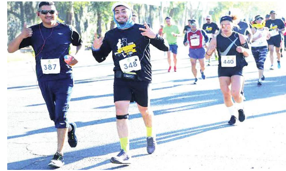
Cetyys Universidad realizó una invitación a la comunidad general para participar en la 2da. Carrera Virtual con Causa, corre, trota o camina en 5, 10 y 15 kilómetros.

La carrera se abrirá el próximo sábado 24 de abril a las 00 horas y se cerrará el 25 de abril a las 12:00 horas, horario del Pacífico. Mayor información sobre inscripciones, camisetas conmemorati-