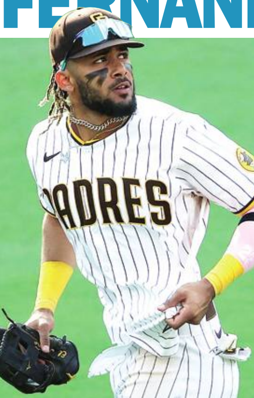
El campocorto dominicano Fernando Tatis Jr. dijo sentirse al 100% a pesar de la lesión en el hombro que lo marginó por unos días en la actual campaña de la MLB.