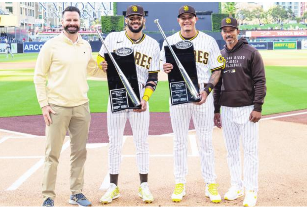
Este sábado, previo al segundo juego de la serie entre Padres y Dodgers, tanto Tatis Jr. como Manny Machado recibieron el reconocimiento del Bate de Plata que lograron en la temporada 2020.