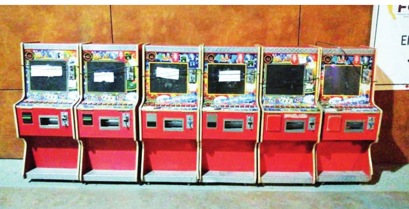
TIJUANA.- La FGE informó del decomiso de 6 mini casinos, tras un operativo policial perpetrado en la colonia Xochimilco Solidaridad.

empresa Autotransportes Urbanos y Suburbanos Libres de Tijuana, de la ruta Natura-Mesa de Otay, impactando de frente contra el camión de transporte público que se encontraba estacionado. (NNC)