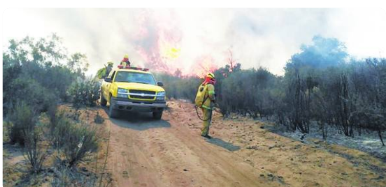
ENSENADA.- Establecen convenios la SCSA, la Conafor y los Ayuntamientos, para hacer frente a la temporada crítica de incendios forestales.