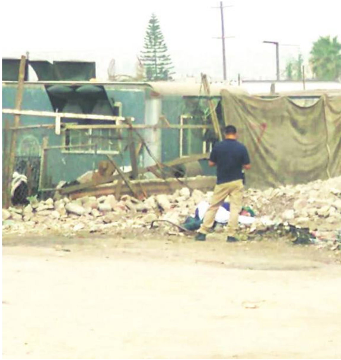
TIJUANA.- El cadáver de un hombre fue localizado en plena vía pública, en la colonia Ampliación Guaycura.

Horas antes, se reportó la ejecución de un