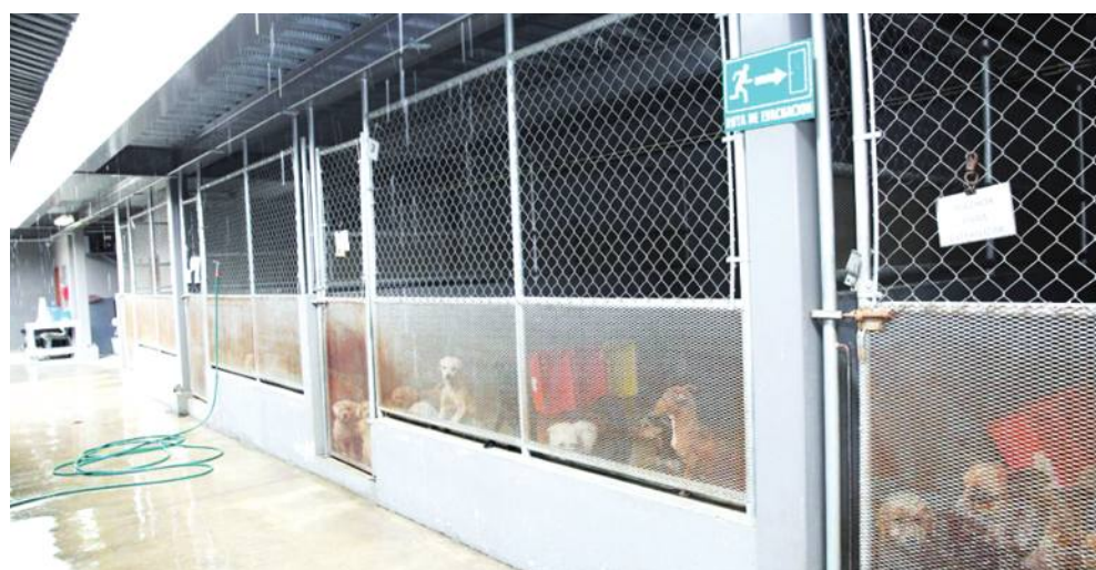
TIJUANA.- Asociaciones civiles y gobierno municipal colaboran actualmente en estrategias de cuidado y protección de perros y gatos sin hogar

reciben diariamente a perros y gatos que son entregados de manera voluntaria por sus dueños, dicho proceso de admisión tiene un costo aproximado de 233 pesos por mascota, sin embargo, en caso de que se trate de cachorros, únicamente son aceptados con el felino o canino que los esté amamantando y también serán dados en adopción.