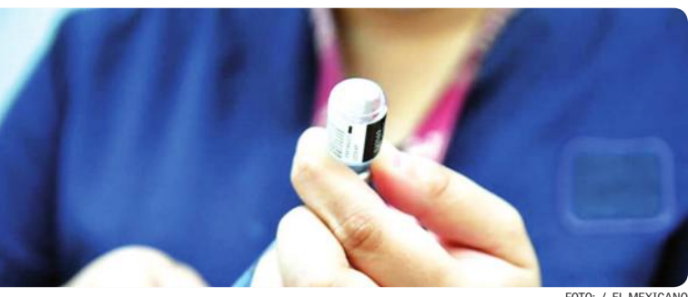
TIJUANA.- Este lunes arrancan segundas dosis en Rosarito, y el próximo miércoles habrá segundas dosis en Tijuana.