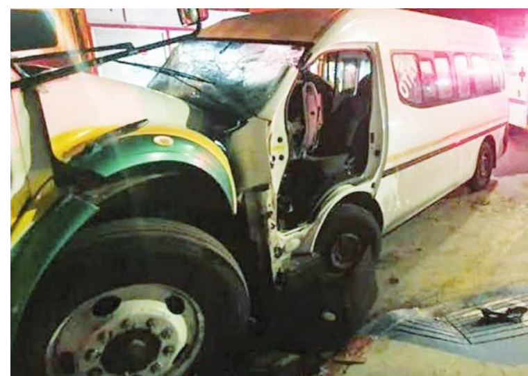
TIJUANA.- Un fuerte impacto entre dos vehículos de transporte público, tuvo lugar en el fraccionamiento Natura, donde resultaron tres personas lesionadas, entre ellas, una mujer rescatada tras quedar prensada.

ción, entre ellas una mujer, que tuvo que ser rescatada por personal de Bomberos, luego de quedar prensada dentro del vehículo. El taxista quedó puesto bajo resguardo policial, después de ser atendido por personal de