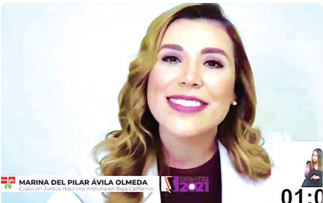
MEXICALI.- La candidata Marina del Pilar mantuvo un discurso dirigido a la población de Baja California.

MEXICALI.- La candidata a la gubernatura de la coalición "Juntos Hacemos Historia en Baja California", Marina del Pilar Ávila Olmeda, consiguió imponerse en el debate organizado por el Instituto Estatal Electoral (IEEBC), a decir de politólogos por presentar propuestas concretas en ámbitos distintos, sobretodo en cuanto a economía. Hizo énfasis las políticas públicas del gobierno de México para que Baja California se convierta en una Zona Económica Estratégica, disminuyendo impuestos clave como el IVA y el ISR, aumentando el salario mínimo, contro-