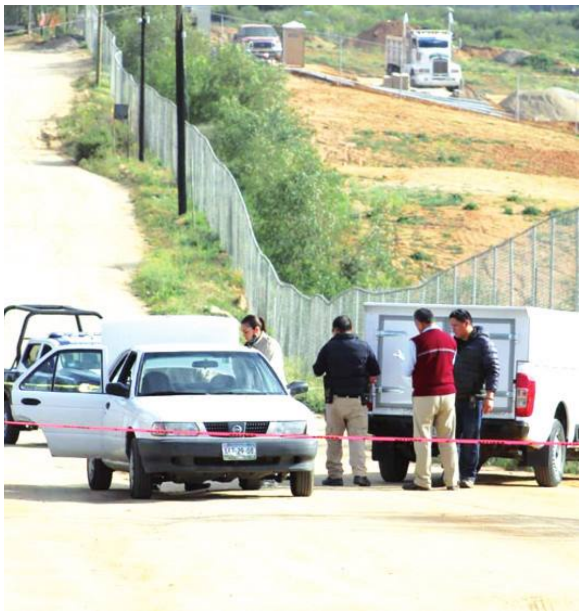
TECATE.- Un nuevo cadáver víctima del crimen fue localizado en la ciudad de Tecate

Cabe mencionar que las ejecuciones superan las 120 en lo que va de 2021, debido a que según las autoridades los grupos del crimen organizado se disputan el control del tráfico de drogas en Tecate, por la baja operación de la Policía Municipal.