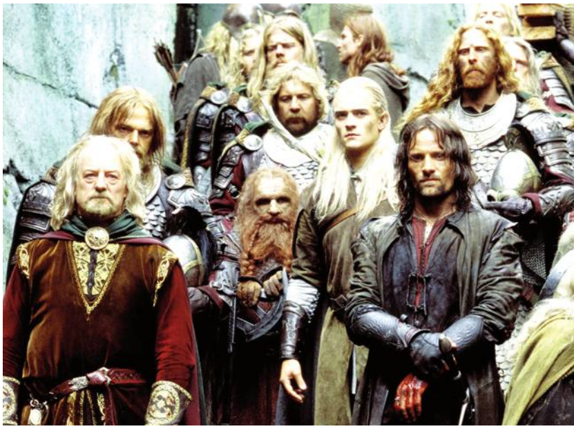
Amazon Studios informó que la productora no escatimará en el recurso económico destinado en la producción de la serie.