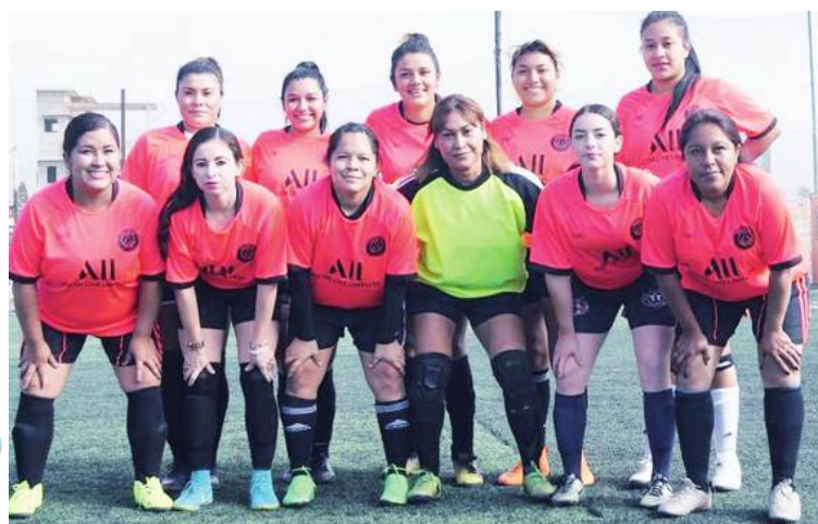
Lavamática Carreto salieron primero a la cancha 1 del Sport Center para hacer valer los pronósticos llevándose triunfo de 5 por 1 sobre The Bones.

Enseguida salieron al pasto sintético de la cancha 1 el cuadro del Maharishi Punta Banda que fue sublíder del torneo para agenciarse vic-