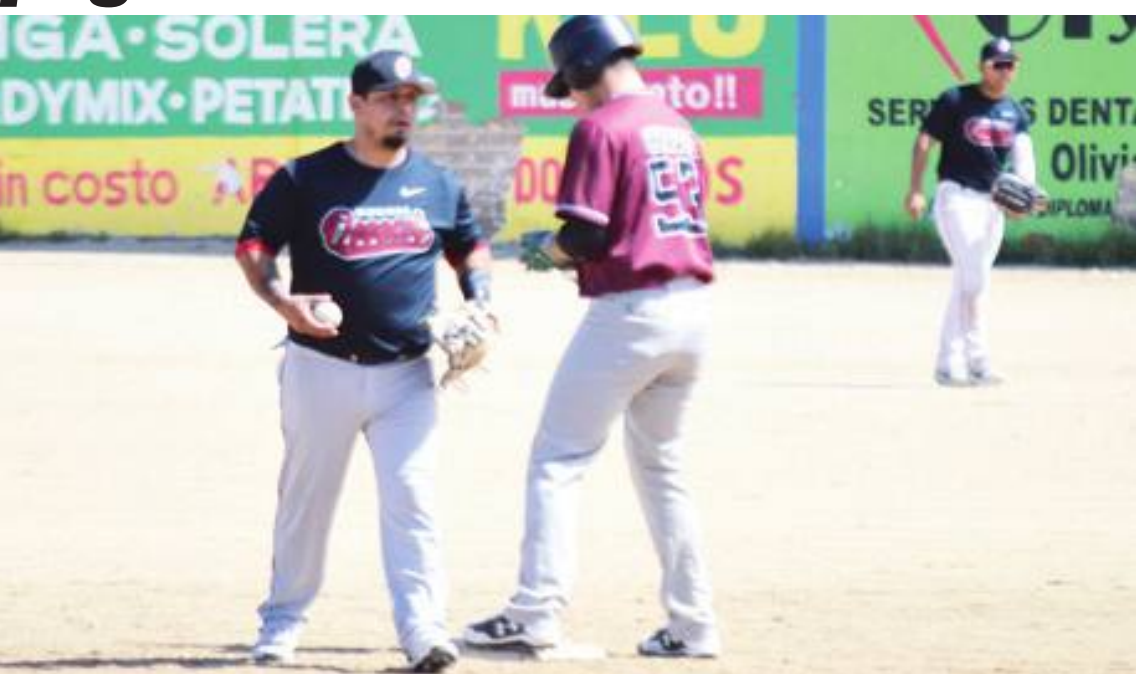
Con ataque de ocho carreras en la primera entrada la novena de Vidriera Omar termino pegándole con pizarra de 19 contra 8 a los juveniles Guerreros.