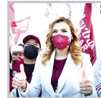
MARINA DEL PILAR...

Por prófugo termina su carrera política.