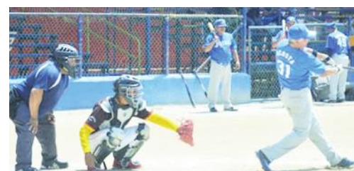
Partidos de muchas carreras se dieron en la primera jornada del torneo oficial 2021 del beisbol de los Super Veteranos de la Industrial Comercial.