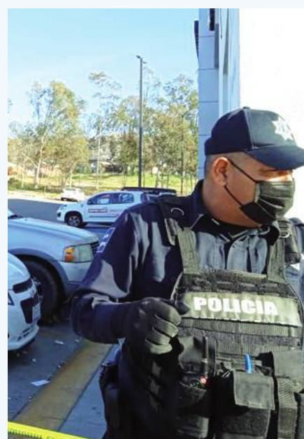
TECATE.- Importante trabajo ha realizado la fiscalía en la ciudad de Tecate.

Una de las investigaciones más recientes versa sobre una familia que fue agredida la tarde del viernes 16 de abril, resultando tres hombres y una mujer heridos por arma