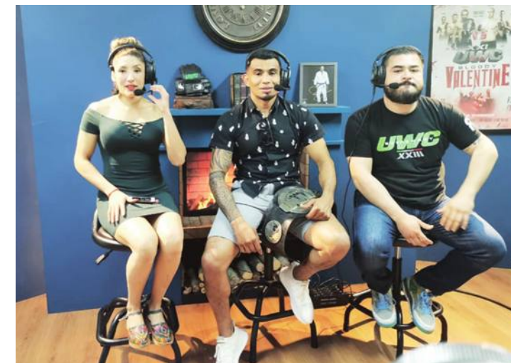
El integrante de Team Blackxicans, de Ensenada, Baja California, estuvo el jueves 15 de abril en la edición 47 del programa UWC: Total War donde explicó lo que significa para él el retorno a UWC.

Acerca de la posibilidad de someterse a cirugía en el transcurso de la temporada, Tatis Jr. expresó, "no siento que tenga que hacerlo, pero me acercaré (a los doctores) después de la campaña para saber como se ve todo. Definitivamente me siento al 100%. Veremos que sucede... Pero siento que es algo que puedo manejar". (AMS)