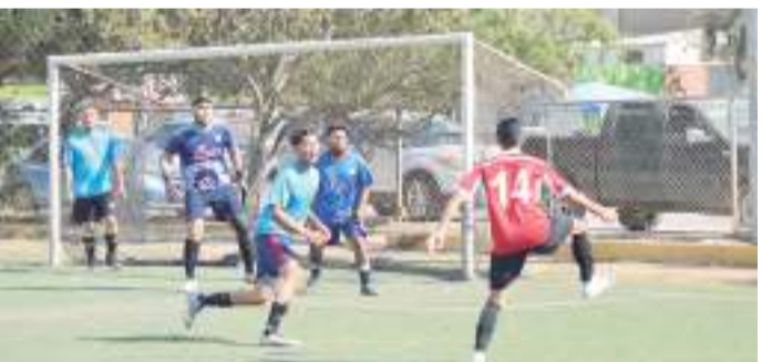
Las acciones de los partidos de Vuelta a jugarse en la cancha de la unidad deportiva de Pórticos arrancarán a las 13:30 horas con el duelo entre Lobos y Deportivo Ajusco.