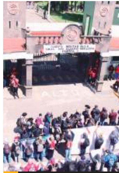
En la bodega pudieron haber dado muerte a algunos normalistas.