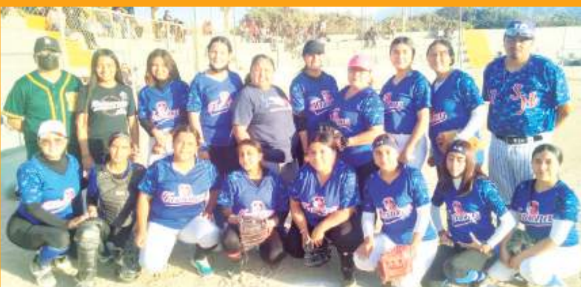
Las Faraonas terminaron de líderes del Grupo B del VI torneo de softbol de Los Barrios de Maneadero.