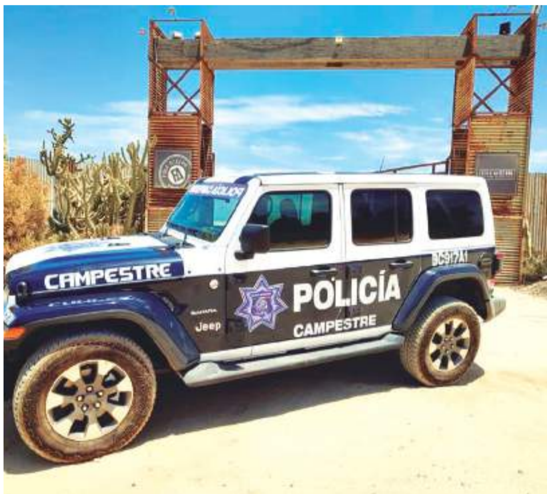
ENSENADA.- Los elementos de la Policía Campestre, buscan brindar paz y tranquilidad a los turistas y ciudadanos que visitan la Ruta del Vino.

Así mismo la unidad Campestre procura preservar el desarrollo de la comunidad y de la Zona Turística del Valle de Guadalupe, realizando recorridos de vigilancia, atención puntual a los reportes ciu-