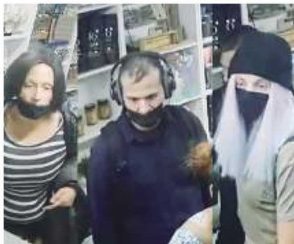
TIJUANA.- La banda "Lady Pelucas" ha robado mercancía en negocios de la colonia Hipódromo.

calle Tapachula de la colonia Hipódromo. El fiscal regional Mendoza Razo, señaló que inició una investigación para desarticular a la banda de asalto comercios, de acuerdo a la denuncia presentada se trata de robo sin violencia de mercancía. "Habíamos visto en redes sociales esta noticia, fue hasta el día 25 de septiembre que se tiene una denuncia formal de un atraco del 20 de septiembre. La parte reportante nos indica que un masculino simula hacer una compra, para que las otras dos personas se apoderan de mercancía del establecimiento". Varios comercios de la colonia Hipódromo denunciaron a través de redes sociales que habían sido víctimas de robos sin violencia de mercancía, por una banda integrada por un hombre y dos mujeres, a la que apodaron "Lady Pelucas" debido que al cometer los atracos utilizaban pelucas. Los afectados aseguran que mientras el hombre entretiene a los encargados de negocio, las dos mujeres roban mercancía