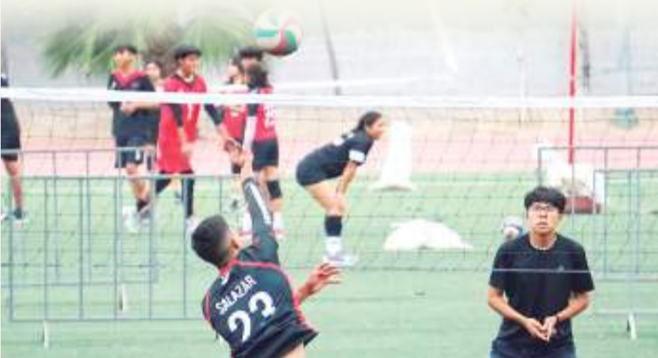
Los equipos se fueron eliminando hasta determinar a los campeones municipales, siendo la delegación San Antonio de los Buenos la que más categorías ganó.