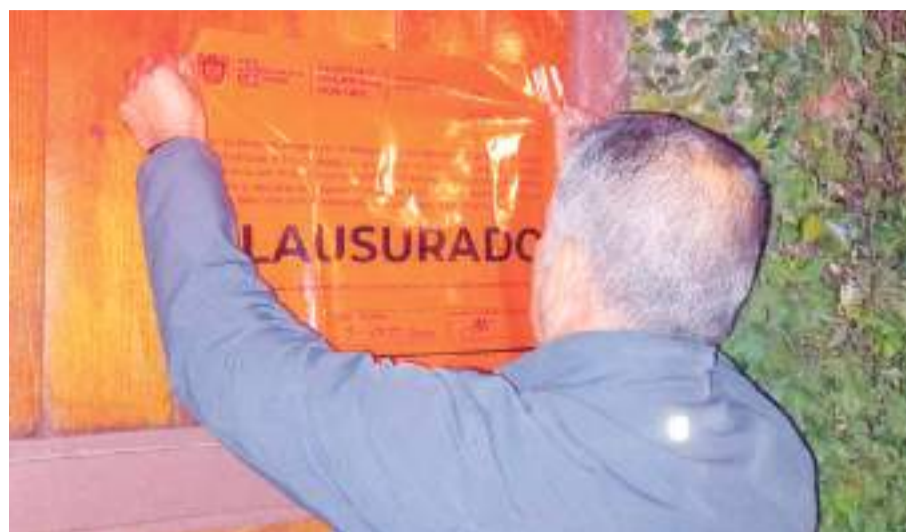
TIJUANA.- Otra fiesta clandestina de menores de edad consumiendo alcohol, fue clausurada.

En el inmueble había alrededor de 100 jóvenes, entre ellos 25 menores