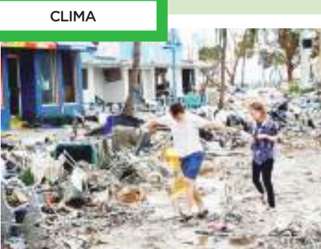
"Ilan" se convirtió en tormenta tras dejar graves daños en la zosta Este de Estados Unidos.