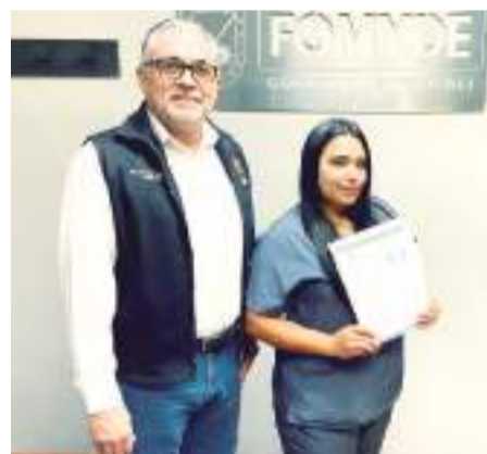
MEXICALI.- La empresa ZERO fue la primera en utilizar el nuevo Sistema de Apertura Rápida de Empresas (SARE).