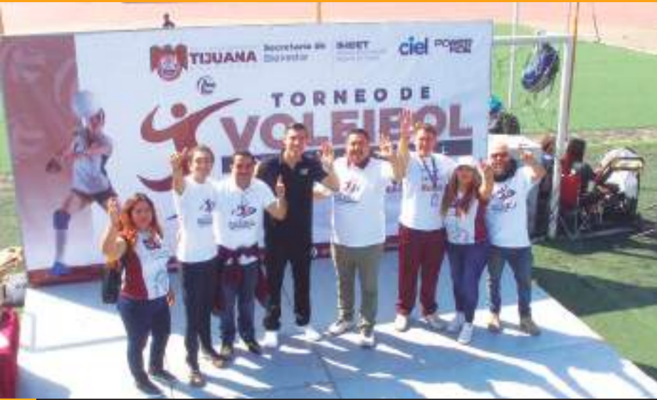
Convocando a 92 equipos pertenecientes a las nueve delegaciones de la ciudad, el Instituto Municipal del Deporte de Tijuana llevó a cabo este sábado la Final Municipal del Torneo Delegacional de Voleibol.