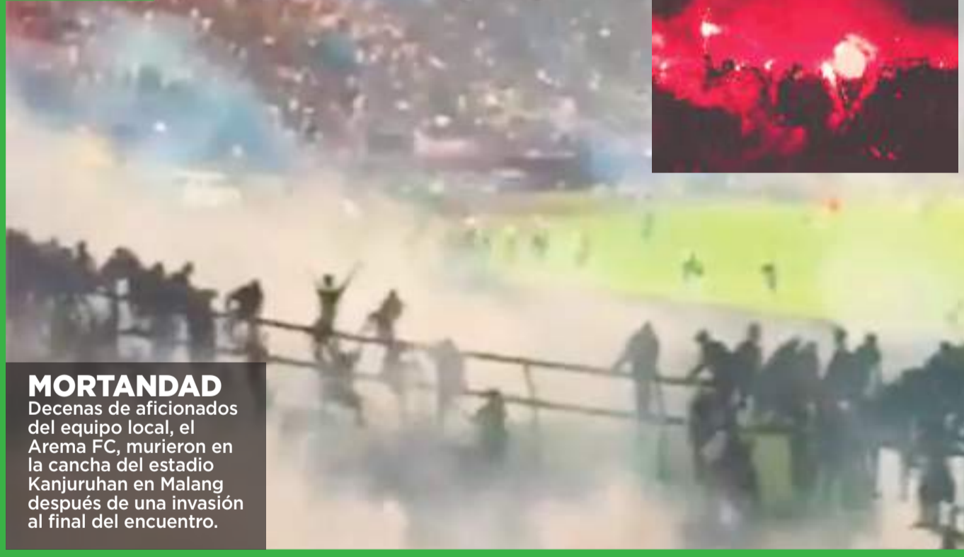
MORTANDAD Decenas de aficionados del equipo local, el Arema FC, murieron en la cancha del estadio Kanjuruhan en Malang después de una invasión al final del encuentro.