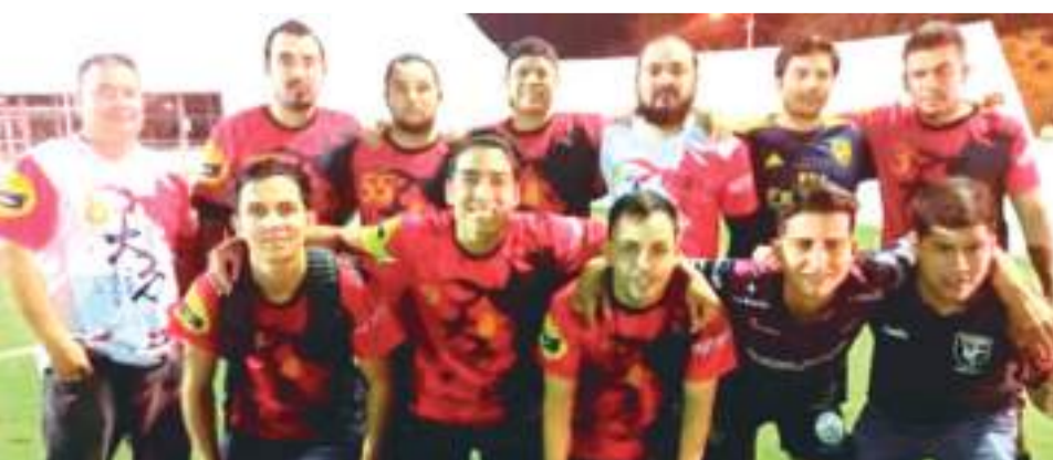
El trabuco de la casa rica Markecko Radio patrulla ligó su triunfo número 6 en forma consecutiva al derrotar al China House.

Del torneo internacional en Los Cabos, La Paz, Baja California Sur en donde el equipo Rich House Markecko y Radio Patrulla asistirán a participar. En dónde enfrentarán a grandes equipos de varios países gracias a los patrocinadores con que cuenta el conjunto rojo.