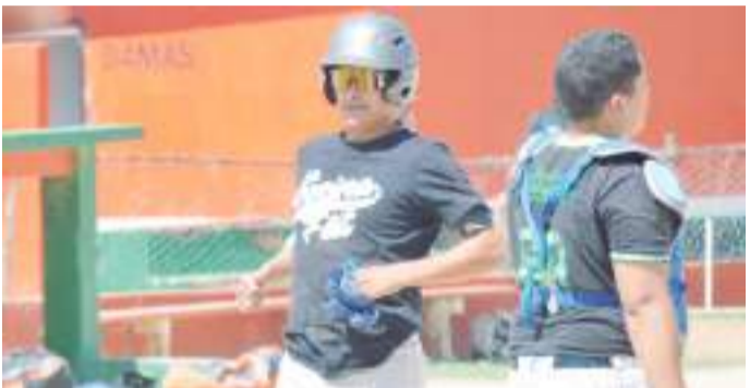
La Cocina Del Fat con ventaja de dos juegos por cero buscará coronarse este domingo en el tercer juego de la serie final sobre los Terkos.