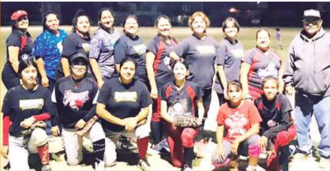
Las Warriors tendrán un duro escollo para acceder a la final, ya que tendrán enfrente en semifinales a las Faraonas.