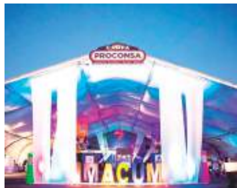
MEXICALI.- Promueve IMACUM artistas locales en Foro Diversidad de las Fiestas del Sol.

integral (acuática, terrestre, de hábitat y de vida silvestre) de las lagunas costeras de San Quintín y el Estero de Punta Banda para conocer su estado de conservación.