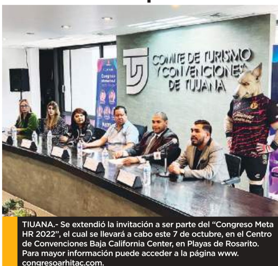
TIJUANA.- Se extendió la invitación a ser parte del "Congreso Meta HR 2022", el cual se llevará a cabo este 7 de octubre, en el Centro de Convenciones Baja California Center, en Playas de Rosarito. Para mayor información puede acceder a la página www.congresoarhitac.com .

Se realizará en el centro de convenciones Baja California Center, de Playas de Rosarito