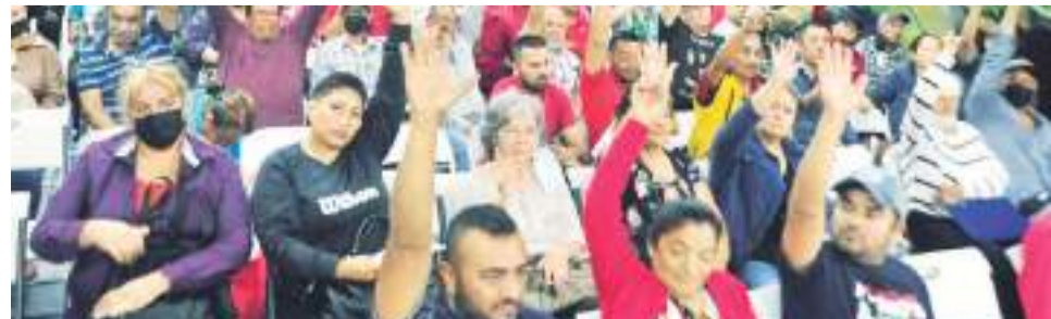
TIJUANA.- Pretenden retirar a los 600 taxis que circulan por el Bulevar Agua Caliente y dar la concesión a la empresa Transporte Masivo Sustentable S.A. de C.V., lo cual rechazan concesionarios.