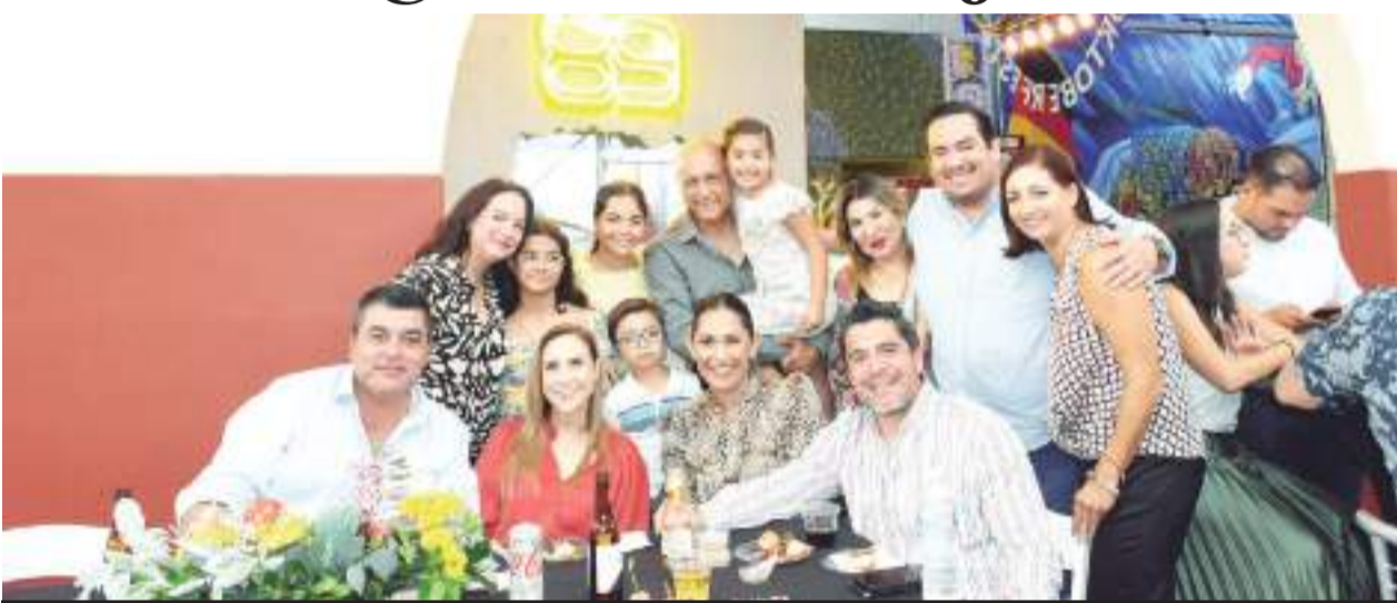
Familiares e invitados al evento.