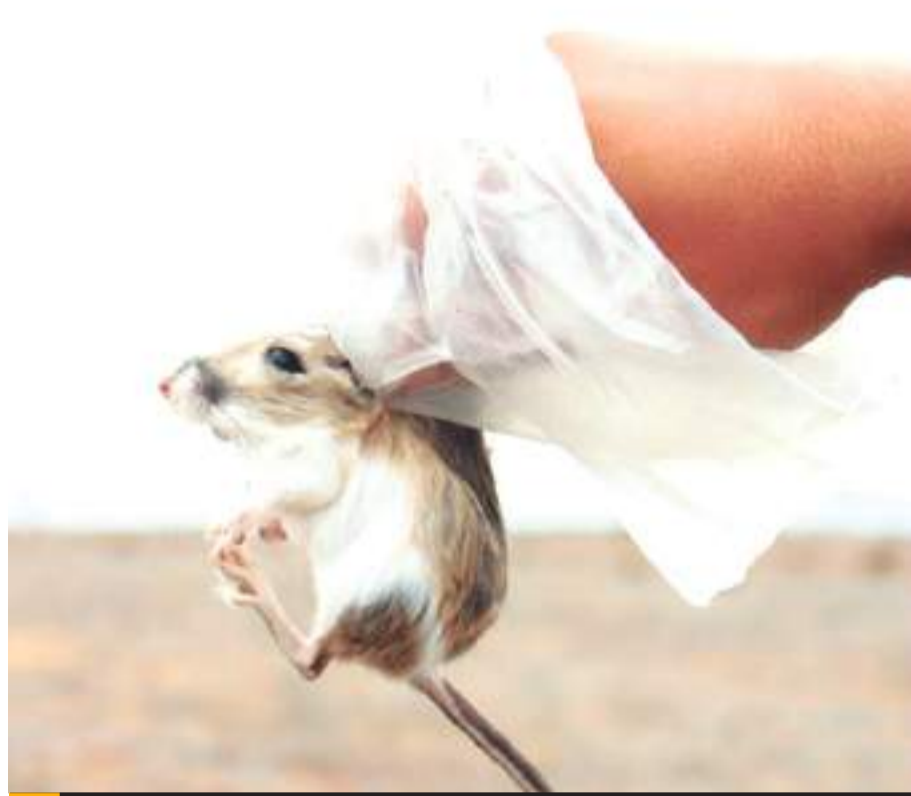
SAN QUINTIN.- Las fotografías del rascón picudo, reptiles y la rata canguero de San Quintín, fueron tomadas en los monitoreos que se han realizado en los últimos meses.

reptiles y la rata canguero de San Quintín fueron tomadas en los monitoreos que se han realizado en los últimos meses como parte de un proyecto binacional, el cual busca hacer una caracterización