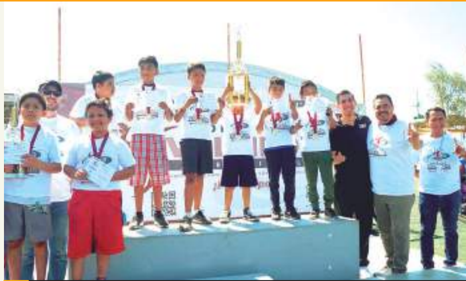
Un total de 900 competidores, de las categorías 8-9, 10-11, 12-13, 14-15 y Abierta, en las ramas femenil y varonil, fueron distribuidos a lo largo de 15 canchas que fueron montadas en el campo de futbol de la Unidad Deportiva Tijuana.