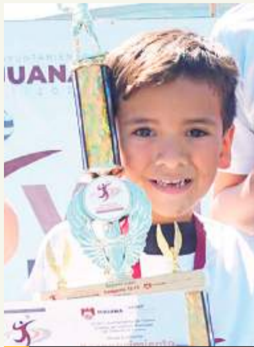
La otra delegación que triunfó en varias categorías fue Cerro Colorado.