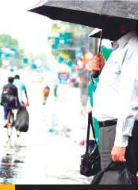
En diez estados se registran lluvias derivadas del huracán "Orlene".