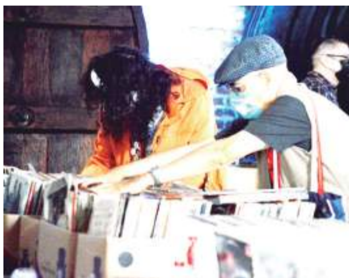
ENSENADA.- el ERS se realizará en Centro Cultural Santo Tomás de las 09:00 a las 21:00 horas y se contará con música en vivo, Dj's y miles de discos.