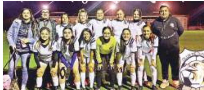
Veracruz Águilas Blancas tuvo un sensacional arranque de torneo al imponerse con goleada de 12 por 0 al conjunto de Banchetto FC Crafty.

ENSENADA.- Las chicas del Veracruz Águilas Blancas tuvieron un sensacional arranque de torneo al imponerse con goleada de 12 por 0 al conjunto de Banchetto FC Crafty.