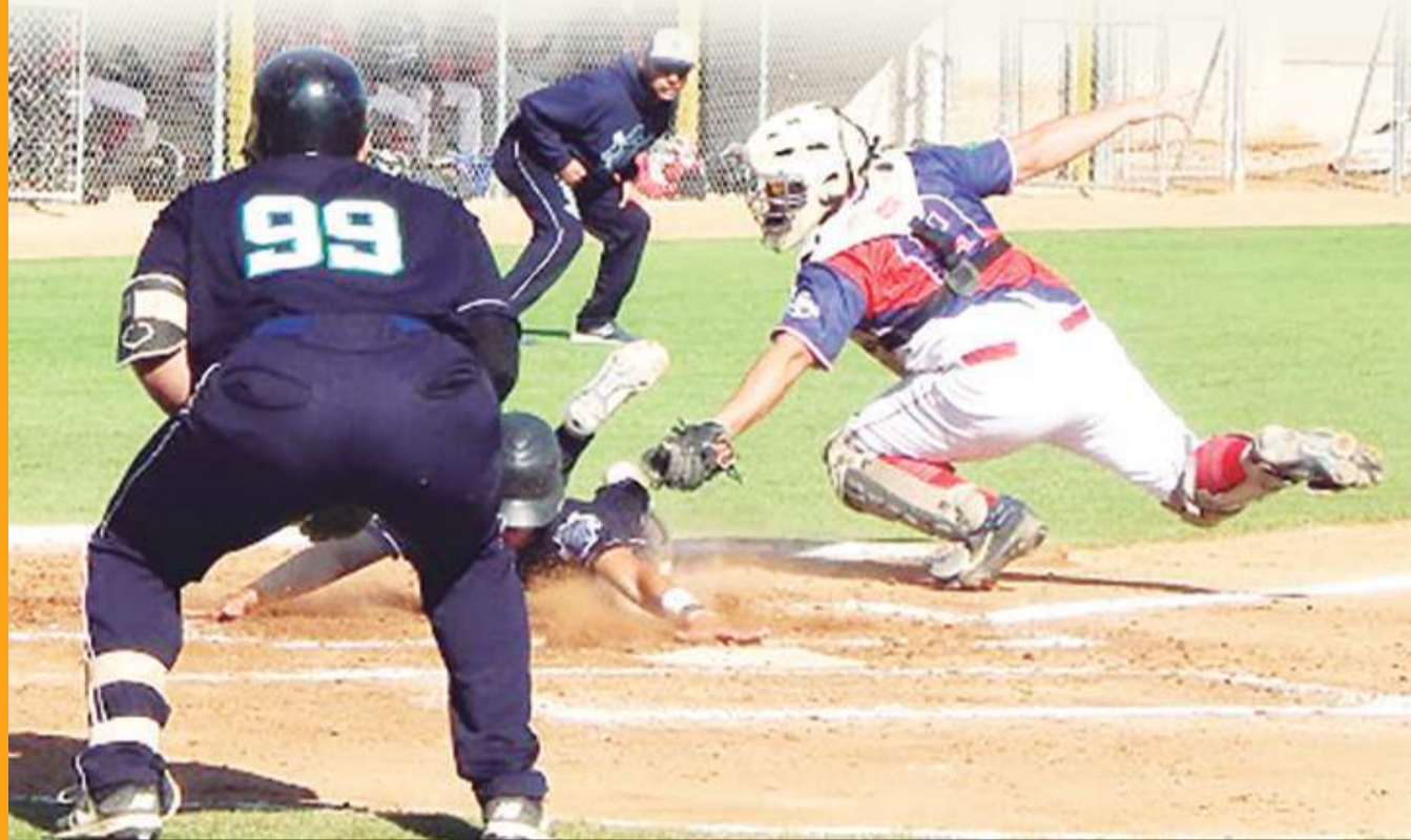
Seguirán hoy las semifinales entre Algodoneros y Cetys, así como Red Sox y Baja Gas and Oil, en el Torneo Oficial "Verónica García 2022" de la Liga de Beisbol Juvenil Amateur de Tijuana.