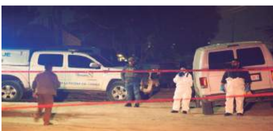
TIJUANA.- En lo que va de noviembre 35 personas han sido asesinadas por impactos de bala, informó la FGE, en Tijuana.

Pasadas las 2 de la madrugada del 4 de noviembre, tres sujetos fueron blanco de armas de alto poder cuando se encontraban sobre el bulevar Las Fuentes, exactamente en el interior del domicilio número 8327, esquina con calle Manzana, del fraccionamiento Villa Floresta. Cerca del área del ataque armado fueron localizados diversos indicios balísticos de arma larga y corta, así como también, sobre la calle antes mencionada, se encontraba un vehículo tipo panel de color gris, marca Dodge Grand Caravan, y en su interior se alojaban un chaleco táctico y una pistola.