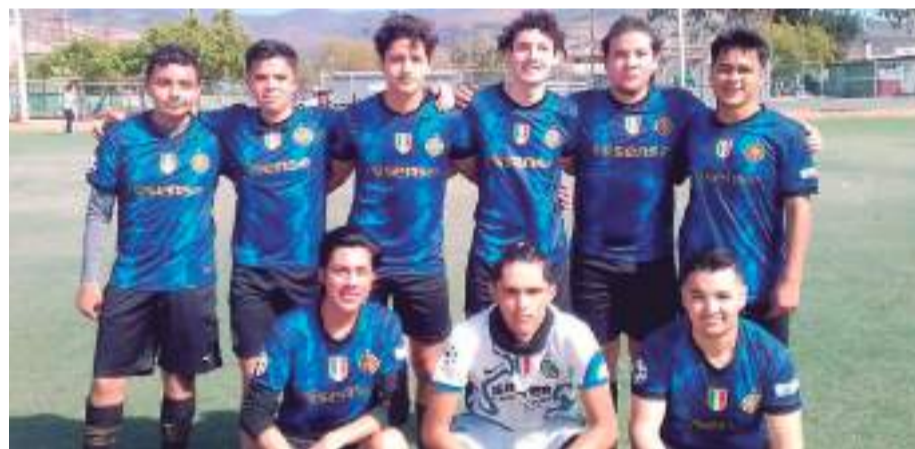
Este sábado se juegan los partidos finales del torneo Juvenil de futbol Siete de la Nueva Liga de futbol de Pórticos Del Mar.

En tanto que en el campo Juan Melgoza de San Carlos, la doble cartelera se juega con Dodgers enfrentando a Titanes en la mañana y Cobach se mide a Rancho Romero.