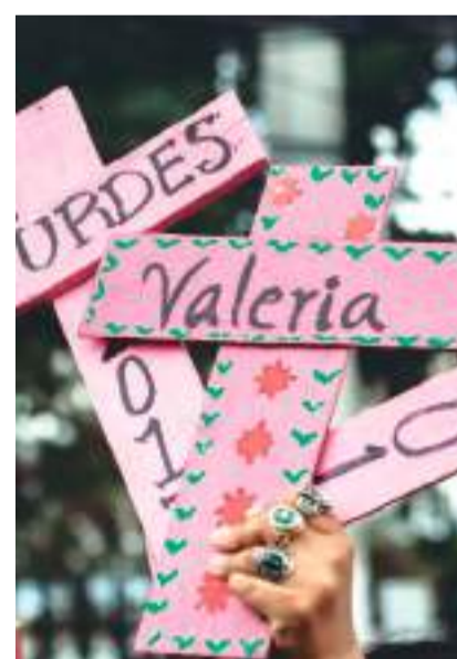
En promedio, 10 mujeres son asesinadas cada día a nivel nacional.