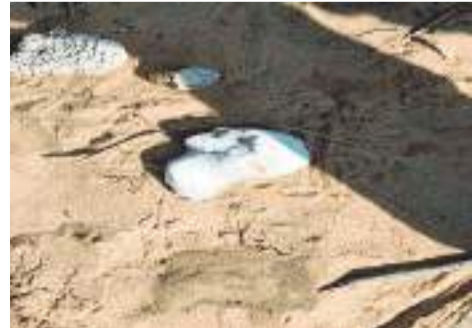
TIJUANA.- Restos óseos se han encontrado en la "gran fosa clandestina".