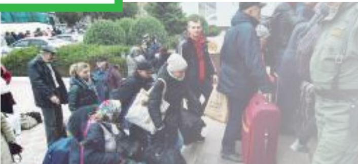
Ante la ofensiva de Ucrania, mantienen la orden a los civiles de evacuar Jersón.