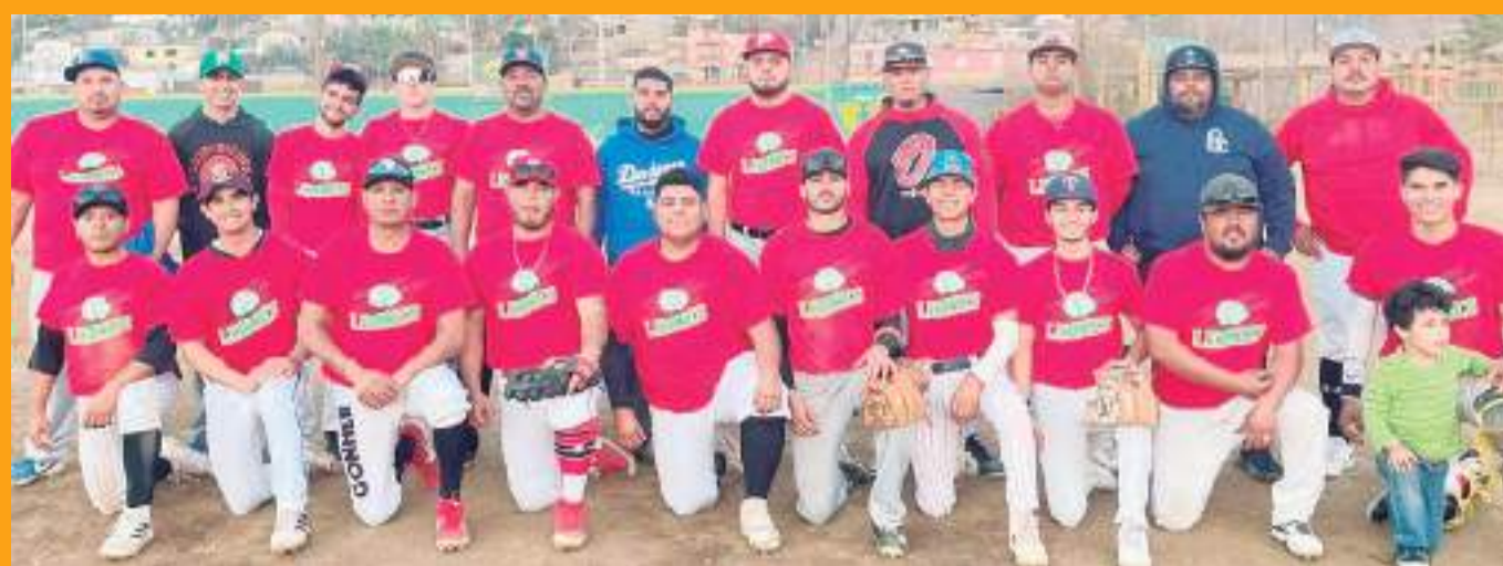
Los Leones le quitaron el invicto el domingo pasado a Rancho Romero y ahora buscarán acabar con el invicto de Tomateros.

rampa_mon@hotmail.com facebook.com/carlos rampa romero