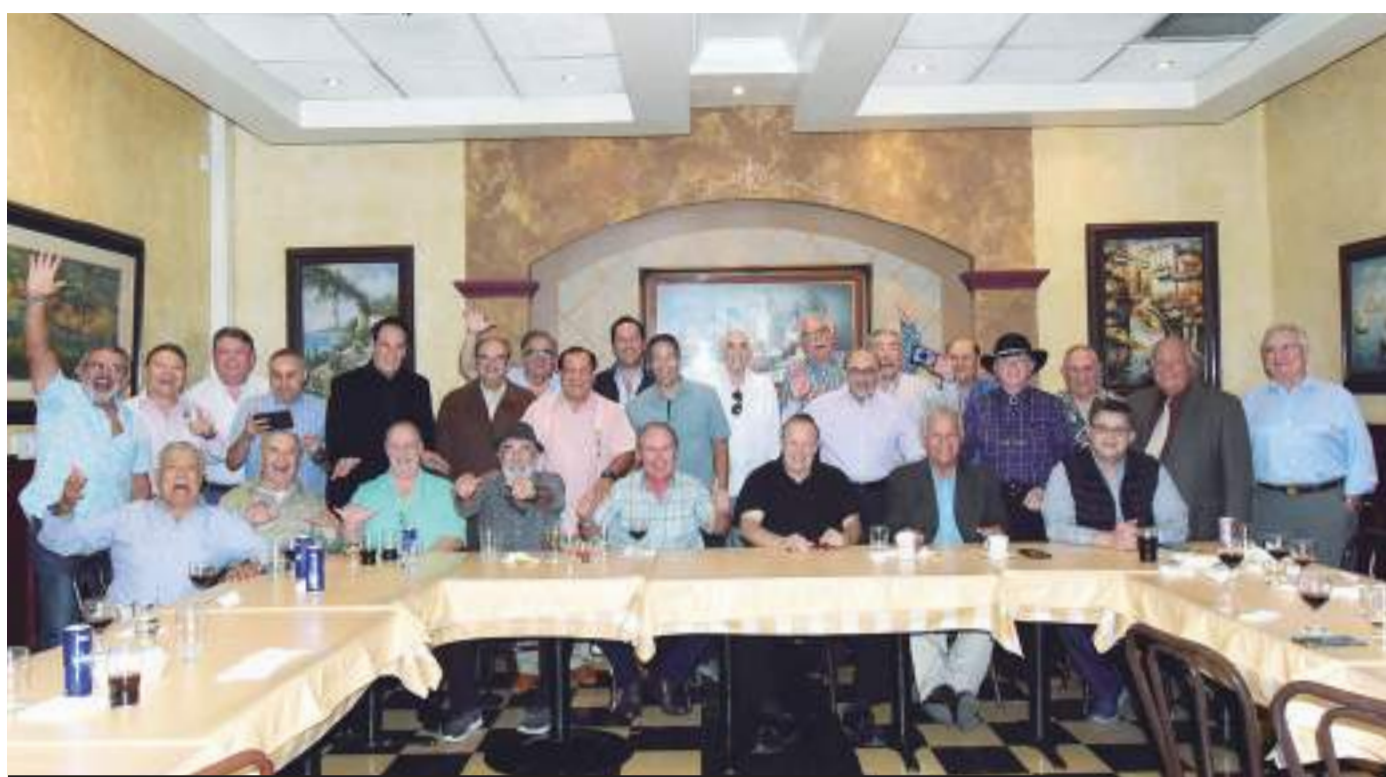
En un marco de camaradería y buen ambiente, la organización de caballeros tijuanenses, Grupo Los Compadres, tuvieron su reunión.

CON EL OBJETIVO DE PRESERVAR LA AMISTAD Y COMPARTIR UN GRAN NÚMERO DE ANÉCDOTAS FAMILIARES, LOS CABALLEROS TIJUANENSES SE REUNIERON EN EL SALÓN DEL RESTAURANT GIUSEPPIS DE BOULEVARD