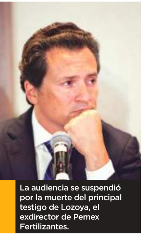
La audiencia se suspendió por la muerte del principal testigo de Lozoya, el exdirector de Pemex Fertilizantes.