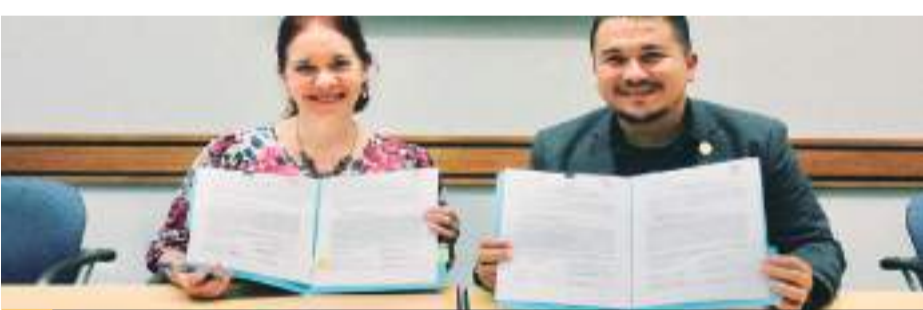
SAN DIEGO.- El Colegio de Estudios Científicos y Tecnológicos de Baja California (CECyTE BC) celebró una alianza estratégica con la Universidad de California Campus San Diego (UC San Diego), en beneficio de la educación de las y los jóvenes de ambas instituciones.

Por otro lado, el magistrado presidente del Tribunal Superior de Justicia del Estado estableció el compromiso con los abogados para atender los asuntos de sentido común, que nada tiene que ver con la cuestión presupuestal, para mejorar la atención al público.