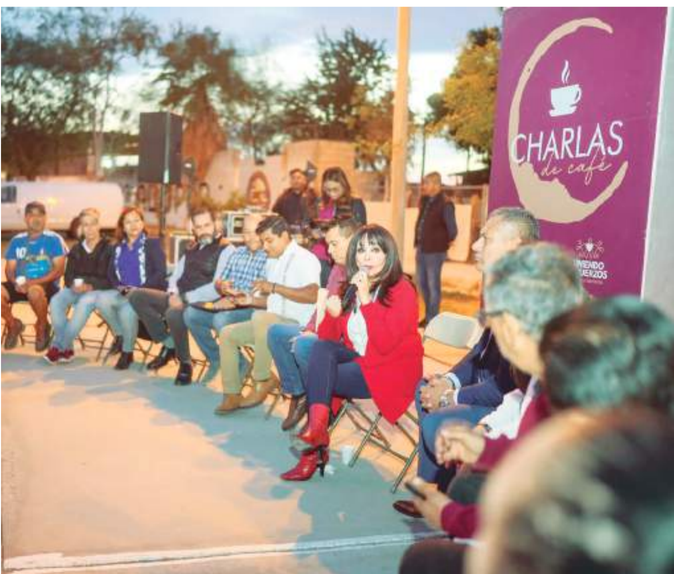
MEXICALI.- La Alcaldesa Norma Bustamante, estuvo en la colonia Mirasol con sus “Charlas de Café”, durante la reunión se abordaron los temas de seguridad, bacheo, señalamientos viales, luminarias y limpieza de calles.

trabajadores estén presentes, en las citas médicas en que se apliquen los tratamientos, también con goce de sueldo.