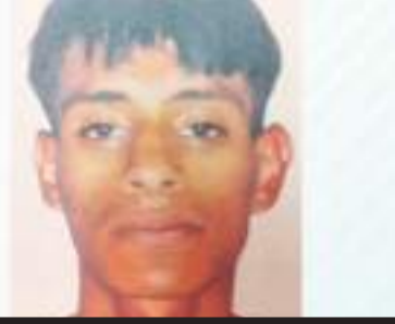
TIJUANA.- Con pistola impactó en tres ocasiones a la víctima; a quemarropa.

Este 2 de noviembre de 2022, se realizó audiencia intermedia, en donde la Fiscalía ofreció la penalidad de 13 años y 4 meses de prisión, para la celebración de una terminación anticipada del proceso, consistente en procedimiento abreviado, por el delito de homicidio calificado en su grado de ejecución de tentativa; penalidad que fue aceptada por el responsable y su defensa.