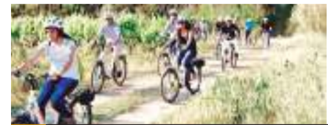
La Rodada por la Ruta del Vino es de 7 kilómetros, atravesando las principales vinícolas de la región, teniendo como salida y meta el Parque Ejidal de El Porvenir.

Las personas interesadas en participar, deben comunicarse a los teléfonos: 646 177 0744 y 646 176 4445 o escribir mensaje en www.facebook.com/INMUDERE.