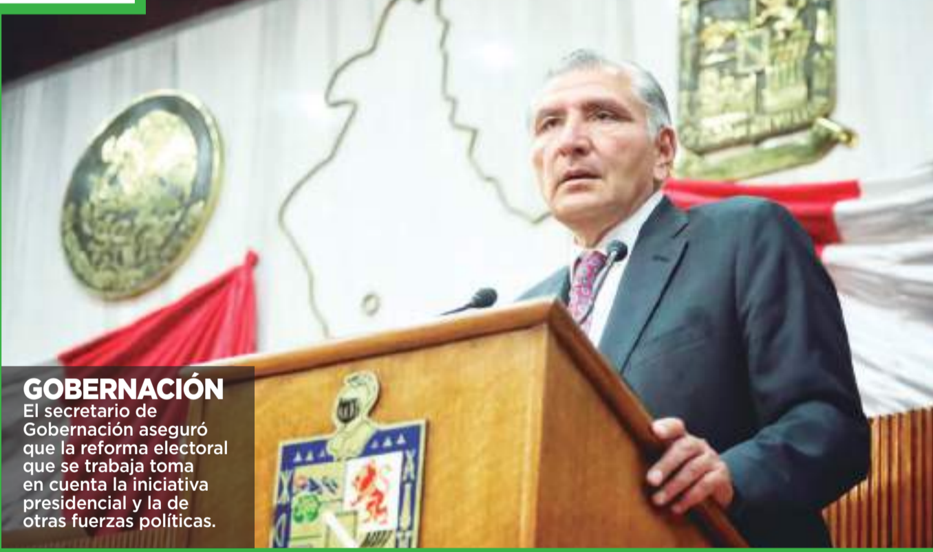
GOBERNACIÓN El secretario de Gobernación aseguró que la reforma electoral que se trabaja toma en cuenta la iniciativa presidencial y la de otras fuerzas políticas.