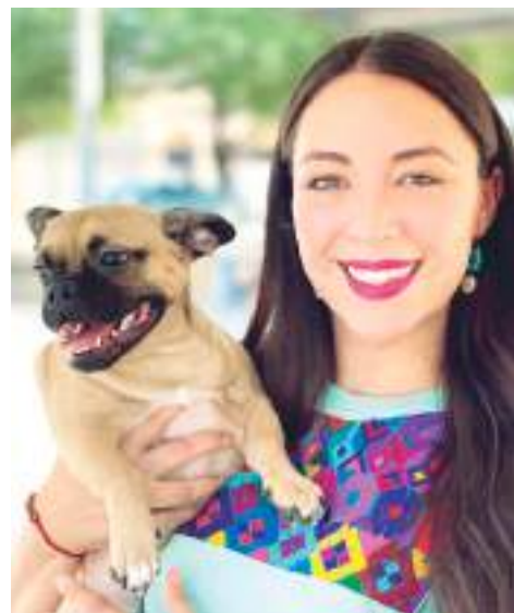
MEXICALI.- Se vacunarán a perros y gatos contra la rabia y se les aplicará gel contra las garrapatas.

“Tenemos como meta el que los negocios puedan trascender las fronteras para que tengan oportunidades no solo en México sino también en el extranjero, esto a través de los tratados comerciales que tiene nuestro país, sobre todo teniendo esta ventaja de estar en el puerto”, concluyó.