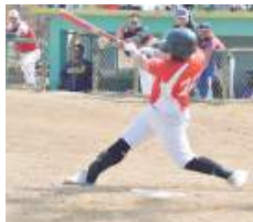
Puerto Santo Tomas tiene una difícil salida este domingo al campo Juan Melgoza para enfrentar a Bravos en duelo de la categoría Mayor de la Liga Rural de Maneadero.