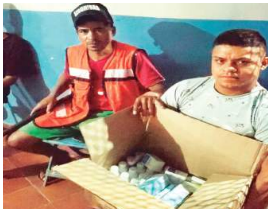
MEXICALI.- El DIF Municipal apoyando a la comunidad migrante, llevó a cabo una donación de artículos de higiene y protección a diversos albergues de la ciudad que apoyan a los migrantes que diariamente llegan a la ciudad.

Explicó que se otorgaron insumos como cubrebocas, caretas, gel desinfectante, botes personales y colectivos, toallitas húmedas con cloro, al igual que, paquetes de toallas sanitizantes, a va-