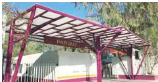
MEXICALI.- Se invita a los mexicalenses para que asistan este día al Tianguis Orgánico que se llevará a cabo en el parque Cri-Cri, en un horario de 10 de la mañana a 3 de la tarde, donde habrá venta de diversos productos.

También, como parte del programa a las 10:30 a.m. se dará una clase de zumba, y se realizará durante el transcurso de la mañana las tradicionales rifas. Cabe men-