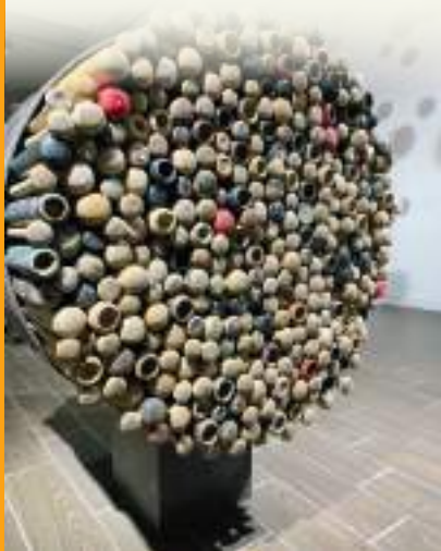
Conocido de igual forma como “El mejor campo de pelota”, el inmueble cuenta con un total de 14 salas donde se exponen distintas obras y piezas de arte.

El recinto que el próximo 27 de abril está por cumplir un año desde su inauguración, inicia en el lobby