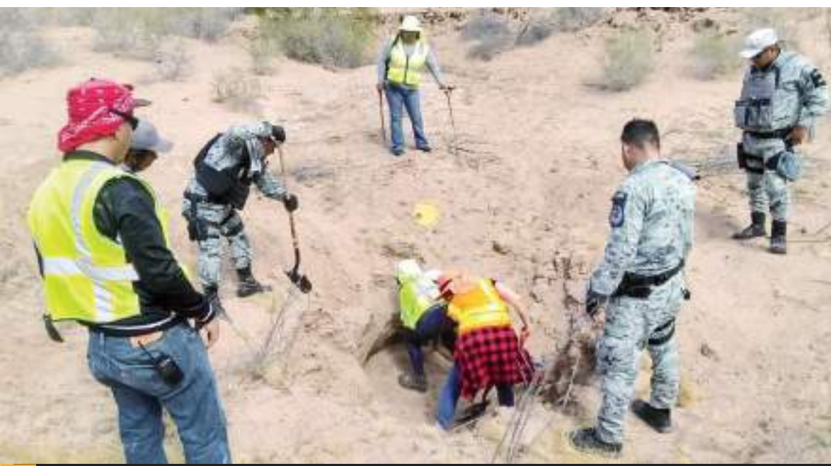
TECATE.- Se realizarán búsquedas de desaparecidos por toda la entidad.

Para ello, se indicó habrán de programar las fechas para revisar el mayor territorio bajacaliforniano posible, en espera de resultados positivos. (AAR)