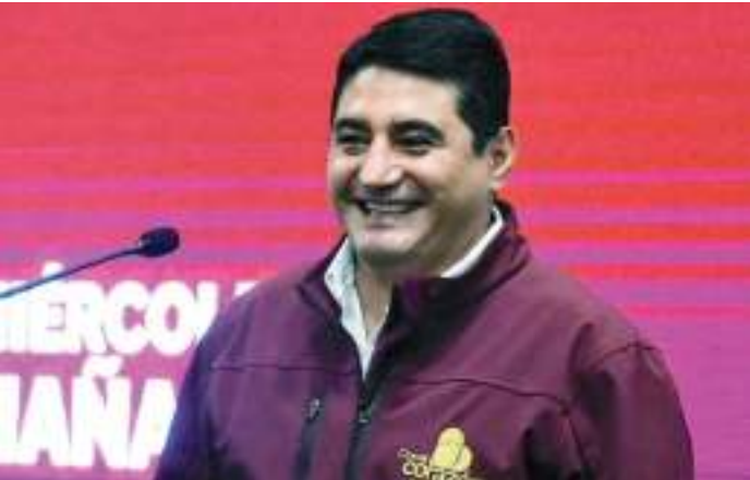
MEXICALI ERIK MORALES... Comprometido con los atletas.