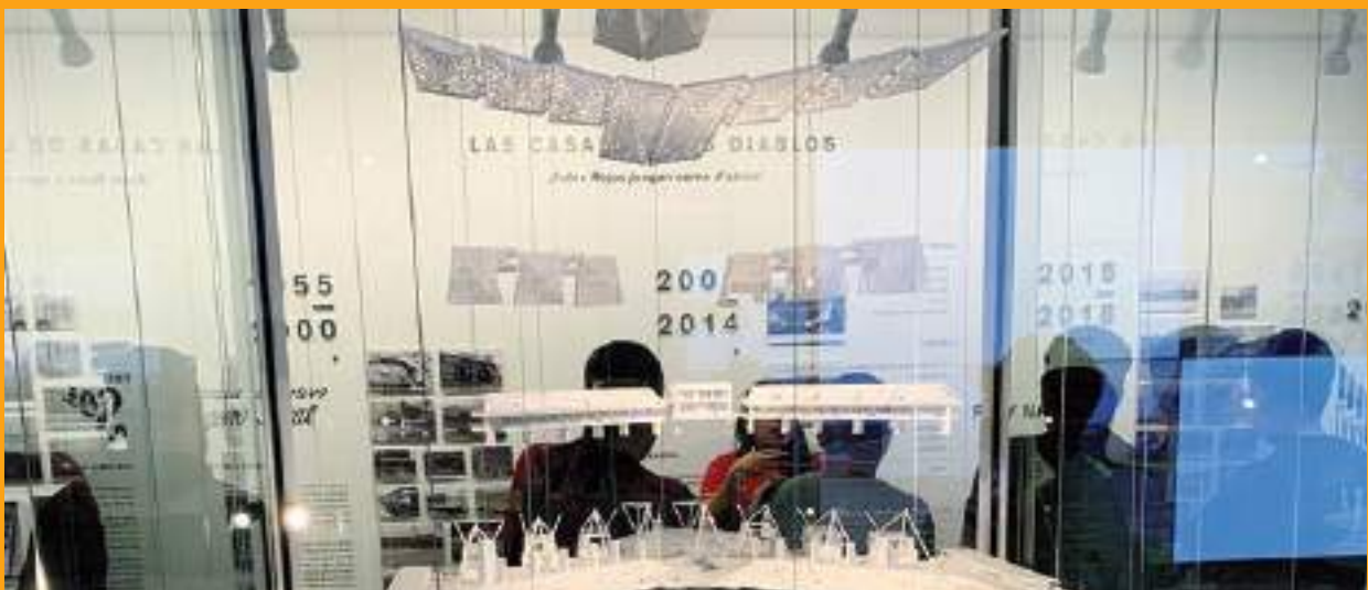
En una ciudad donde abundan los museos, nuestros anfitriones nos permitieron conocer el “Museo Diablos, una historia incomparable”.

CELEBRARÁ ANIVERSARIO A FINALES DE ABRIL