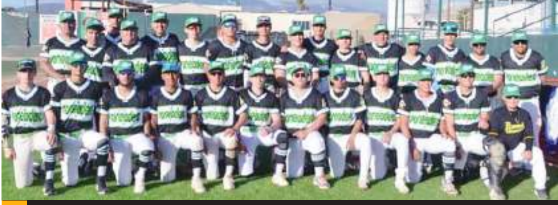
La selección Rural de Maneadero se repartió triunfos con su similar de la Municipal de Ensenada ganando de 7-4 en la mañana y perdiendo 12-13 en la tarde.