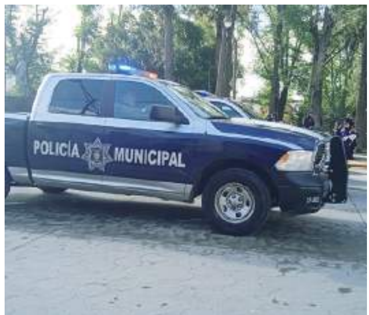
TECATE.- Ante llamadas de extorsión en la ciudad, se exhorta a la comunidad a abstenerse de realizar depósitos.