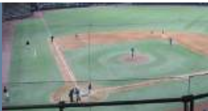
El conjunto carmelita sostendrá una serie de dos encuentros contra los Gigantes de San Francisco los días 29 y 30 de abril.

Con capacidad para poco más de 20,000 espectadores, se espera que para ese último fin de semana de abril, el estadio está dividido entre público local y fanática proveniente de fuera, especialmente de Baja California y el estado