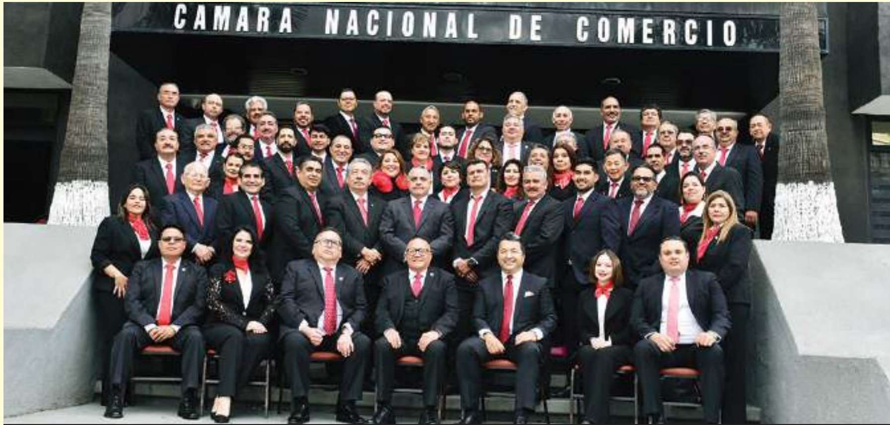
Elegantes en la fotografía oficial del Consejo Directivo de CANACO Tijuana.

Durante la reunión mensual celebrada en las instalaciones del Instituto Mexicano de Contadores Públicos de Baja California, se presentaron conferencias de interés para los contribuyentes del SAT.