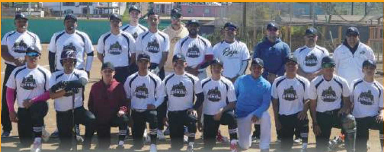
Rancho Romero llega con la moral en alto a enfrentar la gran final de la categoría Mayor de la Liga Rural de beisbol de Maneadero.