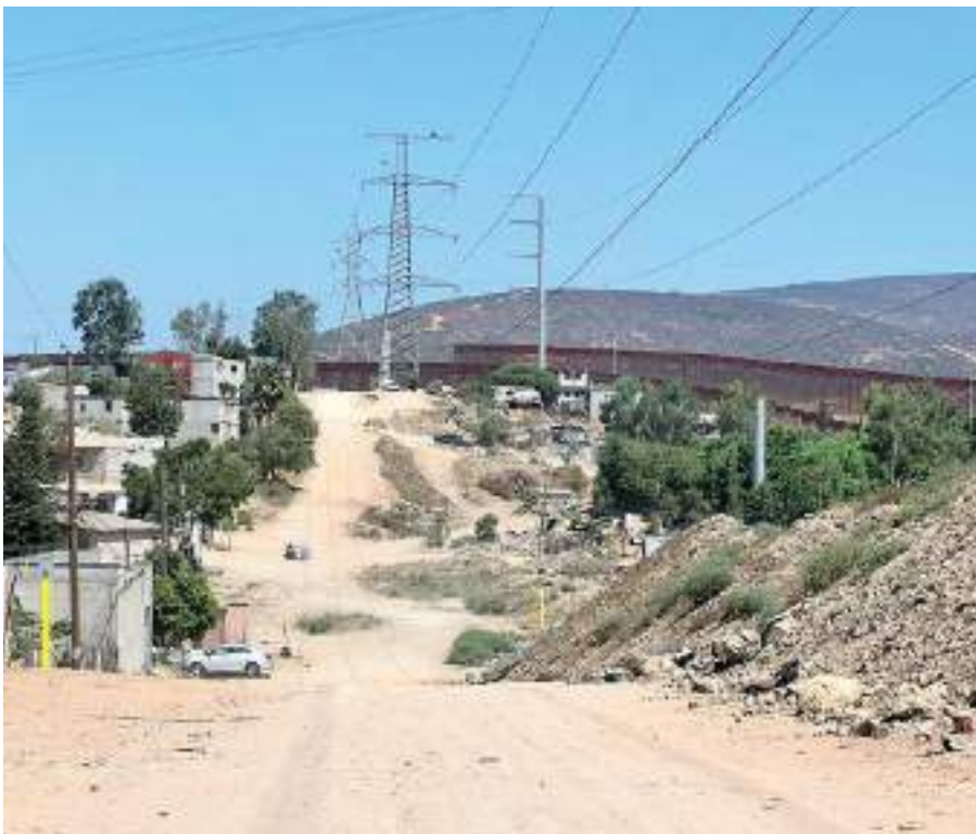
TIJUANA.- Nido de Las Águilas, “es una área en la que se dedican al tráfico de indocumentados”.

El muro fronterizo no es de libre paso a migrantes, halcones armados cuidan que no se acerquen ciudadanos o migrantes sin pagar el piso, una problemática denunciada por migrantes al periódico El Mexicano