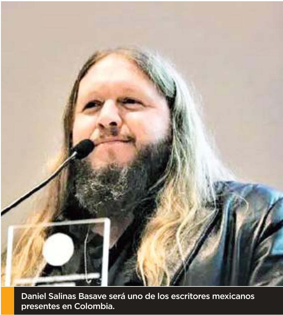
Daniel Salinas Basave será uno de los escritores mexicanos presentes en Colombia.

También un Taller de ilustración con Rafael Barajas 'El Fisgón', donde los participantes tendrán la oportunidad de aprender sobre el arte de la ilustración y la caricatura de la mano de uno de los más reconocidos ilustradores de