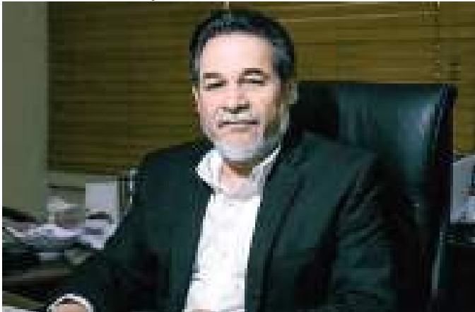
TIJUANA CATALINO ZAVALA MÁRQUEZ... Impulsa la actualización del Atlas de Riesgo de Tijuana.