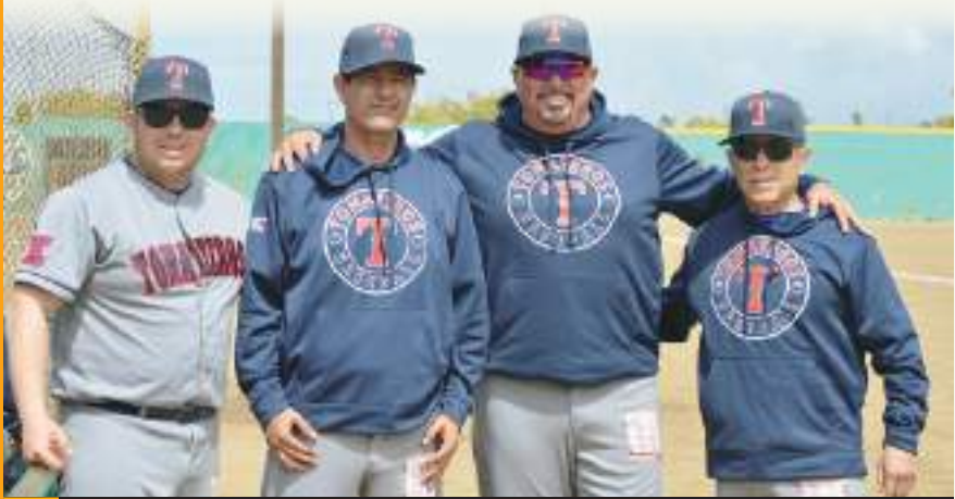
El Cuerpo Técnico confía en sus Tomateros para sacar adelante la serie final ante Rancho Romero.