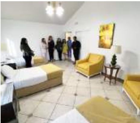
TIJUANA.- Inauguran Residencia Life, estancia para el cuidado de adultos mayores, un espacio al alcance de todos.