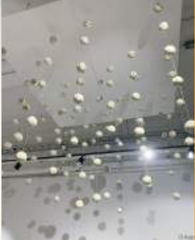
Desde luego que también se encuentran uniformes, guantes, pelotas, bates y equipo perteneciente a jugadores emblemáticos de los Diablos Rojos del México.

Uno de los lugares más atractivos es un selfie spot que consta de un trono ambientado con luces y decoración infernal que nos hace sentir en las tinieblas y que te im-