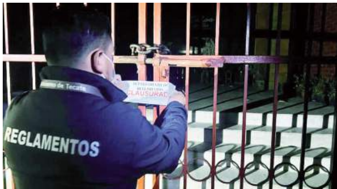
TECATE.- Investigan a inspectores de reglamentos por supuestos actos de corrupción en clausura de antros.

Por ello, la oficina de Responsabilidades de Sindicatura Municipal, abrió una carpeta de investigación, donde dependiendo de los resultados, se podría incluso formular denuncias ante las instituciones judiciales para promover procesos penales para quien o quienes resulten responsables.