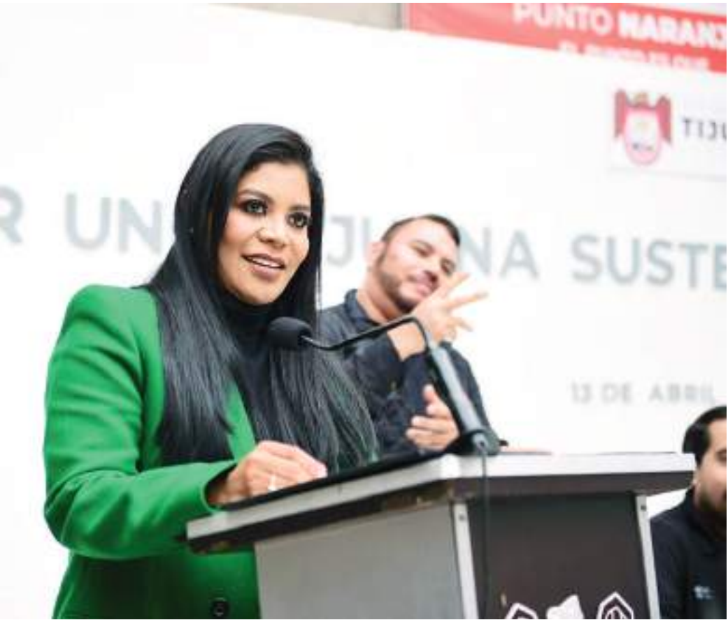
TIJUANA MONTSERRAT CABALLERO RAMÍREZ... Redobla esfuerzos para atender los deslizamientos.

En tanto, habrá que esperar el resultado de las investigaciones que realice Sindicatura Municipal pero se advierte que varios funcionarios de la actual, y anteriores administraciones, tendrán que responder por actos de corrupción.