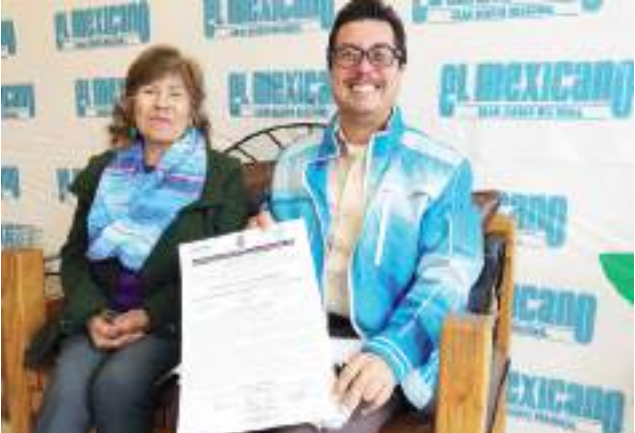
ENSENADA.- El “XL Symposium de Historia Regional”, se realizará los próximos 16, 17 y 18 de mayo del 2023 en la UABC unidad Valle Dorado.