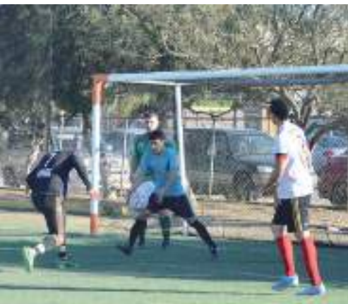
Los cuadros del JyC Club y Filizia abren las acciones de la jornada número 16 del torneo Dominical 7 Varonil Abierto.