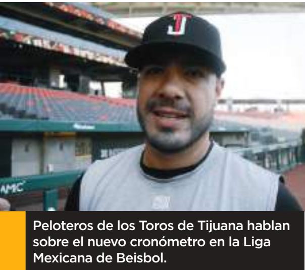
Peloteros de los Toros de Tijuana hablan sobre el nuevo cronómetro en la Liga Mexicana de Beisbol.

“Creo que nosotros hemos tenido poquitas fallas, nos han cantado alrededor de tres o cuatro bolas, un strike a un bateador en ocho juegos, lo hemos manejado bien, los muchachos lo han entendido”, finalizó.