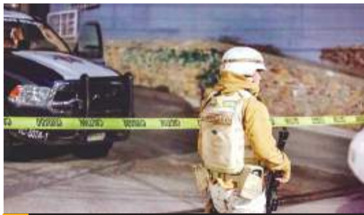
TIJUANA - Uno perdió la vida tras accidente y dos fueron ejecutados a balazos