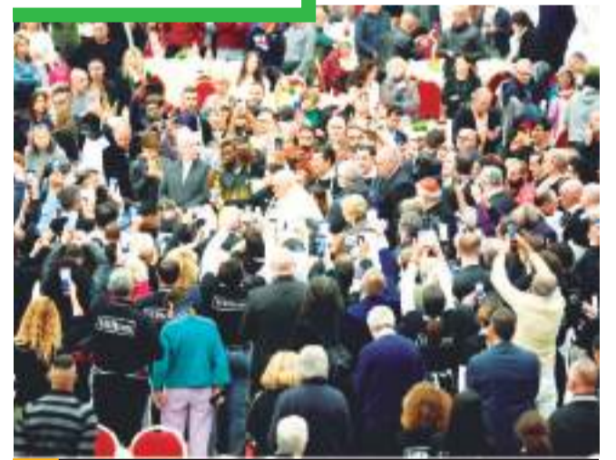
Mujeres trans destacan el mensaje de inclusión, del Papa Francisco.