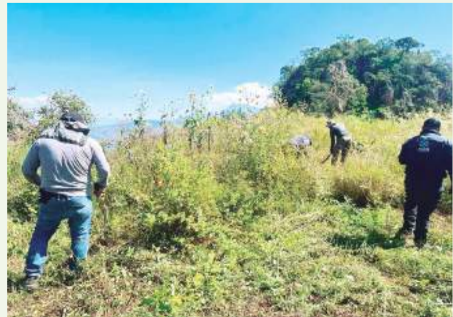
MEXICALI.- De acuerdo al proyecto de la Ley en Materia de Desaparición Forzada del Estado, las policías municipales tendrán que contar con células de búsqueda de personas.

“Ya casi está lista la legislación, si fue consensuada con los colectivos”, refirió.