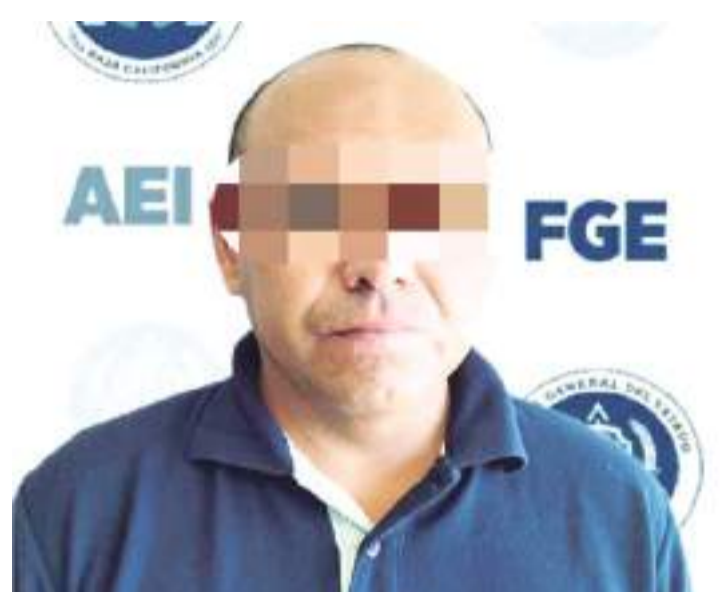
MEXICALI.- La orden de aprehensión fue cumplimentada el día 17 de noviembre del presente año.

por la fiscalía, imponiendo para el señalado prisión preventiva justificada y plazo de un mes para la investigación complementaria.