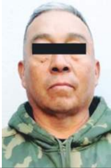
TIJUANA.- Obed "N", Joaquín "N" y Germán "N", quienes, al ser capturados, llevaban unas escaleras especiales para colgarse en el cerco metálico, en donde lograron cruzar a tres migrantes.