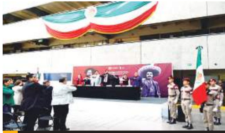
TIJUANA Miles de personas entre personal de distintas dependencias de gobierno, asociaciones civiles y estudiantes celebraron la Revolución Mexicana con el tradicional desfile cívico.

"Este día hay que honrar su sacrificio, porque entregaron su vida por México, en forjar un mejor país con ese futuro que exigían, una lucha que se gestó producto de un México de ideales. Gracias a esta visión, los hombres como Madero, Zapata, Obregón, Carranza, Villa, entre otros, aspiraron a la igualdad de una nación y se quedó plasmado en nuestra historia", manifestó. Asimismo, el Secretario de Gobierno Municipal no olvidó en