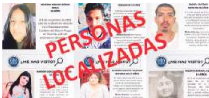
TIJUANA -Algunos de ellos ya han sido reunidos con sus familiares.

Agradecemos a los medios de comunicación y a la ciudadanía en general por el apoyo brindado durante el proceso de búsqueda de estas personas. Su colaboración fue invaluable y desempeñó un papel fundamental en el éxito de estas labores.