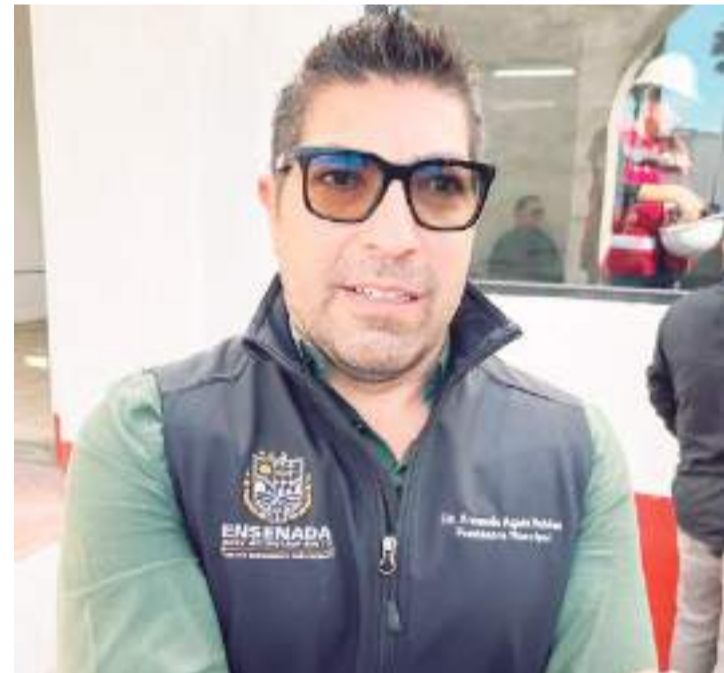
TIJUANA.- Según la casa encuestadora Demoscopia Digital la dupla de la Diputada Federal Julieta Ramírez y el Alcalde de Ensenada, Armando Ayala, son los preferidos para el Senado.

punto de las 09:00 horas a las afueras de Palacio Municipal, sobre la avenida Independencia y concluyó alrededor de las 13:00 horas a las afueras de la Universidad Autónoma de Baja California, contando con la participación de más de 5 mil personas en total, entre estudiantes, civiles y personal de instituciones como Cruz Roja, Bomberos, Policía Municipal y Ejército Mexicano.