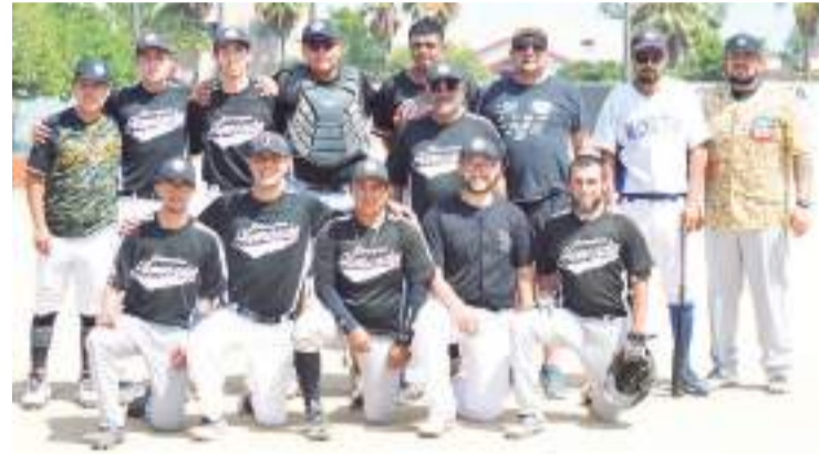
Embarcaciones Hernández se llevó victoria con marcador de seis carreras por una sobre Chapultepec.