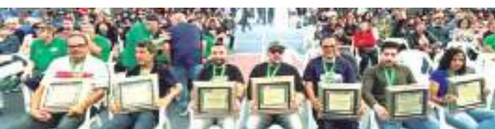
El Muro de La Fama del Deporte de El Sauzal A. C, ya tiene nuevos miembros que fueron entronizados, nueve ex deportistas que han puesto en alto el nombre de El Sauzal.