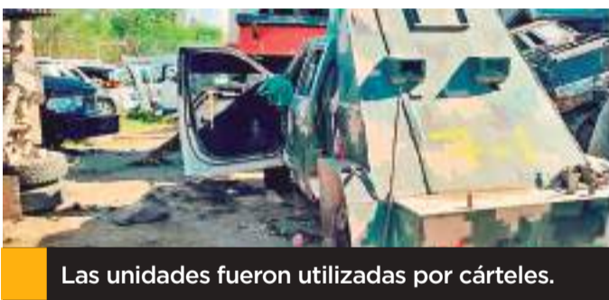
Las unidades fueron utilizadas por cárteles.