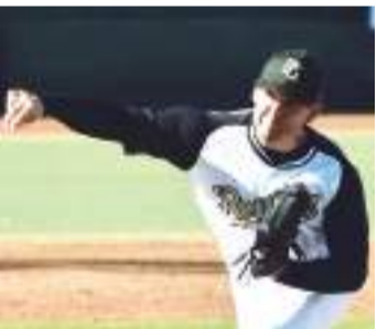
Publicidad Márquez y Royals resolvieron con sendas palizas sus respectivos compromisos celebrados en el deportivo Antonio Palacios.