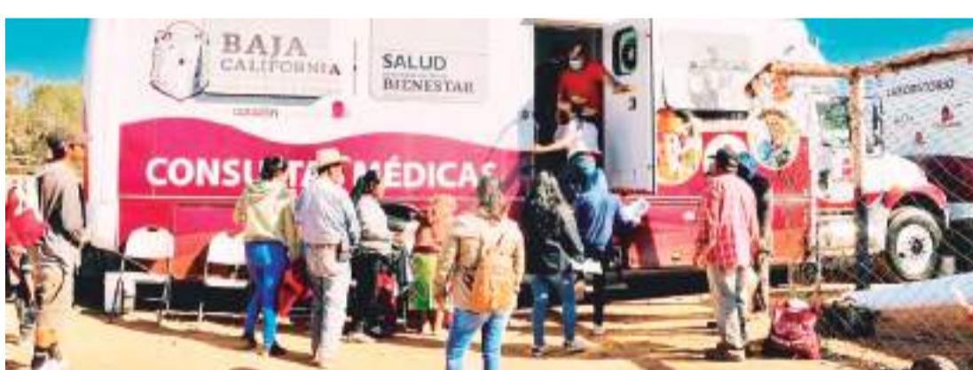
MEXICALI.- Los Centros de Salud Móviles continúan brindando servicios de salud a las comunidades en condición vulnerable en Mexicali, Tijuana y Ensenada.

Por último, Medina Amarillas informó que el objetivo de estas unidades es detectar de manera temprana enfermedades como la diabetes, la hipertensión, el cáncer, la tuberculosis y enfermedades respiratorias y gastrointestinales, permitiendo que se les proporcione la debida atención médica a todas las personas con servicios completamente gratuitos.