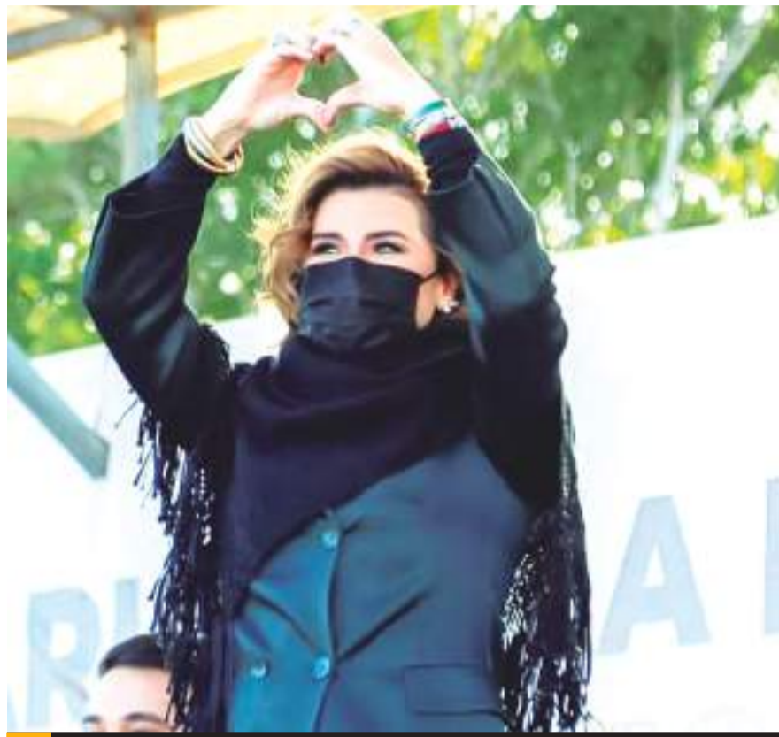
MEXICALI.- Al iniciar ayer el periodo del registro de aspirantes de los diferentes cargos de elección popular en Baja California, la Gobernadora Marina del Pilar Ávila Olmeda pidió a los aspirantes a respetar el resultado de las encuestas.

Hace unos días también se inscribieron los interesados en el proceso para candidaturas a las diputaciones federales y al Sena-