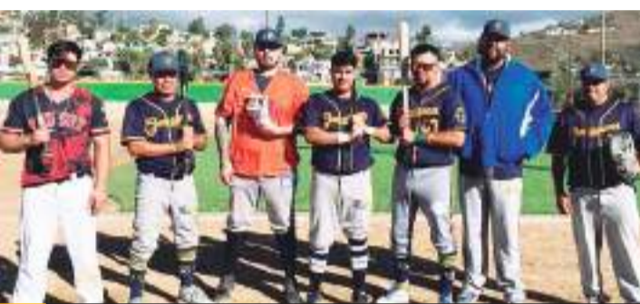
Cerveceros le ganó en maratónico duelo 12 carreras por 11 a Materiales Robles en partido de la Primera Especial.