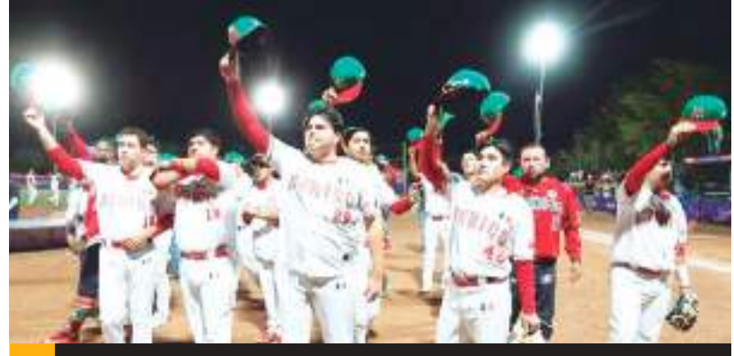
México enfrentó a Japón en la final de la Copa Mundial de Softbol Masculino Sub-18 Hermosillo 2023.