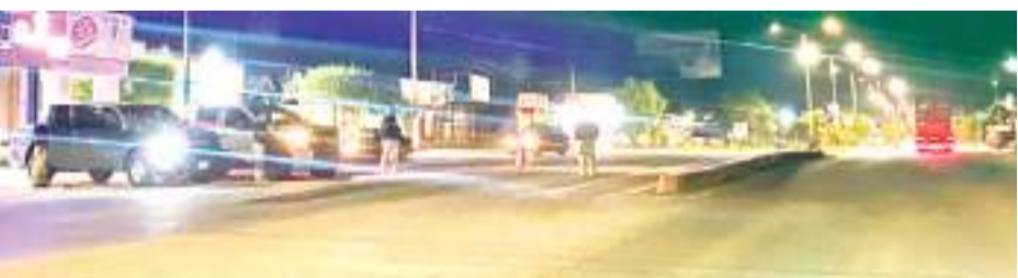
ENSENADA.- Han iniciado las primeras acciones del proyecto de la ciclovia y se mantendrán estacionamientos exclusivos en el tramo que comprende, expresó el alcalde CIA.