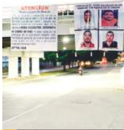
Firmadas por "Los Chapitos", prohíben en narcomantas los secuestros en Culiacán.