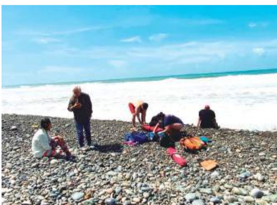
PLAYAS DE ROSARITO.- Un joven junto con su caballo, estuvieron a punto de morir ahogados.