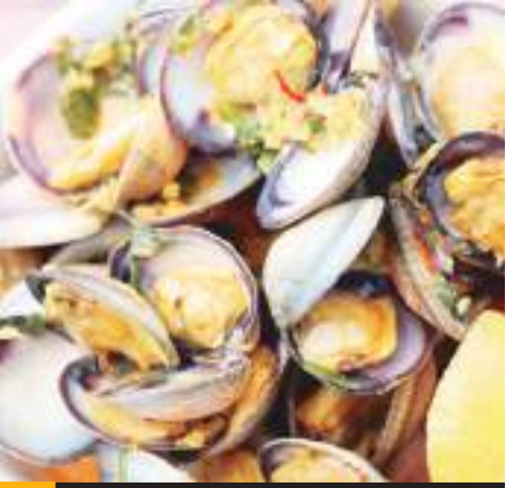
ENSENADA.- El primer proyecto acuícola en la Bahía de San Quintín, es respaldado por la Sepesca, el Imipas y los gobiernos federal y estatal.

Asimismo, se estableció que la operación de las granjas acuícolas de la zona son una referencia nacional e internacional, por la calidad y la sustentabilidad de los productos que ahí se generan y del cuidado del medio ambiente.