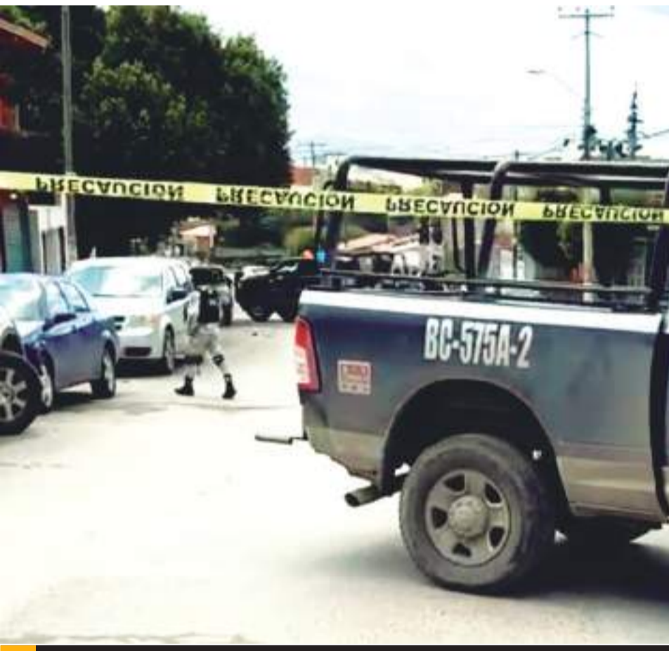
TIJUANA.- Saldo rojo, este martes, por hechos violentos en Tijuana

Con relación a este caso, las policías preventivas no informaron sobre personas detenidas, mientras que la Fiscalía General del Estado se hizo cargo de la investigación correspondiente.