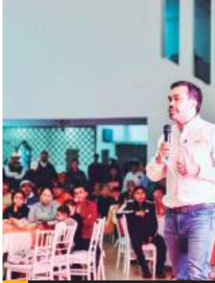
Jorge Álvarez Máynez, estuvo de gira en su natal Zacatecas, gobernada por Morena.

Asimismo, reprochó la manera en la que fueron tratadas las manifestantes el pasado 8 de marzo por autoridades estatales.