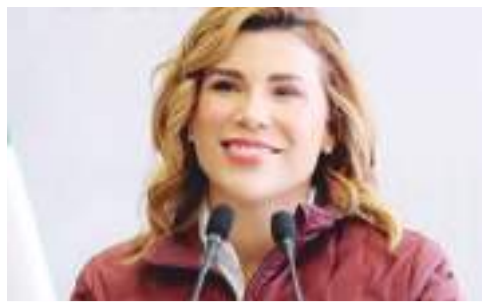
MEXICALI MARINA DEL PILAR ÁVILA OLMEDA...

Asumió compromisos para el bienestar de los oaxaqueños.