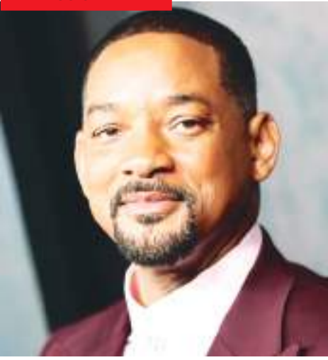
"BAD BOYS 4"