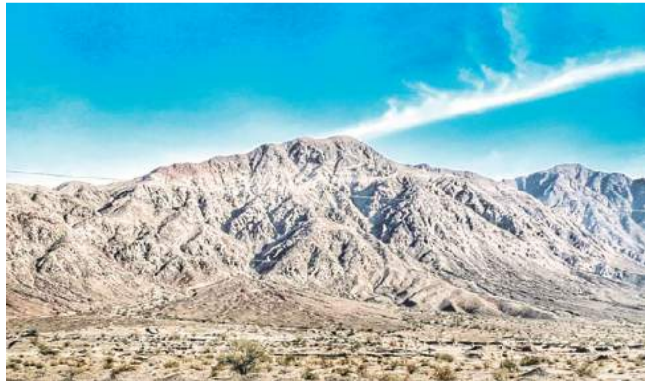
MEXICALI.- Brigadas del Sol recomiendan a los vacacionistas dar aviso a protección civil si visitan lugares de difícil acceso.

Expuso que lo ideal es que los vacacionistas tengan conocimientos de primeros auxilios mientras llegan los grupos de rescate, aunque reconoció que la mayoría de las personas ca-