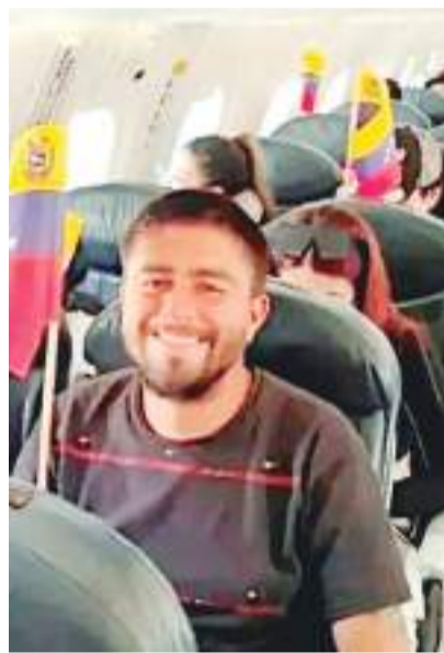
Repatriados recibirán dinero a través de tarjetas de Bienestar.