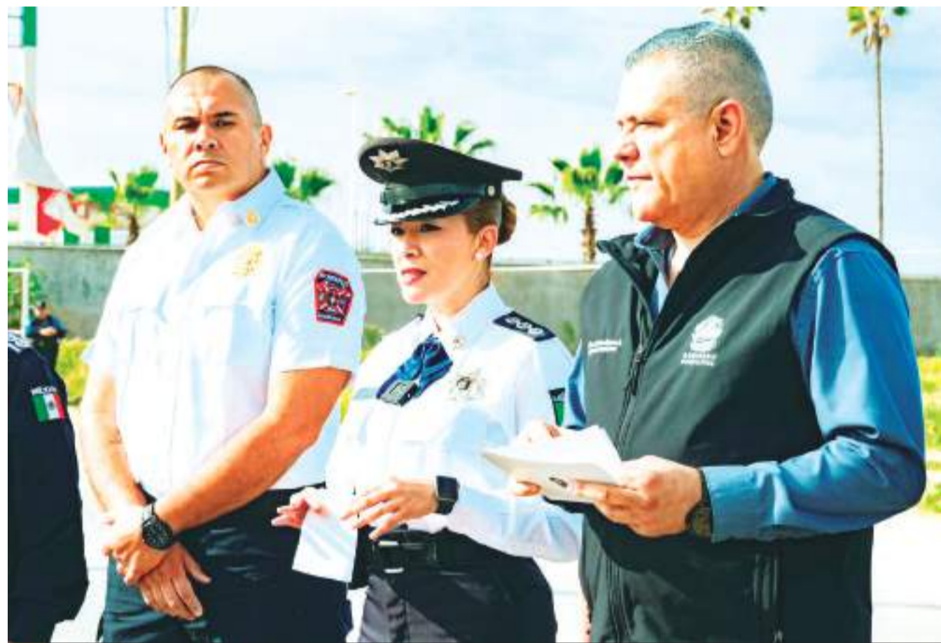
ENSENADA.- Durante la primera sesión ordinaria del Consejo de Seguridad Ciudadana se acordó buscar estrategias para unificar el Programa Violeta en pro de las víctimas de violencia.

La mayoría de los accidentes son prevenibles; la prevención de los mismos depende de dos factores principales: la protección y la educación. (bpa).