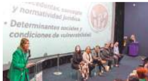
MEXICALI.- Personal del DIF Baja California participó en el curso-taller denominado: "Trata de Personas, Fenómeno Social Complejo en el Modelo Neoliberal".

to de la trata de personas que versaron desde datos históricos a situaciones reales que se han presentado en el escenario nacional e internacional.