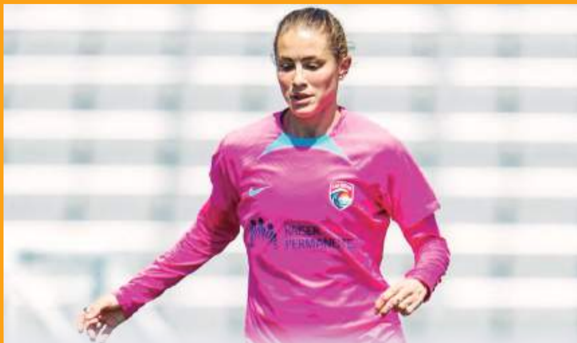
Cuatro jugadoras de SD Wave fueron convocadas.