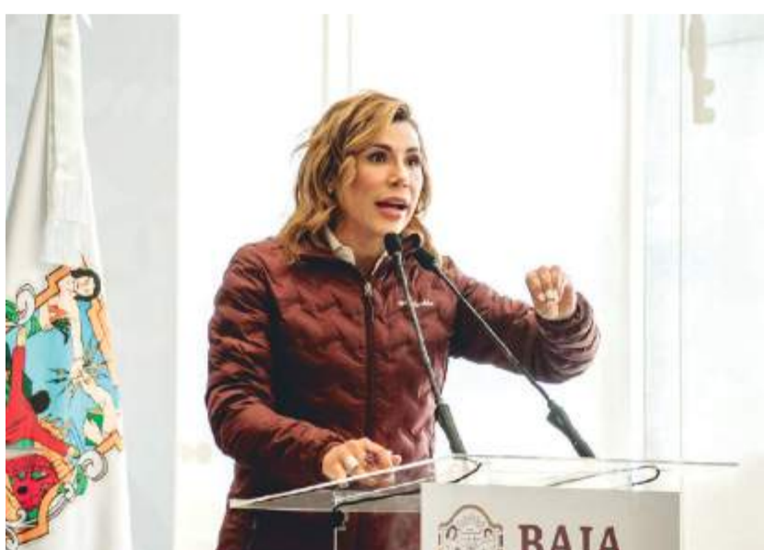
TIJUANA.- La Gobernadora Marina del Pilar dijo que la destitución de los dos funcionarios del Instituto Nacional de Migración, es un tema federal del que se hará cargo la Fiscalía General de la República.

“Lo que yo les puedo decir como Gobernadora del Estado, es que estaremos atentos al procedimiento de la investigación que se lleve a cabo, coincido en que no se deben pagar justos por pecadores”, señaló.