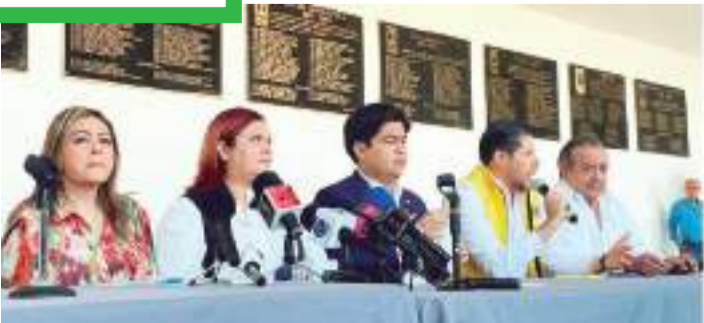
En conferencia de prensa, el PRD demandó seguridad en la contienda electoral.