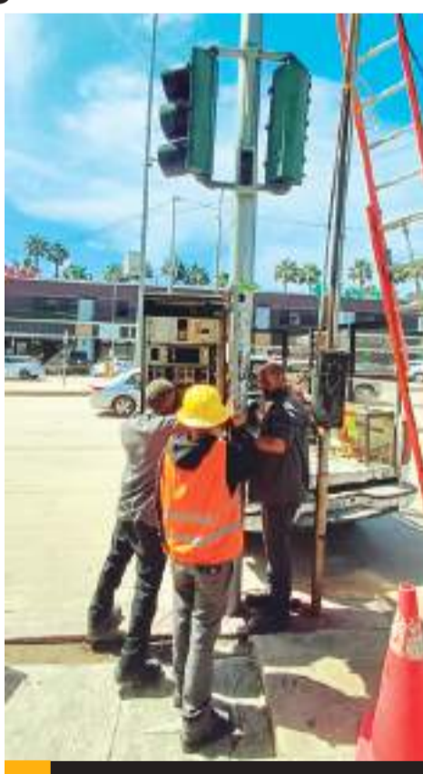
PLAYAS DE ROSARITO.- La afectación a semáforos a causa del clima adverso, ya fue resuelto por el Ayuntamiento de Playas de Rosarito.

El Gobierno de la ciudad hace un llamado a la comunidad a reportar cualquier tipo de incidente relaciona-