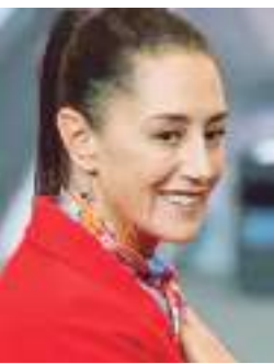
MEXICALI CLAUDIA SHEINBAUM PARDO...

Asumió compromisos para el bienestar de los oaxaqueños.