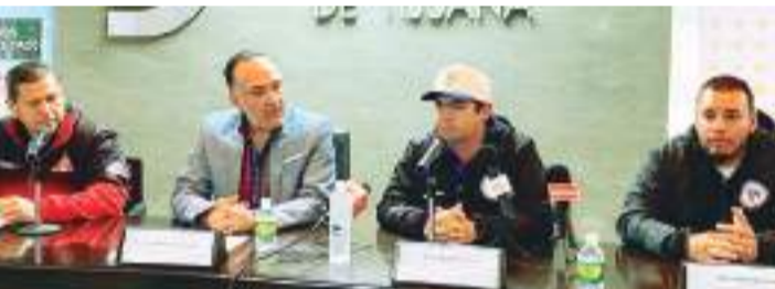
Participarán 14 equipos de diversos estados del país.

Otras son la Liga Municipal Linces de Guasave, Liga Escuela de Beisbol Infantil y Juvenil Tarahumara, Liga Pequeña de Beisbol Beto Avila, Liga de Beisbol Infantil y Juvenil Norte de Hermosillo, Liga de Beisbol Infantil y Juvenil Félix Arce, Liga de Beisbol Infantil y Juvenil Cuapah, Liga de Beisbol Infantil y Juvenil del Estado de Nuevo León Mandarina.