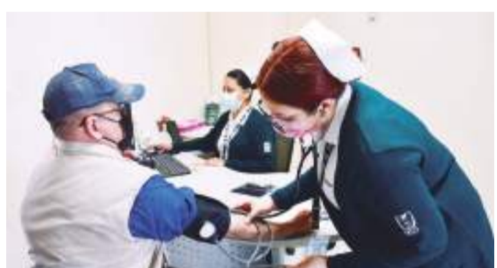
TIJUANA.- El IMSS recomienda no abusar de alimentos procedentes del mar ni de comidas endulzadas o postres durante la Cuaresma principalmente.