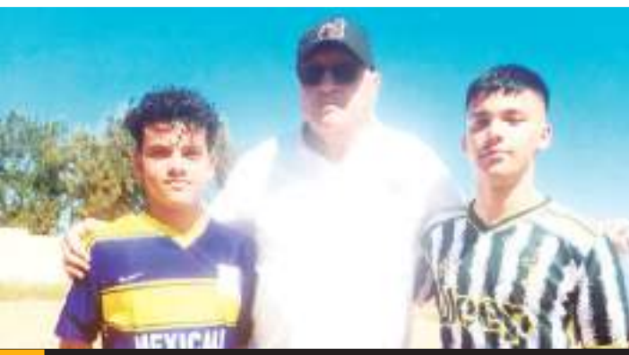
Este tipo de juegos es para generar mejor nivel.

También mencionó que se espera crear un mejor colegio de arbitraje, todo esto con miras de crecer en el ámbito deportivo, con las puertas abiertas para todos los interesados en aprender este gran oficio desde una temprana edad.