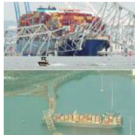
Barco de carga colisiona con Puente Francis Scott Key en Baltimore, provocando su colapso parcial.