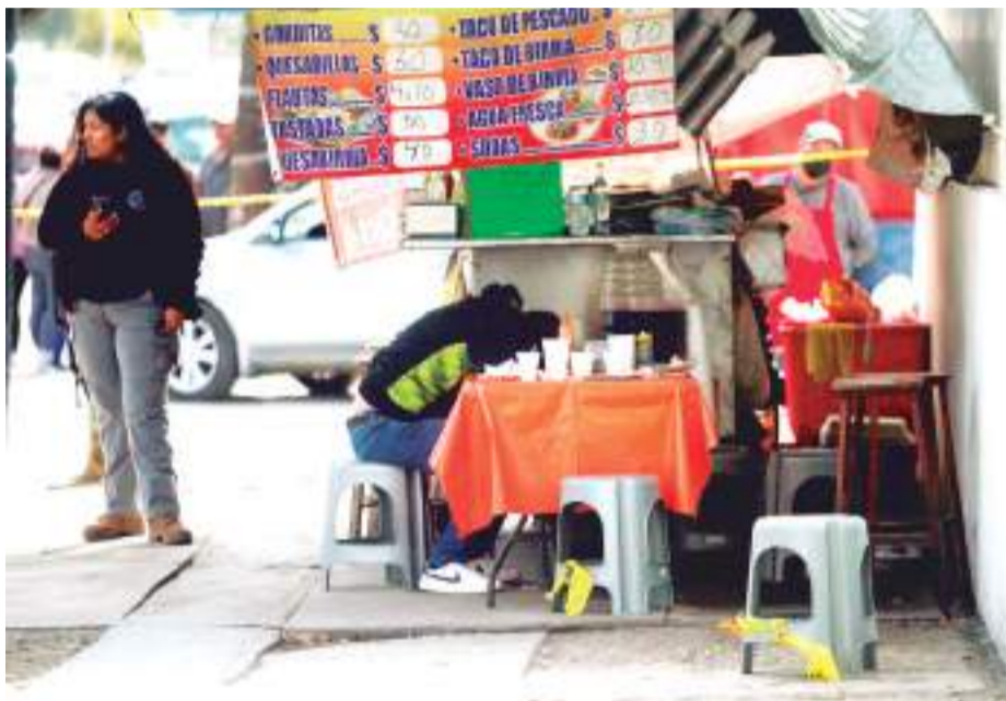
TIJUANA.- Un hombre fue sorprendido a tiros cuando comía tacos de birria en un puesto ubicado frente a la clínica 27 del IMSS, demarcación Pinos de Nares.

Hasta donde llegaron una ambulancia, policías municipales y unidades de la Guardia Nacional, pero fueron socorristas de la Cruz Roja los que allí declararon sin vida a la víctima; señalaron presentaba un