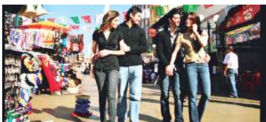
TIJUANA.- Baja California tiene una amplia oferta turística, y por lo cual los touroperadores invitan a ser turista en tu Estado.

Pacífico en Ensenada. “Al viajar en el estado se apoya también a cientos de empresas turísticas que ofrecen diversos servicios además ahora con descuentos