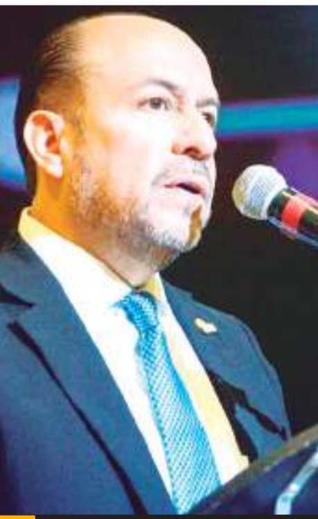
MEXICALI.- Para INDEX Mexicali, se requiere mayor información de la Ley anti golondrinas aprobada recientemente por el Congreso estatal.

En otro tema, el líder maquilador comentó que, en la temporada vacacional de Semana Santa, no hay días oficiales considerados como descanso, sino que algunas empresas otorgan esos días como una prestación adicional, "algunas cambiaron el 18 de marzo en relación al natalicio de Benito Juárez para el viernes santo y dar un puente más largo, pero fuera de eso, la jornada es normal" concluyó.