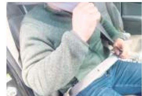
ENSENADA.- En el sector salud recomiendan conducir con todas las medidas de precaución para evitar accidentes durante este período vacacional.

Durante esta primera sesión ordinaria, también abordaron el Sistema de Justicia Cívica para su aplicación en el estado, como son los estándares que se deberán seguir tanto en equipamiento, capacitación, unidades y sentido de pertenencia de los elementos policiacos, entre otros puntos. (bpa).