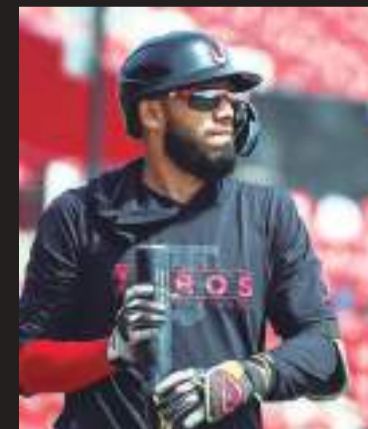
El conjunto fronterizo viajó el martes a Oaxaca.

La actividad se trasladará a la Ciudad de México donde Toros de Tijuana ya pactó