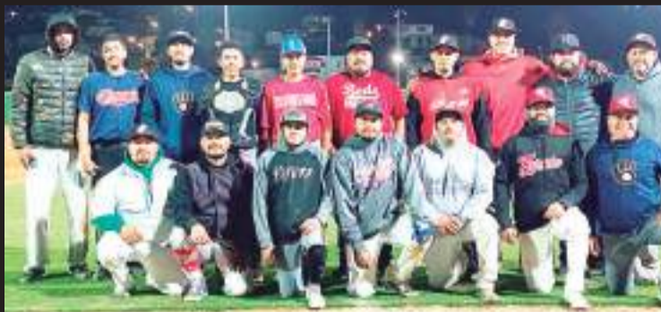
Rojos gan  el primer juego de las semifinales de la Primera Especial.