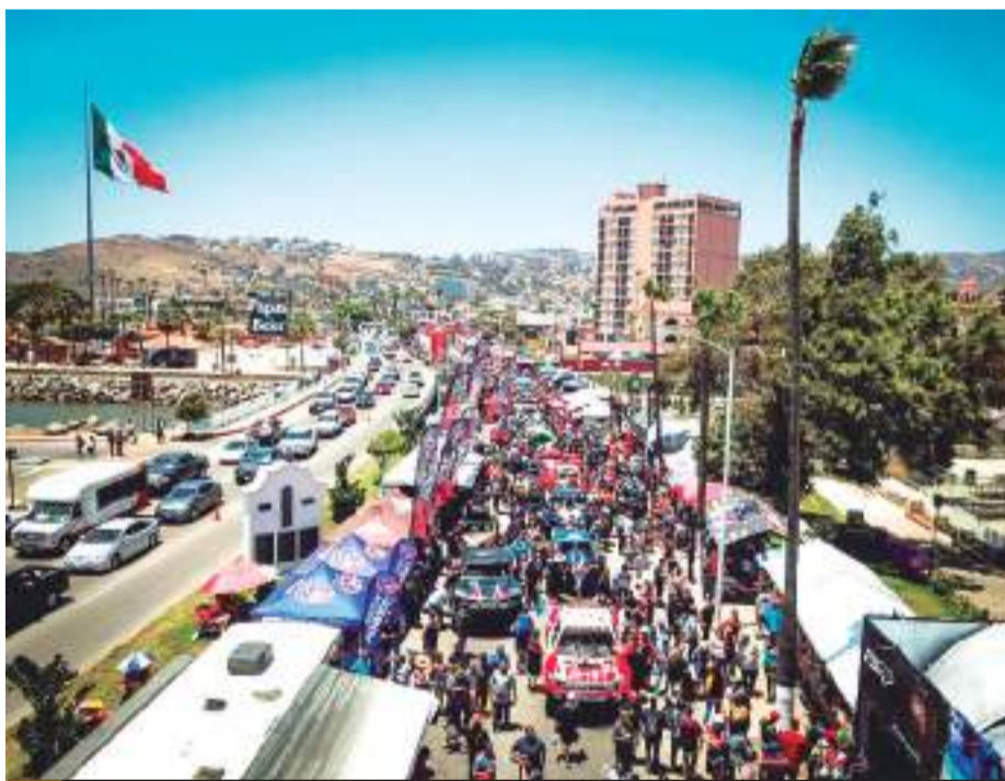
ENSENADA.- Tres carreras de Score programadas para este 2024, producirán una derrama económica y promoción para Ensenada.

Debido a que las tres carreras tendrán salida y meta en Ensenada y que, por primera vez en su historia, contarán con Rondas de Calificación en cada una de ellas, se proyecta una derrama económica superior a los 30 MDD en total en una amplia cadena de servicios de hospedaje, transporte, seguridad, personal y alimentación