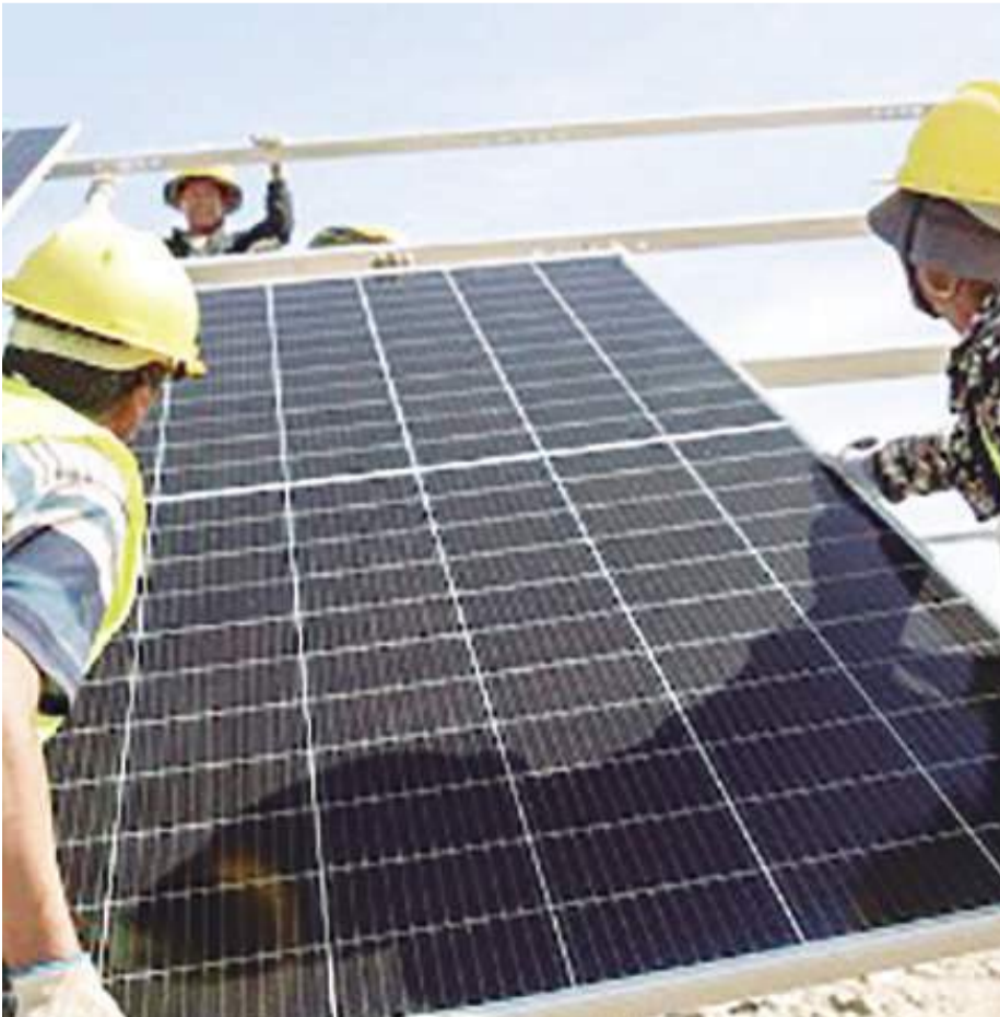
TIJUANA.- La CFE aclaró que no regala paneles solares, y sólo realiza el trámite de contratación de suministro para solicitudes de interconexión de clientes que ya cuentan con sus propias celdas fotovoltaicas.

Estas acciones –se indicó–, es en el marco de programas sociales como el que deriva del Fondo de Servicio Universal Eléctrico (FSUE), y estableció que en sus Centros de Atención a Clientes, la CFE no realiza ningún tipo de trámite destinado a regalar paneles solares. (scg)