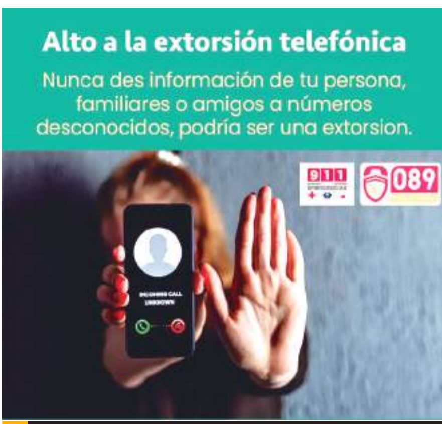
ENSENADA.- Alerta el Gobierno Municipal sobre llamadas de extorsión para pedir recursos supuestamente para el pago de un holograma de materia de Protección Civil.

Dijo también que es importante que no permitan que personas menores de edad respondan las llamadas y cuidar que los adultos mayores caigan, al ser ambos los más vulnerables en ese tipo de extorsiones.(bpa).