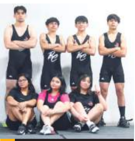
Los atletas viajaron ayer a la sede Monterrey.