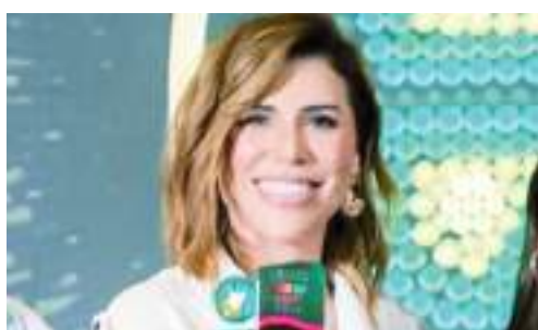
MEXICALI MARINA DEL PILAR ÁVILA OLMEDA...

Refrenda el éxito de la Entidad en materia turística.