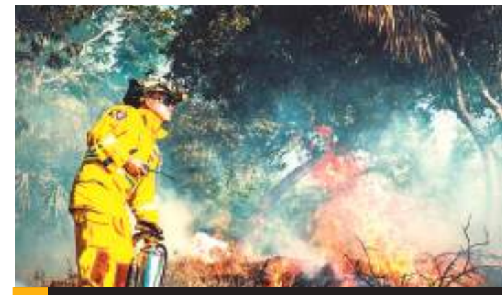
TIJUANA.- En la época de calor aumentan los incendios forestales a consecuencia de las altas temperaturas.

Posteriormente, la zona quedó acordonada por elementos de la Policía Municipal y Guardia Nacional, mientras arribaban los agentes de la Fiscalía General del Estado, quienes finalmente se encargaron de realizar las investigaciones correspondientes en la escena.