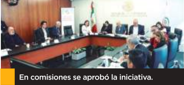
En comisiones se aprobó la iniciativa.