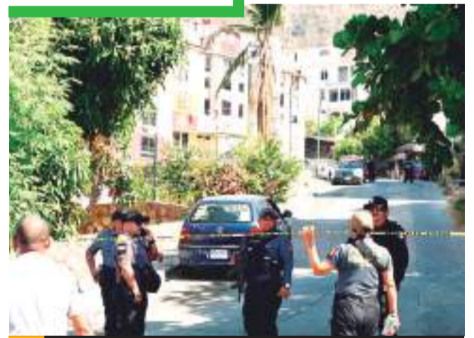
El ataque se produjo a las 8:50 horas de este jueves en la zona urbana del destino turístico.