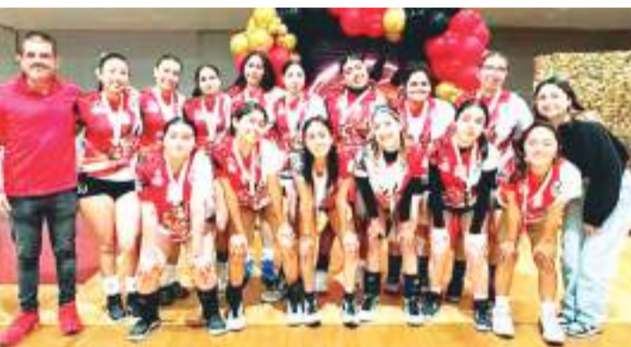
El Club Alphas se llev  el primer lugar.