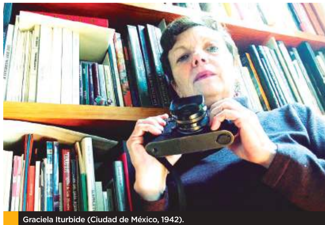
Graciela Iturbide (Ciudad de México, 1942).

Estuve en Lanzarote y también en La Palma, acerde no me dejaron acercarme al volcán porque estaba en erupción. Aquí en México voy a tratar de fotografiar todos los volcanes. Fotografié al Parícutín, porque yo quería que estuviera en la exposición, pero desafortunadamente tomé una foto que todo mundo ha tomado, entonces no la puse, no valía la pena. A veces uno encuentra sorpresas en su trabajo, fotos que pensabas que no iban a resultar y de repente fotos que (implícitamente) un esfuerzo para subir —estoy loca, a mi edad me pude haber matado ahí— fue maravilloso, pero no vale la pena. He aprendido como fotógrafa a ver el mundo de distintas formas, pero como Graciela Iturbide, sobre todo, en el sentido que por un lado están mis fotos, pero todo esto me da oportunidad de se-