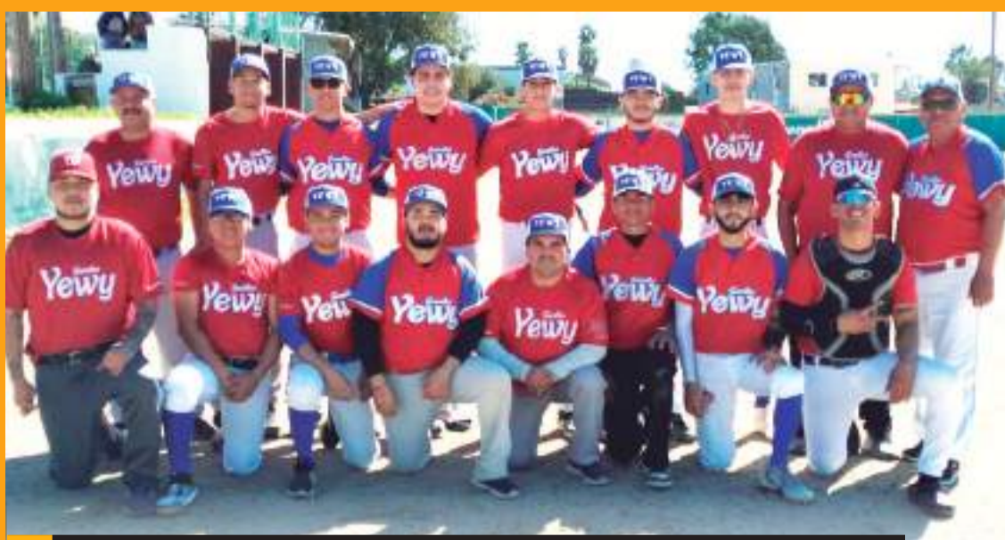
Semillas Yewi gan  su  ltimo compromiso 10 carreras por 8 a los Astros.