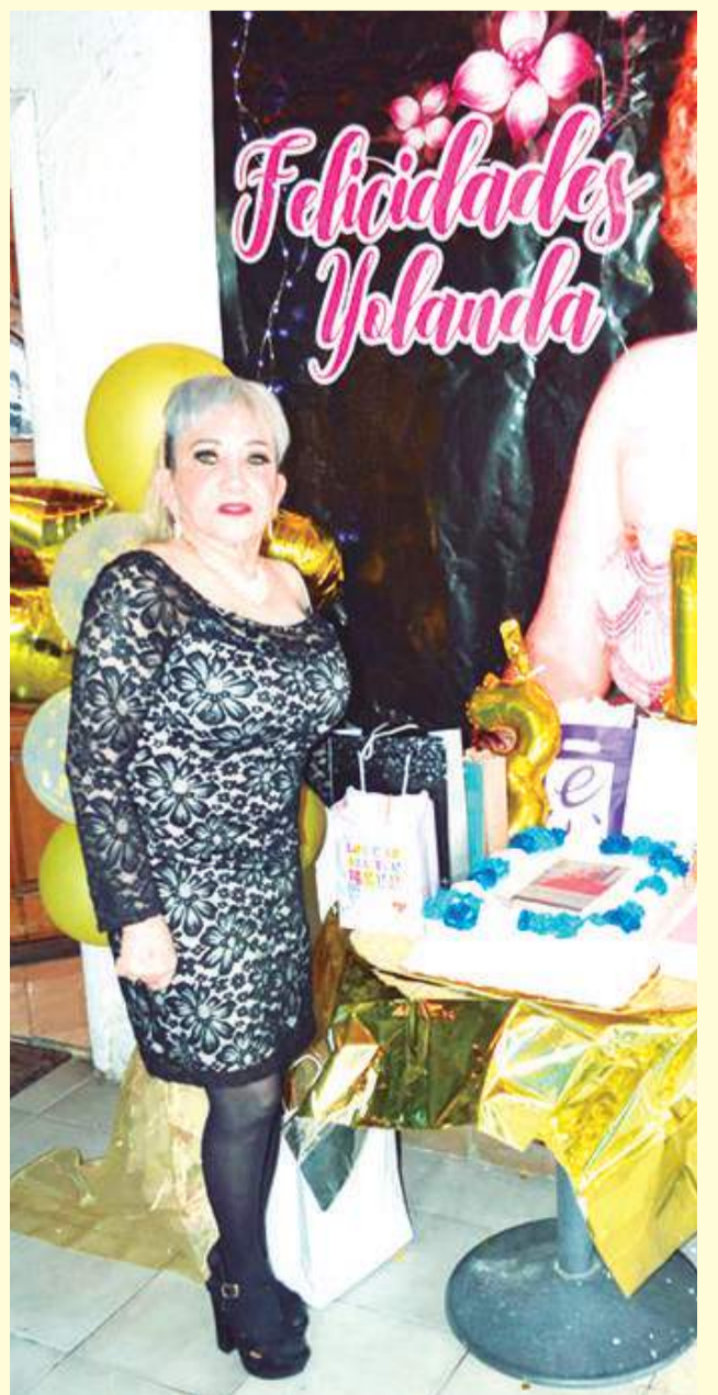
La feliz jubilada.