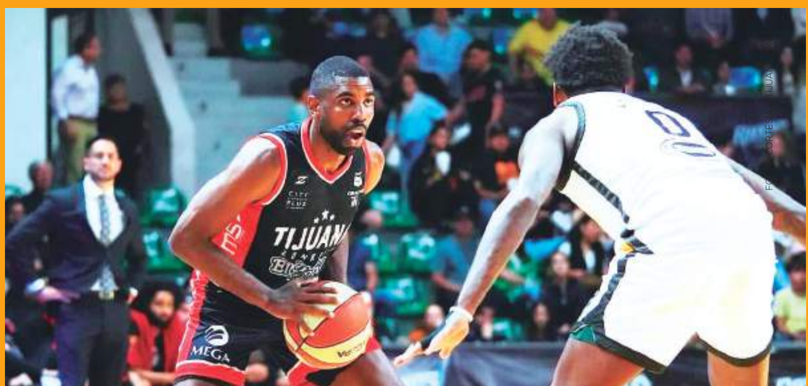
En la Segunda Vuelta, ambas franquicias se encuentran con marca de 1-1.