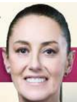
MEXICALI CLAUDIA SHEINBAUM PARDO...