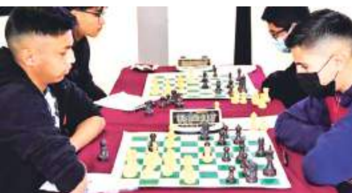
El certamen es en memoria de Felipe de Jes s P rez Blanco.

La premiaci n ser  en efectivo para los primeros 6 lugares en las categor as Abierta y Aficionados y medallas y trofeos en las categor as Juvenil e Infantil.