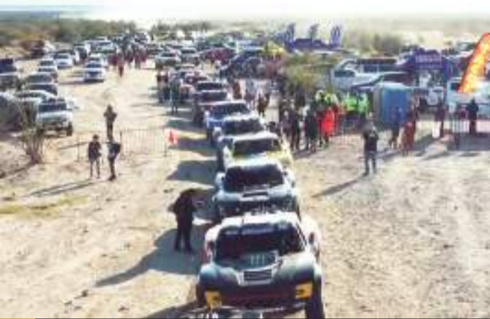
La ronda es para los equipos inscritos en las clases Trophy Truck.

Score International en M xico confirm  tambi n que la ruta se abrir  para recorridos de reconocimientos a partir del s bado 18 de mayo, fecha desde la cual habr a presencia de equipos participantes en Ensenada y sus alrededores.