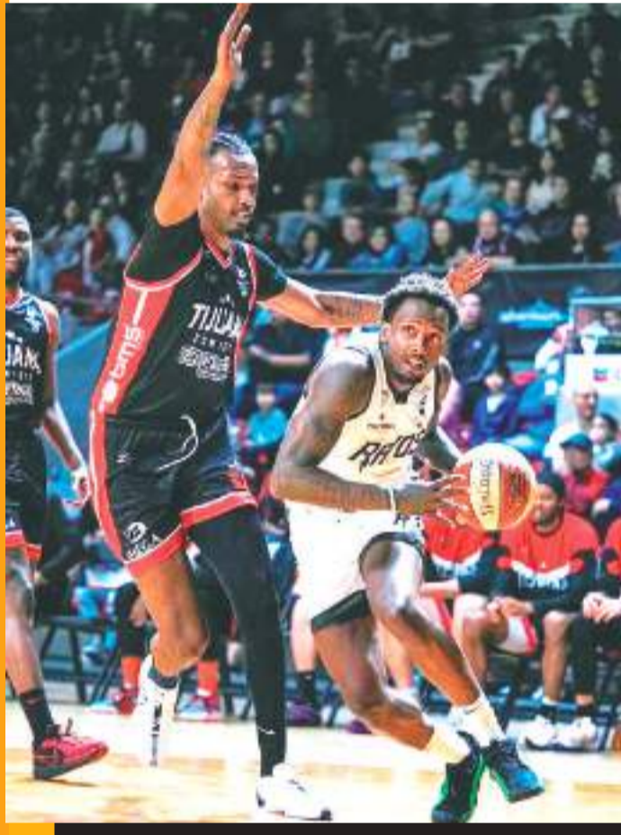
El juego de este viernes arranca en punto de las 19:00 horas.

Zonkeys recibe hoy a Rayos de Hermosillo en serie de la Segunda Vuelta; la franquicia buscará reafirmar el buen paso