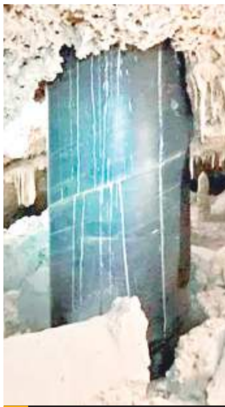
López Obrador reconoció por primera vez la contaminación de un cenote en Quintana Roo.