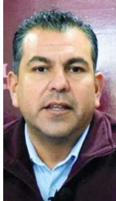
MEXICALI.- El ex director de COEPRIS, ahora asumirá su papel como edil en el Cabildo de Tijuana.

El estudio es impulsado por Comice y financiado por el Consejo de Desarrollo Económico de Ensenada a través del Fideicomiso Empresarial 2 y prevén concluirlo para su publicación en octubre. (bpa).