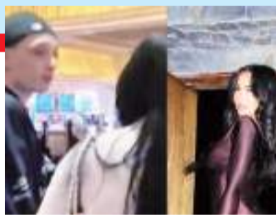
EL CANTANTE RECHAZA REVELAR