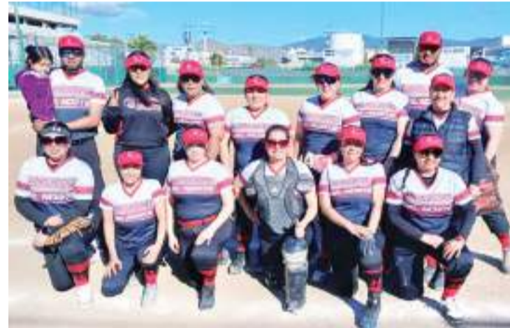
Extinguidores Del Norte se impuso 11 carreras por 9 a las Monsters en duelo de la categoría de Segunda Fuerza B1.