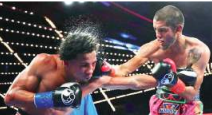
Las acciones se realizan este sábado y tendrá varias peleas.

Para la empresa promotora será su tercer evento del año, la primera fue el 27 de enero y el segundo el pasado primero de