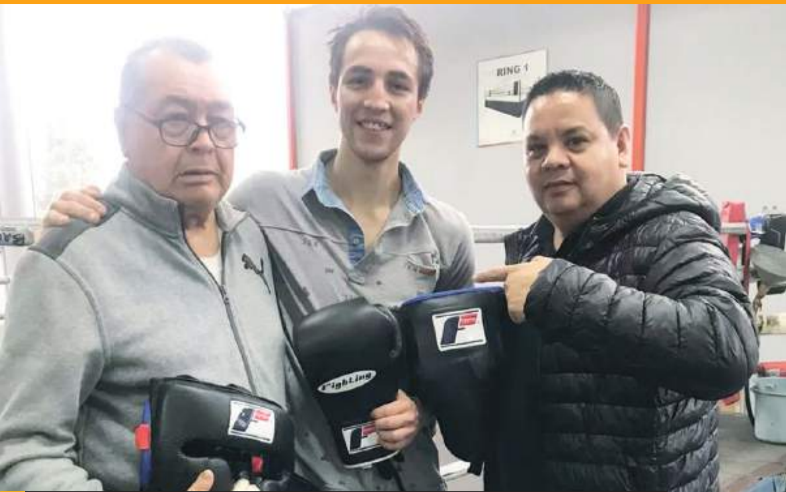
El boxeador estará en una de las peleas principales de "Noche de Box" a realizarse el próximo mes.

Por parte de la Conferencia Oeste los clasificados a la postemporada son Thunder de Oklahoma, Nuggets de Denver, Timberwolves de Minnesota, Clippers de Los Angeles, Mavericks de Dallas y Suns de Phoenix. (AMS)