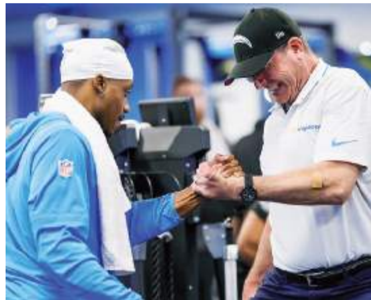
Chargers de Los Ángeles ingresan al Draft NFL 2024 con nueve selecciones, la primera de ellas será la general número 5.

La selección general número 5 de los Chargers es