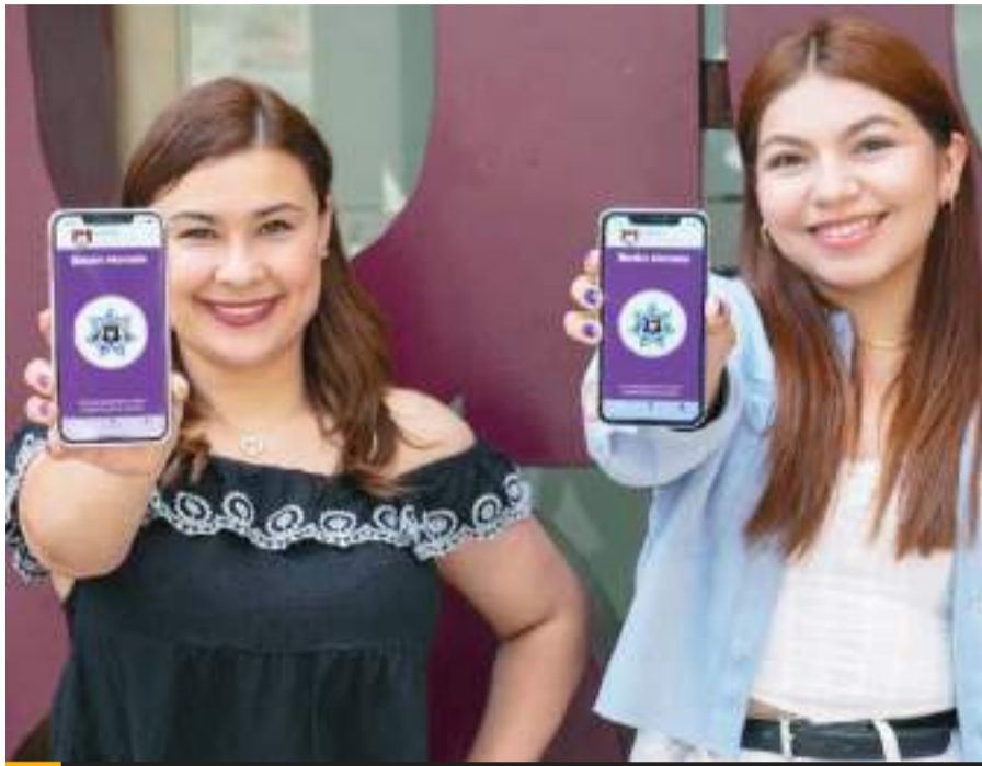
TIJUANA.- Un total de 109 mil mujeres han descargado la APP, Botón Morado, que es una herramienta para su protección.

Recalcó que, desde su presentación a la fecha, la aplicación Botón Morado, registra 109 mil descargas, luego de ser una herramienta preventiva que se tiene en el celular de