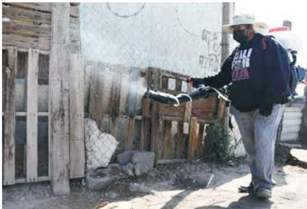
MEXICALI.- El sector salud en acciones intensas para evitar muertes por rickettsia.

Al respecto, comentó que se proporcionará un collar, así como el anti garrapati-