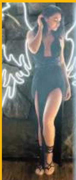
LIVIA BRITO EN CANCÚN