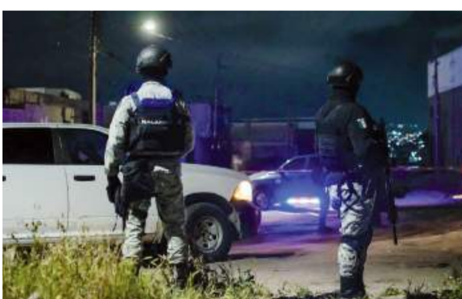
TIJUANA.- Cuatro hombres y una mujer fueron localizados sin vida abandonados a bordo de una camioneta, estaban atados de pies y manos, además envueltos en plástico transparente, tipo fleje.