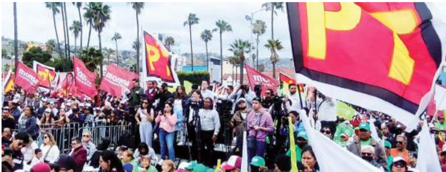
ENSENADA.- Iniciaron campaña de proselitismo de manera puntual los candidatos a la presidencia municipal, postulados por los diferentes partidos que están en la contienda electoral.

Al término de la caravana de automóviles, la candidata se concentró junto con sus seguidores en el monumento a la madre y la explanada del Parque Revolución, evento que fue alegrado con música del grupo Los Tiranos del Norte.