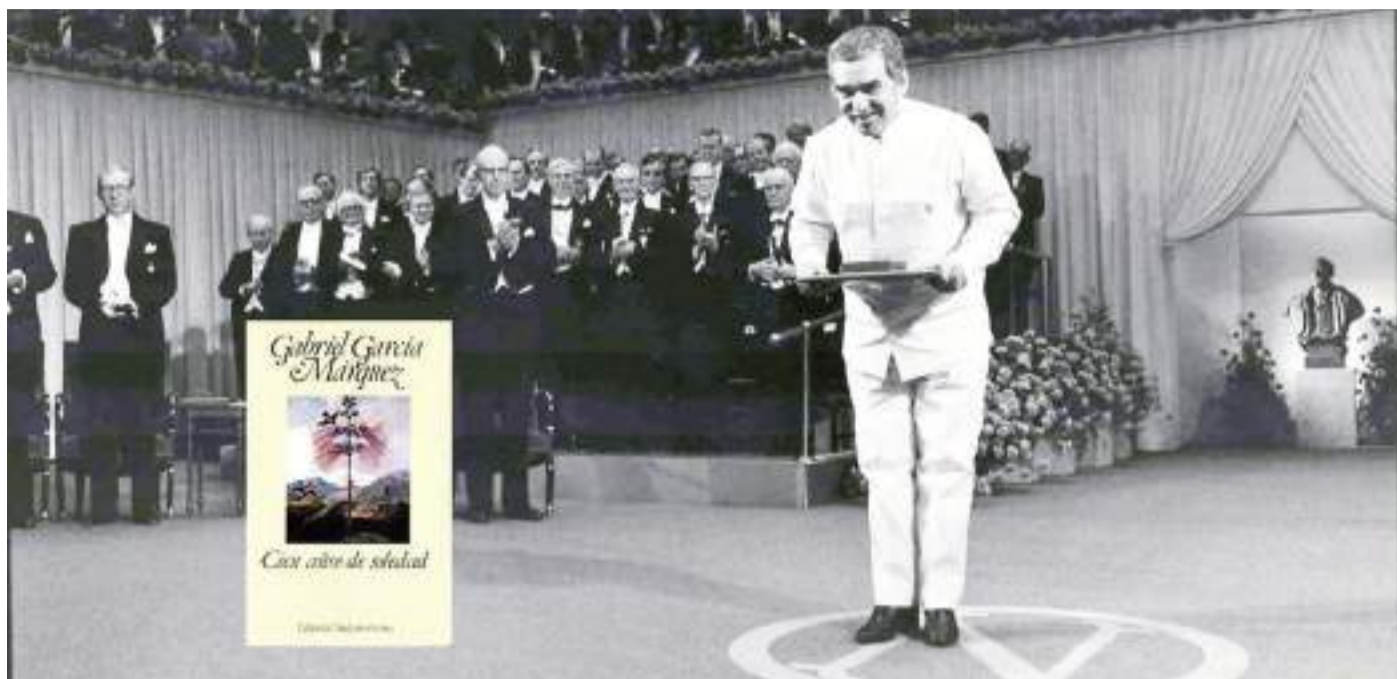
El escritor colombiano recibió el Premio Nobel de Literatura en 1982.

Otra experiencia esencial comenzó en 1973. La circunstancias de García Márquez ya eran muy distintas: siete años antes había publicado Cien años de soledad, cuyo rotundo éxito le representó al autor solvencia financiera y un creciente prestigio. Ese año, el autor se propuso emprender uno de sus más ambiciosos proyectos pe-