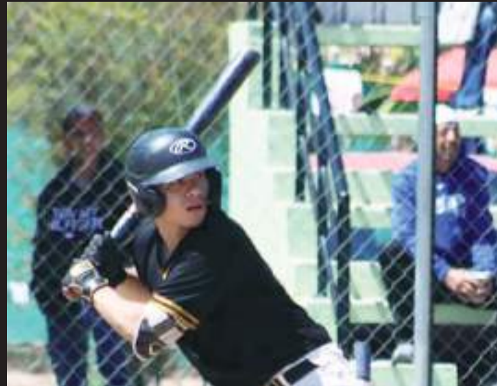
Rancho Romero empareja la serie final por el gallardete de la máxima categoría del campeonato oficial 2023-24 de la liga Rural de beisbol de Maneadero.