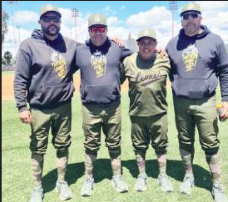
El equipo Leones apaleó a Cardenales para convertirse en el otro finalista del Torneo Oficial 2023-2024 de la Liga de Beisbol Amateur de Tijuana.