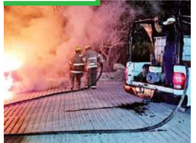
El narcoterrorismo, se adueña de Acapulco y la capital de Guerrero.