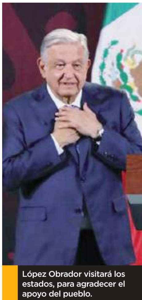
López Obrador visitará los estados, para agradecer el apoyo del pueblo.