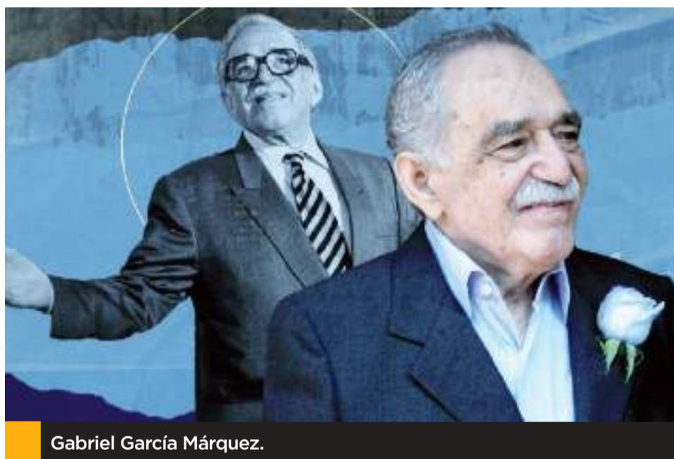
Gabriel García Márquez.

riodísticos: una revista política con contenidos relativos a toda América Latina. Así nació Alternativa, proyecto fundado y financiado por tres socios: García Márquez, el sociólogo Orlando Fals Borda y el periodista Enrique Santos Calderón. En palabras del último, el periodismo que practicaban era de “denuncia, investigación y análisis”. Tanto García Márquez como los otros socios invirtieron grandes cantidades de dinero en esta aventura que, por naturaleza, resultaba un negocio de muy alto riesgo.