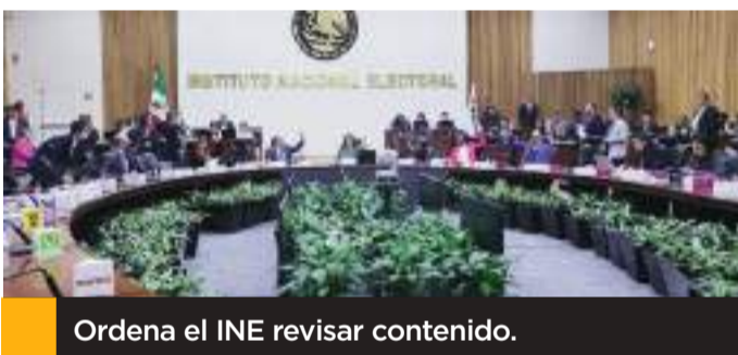
Ordena el INE revisar contenido.