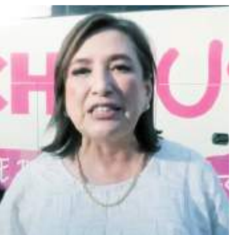
Xóchitl Gálvez, en Camargo.

El Poliforo Municipal fue insuficiente para albergar a los cientos de habitantes de los distintos municipios del centro-sur del estado, por lo que fue necesario habilitar en