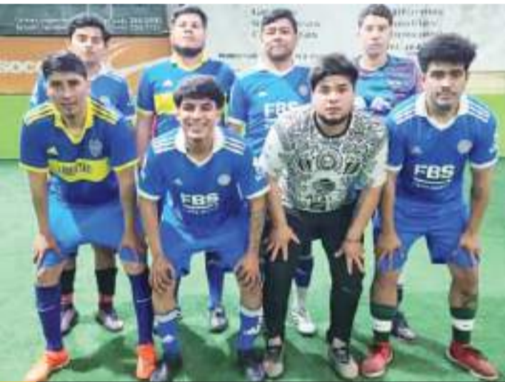
Los dos que tienen los pronósticos a su favor para quedarse con los boletos a la final son los cuadros de Constructora Hernández y Purificadora Zaldívar.

También este miércoles en la cancha Urban se estarán jugando los partidos de Ida de las semifinales de Recopa.