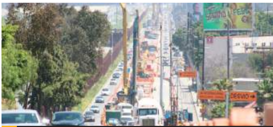
TIJUANA.- Este martes habrá cierre total de la avenida Internacional desde las 23:00 horas hasta las 4:00 de la madrugada para evitar molestias a los automovilistas.

El secretario de Desarrollo Territorial, Urbano y Ambiental (SD-