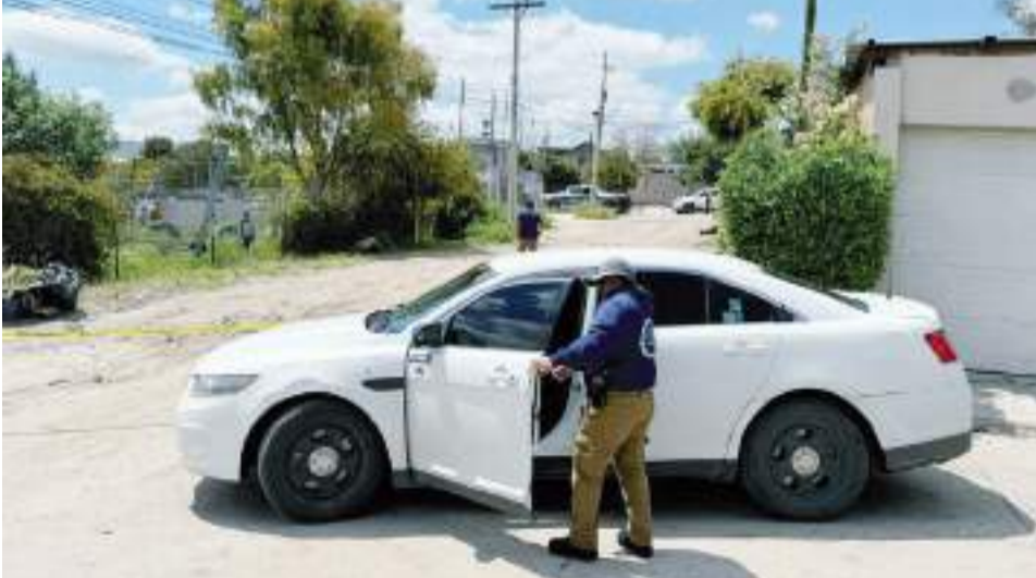
TIJUANA.- Una mujer fue quemada sobre la calle de terracería en la colonia La Morita; hasta el momento se desconoce identidad y edad de la víctima.