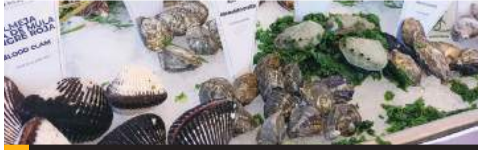
ENSENADA.- Cientos de comensales disfrutaron de diversos platillos a base de productos pesqueros y acuícolas, marinados con vinos de la región, durante el Festival de las Conchas y el Vino Nuevo en su 24 edición que tuvo lugar en este puerto.