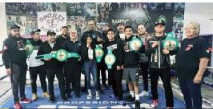
Los boxeadores de Baja California con sus cinturones del CMB ganados a sudor y lágrimas.