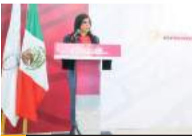
TIJUANA.- Suman 612 establecimientos convertidos en zonas seguras.

El cierre nocturno será desde el día martes 16 de abril hasta el 31 de agosto y contará con su debido señalamiento vial, por lo cual el Ayuntamiento de Tijuana solicita a los ciudadanos su comprensión para que tome las debidas precauciones.