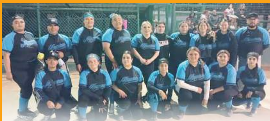
Monsters suma triunfo dentro de la categoría de Segunda Fuerza C del torneo oficial 2023-24 de la Liga Municipal de softbol Femenil de Ensenada.