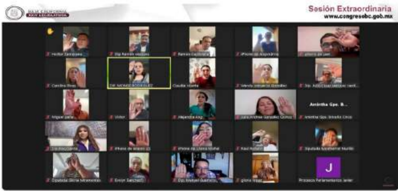
Sesión Extraordinaria Abril-14-2024

MEXICALI.- En sesión extraordinaria virtual de Pleno, diputadas y diputados de la XXIV Legislatura local, aprobaron por unanimidad el Dictamen No. 234 de la Comisión de Hacienda y Presupuesto, relativo a una solicitud de transferencia presupuestal