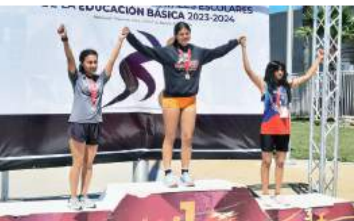
Los cachanillas subieron al podio dominando pista y campo.

Aproximadamente 600 alumnos-deportistas compiten este año en los Juegos Deportivos Nacionales Escolares de la Educación Básica 2023-2024 en su etapa estatal, nivel Secundaria.