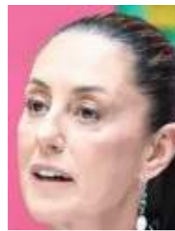
MEXICALI CLAUDIA SHEINBAUM PARDO...