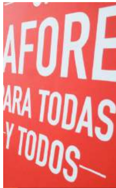
Va la 4T por el Fondo de Pensión Bienestar