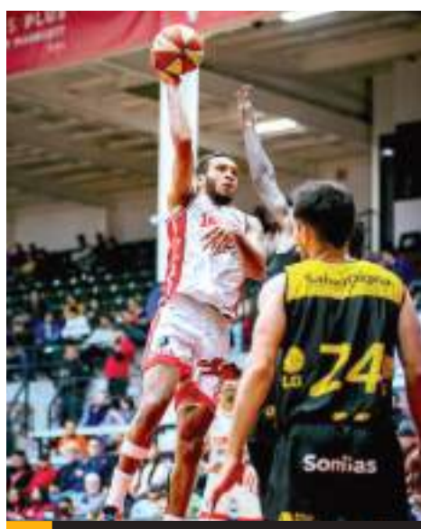
Este miércoles es el segundo de la serie.