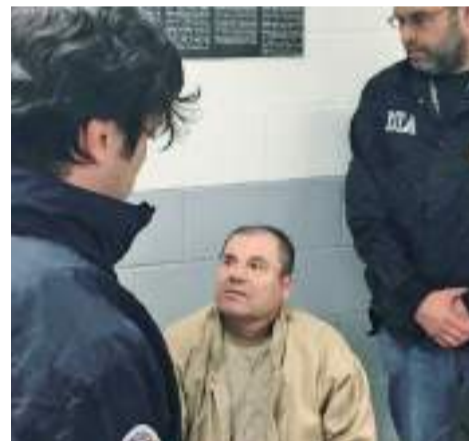
Difunden carta de ‘El Chapo’ rogando visita de Emma Coronel; juez Cogan lo castiga.