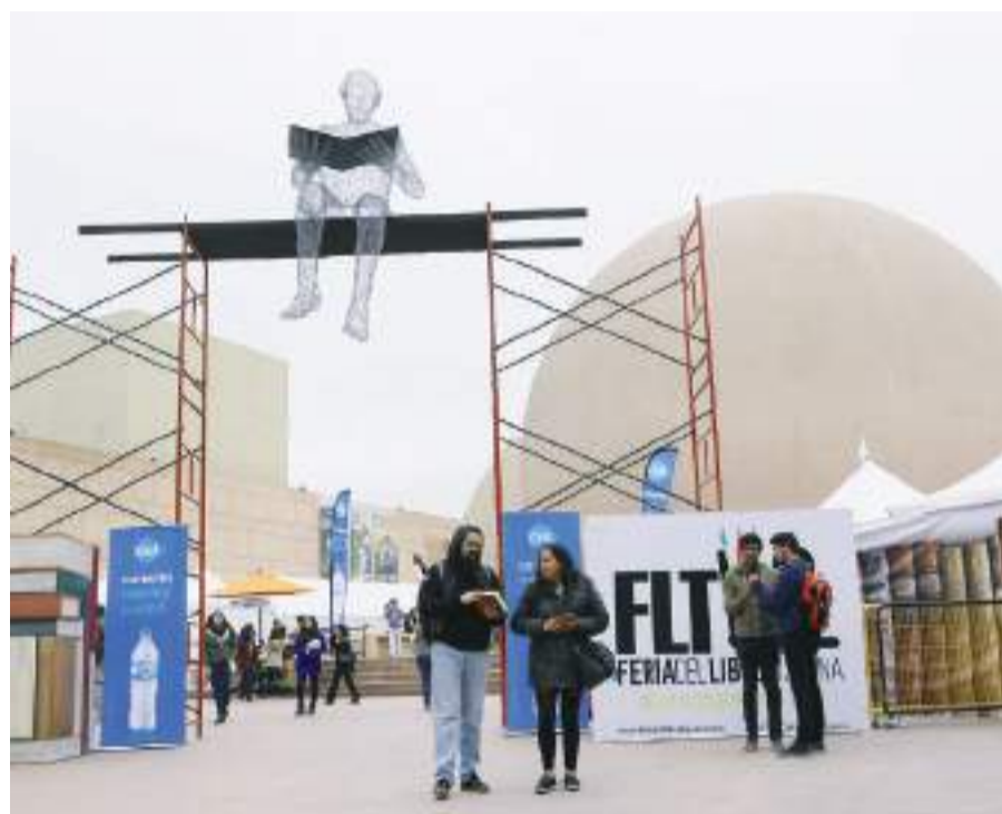
Faltan 32 días para la Feria del Libro de Tijuana en su 39 edición.