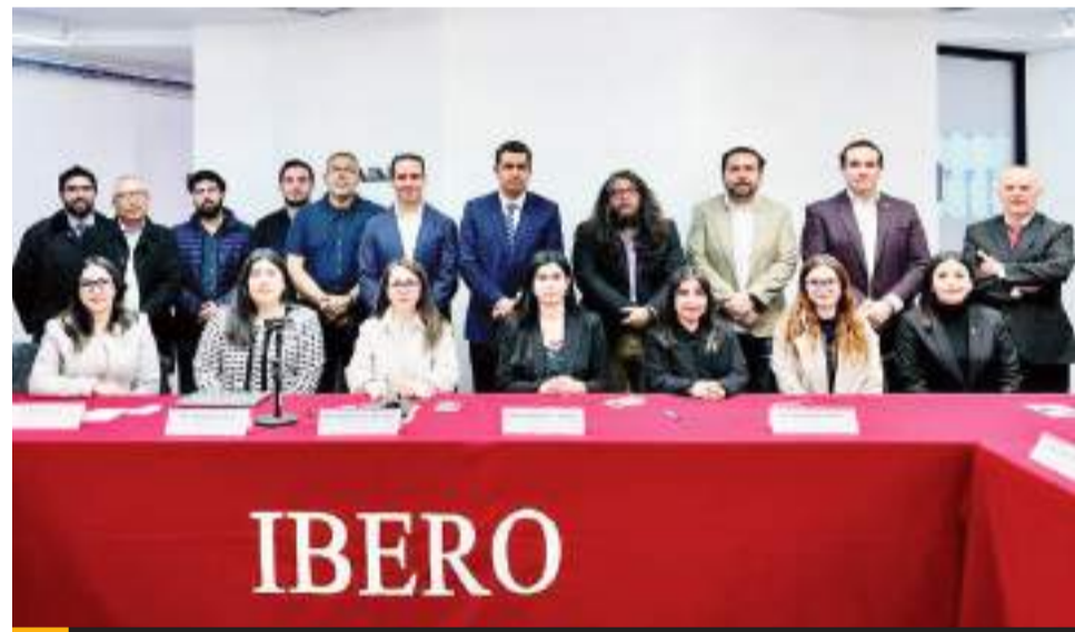
TIJUANA.- Expertos legistas participaron en la Mesa de análisis "El impacto del conflicto México-Ecuador".