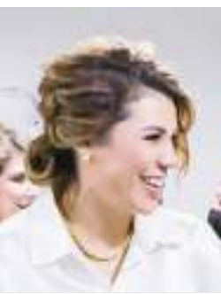
MEXICALI MARINA DEL PILAR AVILA OLMEDA...

Impulsa el bienestar de las comunidades más vulnerables.