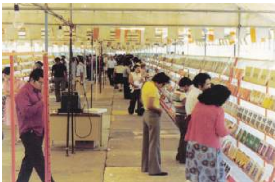
La primera Feria del Libro de Tijuana fue realizada en 1980 en la Calle 8.

Siga las redes sociales de la Secretaría de Cultura en Twitter (@cultura_mx), Facebook (/SecretariaCulturaMX) e Instagram (@culturamx).