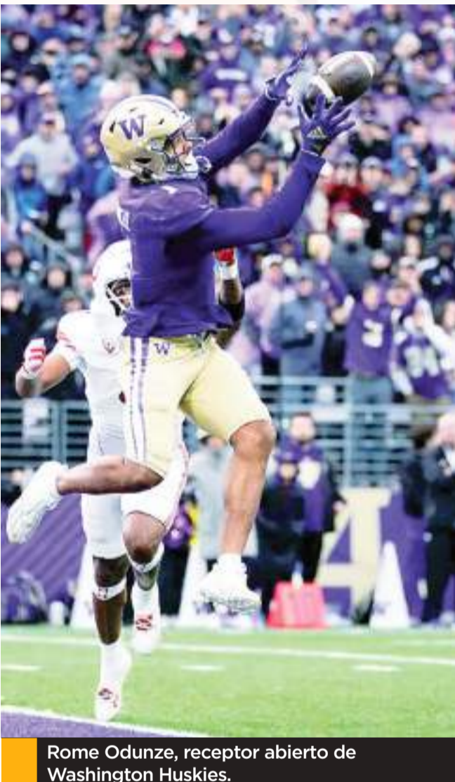
Rome Odunze, receptor abierto de Washington Huskies.