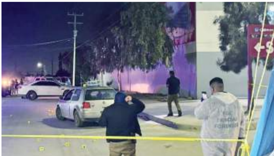
TIJUANA.- Una persona de sexo masculino fue rafageada cuando se encontraba a punto de salir en su minicamioneta de un Calimax en la colonia Granjas Familiares; murió tras recibir cerca de 15 disparos.

chos percutidos, mismos impactos que recibió la víctima a corta distancia, además, dijeron testigos que los atacantes eran dos sujetos de vestimenta gris y que se dieron a la fuga rumbo al fraccionamiento Rivera del Bosque.