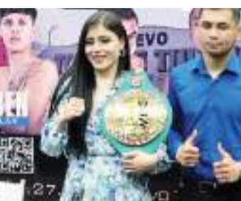
La boxeadora va por su séptima defensa.