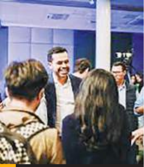
Jorge Álvarez Máynez, dijo sobre sus oponentes que "también bailan, pero hacen el ridículo".

Máynez indicó que ha visitado 18 universidades y hoy fue recibido en la Universidad Anáhuac. La capacidad del auditorio fue de mil 200 personas y éste se llenó, sin embargo al final de la presentación ya lucía vacío.