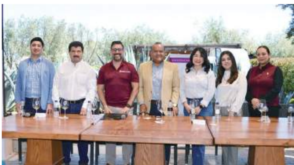
ENSENADA.- El proyecto “Viñadas”, presentado ayer por EDVG ante el Secretario de Turismo del Estado, Miguel Aguiñiga Rodríguez, es considerado un impulso turístico de clase mundial, considera el presidente de este organismo, Marco Estudillo Bernal.

En este esfuerzo, puntualizó, se capitalizarán fortalezas como la acuicultura, pesca, hospedaje, romance, transporte y servicios, así como la comunidad, el capital humano, los pueblos originarios, ejidatarios y otras organizaciones del VDG, y de turismo de Ensenada y Baja California. (bpa).