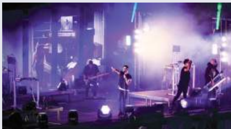
Moenia amenizó en la casa de los Toros durante 35 minutos.

El ambiente festivo prevaleció hasta después de que se cantó el playball en el campo, en el que los “as-tados” buscarán consagrar