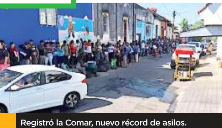
Registró la Comar, nuevo récord de asilos.