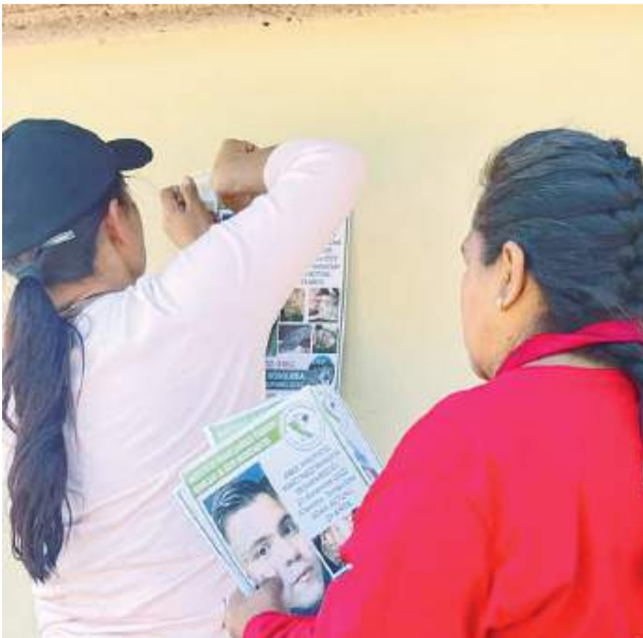
MEXICALI.- Colectivos de Baja California participan en la quinta jornada internacional de búsqueda que tendrá actividad en los 7 municipios del Estado.

Los integrantes del colectivo, pegaron carteles con información de las personas que buscaban.