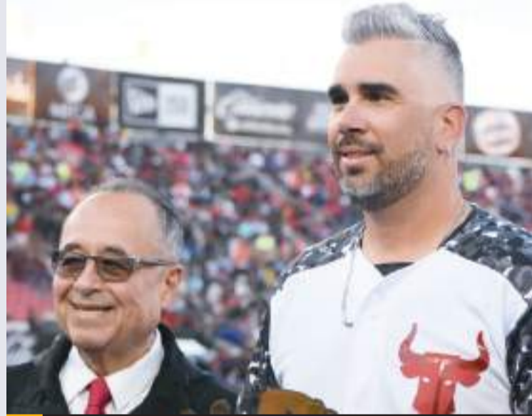
Toros honró la trayectoria del ex ligamayorista Oliver Pérez, quien estuvo a cargo del primer lanzamiento.