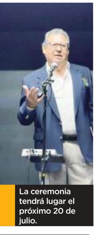
La ceremonia tendrá lugar el próximo 20 de julio.

listo para volver a Texas a comienzos de mayo, y su primera apertura de rehabilitación sería tan pronto como la próxima semana. "No estamos listos para