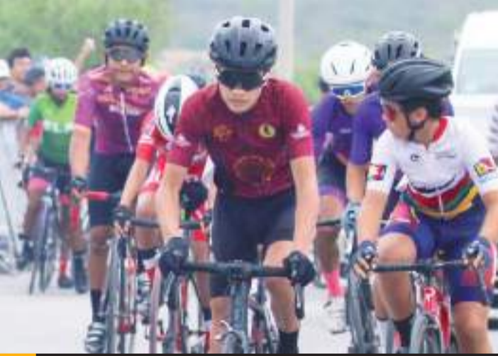
Algunos pedalistas repetirán modalidades.