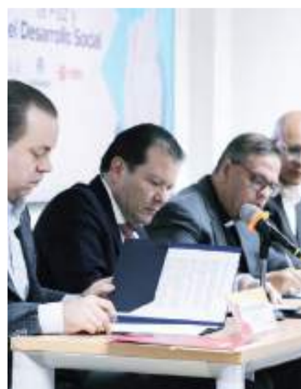
Coparmex Jalisco va en alianza con la Iglesia para promover la asistencia a las urnas.