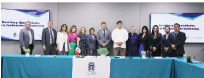
MEXICALI.- El Poder Judicial llevó a cabo la mesa de trabajo "Desafíos y Oportunidades en la Publicación de Sentencias", en la que participaron magistrados, representantes del ITAIPBC e INAI.

MEXICALI.- El Poder Judicial de Baja California (PJBC) se convirtió en la primera institución de todo el país en iniciar una mesa de trabajo con autoridades de primer nivel en materia de Publicación de Sentencias.