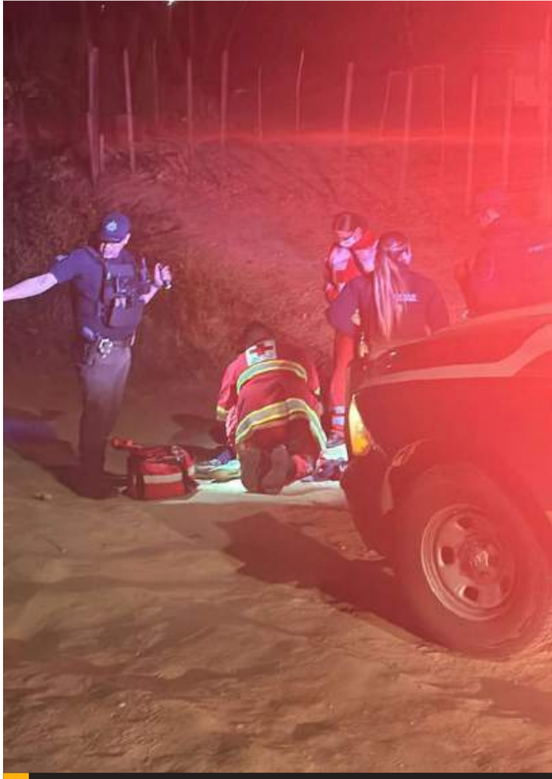
ENSENADA.- Con una herida en la pierna, resultó una mujer que presenció un ataque armado en la delegación de El Sauzal.

Paramédicos atendieron a la mujer, que resultó lesionada en la pierna izquierda a la altura del fémur. Se sabe que el objetivo de los atacantes huyó del lugar ileso, y no se logró localizar a los agresores ni el vehículo en el que viajaban.