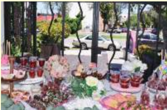
Elegante y surtida fue la mesa de postres.