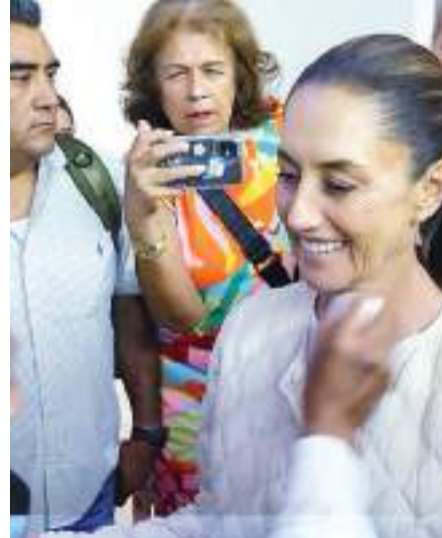
Claudia Sheinbaum negó que militares descuiden la seguridad en el país.

"Entonces, esta idea de que otras labores de la Sedena han evitado que se dediquen a la seguridad, ahí no estoy tan de acuerdo. Y no sustituyen a la Iniciativa Privada", abundó en la sede de la Canaco Mérida.