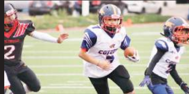
Coyotes tuvo actividad en Mexicali.

Panteras cuenta con la mejor ofensiva de Infantil Menor al acumular 120 puntos en la campaña, para un promedio de 40 unidades por encuentro, y la defensa es la segunda mejor con 50 tantos permitidos.