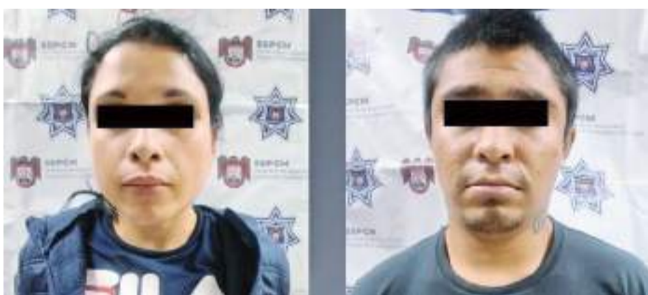
TIJUANA.- Una pareja, masculino y mujer, fueron capturados momentos después de intentar asesinar a un hombre en la vía pública.

Una vez en el sitio, los uniformados se entrevistaron con la víctima, quien manifestó que una mujer lo distrajo platicando cuando de pronto un sujeto llegó y le disparó por la espalda, pero no logró arrebatarle la vida sólo lo hirió. Por lo que tras recabar información de los sospechosos, se implementó un operativo en el área, logrando detener a los presuntos responsables.