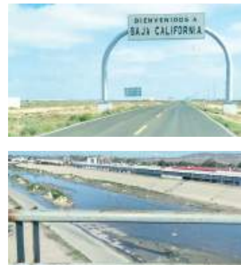
TIJUANA.- Las autoridades correspondientes deben aplicar sanciones más estrictas para mejorar la calidad del medio ambiente de Baja California.

En cuanto a los responsables de este delito, se identificó a una banda delincuencia que opera en esa zona, sin embargo, hasta el momento no se puede dar más información.