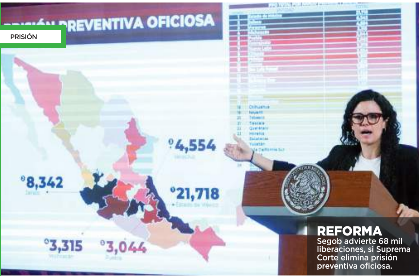
REFORMA Segob advierte 68 mil liberaciones, si Suprema Corte elimina prisión preventiva oficiosa.