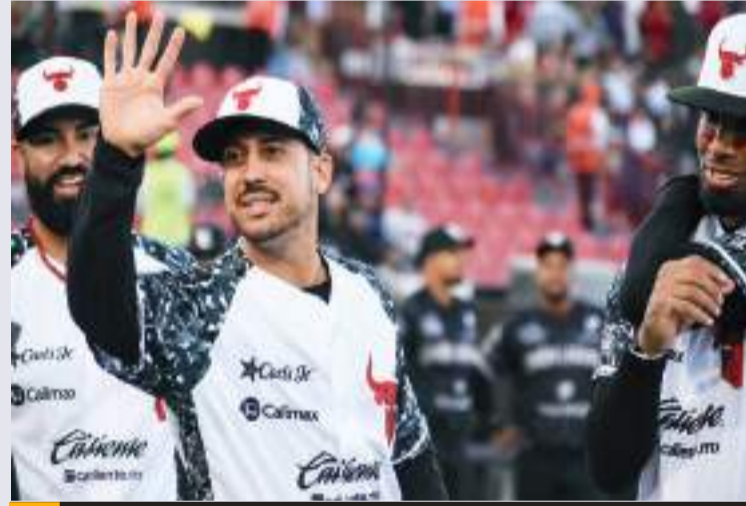
Los bureles afrontaron su primera serie en casa ante los Algodoneros.