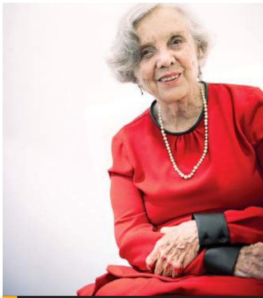
Elena Poniatowska será la escritora homenajead.

dos invitados se integrarán a la programación los siguientes escritores y escritoras: