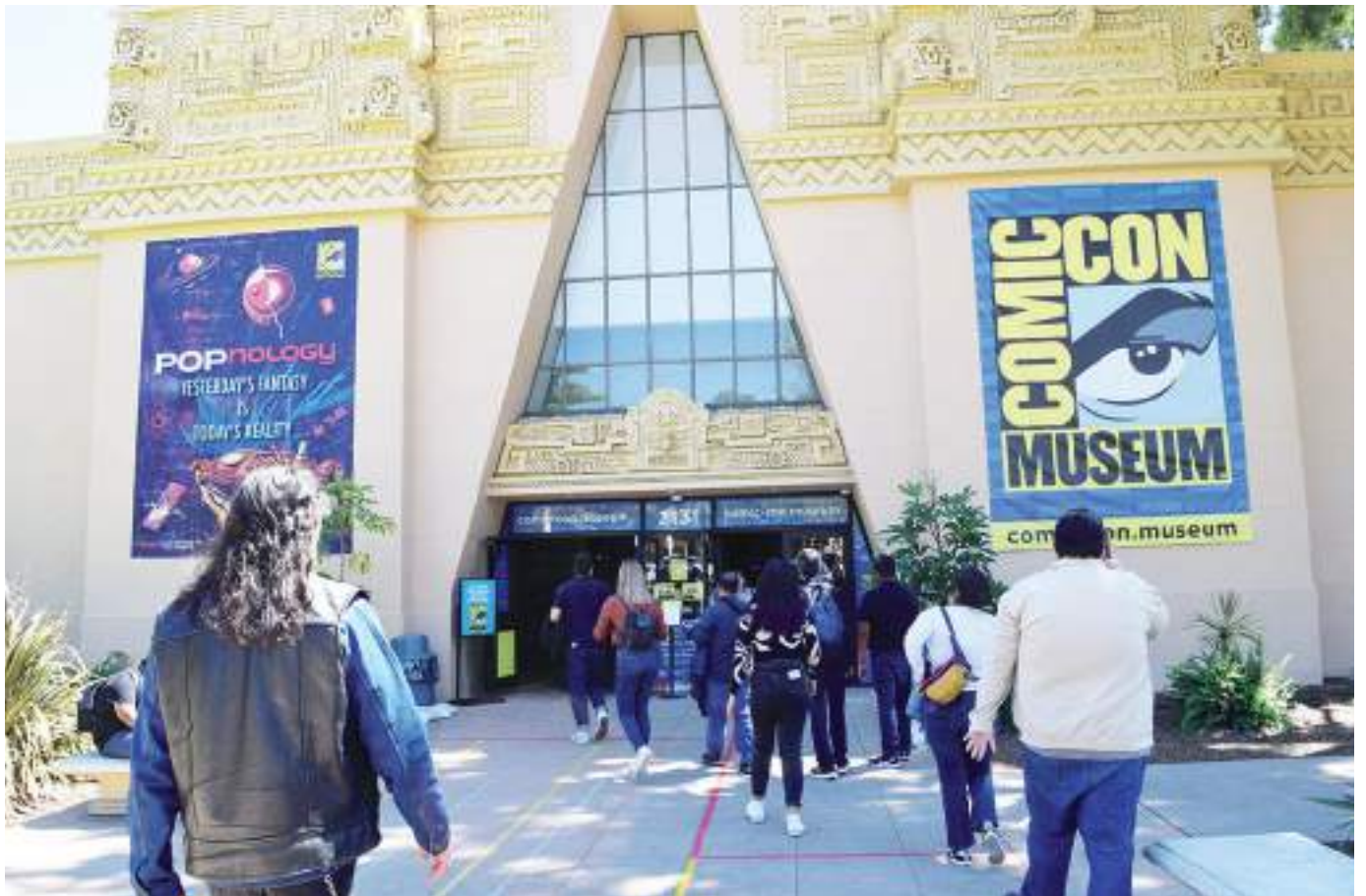
Los empleados de Cecut visitaron el Museo Comic-Con dedicado a crear conciencia y apreciación por los cómics y sus formas de arte relacionadas.

COLABORADORES DEL RECINTO FEDERAL ASISTIERON A UNA VISITA GUIADA CON MIRAS A EXPANDIR LOS VÍNCULOS DE TRABAJO INTERINSTITUCIONAL EN EL ÁMBITO BINACIONAL Y, EN ESE SENTIDO, COMPARTIERON EXPERIENCIAS CON SUS PARES DE LAS INSTITUCIONES CULTURALES DEL VECINO PAÍS DEL NORTE