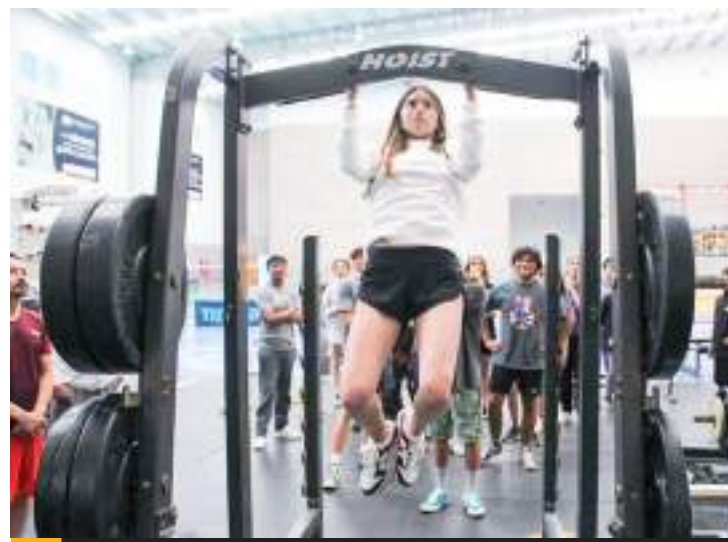
Los surfistas recibieron capacitaciones, conferencias de psicología deportiva y análisis de aptitudes físicas en las instalaciones del CAR Ensenada.

El año pasado hicieron el viaje una docena de sur-