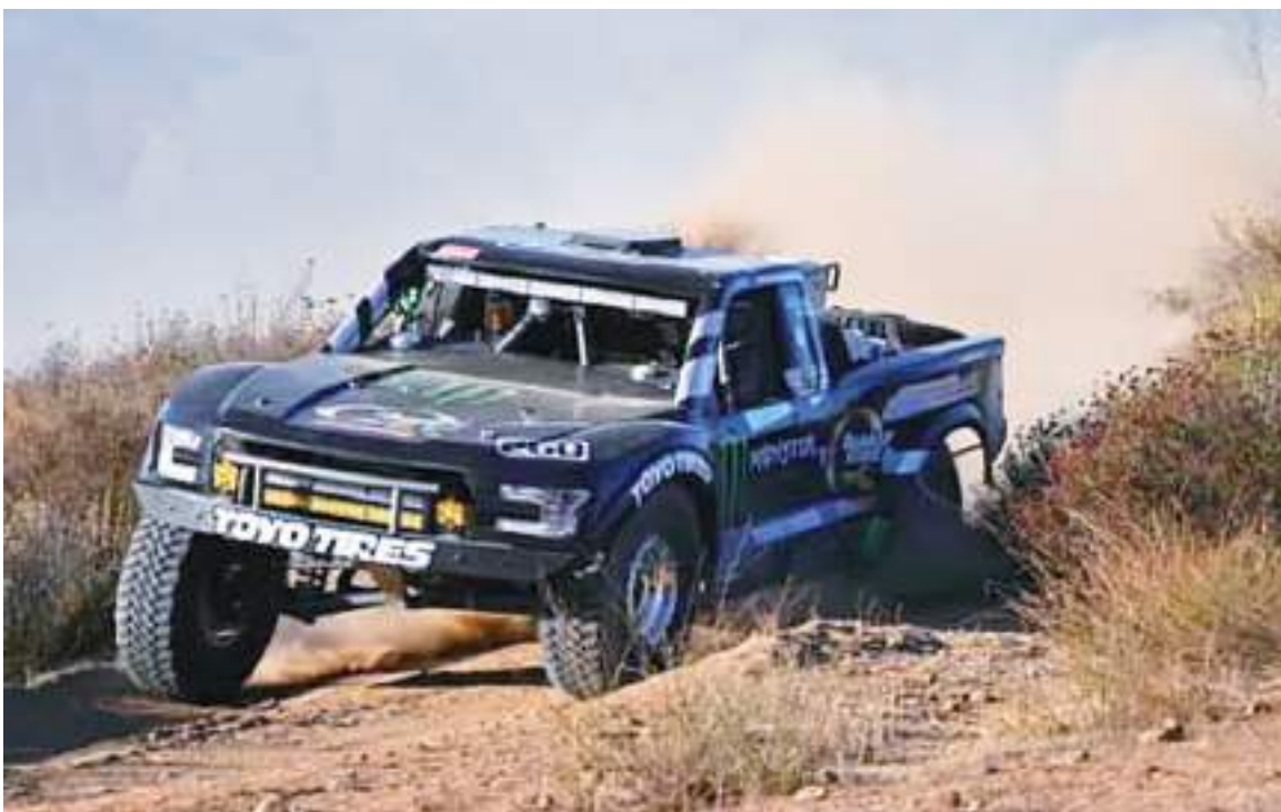
La Score Baja 500" cuenta ya con más de 75 equipos inscritos procedentes hasta hoy de Indonesia, Australia, Canadá, Japón, E.U. y México entre otros.

En Nacionales CONADE 2024, competirán bajacalifornianos en las categorías 12-13-14 años, 15-16 años, 17-18 años, en modalidades de Surfing, Longboard, Bodyboard y Stand Up Paddle.