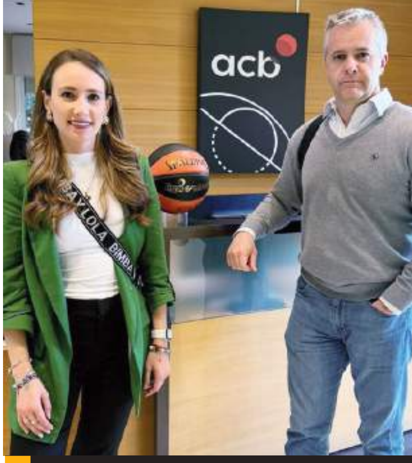
La primera edición de la Minicopa México tendrá lugar del 26 al 28 de enero en la Arena Zonkeys.

Este torneo será con causa, por lo que la afición podrá entrar a los partidos solamente llevando un kilo de alimentos, que será donado a la asociación sin fines