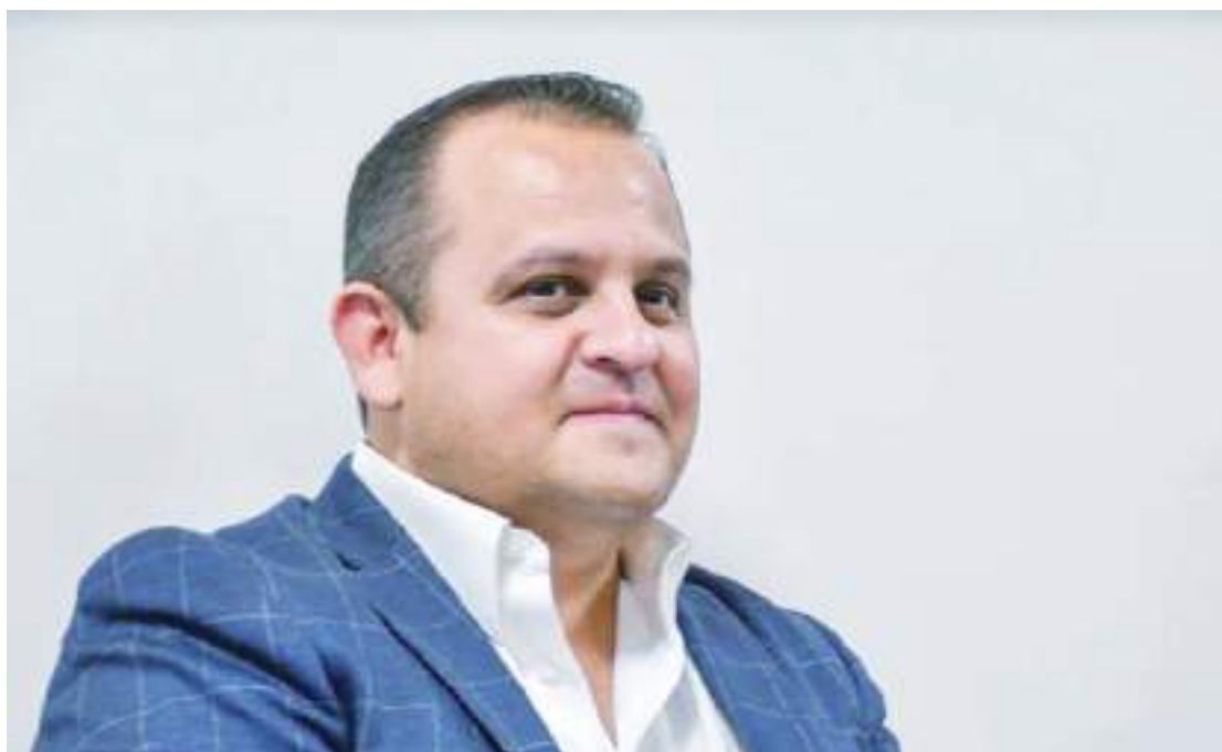
MEXICALI.- En mayo, los habitantes del Valle podrán emitir su opinión para la municipalización de la zona.

Recordó que las condiciones para municipalizar el Valle de Mexicali son distintas a lo que ocurrió con San Quintín y San Felipe, ya que se trata de una zona con más de 177 mil habitantes, se ubica en los límites con el estado de Sonora, y se tienen pláticas avanzadas, entre otras, para el desarrollo de un "clúster médico" en la zona de Los Algodones.