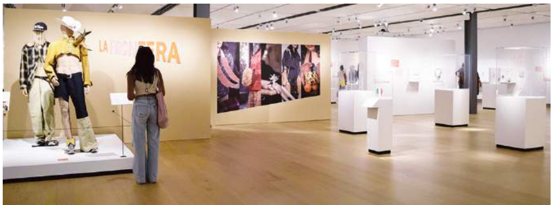
Exposición La Frontera en el Museo Internacional Mingei misma que expone parte de sus obras en El Cubo de Cecut desde febrero de este año.

Las redes sociales del Cecut en Twitter (@cecute_mx), Facebook (/cecute.mx), YouTube (Cecute) e Instagram (@cecute_mx). Las redes sociales de la Secretaría de Cultura en Twitter (@cultura_mx), Facebook (/SecretariaCulturaMX) e Instagram (@culturamx).