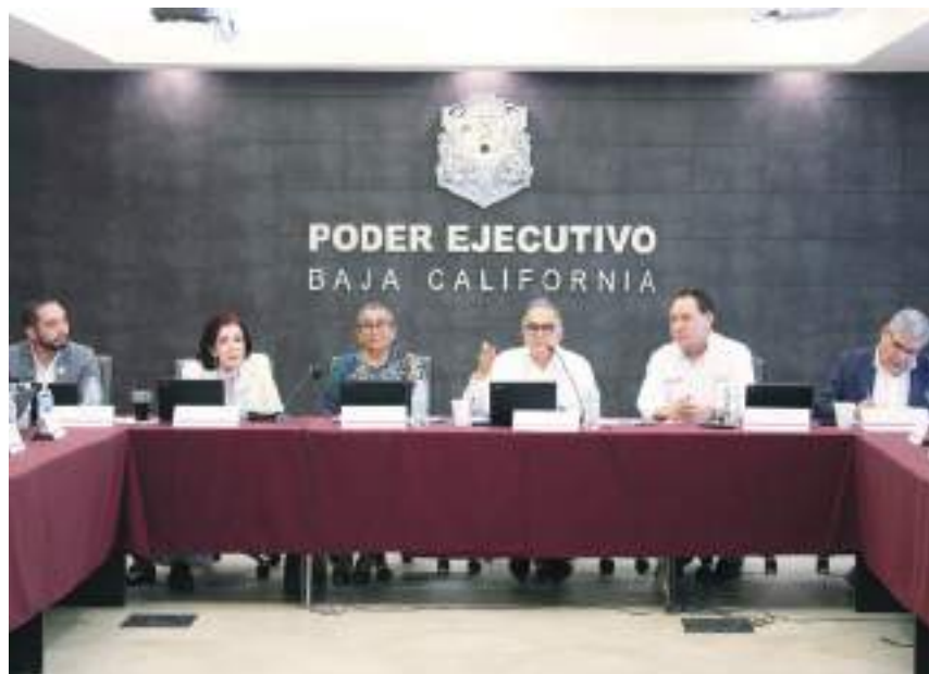
MEXICALI.- El sector educativo está ocupado en evitar problemas que afecten el aprendizaje de los estudiantes del Estado con la instalación de la Mesa por la construcción por la paz.

"Son más de 16 escenarios que tenemos identificados, como acoso escolar, bullying, violencia, baja autoestima, donde se establecerán programas para dar atención a cada uno de los casos, cada vez que