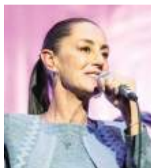
MEXICALI CLAUDIA SHEINBAUM PARDO...

"Ni un paso atrás contra la inseguridad, porque vamos por tiempos mejores para nuestra ciudad", fue una de las frases utilizada por BURGUEÑO RUÍZ ante los grupos especializados del