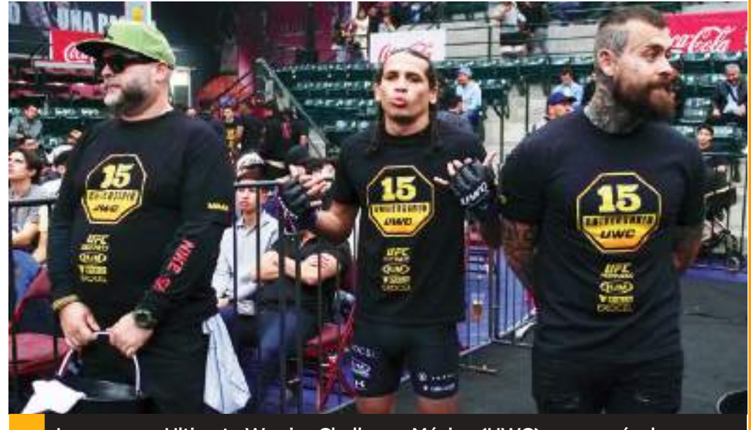
La empresa Ultimate Warrior Challenge México (UWC) regresará a la actividad para el domingo 19 de mayo.

"Eso es una gran ventaja, básicamente continuarán con su entrenamiento, preparación, rutinas en la Ciudad de México, pero siguen libres para pelear en eventos