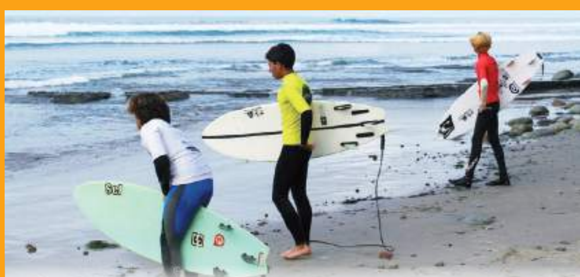
La concentración organizada por la Asociación de Surfing de Baja California fue en coordinación con el INDE BC y tuvo una duración de dos días.