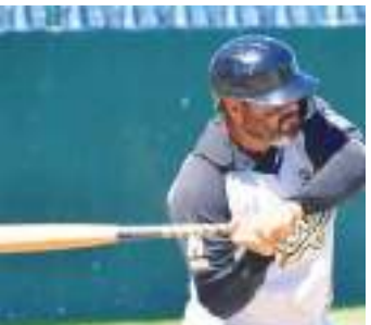
Royals es el primer invitado a la gran final de la Primera Fuerza del campeonato oficial 2023-24 de la Liga Municipal de beisbol de Ensenada.