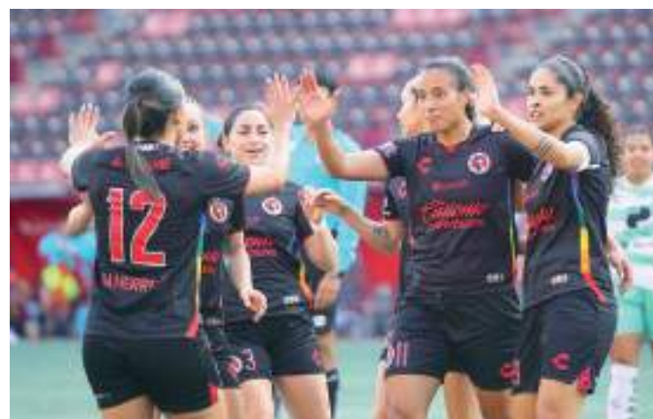
Xolos Femenil se impuso por goleada a su similar de Santos en el estadio Caliente.