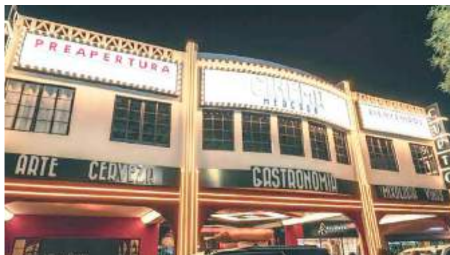
MEXICALI.- El Mercado Cine Curto fue declarado Patrimonio Histórico del Gobierno del Estado, a través de la Secretaría de Cultura y del Instituto de Cultura de Baja California.

Como parte de este proceso, fue constituido el expediente técnico con aspectos de carácter jurídico, descripción arquitectónica del inmueble, la justificación histórica y significado social, entre otros. Posteriormente, este fue turnado a la Comisión de Patrimonio Cultural del municipio de Mexicali, y finalmente al Consejo