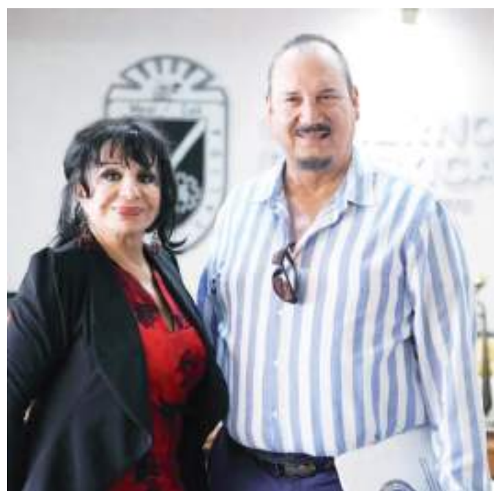
MEXICALI.- Más apoyo para la Dirección de Seguridad Pública con la reactivación de la alianza empresarial.