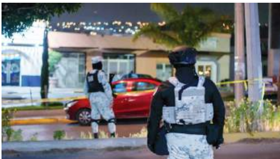
TIJUANA.- Durante la noche del domingo, dos mujeres y un chofer de plataforma digital sufrieron ataques armados.