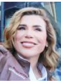
MEXICALI MARINA DEL PILAR ÁVILA OLMEDA...