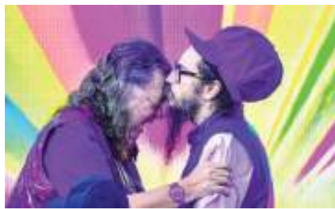
TIJUANA JORGE HANK RHON...