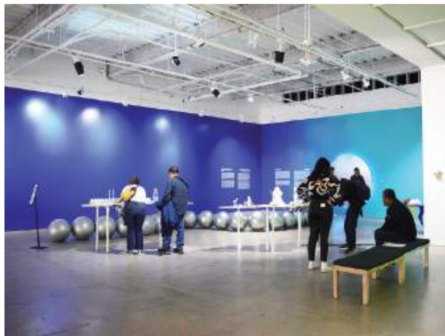
En el Instituto de Arte Contemporáneo de San Diego el grupo pudo transitar la muestra Pinar Yoldas: Synaptic Sculpture.

En el Museo Internacional Mingei recorrieron la exposición La Frontera, una exhibición de joyería contemporánea que aborda las identidades duales de la residencia en la frontera entre México y Estados Unidos, misma que expone parte de sus obras en El Cubo de Cecut desde febrero de este año, una muestra que forma parte de la agenda oficial del World Design Capital San Diego-Tijuana 2024.