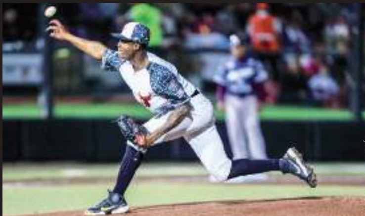
Toros de Tijuana va por más éxitos en su historia cuando visiten a Charros de Jalisco en serie de tres juegos.

Este martes el rival en turno es la novena que dirige el tijuanaense Benjamín Gil con unos Charros de Jalisco que ha iniciado lento con sólo tres triunfos y seis derrotas en el fondo del pelotón norteño.