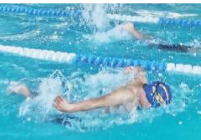
Reinscripciones, hoy miércoles; por primera vez, jueves y viernes.

Los requisitos para inscribirse son presentar un certificado médico, dos fotografías tamaño infantil, cubrir la cuota de registro y el costo del curso, que varía según la cantidad de clases que se tomen al mes, ya que hay bloques diseñados para que los alumnos vayan lunes, miércoles y viernes o los martes y jueves.