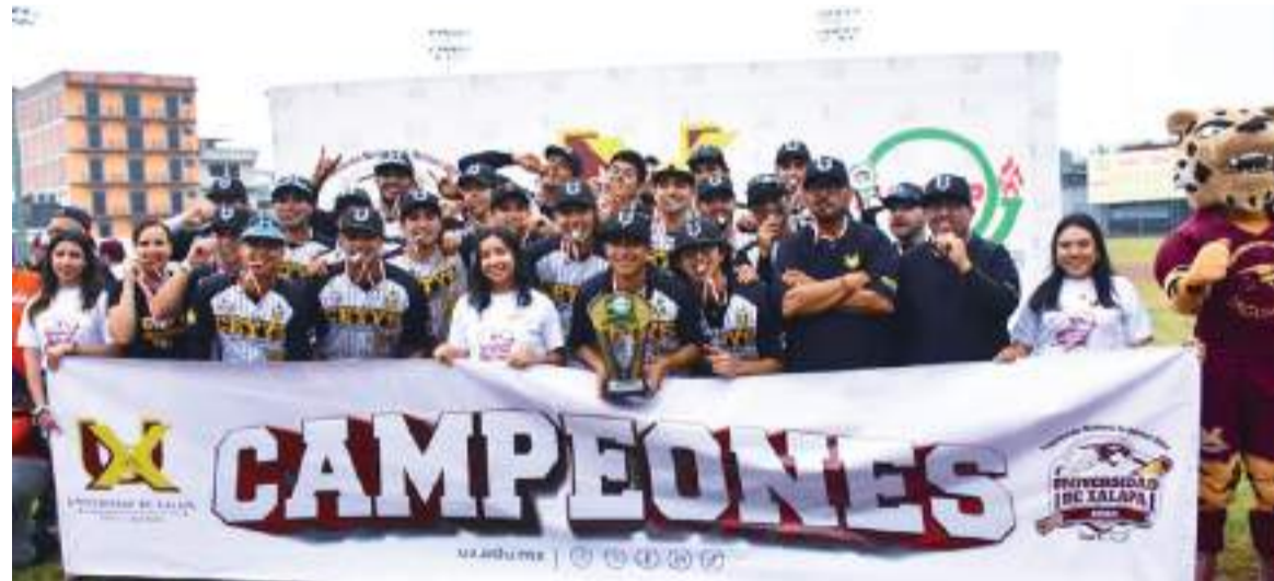
Es el tercer título nacional de Primera Fuerza para el equipo.

Bañuelos y Compañía disputará el campeonato con el ganador de la otra semifinal que sostienen Twins y Dodgers.