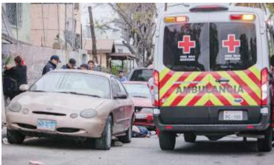
TIJUANA.- Con este último crimen, donde un menor fue ejecutado a balazos, acumuló 601 homicidios en lo que va del año en curso en esta ciudad.