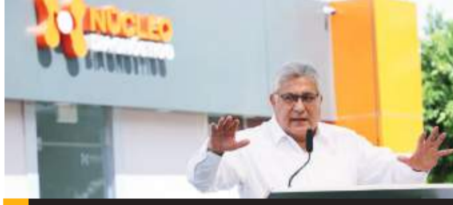
MEXICALI.- Se inauguró el primer Centro de Diagnóstico Integral que, con tecnología de punta, brindará servicios de salud a los agremiados del SNTE y sus familias. La apertura de este Centro estuvo a cargo del secretario general del SNTE, Alfonso Cepeda Salas.

continuar los esfuerzos coordinados en beneficio de los niños y jóvenes bajacalifornianos.