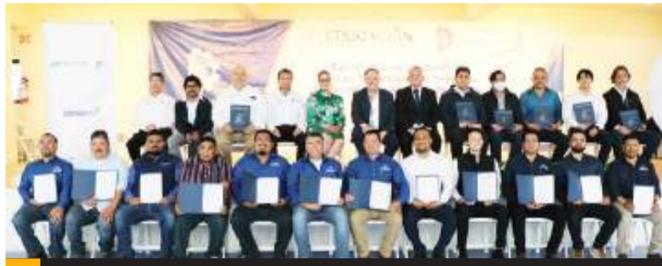
ENSENADA.- Es un proyecto educativo de largo alcance para la formación de talento especializado en corrosión, área indispensable en una región marítima e industrial y de alta demanda en el mercado.