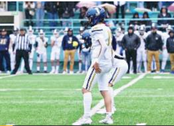
El liderato estará en juego este sábado 27 de abril.