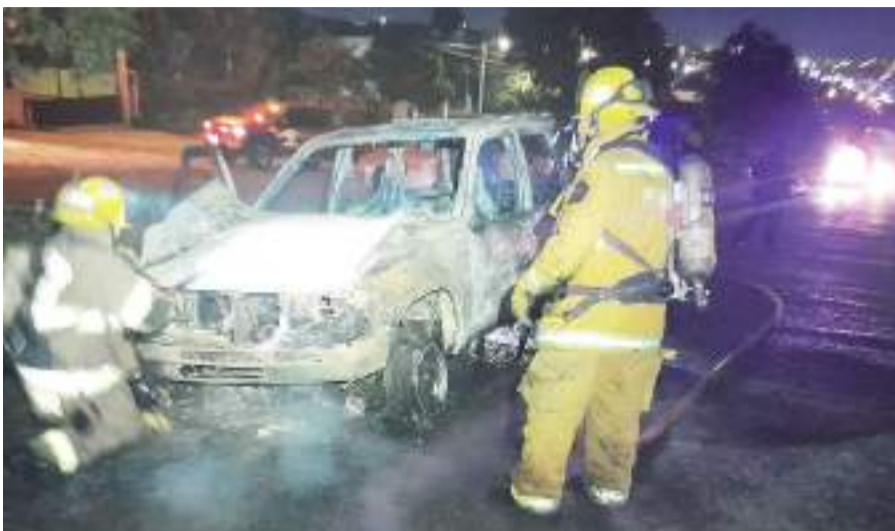
PLAYAS DE ROSARITO.- Se incrementa el número de autos afectados por incendio en el Quinto Municipio.

P LAYAS DE ROSARITO.- Un promedio de una decena de vehículos se incendian al mes por causas diversas, y aunque afortunadamente no se registran afectaciones de la integridad de los propietarios, la Secretaría de Seguridad Ciudadana recomienda revisar periódicamente las condiciones mecánicas de las unidades. No hay evidencia aparente de vandalismo u otra intención de terceros de ocasionar los siniestros, pero sin duda y a pesar del