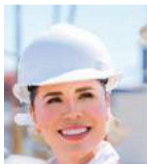
MEXICALI MARINA DEL PILAR ÁVILA OLMEDA...

putados federales, diputados locales, alcaldías, sindicatos y regidurías han cuestionado la falta de lonas, artículos utilitarios y propaganda impresa con las propuestas de XÓCHITL GÁLVEZ para ser entregada entre la población.