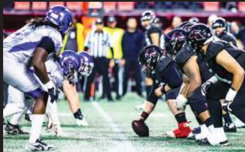
El triunfo permitió a Tijuana ascender en la tabla de posiciones.