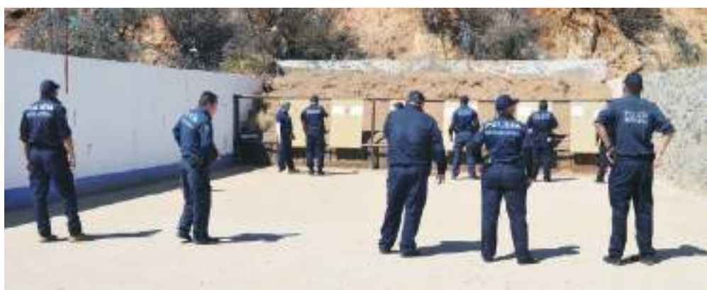
MEXICALI.- El gobierno municipal está listo para construir el campo de tiro para la autorización de la academia de policía.