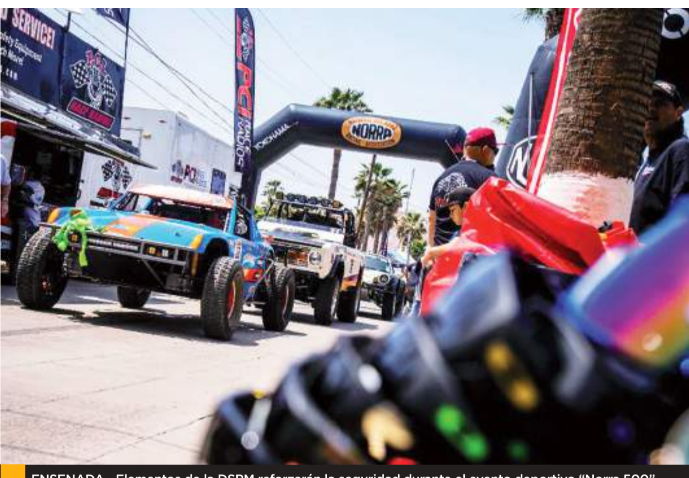
ENSENADA.- Elementos de la DSPM reforzarán la seguridad durante el evento deportivo "Norra 500".

Por lo anterior, se hace un exhorto a la población en general y a los espectadores a respetar en todo momento los señalamientos e indicaciones que emita el personal policiaco y eviten situaciones que pongan en riesgo la integridad propia y de terceras personas, así como utilizar rutas alternas y salir con tiempo hacia sus destinos, pues la finalidad es lograr que dicha actividad culmine sin sucesos que lamentar.