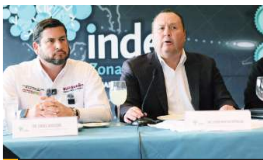
TIJUANA.- El candidato a la alcaldía de Tijuana por la coalición “Sigamos Haciendo Historia por Baja California”, Ismael Burgueño Ruiz, acudió como invitado al Ciclo Diálogos Index.

clave la coordinación con el gobierno del estado y la Federación.