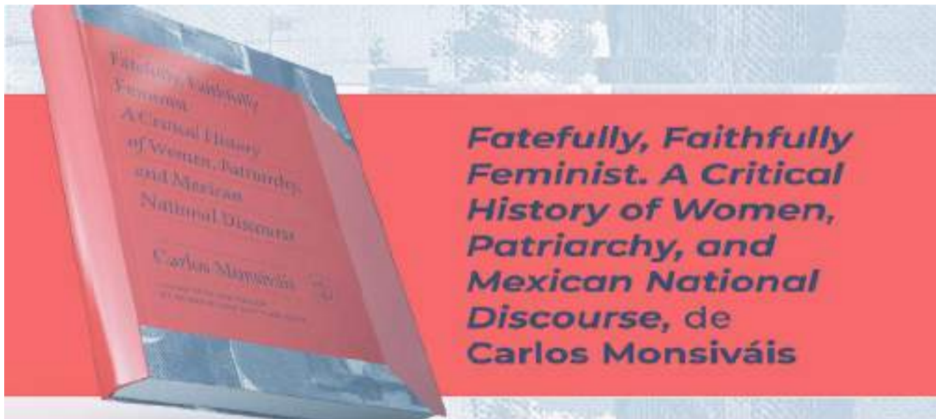
Fatal y fielmente feminista. Historia crítica de las mujeres, el patriarcado y el discurso nacional mexicano, sería una de las formas de traducir el título de este libro editado por Norma Klahn e Ilana Luna.

Las redes sociales del Cecut en Twitter (@cecut_mx), Facebook (/cecut.mx), YouTube (Cecut) e Instagram (@cecut_mx).