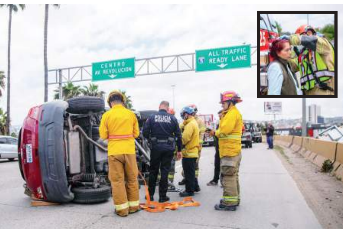
TIJUANA.- Una mujer sexagenaria perdió el control de su vehículo quedando volcado sobre el puente México; resultó con solo algunos raspones.

La Fiscalía no escatimará esfuerzos para llevar a cabo investigaciones exhaustivas con el objetivo de conducir a proceso penal a aquellos que cometan este tipo de ilícitos.