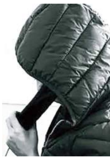
pueden robar tus datos personales, o bien, llamadas provenientes de

Se han suscitado casos en los que se envían mensajes de texto o correos electrónicos con enlaces que