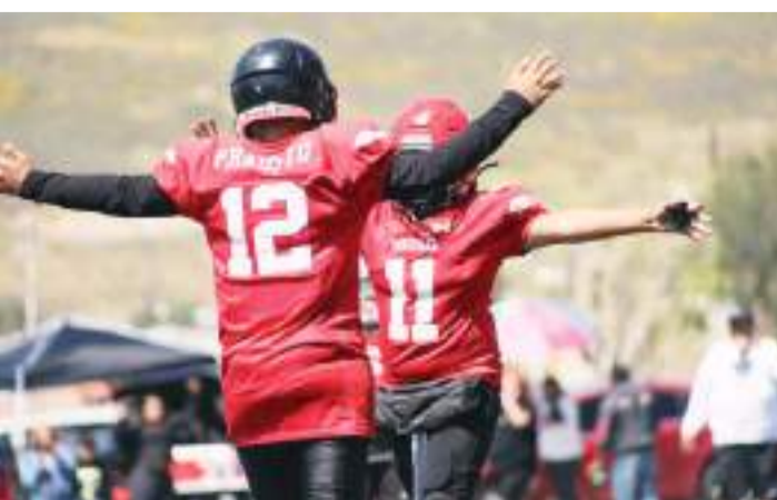
El duelo entre el primero y segundo lugar resultó una batalla grande.

Por su parte Coyotes, se quedan en el sótano de la división al llevar cuatro partidos sin encontrar victoria, y ya sin posibilidad de ir a la final, pueden arruinar fiestas en las próximas jornadas.