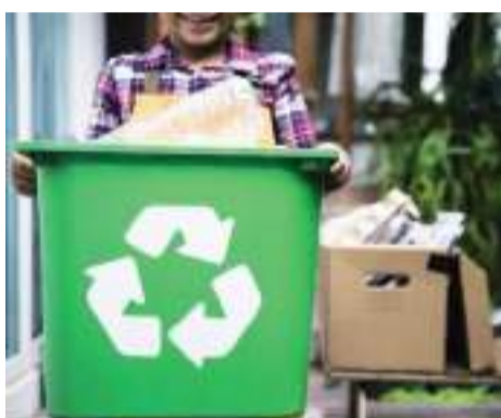
TIJUANA.- Los pequeños detalles hacen una gran diferencia, de manera que pensar en cuidar el planeta no tiene que ser algo costoso ni difícil, pues se puede iniciar con replicar acciones entre los residentes de la comunidad.