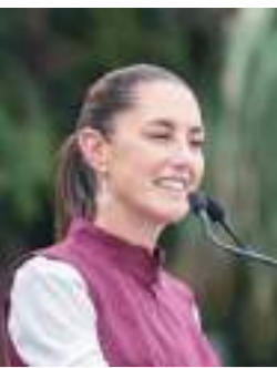
MEXICALI CLAUDIA SHEINBAUM PARDO...

Ofrece regresar los trenes de pasajeros al país.