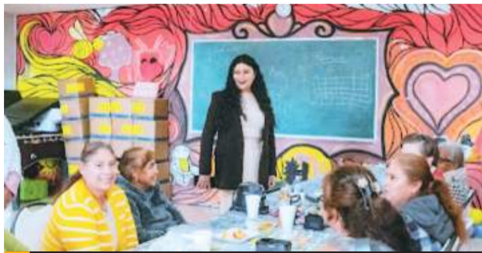
PLAYAS DE ROSARITO.- Proyecta Gobierno Municipal elaborar un plan de acción a corto plazo.

todo en materia de nuevas disposiciones, impuestos y modificaciones dentro de las plataformas gubernamentales o aplicaciones digitales, así como todo aquello que les permita brindar un mejor servicio.