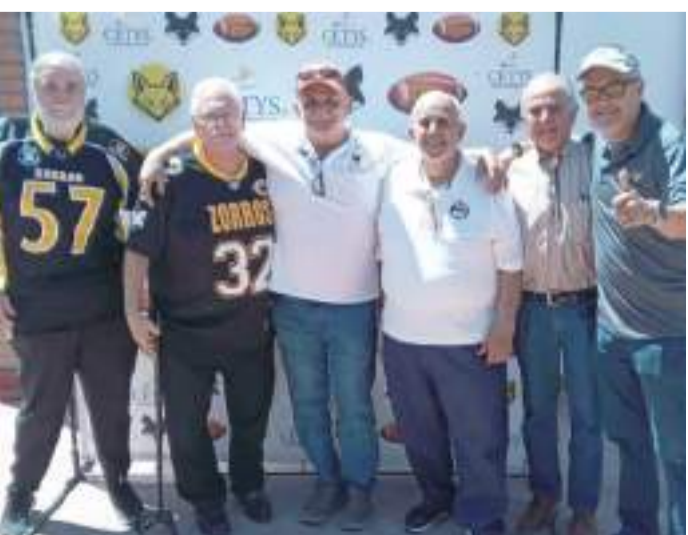
El objetivo del evento es mantener viva la historia de Zorros del Cetys.

El Tercer Reencuentro de exjugadores, jugadores y coaches de FBA Zorros Cetys Universidad fue un evento memorable que fortaleció los lazos de amistad y camaradería entre la comunidad de egresados deportistas. Se espera que este tipo de encuentros continúen en el futuro, manteniendo viva la tradición y el espíritu de los Zorros.