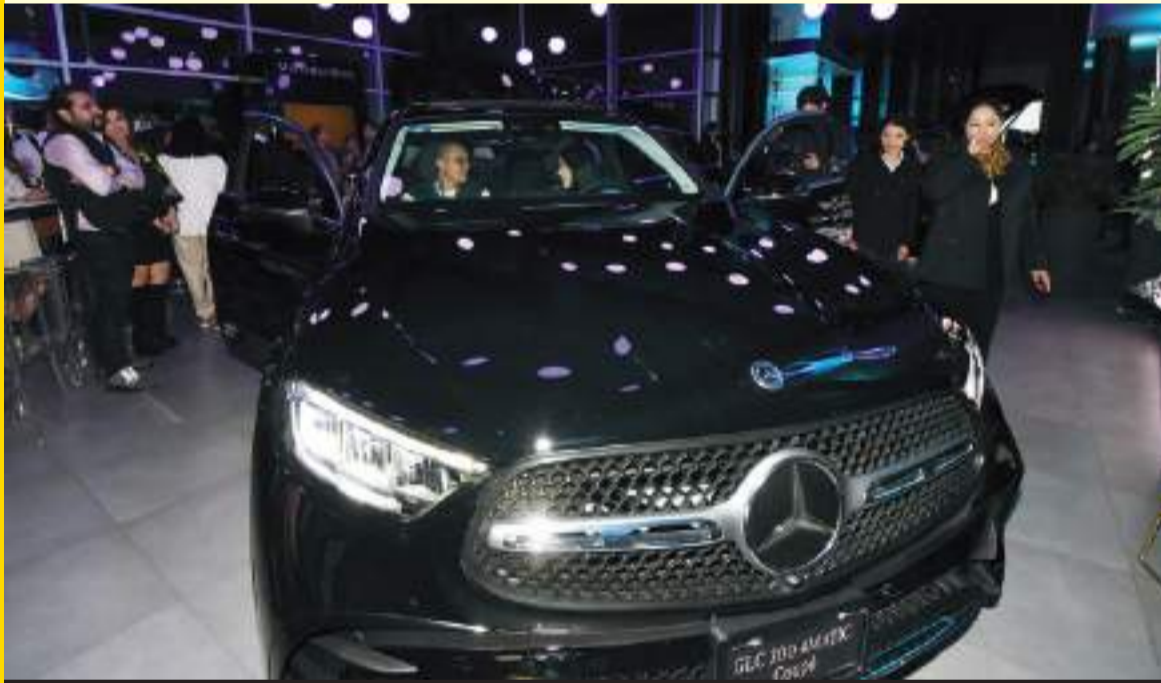
La estrella de la noche, el Mercedes-Benz GLC 300 4MATIC Coupé.

CON GRAN ASISTENCIA FUE EL COCKTEL DE PRESENTACIÓN DEL MODELO MERCEDES-BENZ CLASE GLC COUPÉ EN LAS INSTALACIONES DE SU DISTRIBUIDOR DE ESTA CIUDAD