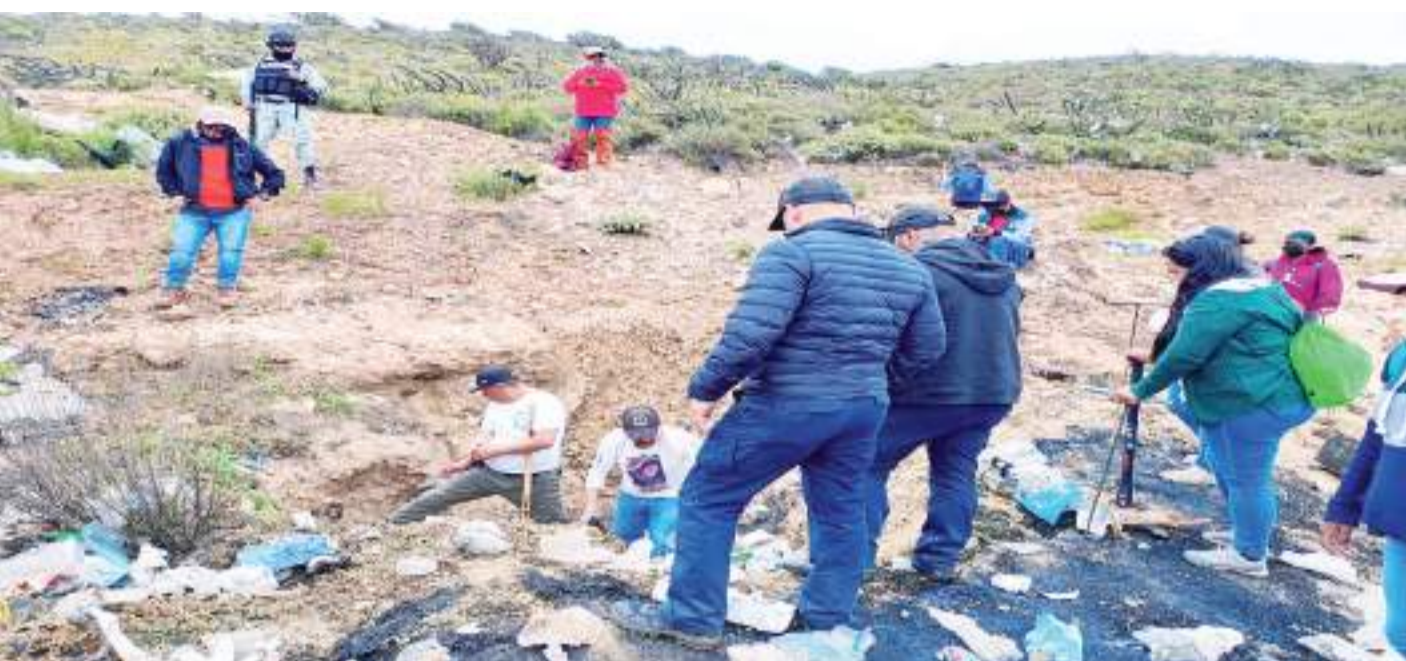
SAN QUINTÍN.- Intensa labor de búsqueda de personas desaparecidas realizaron autoridades, de manera coordinada con colectivos, en las colonias de la jurisdicción municipal San Quintín.