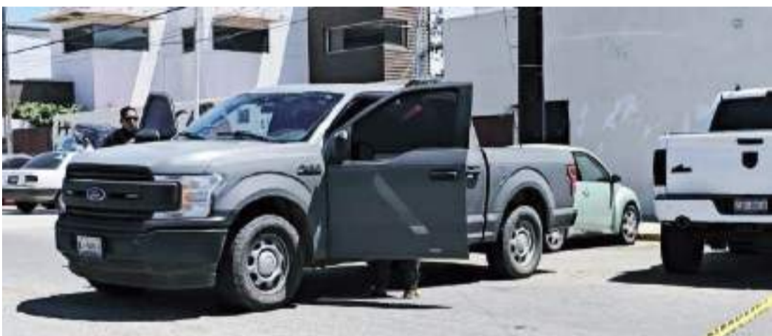
ENSENADA.- Por diversos delitos que se mantienen bajo cierto sigilo, dos policías municipales fueron detenidos por elementos de la Fiscalía General del Estado y el Alcalde Carlos Ibarra dijo ser respetuoso de la investigación que se lleva a cabo.

“Lamento esta detención, pero confío en la labor que realiza la Fiscalía General del Estado. Reitero mi disposición de que se apoyará en lo que se requiera, y refrendo mi reconocimiento al personal policial que diariamente, con valor, disciplina, honestidad y lealtad vela por el bienestar de las y los ensenadenses”, concluyó el primer edil.