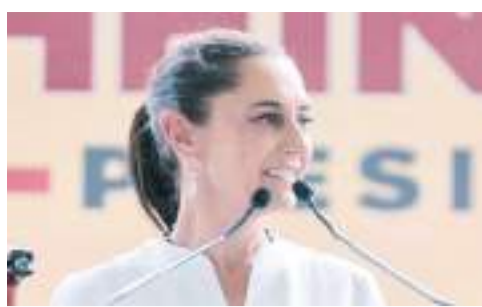
MEXICALI CLAUDIA SHEINBAUM PARDO...

Ha brindado un apoyo sin precedente a la pesca.