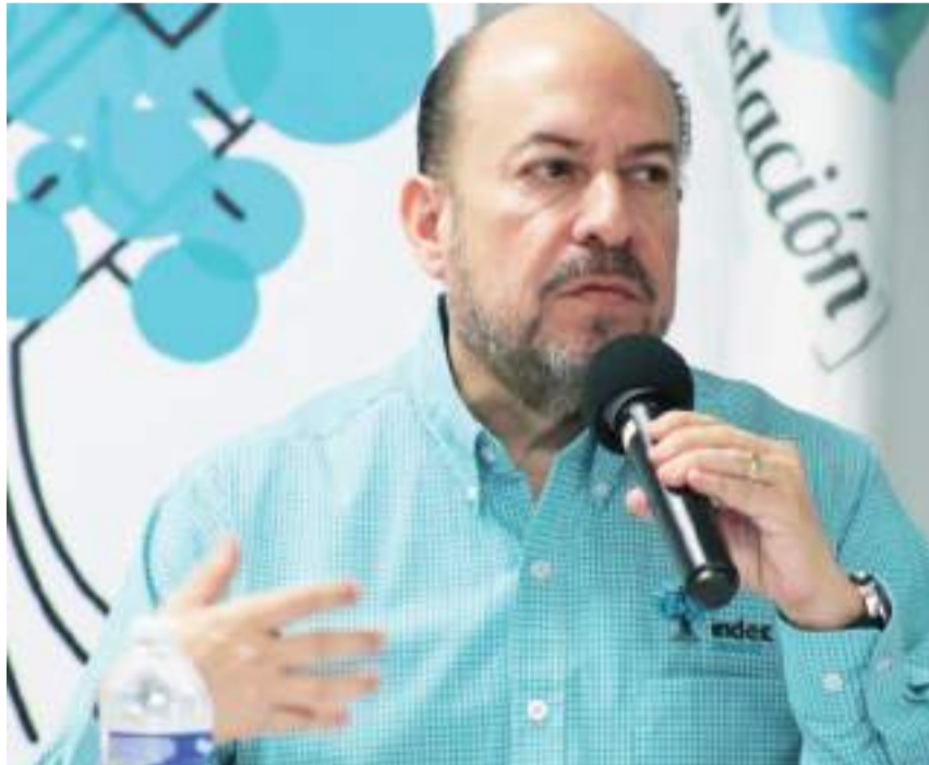
MEXICALI.- El aumento de aranceles a diversos productos trae inquietos a los integrantes del ramo maquilador.

“Esos son porcentajes altos que dejan fuera de competencia mundial, no se pueden hacer este tipo de anuncios de manera abrupta sin antes informarnos acerca de los efectos que tendrá, se debe trabajar en equipo en el gobierno,