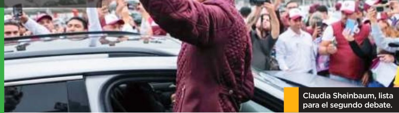
Claudia Sheinbaum, lista para el segundo debate.

Sheinbaum reiteró que el modelo económico de este Gobierno es tan exitoso que el mundo entero lo está viendo.