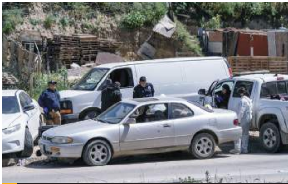
TIJUANA.- Peritos de Servicios Periciales trabajaron en la escena para intentar identificar a la víctima, quien fue ingresada al Semefo en calidad de desconocida, edad y sexo a determinar.

El hallazgo ocurrió justo a la orilla del libramiento Rosas Magallón a la altura del puente "La Villa", con dirección al Soler, en donde un cadáver de una persona, sin identificar, sexo y edad a determinar, fue localizado abandonado junto con un vehículo color gris y placas de circulación del estado de California, marca Toyota Camry.