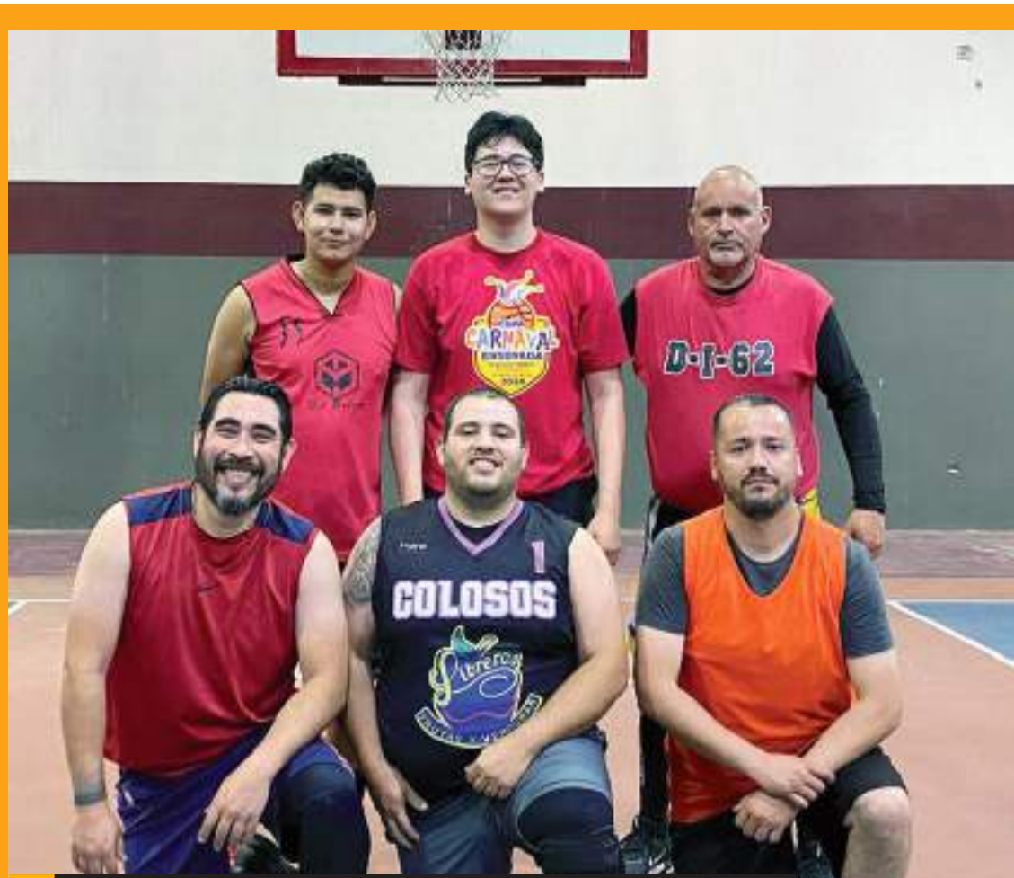
Los Old Capitans vencieron 60-39 al Macchina en Segunda Fuerza.