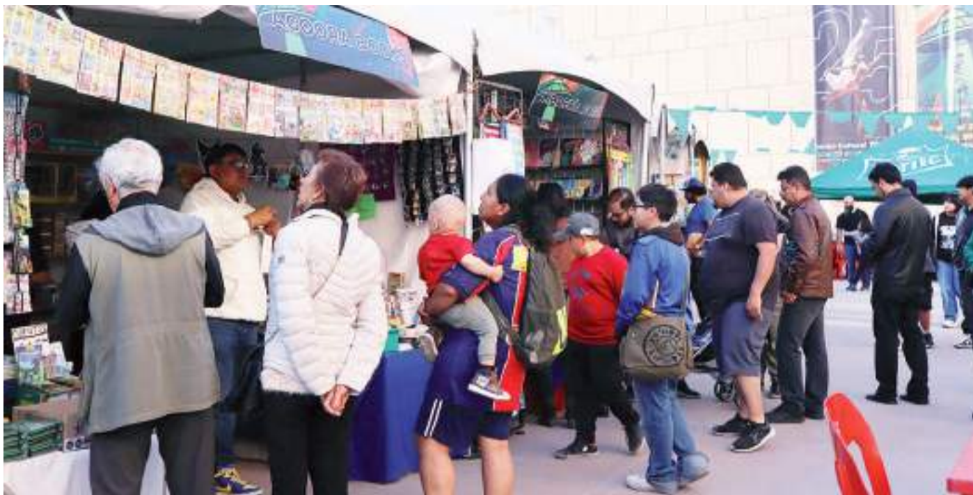
Stands de venta de libros, productos de la cultura pop y oferta de alimentos complementaron Ding.