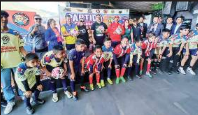
El partido se jugará en un ambiente completamente familiar.

Las puertas del inmueble frente al cerro Colorado abrirán a partir de las 17:00 horas para el evento deportivo familiar, que con el acceso VIP tendrán derecho a la convivencia con los ex futbolistas de ambos equipos para fotografías y firma de autógrafos.