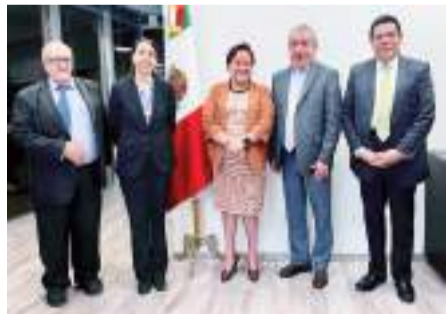
TIJUANA.- Los programas de autorregulación requieren tiempo para madurar para que los consumidores, incluso las áreas de compras del gobierno, prefieran adquirir productos o servicios a empresas con etiquetas ambientales.

Álvarez, es que el distintivo ambiental sea reconocido en los gobiernos estatal y municipal a lo largo y ancho del país, y detalló que la Concanaco Servytur representa a 257 cámaras en más de mil 800 municipios de México, lo que la convierte en una importante plataforma para el desarrollo de la sustentabilidad en los negocios.