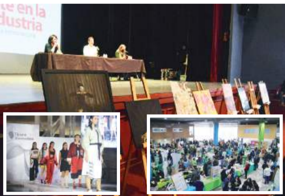
TIJUANA.- En Tijuana Innovadora 2024 también se efectuará el Paseo de la Fama en el cual galardonará a aquellos tijuanaenses que han destacado en el plano internacional.

Mencionó que este partido se lo ha dado todo y en su caso, aunque no le den un cargo apoyará a la doctora. “Mi futuro político sigue porque sigo en el partido, aunque a muchos no les guste, he logrado ser un referente del partido”, finalizó.