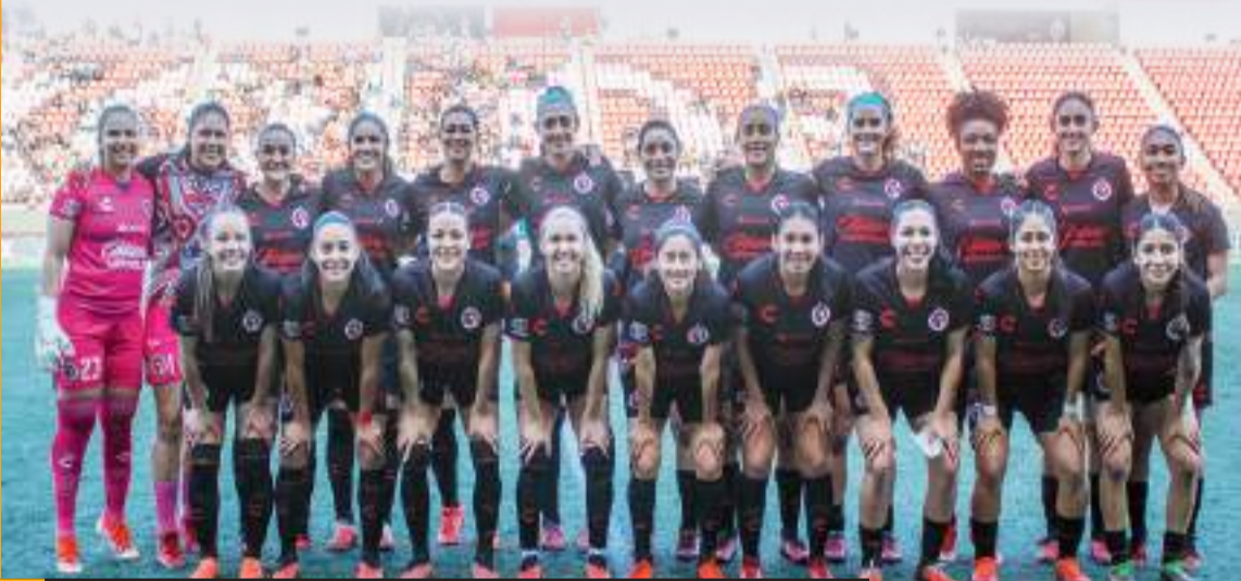
El duelo será celebrado a las 20:10 horas en el Caliente.

En el cierre del torneo, a Tijuana le restan enfrentamientos ante Toluca, que también se encuentra en la búsqueda de un sitio en la "fiesta grande", y contra León, que es sexto en la tabla general y también tiene como objetivo mantenerse dentro de los mejores clubes del campeonato.