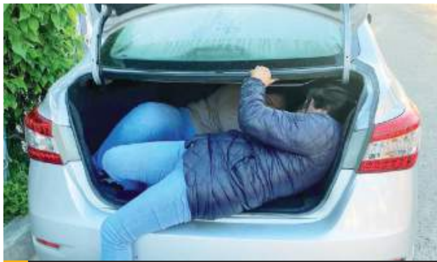
TIJUANA.- Ya son 4 casos de "Mula Ciega" detectados en lo que va del mes de abril, en Tijuana.

de ser localizados al cruzar la línea internacional, pueden ser encarcelados y perder de manera permanente, la posibilidad de obtener asilo en Estados Unidos", señaló el funcionario municipal.