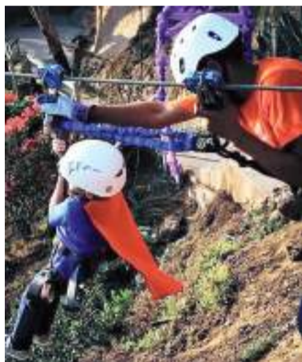
PLAYAS DE ROSARITO.- El parque brinda una experiencia única a los niños con discapacidad.

Además, este parque de altura era uno de los destinos predilectos del programa “Corazones Viajeros” del Gobierno del Estado, ya que recolectaban a las familias de las colonias y los trasladaban a este punto.