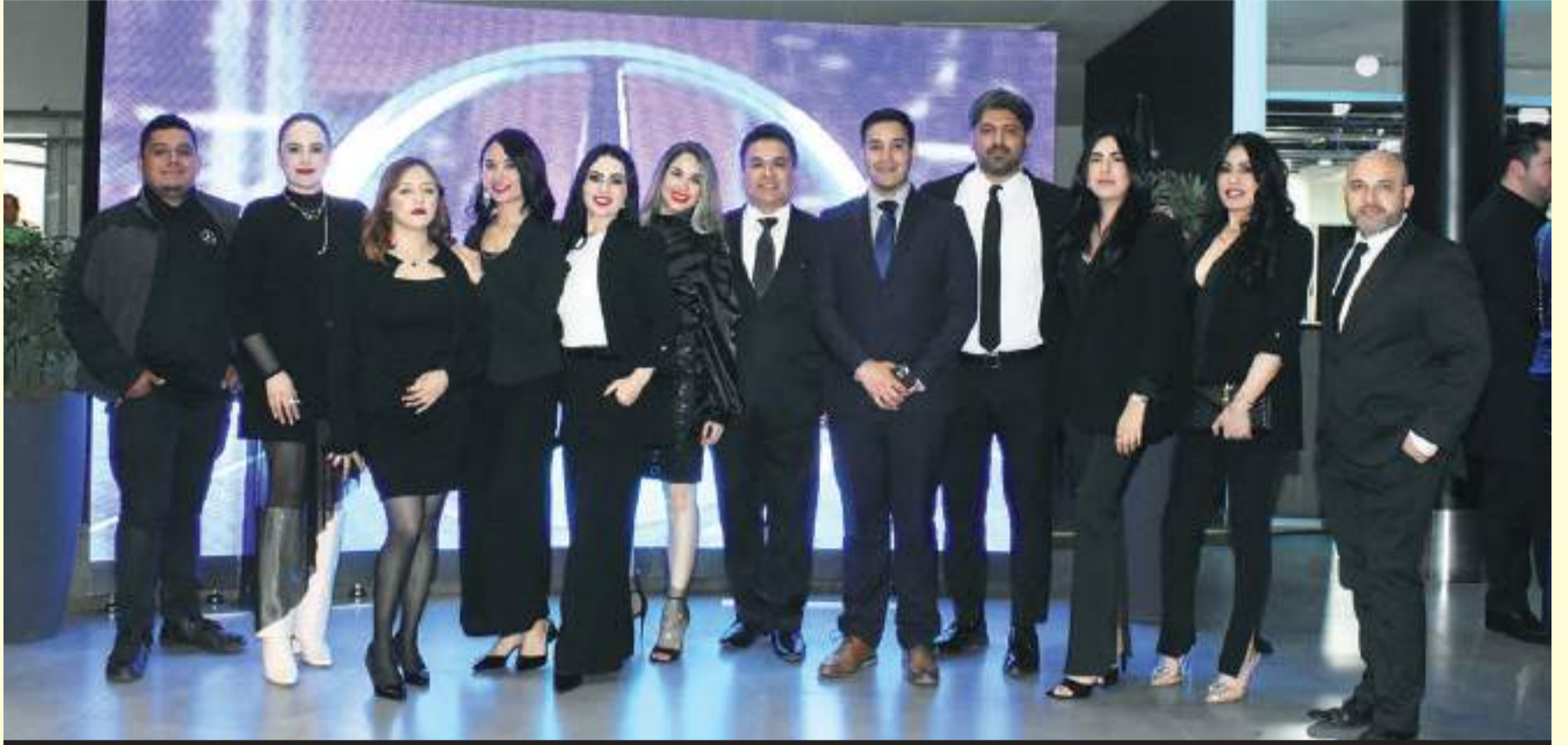
En una gala de presentación, el Equipo de Benz Tijuana.