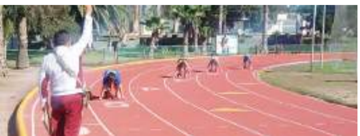
Todos los atletas máster están invitados a participar en el encuentro.

Los que pasen el Estatal, conformarán la Selección Baja California de Atletismo Máster Pista y Campo que nos representará en el Nacional de atletismo máster 2024 a celebrarse en la ciudad de Durango.