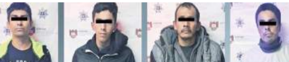
TIJUANA.- La Unidad Táctica Especial logró el arresto de "El Juanito", objetivo prioritario generador de violencia y tres sujetos más; llevaban droga y armas de distintos calibres.

de prueba presentados por el agente del Ministerio Público, un juez impuso la medida cautelar de prisión preventiva justificada y fijó tres meses de investigación complementaria.