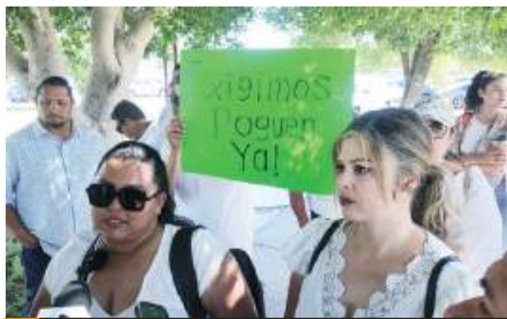
MEXICALI.- Maestros exigen el pago por su labor ante la falta de apoyo del SNTE.