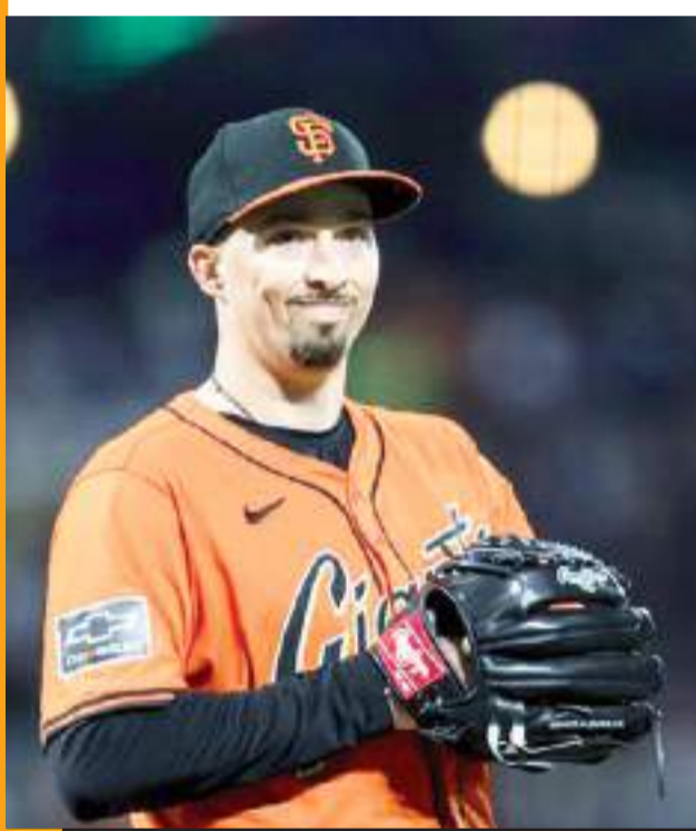
El vigente Cy Young llegó a SF con un contrato de dos años y 62 mdd.

El lanzador estaba agendado para realizar la labor de apertura en contra de Mets este miércoles