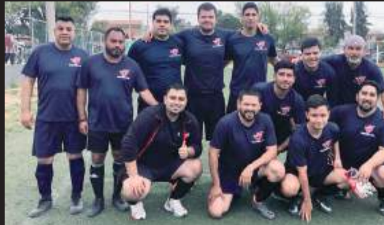
Los Huleros FC marchan con una victoria y una derrota.

Este certamen es impulsado por la empresa Hutchinson que apoya el deporte y lo promueve entre sus trabajadores para impulsar las actividades físicas y la sana convivencia.