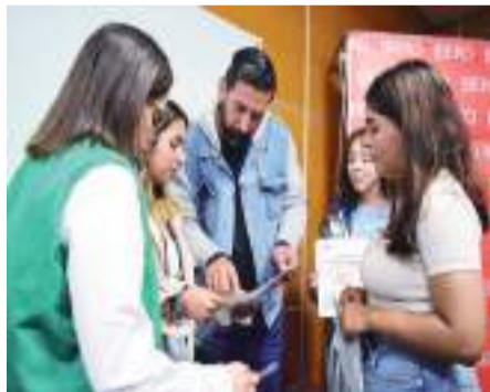
TIJUANA.- Estudiantes de la Universidad Iberoamericana sintieron una empatía generacional con el candidato del Partido Verde al Senado de la República, Juan Carlos Hank Krauss.

zos de coordinación con organismos nacionales e internacionales que quieran invertir en proyectos sustentables para Baja California, buscar esos recursos y retomar los ejemplos que se han desarrollado con éxito en otras ciudades de México y del mundo”. Puntualizó.