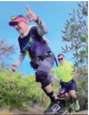
La cuarta fecha del serial se realizará el domingo 19 de mayo.

La premiación será económica para los tres primeros lugares absolutos de ambas ramas con 1 mil pesos, 750 pesos y 500 pesos respectivamente, así como medallas para los 3 primeros lugares de ambas ramas en cada una de las categorías y en la categoría Única de personas con discapacidad.