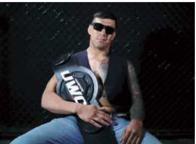
El argentino pondrá en juego el fajín que ganó en septiembre del 2023.

El argentino ganó el Campeonato Medio el 2 de julio del 2023 y dos meses después se convirtió en el "champ-champ" al dar cuenta del brasileño Víctor "Imperador" de Paula (7-3-0) por nocaut.