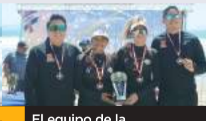
El equipo de la Universidad Anáhuac Querétaro fue el tercer lugar de la rama Femenil, venciendo al Tec CCM.