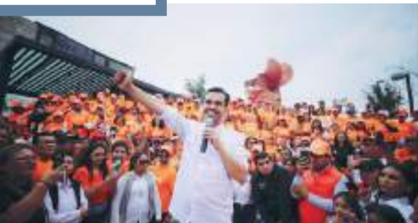
Álvarez Máynez, en visita llena de contrastes.