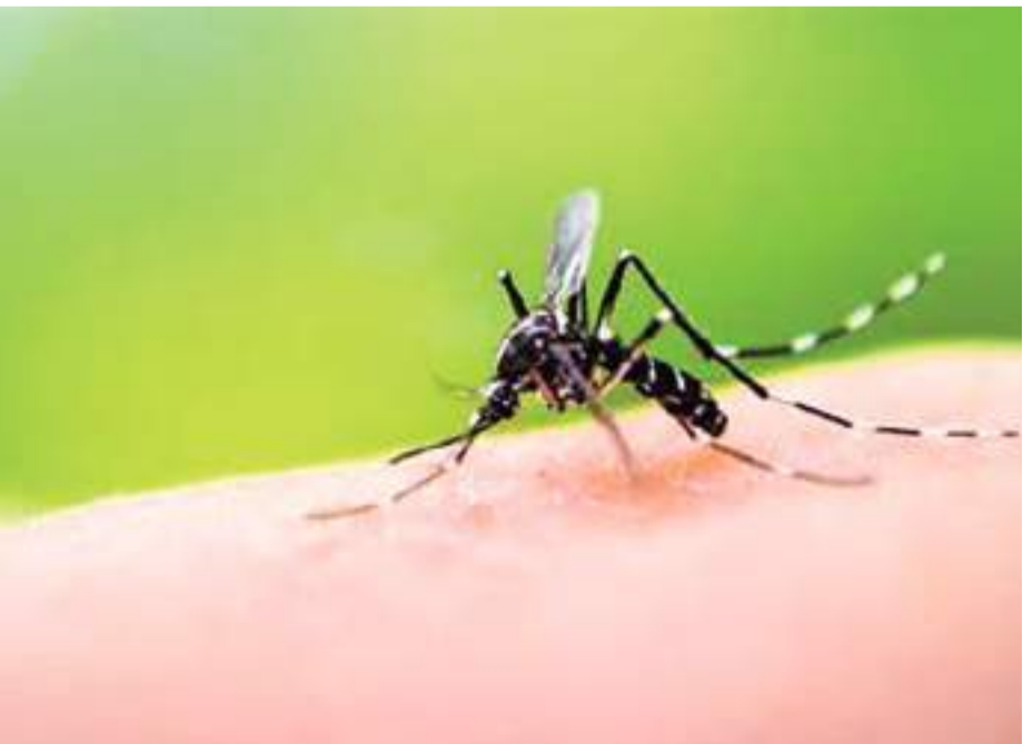
MEXICALI.- El sector salud menciona un control ante casos de paludismo en la entidad.

La secretaría de salud informó que los síntomas principales de la enfermedad son fiebre, dolor de cabeza, escalofríos y malestar general, los que aparecen entre 10 y 15 días después de la picadura del mosquito.