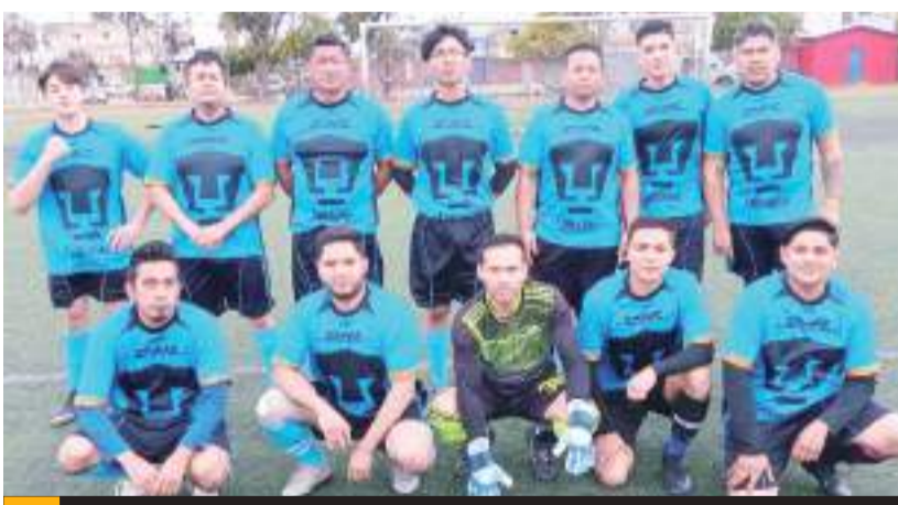
Este fin de semana se llevarán a cabo los duelos de liguilla en la Liga Reforma de fútbol, mismo que tendrá actividad en la Unidad Deportiva Reforma.

En el cierre de la actividad en el Campo Reforma, Juventus afrontará a Brujos a las 18:30 horas, Italia colisionará contra Club Nacional a las 19:40 horas y Rebel's United sostendrá un enfrentamiento ante Cuervos Salvajes. (AMS)