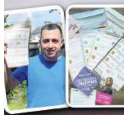
Emiten su voto, mexicanos en el extranjero.