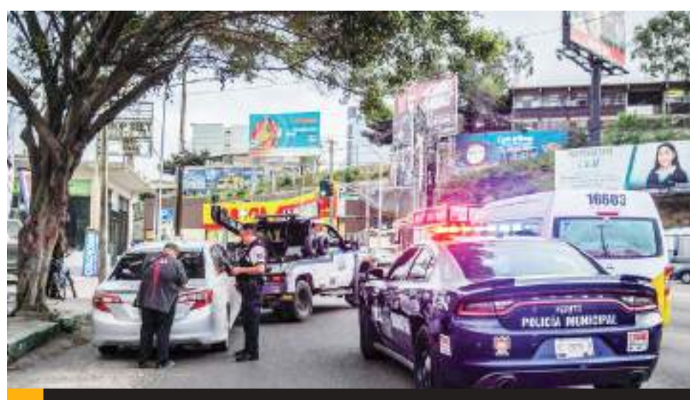
TIJUANA.- Un conductor chocó contra taxi de ruta impactándolo con tal fuerza que lo volcó, y aunque apeló a la fuga, fue capturado por la policía.