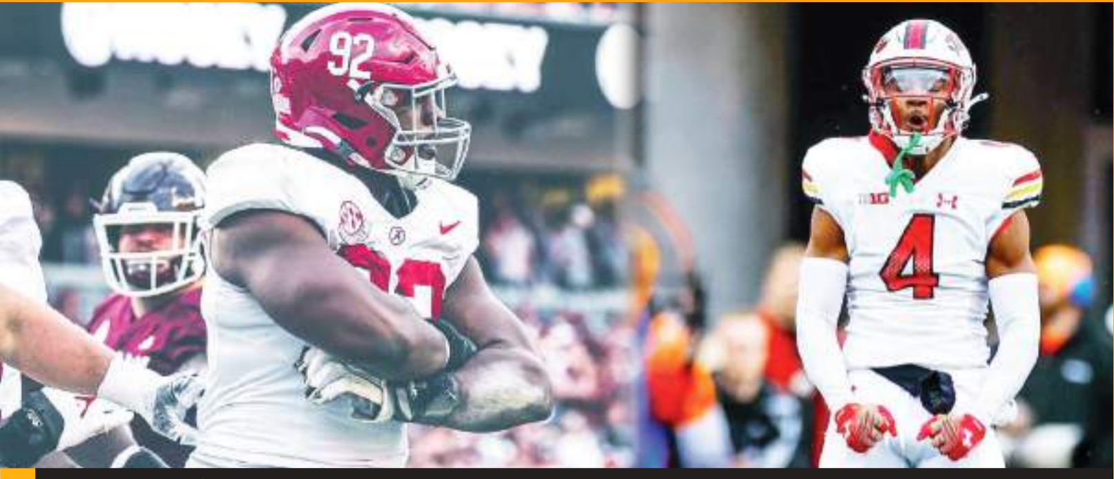
Chargers de Los Ángeles cerró este sábado su participación en el Draft 2024 de la NFL realizando seis selecciones.

Una anotación de Robert Andrich al 90+6 sentenció el cotejo celebrado en la Bay Arena, lo que pone a soñar a los dirigidos por Xabi Alonso en finalizar la temporada invictos, ya que restan solamente tres fechas para la conclusión de la liga de Alemania.