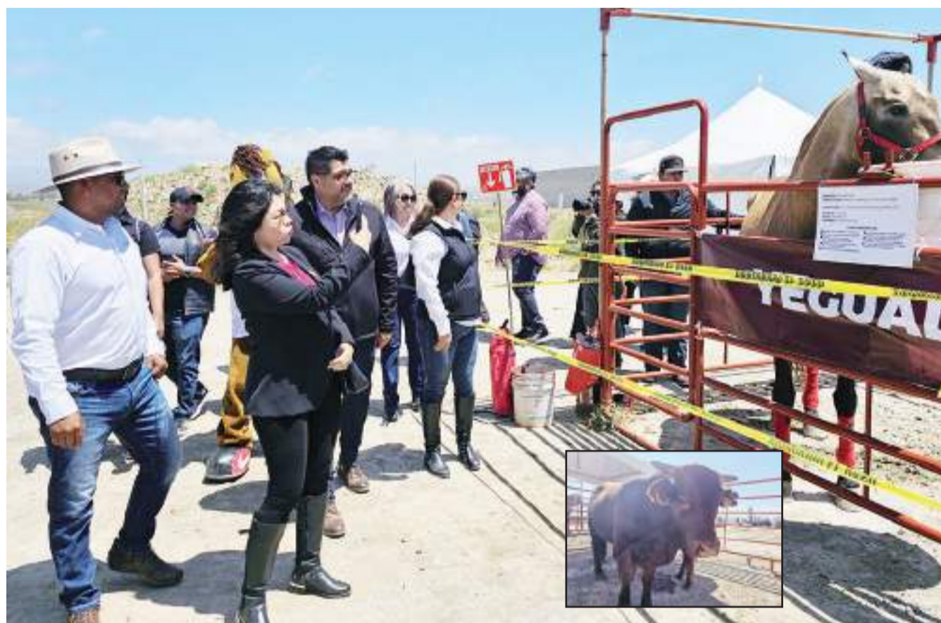
SAN QUINTÍN.- Con más de 140 expositores, se llevó a cabo exitosamente la Expo Agro San Quintín 2024.