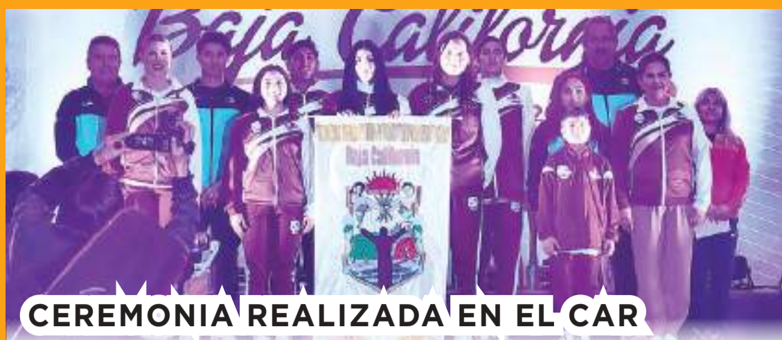
CEREMONIA REALIZADA EN EL CAR