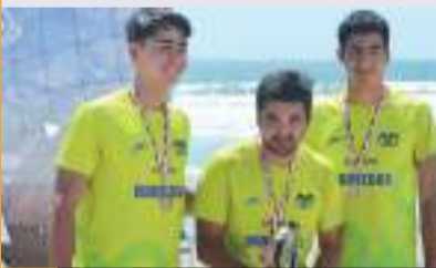
El tercer lugar del nacional de voleibol de playa categoría Juvenil C fue para el Tec CCM Campus Querétaro.