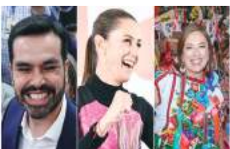
Esta noche será el segundo debate.

Claudia Sheinbaum: 51 Xóchitl Gálvez: 34 Álvarez Máynez: 7