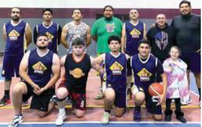
Constructora Roma sacó triunfo al vencer 62 puntos por 47 al CJ Shop, en duelo de la Intermedia de Libasa.