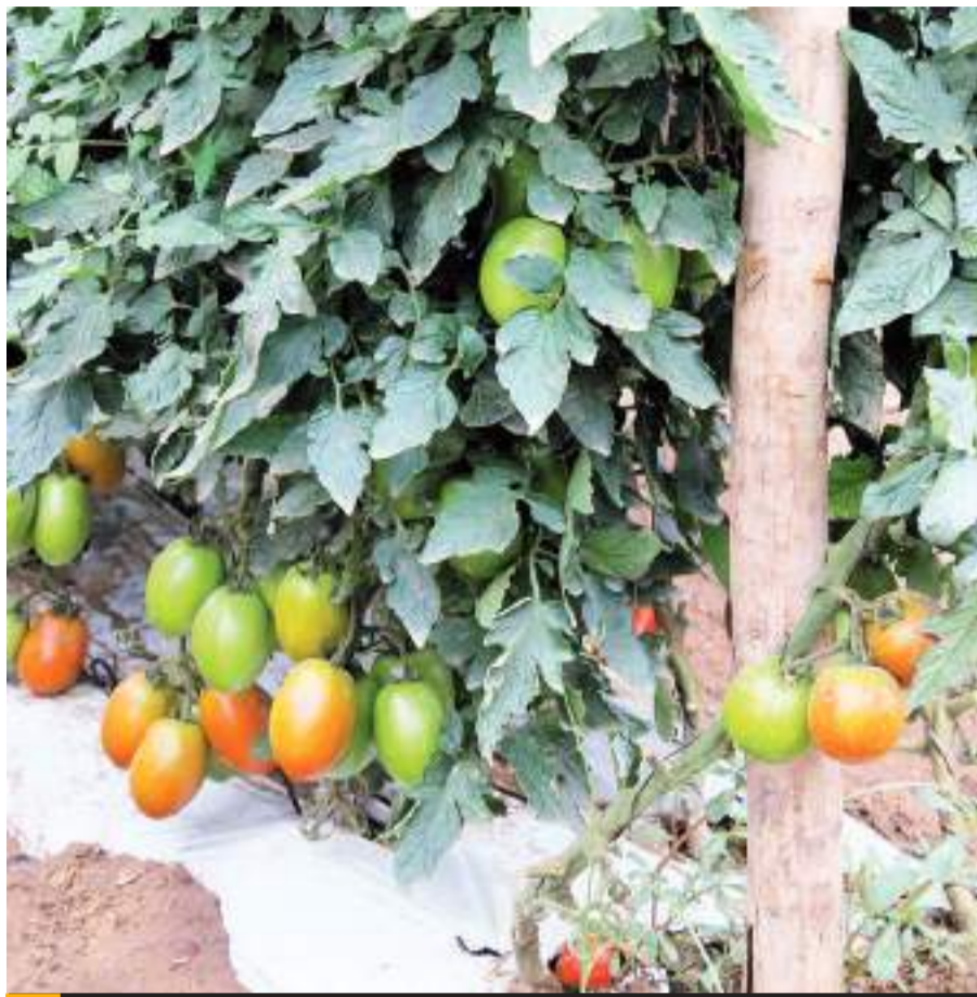
MEXICALI.- Importantes resultados en la agricultura en BC con los cultivos de chile y tomate.

Comentó que el mayor avance, lo presenta el cultivo del chile con 267 hectáreas. La mayoría de esta superficie, 252 hectáreas, están siendo cultivadas a cielo abierto, mientras que las restantes 15 hectáreas en la modalidad de agricultura protegida, es decir, a través de la utilización de invernaderos, malla sombra, acolchado, entre otros.