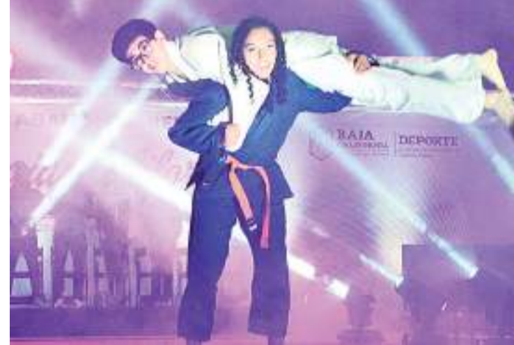
Este sábado fue celebrada la ceremonia de Abanderamiento a la Selección de Baja California que competirá este año en los Nacionales CONADE.