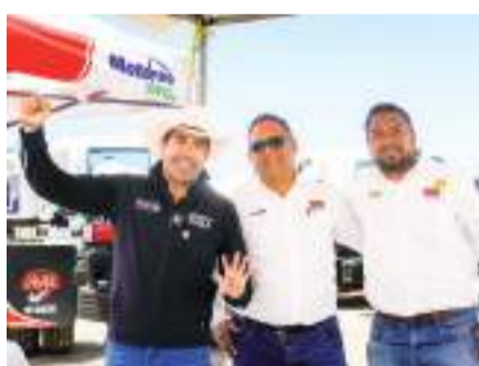
SAN QUINTÍN.- De la mano con la próxima Presidenta Claudia Sheinbaum, se fortalecerá el campo del Sexto Municipio, aseguró Armando Ayala.