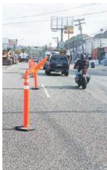
PLAYAS DE ROSARITO.- Exhortan a automovilistas a tomar vías alternas y mayor tiempo para evitar demora en sus tiempos de traslado.