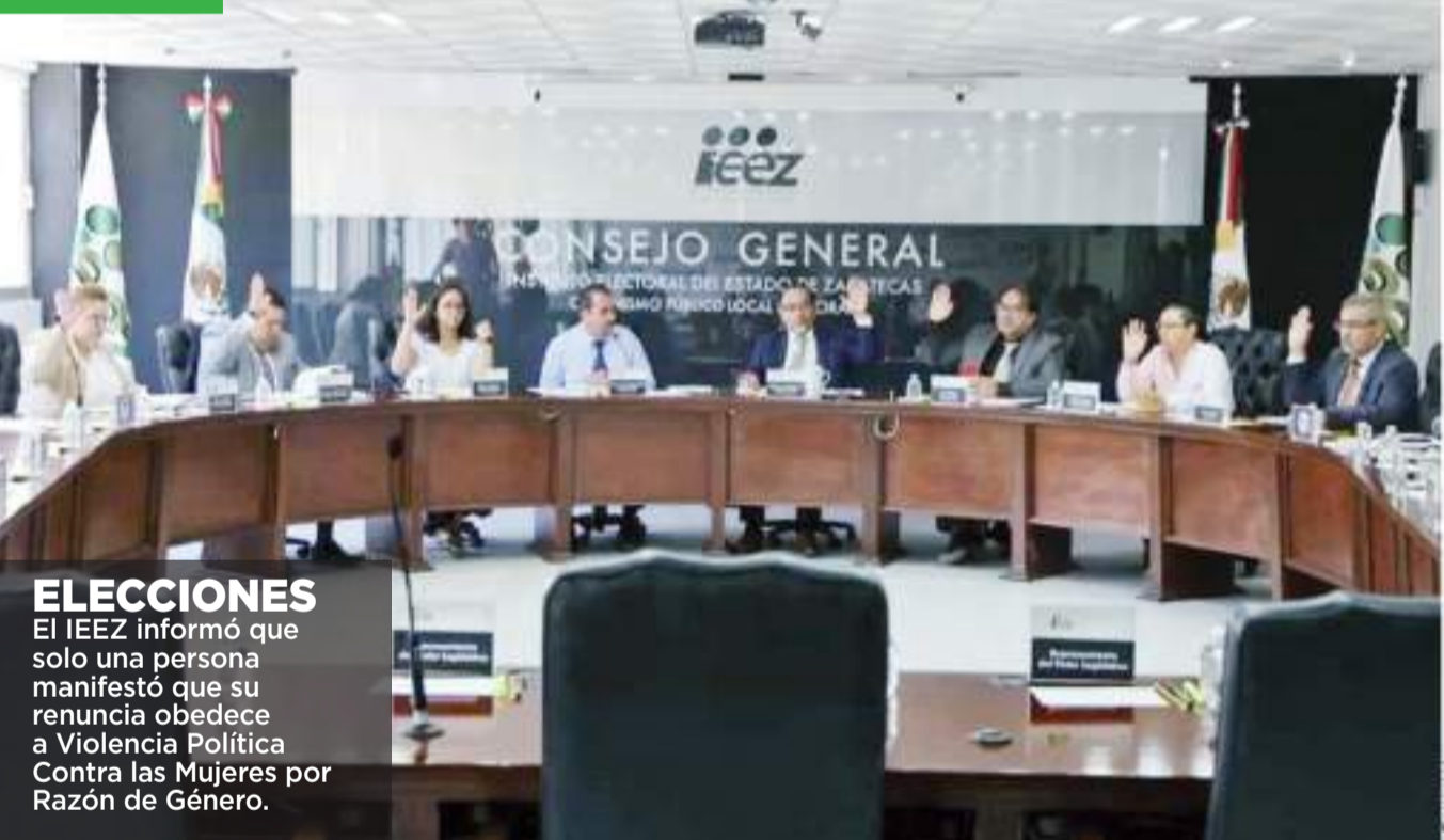
ELECCIONES El IEEZ informó que solo una persona manifestó que su renuncia obedece a Violencia Política Contra las Mujeres por Razón de Género.