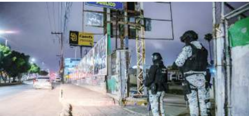
TIJUANA.- En condición grave fue trasladada una mujer al hospital tras recibir impactos de bala, el hombre que la acompañaba pereció en el lugar.