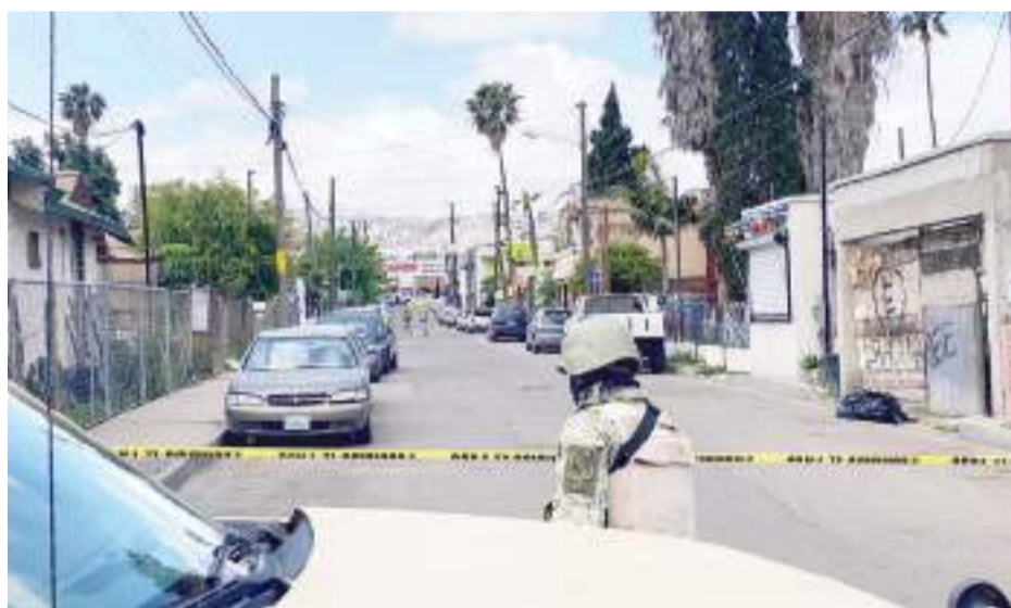
TIJUANA.- Restos humanos fueron encontrados en una bolsa abandonada sobre la Ermita.