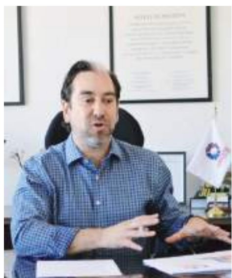
MEXICALI.- Canacintra Mexicali espera buenos resultados con el encuentro de candidatos a la alcaldía.

En adición a estos cultivos, también se cuentan 53 hectáreas de cebolla, 31 hectáreas de calabacita, 17 hectáreas de maíz, 12 hectáreas de frambuesa, 7 hectáreas de pepino y 196 hectáreas de cultivos varios, principalmente hortalizas.