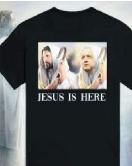
Difunden imagen del presidente vistiendo como el nazareno.