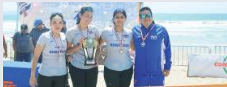
El representativo del Tec CCM Edo. de México fue el subcampeón de la rama Femenil en el nacional de voley de playa Juvenil "C" de Conaidep 2024.

El acto de premiación y clausura se hizo al término de las finales contando con la presencia de Alfre-