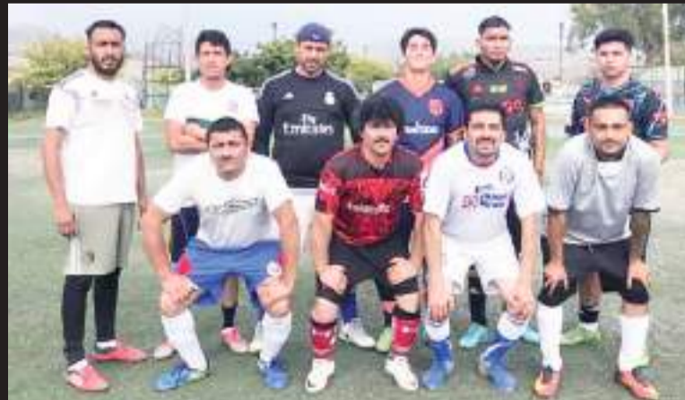
Tremendos agarrones se esperan este domingo en la cuarta jornada del torneo de la Nueva Liga Empresarial Futbol 7 Hutchinson.

Serán las escuadras de Mantenimiento FC y Mezclado los encargados de abrir las acciones, en tanto que los equipos de Inyección FC y Arsenal saltaran a la cancha a las cuatro de la tarde para protagonizar el último partido de la jornada.