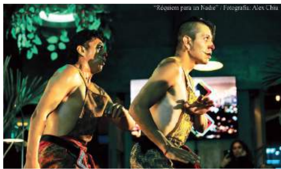
"Réquiem para un Nadie" / Fotografía: Alex Chiu

La tercera pieza que aborda el tema de la violencia, en su dimensión más normalizada e incluso un tanto folklorizada e incorporada al imaginario social mexicano desde el siglo pasado, retrata personajes que devienen como efecto de los procesos de marginación social -violencia estructural- que ocurren en la ciudades y que han sido retratadas en distintos momentos de la historia del cine nacional: en las películas de Ismael Rodríguez con el personaje de Pedro Infante en Nosotros los pobres, en la película Los olvidados de Luis Buñuel y más recientemente en Chicuarotes de Gael García. Justo se trata de personajes inspirados en esta última, pues se interpreta a dos jóvenes que vestidos de payaso viven distintas situaciones de violencia y precariedad. Es una pieza bien lograda que combina elementos sonoros (disparos, sirenas), voz en off, música popular mexicana de diferentes épocas y lugares, que constituyen parte del paisaje sonoro del "México de hoy y siempre".