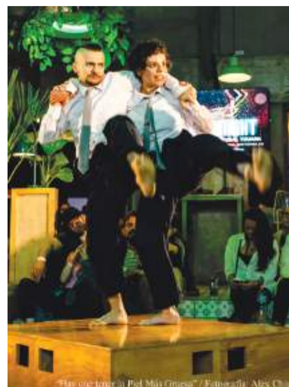
"Hay que tener la Piel Más Gruesa"