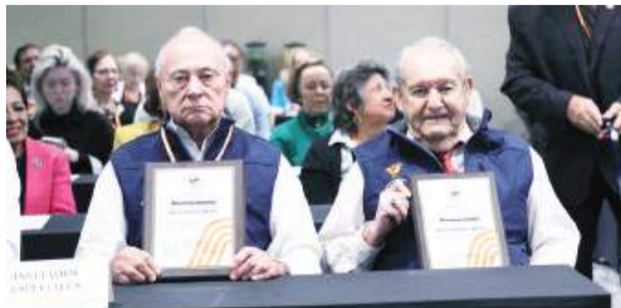
TIJUANA.- Coordinadores acordaron puntos fundamentales para impulsar el Movimiento Madrugador Internacional, durante la celebración del 50 Aniversario de Madrugadores de Tijuana.

Para finalizar, se llevaron a cabo mesas de trabajo entre los diferentes Grupos Madrugadores para llevar acciones ciudadanas a sus municipios correspondientes. Entre las problemáticas que abordaron como atención prioritaria, fueron seguridad y cuidado del agua.