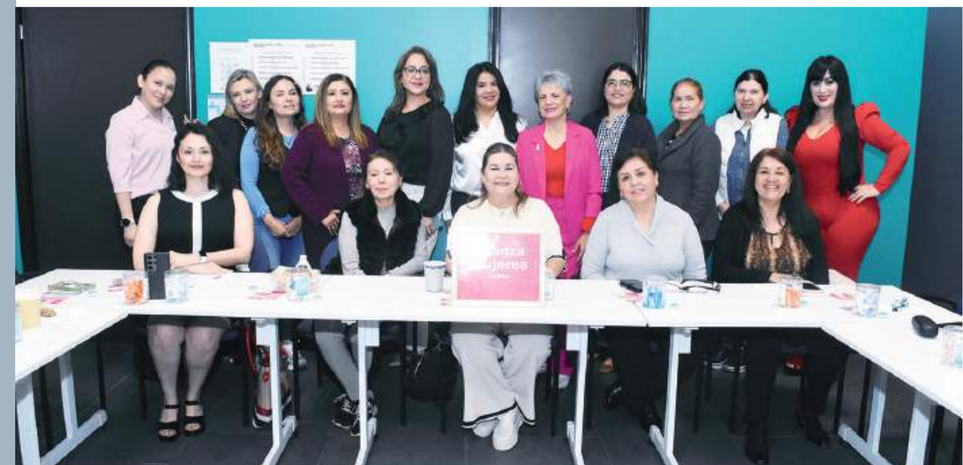
Interesante ciclo de conferencias ofreció la organización Mujeres por Mujeres, A.C.