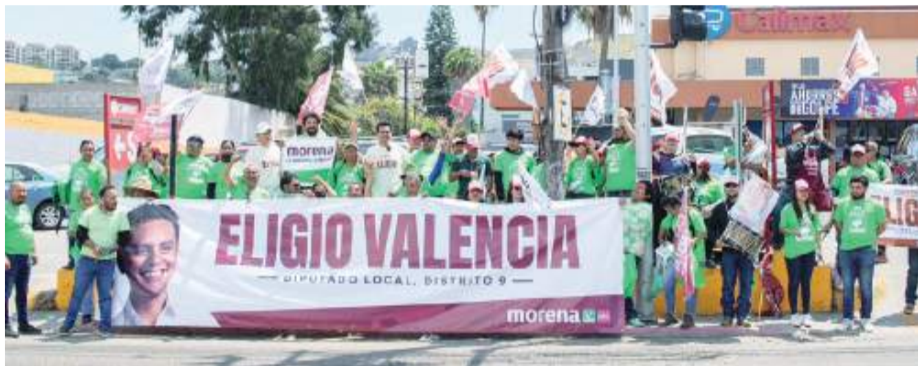
TIJUANA.- Residentes de Torres del Lago formaron brigadas para promover el voto a favor de Eligio Valencia López, candidato a diputado local por el distrito 9 por la alianza Sigamos Haciendo Historia en Baja California.

Para la tarde, se sumaron más simpatizantes e invitaron a Eligio Valencia López a transitar sobre un cruceiro en la avenida Las Ferias, donde pidió el voto en las principales vialidades de la zona.