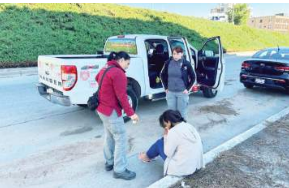
TIJUANA.- El Ayuntamiento de Tijuana, a través del UMAS, ha brindado orientación a cerca de 3 mil personas vulnerables.

Además, este 2024 UMAS dio asistencia a familiares y amigos de nueve víctimas de suicidio, brindó 13 atenciones a familias que perdieron su patrimonio en incendios, otorgó ocho servicios médicos, un caso de violencia intrafamiliar y apoyó en 30 casos a los deudos, tras la pérdida de sus seres queridos.