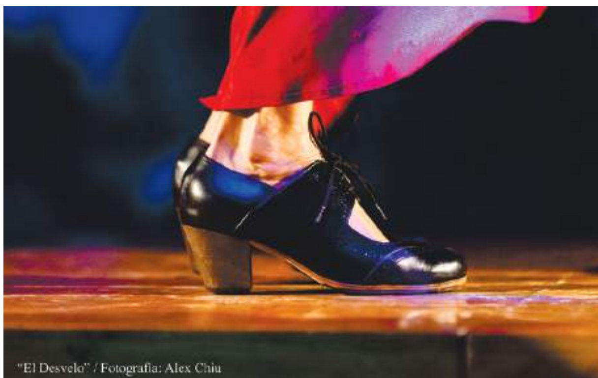
"El Desvelo"