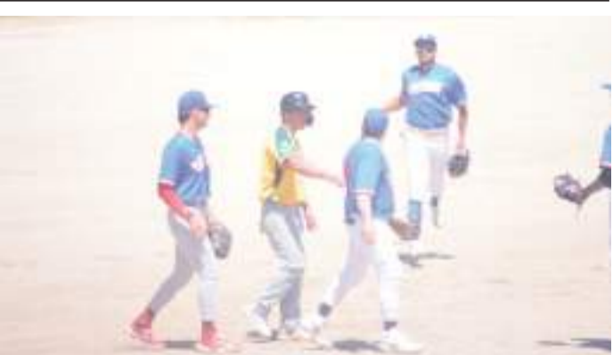
Tomateros saldrán en busca del boleto a la final y Cañeros Del Río en busca de alargar la serie en semifinal de la Urbana de Chapultepec.