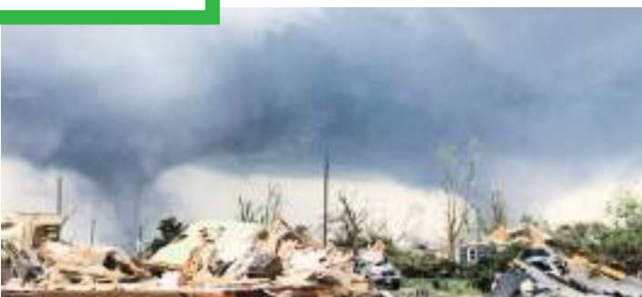
Los dos estados con mayor actividad de tornados son Texas y Kansas..