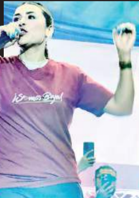
La Gobernadora Marina del Pilar reveló que Baja California podría ser sede alterna en los Juegos Olímpicos Los Ángeles 2028.

La única ocasión en la que México ha sido sede de unos Juegos Olímpicos fue en 1968, pero en dicho evento las actividades fueron realizadas principalmente en Ciudad de México, con algunas competencias realizadas en Acapulco, Puebla, Valle de Bravo, León y Guadalajara, por lo que de