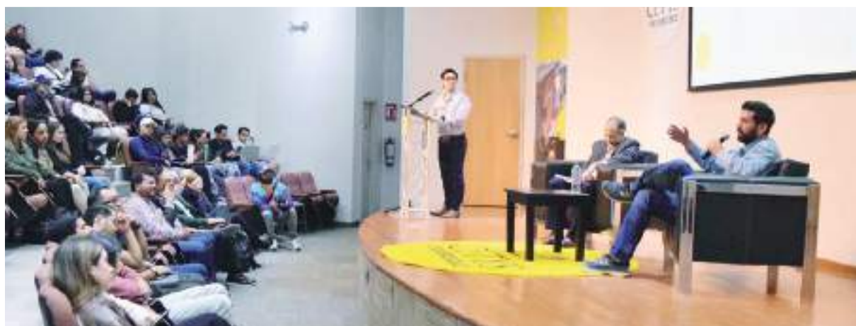
TIJUANA.- Juan Carlos Hank Krauss, candidato al Senado de la República por el Partido Verde Ecologista (PVEM), sostuvo un encuentro con estudiantes de dicha institución educativa.