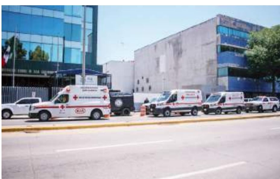
TIJUANA.- Dos agentes adscritos a la FGR resultaron intoxicados mientras manipulaban precursores para la elaboración de la mortal droga fentanilo.

sado cantidades de metanfetamina y fentanilo, mismas drogas la que fueron puestas a disposición de la FGR;