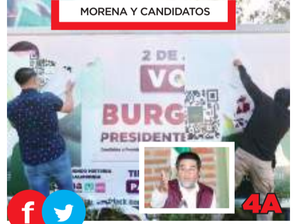
MORENA Y CANDIDATOS