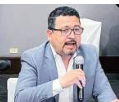
ENSENADA.- La detención de dos policías municipales vinculados al crimen, encendió los focos de alerta de la población.

Los permisos a realizar en el SARE son factibilidad de uso de suelo, licencia ambiental, dictamen de uso de suelo e instalación de anuncios, rótulos y similares, por lo que para más información deberán comunicarse al 646 172 3401, extensión 1191 de lunes a viernes de 8:00 a 15:00 horas o enviar un correo a sarenenada@gmail.com.