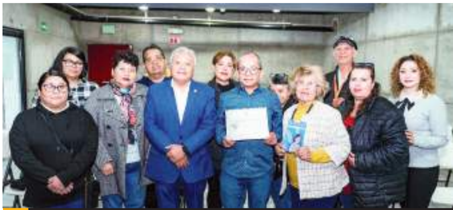
ENSENADA.- Reconoce el Gobierno Municipal el gran aporte del sector empresarial a la generación de empleos, que en tan solo este año han aportado 416 nuevos empleos.