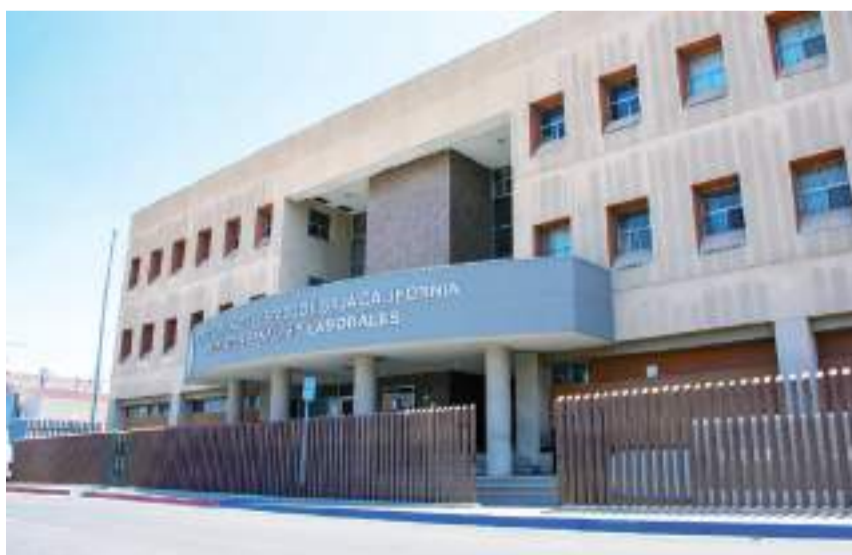
MEXICALI.- Hay más tribunales y jueces en la entidad, para resolver los conflictos en materia laboral.

Asimismo, la Materia Laboral se desarrolla con auxilio de apoyos tecnológicos y con una política de cero papel mediante el uso de expedientes digitalizados electrónicamente.