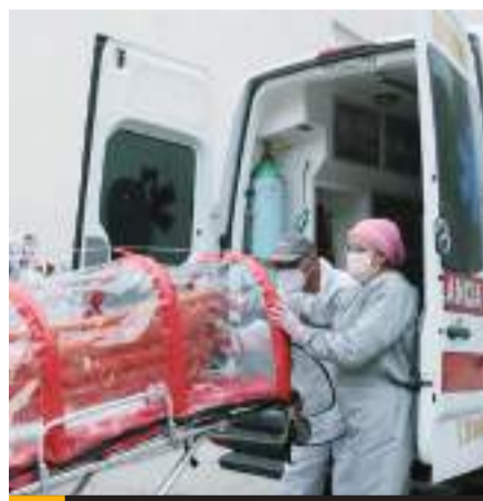
Pudieron evitarse 36% de las muertes en la pandemia.

El informe fue presentado ayer y contrasta las cifras de afectación con