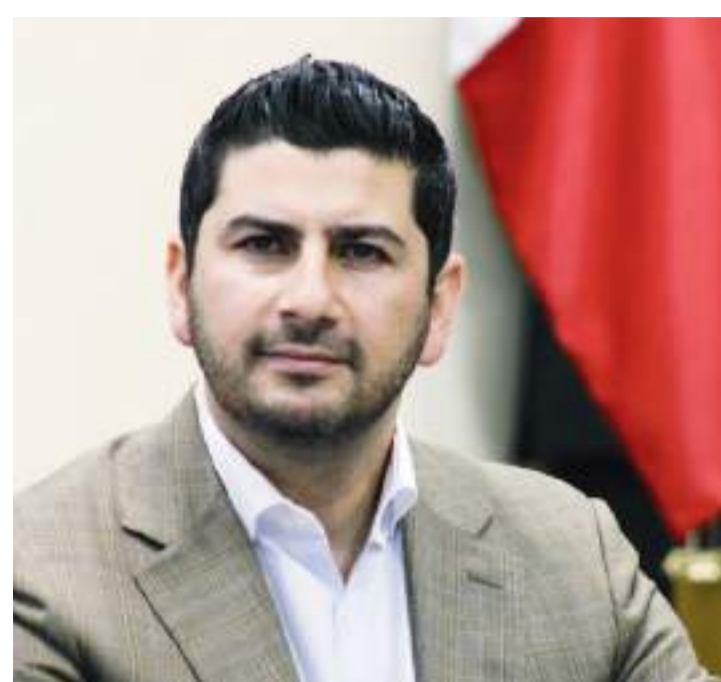
MEXICALI.- El titular de la Secretaría del Trabajo dijo que a través de la vía de la conciliación en Baja California se resuelven oportunamente cada conflicto laboral.