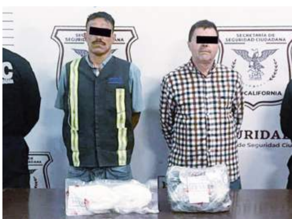
TIJUANA.- Los capturados y la droga fueron remitidos ante la Fiscalía General de la República (FGR).

Por esta razón se le informó a los sujetos que serían detenidos, por la comisión de delitos contra la salud. Posteriormente se les turnó a la Fiscalía General de la República (FGR).