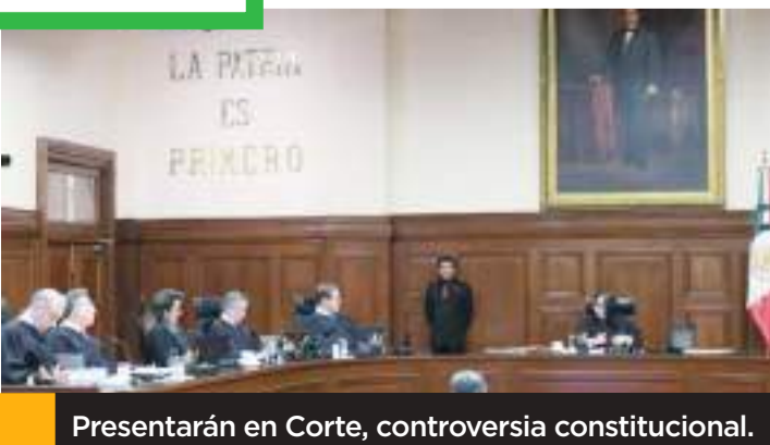
Presentarán en Corte, controversia constitucional.