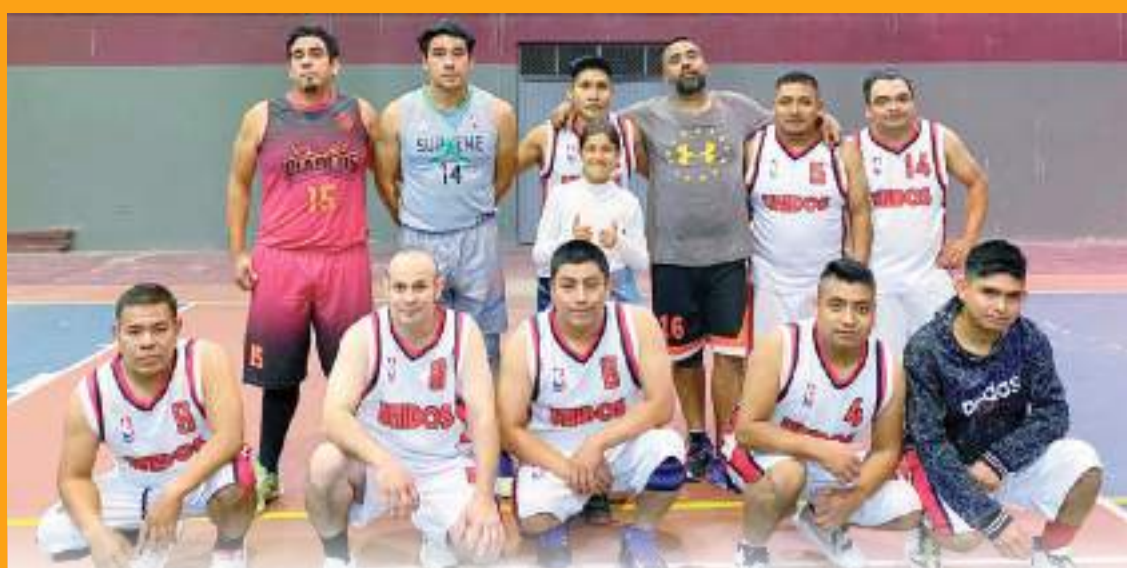
Unidos remontó en la pizarra para vencer 35-28 a los Hornets Veteranos.