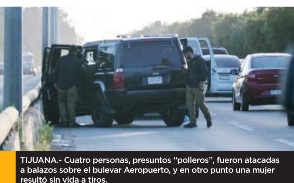
TIJUANA.- Cuatro personas, presuntos "polleros", fueron atacadas a balazos sobre el bulevar Aeropuerto, y en otro punto una mujer resultó sin vida a tiros.

El hoy detenido fue presentado ante la autoridad para dar inicio a la carpeta de investigación.