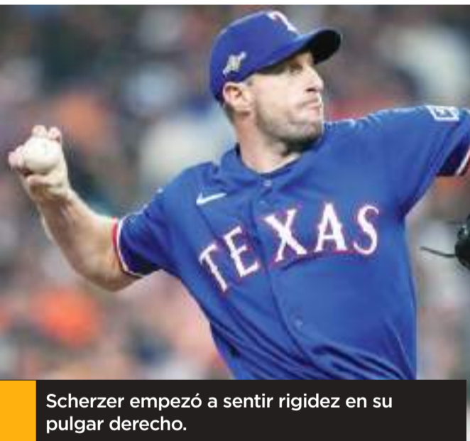
Scherzer empezó a sentir rigidez en su pulgar derecho.

FRISCO, Texas.- Los Rangers decidieron retrasar algunos días la apertura de rehabilitación que Max Scherzer tenía pautada con Doble-A Frisco, anunció el martes el gerente general del equipo texano Chris Young.