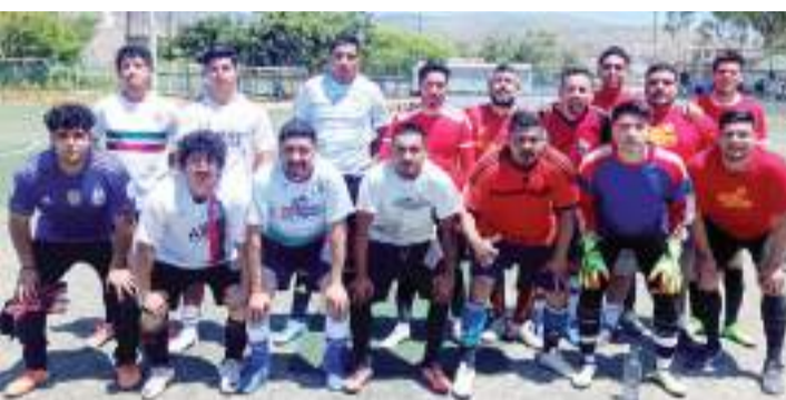
Reñidos duelos se dieron en la Jornada 4 del torneo de futbol 7.