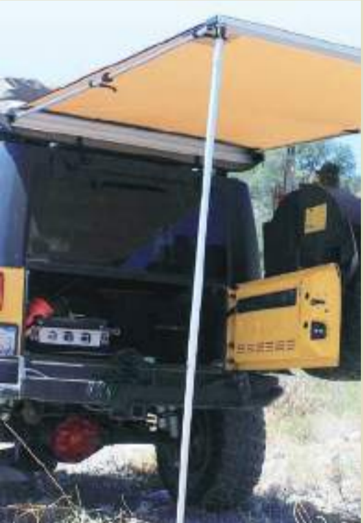
La cita para expertos en el tema, así como para quienes gustan de admirar vehículos de automotor de alto nivel.

Este, sin duda será un evento de éxito y sano esparcimiento para los que saben y gustan aprender de automovilismo regional.