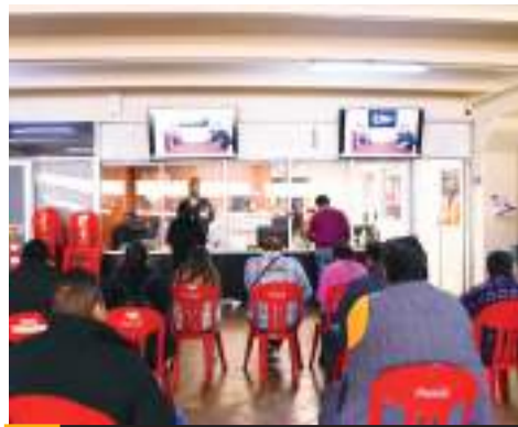
TIJUANA.- El Ayuntamiento de Tijuana arrancó la expedición de permisos accidentales o eventuales para la venta de artículos de ocasión o flores con motivo del Día de las Madres.

al ser engañados y desinformados sobre los métodos que utilizan para ingresarlos a Estados Unidos.