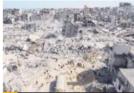
Van 37 millones de toneladas de escombros, a consecuencia de los bombardeos en Gaza.

"Se estima que hay más de 800.000 toneladas de asbesto entre los escombros solo en los escombros de Gaza", ha sostenido antes de afirmar que se trata de un elemento tóxico muy peligroso para la salud.