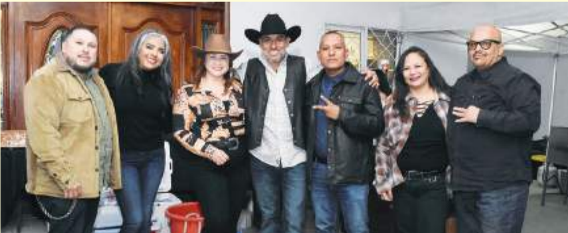
Grupo los charros, acompañando al cumpleaños.

EL HOGAR DE LA FAMILIA IBARRA, DE LA COLONIA EL MIRADOR, SE VISTIÓ DE GALA PARA RECIBIR A UN GRUPO DE INVITADOS PARA CELEBRAR UN ANIVERSARIO MÁS DE VIDA DEL FELIZ CUMPLEAÑERO