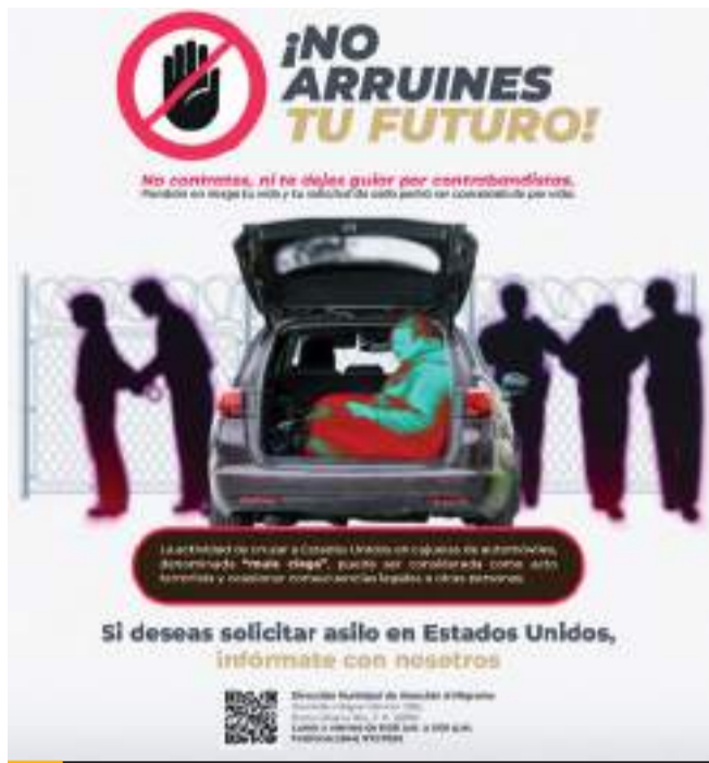
TIJUANA.- Se lanzó la campaña "No arruines tu futuro", cuyo propósito es informar a los migrantes sobre los riesgos de cruzar bajo la modalidad "mula ciega".

De igual manera, se busca prevenir un am-