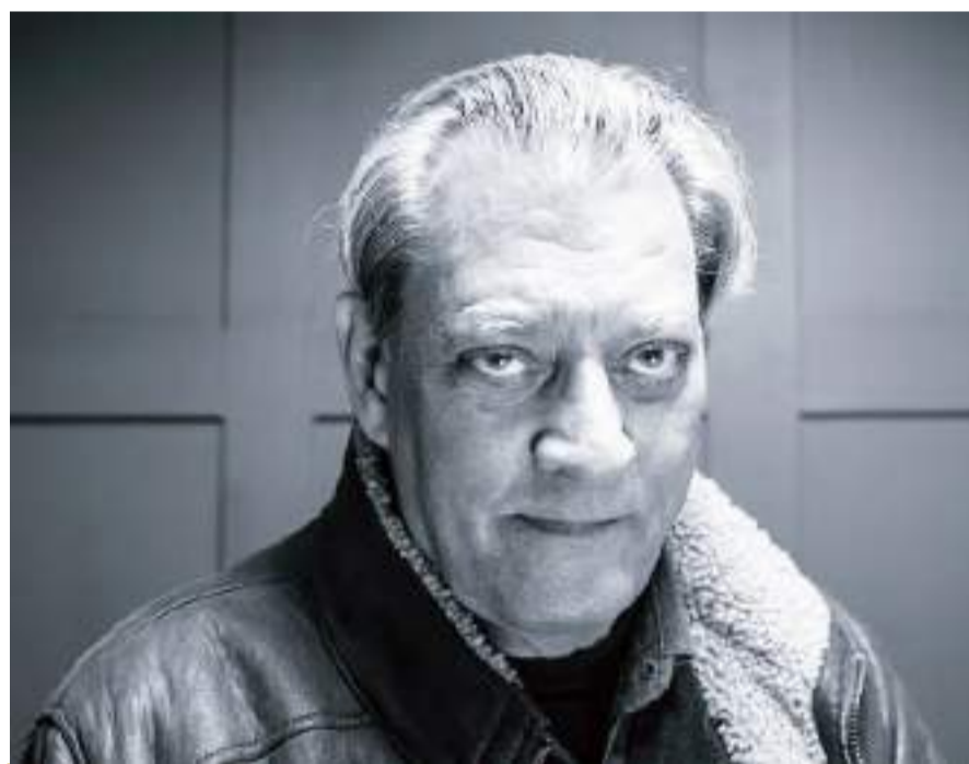
El escritor Paul Auster en el festival literario de Oxford en marzo de 2017.

La historia del restaurante -durante la II Guerra Mundial miles de judíos se salvaron gracias a la cobertura prestada por el establecimiento- propiciaba un motivo de conversación, pero Auster, judío de nacimiento, no