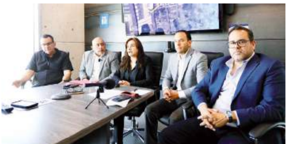
TIJUANA.- Con la llegada de nuevas inversiones, la labor de promoción realizada por organismos privados está dando resultados positivos, director a conocer directivos del Grupo Tacna y Deitac.

En consecuencia, la Unidad de Transparencia y Acceso a la Información Pública del IEEBC, procedió a hacer del conocimiento de los partidos políticos, la importancia del proceso de validación, ya que eso permite que la información se analice y se proceda a su publicación cumpliendo su objetivo.