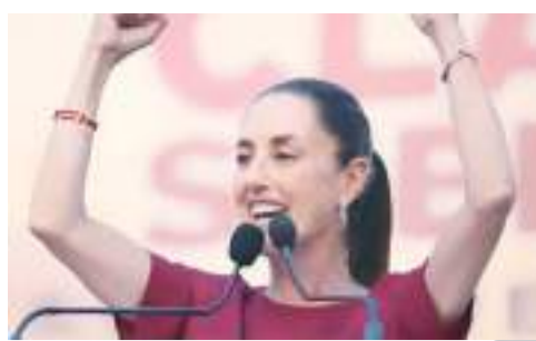
MEXICALI CLAUDIA SHEINBAUM PARDO...

Anuncia importante inversión extranjera.