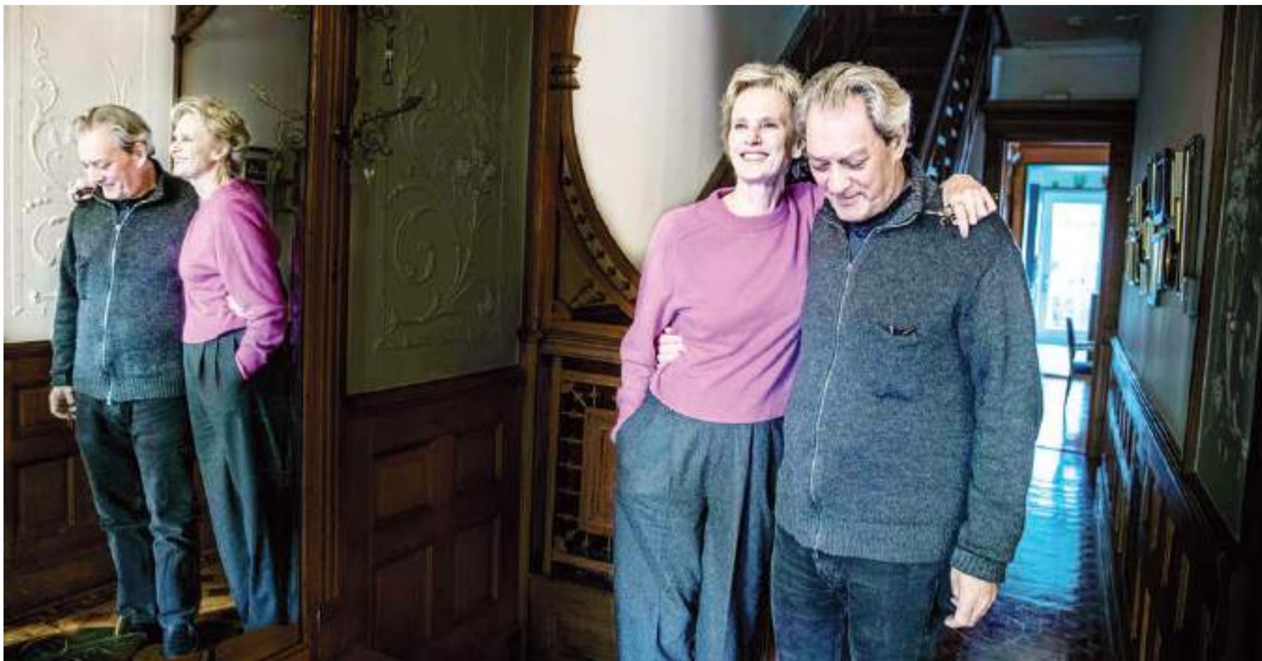
Paul Auster y su mujer, Siri Hustvedt, en su casa de Brooklyn en octubre de 2020.