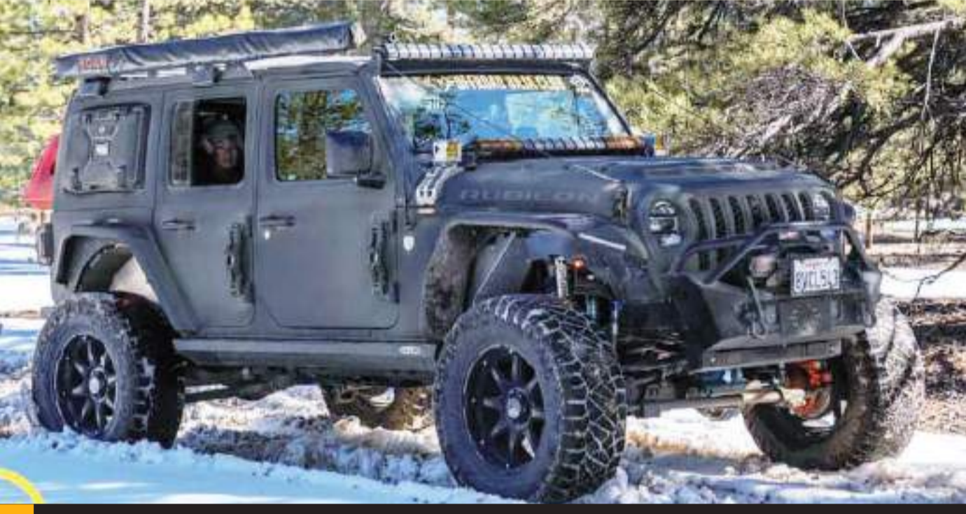
Los expositores tendrán un lugar seleccionado, dependiendo de las categorías a participar.

La Expo Over-Land Sin Fronteras ha fijado como hora de ingreso para el público asistente, las 10 de la mañana, y 5 de la tarde como conclusión del evento.