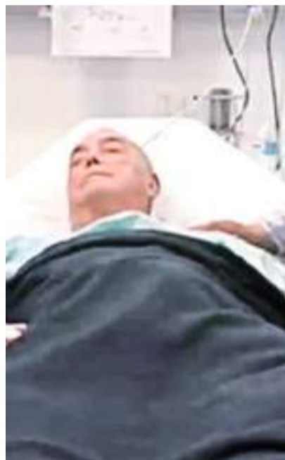
El Obispo continúa en el hospital.