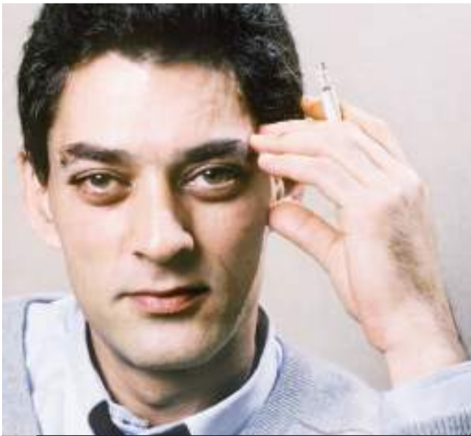
Paul Auster, retratado en París en noviembre de 1987.

Unos años más tarde, no sé si en agradecimiento por aquel episodio anecdótico, me llamó para preguntarme si quería comer con Paul Auster, que estaba en España. Acepté con la misma alegría que se acepta un billete de lotería premiado y -como cuan-