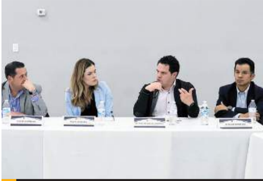
TIJUANA.- Canacintra Tijuana realizó una mesa de trabajo con empresas para analizar el Decreto por el que se modifica la Tarifa de la Ley de los Impuestos Generales de Importación y de Exportación.

“Imagina que tienes una fábrica que produce artículos de alu-