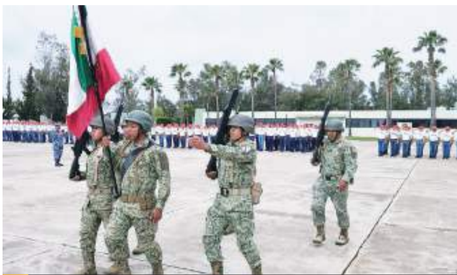
TIJUANA.- Más de un millar de jóvenes soldados del Servicio Militar Nacional y Mujeres Voluntarias, participaron en la toma de protesta de Bandera.

Protestaron bandera un total de 1,088 jóvenes en edad militar en su modalidad de encuadrados, situación que ofrece la oportunidad de cumplir con este deber constitucional y obtener la liberación de su Cartilla de Identidad del Servicio Militar Nacional.