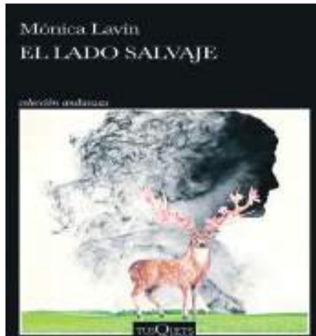
“El lado salvaje” nos sumerge en un mundo donde lo inesperado se entrelaza con lo cotidiano.

Dejé que tomara la delantera y seguí el auto rojo barniz de uñas, hasta que sus intermitentes me indicaron que