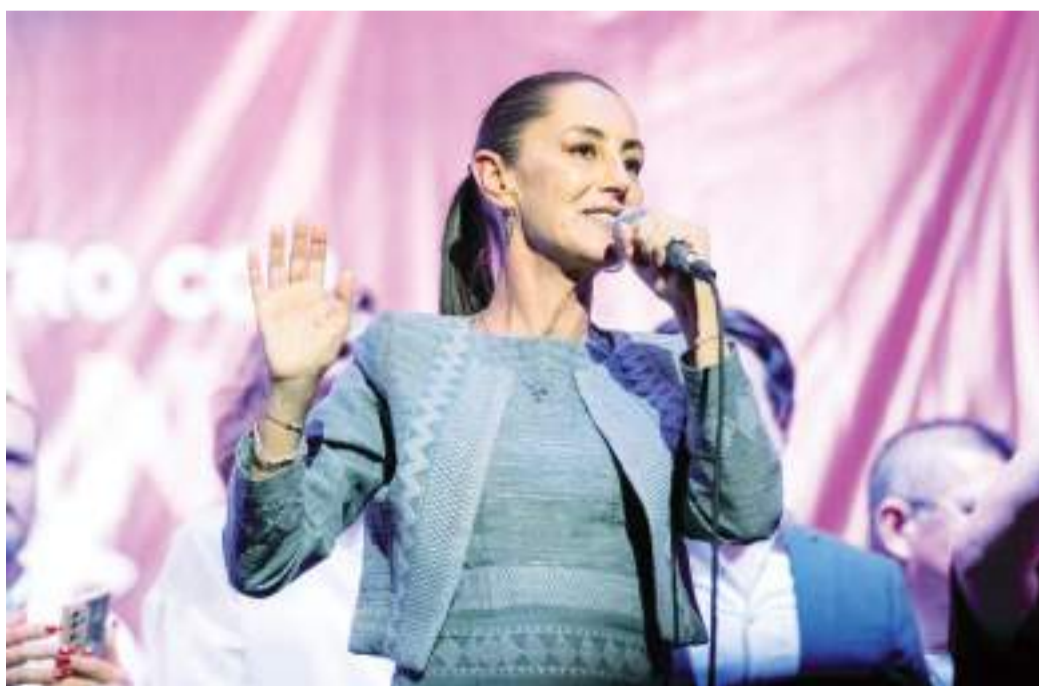
MEXICALI CLAUDIA SHEINBAUM PARDO...

Peor aún resulta que las autoridades de los tres niveles de gobierno tengan conocimiento de la clase de "fichita" delictiva que es el de apellido Garnica, apodado el "Kekas", del que en toda esa zona de Santo Tomás se ha convertido en el terror de los residentes de ese poblado y sus alrededores, y, peor aún, que es la mano ejecutora de otro delincuente de mayor nivel que en las barbas de los operativos parece ser el mero mero del trasiego de drogas en esa zona y sus alrededores y, curiosamente las autoridades que frecuentan esa zona del municipio no se habían dado cuenta hasta que ocurrió esta tragedia.