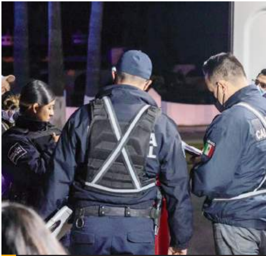
ENSENADA.- Elementos de la DSPM, adscritos a la Policía Ecológica, realizaron infracciones por obstrucción de la vía pública en distintos puntos de la ciudad.

Derivado de ello se desprendió de las intervenciones realizadas por los