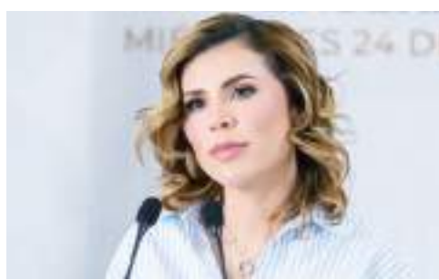
MEXICALI MARINA DEL PILAR ÁVILA OLMEDA...

Entró al quite y comenzó trabajos de cara a los comicios del próximo 2 de junio.