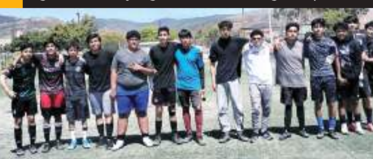
Gladiadores le sacó ventaja a Calienta Bancas en la ida de la 2007.