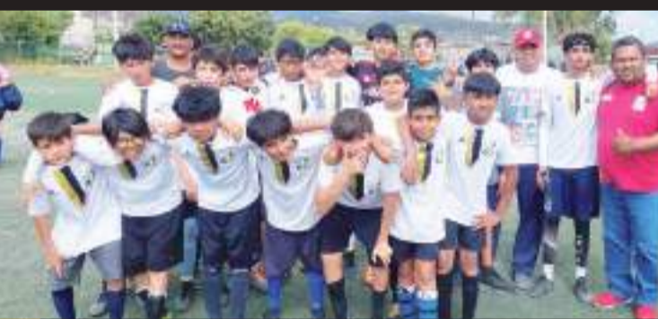
Águilas Marinas y Jaguares brindaron un gran espectáculo.

Los tantos que tienen con ventaja a los Gladiadores cayeron de los botines de