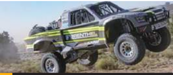
Hasta la fecha se cuenta con más de 140 equipos inscritos.

Hasta la fecha se cuenta con más de 140 equipos inscritos para participar en la que es considerada una de las diez más famosos eventos de automovilismo deportivo en el mundo.