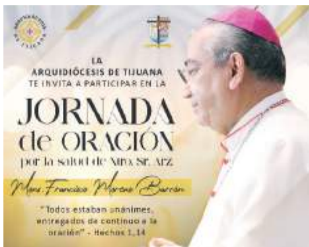
TIJUANA.- El Arzobispo de la Diócesis de Tijuana, Francisco Moreno Barrón, será intervenido este lunes 6 de mayo, quien antes de partir a la CDMX, agradeció la oración de todos.

Asimismo, manifestó que no se trata de una operación que garantice que quede curado, pero que sí le permita optimizar la vida restante que Dios le dé, "porque este cáncer, según me han explicado, aunque se intervinga, con el tiempo puede volver a surgir, por lo que tendré que continuar con algunos cuidados posteriormen-