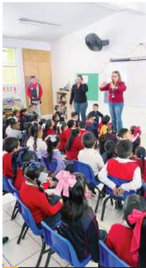
TIJUANA.- La CESPT realiza desde 1990 actividades de fomento al cuidado del vital líquido en el sector estudiantil, empresarial y sociedad en general.

La consejera refirió que el propósito fue buscar alternativas para reducir el impacto, por medio de programas para la industria, aunque, al final, dijo, se mantienen atados por la Regla Octava, de tal forma que la idea es continuar con estas mesas de trabajo.