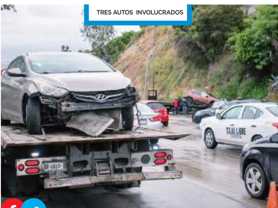
TRES AUTOS INVOLUCRADOS

El 28 de abril de 2024 se realizó la audiencia en la cual se ratificó de legal la detención del imputado y se vinculó a proceso, en esta misma, se estableció para la Fiscalía el plazo de dos meses para la investigación complementaria del caso.