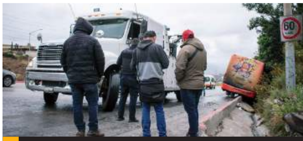
TIJUANA.- Tras chocar conductor de un tráiler a un camión de pasajeros, en el libramiento Rosas Magallón, después del impacto huyó del lugar junto con el vehículo de carga.

Ante la fuga de un conductor de los vehículos involucrados, la zona quedó resguardada por policías, mientras que peritos de Tránsito Municipal realizan las investigaciones correspondientes y un par de grúas se encargaban en retirar los vehículos de la zona.