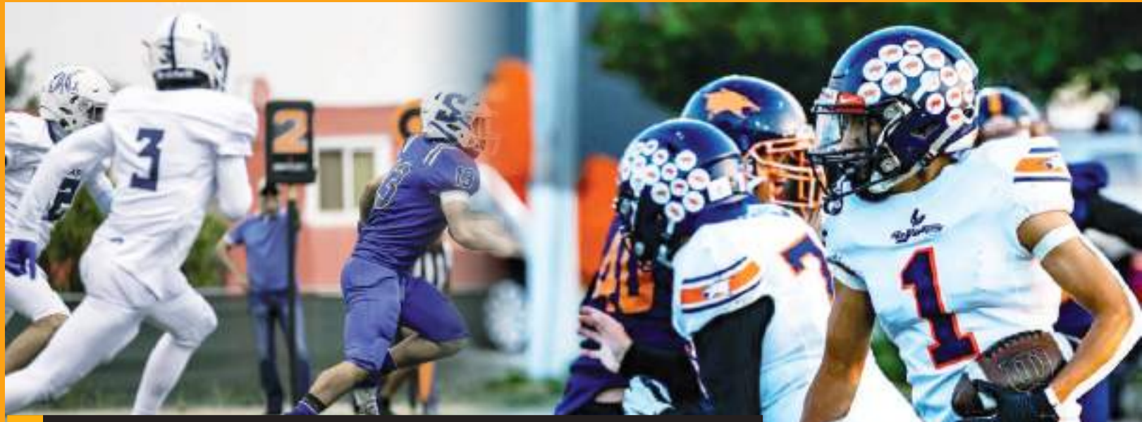
Águilas, Coyotes y Monaguillos aseguraron sede para la ronda de comodines.