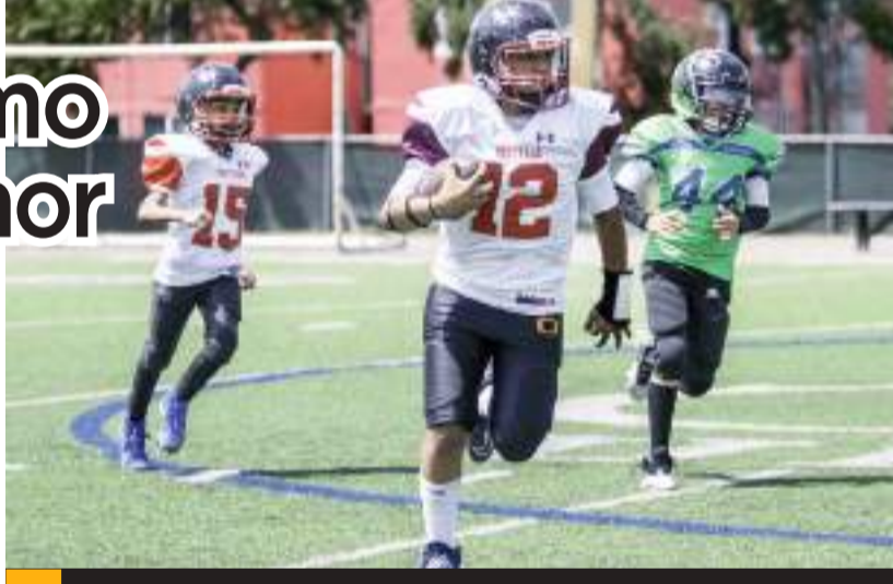
Panteras sumó seis victorias en la temporada.