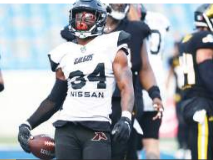
Tijuana cayó ante Fundidores en su último juego regular de la LFA.

La derrota dejó a Galgos con una marca de 3-5 en la temporada 2024 de la LFA, ubicados en la octava y penúltima posición de la tabla general. El sistema de clasificación de la liga solamente permite que avancen a postemporada los seis mejores equipos de la campaña.