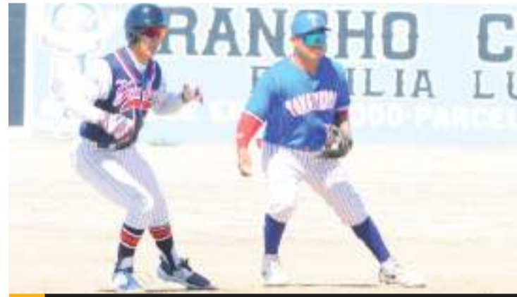
La serie fue pactada a ganar tres de cinco encuentros.

En el que fue el primer juego de la final celebrado sobre el terreno de juego del campo Raymundo Godínez, los Yankees abrieron la pizarra con una carrera en la primera entrada, pero en el cierre, Tomateros hizo 4; en la segunda Yankees emparejó la pizarra a 4, en la tercera Tomateros pintó dos más para irse arriba 6-4 y en la sexta puso dos más en la pizarra para sellar el triunfo de 8 contra 4.