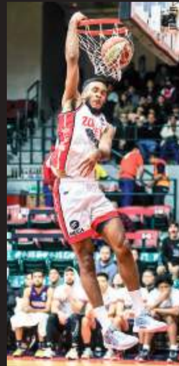
Sigue Tijuana con buen paso en la Segunda Vuelta.

Ambos equipos se enfrentaron en la Primera Vuelta de la Temporada 2024 el pasado 5 y 6 de abril en el Arena Zonkeys. En esa serie, el primer juego lo ganó