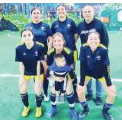
Farmacia Suprema saldrán este lunes a la cancha Urban.

El duelo estrella de la jornada será protagonizado por Alfombras Lore y Romany FC en duelo que definirá el liderazgo de la tabla de posiciones.