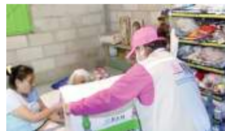
CIUDAD DE MÉXICO.- Este día el INE inicia con el voto anticipado de personas con alguna enfermedad y de quienes están prisión preventiva.

Conforme al artículo 141 de la Ley General de Instituciones y Procedimientos Electorales (LGIPE), las personas con alguna limi-