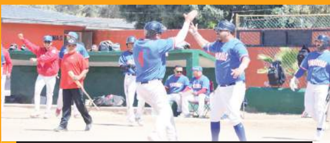
Tomateros se queda con el primer juego de la gran final de la Primera Fuerza.