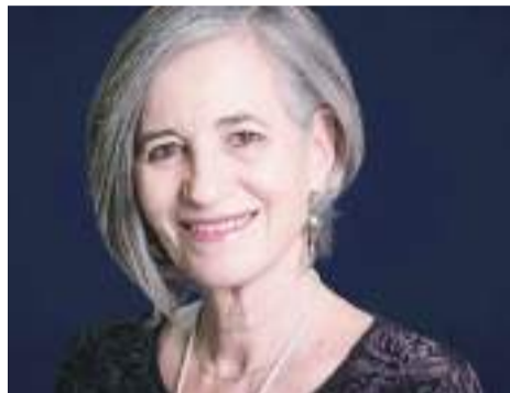
Mónica Lavín recién obtuvo el Premio Nacional Letras de Sinaloa por su trayectoria literaria.

Por cortesía de editorial Tusquets, un cuento del nuevo libro de Mónica Lavín: “El lado salvaje”. La obra, próxima a circular en librerías, explora la conducta humana ante el peligro y los fantasmas que develan los prejuicios