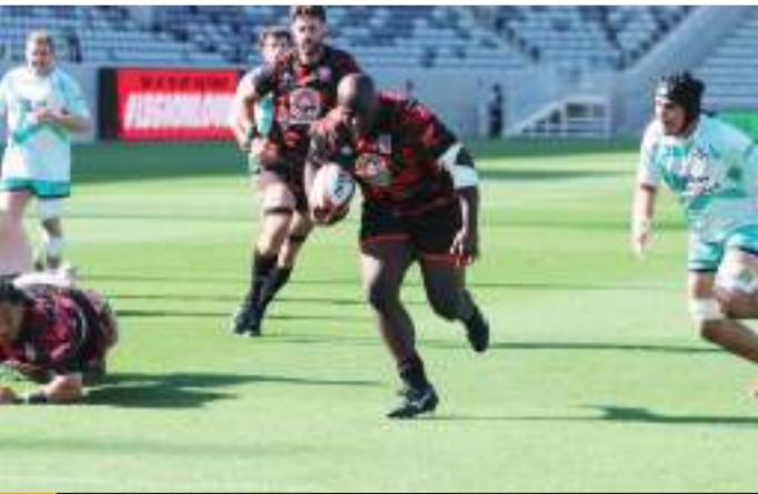
El equipo de San Diego regresó al Snapdragon Stadium.

San Diego descansará el siguiente fin de semana y volverá a la acción en la Fecha 12 de nuevo en el Snapdragon Stadium. Legion recibirá a New England Free Jacks el 19 de Mayo en Mission Valley.