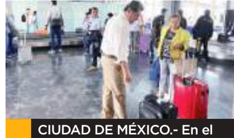
CIUDAD DE MÉXICO.- En el primer trimestre de 2024, se transportaron 30 millones 136 mil pasajeros, de los cuales 14 millones 112 mil fueron en vuelos nacionales, y 16 millones 23 mil, en vuelos internacionales.

Las aerolíneas con mayor flujo de pasajeros en vuelos nacionales de enero a marzo de 2024, fue-