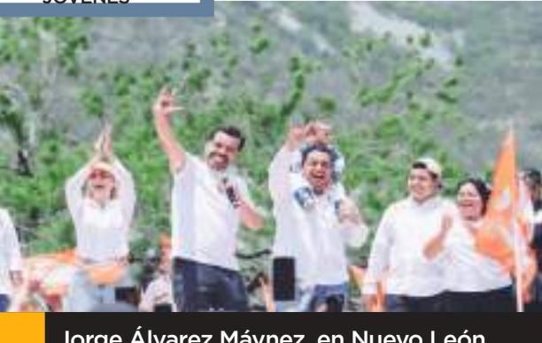
Jorge Álvarez Máynez, en Nuevo León.