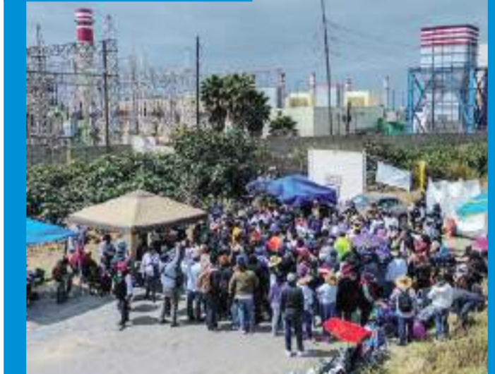
POBLADORES DEL MACLOVIO

PARTIERON DE LA ZONA ESTE, AYER Desde las 6:30 horas los protestantes iniciaron la movilización, una caravana de autos partió desde la Zona Este de Tijuana hacia Playas de Rosarito.