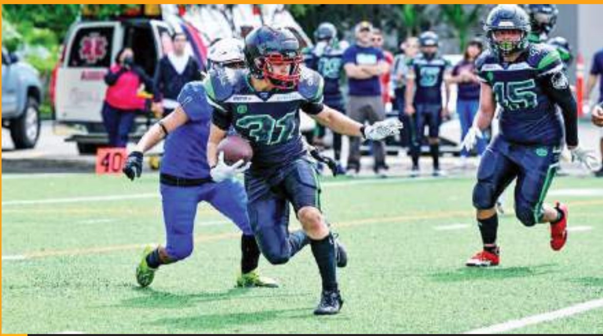
La postemporada arranca hoy a las 19:00 horas.