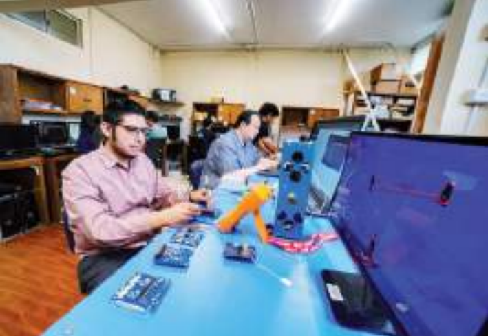
MEXICALI.- La formación docente busca multiplicar los conocimientos para formar una nueva generación de talento y fortalecer la competitividad de la región.

Deben tener dominio idioma inglés, contar con disponibilidad para dedicar 6 a 8 horas a la semana y el compromiso para transmitir el conocimiento adquirido, facilitando procesos de formación a futuros estudiantes dentro de la universidad, así como a futuras generaciones de este programa. La convocatoria y toda la información se encuentra en https://semiconductoresbc.emtech.digital/