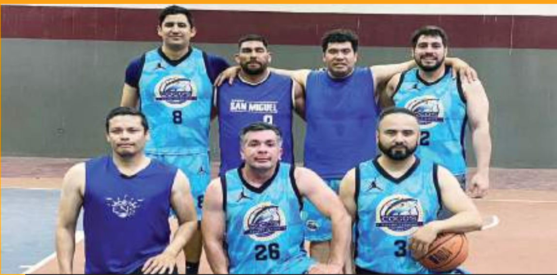
Cocos Sportfishing ganó por 38-30 sobre el Cetys.