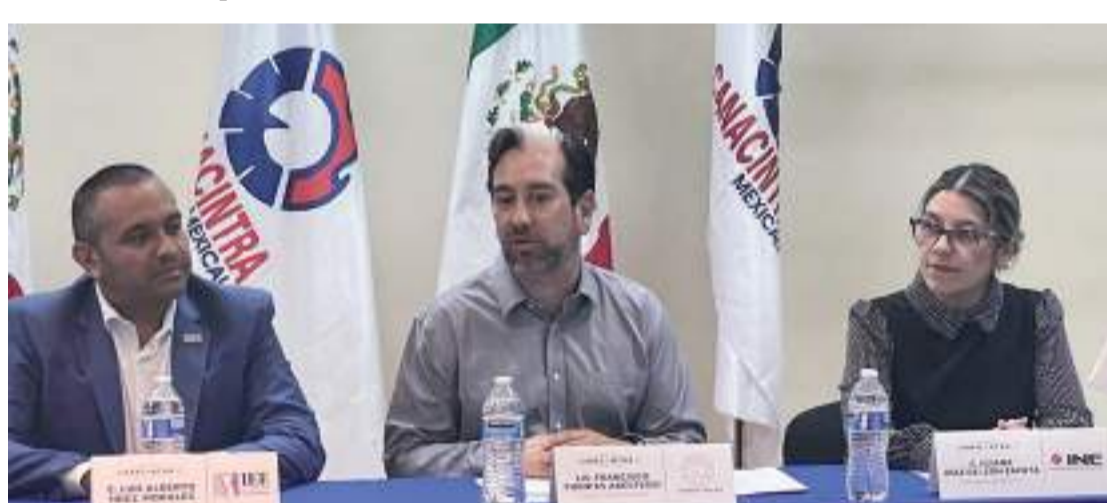
MEXICALI.- CANACINTRA Y EL IEEBC trabajando juntos para aumentar la participación ciudadana este 2 de junio.

“Queremos involucrar a los diversos sectores patronales en la promoción del voto, ya se firmó convenio con INDEX, CANACO el Consejo Coordinador empresarial y hoy toca el turno de CANACINTRA”, dijo el funcionario electoral.