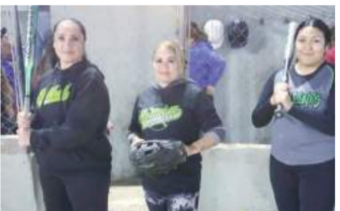
Anzaldos Team se impuso 12-9 a las Tóxicas.