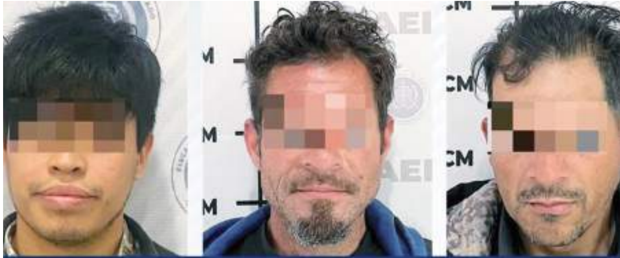
PLAYAS DE ROSARITO.- Tras denuncias ciudadanas, agentes de la FGE aseguraron en este municipio a un "violín" y dos "chiquinarcos".