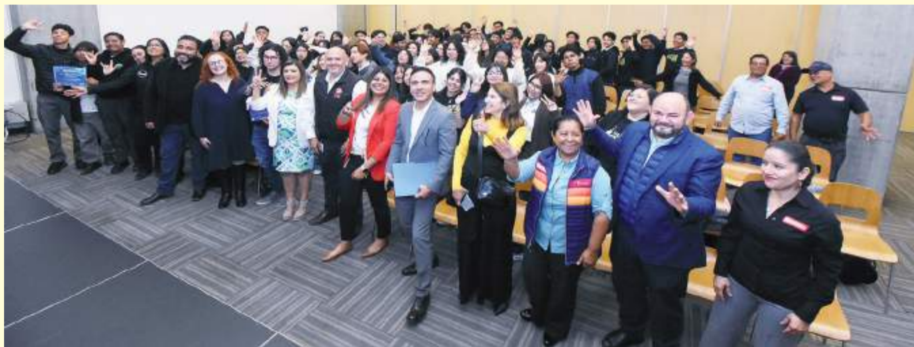
La asociación civil COSTASALVAJE realizó un concurso de video para estudiantes de preparatoria, universitarios y público en general con motivo del Día Mundial del Agua.