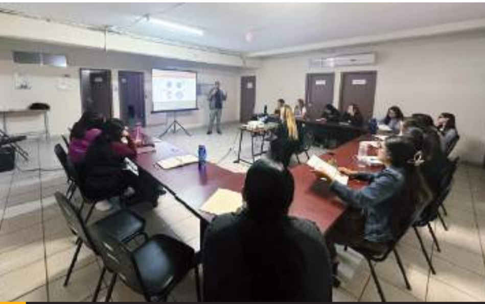
TIJUANA.- IMMUJER inició el plan de trabajo con la finalidad de prevenir la violencia y discriminación.

PERSONAL SE CAPACITA EN LENGUAS DE SEÑAS MEXICANAS