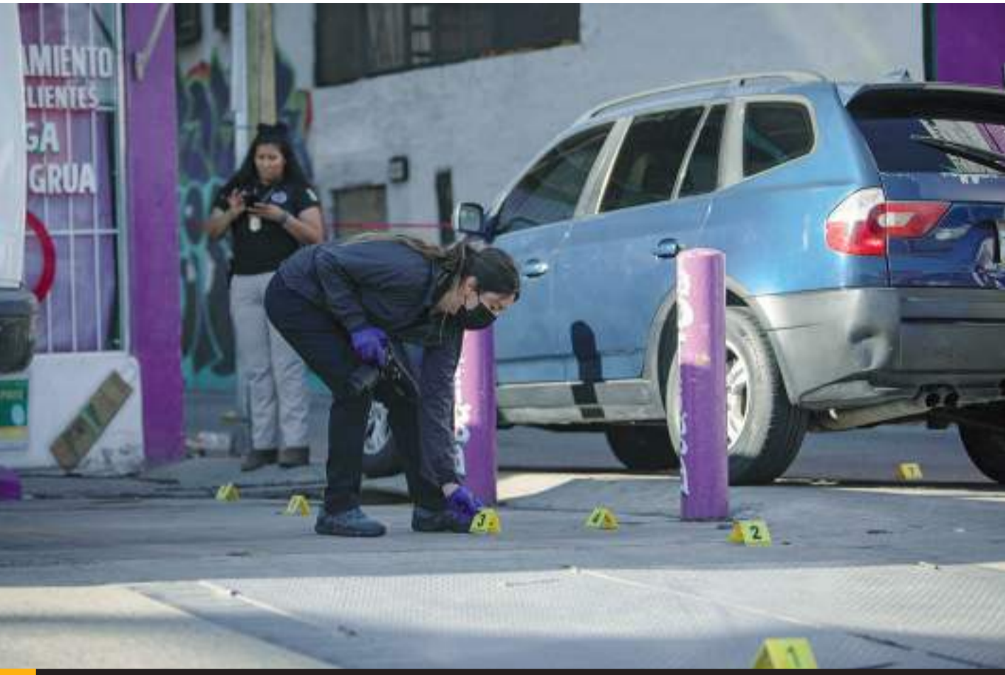
TIJUANA.- Un hombre, del cual se desconocen sus datos generales hasta el momento, fue atacado a balazos cuando se encontraba en la colonia Zona Norte; recibió 7 impactos de bala.