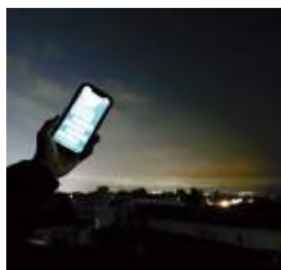
El Cenace declaró Estado de Emergencia en el país, a causa de los apagones.