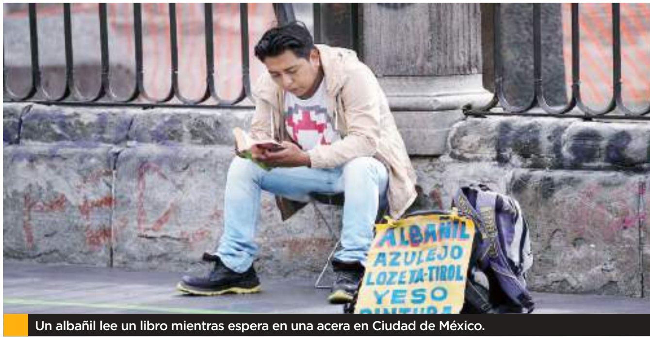
Un albañil lee un libro mientras espera en una acera en Ciudad de México.

Es posible que la visibilidad mediática dada al hecho por todos los grandes medios de prensa, radio y televisión, que ha creado una corriente nacional de solidaridad, se haya debido a que, al descubrir la escritora en el hospital su estado físico real, en vez de desesperarse, haya reaccionado con el grito: "Lucharé como una poeta". Y al saber que había perdido el brazo con el que había alimentado ya a tres generaciones de niños con sus más de cien publicaciones de poesías anunció que