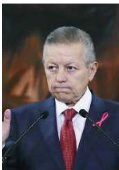
Audios difundidos por Televisa, vinculan a Zaldívar con presiones de la 4T a jueces.