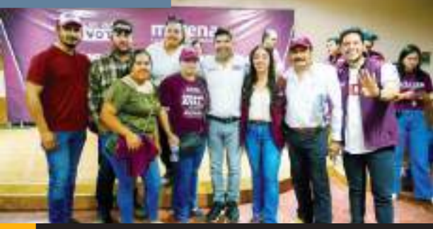
MEXICALI.- Los aspirantes al Senado se reunieron con docentes en el Valle.