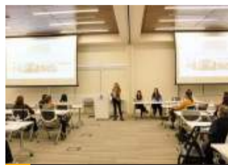
SAN DIEGO, CA.- El CEJUM participó en el evento titulado "Entrenamiento de Conceptos Esenciales de Violencia Doméstica, una capacitación fundamental para profesionales y la comunidad".

COLABORACIÓN CON ONE SAFE PLACE, THE NORTH FAMILY JUSTICE CENTER, EL CONSULADO GENERAL DE MÉXICO EN SAN DIEGO Y LA FISCALÍA DEL DISTRITO DE SAN DIEGO