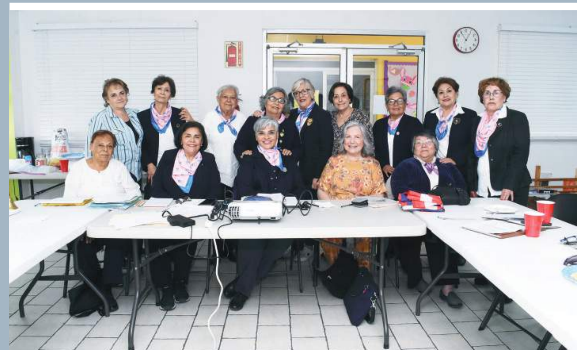
Amena reunión tuvieron las damas integrantes de los clubes Soroptimistas Internacional Tijuana Río y Centro.