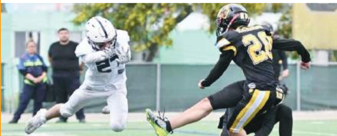
El tercer Wildcard será el sábado a las 15:00 horas.

Estos equipos no se vieron en la temporada regular donde el ataque de Monaguillos no fue tan fuerte como aquel del Centro de Enseñanza Técnica y Superior (Cetys), campus Ensenada, al tener los cachanillas 88 comparado con 126 de Zorros.