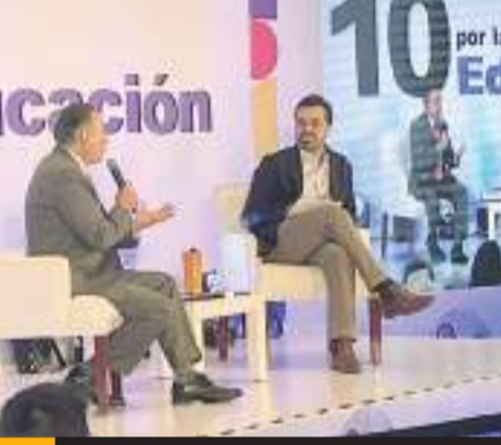
El candidato de MC se lanzó contra las universidades del Bienestar.