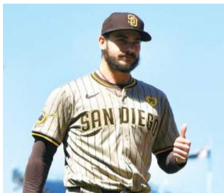
Los Padres propinaron su segunda blanqueada de la campaña.