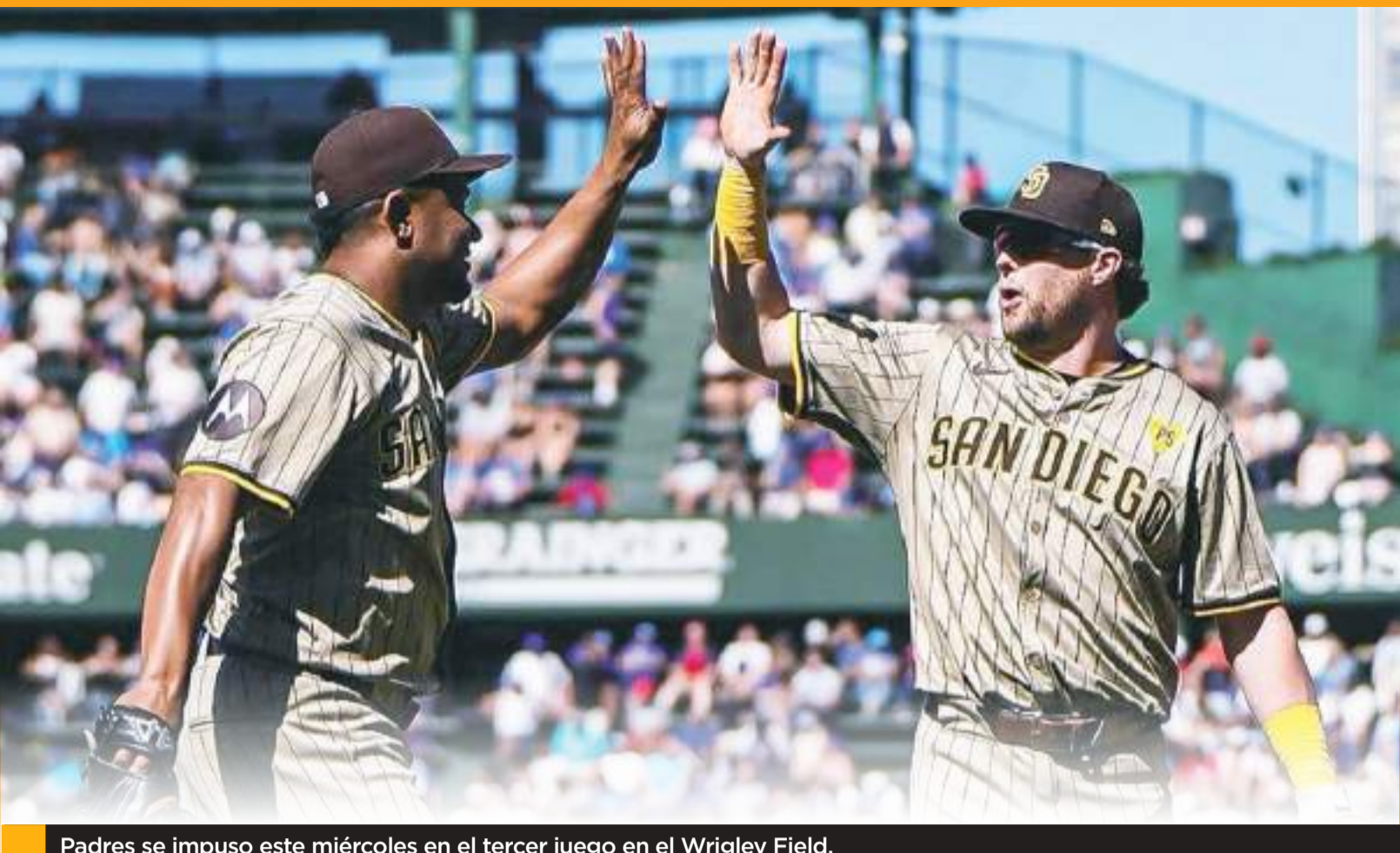
Padres se impuso este miércoles en el tercer juego en el Wrigley Field.