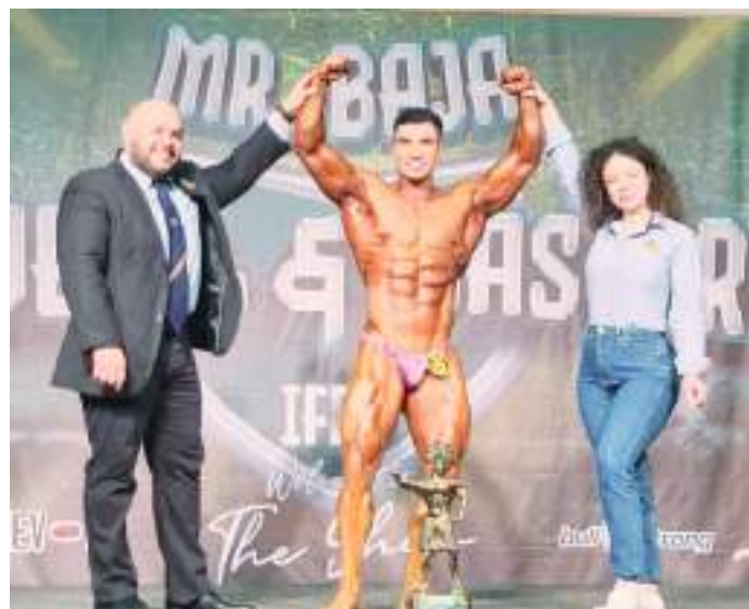
Los representantes del Estado 29 tienen posibilidades de los primeros lugares.