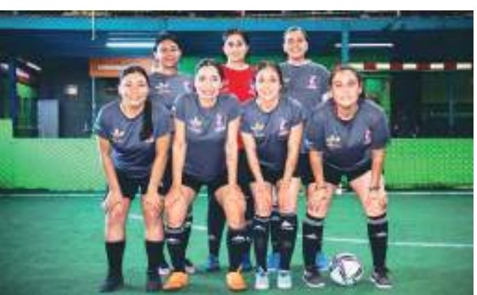
Farmacia Suprema es sublíder con 15 unidades.