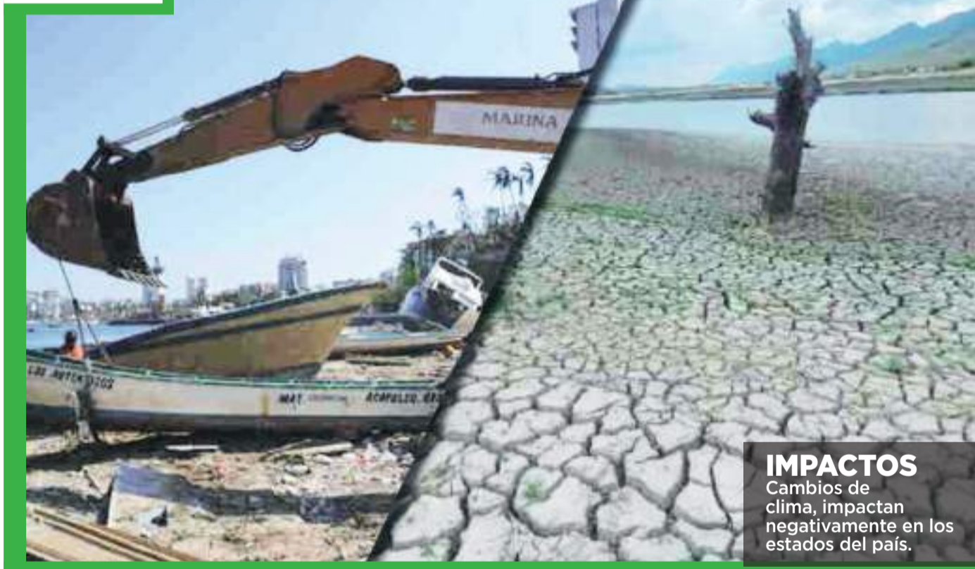
IMPACTOS Cambios de clima, impactan negativamente en los estados del país.