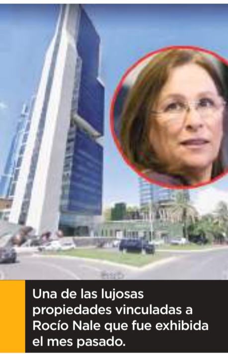
Una de las lujosas propiedades vinculadas a Rocío Nahle que fue exhibida el mes pasado.