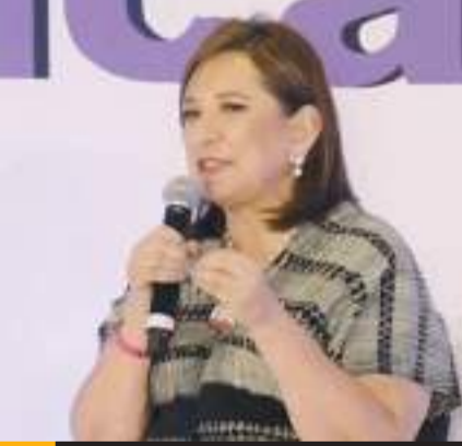
Destacó Gálvez que la CFE no puede satisfacer la demanda de energía eléctrica.

"Hay que hacer varias cosas, una hacer la línea de transmisión del Istmo de Tehuantepec hacia el centro del País, ahí hay tres gigas de generación de energíarenovable que se pueden integrar al sistema de una manera bastante rápida; traer