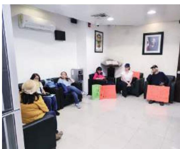
MEXICALI.- Maestros jubilados del COBACH exigen a las autoridades les paguen jubilaciones.

Esta experiencia educativa, fue aprovechada por estudiantes de la UABC, lo que les permitirá contar con una visión integral de la importancia del tratamiento de aguas residuales y el impacto que tiene en la preservación del medio ambiente y la salud pública en Mexicali.