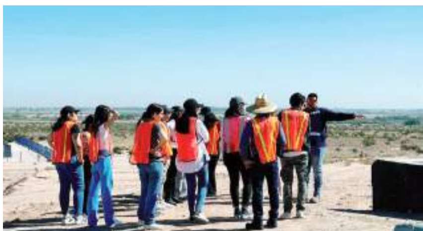
MEXICALI.- Estudiante y académicos de la UABC realizaron un recorrido por las instalaciones de la Planta de Tratamiento “Las Arenitas”, con el objetivo de conocer el proceso de tratamiento de aguas residuales en esta ciudad.

“Las Arenitas” no solo es una planta de tratamiento, también es un parque ecológico que cuenta con un humedal integra-