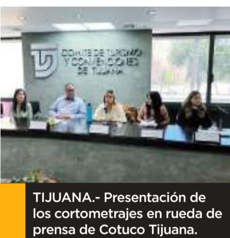
TIJUANA.- Presentación de los cortometrajes en rueda de prensa de Cotuco Tijuana.