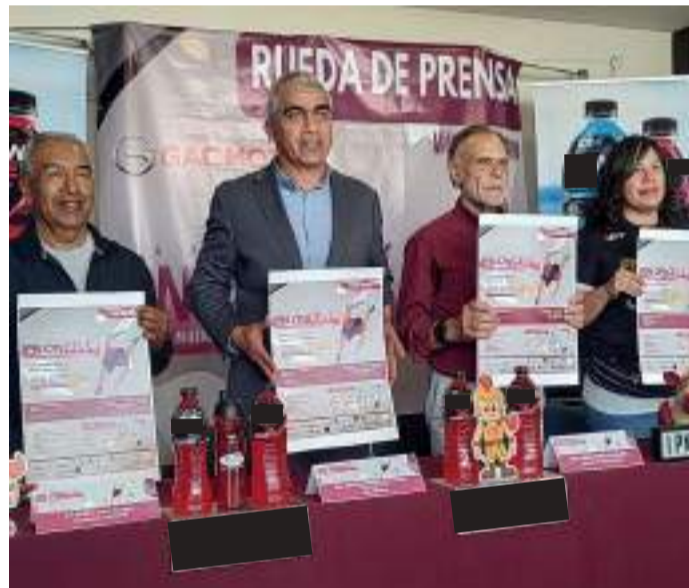
La carrera se realizará el 19 de mayo.

El viernes 17 de mayo, 10:00 am a 6:00 pm se entregarán los kits de corredor, mientras que el sábado se realizará de 10:00 am a 2:00 pm, incluida venta de números.