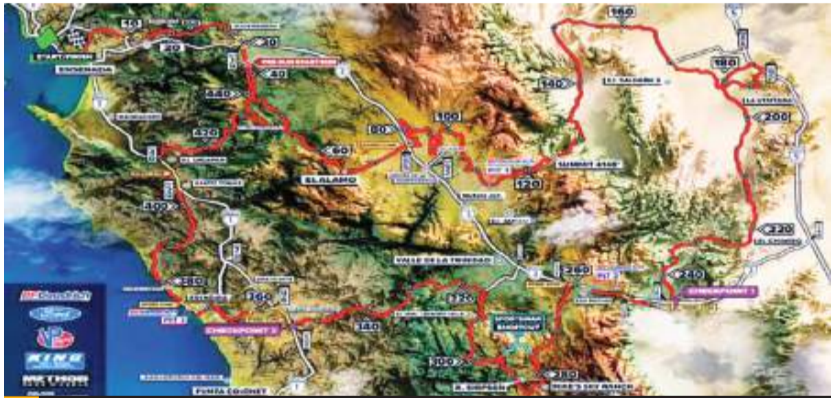
La ruta de 483.06 millas iniciará y terminará en el bulevar Costero de Ensenada.