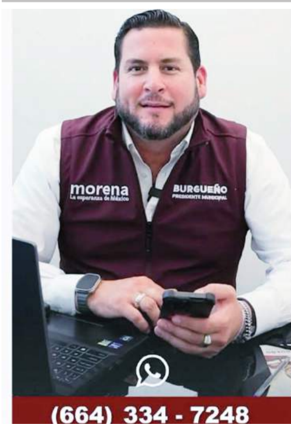
TIJUANA ISMAEL BURGUEÑO RUÍZ...

Y vamos hasta el Estado de Veracruz, donde Junto a ROCÍO NAHLE , candidata a gobernadora de ese Estado, CLAUDIA SHEINBAUM PARDO , candidata a la Presidencia del país por la Coalición "Sigamos haciendo historia", reiteró que en la Cuarta Transformación no se hacen promesas, sino compromisos, y por eso se comprometió con el pueblo de Zongolica a seguir avanzando con los programas sociales, la creación de caminos artesanales y la construcción de sus dere-