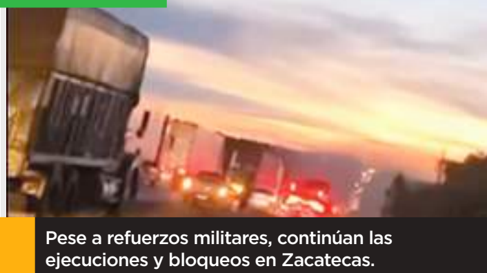
Pese a refuerzos militares, continúan las ejecuciones y bloqueos en Zacatecas.