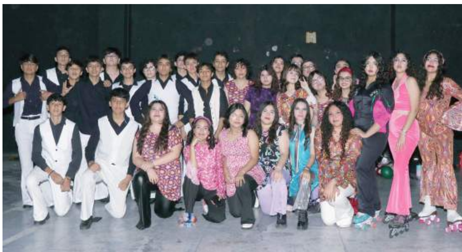
Alumnos del Grupo de tercero C.

EN EL MARCO DEL 55 ANIVERSARIO DEL PLANTEL EDUCATIVO