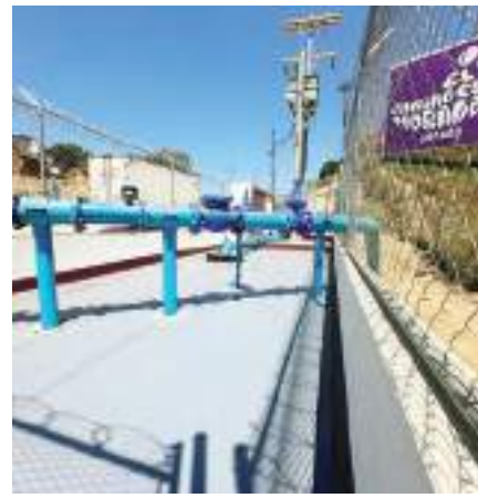
014, un saneamiento efectivo del vital líquido, entre otras alternativas, sobre todo para beneficiar a los hogares de la entidad.(bpa)

Mencionó, a manera de ejemplo, la serie de estrategias y políticas públicas que se han puesto en marcha por parte de la mandataría, a través de la búsqueda de nuevas fuentes, acuerdos institucionales con el Distrito de Riego