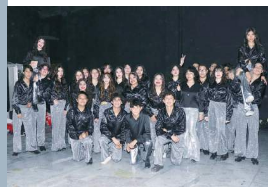
Estudiantes del Grupo de tercero D.