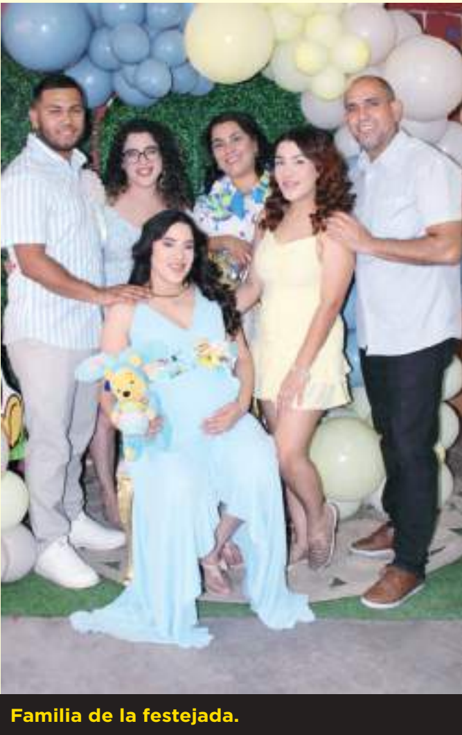
Familia de la festejada.