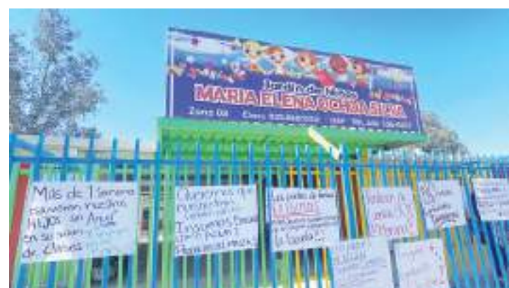
MEXICALI.- Exhiben padres de familia otra denuncia contra manejo irregular de directivo de un plantel.