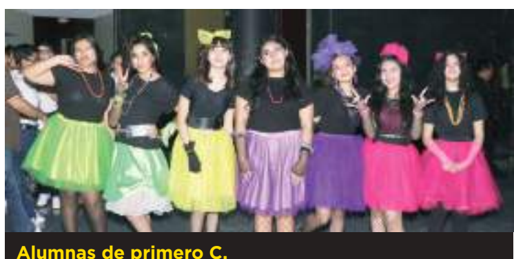
Alumnas de primero C.