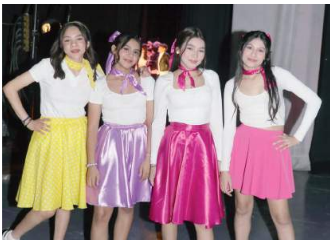
Alumnas de Segundo C.