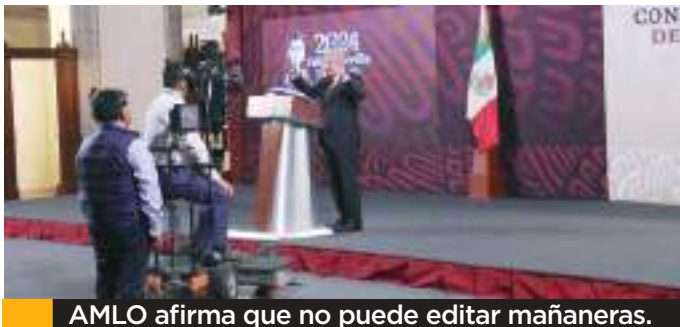
AMLO afirma que no puede editar mañaneras.