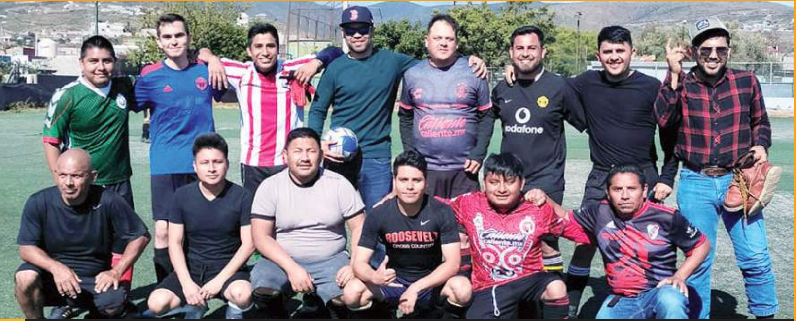
Son diez las escuadras que participan en el torneo de futbol 7 de la Nueva Liga Empresarial de Pórticos.