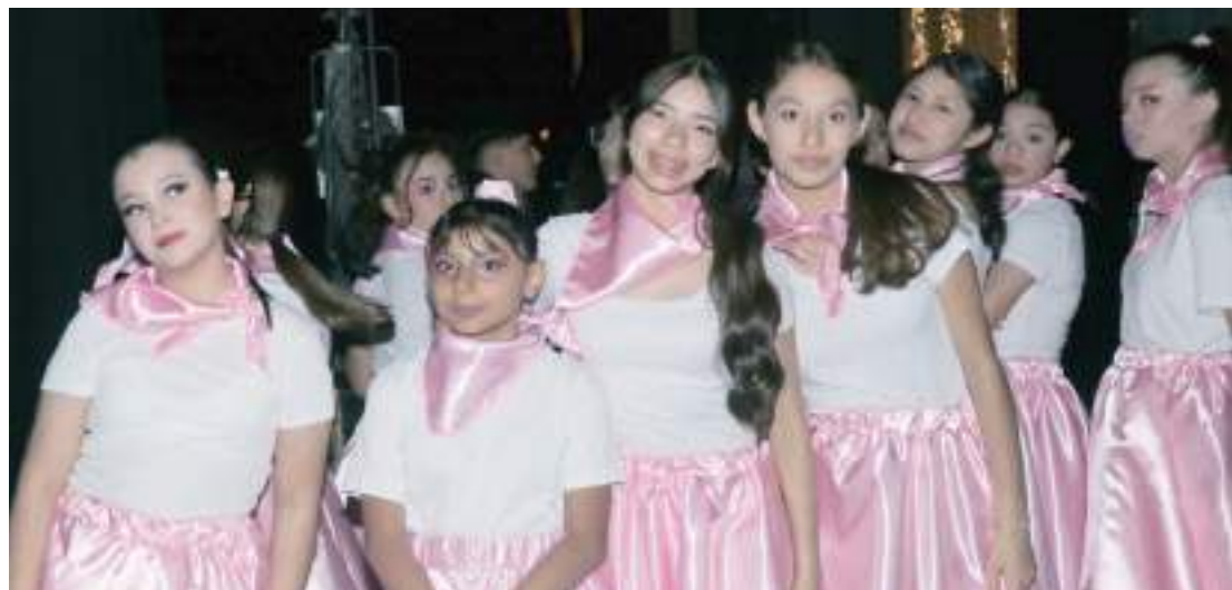
Alumnos del Grupo de primero B.