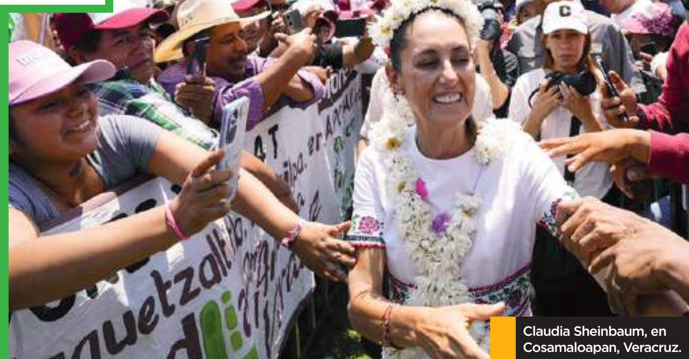
Claudia Sheinbaum, en Cosamaloapan, Veracruz.