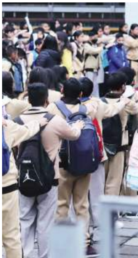
Ordena juez a SEP concretar trámites para participar en la prueba PISA.