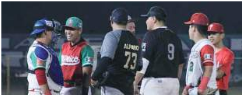
Angelitos del KM6 se apuntaron el triunfo 16-4 sobre Panteritas.