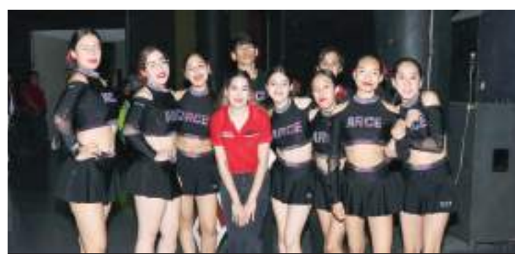
Grupo de porra.