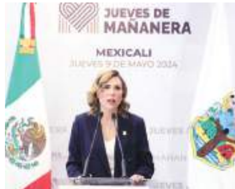
MEXICALI.- Confianza pide la Gobernadora Marina del Pilar a maestros del COBACH, en el pago de jubilaciones.

De igual manera, se presentó un resumen sobre la actividad de proyectos desde la última reunión del Consejo en noviembre de 2023, con aprobación por parte del Consejo Directivo de financiamiento en crédito y recursos no reembolsables por 144.4 millones de dólares para nueve nuevos proyectos, incluyendo uno aprobado el día de hoy.