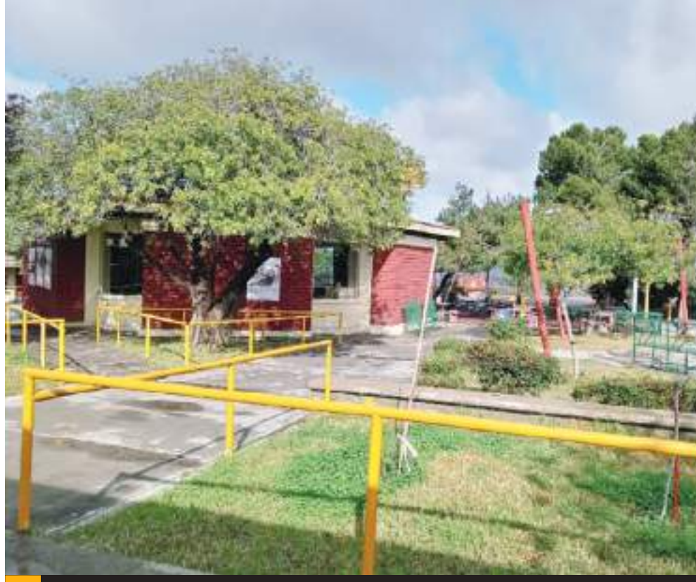
T IJUANA.- Este viernes 10 de mayo habrá suspensión de clases para los alumnos de las 14 escuelas municipales.

De esta forma, el Gobierno Municipal dio a conocer que los alumnos de las escuelas municipales retomarán sus actividades escolares de manera normal, el lunes 13 de mayo.