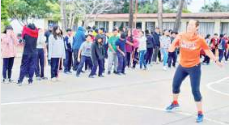
Participaron 250 alumnos de la Escuela Gral. Federico Chapoy.