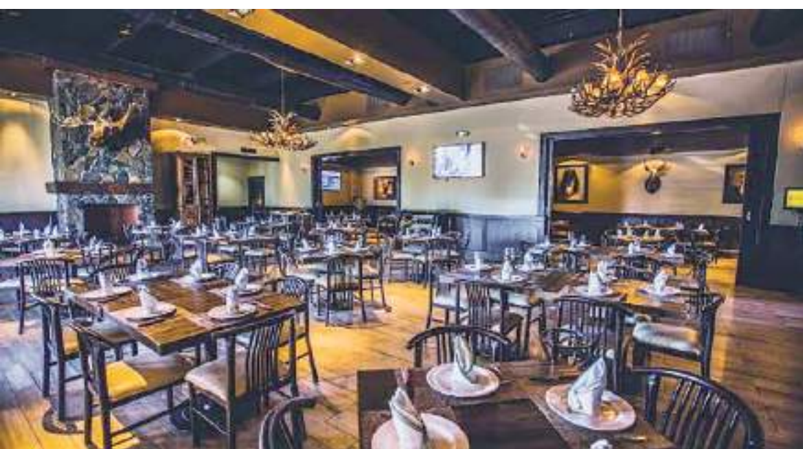
MEXICALI.- El sector restaurantero espera un importante aumento en ventas por el Día de las Madres.

En otro tema, Roxana Ramos expresó que los restaurantes agremiados ya preparan promociones a las personas que acudan a votar el domingo 2 de junio.