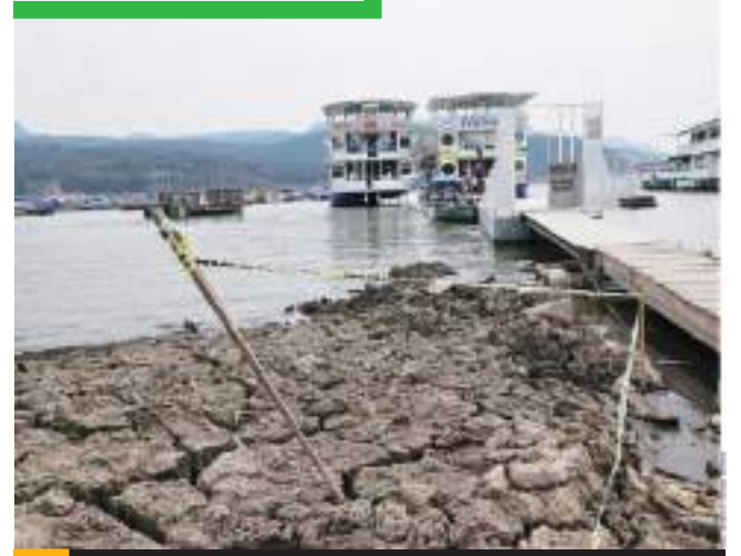
El calor, y la falta de lluvias en México, se ubican encima del promedio histórico.