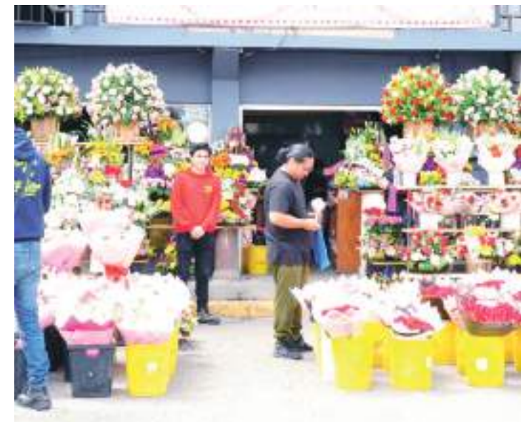
TIJUANA.- Florerías, uno de los giros más beneficiados con el Día de las Madres.