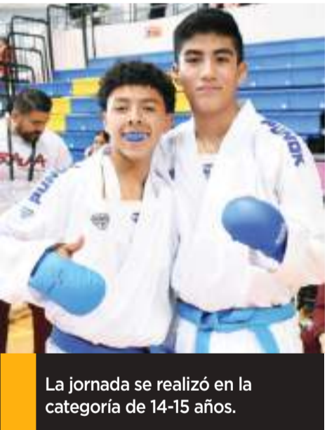
La jornada se realizó en la categoría de 14-15 años.