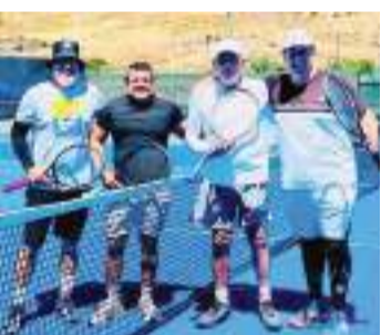
Los tenistas de Vallarta llegaron al puerto para una serie de cuatro días.