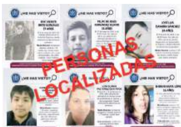
TIJUANA.- En distintas acciones de los elementos de la FGE fueron localizadas 6 personas que habían sido reportadas desaparecidas, fueron encontradas en buen estado de salud.