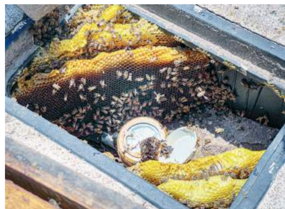
ENSENADA.- Ha implementado la CESPE acciones para la preservación de enjambres de abejas que regularmente se alojan en los registros que resguardan los medidores de agua en los domicilios.