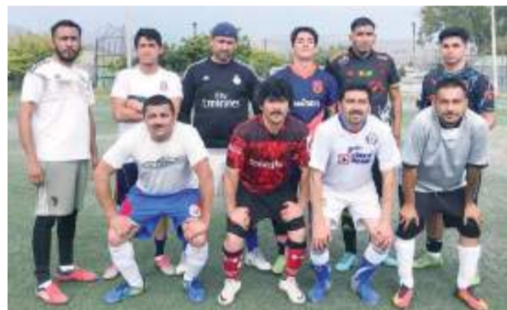
Tremendos duelos se esperan este domingo en la fecha 11.