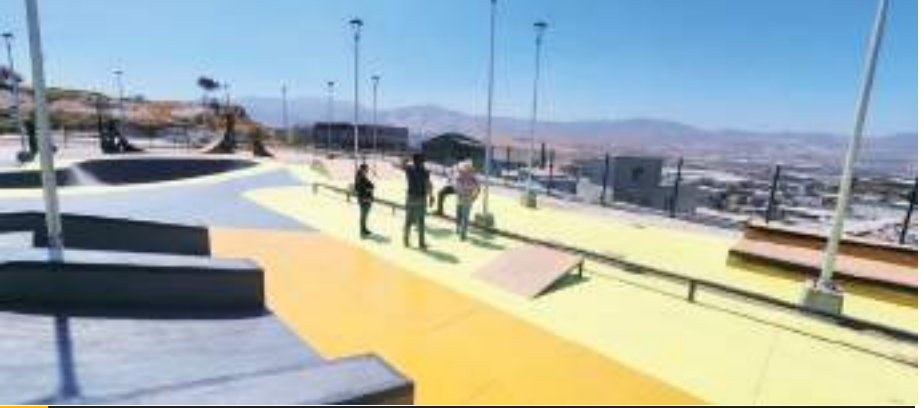
TIJUANA.- A través de la Subdirección de Obras y Concesiones, la Sindicatura Procuradora se ha hecho presente en la Entrega-Recepción de diversas obras en el parque de las Abejas.