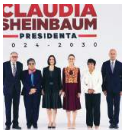
CIUDAD DE MÉXICO.- Claudia Sheinbaum, presentó la segunda parte de su gabinete.