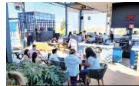
ENSENADA.- Es el turismo la oportunidad de impulso y retos en movilidad para Ensenada.

El experto en planeación estratégica advirtió que, en el apartado eléctrico, es necesario pensar en las necesidades futuras, toda vez que las necesidades actuales de la ciudad mantienen la demanda deprimida. "Es necesario planear con base en la demanda futura, cogeneración y autogeneración, involucrar al gobierno federal y estatal con las perspectivas de crecimiento del municipio.