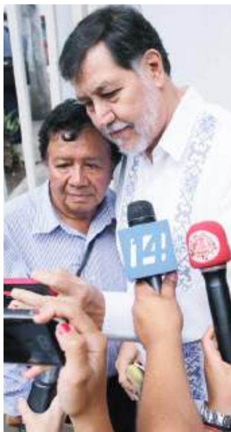
Fernández Noroña reclama ahora a AMLO, que deje fuera a sus aliados políticos.

Noroña, todavía representante del Partido del Trabajo (PT) en el Instituto Nacional Electoral (INE), acudió hoy al recinto del árbitro electoral con un discurso que leyó a la prensa antes de arrancar la sesión del consejo general.