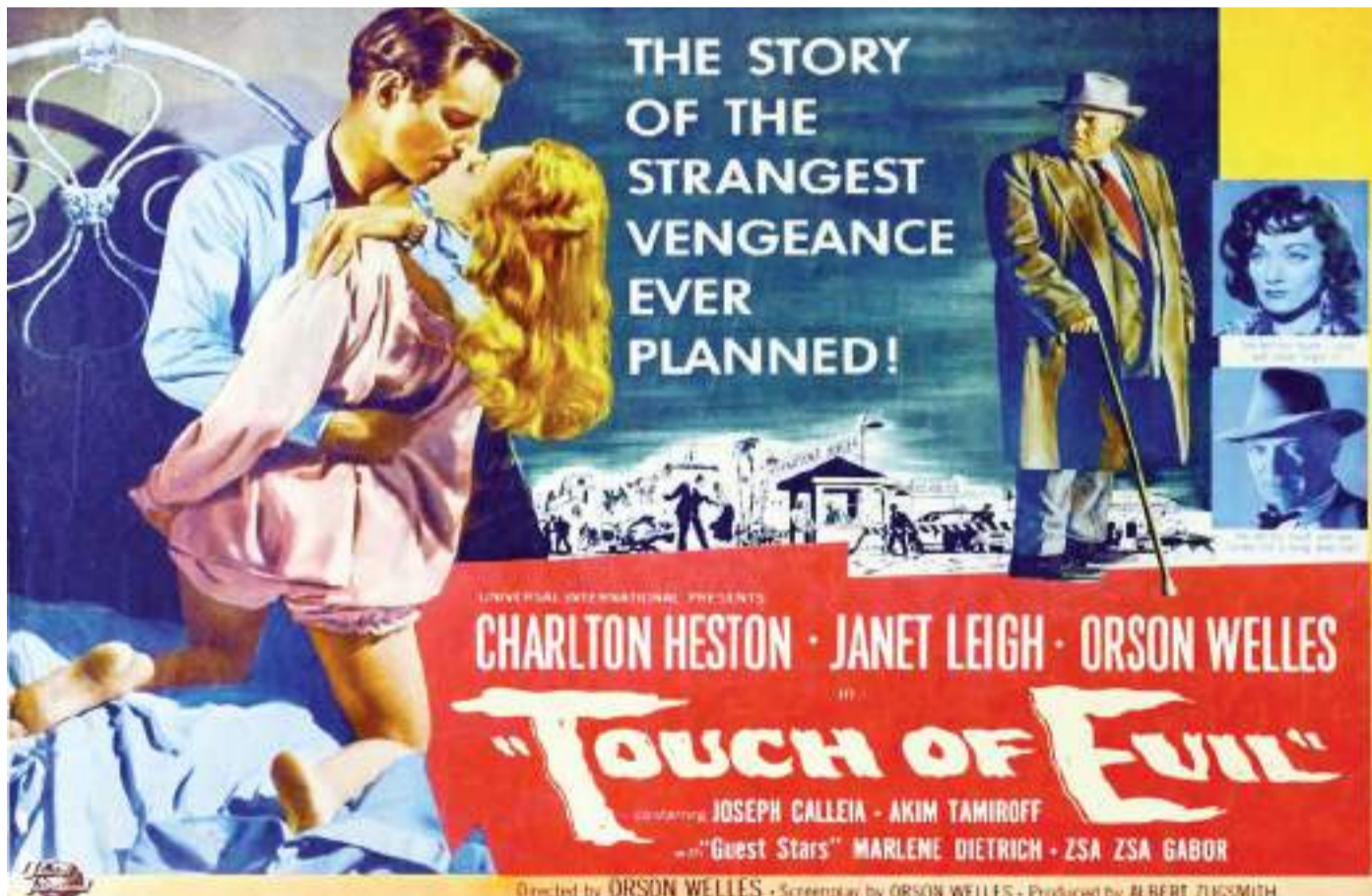
Sed de maldad (1958), película de Orson Welles.

Brad no pidió ninguna opinión cuando les comunicó que la filmación debía suspenderse por al menos tres semanas. Jennifer regresó a San Diego y por varios días ignoró los correos y las llamadas de Mario. Brad nunca la había llamado personalmente. Tenía que pensar claramente lo que debía hacer. Antes de su experiencia en Oldtown , nunca había reflexionado acerca de lo que significaba pertenecer a dos culturas distintas. A decir verdad, lo no se había detenido a analizar el personaje tan abaratado que Brad Stormer le había dado para su película. Estaba tan emocionada por su primer protagónico que no le había dado tiempo de cavilar sobre el papel del cine en el ámbito socio-