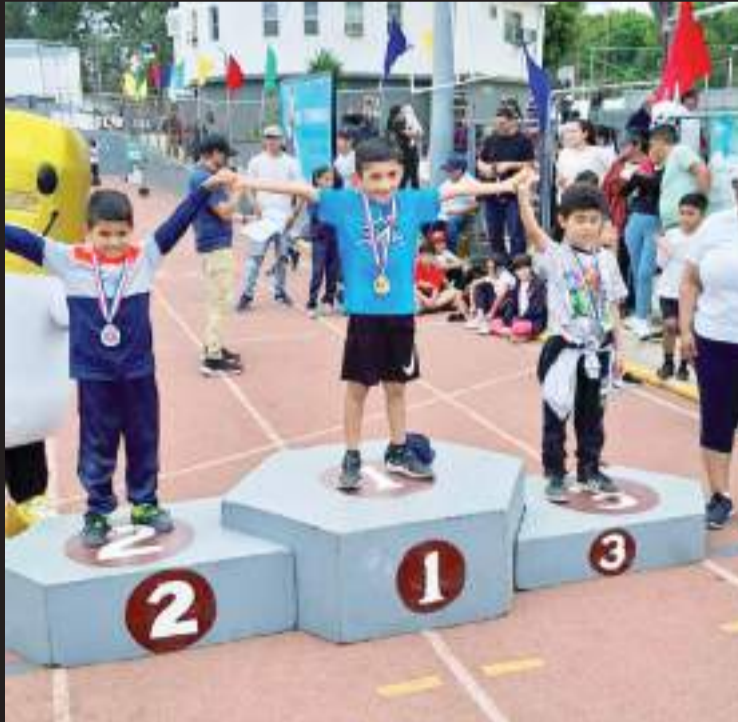
Las actividades incluyeron carreras recreativas.