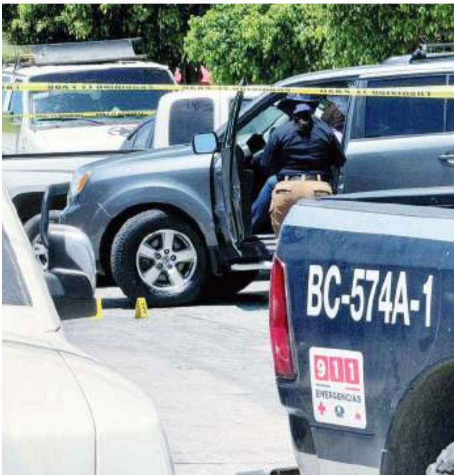
TIJUANA.- La víctima fatal fue atacada a balazos antes del mediodía de ayer cuando intentaba salir en su camioneta de su domicilio en la colonia Obrera.

Ante lo ocurrido, la zona quedó debidamente resguardada por agentes de distintas corporaciones de seguridad pública, en lo que peritos y detectives de la Fiscalía Regional de Tijuana procesaban la escena.