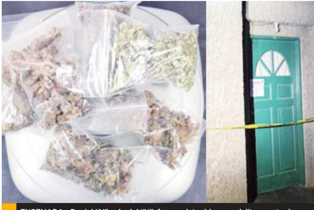
ENSENADA.- Daniel "N" y Audel "N", fueron detenidos por delitos contra la salud en modalidad de narcomenudeo.