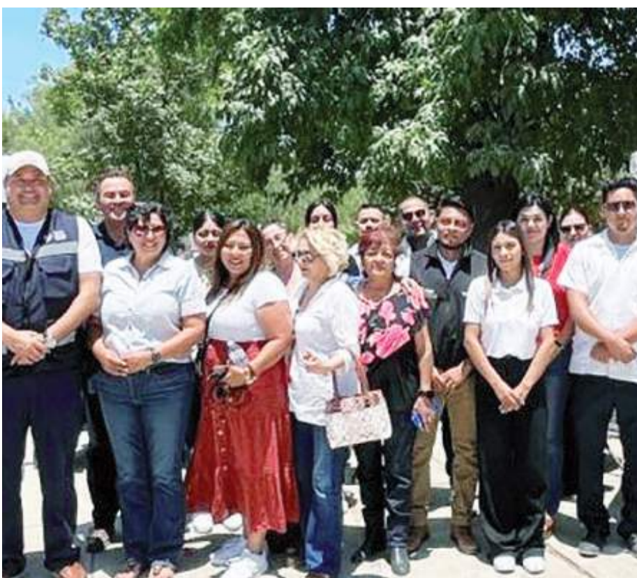
ENSENADA.- Una jornada comunitaria para llevar sus servicios a las poblaciones rurales, llevó a cabo la CEDH-BC a la delegación municipal El Porvenir del Valle de Guadalupe.