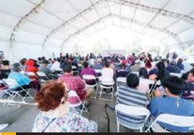
TIJUANA.- Más de medio millón de pesos en apoyos económicos a personas vulnerables entregó la Alcaldesa Montserrat Caballero Ramírez.

programa Construyendo Bienestar para Todos, donde además de apoyo económico, se brinda atención médica, pies de casa y material de construcción.