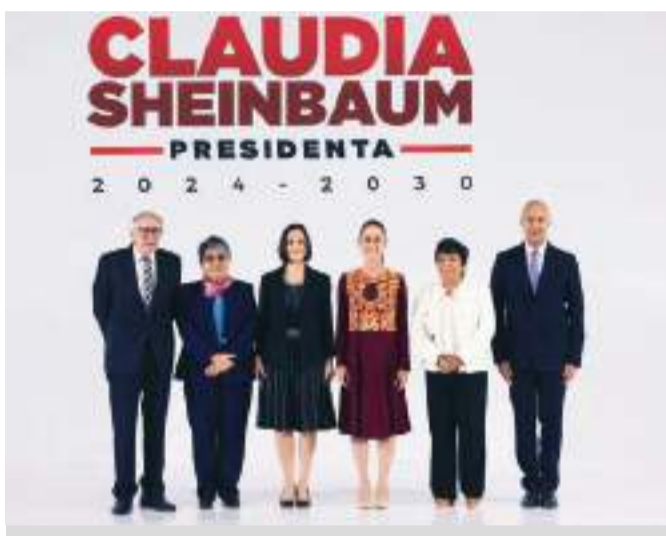
TIJUANA CLAUDIA SHEINBAUM PARDO...

La titular reafirmó que el CEJUM está para apoyar a