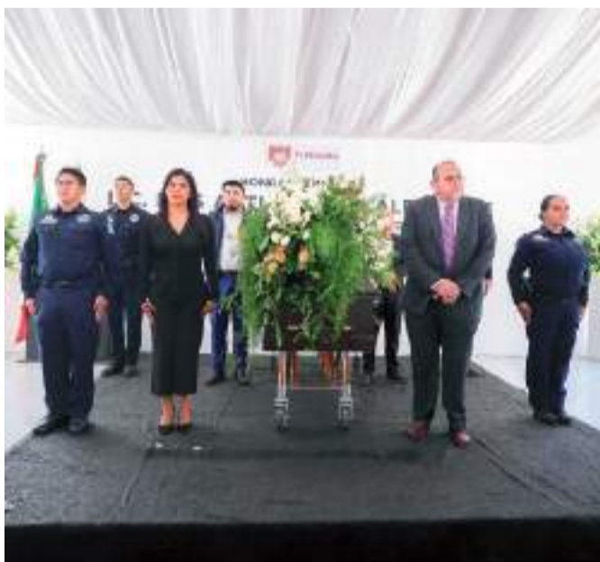
TIJUANA ARTURO GONZÁLEZ CRUZ...

Tres hombres y tres mujeres fueron presentados como parte del segundo bloque del gabinete que acompañará a CLAUDIA SHEINBAUM PARDO, virtual Presidenta de México durante el arranque de su gobierno, que inicia funciones el próximo 1 de octubre.