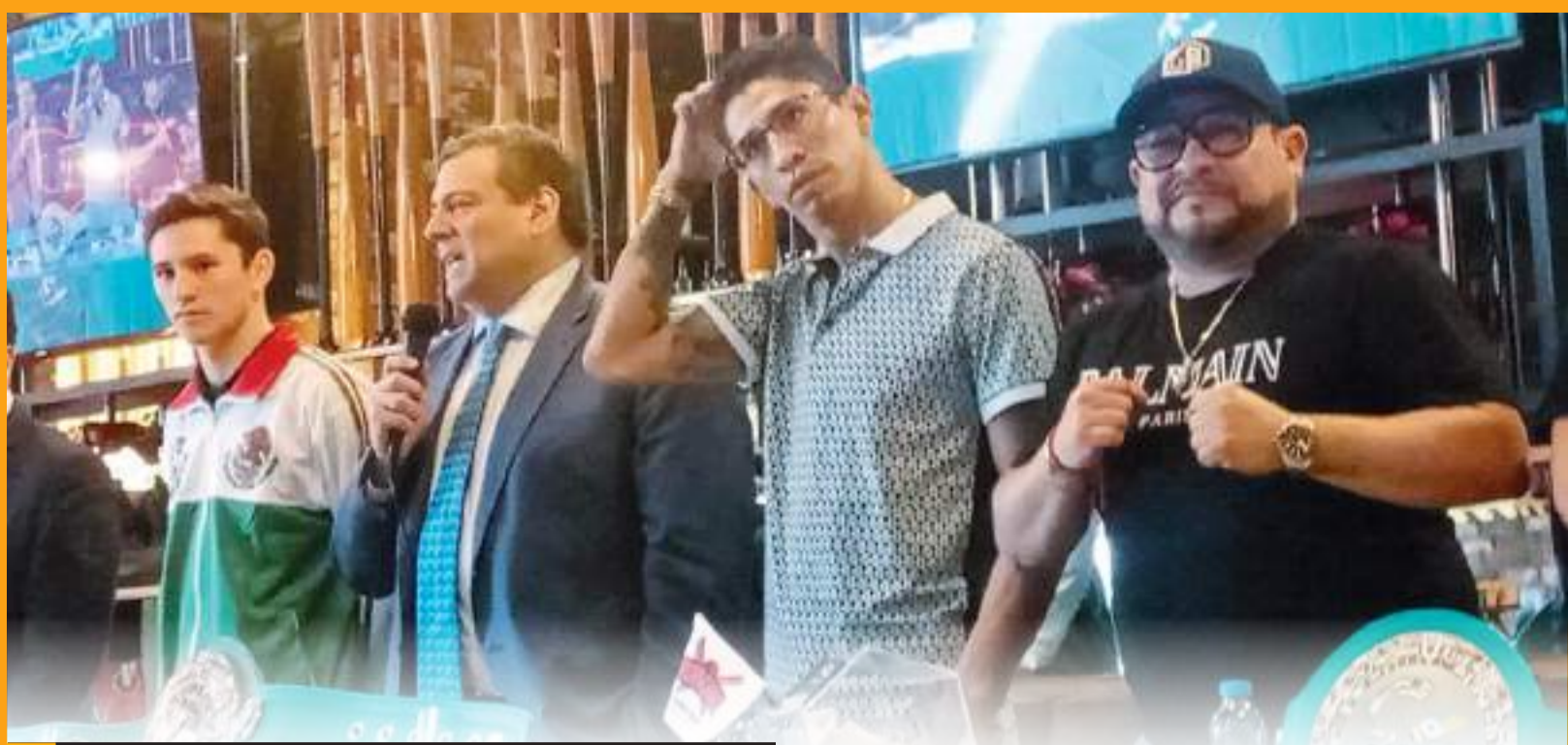
Las actividades comenzarán este sábado con el pesaje.

Antes de regresar a Miami, las próximas tres Series del Caribe se jugarán de la siguiente manera: el 2025 en Mexicali, México; el 2026 en San Juan, Puerto Rico; y el 2027 en Hermosillo, México.