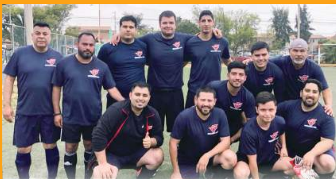
Sellos, Mezclados y Arsenal mantienen cerrada lucha en la Liga Empresarial.