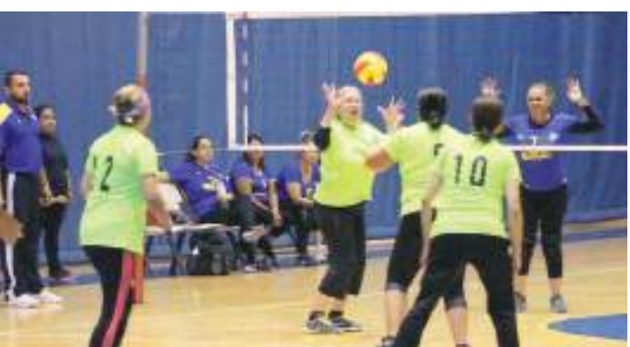
Participarán equipos de Tijuana, Ensenada, Rosarito y Mexicali.

Las ganadoras de los tres primeros lugares de cada una de las categorías estarán siendo premiadas con trofeo.