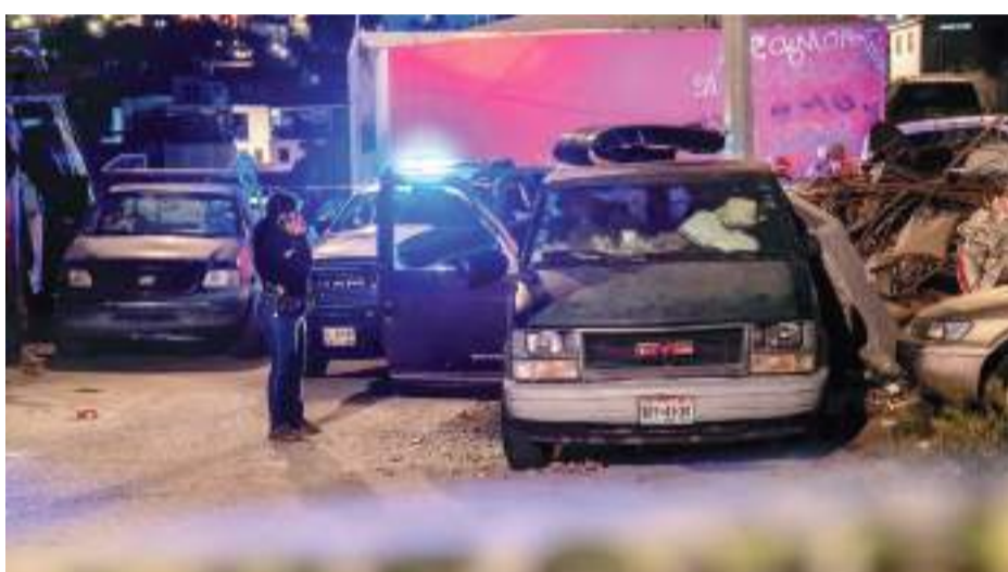
TIJUANA.- Cinco personas fueron agredidas a balazos durante la noche del sábado, en distintos puntos de esta ciudad, acciones de sangre que dejaron como saldo a tres hombres sin vida, otro herido junto con una mujer.

preventivas atendieron otra agresión armada, en esta ocasión, los o el agresor terminaron con la vida de un sujeto, esto entre el callejón Quintana Roo y la calle Ignacio Zaragoza, colonia Zona Centro.