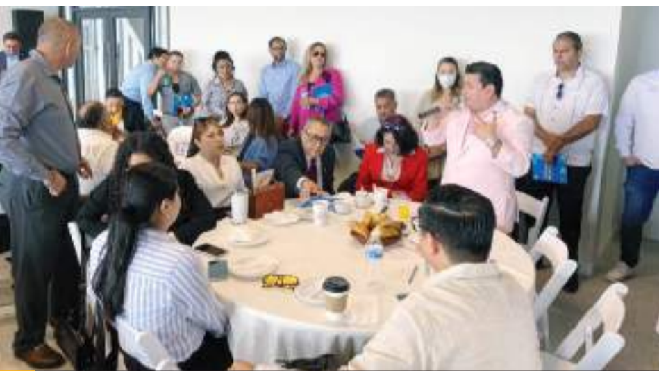
MEXICALI.- Se realizó el evento "Statistics Day", en el que se analizó el comportamiento del mercado inmobiliario en el corredor costero.

Reiteró que la Secretaría de Salud mantiene estos servicios disponibles en todo el Estado, para la población que los requiera, durante todo el verano.