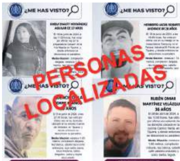
TIJUANA.- La Fiscalía General de Baja California reitera su compromiso de velar por la seguridad y bienestar de la comunidad.

Todos los localizados se encuentran en buenas condiciones de salud. Algunos de ellos ya