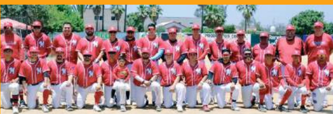
La Máquina Roja de Ensenada Municipal limpia a Tecate Municipal.