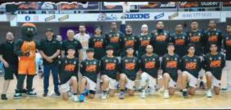
Ensenada Lobos cosechó un triunfo contundente como visitante.