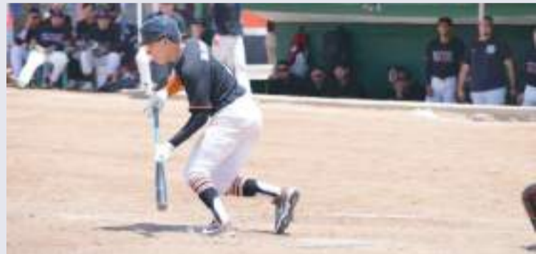
La Rural de Maneadero se llevó la primera de la doble cartelera ante la Urbana.