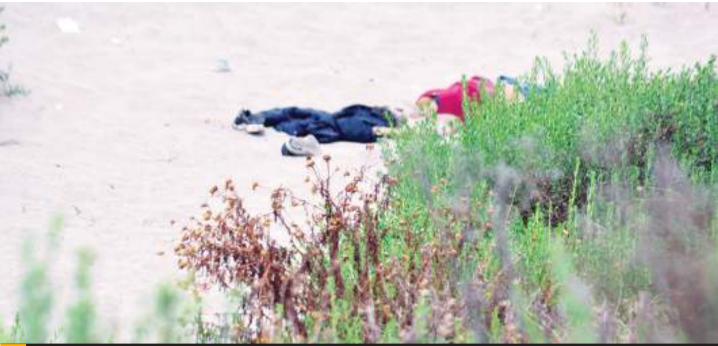
ENSENADA.- El cuerpo de la víctima fue encontrado el 23 de junio en la playa que se encuentra frente a Macroplaza.

La Fiscalía General del Estado fortalece acciones de investigación y esclarecimiento de ilícitos, por lo que exhorta a la comunidad a seguir denunciando cualquier acto de violencia, con el objetivo de llevar ante la justicia a quienes cometen estos delitos.