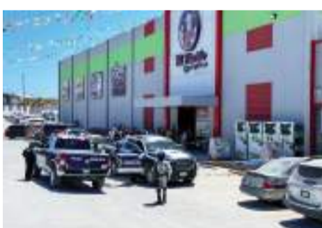
TIJUANA.- En diversas cuentas de redes sociales exigen seguridad policial en las sucursales de El Florido Abarrotes y Carnes, tras el tercer homicidio registrado durante este año en sus instalaciones.

SUJETOS MATARON FRENTE A SU FAMILIA A UN CLIENTE