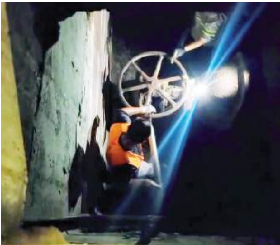
MEXICALI.- Equipos de la CESPМ continúan trabajando arduamente para reparar las tuberías dañadas, así como los sistemas hidráulicos ubicados bajo la superficie.

SE PREVÉ QUE ALREDEDOR DE LA MEDIANOCHE EL SERVICIO ESTÉ RESTABLECIDO. PODRÍAN EXISTIR VARIACIONES EN LA PRESIÓN DE LA RED DURANTE EL PROCESO DE NORMALIZACIÓN