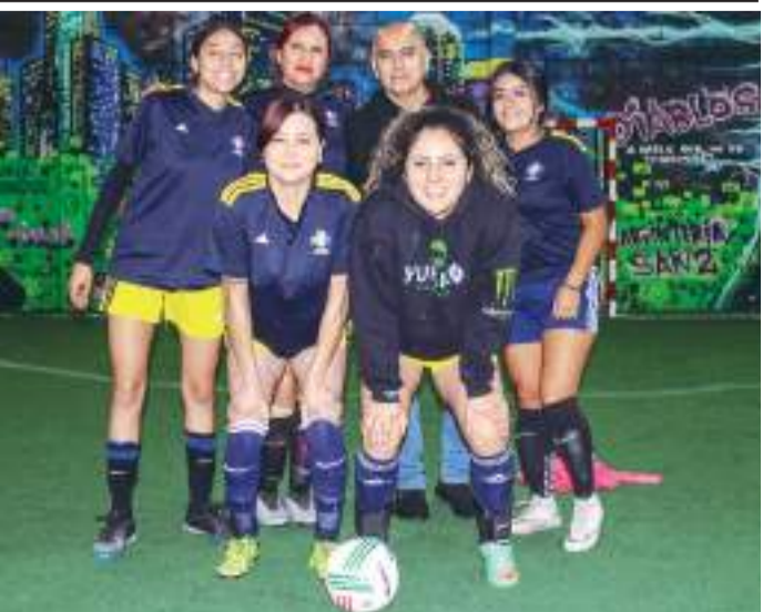
Suprema B se medirá a Jurídico Ponce en el partido del Grupo B.