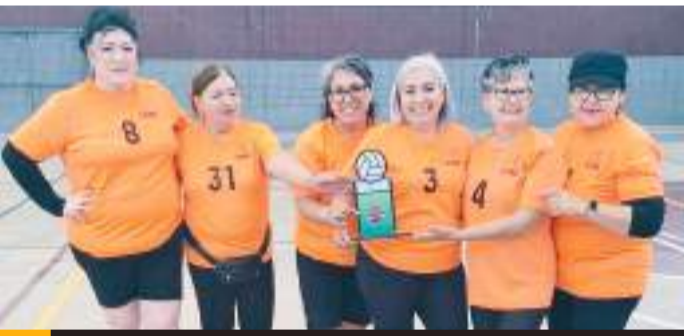
Mexicali Club venció en la final a las Chicuelas de Ensenada categoría 60 Años y Más.