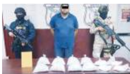
MEXICALI.- Hay un detenido tras ser sorprendido con droga; pero otro huyó.

Del otro sujeto que logró huir, dijeron los agentes, nada se mencionó en la tarjeta informativa policial.