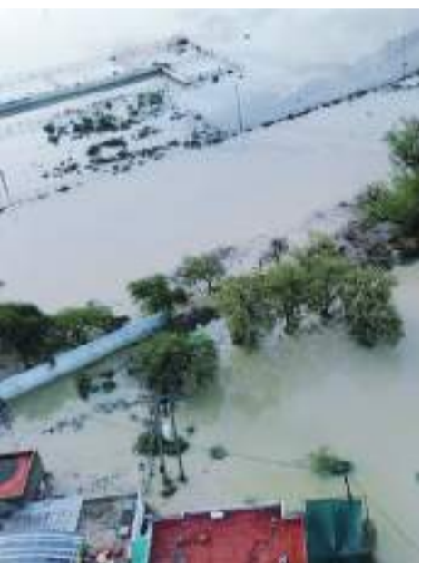
Los escurrimientos continúan, en el municipio de Tula, en el Altiplano de Tamaulipas.

En la cabecera municipal, el arroyo PASA A LA PÁGINA 2-C