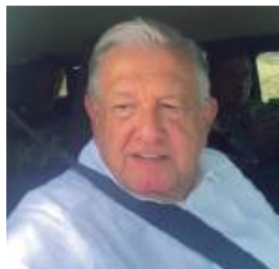
El Presidente de México, supervisa avance de las obras del Tren Maya.