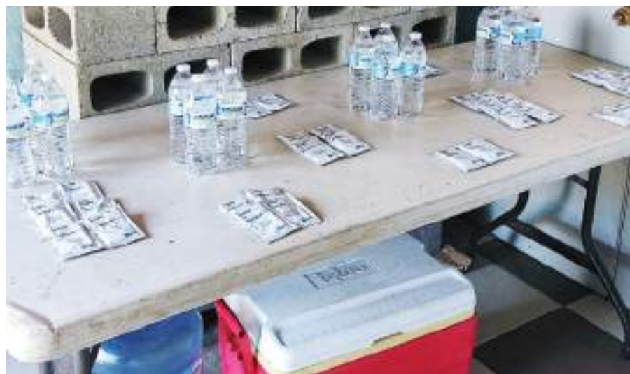
TIJUANA.- La Jurisdicción de Servicios de Salud Tijuana estableció casas de hidratación oral en la ciudad para hacer frente a las altas temperaturas.

Las Casas de Hidratación Oral están ubicadas en Calle El Triunfo Lote 19, colonia Buenos Aires Norte; Calle Nicolás Bravo 821 colonia Mariano Matamoros; en la Avenida Lomas de Tijuana 27115 colonia Lomas del Valle; en Privada del Trébol 50, fraccionamiento Urbi Villas del Prado.