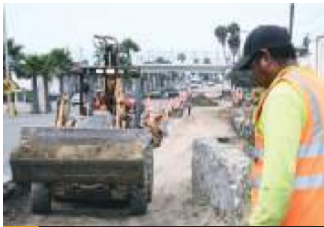
ENSENADA.- Alrededor de seis semanas durarán los trabajos de construcción del tercer carril a la altura del nodo CICESE-UABC.

Precisó que con esta medida se preservará la estructura del puen-