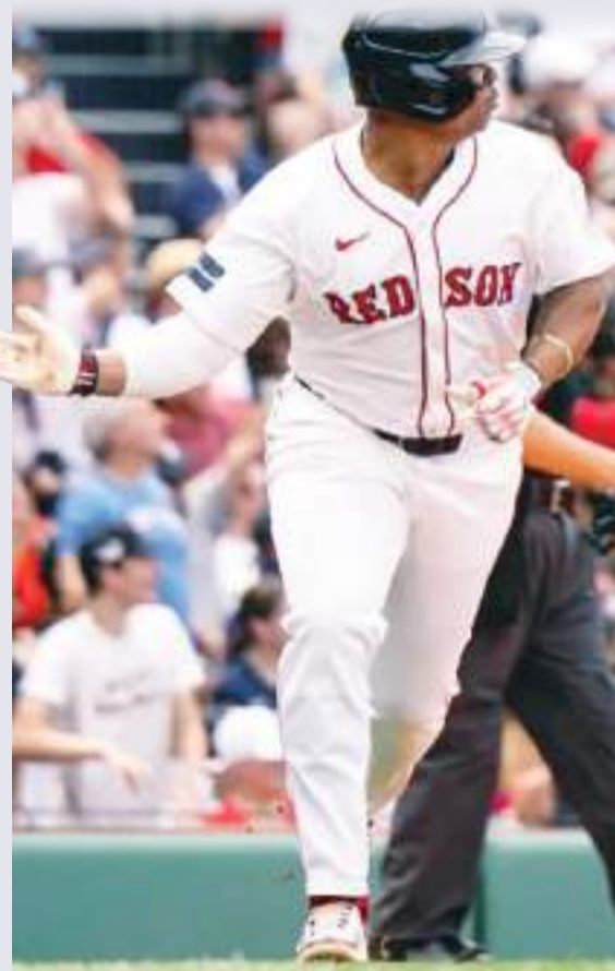
San Diego se llevó la victoria 4-1 el domingo ante los Padres.

Por los Padres, el venezolano Luis Arráez de 4-1. El colombiano Donovan Solano de 4-0. Por los Medias Rojas, el venezolano Wilyer