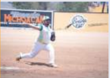
Con 3 carreras en la séptima y 1 en la octava, la Urbana de Chapultepec le ganó el segundo a la Rural de Maneadero.