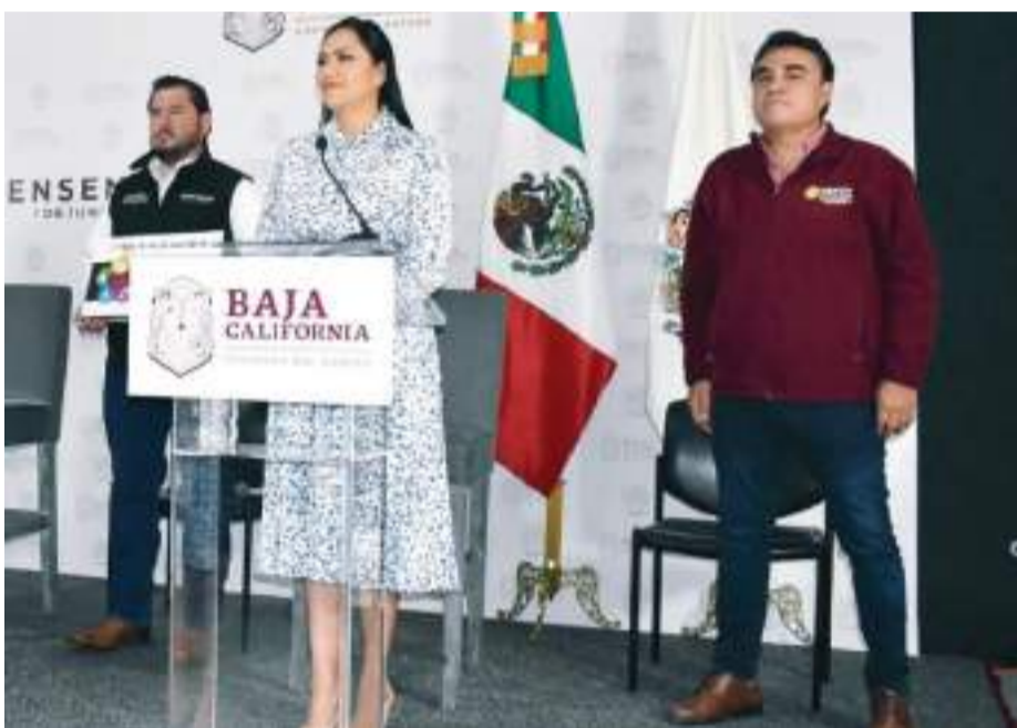
CIUDAD DE MÉXICO.- A partir del primero de julio, inicia el pago de la pensión y de los programas de apoyo, informó a secretaria de Bienestar, Ariadna Montiel Reyes.

La ubicación de sucursales del Banco del Bienestar puede consultarse en: ubicatubancodelbienestar.bienestar.gob.mx .