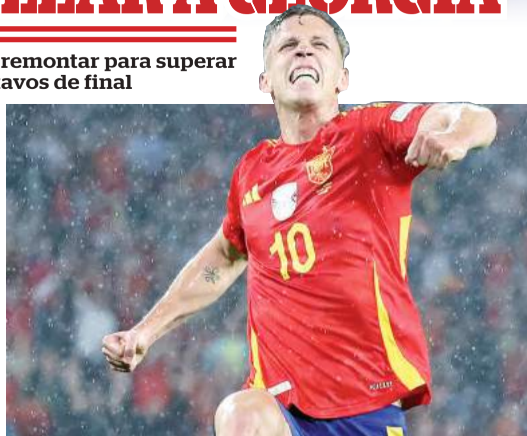
España selló su pase a cuartos de final tras imponerse a Georgia este domingo.

Seguidamente, respondió “La Furia Roja” con un lanzamiento de falta de Lamine Yamal