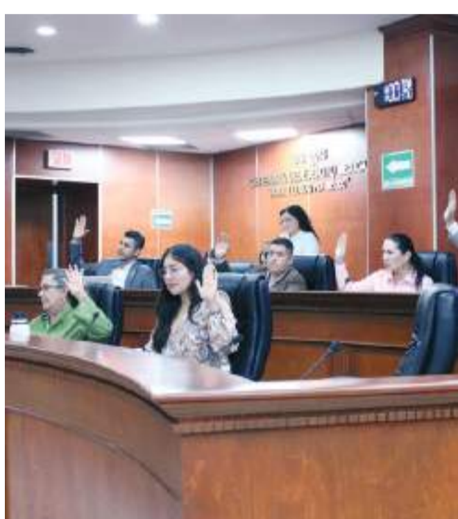
MEXICALI.- La Comisión de Fiscalización del Gasto Público presentó diversos dictámenes de la cuenta pública anual.

Por otro lado, la cuenta pública que se dictaminó como no aprobatoria es la correspondiente al Insti-