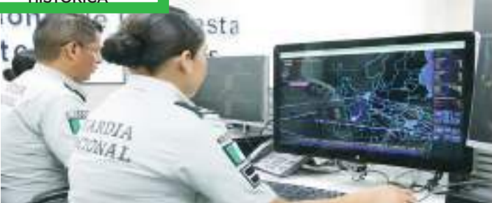
La colaboración de la Guardia Nacional con la fiscalía de Chiapas, se logró la condena histórica.