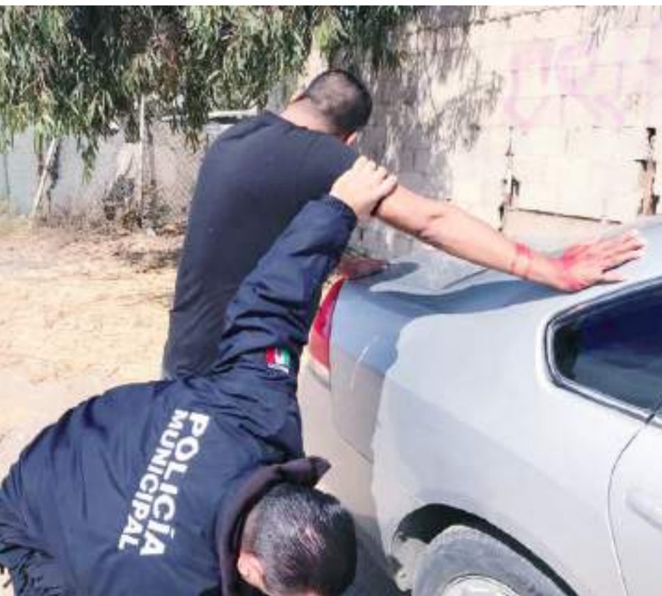
ENSENADA.- A Francisco "N", le fueron asegurados 10 envoltorios con cristal, durante una intervención en Loma Dorada.

ENSENADA.- Tras ser sorprendido y reportado por el intento de robo de vehículo, un hombre de 38 años de edad, fue intervenido por los elementos de la Dirección de Seguridad Pública Municipal, y encontrado en posesión de cristal.