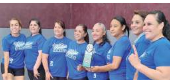
Renegadas de Ensenada se llevó los máximos honores de la categoría 40-49 Años.

Campeón: Mexicali Club Subcampeón: Chicuelas de Ensenada