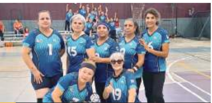
Mexicali Team fue el campeón de la categoría 50-59 Años.