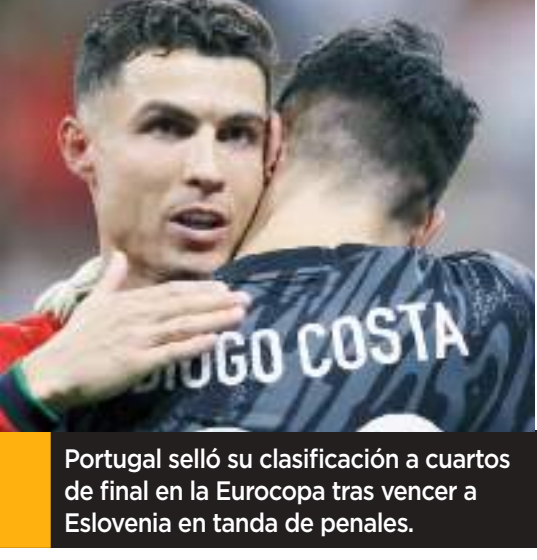
Portugal selló su clasificación a cuartos de final en la Eurocopa tras vencer a Eslovenia en tanda de penales.