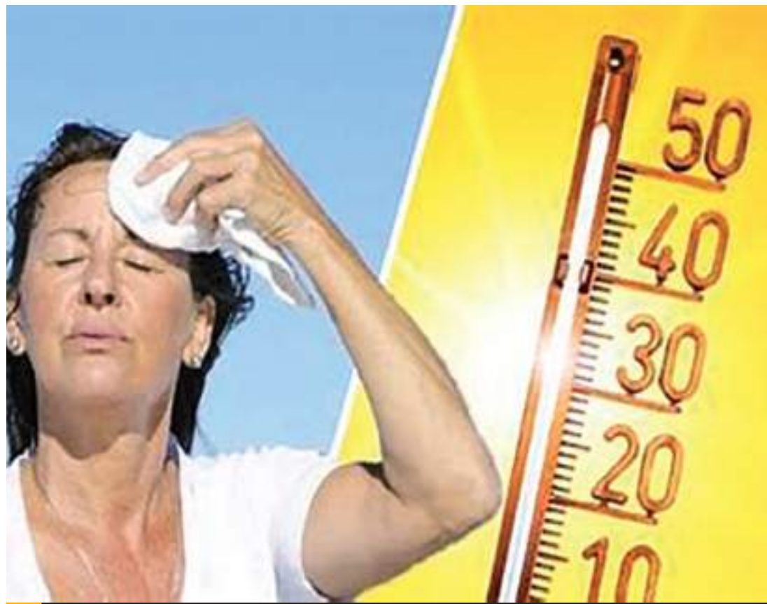
MEXICALI.- Junio registró 6 fallecimientos por golpe de calor, las autoridades de protección civil invitan a extremar precauciones.

También mencionó evitar acudir a zonas agres-