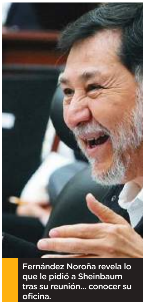
Fernández Noroña revela lo que le pidió a Sheinbaum tras su reunión... conocer su oficina.