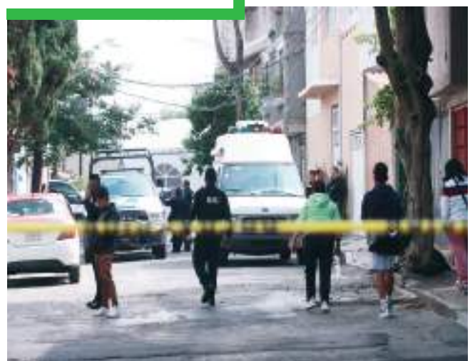
Junio fue el segundo mes más violento de 2024, después de mayo.