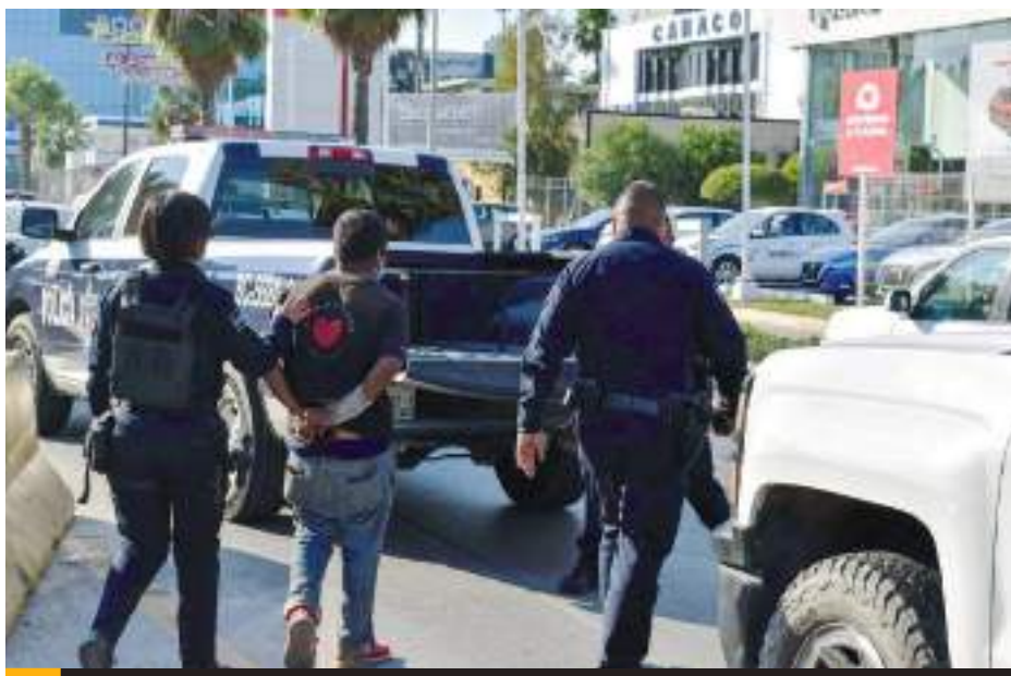
TIJUANA.- La corporación de seguridad preventiva local, informó que lograron la detención de más de mil personas por diversos delitos y otras relacionadas con drogas y armas de fuego.

También se incautaron miles de dosis de metanfetamina, marihuana, he-