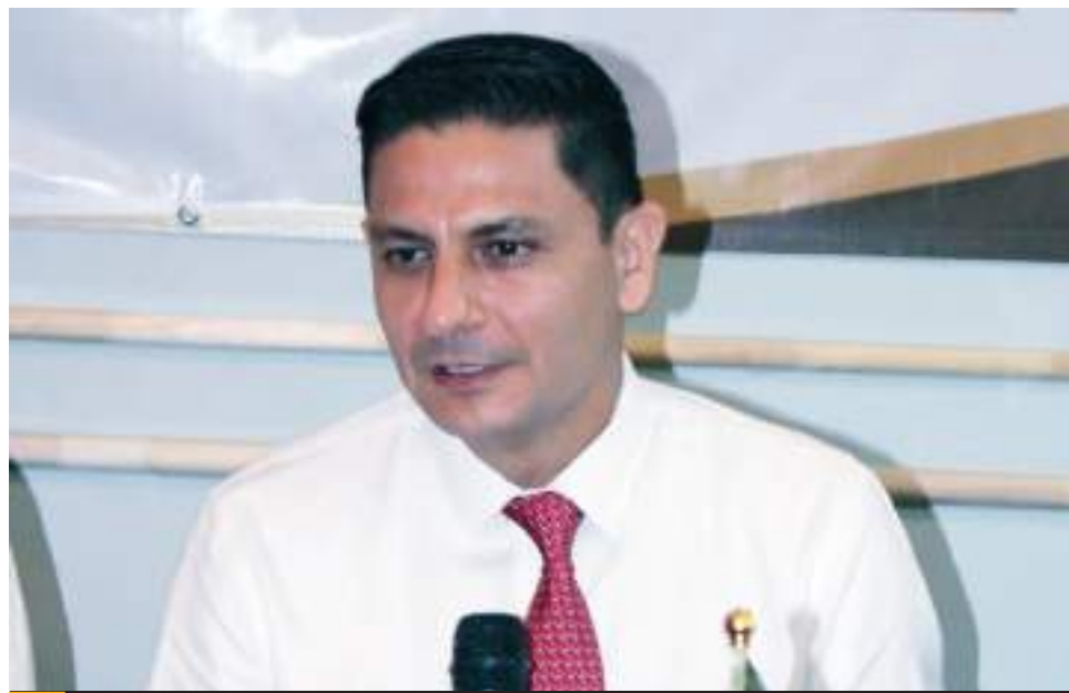
MEXICALI.- Un total de 280 millones de pesos requiere el TEJA para ampliar juzgados en el Estado.

En este sentido, les comentó que próximamente la Secretaría organizará una serie de capacitaciones, que incluirán talleres y diplomados, que estarán enfocados en la actualización de diversos temas relacionados con el trigo, incluyendo el manejo de coberturas, por lo que les extendió la invitación para que participen y puedan disipar sus dudas.