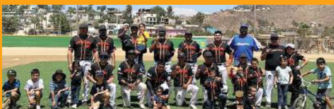
Cerveceros de la Rural de Maneadero ganó a Legends de la Municipal de Ensenada y se quedó con el trofeo de Campeón de Campeones Interligas de la Primera Especial.