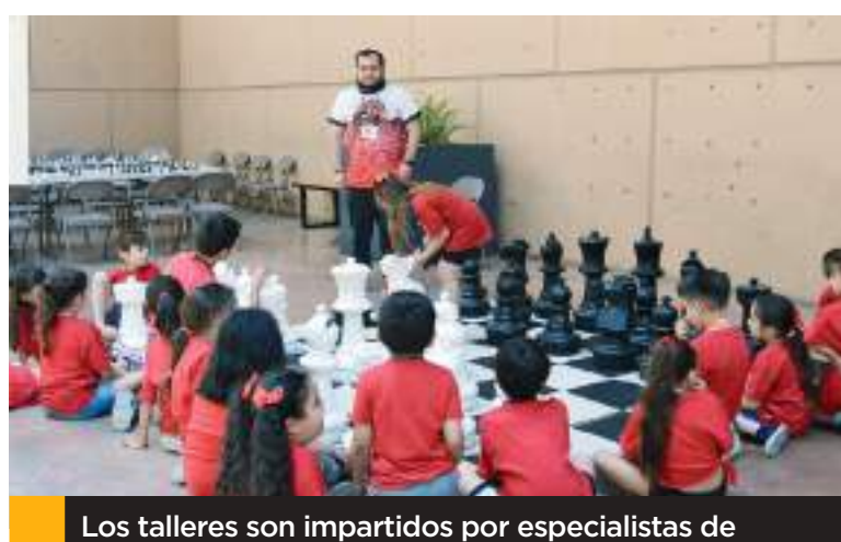
Los talleres son impartidos por especialistas de diversas disciplinas quienes acompañan, instruyen e inspiran a los participantes.