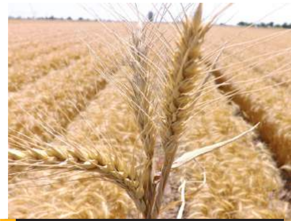
MEXICALI.- La secretaria de agricultura del estado, atenderá a los productores por la falta de apoyo económico gubernamental.

El magistrado indicó que otro aspecto que debe mejorar dentro del TEJA, es que en el futuro los juicios se resuelvan por la vía de la conciliación ya que el 80% de los casos se va hasta la resolución judicial lo que implica un desgaste en cuanto el tiempo y recursos.