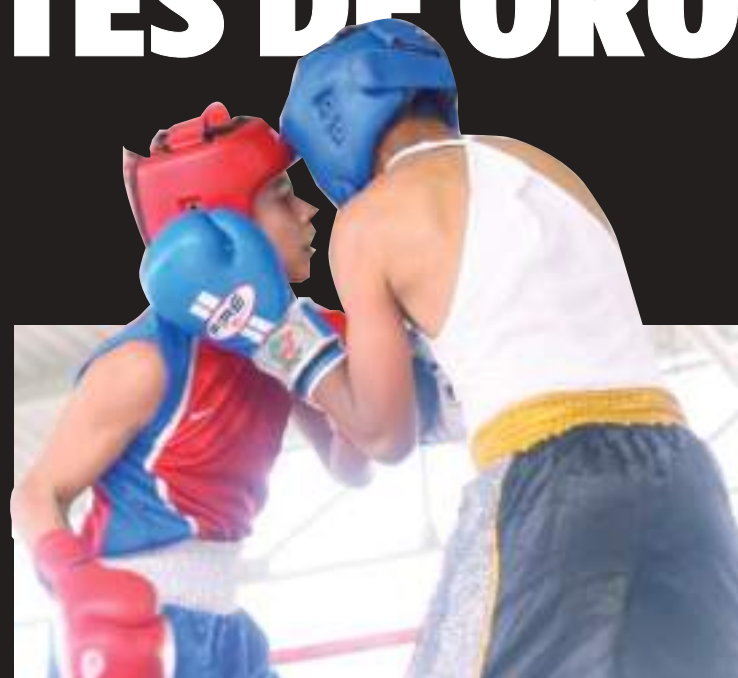
El Instituto Municipal del Deporte y Recreación de Ensenada alista el Torneo de Box Amateur Guantes de Oro.

El torneo Guantes de Oro a realizarse en su primera etapa el 7 de julio del 2024 en el gimnasio de box de la Unidad Deportiva Raúl Ramírez Lozano en Valle Dorado cuanta con el avala de la Asociación Estatal de Boxeo.