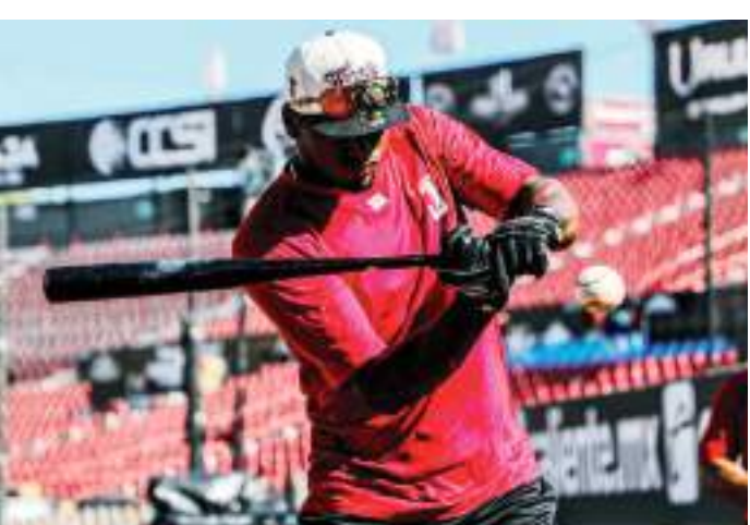
Toros de Tijuana disputará una serie contra Sultanes con el objetivo de acortar distancias en la Zona Norte.

Tijuana cuenta con marca de 35-30 en la actual campaña de la LMB, en tanto que Sultanes marcha con récord de 40-24.