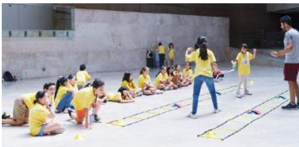
Niñas y niños de la región descubrirán atractivas actividades relacionadas con el mundo del arte.