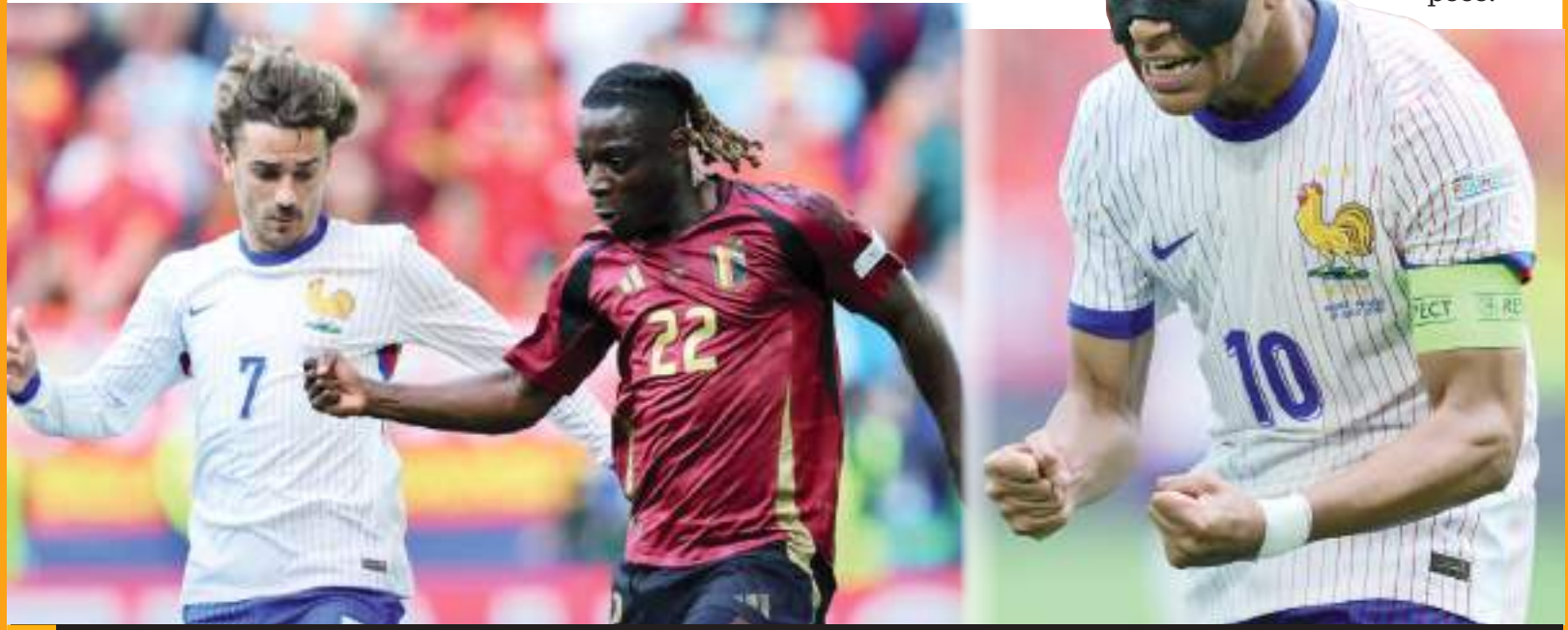
Francia logró su boleto a los cuartos de final de la Euro tras superar a Bélgica en octavos.

El jugador belga se lesionó durante el partido, lo que obligó al entrenador a sustituirlo por un jugador suplente.