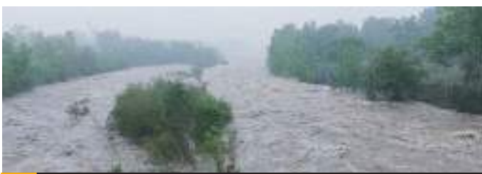
La depresión tropical genera fuertes tormentas, en varios estados del país.