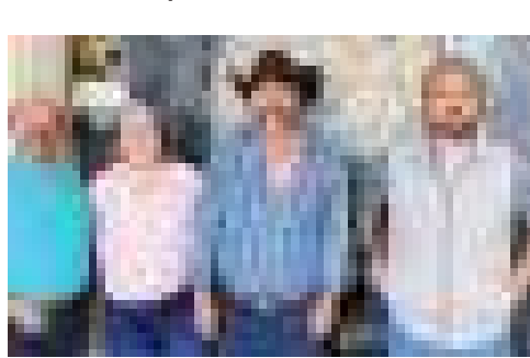
ENSENADA LÍDERES AGRARIOS...

Puso en servicio, totalmente terminado, el nodo alamar de Tijuana.