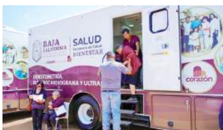
TIJUANA.- Los Centros de Salud Móviles, continúan ofreciendo sus servicios del martes 2 al 6 de julio del 2024.

Los pacientes con Rickettsiosis presentan dolor de cabeza intenso, fiebre de 39°C, erupciones cutáneas, dolor muscular, malestar general, náuseas, vómito, anorexia y dolor abdominal, por lo que se exhorta a la población acudir a su Centro de Salud más cercano, si presenta los síntomas anteriores, además de la presencia de garrapatas en su entorno.