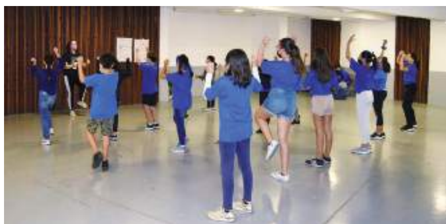
Se busca fortalecer en cada campista valores tan importantes como el respeto, la tolerancia, el trabajo en equipo y la amistad.

Niñas y niños de la región descubrirán atractivas actividades relacionadas con el mundo del arte, mediante talleres impartidos por especialistas de diversas disciplinas quienes acompañan, instruyen e inspiran a los participantes en medio de una convivencia y ca-