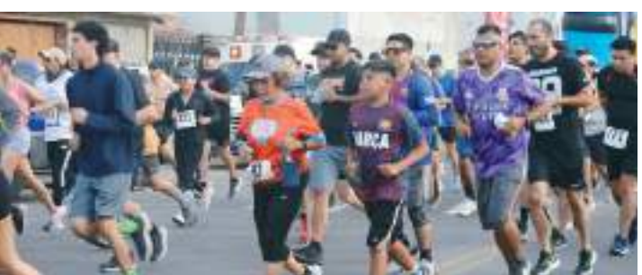
Las inscripciones en línea son para categorías a participar en ambas ramas de 13-15 Años hasta 70 y Más, categoría Única de personas con discapacidad.

La premiación será para los 3 primeros lugares absolutos en ambas ramas de 1 mil pesos, 750 pesos y 500 pesos respectivamente, en tanto que los ganadores de los 3 primeros lugares de cada categoría serán de medalla, así como para los de categoría Única de personas con discapacidad.