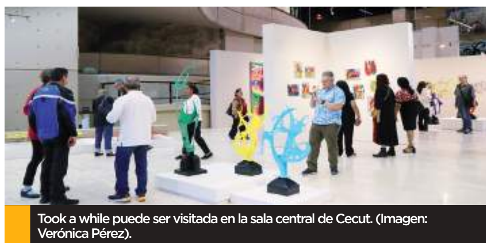
Took a while puede ser visitada en la sala central de Cecut. (Imagen: Verónica Pérez).

Took a while puede ser visitada en la Sala Central de Cecut de martes a domingo de 10:00 a 19:00 horas, la entrada es libre.