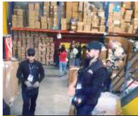
TIJUANA.- Inspectores de SATBC que intervinieron en la revisión de Saldos Koko

En una atención a medios, la Gobernadora dijo que ordenó a la Secretaría General de Gobierno abriera una investigación, pues deben de respetar los procedimientos legales y consideró 'innecesario' el uso de cubrebocas y lente