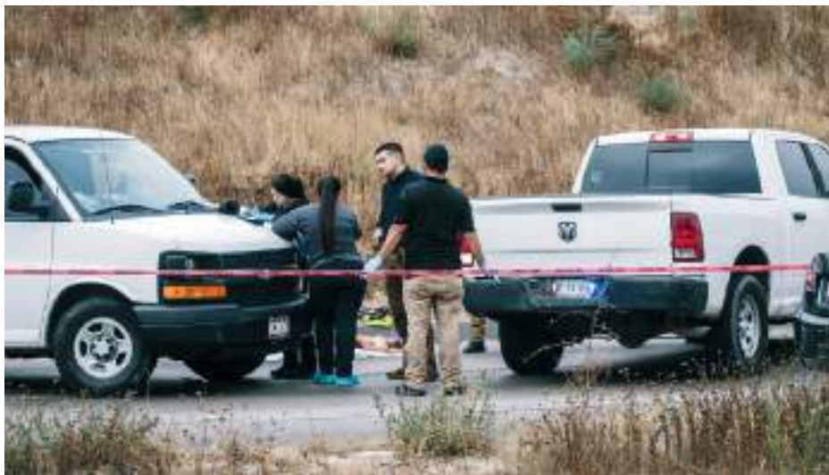
TIJUANA.- Una persona en condición de calle fue alcanzada por un vehículo en el momento que intentó cruzar la carretera; murió de manera brutal.

Por su parte, agentes de la Fiscalía Regional de Tijuana se encargan de realizar las investigaciones correspondientes, mientras que peritos de Servicios Periciales dieron el le-