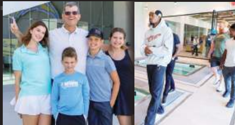
Chargers de Los Angeles organizarán el fin de semana del sábado 13 y domingo 14 de julio una "casa abierta" pública en The Bolt.

Todos los fanáticos que visiten The Bolt el 13 y 14 de julio para la jornada de puertas abiertas también tendrán la oportunidad de presentar su boleto digital en la tienda del equipo Chargers el mismo día de su visita para recibir un descuento.