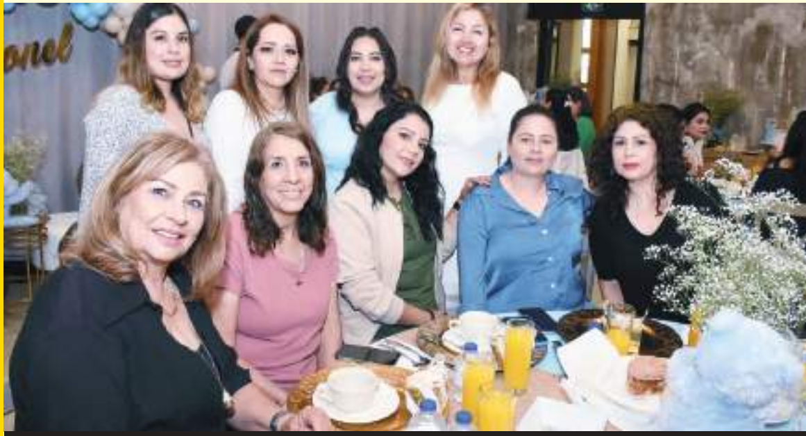
Al baby shower, asistió de manera especial un grupo de sus amigas y familiares.