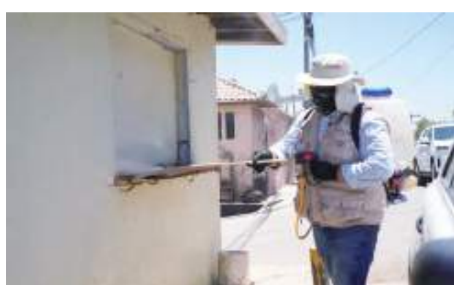
TIJUANA.- Personal de diferentes Programas de la Jurisdicción de Servicios de Salud Tijuana, estará presente en la colonia Bellavista de la ciudad de Tecate, en un operativo conjunto contra la Rickettsiosis.

En cuanto al cuidado de los animales, es necesario prevenir que pe-