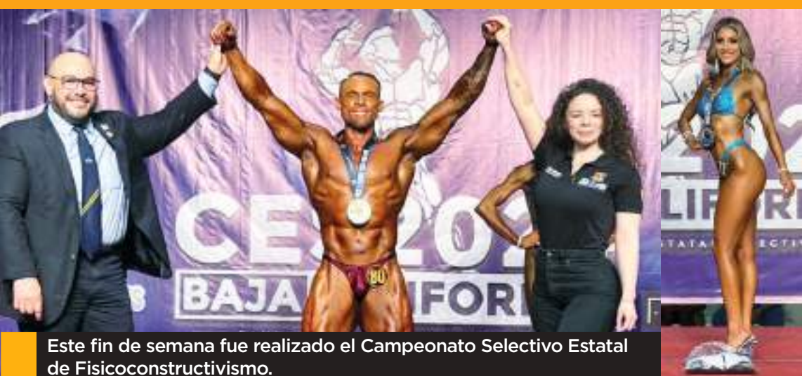
Este fin de semana fue realizado el Campeonato Selectivo Estatal de Fiscoconstructivismo.