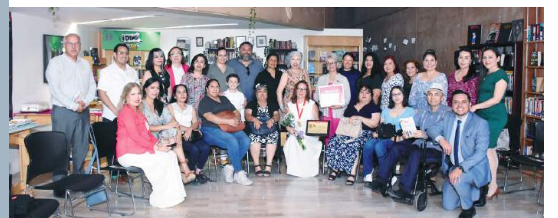
Las damas integrantes de la "Alianza de Mujeres Por Mujeres" de Tijuana, ofreció un merecido reconocimiento como "Mujer de Éxito".