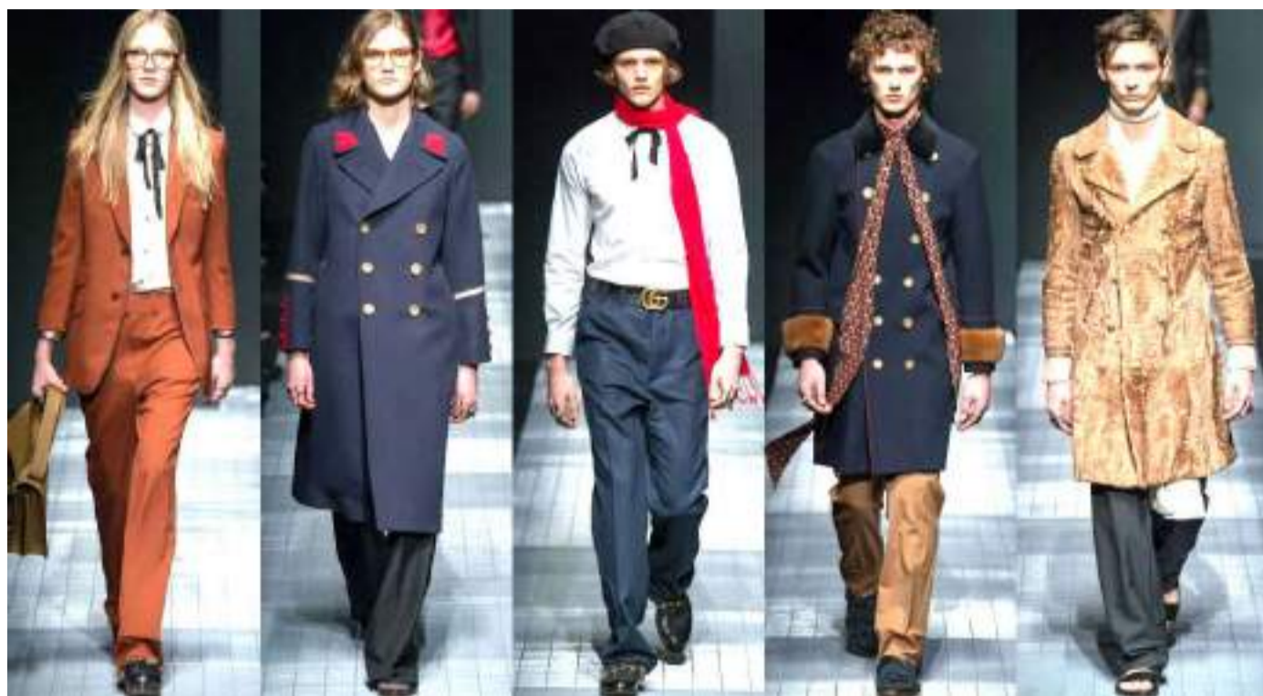
DE LAS CASAS DE MODA MÁS LUJOSAS