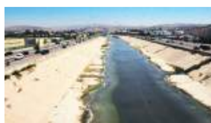
TIJUANA.- La nueva ciclovia será en la parte superior de la canalización del Río Tijuana, y se empalmará con la del bulevar Benítez