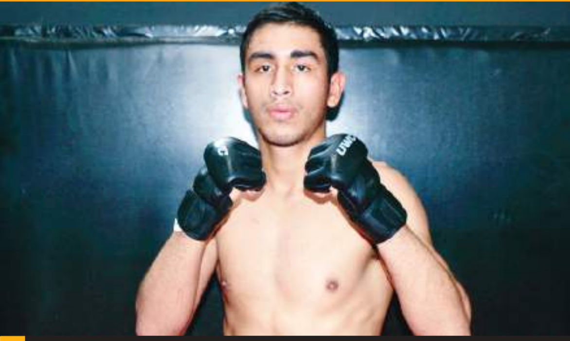
El sudamericano tiene marca de 6-1-0.