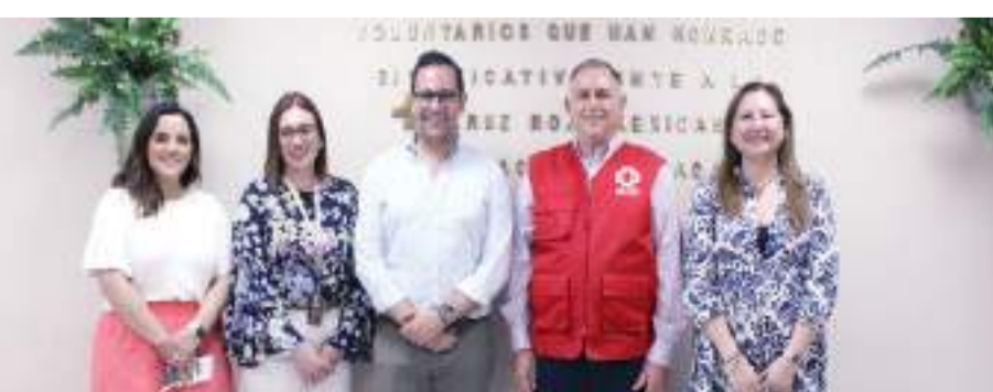
ENSENADA.- Instalaciones de la Cruz Roja Mexicana (CRM) en este municipio, son iluminadas con 34 paneles solares que fueron instalados en su sede con apoyo de la Fundación Semptra Infraestructura.

Recordaron que el anhelo de construir la presa “El Barbón” no es nuevo; es una demanda histórica no solo de los ejidatarios de Real del Castillo, Sierra de Juárez y Laguna de Hanson, sino también de la comunidad indígena La Huerta y del Real del Castillo Viejo, quienes también dependen del Valle de Ojos Negros.