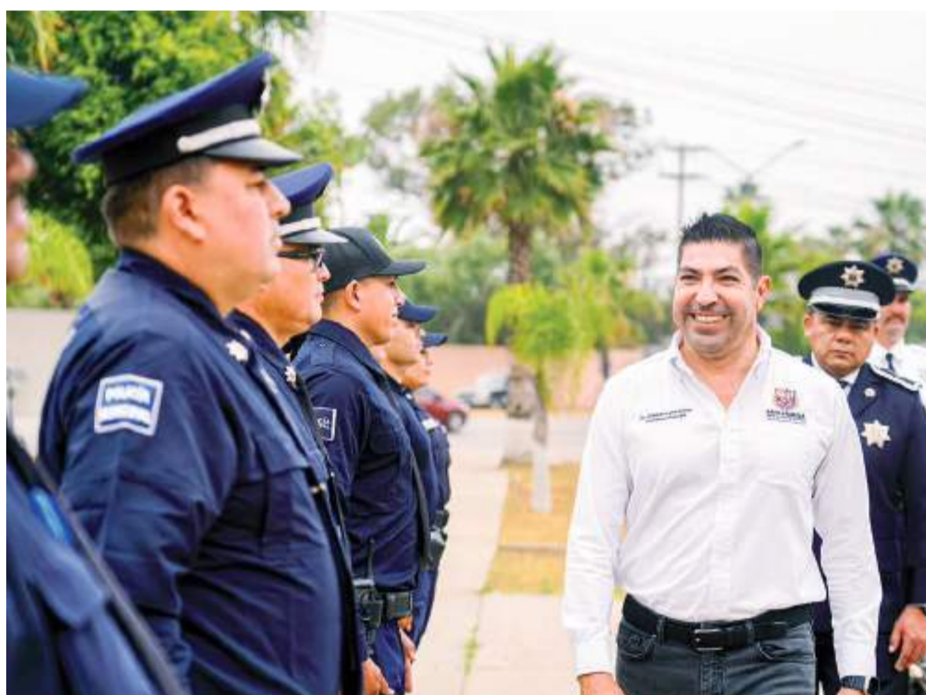
ENSENADA.- Playas, zona centro y las rutas del vino entre otras zonas del municipio, son parte del operativo de seguridad por el 4 de julio, fecha en la que se espera gran afluencia de visitantes, por la celebración de la independencia de Estados Unidos.

En ese sentido, se exhorta a la ciudadanía a no arrojar desechos, ni lanzar objetos a descargas sanitarias o alcantarillas de viviendas o de la vía pública, ya que, además del deterioro de la infraestructura por el efecto del tiempo, influye de manera sustancial la basura que se tira y después es arrastrada a la tubería. (bpa).