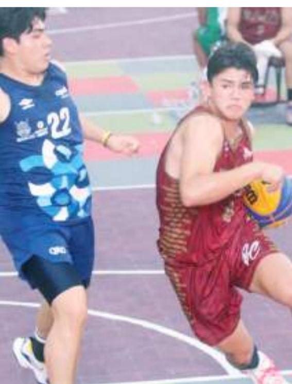
Baja California tiene que derrotar a Guanajuato para avanzar directamente.

El equipo que participó el año pasado en esta disciplina terminó con la medalla de plata por lo que jugadores y cuerpo técnico tienen trazado el objetivo de campeonar en esta edición.