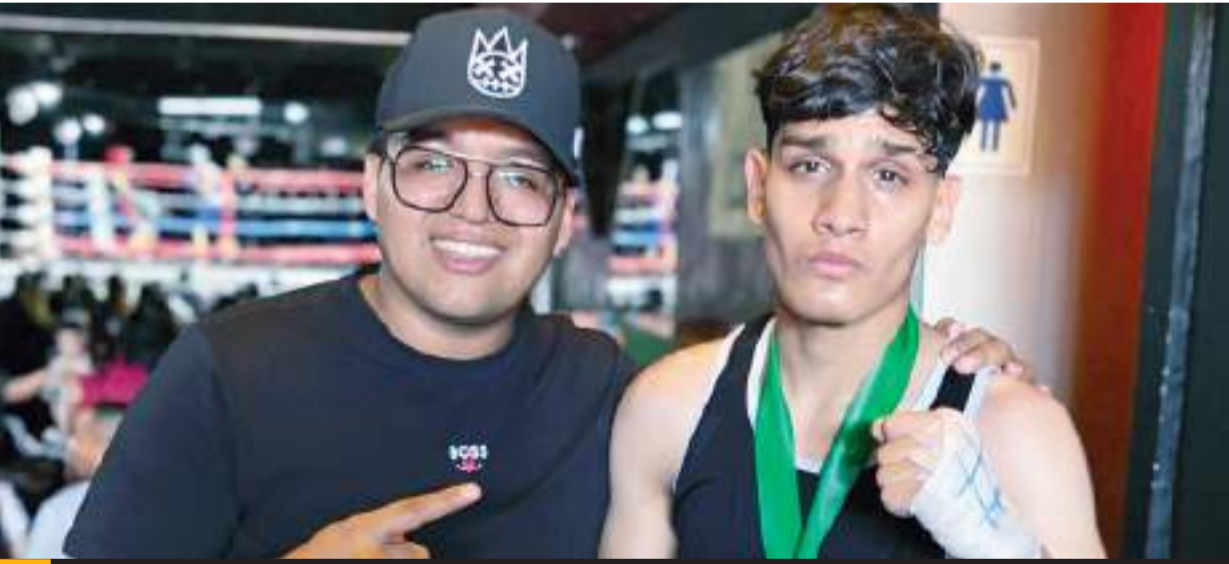
Los boxeadores ganadores recibieron medallas.

El equipo fronterizo buscará reposicionarse dentro de los mejores ocho del certamen, ya que en el pasado Clausura 2024 no alcanzaron la clasificación a la fiesta grande, después de cinco Liguillas interrumpidas.