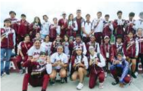
Los bajacalifornianos conquistaron 4 medallas de oro; 8 de plata y 6 de bronce.

"Nos vamos contentísimos", aseguró, "muchos jovencitos dieron todo, otra vez vamos a agarrar el semillero que traemos y vamos a tratar de ser mejor cada día".