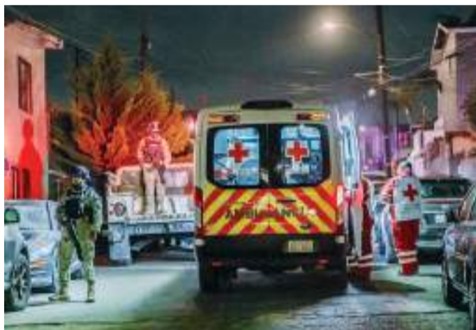
TIJUANA.- Durante la noche del lunes se desató la matanza en esta ciudad, acciones que dejaron como saldo a dos hombres sin vida, ambos a punta de arma de fuego.