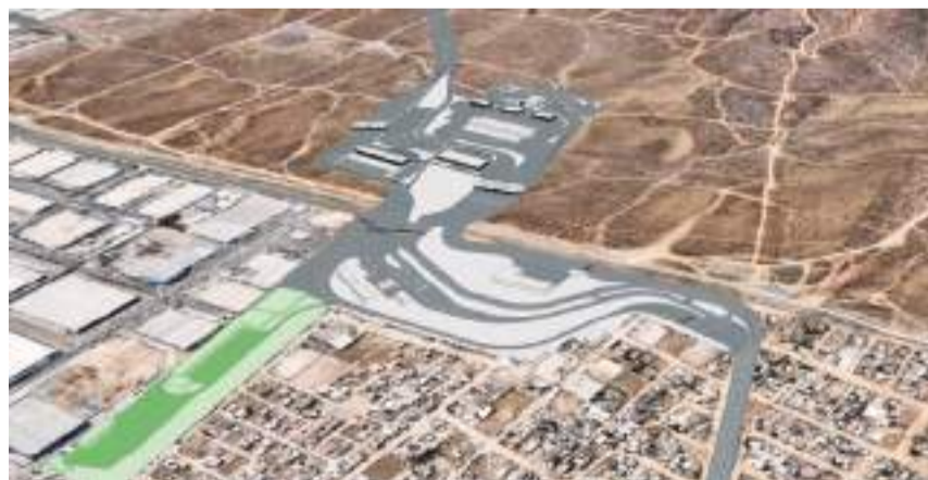
TIJUANA.- La culminación de la garita Otay Mesa II estaría hasta 2027 del lado estadounidense, indican autoridades.

"Es súper complejo no es tan fácil como suena, yo no visualizo que lo vayan a abrir hacia el sur cuando termine México, pero no tengo duda de que México termine antes. Van a