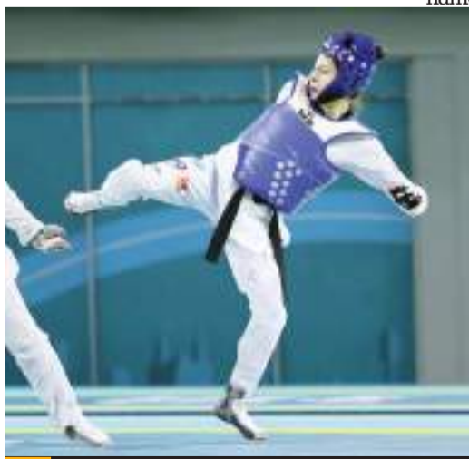
Viajará el 12 de julio a Francia para cerrar su preparación.