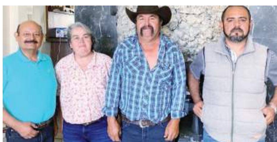
ENSENADA.- Ante la baja en las reservas de agua que se detectan en el Valle de Ojos Negros, líderes ejidales de los valles altos harán las gestiones necesarias para que se construya una presa sobre el arroyo de El Barbón.

A nivel nacional, ambas instituciones han trabajado en equipo por cerca de 10 años en distintos proyectos solidarios, tales como el Plan Invernal, ayuda humanitaria en situaciones de emergencia y/o desastres naturales, entrega de ambulancias, equipamiento, y áreas de salud y resiliencia comunitaria.