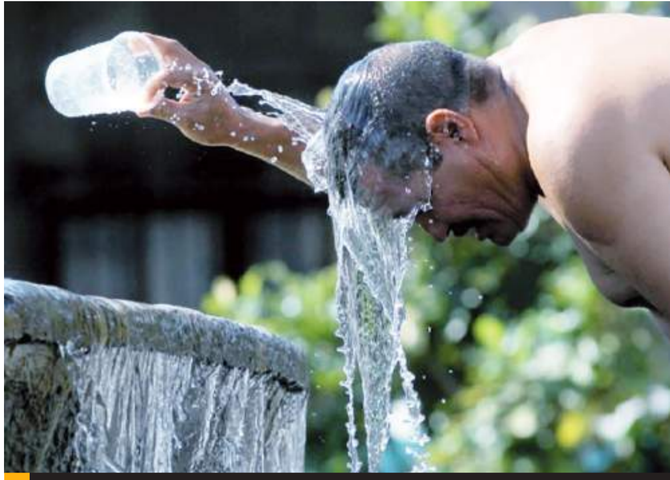
MEXICALI.- Sigue el incremento en muertes por golpe de calor en la capital del Estado.