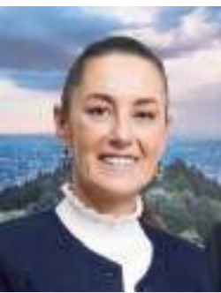
MEXICALI CLAUDIA SHEINBAUM PARDO...

Anuncia que en su mandato aplicará políticas de beneficio para los jóvenes.