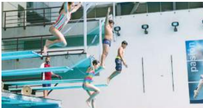
Los niños serán registrados en las categorías Pandas, Mapaches, Tigres y Lobos.

fútbol y tenis de mesa, así como actividades recreativas. También se dio a conocer que en el caso del puerto de Ensenada los niños y jóvenes de ambas ramas aprenderán los fundamentos de bádminton, judo, esgrima, basquetbol, tenis de mesa y gimnasia. En Mexicali serán los deportes como el taekwondo, tiro con arco, fútbol, baloncesto, pentatlón moderno, atletismo, natación, esgrima, activación física y luchas asociadas.