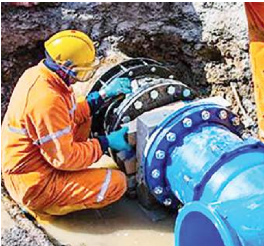
MEXICALI.- La CESPM trabajando para mejorar la infraestructura en el servicio del agua en Mexicali.

También dijo que exhibirán a los diputados de MORENA que avalaron la legislación al considerar que se extralimitaron en la interpretación que hizo la SCJN en el tema.