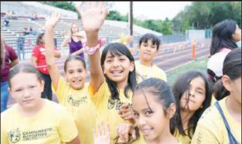
La actividad se realizará en ocho unidades deportivas

Las inscripciones estarán abiertas hasta el viernes 12 de julio y podrán realizarse en línea en la página imdet.tijuana.gob.mx . También habrá registros presenciales en las oficinas del IMDET, ubicadas en la Unidad Deportiva CREA, con un