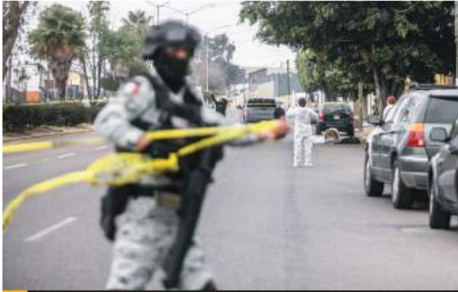
TIJUANA.- Dos cadáveres de personas fueron localizados dentro de un tambo para basura en la vía pública, estaban entre cobijas y bolsas de plástico, en la colonia El Rubí.

En el lugar trabajaron elementos de Servicios Periciales de la Fiscalía General del Estado. Sin embargo, hasta el momento se desconoce sexo de ambas víctimas, y no se han reportado personas detenidas.