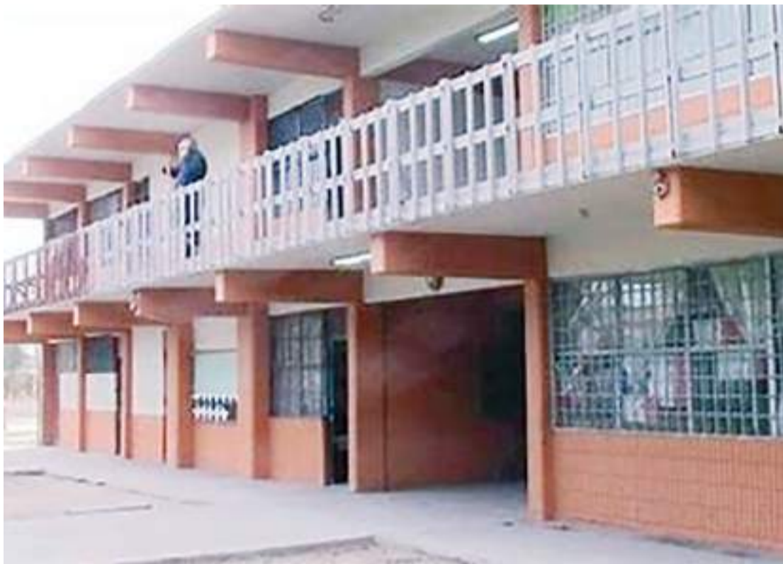
MEXICALI.- Para evitar afectaciones por el calor, el Sistema Educativo propone clases virtuales en agosto.

Además, manifestó que los eventos de fin de cursos se están realizando por las tardes para evitar incidentes por la temperatura, ya que cerca de 180 mil estudiantes en educación básica terminarán sus estudios.