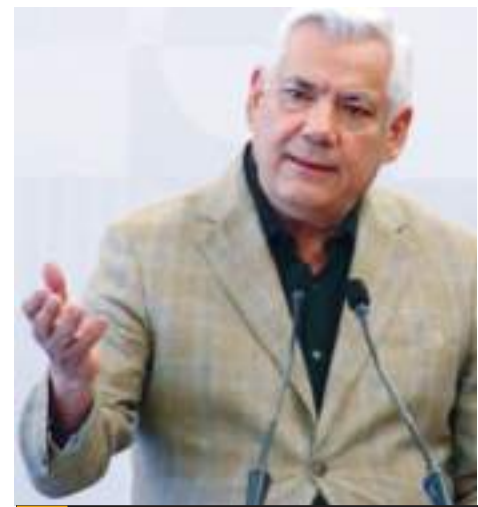
MEXICALI.- El Secretario de Hacienda de Baja California, participará en la cuarta edición de la Mesa Redonda de Inversiones EE.UU.-México.

Recordó que, en estos lugares, además de ofrecer suero vida oral y descanso, se informa cómo protegerse de las altas temperaturas además de evitar enfermedades, donde también se proporciona revisión médica.