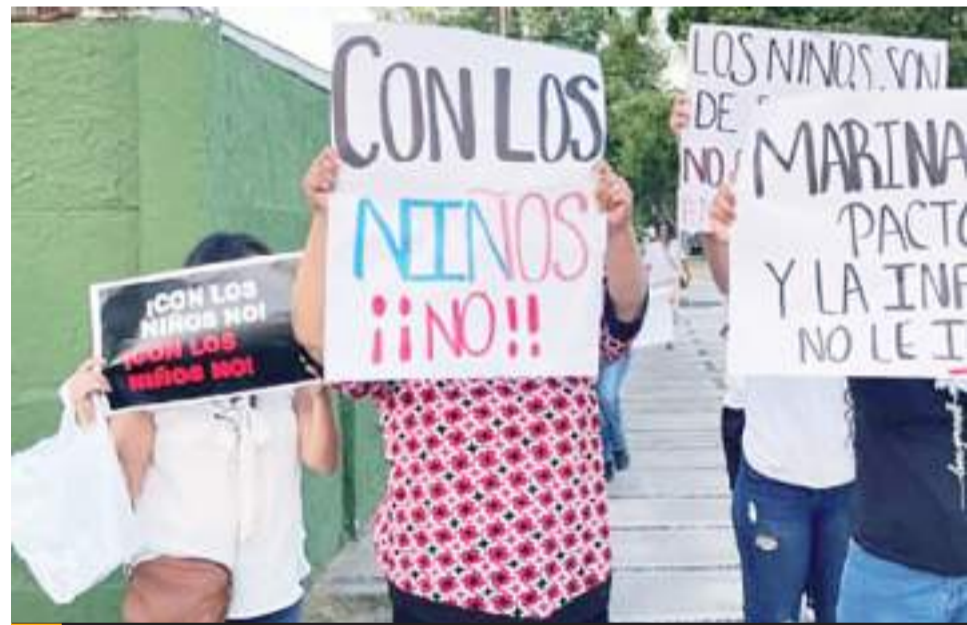
MEXICALI.- Marina del Pilar dice respetar las opiniones de quienes están en contra del cambio de género en las actas de nacimiento.

Finalmente, el titular del organismo dijo que para el 20 de julio, la vialidad afectada por la fuga estará totalmente funcional.