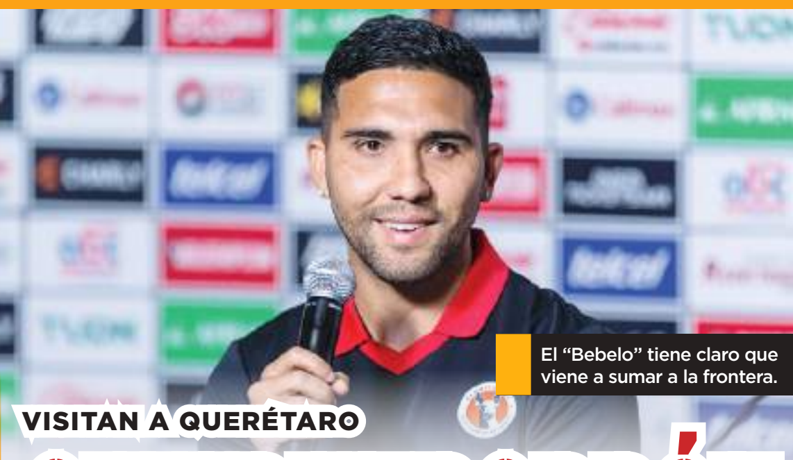
El "Bebelo" tiene claro que viene a sumar a la frontera.