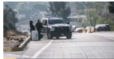
TIJUANA.- Otro depósito para basura fue abandonado sobre la avenida Internacional a la altura del Soler.

Con este hecho de sangre, es el segundo día consecutivo en que abandonan depósitos con personas descuartizadas o cadáveres enteros, sin que las autoridades preventivas hayan detenido aún a los responsables; el martes por la mañana dos cuerpos sin vida fueron localizados dentro de un bote de basura en el bulevar Fundadores.