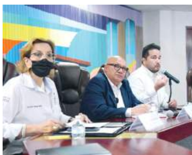
TIJUANA.- Se realizó una reunión informativa sobre "Auditorías del IMSS y los Nuevos Hospitales en Baja California".

Es importante tener estos foros porque en la medida en que estamos informados los empresarios para no cometer errores tendremos una empresa más sustentable", mencionó.