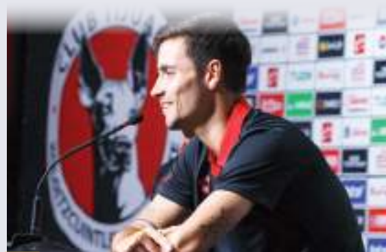
Bilbao aseguró que Xolos está para competir en el torneo.

Bilbao comentó que comenzarán de cero en todos los aspectos y que muchas cosas entorno al Club ayudan a lograrlo: "Al final a nosotros no nos gusta ver el pasado y menos en nuestro caso que no estuvimos acá en