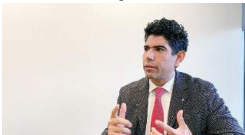
TIJUANA.- Para poder recuperar toda la mercancía, la propietaria de Saldos Koko debió permitir que procedieran al embargo para que todo quedara constatado en actas, y posteriormente, la mercancía pudiera ser reclamada, en vez de regalarla.

"Esa fue la primera violación. En segundo térmi-