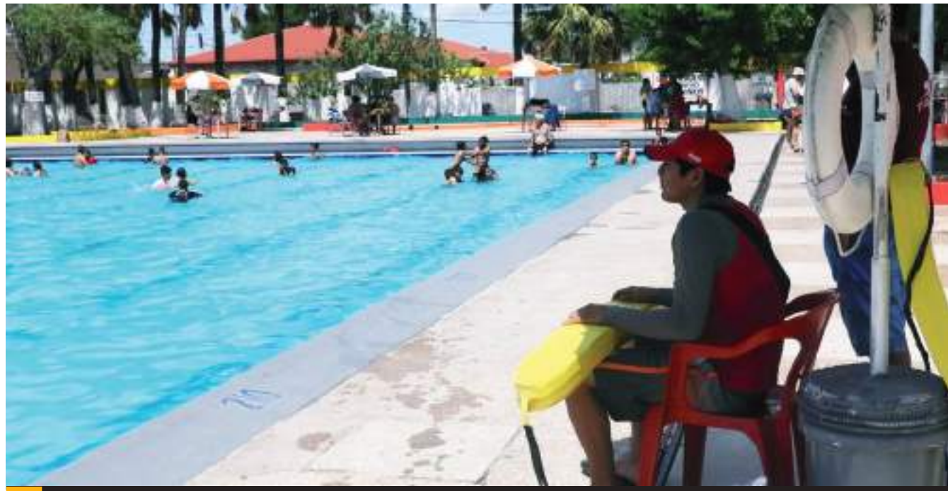
MEXICALI.- La Dirección de Bomberos continúa con los operativos en albercas para garantizar seguridad a los visitantes.

El pasado 28 de junio, un hombre que trabajaba como salvavidas falleció en el Centro de Desarrollo Humano Integral (CDHI) o Parque Centenario y el 18 de junio de 2023 un menor de aproximadamente 8 años de edad perdió la vida en el parque acuático “El barco”.