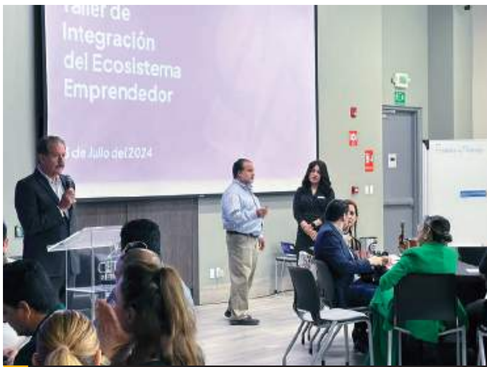
TIJUANA.- A través de la impartición de talleres se busca llevar de la mano a un emprendedor para que en un futuro sea exitoso su modelo de negocio.

Se pretende, agregó, que quienes forman parte del ecosistema emprendedor se conozcan entre ellos, sepan lo que hace cada uno y que esta vinculación les fortalezca. "La intención es que no sea este un proyecto de gobierno que culmine con la administración, sino que sea un proyecto respaldado por la Iniciativa Privada y la academia para que en la siguiente administración se le de continuidad y sea respaldado por los demás agentes del ecosistema", comentó. Señaló que en los trabajos de hoy participaron 60 emprendedores de distintos sectores y se vieron temas de política y gobernanza, finanzas, capital humano y talento.