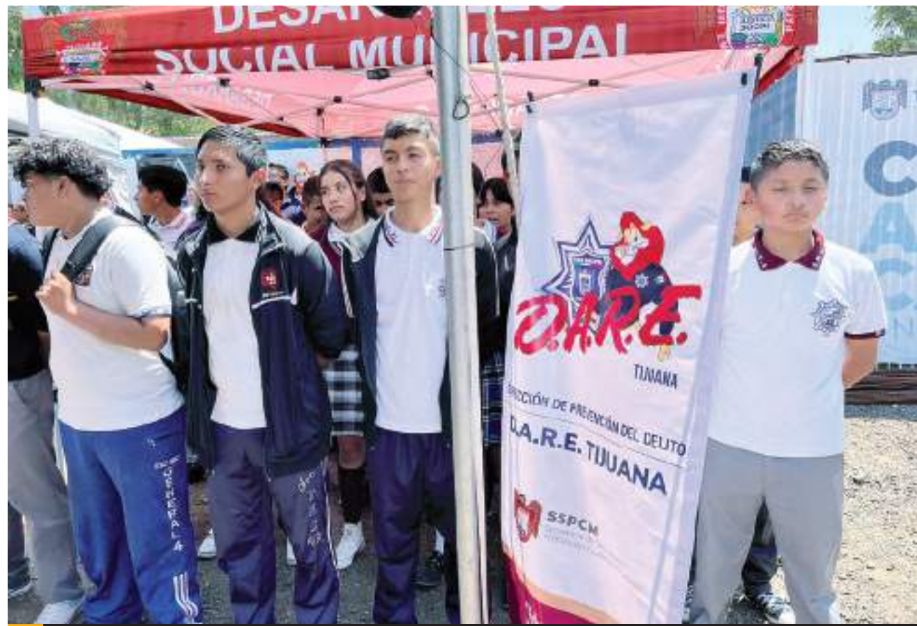
TIJUANA.- Cuatro mil jóvenes fueron informados sobre las consecuencias de consumir drogas.

“Nos queda claro que tuvimos los mejores candidatos y propuestas encaminadas a buscar el bien común para la población, pero hay que reconocer que, a pesar del gran trabajo de la sociedad civil y los abanderados blanquiazules, nos enfrentamos a una elección de estado difícil de superar”, dijo la dirigente.