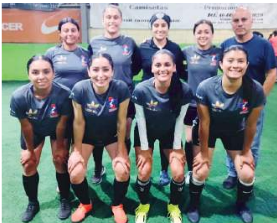
Farmacia Suprema se coloca en el subliderato de la Primera Fuerza.