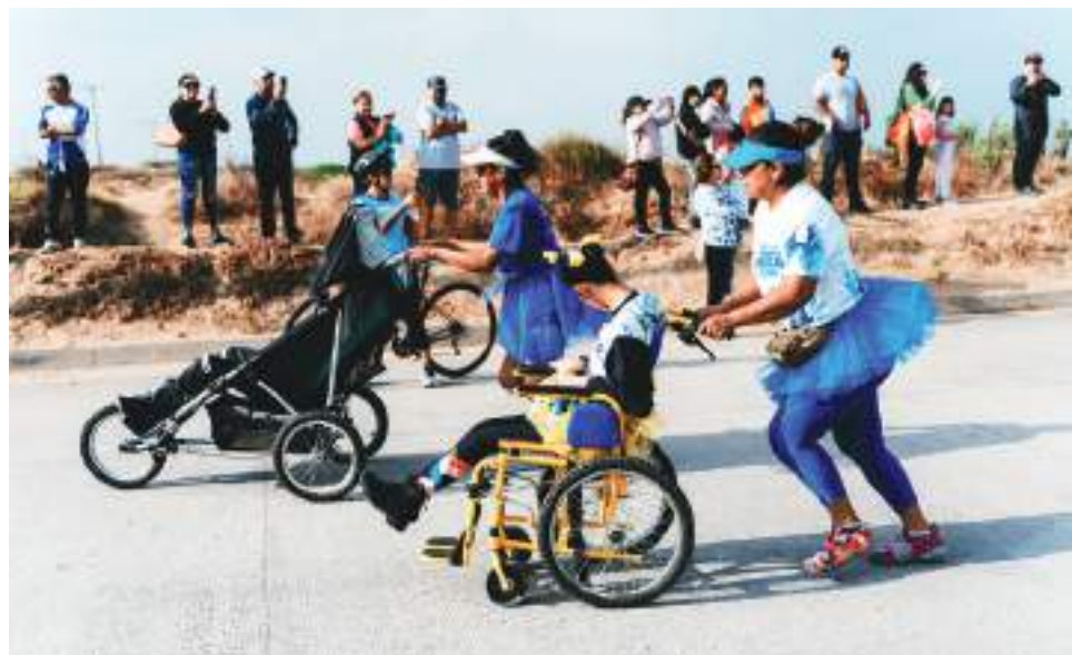
ENSENADA.- Alimentos y productos de limpieza fueron donados por más de 800 participantes en evento social-deportivo respaldado por la empresa Energía Costa Azul.

“...Celebramos la inversión y avance en las plantas de tratamiento el gallo, noreste y sauзал, que están a punto de terminar las reparaciones”, puntualizó. (bpa).