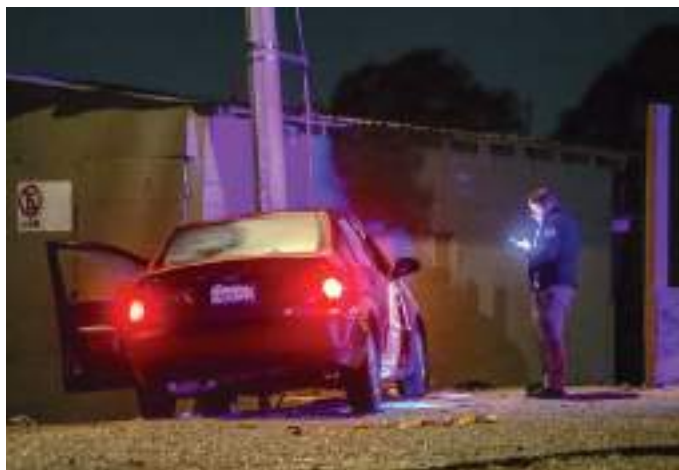
TIJUANA.- Dos mujeres heridas por disparos de arma de fuego y un hombre asesinado, dejó la jornada de sangre en menos de tres horas en esta ciudad.

cia un hospital cercano, en condiciones graves, trascendió.