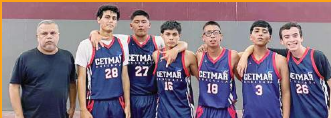
Cet Mar ganó por 65-33 ante los aguerridos Clippers en la categoría Juvenil.

Esto es todo por hoy, amigos. Nos leemos la próxima semana aquí en la Casa del Lobo.