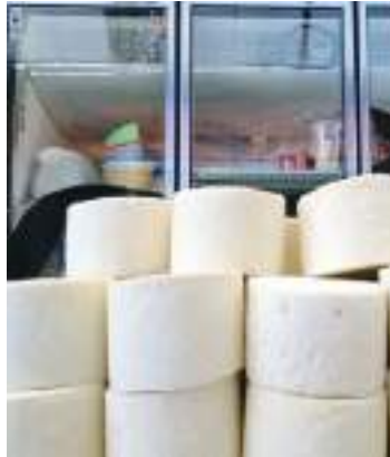
MEXICALI.- La SADERBC ofrecerá un diplomado para profundizar en la cultura de elaboración de quesos.

Asimismo, señaló que los productores o el público en general que desee participar en el Diplomado, pueden acudir el 04 de julio a las instalaciones del Distrito de De-