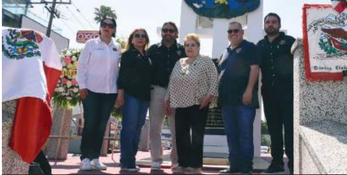
Leones Chapultepec, Leones La mesa y Leones Tijuana A.C.

Morales, actual presidenta de la Sociedad de Historia de Tijuana. Durante el acto la presidenta de la Sociedad de Historia recordó que desde hace 40 años homenajean a quienes lucharon el 22 de junio de 1911 defendiendo la ciudad de Tijuana. Se honra, cada 22 de junio, a nuestros héroes que defendieron con su vida este girón a la patria. Los fundadores de la Sociedad de Historia, se dieron a la tarea de crear un organismo abierto en donde pudieran pertenecer todos aquellos que les interesa nuestro pasado histórico a 48 años de aquel 28 de febrero de 1976 mucho ha sucedido, los objetivos se han logrado a base de esfuerzo, trabajo y mucho cariño a nuestra ciudad. Donde se dictaminó que Tijuana nació legalmente el 11 de julio de 1989.