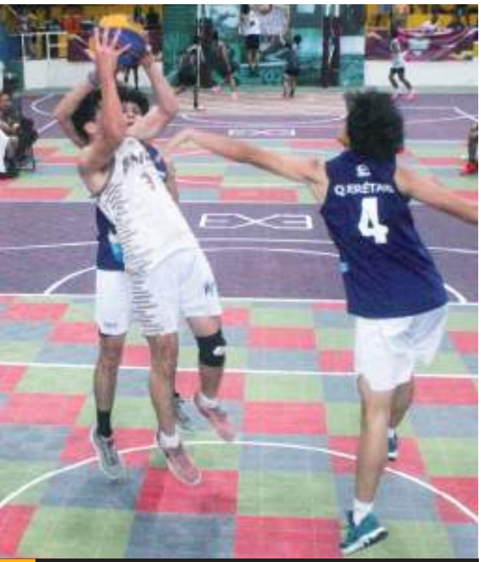
La competencia se desarrolló en Ciudad del Carmen.

Los bajacalifornianos durante la competencia propinaron el primer nocaut en su categoría terminando en el tercer sitio de su grupo con marca de 2-2.