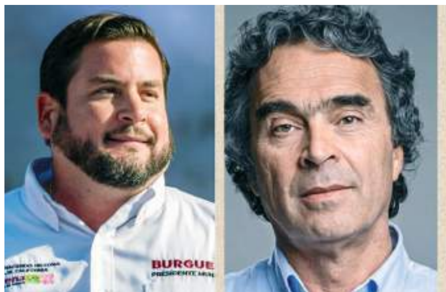
TIJUANA.- El próximo lunes 8 de julio el Alcalde electo de Tijuana, Ismael Burgueño Ruiz sostendrá un encuentro con el ex Alcalde de Medellín, Sergio Fajardo Valderrama.

ció el 19 de junio de 1956 en Medellín, Colombia.