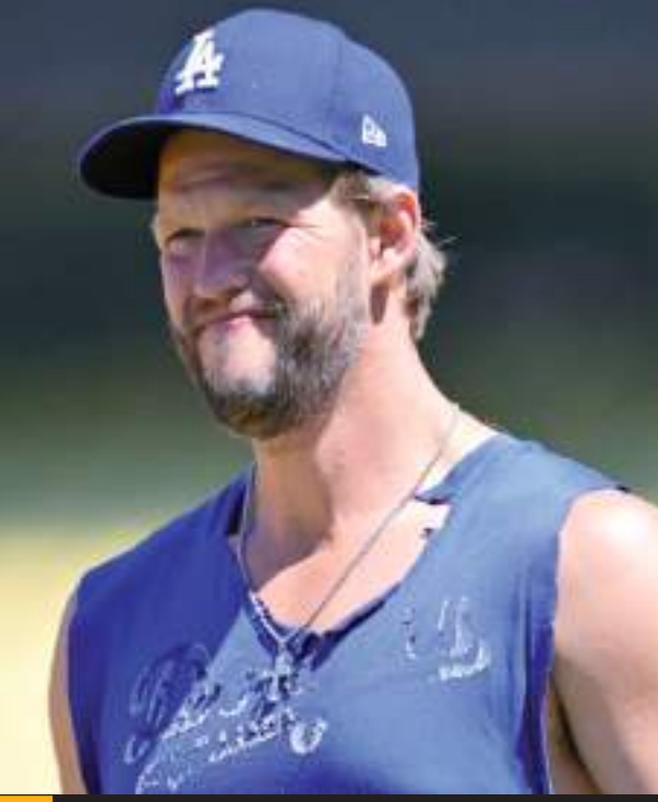
El monticular dio un paso positivo el martes, soltando el brazo en el Dodger Stadium.

Kershaw, ganador de 210 juegos en Grandes Ligas, se sometió a una cirugía el pasado 3 de noviembre para reparar los ligamentos glenohomerales y la cápsula del hombro izquierdo. Tuvo marca de 13-5 con efectividad de 2.46 en 131.2 entradas entre 24 aperturas la temporada pasada.