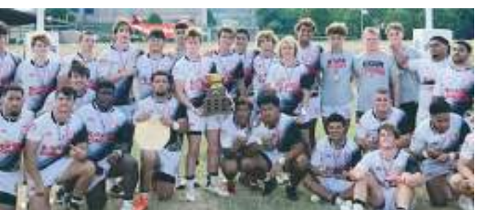
El equipo santiaguino se consagró en la categoría Sub 19.

De esta manera, San Diego Legion Rugby Academy puso en alto el Sur de California con el torneo en el que participaron los equipos juveniles de los clubes de la Major League Rugby de los Estados Unidos, en la búsqueda del desarrollo de más talentos rumbo al profesionalismo.