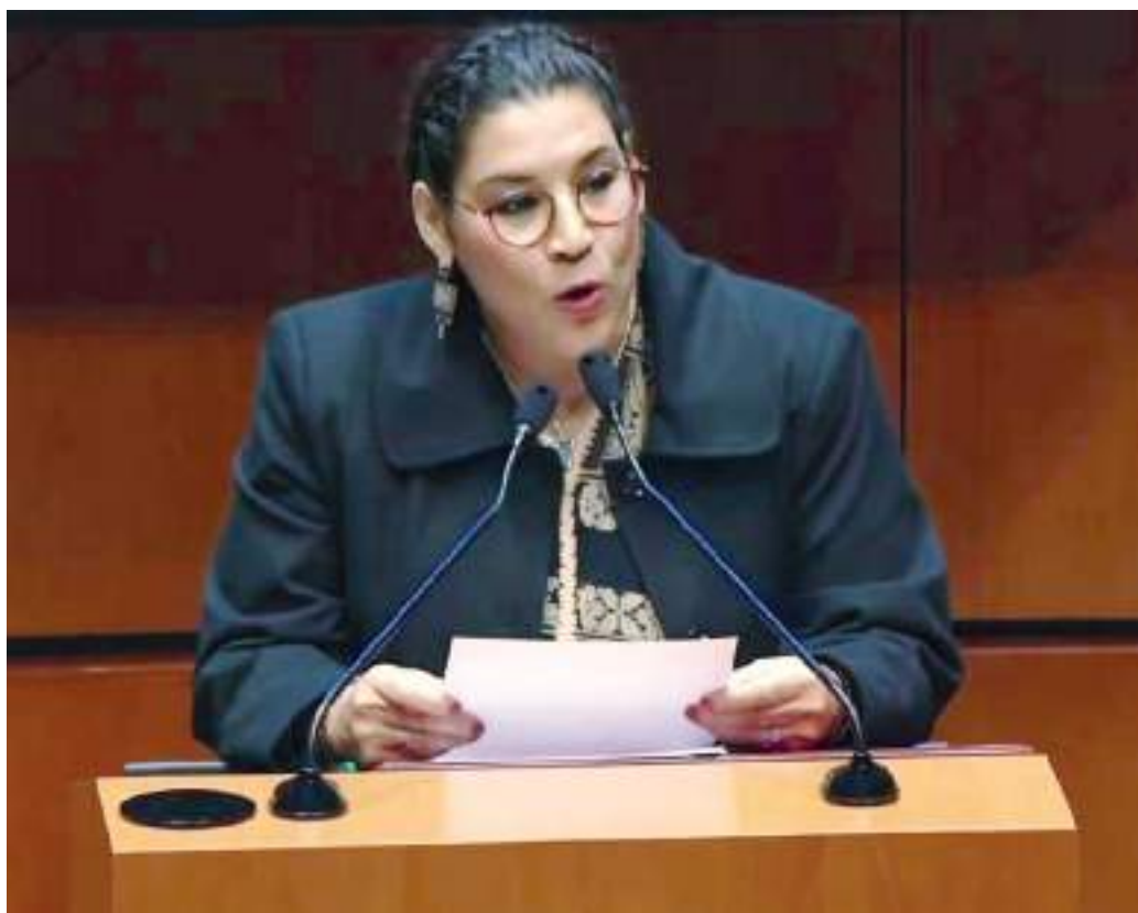
TIJUANA LENIA BATRES GUADARRAMA...

Foro sobre la Reforma al Poder Judicial.