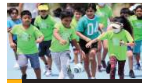
El complejo deportivo de Valle Dorado será sede de la actividad.

Los niños y jóvenes de ambas ramas que asistan al curso aprenderán los fundamentos de bádmiton, judo, esgrima, basquetbol, tenis de mesa y gimnasia, entre otras actividades.