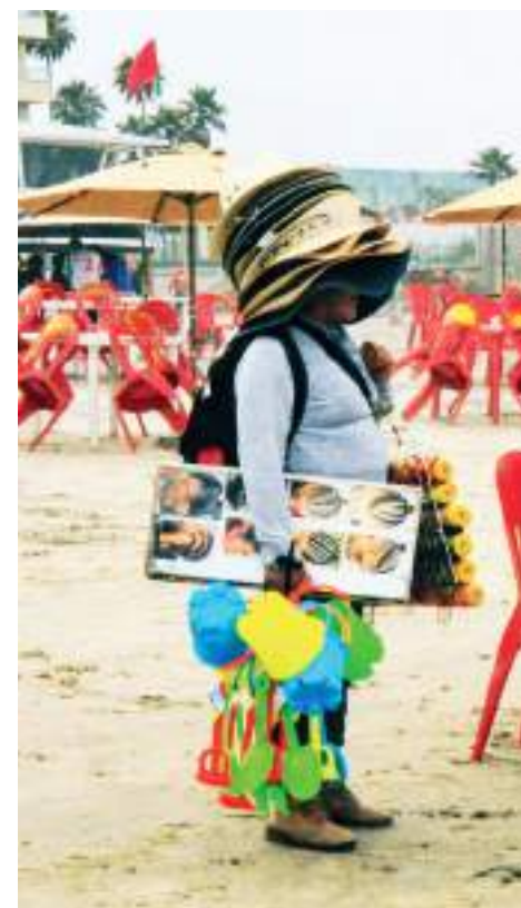
PLAYAS DE ROSARITO.- Vendedores ambulantes y prestadores de servicios en playa, esperan que sus ventas mejoren en el fin de semana del 4 de julio.

Las expectativas son buenas para el comercio ambulante, pero será hasta el jueves 4 o viernes 5, cuando podrán constatar si el fin de semana de 4 de julio sea mejor que el del año pasado, así como de los últimos meses en los que las ventas no han sido tan buenas. (scg)