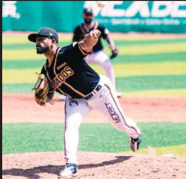
El zurdo de 34 años arrancó la campaña con Dorados.

En la jornada dominical el ex prospecto de Piratas de Pittsburgh hizo su primera apertura desde el 26 de abril y lanzó seis entradas sin permitir carrera, espacio cuatro hits, con cinco ponches y dos bases por bolas para acreditarse la victoria en el triunfo de 10-0