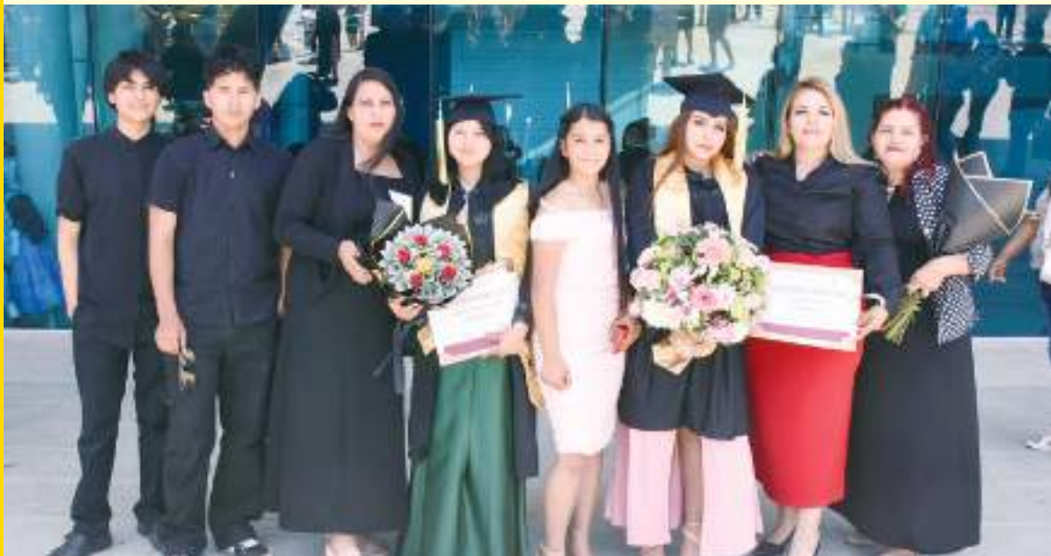
Familia García, orgullosa con su graduado.