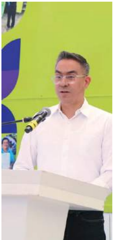
MEXICALI.- El secretario de Educación asegura que el dinero faltante del PIMEE será entregado.