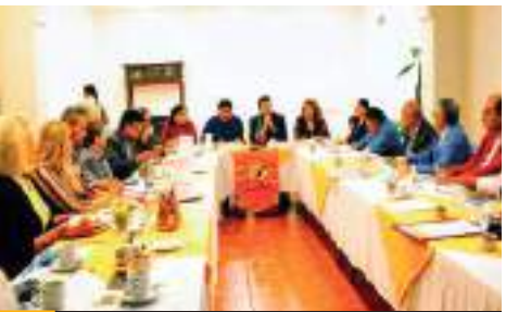
PLAYAS DE ROSARITO.- El Baja California Center, es el único Centro de Convenciones en el país con vista al mar, y es accesible a todos los sectores que organicen un evento.

tengan temor a rentar el Centro de Convenciones para un evento, "nos ajustamos a sus presupuestos, pero utilicen nuestros espacios que además de cómodos, amplios, con estacionamiento y diversas amenidades, cuentan con una vista que nadie tiene, somos privilegiados", destacó. (scg)