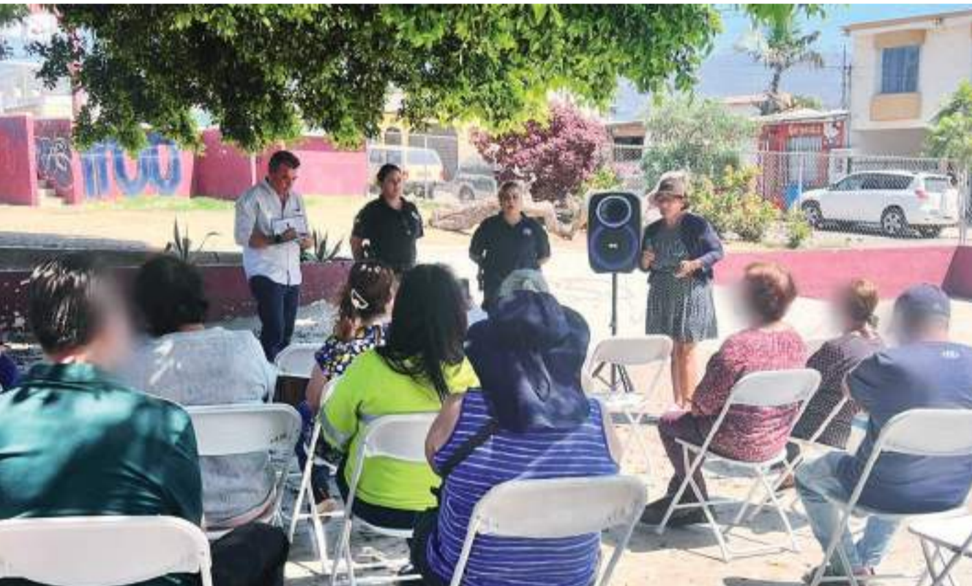
ENSENADA.- Interesados pueden contactar a la Subdirección de Prevención del Delito al (646) 182-3000 extensión 2742, de lunes a sábado, de 8:00 a 17:00 horas.

Por lo anterior, es que se invita a la ciudadanía a formar parte de estas redes y a aquellos interesados en obtener más información, les instó a contactar a la Subdirección de Prevención del Delito al (646) 182-3000 extensión 2742, de lunes a sábado, de 8:00 a 17:00 horas.