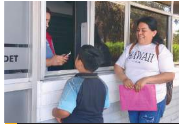
El campamento se realizará en cinco categorías.

Habrán cinco categorías en la que podrán inscribir a las niñas y niños al Campamento, que serán Hormiguitas (4 a 5 años, morado), Linces (6 a 7 años, azul), Gacelas (8 a 9 años, rojo), Mapaches (10 a 11 años, amarillo) y Tigres (12 a 13 años, naranja). En todas las categorías serán admitidos niñas y niños con discapacidad.