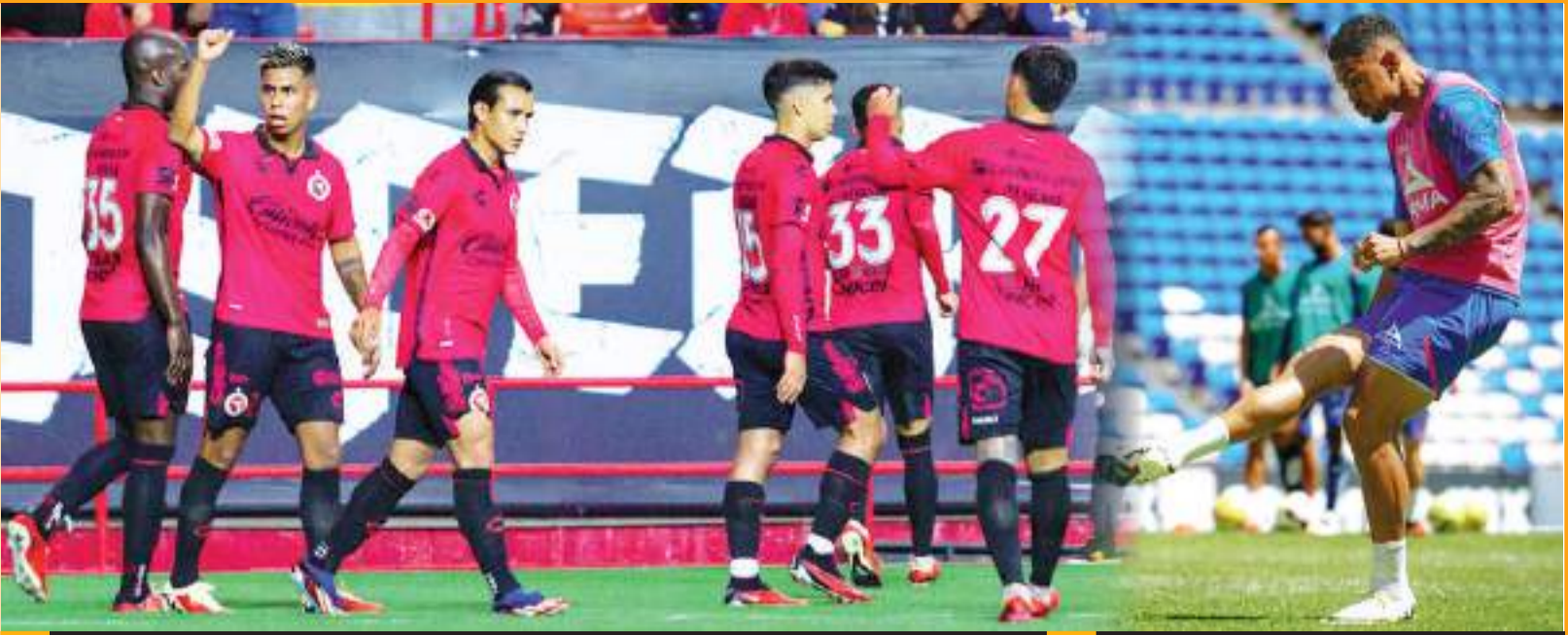
Los Xolos llega al Clausura después de golear en partido amistoso al Herediano de Costa Rica.