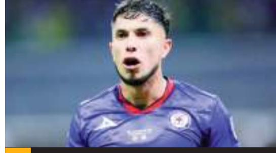
Salcedo pidió a Cruz Azul su salida con efecto inmediato. Se iría como agente libre.

No es la primera ocasión en la que "El Titán" se ha visto envuelto en temas controversiales,