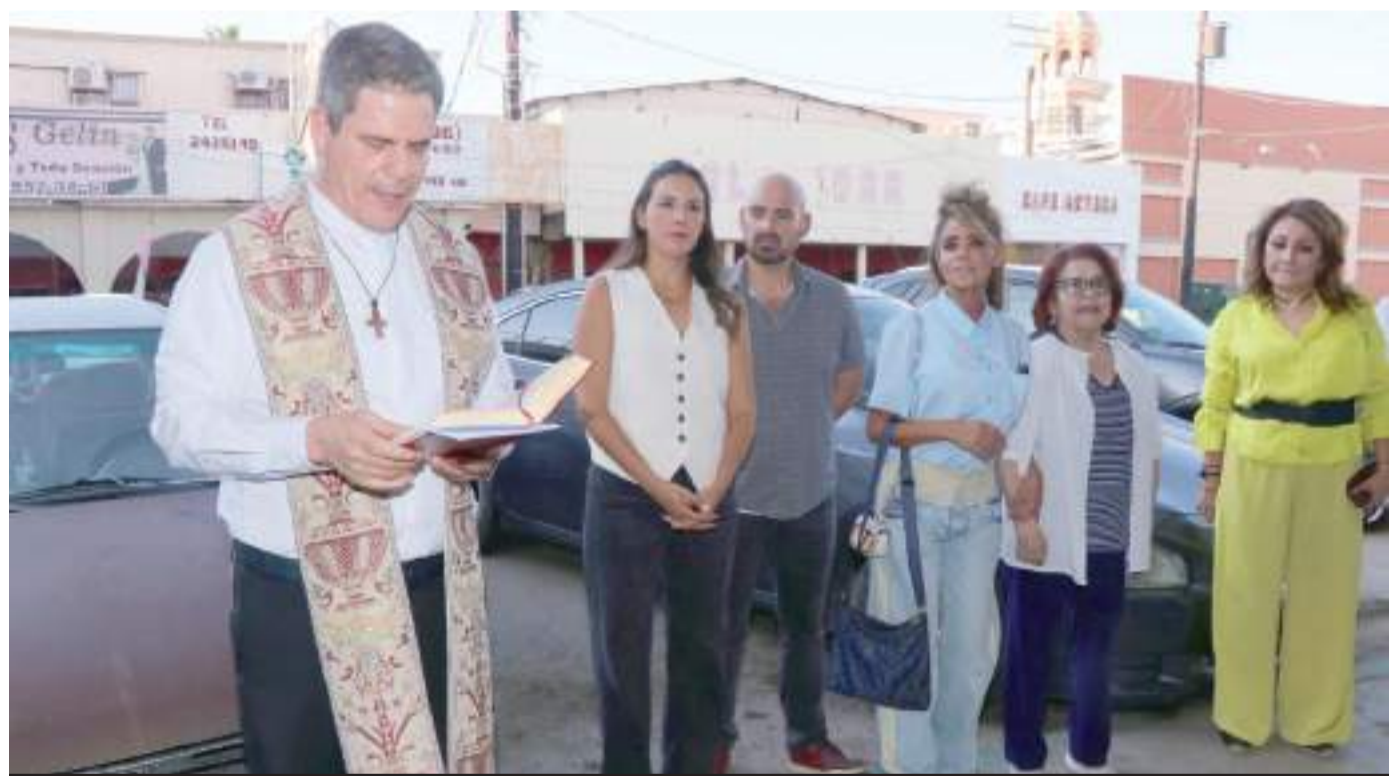
Aspecto de la bendición.