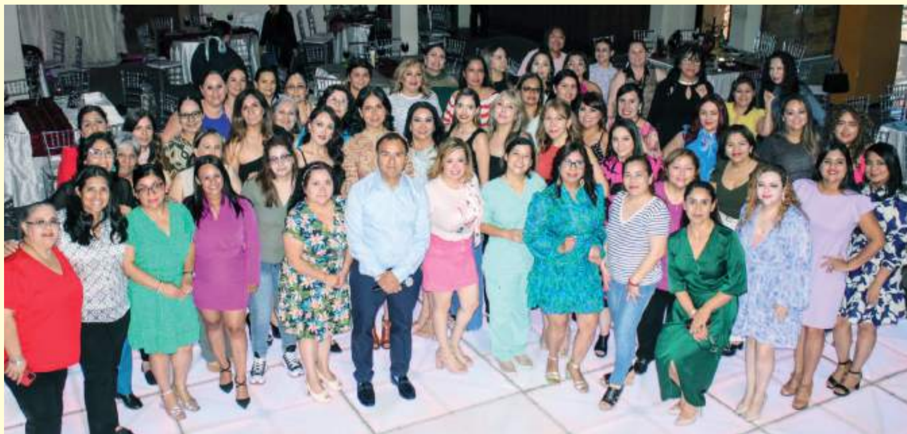
Las festejadas en el convivio a su honor.