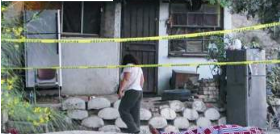
TIJUANA.- Otra noche de terror se registró en distintas colonias de esta ciudad, con saldo de tres personas localizadas sin vida; una abandonada en una maleta.

con calle Eligio Valencia, pocos minutos después de las 9 de la noche.