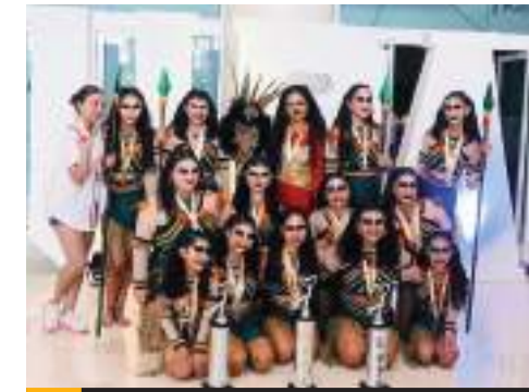
ENSENADA.- Ganó 18 primeros lugares academia ensenadense de danza, en competencia internacional de baile que tuvo lugar en Puerto Vallarta, Jalisco.

Finalmente el CECyTE BC se prepara para recibir a las y los más de 28 mil estudiantes que estarán cursando Primero, Tercero y Quinto semestre en alguno de los 28 planteles y 12 grupos educativos en todo el Estado, a partir del lunes 19 de agosto del año en curso.(bpa).