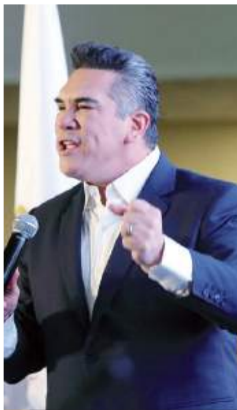
Alejandro "Alito" Moreno, se propone mantenerse en el cargo, tras la Asamblea Nacional del domingo.