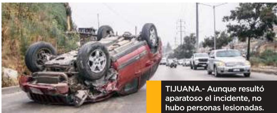
TIJUANA.- Aunque resultó aparatoso el incidente, no hubo personas lesionadas.

La camioneta, una de la marca Jeep Grand Cherokee de color guinda, placas de circulación de California, quedó con las ruedas hacia arriba sobre el carril de circulación.