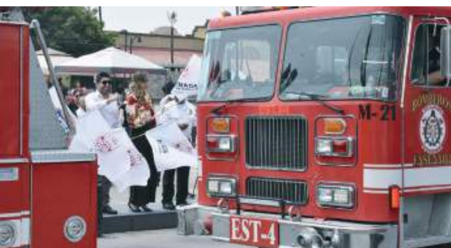
ENSENADA.- El Gobierno Municipal aplica alrededor de 1.2 millones de pesos en la adquisición de equipo para personal operativo de la Dirección de Bomberos.

El primer edil aprovechó para destacar el trabajo que realiza la corporación en bienestar de la comunidad, arriesgando inclusive su vida en la atención de las emergencias, como en el incendio forestal de finales de junio. (bpa).