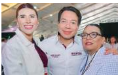
MEXICALI MARINA DEL PILAR ÁVILA OLMEDA...

Da resultados el operativo de Seguridad por el 4 de julio en este puerto.