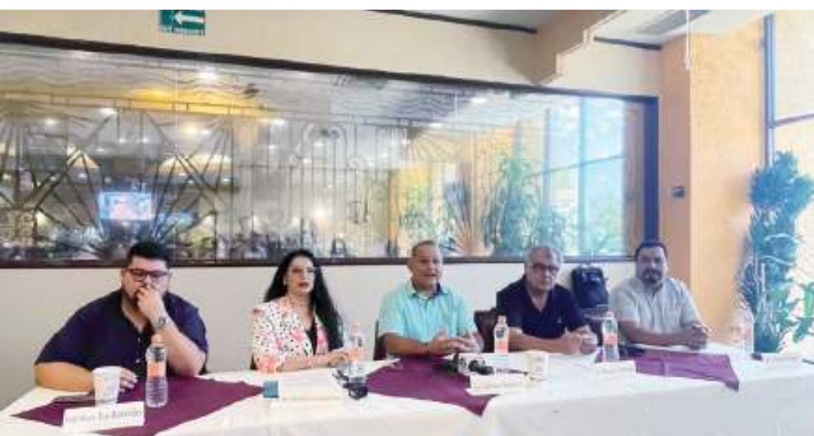
MEXICALI.- Preparan grupos en defensa de la vida, amparos contra la Ley Infancias Trans.