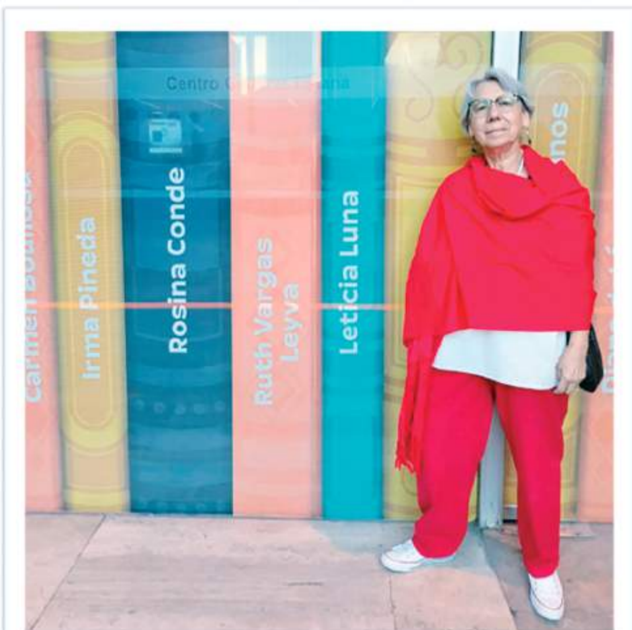
Rosina Conde recibirá el Premio Bellas Artes de Literatura.

Desde entonces la obra de Rosina Conde ha mantenido su coherencia retadora, su intensidad narrativa, como una escritora que sigue siendo vital para la literatura bajacaliforniana en particular y para la literatura nacional en general. Alguien que habla sin tapujos, alguien que cuenta los cuentos que muchos no quieren escuchar.