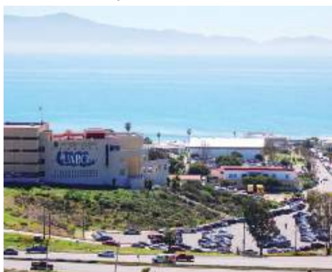
MEXICALI.- El primero de Julio empezó la etapa vacacional en la UABC para el personal académico y administrativo, regresando labores hasta el 29 del mes en curso.

También, las y los aspirantes a cursar la licenciatura en Gestión e Innovación Organizacional, perio-