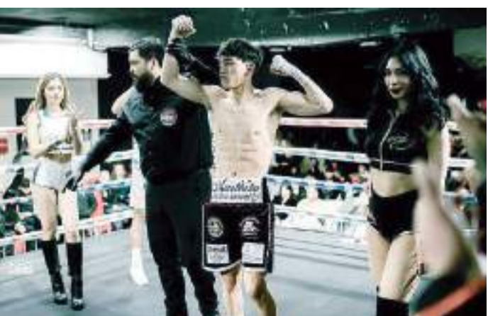
Para Frías será su tercera pelea profesional de este año.

Para esta pelea estará buscando mostrar una cara más agresiva para salir con la mano en alto.