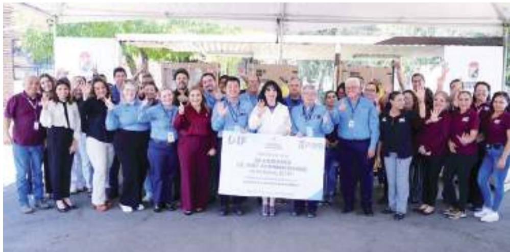
MEXICALI.- Un importante donativo de aires acondicionado recibió DIF municipal de parte de una empresa maquiladora.

"Agradezco la solidaridad de PIMS al donar estos equipos de aire acondicionado, los cuales fueron fabricados aquí en Mexicali, demostrando el talento cachanilla, por lo que les quiero reafirmar mi compromiso para seguir siendo una ciudad atractiva para nuevas inversiones", manifestó la pre-