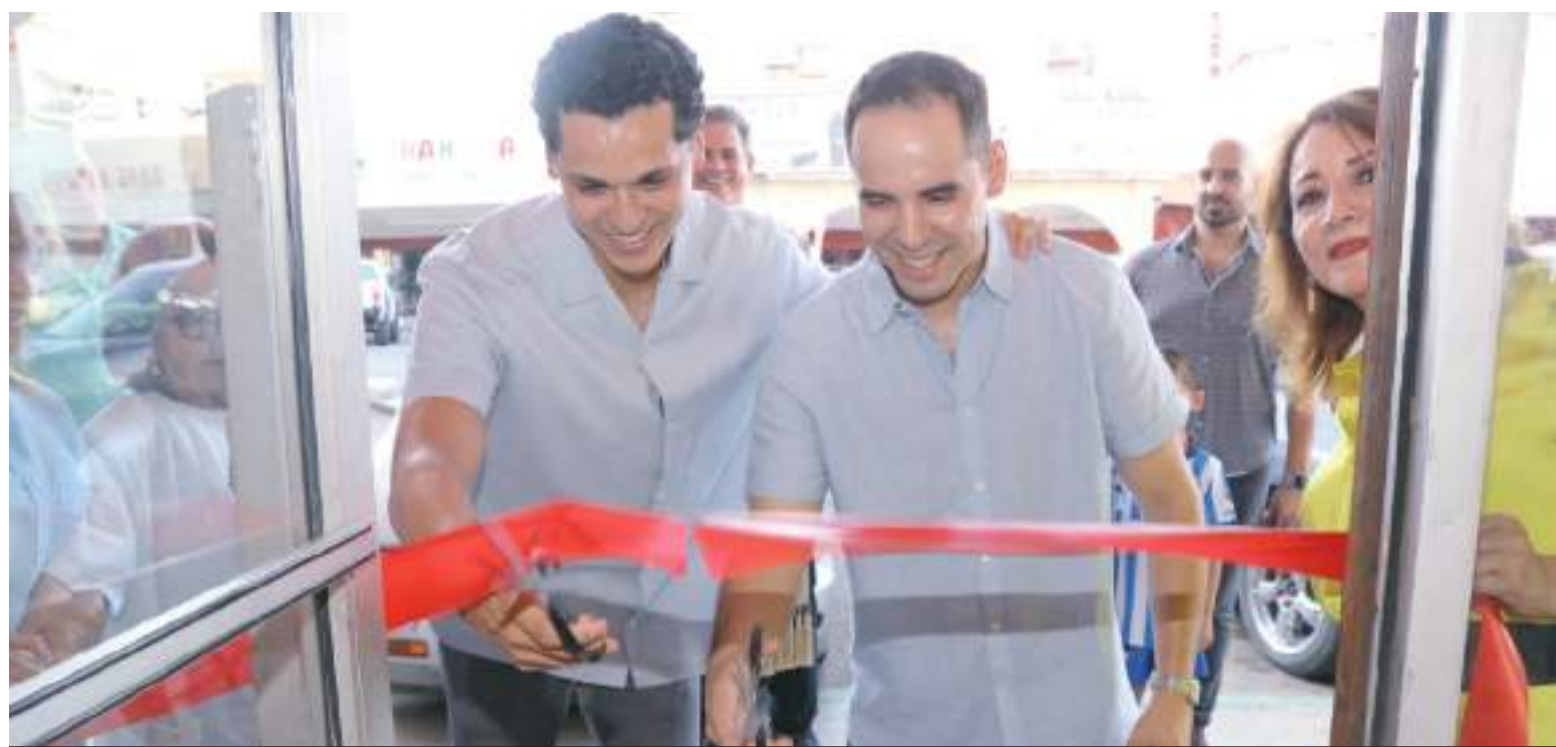
Corte de listón por parte de los empresarios.

EL EVENTO CONTÓ CON LA BENDICIÓN DEL PADRE ADRIÁN TORRES