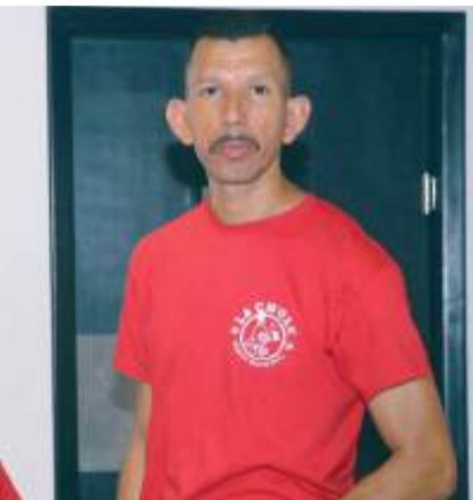
Empleados del lugar.