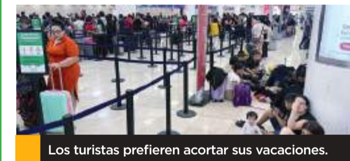
Los turistas prefieren acortar sus vacaciones.

Ante el avance del ciclón hacia territorio mexicano, autoridades ponen en marcha planes de contingencia.