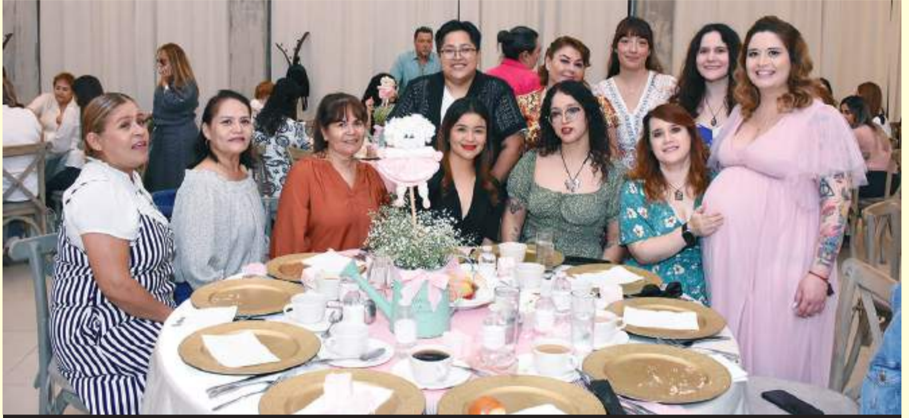
Entre las asistentes al baby shower también estuvieron las tías y amistades cercanas del matrimonio.