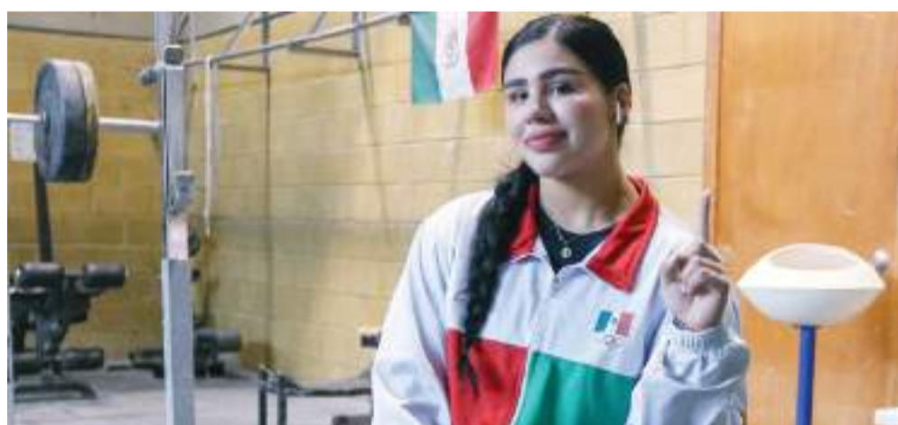
La atleta de Baja California competirá en la división de 81 kilogramos.