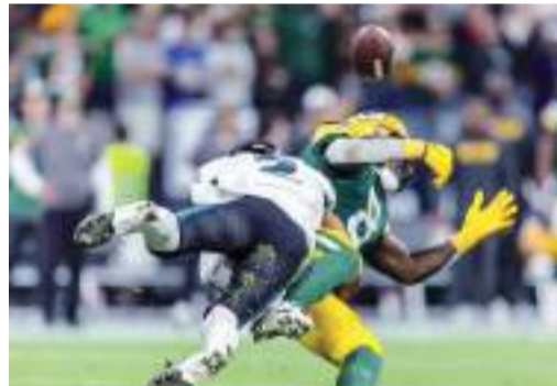
Eagles logró una histórica victoria en el primer juego que la NFL celebró en Brasil.

Para el tercer cuarto, Hurts conectó un pase profundo con AJ Brown, pero Packers también sumó otro touchdown, cortesía de Christian Watson, para poner la pizarra 24-26. Al lograr una intercepción en contra de Love, Filadelfia volvió a sumar otra anotación por conducto de Barkley. Sólo se sumaron dos goles de campo, uno por bando, para sellar el resultado del primer juego de temporada regular de NFL en Brasil.