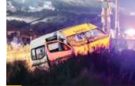
TIJUANA.- Un taxista, en estado de ebriedad, atropelló a un peatón sobre el bulevar 2000.

El mismo que resultó con signos de haber ingerido bebidas alcohólicas, ello fue trasladado a certificar ante la autoridad competente.