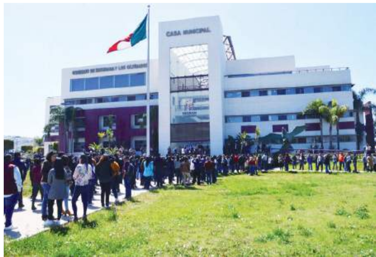
ENSENADA.- Ensenada se encuentra en una zona considerada de alta incidencia sísmica.

rio municipal comentó que las personas interesadas en parti-