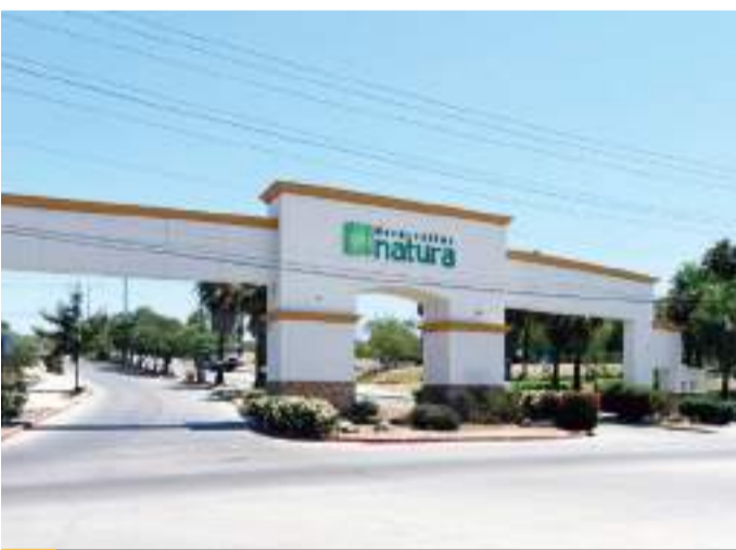
TIJUANA.- Un niño de 11 años fue lesionado con un cuchillo, presuntamente por su padre, quien huyó del lugar.