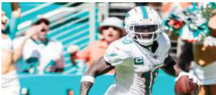
El receptor de Miami fue sometido por la Policía del Sur de Florida por conducir de manera imprudente.

Por su parte Dolphins emitió este lunes un comunicado condenando las acciones de los oficiales involucrados en el incidente, en el que también fue esposado el ala defensiva Calais Campbell, quien opinó que el trato policial hacia Hill fue "innecesario".