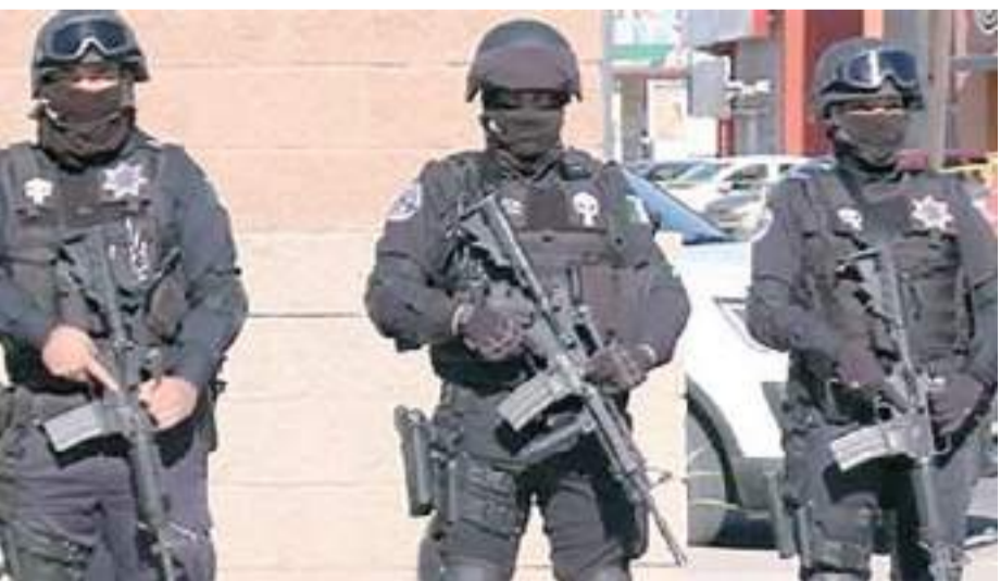
MEXICALI.- La iniciativa privada espera que el examen de control para los policías removidos sea positivo.