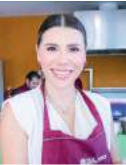
MEXICALI MARINA DEL PILAR ÁVILA OLMEDA...

Garantiza la educación de calidad en Baja California.