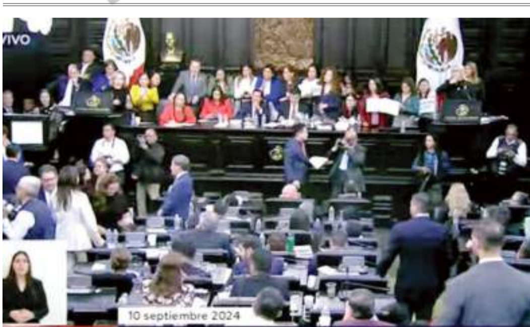
TIJUANA SENADO DE LA REPÚBLICA...

La Presidenta Electa CLAUDIA SHEINBAUM PARDO y el Presidente ANDRÉS MANUEL LÓPEZ OBRADOR visi-