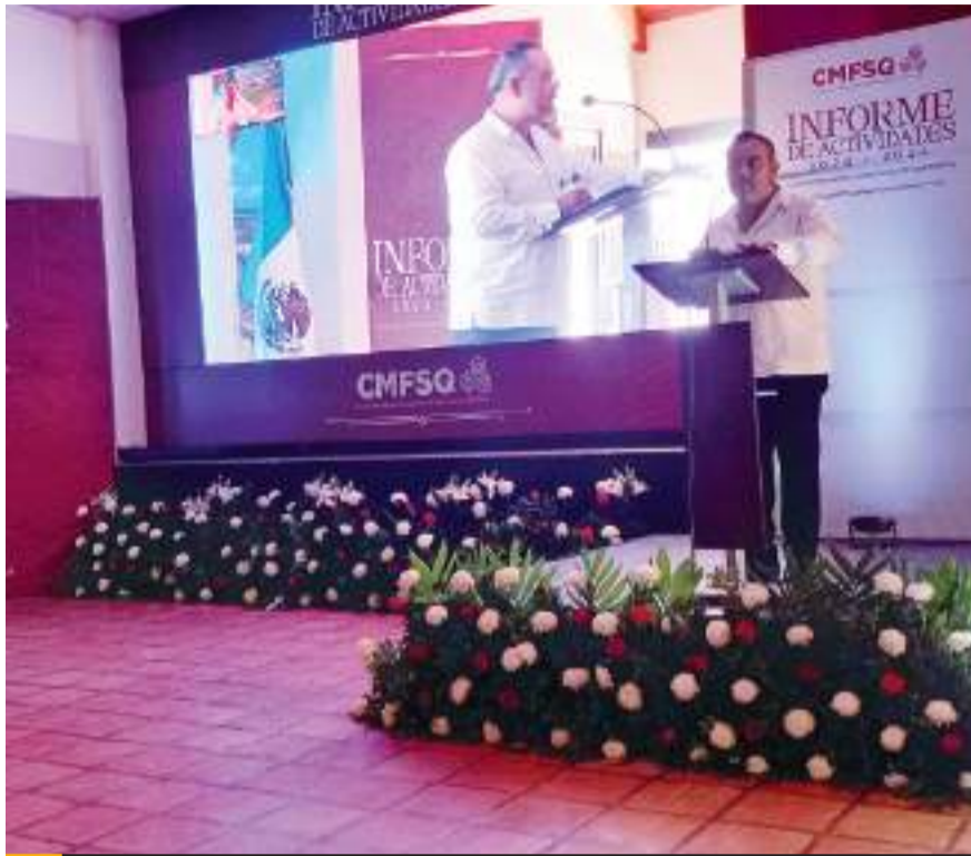
ENSENADA.- El Consejo Fundacional del Municipio de San Quintín rindió su informe.

Para abatir el rezago en servicios públicos, fue la implementación de recolección de basura, dejando para la siguiente administración 15 unidades en funcionamiento para este servicio; el