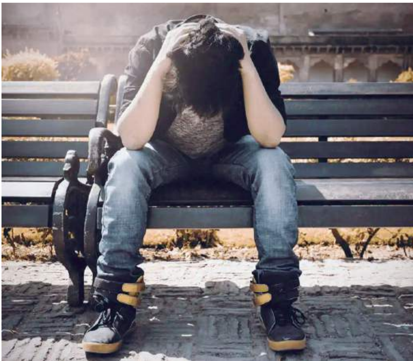
El suicidio es como un fantasma este diario

El Instituto Nacional de Estadística y Geografía (INEGI) es la entidad que ha aportado el panorama estadístico para este flagelo cuya prevención se conmemora hoy bajo la organización de la Asociación Internacional para la Prevención del Suicidio con el aval de la Organización Mundial de la Salud (OMS). Sus datos más recientes indicaron que si en 2017, la tasa fue de 5.3 por cada 100