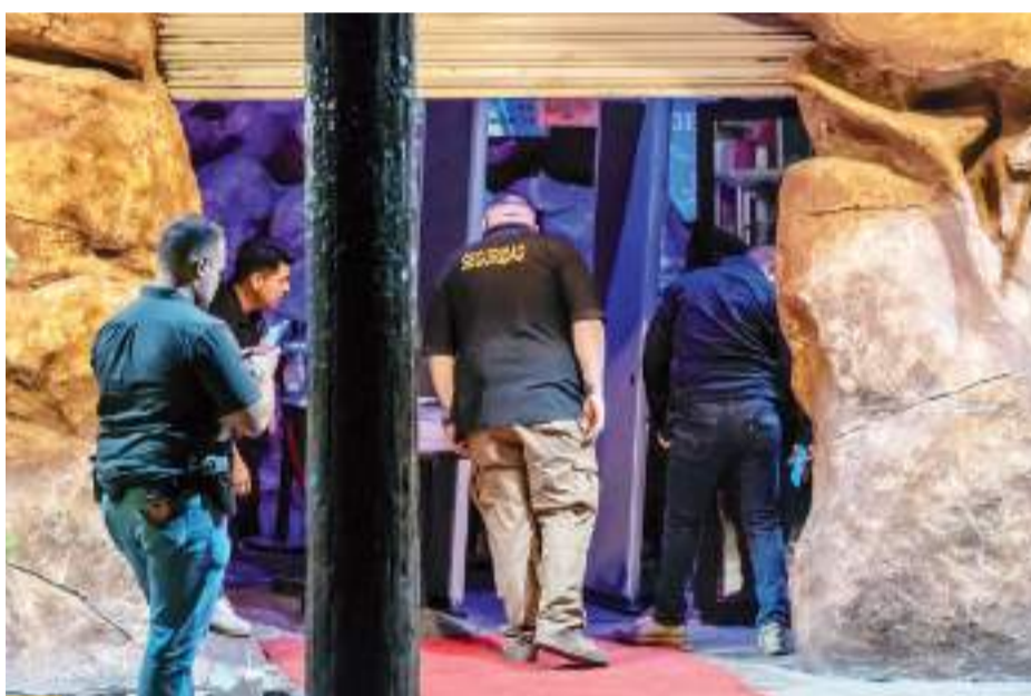
TIJUANA.- Otra agresión a balazos sufrieron empleados del bar "La Cueva del Peludo", en esta ocasión un guardia de seguridad resultó herido; su estado de salud es estable.