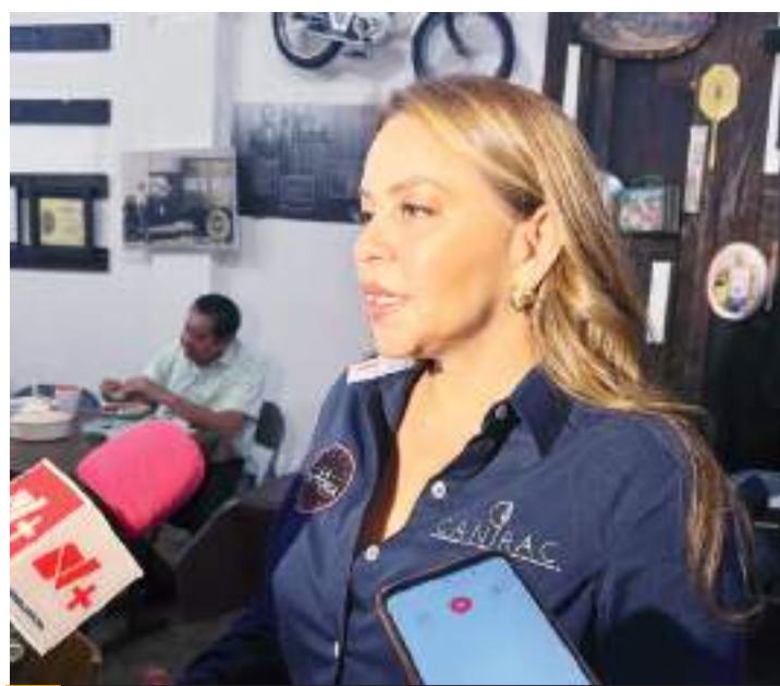
MEXICALI.- La CANIRAC señala que los negocios, donde se han registrado robos, no pertenecen al organismo.

Destacó que, se solicitará una ampliación presupuestal a los diputados, sin mencionar cifra, sólo recordó que en la pasada elección se imprimieron 17 mil 033 boletas para una población de 15 mil personas, donde se instalarán dos consejos distritales, el 5 y 17, con la participación del INE, quienes integrarán las 27 casillas por una distribución de competencias.