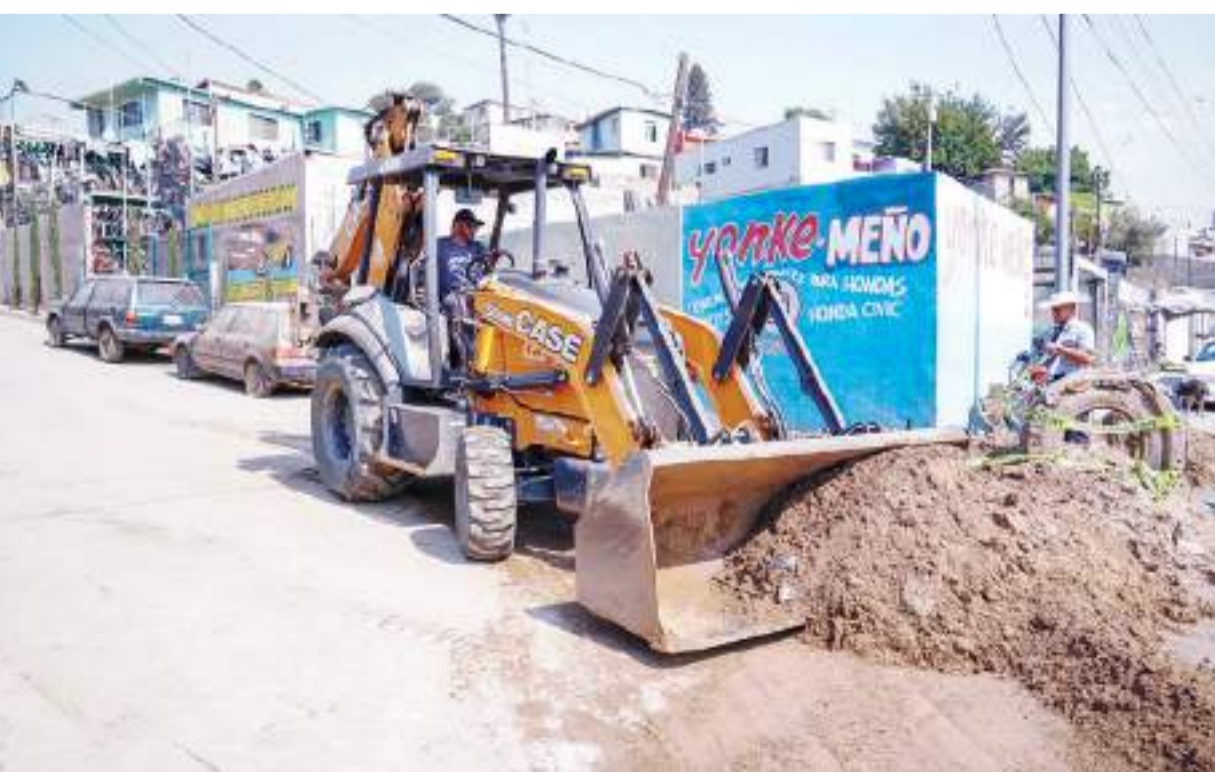
ENSENADA.- La CESPE realizó trabajos de reparación en la línea de conducción de agua potable localizada en el Bulevar Zokolov de la colonia Reacomodo Lomitas.

municándose a los teléfonos 646 173 9710 y 646 173 9790.