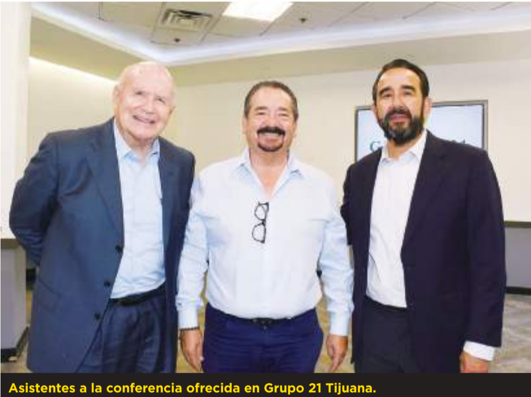
Asistentes a la conferencia ofrecida en Grupo 21 Tijuana.