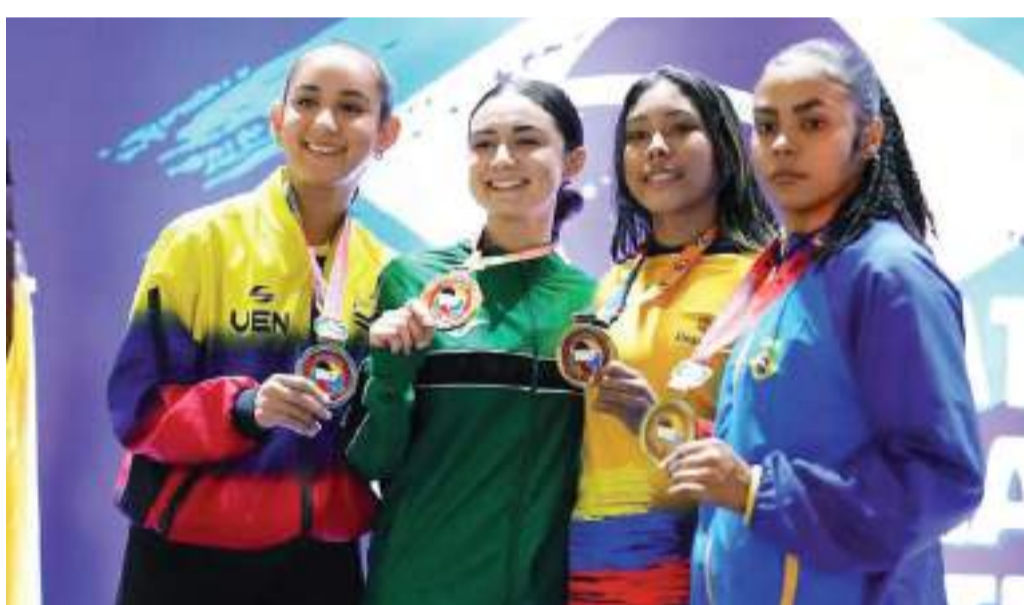
La ensenadense se posicionó en el 1er lugar del Ranking Mundial de la Federación Mundial de Karate WKF.