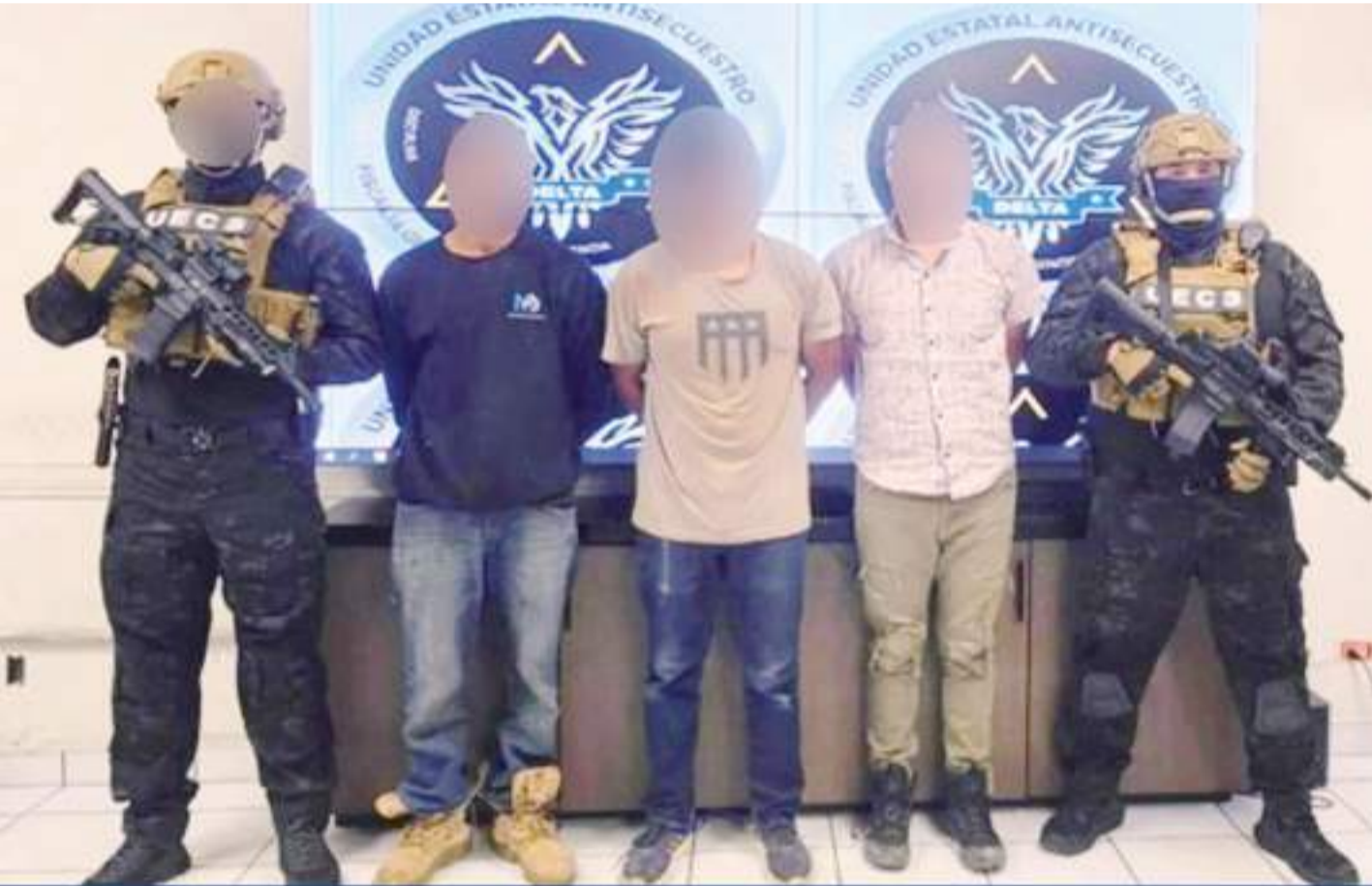
JESÚS "N" ELIASHIM "N" LORENZO "N"

Durante una audiencia reciente, el Juez de Control, dictó el auto de vinculación a proceso contra los imputados por el delito de secuestro agravado y fueron puestos en prisión preventiva como medida cautelar.