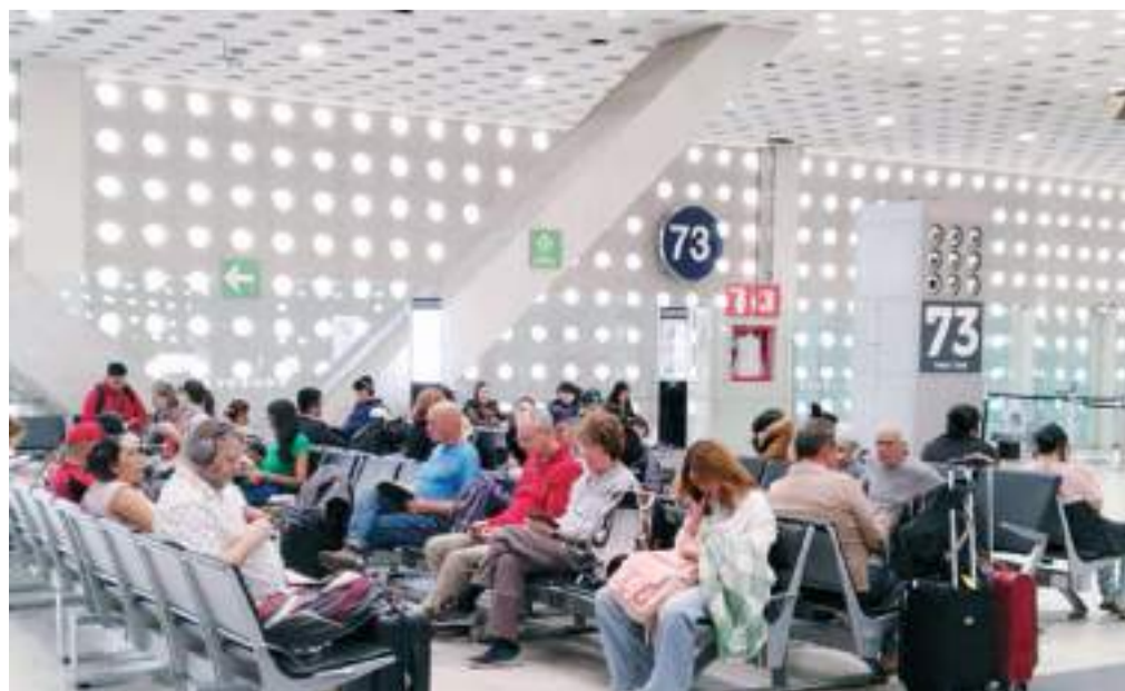
CIUDAD DE MÉXICO.- La Encuesta de Viajeros Internacional del INEGI resultó que en el mes de julio hubo un incremento de 16.5 % en el número de visitantes que ingresaron a México.

En el mes de referencia, residentes en México que visitaron el extranjero gastaron 987.3 millones de dólares, cantidad superior en 9.5 % a la de julio de 2023.