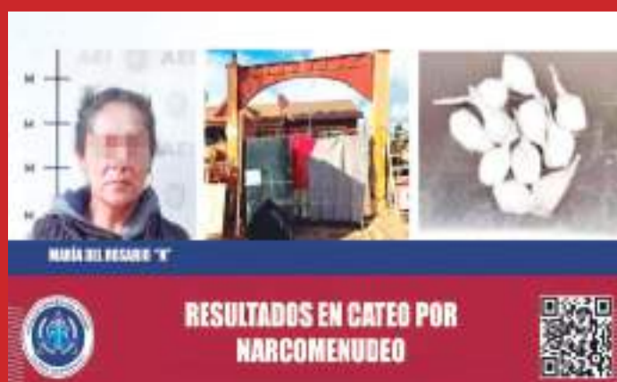
RESULTADOS EN CATEO POR NARCOMENUDEO