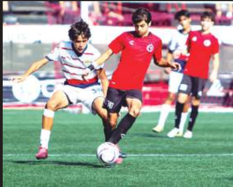
Xolos Sub 14 golearon por 4-1.

Los canes aztecas se perfilaron en la segunda parte para buscar el triunfo en casa, al 58' el atacante Diego Otañez anotó de cabeza para poner el segundo de los fronterizos. El manejo y posesión total del duelo lo mantuvieron los caninos, fue hasta el 85' que el capitán de