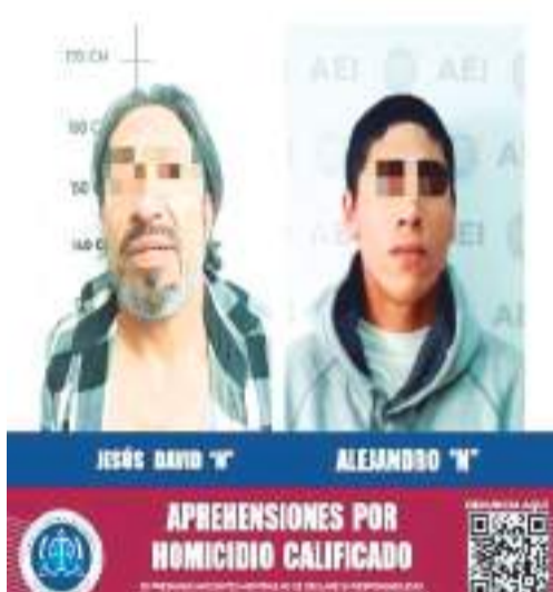
APREHENSIONES POR HOMICIDIO CALIFICADO