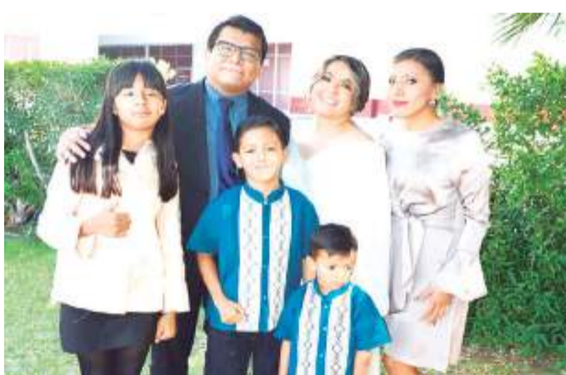
Familiares de los novios.