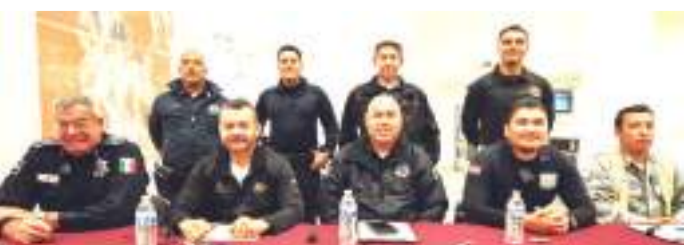
El INDE BC contará con el apoyo de las diferentes corporaciones.

Y la FESC vigilará el paso en calzada Cetys; la Guardia Nacional en Abelardo L. Rodríguez y Calle Novena; y la Legión de Halcones en Argentina, Milton Castellanos, Garcilazo, Calle D y Madero.