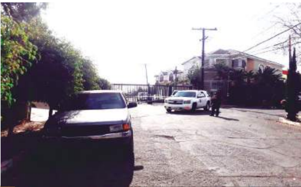
ENSENADA.- En el ejido Raúl Sánchez Díaz, sobre la carretera Transpeninsular, fue encontrado un hombre sin vida, con aparentes indicios de violencia.

En forma rápida, los agentes se trasladaron al lugar donde se observa una persona en posición de