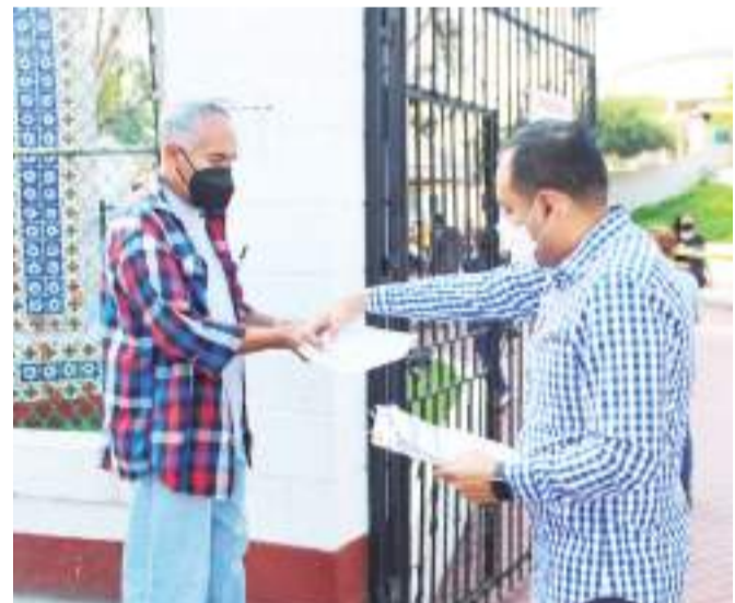
ENSENADA.- Ante los cambios bruscos de temperatura y el cambio de estación otoño-invierno, es necesario extremar precauciones, debido a que esa condición genera aumento hasta del 50 por ciento en infecciones respiratorias.

La sugerencia a la comunidad es tomar precau-