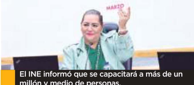
El INE informó que se capacitará a más de un millón y medio de personas.