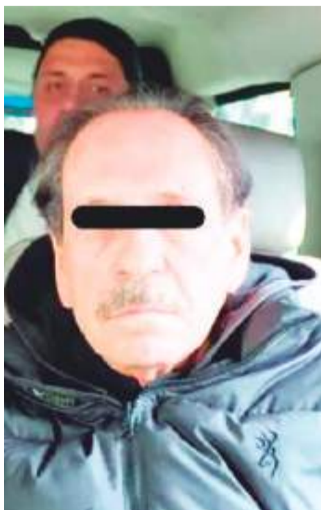
El detenido será presentado ante el Juez Federal que emitió la orden de aprehensión, con sede en el Centro de Justicia Penal Federal de la Ciudad de México.