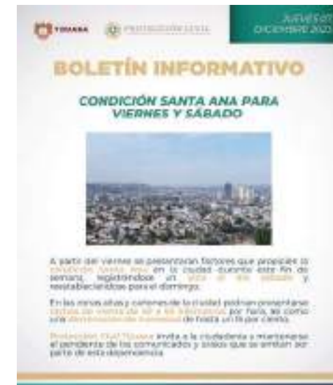
TIJUANA.- Para hoy y mañana se pronostican vientos de Santa Ana en la ciudad, con ráfagas de viento de 40 a 60 kilómetros por hora.