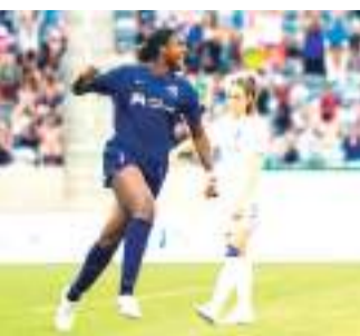
Durante la temporada regular hizo cuatro goles.

En dos temporadas con San Diego, el delantero hizo 37 apariciones (nueve como titular) y anotó cuatro goles en la temporada regular.