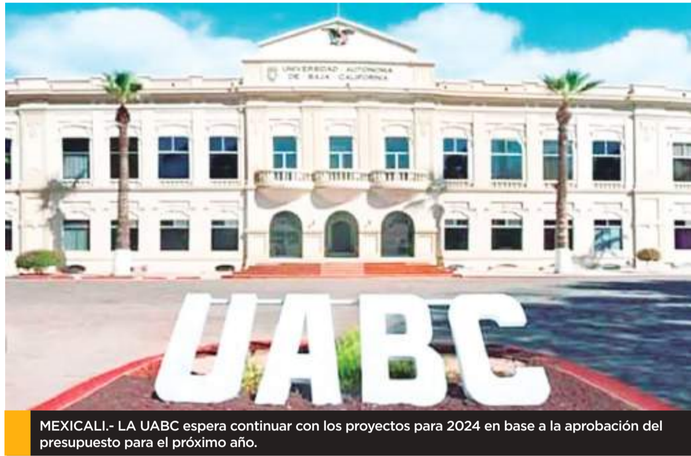
MEXICALI.- LA UABC espera continuar con los proyectos para 2024 en base a la aprobación del presupuesto para el próximo año.

Los otros puentes tienen 22 y 23 años de vida, por lo que todavía dijo el funcionario, son seguros para su circulación, "presentaremos un proyecto ejecutivo a la siguiente administración municipal con las características necesarias de lo que se necesita, e insisto los puentes no se van a caer" concluyó.