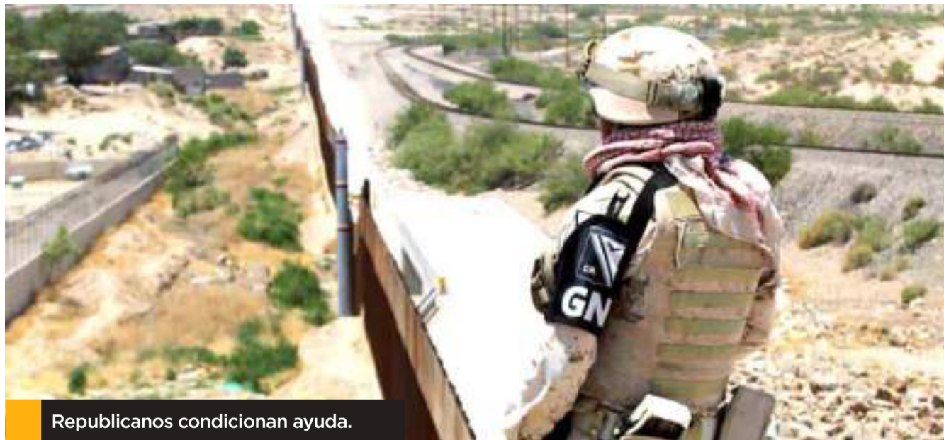
Republicanos condicionan ayuda.

Biden dijo antes de la votación estar dispuesto a hacer “concesiones significativas” a los republicanos en cuanto a la seguridad fronteriza.