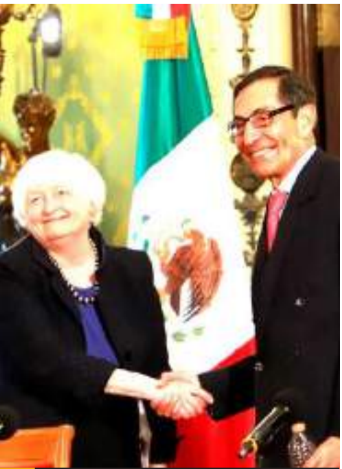
Yanet Yellen y Rogelio Ramírez

“Hoy me reuní con el Secretario de Hacienda y Crédito Público, Rogelio Ramírez de la O de México, para discutir nuestros esfuerzos de colaboración para compartir el fentanilo y el financiamiento ilícito y profundizar los vínculos entre nuestras dos economías, lo que beneficia a ambas naciones,” lee la publicación de Yellen.