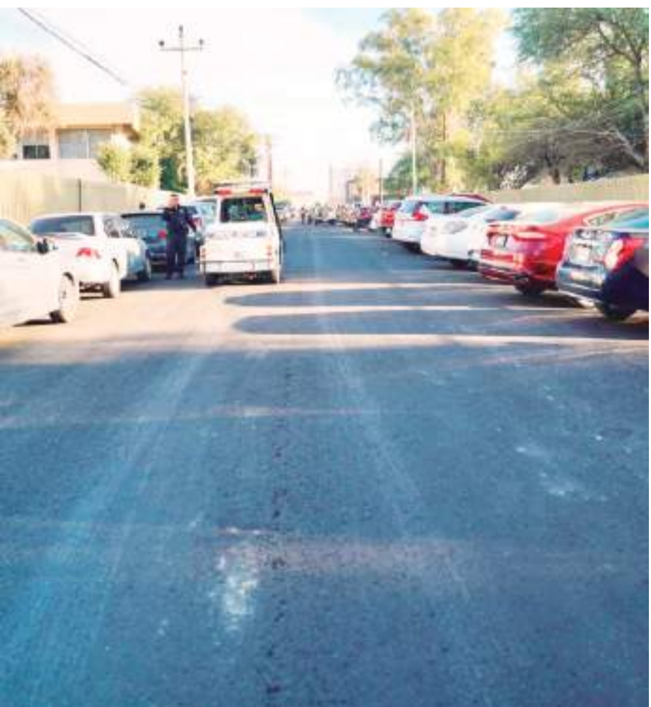
MEXICALI.- El Ayuntamiento de Mexicali cumple con la UABC en mejorar la vialidad ubicada en Centro Cívico.

Este organismo trabaja de manera constante en fomentar la conciencia para lograr ahorros en el consumo, al mismo tiempo que desarrolla programas para mejorar la eficiencia de los procesos, beneficiando directamente a la ciudadanía.