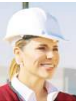
MEXICALI MARINA DEL PILAR ÁVILA...