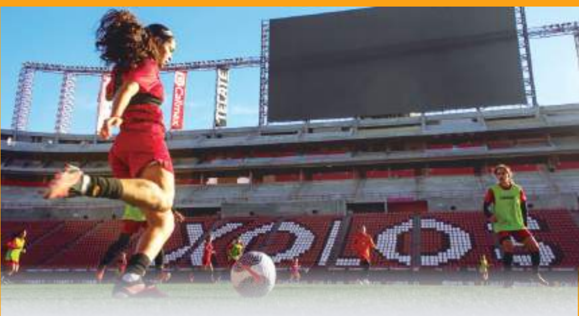
En el Mictlán, las “Perrísimas” albergarán tres partidos de preparación.