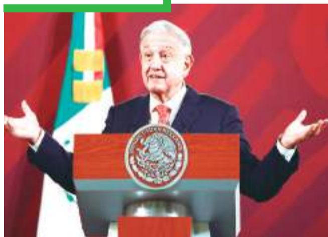
López Obrador adelantará la presentación de las iniciativas de reforma de su llamado "Plan C".