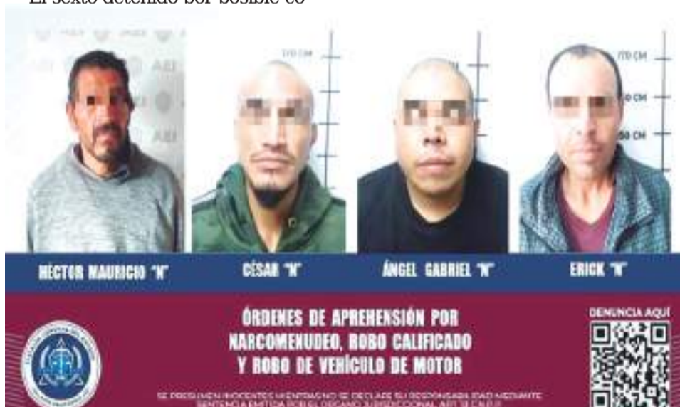
ÓRDENES DE APREHENSIÓN POR NARCOMENUDEO, ROBO CALIFICADO Y ROBO DE VEHÍCULO DE MOTOR