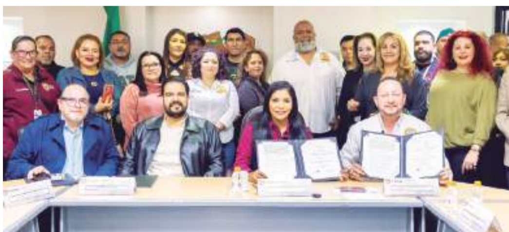
TIJUANA MONTSERRAT CABALLERO...

Y para cuidar su dinero, con el objetivo de que la población pueda regularizar su situación fiscal, el Servicio de Administración Tributaria en Baja California (SATBC), invitó a la población a aprovechar las últimas semanas del decreto que con-