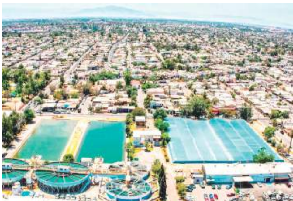
MEXICALI.- Este día la CESPМ celebra su 56° aniversario como organismo público descentralizado del Gobierno del Estado de Baja California, fundado en diciembre de 1967.