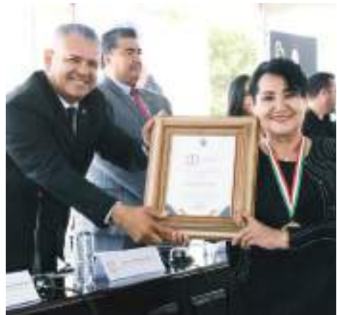
ENSENADA.- En el marco del 142 aniversario de la fundación de Ensenada como asentamiento urbano, el Municipio entregó el premio de Ciudadano Distinguido 2024 "Antonio Meléndrez".

bienestar integral a las personas en reclusión, para abrir nuevos caminos que conduzcan al mejoramiento de las conductas, hábitos y pensamientos que abonen a una plena reinserción social, incorporándolas a sus comunidades de una manera satisfactoria en lo personal y en lo familiar.