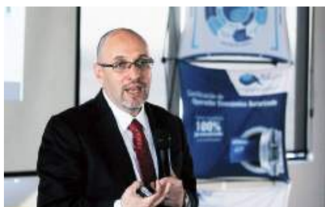
TIJUANA.- Las empresas localizadas en la franja o región fronteriza autorizadas por la Secretaría de Economía tienen la posibilidad de gozar los beneficios arancelarios en las importaciones definitivas para 1,318 fracciones arancelarias.

Así también, revisar las exenciones de los aranceles en las importaciones temporales de acuerdo con los beneficios de los programas IMMEX, por ejemplo, la modalidad de servicio del programa IMMEX.