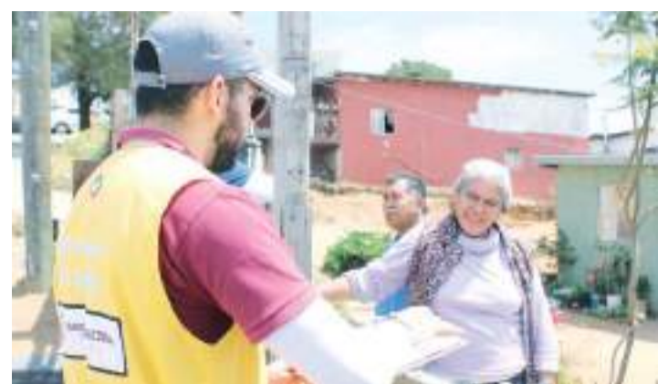
ENSENADA.- Personal especializado de la Jurisdicción de Servicios de Salud recorrió domicilios de la colonia Popular 89.

"En TLC Asociados desarrollamos un equipo multidisciplinario de expertos en auditorías y análisis de riesgos para asesorar y promover el cumplimiento en operaciones de comercio exterior", finalizó.