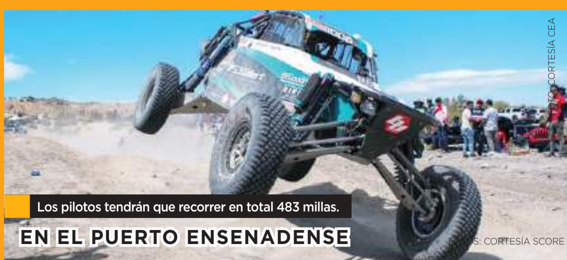
Los pilotos tendrán que recorrer en total 483 millas.