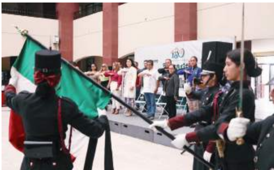
PLAYAS DE ROSARITO.- Celebran el 139 aniversario de la fundación de Playas de Rosarito.