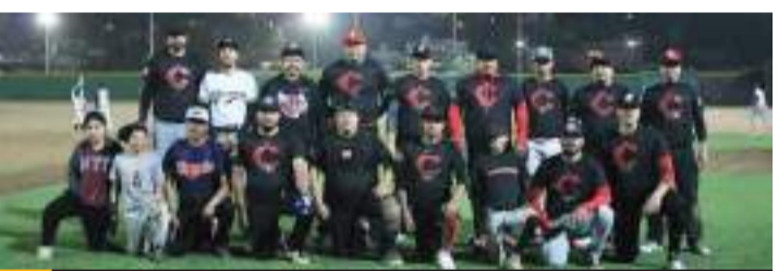
Rojos toman ventaja de 1 juego por 0 sobre Llantera Cantú en la disputa del trofeo de campeón de la Segunda Fuerza A del béisbol de la Rural de Maneadero.

Con este resultado los Rojos tomaron ventaja de 1 juego por 0 sobre Llantera Cantú en la disputa del trofeo de campeón de la Segunda Fuerza A.