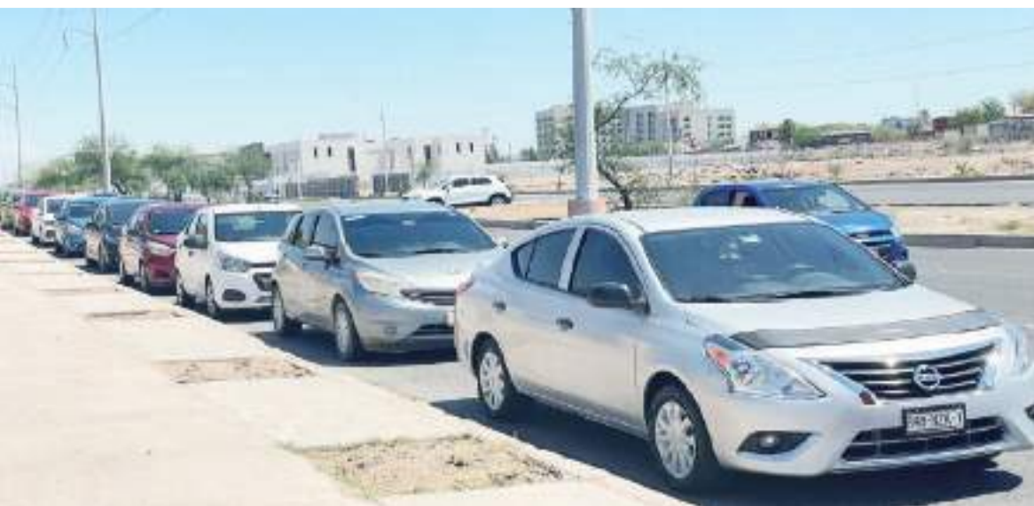
MEXICALI.- Conductores de plataforma de transporte piden cobro justo por registro ante el IMOS.

En respuesta, la mandataria estatal Marina del Pilar solo mencionó que se revisarán los cobros con la secretaría de Hacienda.