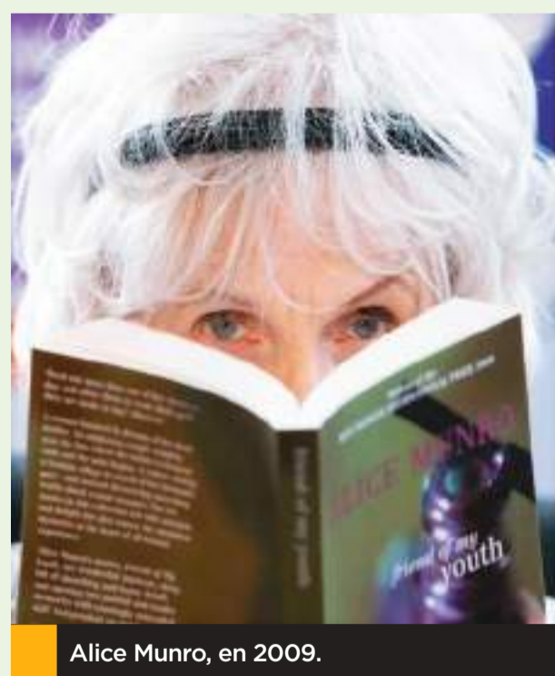
Alice Munro, en 2009.

Pero decía que Alice Munro no fue a recoger su Nobel. No hubo, como se hubiera reconstruido a sí misma, y habría reconstruido su universo, como lo hizo en sus cuentos. Porque lo que de ella queda es no solo ella misma, sino todo aquello que creció a su alrededor. Todo lector de Munro sabe cómo de complicada era llevar una granja de pelería —como la que tenía su padre— durante la Gran Depresión, conoce la apartadísima casa familiar, y cómo fue tener que ocuparse de una madre enferma siendo aún una niña, casarse y tener hijos demasiado pronto; sabe mucho de la culpa, y de intentar aprender a sobornarse a uno mismo. Pero ¿saben qué hubo? Hubo una entrevista, y en esa entrevista Munro habló de