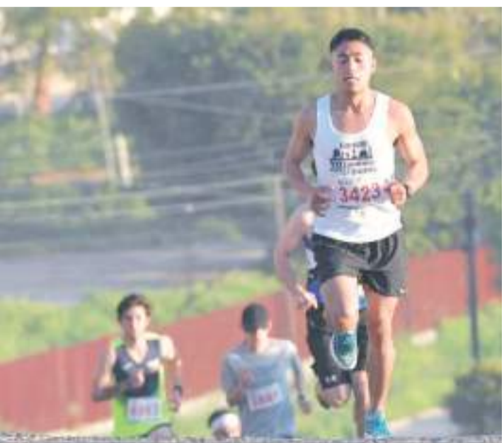
La carrera iniciará en las inmediaciones de la Unidad Deportiva El Rubí.

Para participar será necesario confirmar asistencia mediante el enlace http://bit.ly/3USt7Im y contar con algún número que haya sido entregado en las tres etapas previas de este año, ya que en esta ocasión no habrá registros para nuevos corredores.