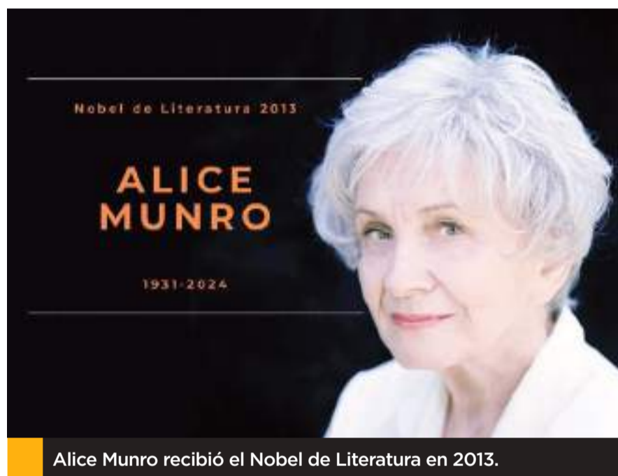
Alice Munro recibió el Nobel de Literatura en 2013.

Los cuentos de algunos de sus libros están entrelazados: es el caso de Escapada y de La vista desde Castle Rock, que alterna la historia de su familia y su emigración a Canadá (uno de sus antepasados escribió un libro titulado Confesiones de un pecador justificado) con el relato de su adolescencia. La situación básica, la historia de fondo, es la de una joven vivaz, con ambiciones intelectuales, que escapa de un confinamiento: el que generan la familia, las costumbres sociales y religiosas, un ambiente tosco o las expectativas sobre lo que debe hacer. Habla de la frustración, del sexo, del paso del tiempo, de gente atrapada o perdida, de matrimonios opresivos o divorcios, del cansancio que produce la maternidad y del desgarramiento del alejamiento de un hijo. Sus personajes a veces son egoístas, sus decisiones pueden dañar a otros: la mirada