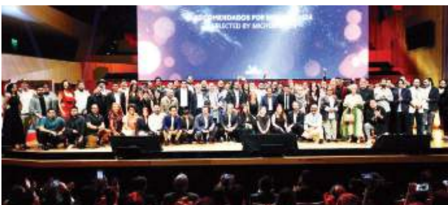
CIUDAD DE MÉXICO.- Baja California obtuvo 22 recomendaciones de restaurantes en la Guía Michelin México 2024.

La Presidenta de la AFEET destacó que las mujeres empresarias que conforman a dicha agrupación representan giros como la hotelería, gastronomía, organización de eventos y touroperadores, entre otros, y participarán con autoridades en la organización del "Tianguis Turístico México 2025", el cual se llevará a cabo por primera vez en Baja California.