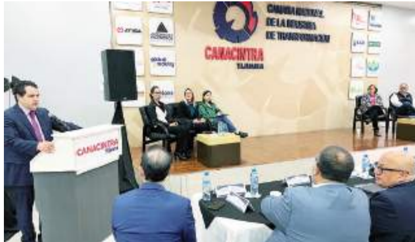
TIJUANA.- Se llevó a cabo el cuarto foro "Diálogos por la democracia" en el que estuvieron los candidatos a senadores para exponer sus propuestas de trabajo en temas de interés para el sector industrial.

El evento contó con la participación de cinco de los aspirantes a senado-