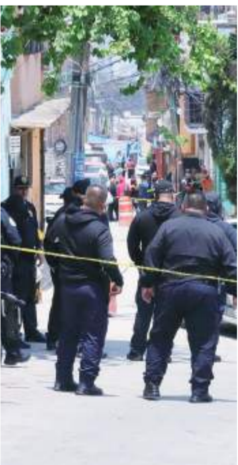
Los políticos en México, tienen un elevado riesgo de ser víctimas de atentados que pueden costarles la vida.

Colima se ubicó de nuevo como el Estado menos pacífico del País el año pasado, seguido de Baja California, Morelos, Guanajuato y Zacatecas. En contraste, Yucatán volvió a ser el estado más pacífico de México, seguido de Tlaxcala, Chiapas, Durango y Coahuila.