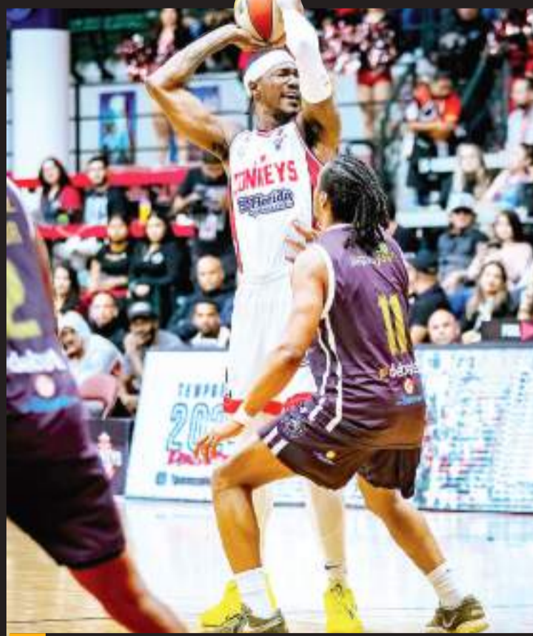
Tijuana se mantiene como líder en la Segunda Vuelta.