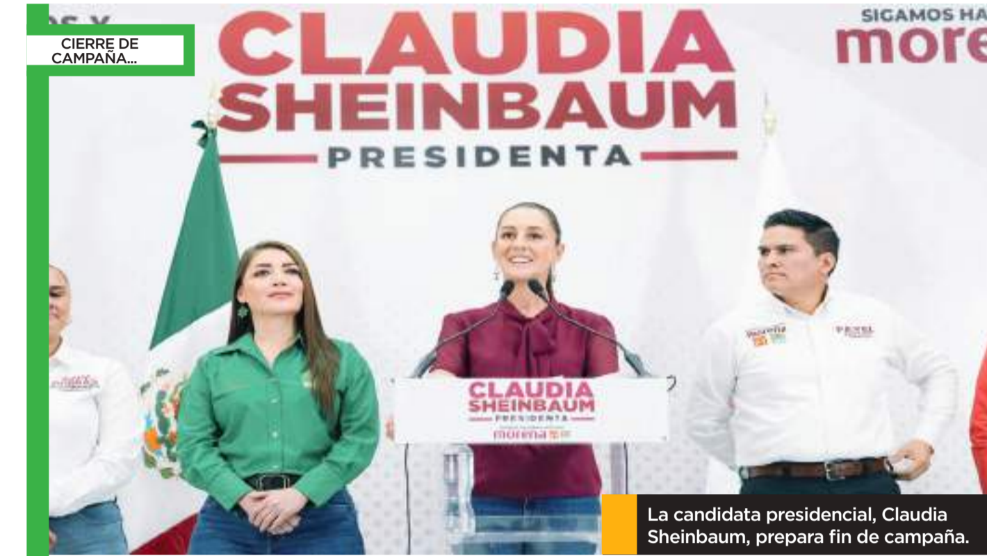
La candidata presidencial, Claudia Sheinbaum, prepara fin de campaña.