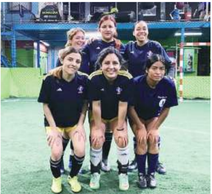
Farmacia Suprema B aplastó en tan solo 20 minutos de juego.

El encuentro celebrado en la cancha Urban solo se jugó a un tiempo debido a la diferencia en el marcador.