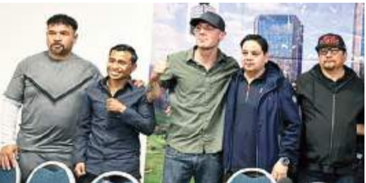
El pesaje se realizará este jueves.