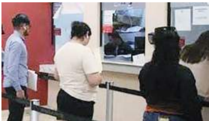
PLAYAS DE ROSARITO.- Hasta el 31 de mayo está vigente la condonación del 80 por ciento de descuento en recargos municipales y 100 por ciento en multas de impuestos y derechos del Ejercicio Fiscal 2024 y años anteriores.

Agregó que los interesados pueden acudir a las oficinas de Recaudación de Rentas ubicadas en la Casa Municipal; o bien pagar en línea a través del portal web del municipio: http://www.rosarito.com.mx/ ; asimismo acudir a la caja auxiliar en la comandancia de la Policía Municipal de la colonia Plan Libertador, a un costado del C4 o en las oficinas de la Delega-