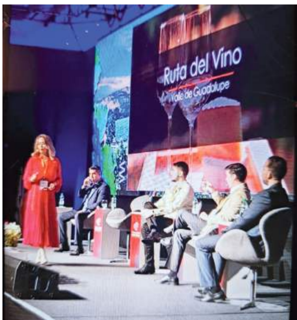
TIJUANA.- La Asociación Femenil de Ejecutivas de Empresas Turísticas en Baja California (AFEET) continuará promoviendo los atractivos, servicios y eventos turístico del Estado.

La Secretaría de Turismo de Baja California, celebra la inclusión de la región en la Guía Michelin México 2024, siendo un reconocimiento merecido para aquellas personas que han dedicado su vida a explorar, innovar y deleitar con sus creaciones culinarias.