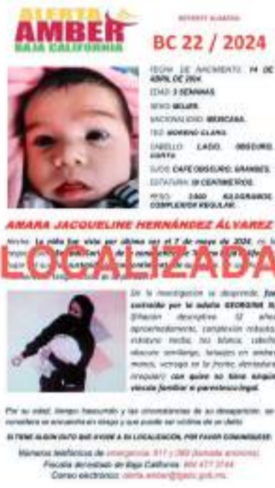
TIJUANA.- Fue localizada en perfecto estado de salud la bebé de tan sólo tres semanas de nacida, por la cual se activó la Alerta Amber el pasado 7 de mayo.