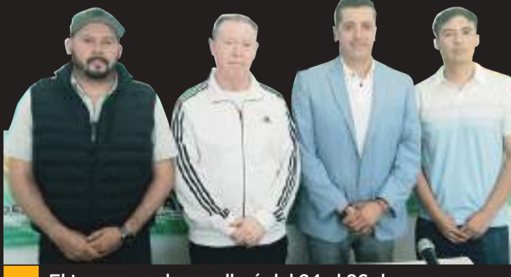
El torneo se desarrollará del 24 al 26 de mayo.