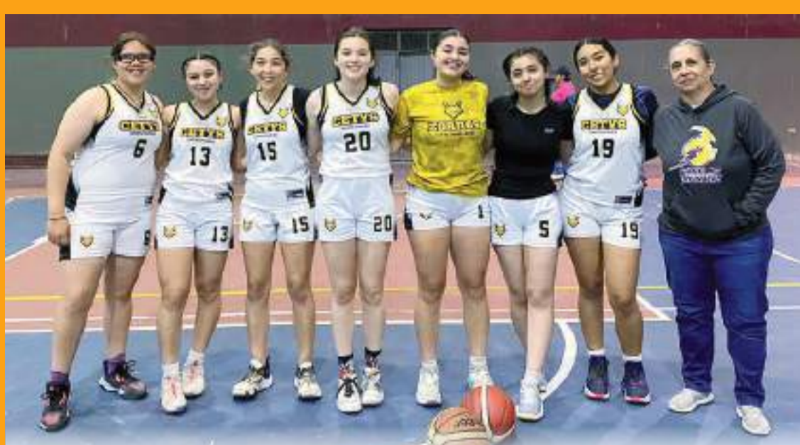
Cetyts femenil categoría Abierta sacó un apretado triunfo sobre Jittoa.