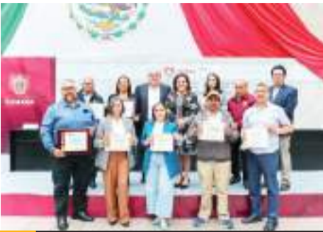
TIJUANA.- Personal docente y de apoyo por 10 y hasta 30 años de servicio del Sistema Educativo Municipal recibieron ayer estímulos del Ayuntamiento de Tijuana.