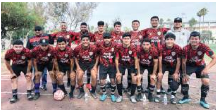
Fueron celebradas semifinales en el torneo Martín A. García Córdoba.

La otra gran final es la correspondiente a la categoría Segun-