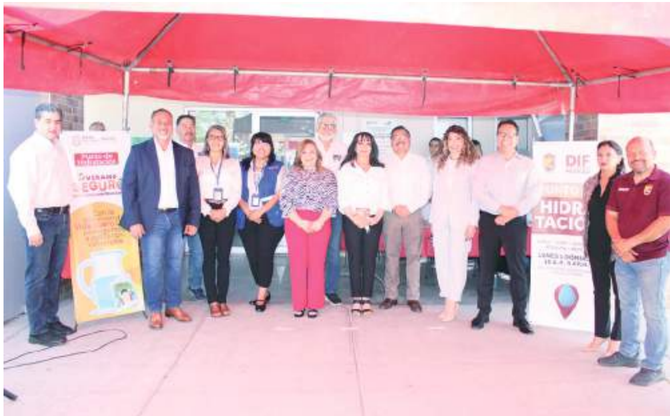
MEXICALI.- El gobierno municipal está listo, con el programa SOS que impulsa DIF, para atender a quienes sufren de calor.