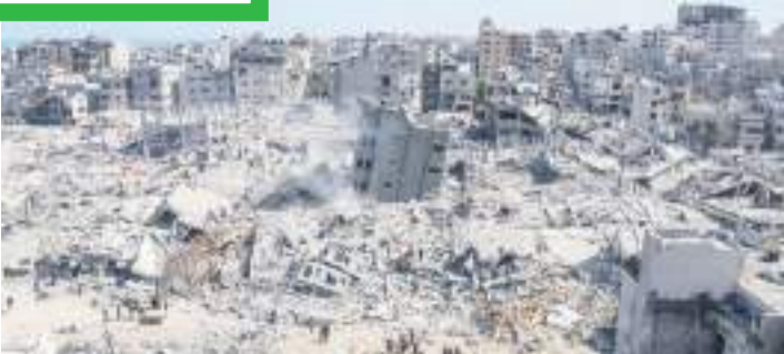
Aumentaron los ataques israelíes en la Franja de Gaza, que se encuentra devastada.