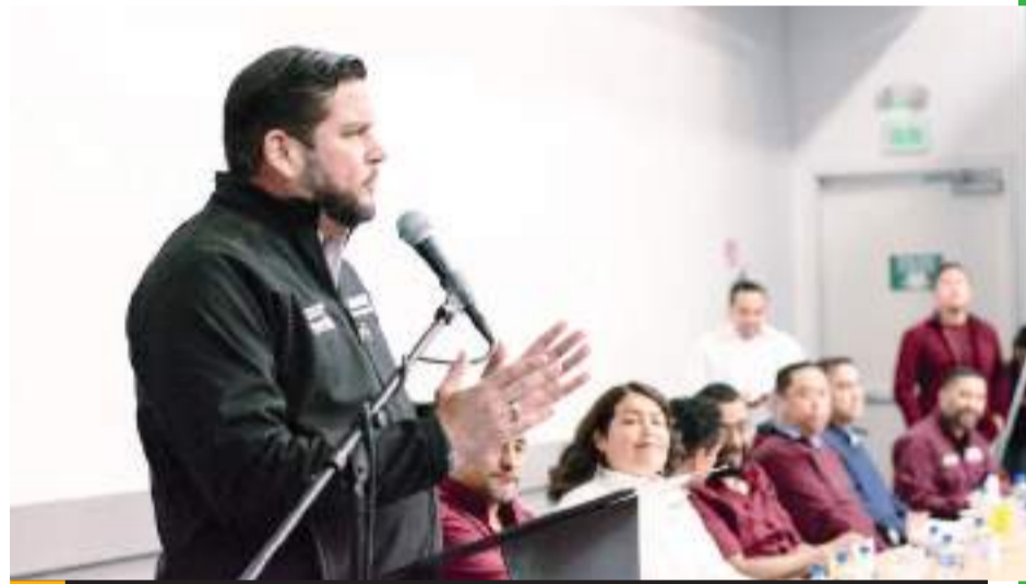
TIJUANA.- El candidato de MORENA acudió a una celebración convocada por maestras y maestros del SNTE sección 37, donde reconoció la gran labor y responsabilidad por la educación.

por la docencia ha sido una experiencia muy bonita en su vida, la cual decidió dejar de lado para incursionar en la política y estar en las mesas donde se toman las decisiones que benefician al sector.