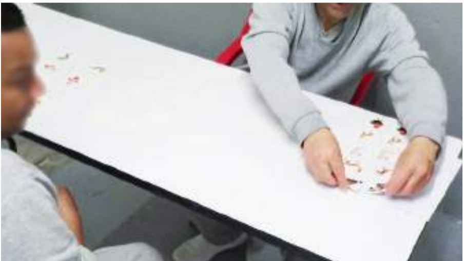
ENSENADA.- La Comisión Estatal del Sistema Penitenciario de Baja California (CESISPE), a través de la Coordinación Educativa del Centro Penitenciario de Ensenada, llevó a cabo el taller "Gimnasia cerebral" a un grupo de 40 personas internas.

mientos del cuerpo que contempla el taller de "Gimnasia cerebral", el cual está a cargo de la Coordinación Educativa del Centro Penitenciario de Ensenada, en el que participan 40 personas privadas de la libertad.