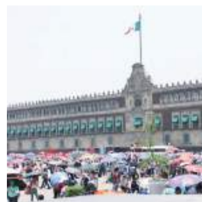
Por tiempo indefinido, el plantón de maestros en el Zócalo.