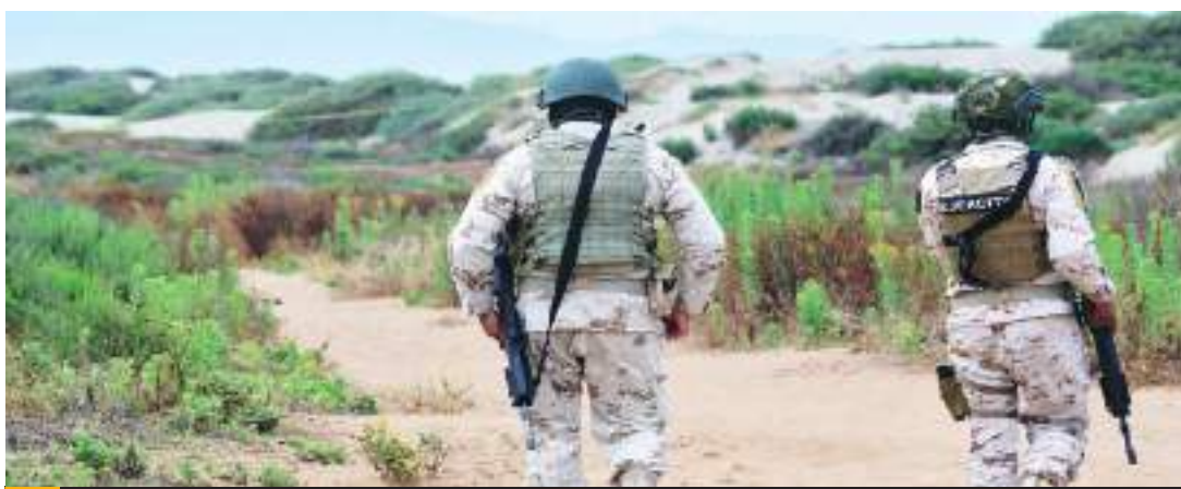
ENSENADA.- El cuerpo sin vida de la mujer no identificada, quedó tirado entre las dunas de la playa El Punto.