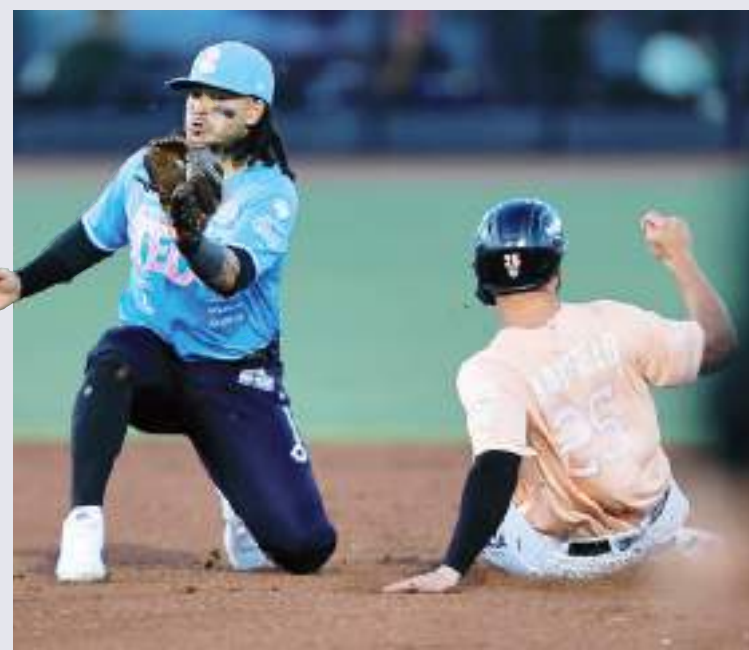
El marcador fue a favor de la visita por 6 carreras a 5.