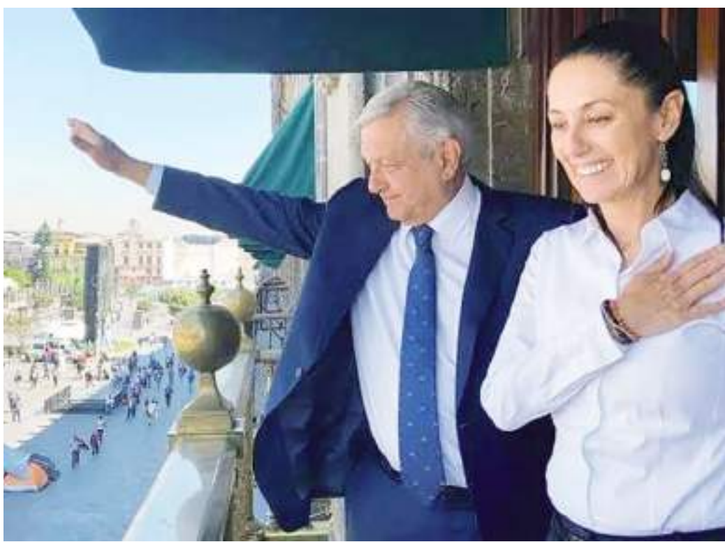
TIJUANA CLAUDIA SHEINBAUM PARDO...

Vamos a un tema de salud, la adolescencia es una fase de cambios significativos tanto físicos como emocionales para las mujeres, cambios que son impulsados por alteraciones hormonales, y demandan aten-