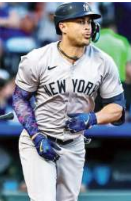
Yankees oficializó el movimiento este domingo.

"No parece ser una situación severa, pero sabemos más sobre eso, espérennos, dentro de poco tiempo", señaló Boone poco después de que el equipo confirmara la lesión este domingo, previo al duelo contra Atlanta.