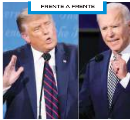
FRENTE A FRENTE