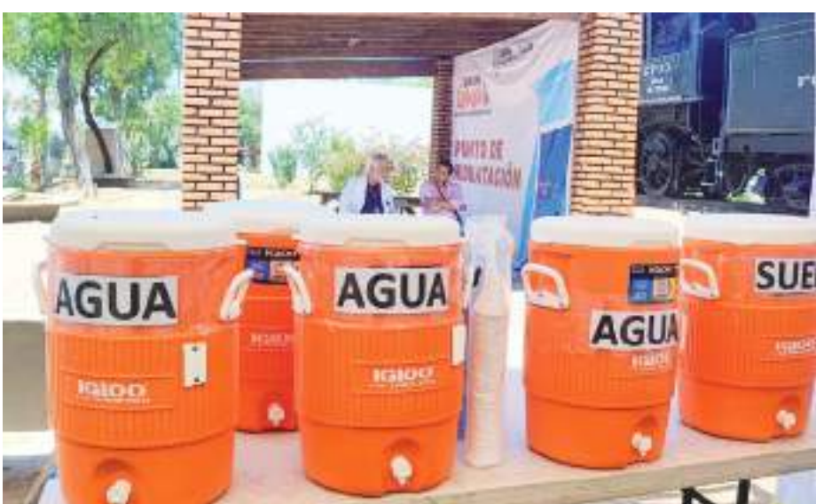
MEXICALI.- Los Centros de Salud y Hospitales en todos los municipios del Estado, así como Centros de Salud Móviles y Clínicas del Bienestar, cuentan con atención y Vida Suero Oral gratuito para quienes lo requieran.

Esta iniciativa también consideró actualizar las denominaciones del Estado con base a la Ley Orgánica del Poder Ejecutivo y la incorporación de lenguaje inclusivo, todo esto en la Ley de la Comisión de Arbitraje Médico del Estado de Baja California, en sus artículos 3, del 8 al 25, 29, 33, 34, 36, 42, 50, 52, 53, 54, 60, 63, 64, 65, 67, 72, 75, 76, 78, 84 y 86.