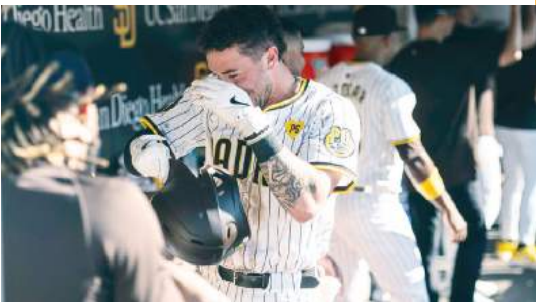
Padres comenzará este lunes una serie contra Nationals.