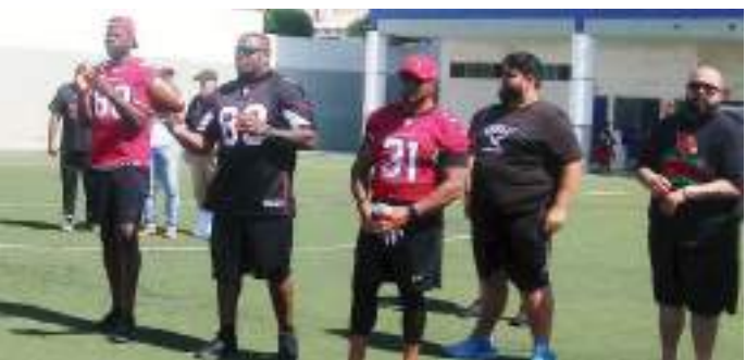
Al evento se dieron cita ex jugadores de la franquicia de NFL.

Al concluir las casi dos horas de ejercicios, los jóvenes tuvieron la oportunidad de llevarse autógrafos de los ex jugadores de NFL, así como de Big Red, en el meet & greet que sirvió de cierre de la clínica.