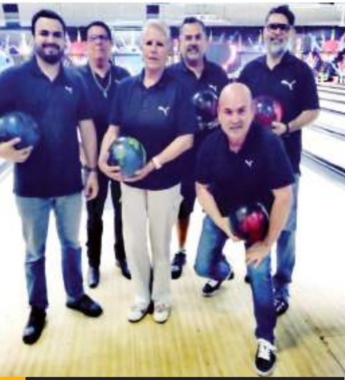
Los felinos caminan con una marca de 100.5-59.5.

El resto de los equipos que buscan posicionarse dentro de los mejores conjuntos del torneo son Gamboa, con marca de 91-69; Bakeros, 90.5-69.5, y Los Pioris, que tienen idéntico récord de 90.5-69.5 para ubicarse a 10 unidades de la cima.