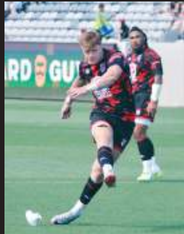
Legion se jugará el boleto de playoffs en casa en la última jornada.

Giteau anotó la conversión y un penalti más para un arranque explosivo de San