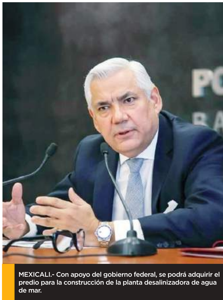
MEXICALI.- Con apoyo del gobierno federal, se podrá adquirir el predio para la construcción de la planta desalinizadora de agua de mar.

Ante la crisis de agua en la cuenca del Río Colorado, y la dependencia que tiene Baja California como principal fuente de agua,