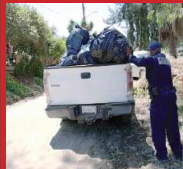
ENSENADA.- Durante la semana del 13 al 19 de junio, 6 personas detenidas participaron en la limpieza en distintas colonias para reducir sus hora de arresto.

Para concluir, Monreal Mendoza invitó a la población interesada en participar o conocer más sobre estos programas a comunicarse al teléfono (646) 182-3000, extensión 2742, de la Subdirección de Prevención del Delito. Las oficinas están disponibles de lunes a sábado, en horario de 8:00 a 17:00 horas.