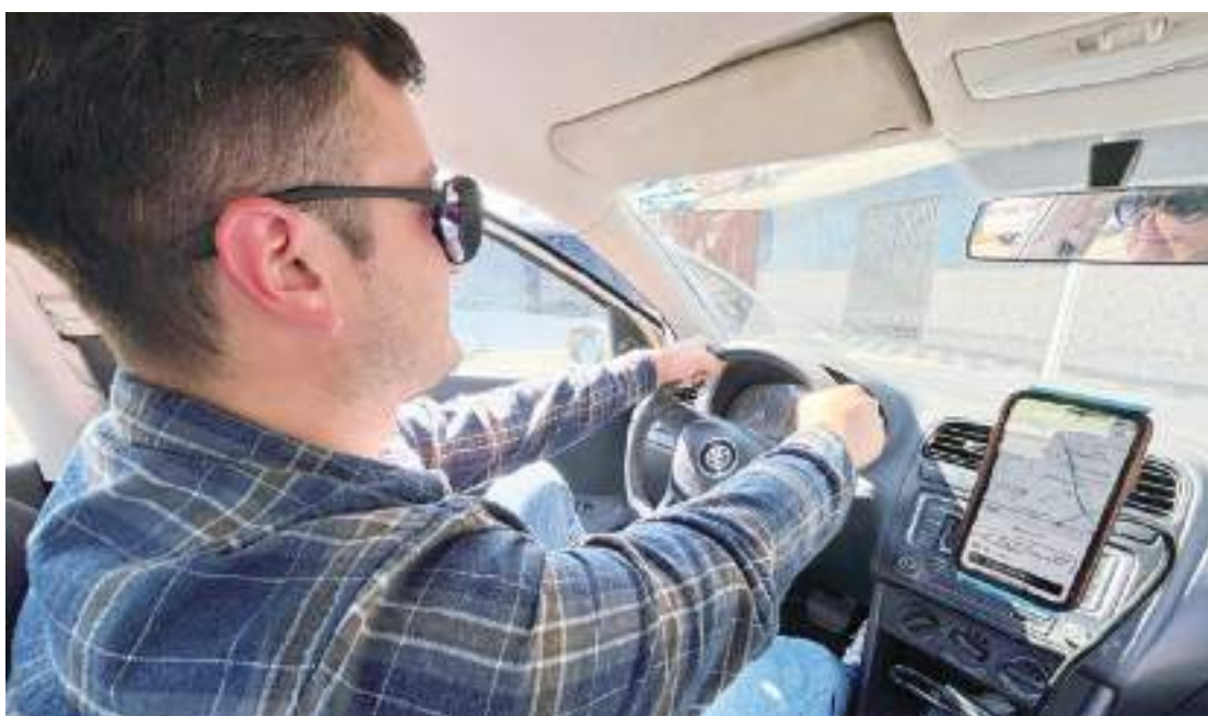
TIJUANA.- El decreto está vigente hasta el 31 de agosto, para que choferes y socios de transporte por aplicación, aprovechen el 50% de descuento.

Finalmente, invitó a las y los choferes y socios conductores a aprovechar los beneficios que les ofrece este decreto, ya que se prevé que, una vez que concluya, el área de inspección de IMOS proceda a la realización de revisiones, buscando la correcta regulación de estos servicios.