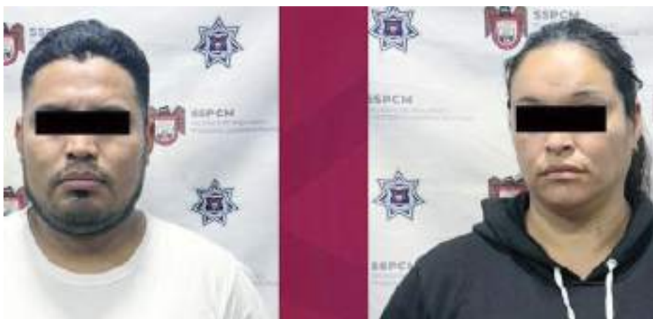
TIJUANA.- Ahora resulta que esta pareja de "ratas" fueron víctimas de los otros dos sujetos que lograron huir después de que incluyéndose, asaltaron de manera violenta a despachadores de gasolina.

En su intentona de lograr darse a la fuga, el conductor, en compañía de los