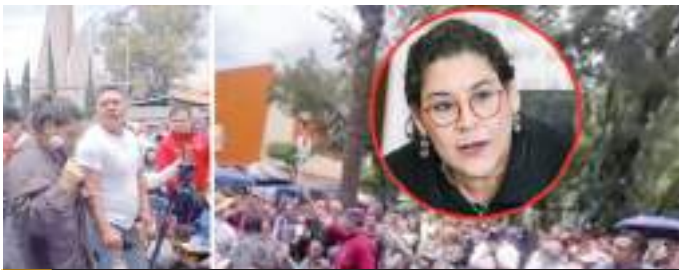
Interrumpieron el discurso de Lenia Batres.