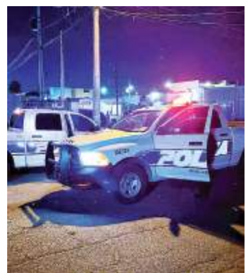
MEXICALI.- Los delitos de robo a casa habitación, registraron una disminución del 17% en el último año.

avalúo del INDAABIN el 10 de julio del 2023, cuya propiedad era de la empresa NSC Agua, S.A. de C.V subsidiaria mexicana de Consolidated Water, con lo que se avanza favorablemente en este importante proyecto para la ciudadanía bajacaliforniana.