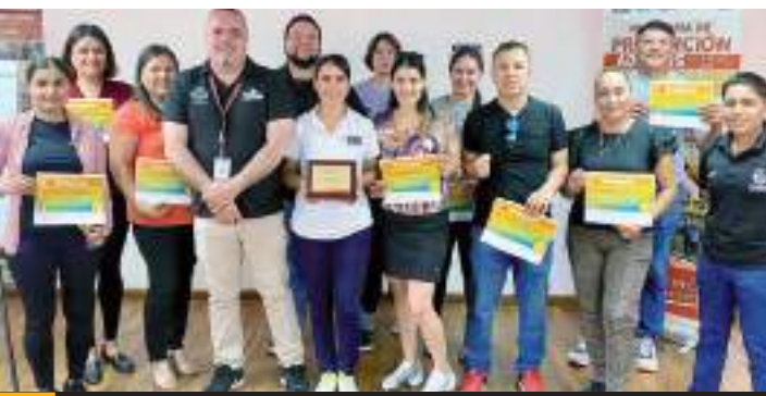
El objetivo fue brindar las bases sobre la adecuada nutrición e hidratación.

El representante del Inmudere agradeció a todos los asistentes por participar y aprender sobre la importancia de una alimentación especializada para optimizar el rendimiento deportivo de sus hijos.