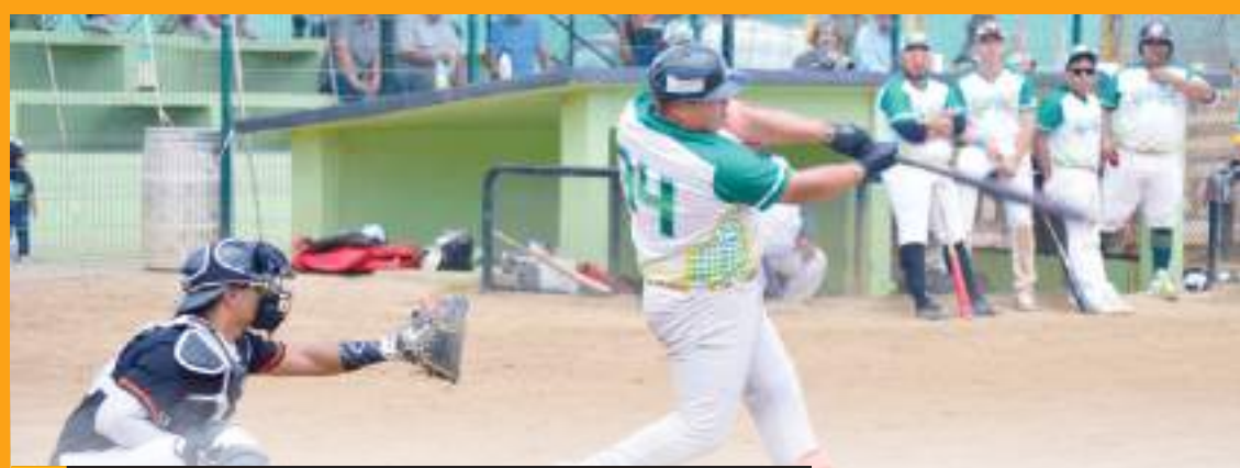
Se realizó la tercera fecha del campeonato estatal.