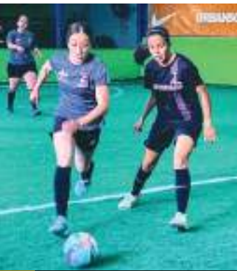
Listos, los equipos en los dos grupos A y B.

En el Grupo A se esperan dos grandes duelos el primero es entre Farmacia Supremas, ocupante del tercer lugar con 27 puntos, y Nájera Soberanis con 16; y en el segundo, es entre el líder Alfombras Lore y el sublíder