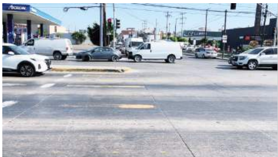
TIJUANA.- Los vehículos formados bloquean la salida de un fraccionamiento y una parada del transporte público.

Esto genera que el carril derecho de la vialidad esté detenido, y conforme crece la línea, el cruce