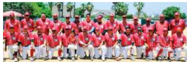
Ensenada Municipal registra seis ganados para liderar el grupo de Ensenada.

Por la tarde, la Urbana de Chapultepec le sacó el juego a la Rural de Maneadero con cartón de 11 anotaciones por 8.