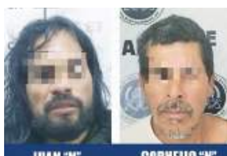
TIJUANA.- Durante la ejecución de cuatro ordenes de aprehensión por parte de policías de la AEI cayeron igual número de detenidos; los presentados.