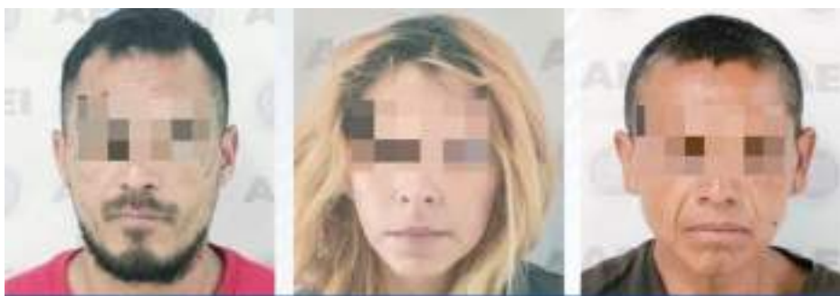
TECATE.- Estas personas ya no podrán cometer más ilícitos, ya están tras las rejas.