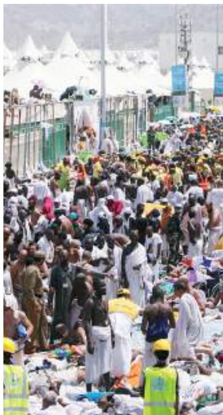
Más de mil vidas cobró el calor extremo, en la peregrinación a La Meca.

Las personas fueron afectadas principalmente por una ola de calor que elevó las temperaturas a casi 52 grados Celsius.