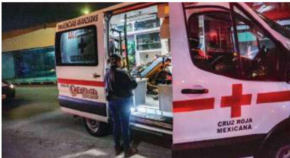
TIJUANA.- Un ataque armado más, registrado durante la noche del viernes, en la Zona Norte.