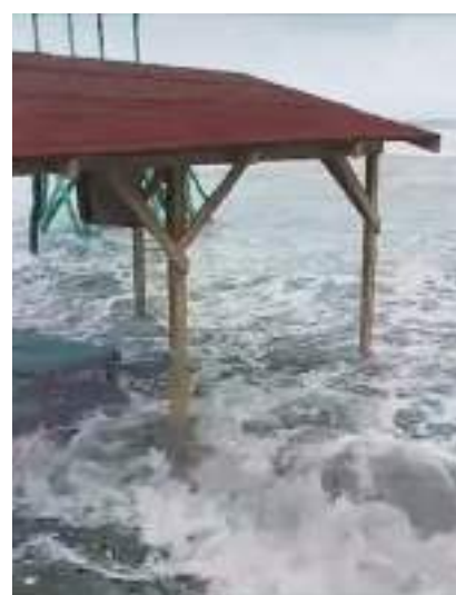
La costa de Texas se prepara para impacto de Beryl; la tormenta podría recuperar fuerza de huracán.