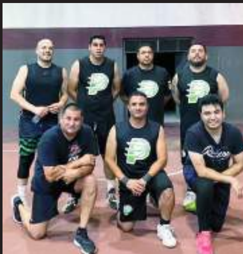
El Pirul ganó al Sauzal Club en partido de la Segunda Fuerza.