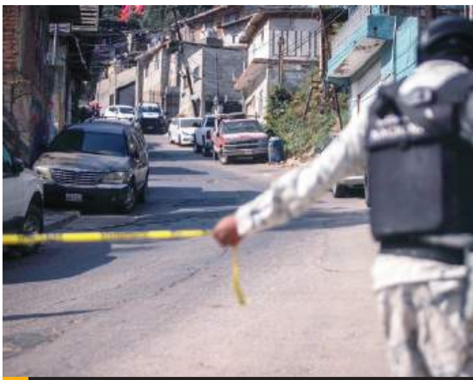
TIJUANA.- Un nuevo cuerpo sin vida, encobijado, maniatado, y evidentes huellas de violencia, fue el terrible hallazgo de transeúntes de la colonia Manuel Paredes.

Fiscalía General del Estado, quedando a cargo de la escena y la investigación se percatan de que se trata de un hombre con huellas de violencia de aproximadamente 35 años de edad.