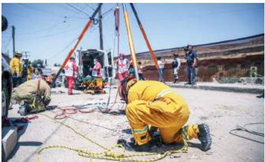
TIJUANA.- No es la única persona en Tijuana que le pasó un accidente y no hace nada la CESPT.

El accidente se registró en la calle Vicente Guerrero en la colonia Libertad, justo en el Cañón Otay donde realizan las obras del viaducto elevado de Playas de Ti-