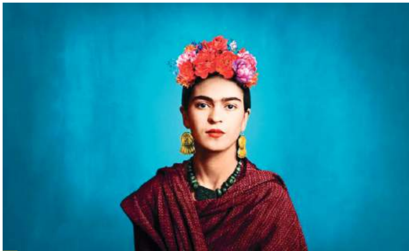
Frida está disponible en el catálogo de la plataforma de streaming Prime Video.

-Respuesta. Fue la historia de Frida Kahlo la que me impulsó a dirigir el documental. Todo empezó con una obsesión que arrastro desde que tenía 19 años y tenía fijación por un cuadro de Frida, el Autorretrato en la frontera entre México y los Estados Unidos. Como Kahlo y como tantos otros inmigrantes, mi relación con Estados Unidos es complicada y me sentía muy identificada por esa dualidad. Y luego tuve una idea que no se