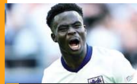
Inglaterra se medirá a los Países Bajos.