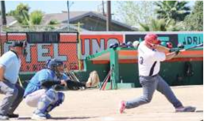
Se jugará este domingo la tercera jornada del torneo.