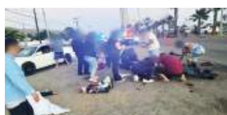
TIJUANA.- Momento de la tragedia que cobró la vida de una pareja.

sin sentimientos, ni siquiera lloro cuando nosotros estábamos llorando, no sintió nada, no tenía sentimientos. Ella iba (manejando) con sus hijos cuando el carro le pasó encima de las motos”.