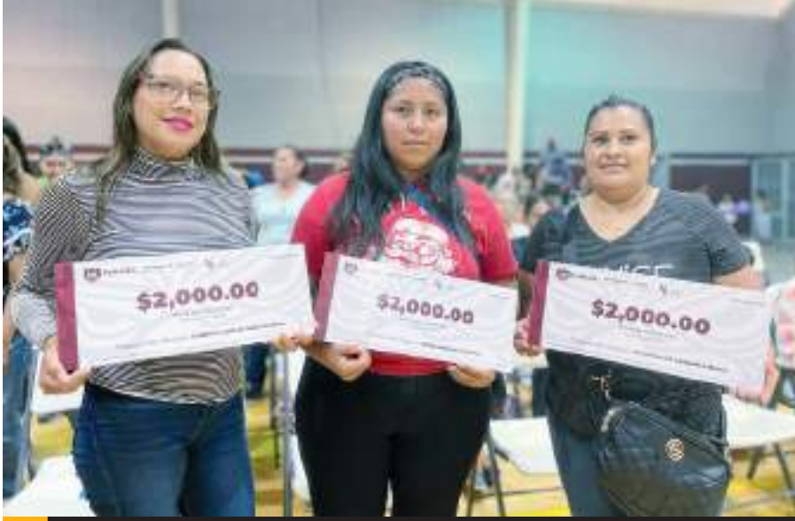
TIJUANA.- El gobierno municipal entregó 250 apoyos económicos a mismo número de familias, para contribuir en la mejora de su calidad de vida.