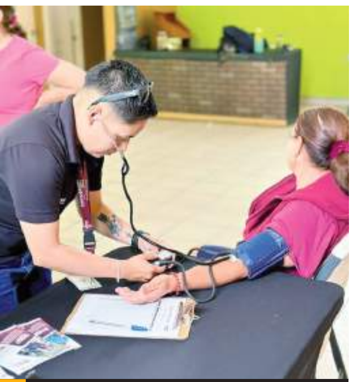
En la jornada de prevención se atendieron a 15 mujeres aproximadamente.

Con estos esfuerzos, el Inmudere trabaja de la mano con nuestros grupos deportivos de adultos mayores para garantizar un estilo de vida más saludable, preventivo y activo.