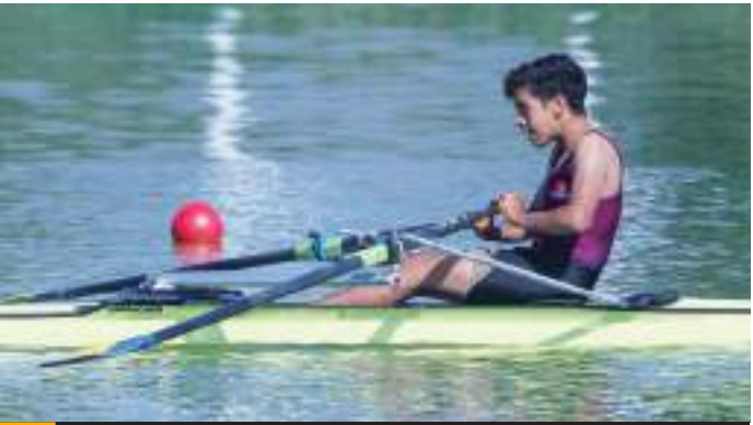
Este domingo remarán en trece finales.

De acuerdo al programa de competencias, este domingo se empezarán a repartir las medallas de los Nacionales CONADE 2024, en una jornada donde Baja California estará presente en trece regatas.