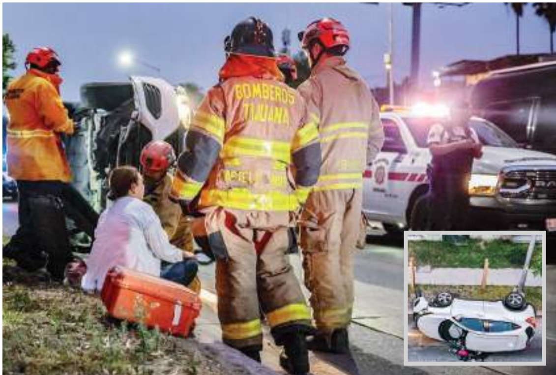
TIJUANA.- Mucha suerte tuvo una mujer, pues pese a que volcó su vehículo, resultó ilesa.

Bomberos llegaron al lugar para brindarle atención médica a la mujer, quien no necesitó traslado, tras no presentar heridas de gravedad.