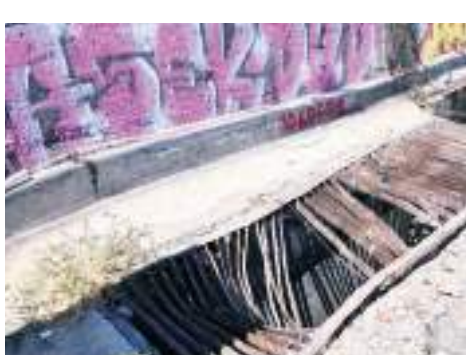
TIJUANA.- La rejilla lleva 5 años en mal estado, refieren los vecinos.

“Pues desde el tiempo que la pusieron, nomás la pusieron y nunca han venido a darle mantenimiento. De he-