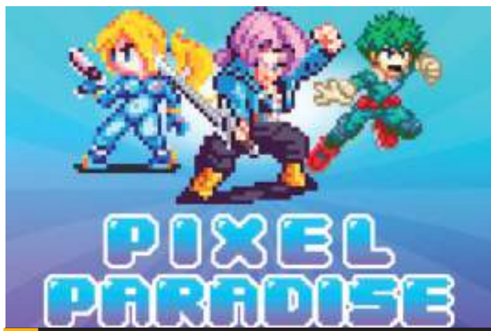
TIJUANA.- Se efectuó con éxito el "Pixel Paradise", organizado por el IMAC.