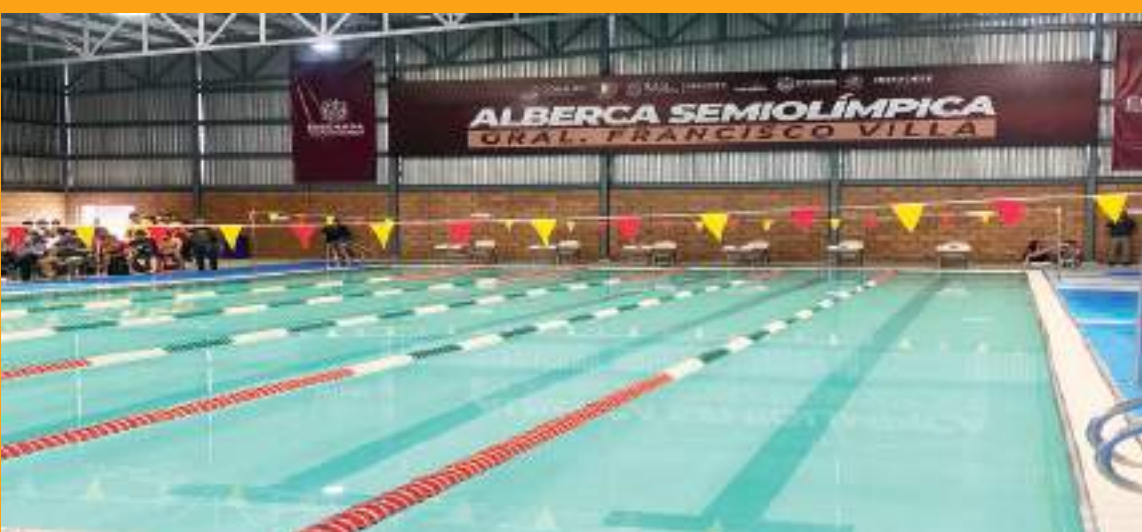
El Gobierno de Ensenada inauguró la rehabilitación de la alberca semiolímpica.