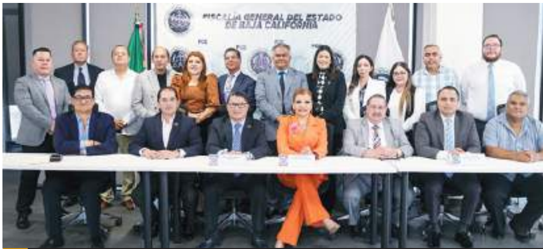
TIJUANA.- El objetivo de la Fiscalía General del Estado, encabezada por la Fiscal Ma. Elena Andrade Ramírez, es mantener canales efectivos de comunicación con diversos sectores de la sociedad y líderes de opinión.

Por su parte, Elías Flores Gallegos expresó su respaldo a las iniciativas de la Fiscalía y reconoció los avances en los programas implementados para beneficiar tanto a la ciudadanía como a los profesionales del derecho. Asimismo, se comprometió a mantener una colaboración estrecha y reuniones periódicas con la institución.