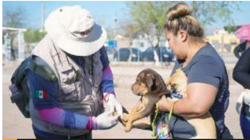
MEXICALI.- Baja California es el único Estado con 58 años sin presencia de rabia humana y 42 años sin casos de rabia en perros.

"Los tipos de padecimientos en animales que se transmiten a los seres humanos, no conocen fronteras, posición social, economía, raza, religión ni grado cultural; algunas de estas pueden llegar a ser muy peligrosas ya que en muchos casos producen discapacidad o muerte en quienes la padecen, como la Rabia o la Rickettsiosis, por lo que estamos desplegando acciones en todos los municipios, todo