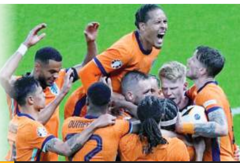
La Naranja Mecánica jugará la semifinal el miércoles.

Koeman dio entrada a Wout Weghorst, y sus compañeros comenzaron a buscarle con balones al corazón del área. Pero Turquía seguía creando peligro a balón parado, y en el 56' Güler estrelló la pelota en el palo en una falta lejana botada con maestría. Tras otro lanzamiento de falta, esta vez ejecutado por Çal-