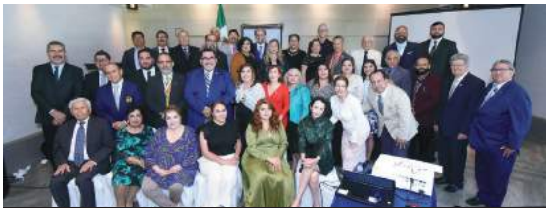
Elegante desayuno de la Academia de Historia de México, en Tijuana.