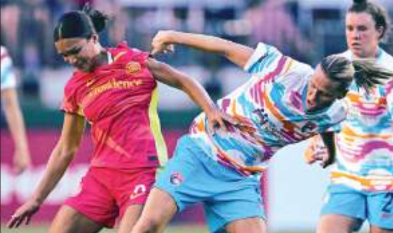
El Wave acumula 15 unidades en la Temporada 2024 de la NWSL.

Al minuto 72, la cancerbera Kailen Sheridan se encontró en un mano a mano con su compatriota Janine Beckie, encuentro que fue favorable para la portera de la "Ola", quien logró mantener el 0-0 con su intervención. Unos minutos después, el Wave tuvo