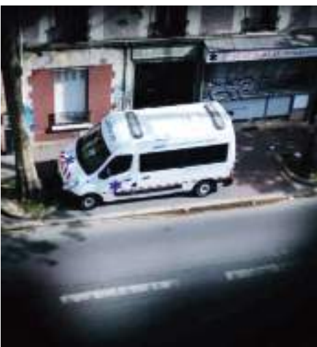
Ocurrió en la casa del hombre, quien tras una discusión arrojó a los niños por la ventana.

Un juez y representantes de la brigada de protección de menores trabajan ya en el caso.