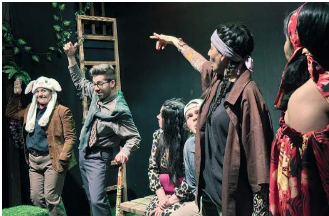
La obra tendrá 6 presentaciones en Teatro Las Tablas.

Fundada en 2007 ha recorrido el teatro para adultos, infancia y juventud; entre sus estrenos mundiales destacan A veces los perros sonríen, También hay moscas en la luna y The Frontera Project; esta última ha recorrido diversas geografías en Estados Unidos. Su producción escénica y programas suman trayectoria en festivales y congresos en México, EUA, España, Cuba y Armenia. Por más de 14 años ha organizado la Escuela Binacional de Espectadores THT y el Festival Interprepas THT, y suma 10 años de su plataforma de educación Taller/Lab THT. En 2021 fundó las Jornadas de Teatro Infancias y Juventudes THT; de 2008 a 2015 realizó el Festival THT que dio paso al 18 al Festival de Teatro Íntimo para fortalecer la creación en espacios independientes. En 2019 abrió la Biblioteca THT dedicada a las artes escénicas y desde 2020 genera el programa audiovisual Cartografía Escénica, un archivo del quehacer en el noroeste del país.