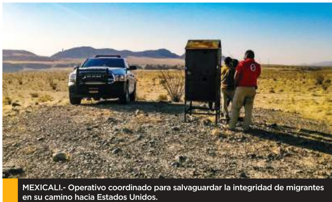
MEXICALI.- Operativo coordinado para salvaguardar la integridad de migrantes en su camino hacia Estados Unidos.

La Policía Municipal de Mexicali, realiza constantemente "Operativos Espejo", en colaboración con la Patrulla Fronteriza sector El Centro para brindar auxilio y salvar vidas de personas en contexto de migración que se encuentren en áreas desérticas cercanas al muro fronterizo.