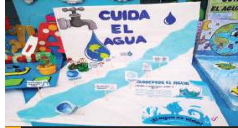
ENSENADA.- Estudiantes de la escuela “Ignacio Allende” promueven el uso, reúso y cuidado del agua entre la comunidad educativa.