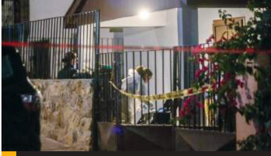
TIJUANA.- La noche del lunes fue asesinada una estudiante de medicina, originaria de los Estados Unidos.

do en Tijuana, al menos ocho personas fueron asesinadas en las últimas 24 horas en esta ciudad, sumando ya