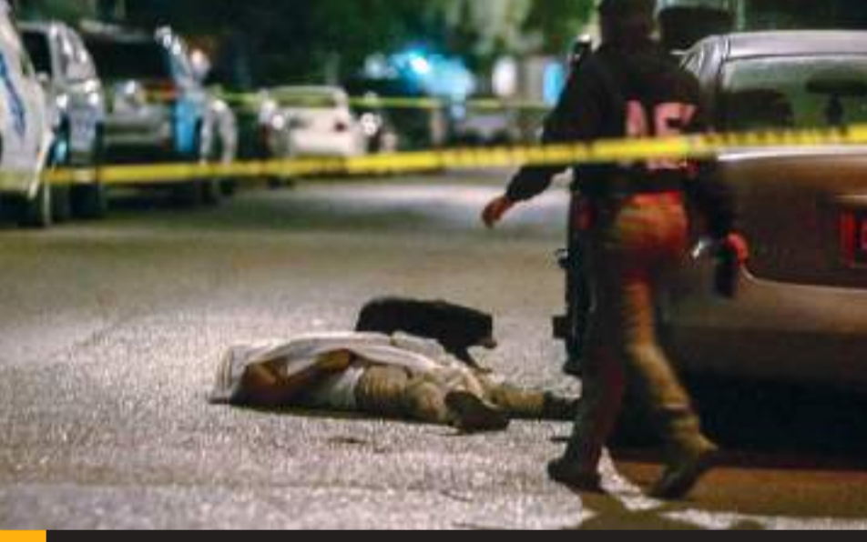
TIJUANA.- Un ciudadano recibió un balazo en una pierna de forma colateral durante ataque armado en contra de un sujeto en Infonavit Lomas del Porvenir.

En tanto la víctima fue trasladada al hospital más cercano, mientras que, al sospechoso, una vez neutralizado, ya detenido fue presentado ante la autoridad competente para dar inicio a la carpeta de investigación.