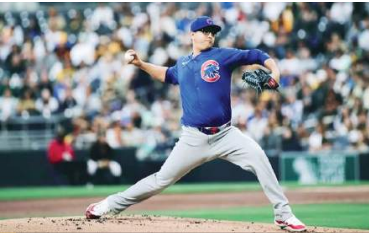
Participó este martes en una sesión de bullpen como parte de su rehabilitación.

“Creemos que hay mucho más aquí, estamos apuntando a algo más grande que el Juego de Estrellas”, dijo Cora. “Que él esté saludable es lo más importante”.