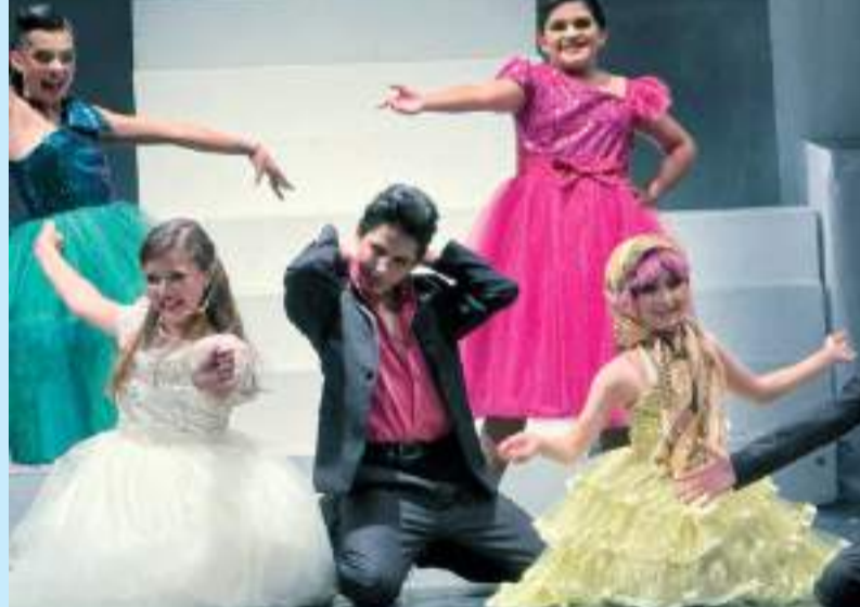
Decenas de familias gozaron las puestas en escena con adaptaciones libres realizadas por el Centro de Artes Escénicas (CAE), en el CECUT.

plica al Sophie invitar a tres hombres del pasado de su madre, para averiguar quién es su papá.