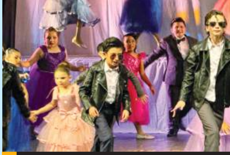
Decenas de familias gozaron las puestas en escena con adaptaciones libres realizadas por el Centro de Artes Escénicas (CAE), en el CECUT.

La Segunda obra en escena fue, “Mamma Mia”, también fue una adaptación libre del musical con el mismo nombre, en la que Donna, una mujer independiente se divide por manejar su propio hotel en Grecia y planear a la boda de su única hija Sophie; sin embargo la trama se com-