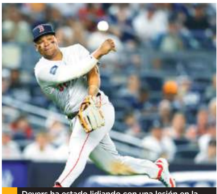
Devers ha estado lidiando con una lesión en la articulación acromioclavicular.

En las 16 salidas que registra esta temporada, Assad ha registrado una efectividad de 3.04 con 79 ponches y 33 bases por bola en 83 entradas con Chicago. El diestro acumuló un ERA de 2.27 en sus primeras 12 aperturas de la campaña, pero en sus cuatro salidas más recientes dicha cifra empeoró a 5.49.