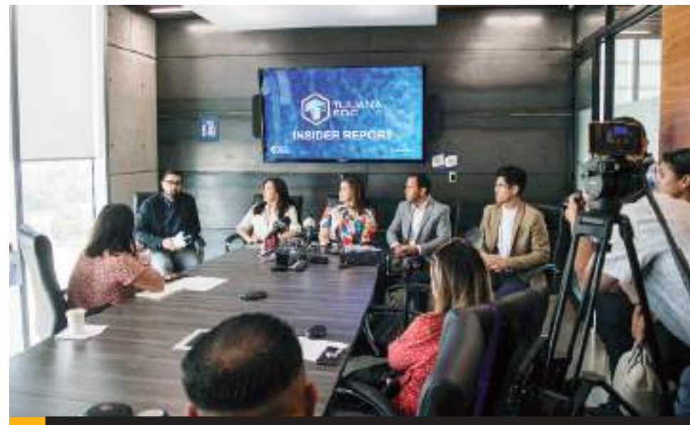
TIJUANA.- DEITAC dio a conocer la herramienta Insider Report.

Añadió que el país alcanzó un máximo histórico de exportaciones a Estados Unidos durante mayo de 2024 y Tijuana es uno de los motores de esta tendencia, al obtener la ciudad el 74% de la inversión que recibió Baja California durante el primer trimestre del año.