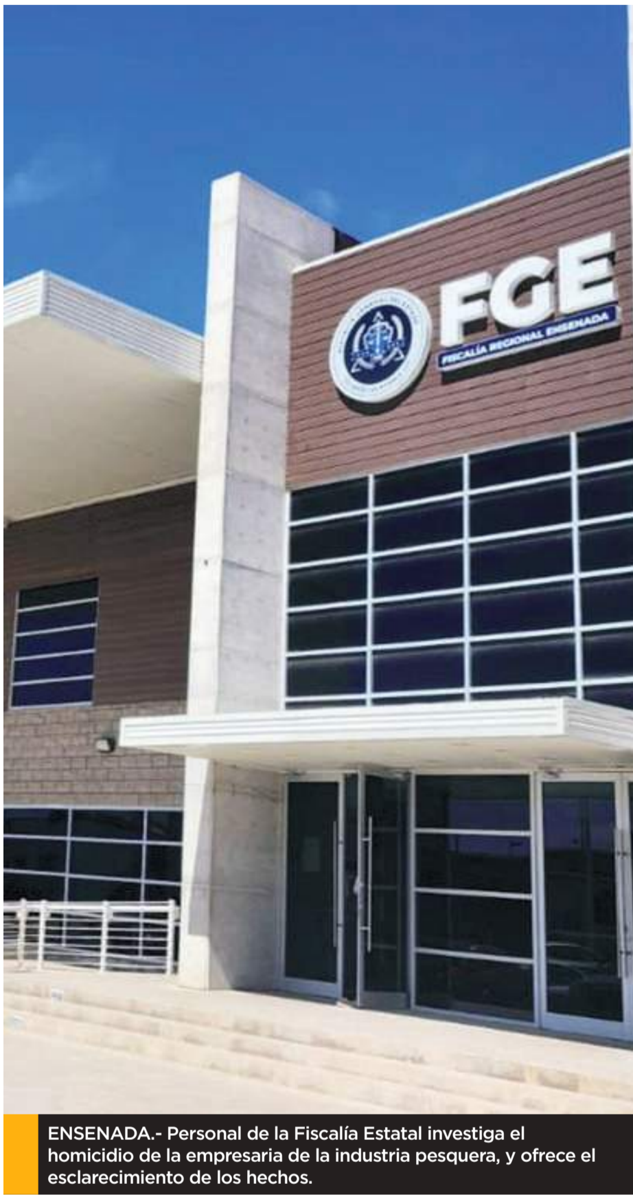
ENSENADA.- Personal de la Fiscalía Estatal investiga el homicidio de la empresaria de la industria pesquera, y ofrece el esclarecimiento de los hechos.

La Fiscalía General del Estado refrenda el compromiso de investigar este caso hasta las últimas consecuencias, a fin de asegurar justicia para las víctimas y que los responsables no queden impunes.