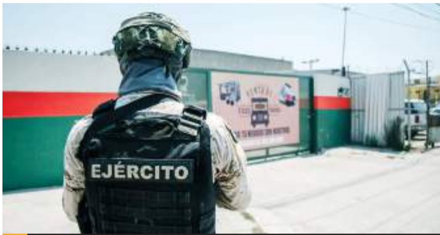
TIJUANA.- Elementos de la SEDENA y de la FGR realizaron un cateo en un predio cerca de la Aduana Mexicana, donde se presume hay un narcotúnel.