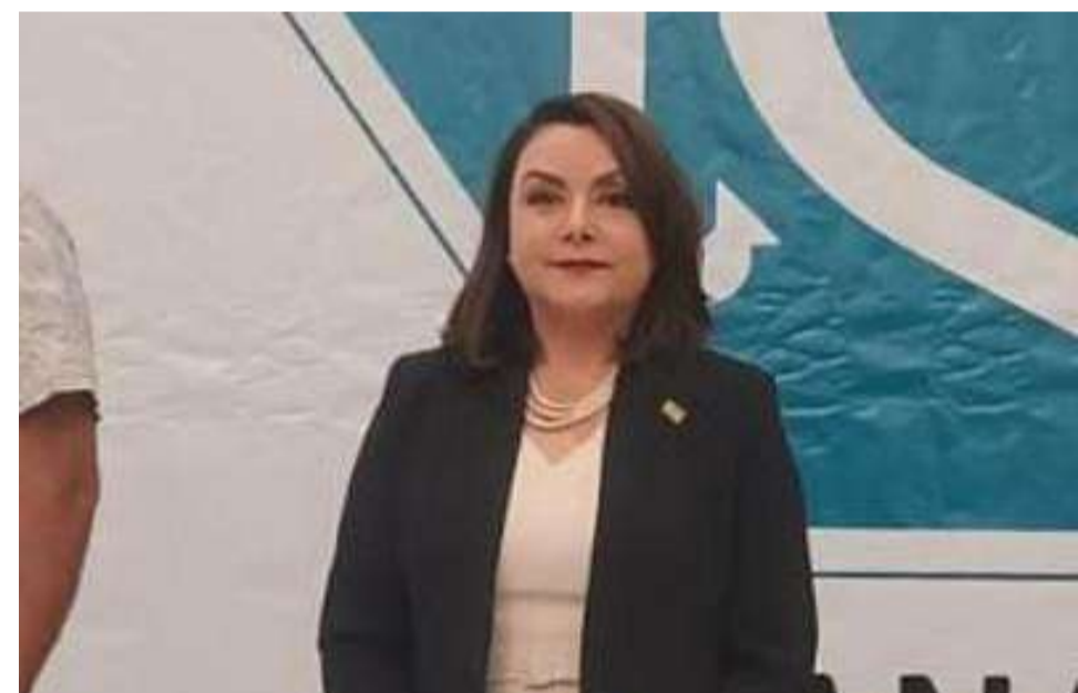
MEXICALI.- Contundente postura de la IP de la capital del Estado en torno al asesinato de la titular de Canainpesca.

De enero a la fecha, se han otorgado más de 10 mil atenciones para todas las edades, reflejando así el interés de la gente por buscar ayuda y tratar profesionalmente padecimientos mentales, aseguró el funcionario estatal.