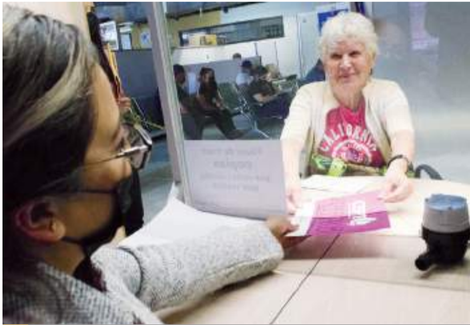
TIJUANA.- Las personas que reciben subsidio por consumo de agua, deben renovar el trámite ante la CESPT para seguir obteniendo este apoyo.

En caso de estar imposibilitados en su movilidad, un familiar puede solici-