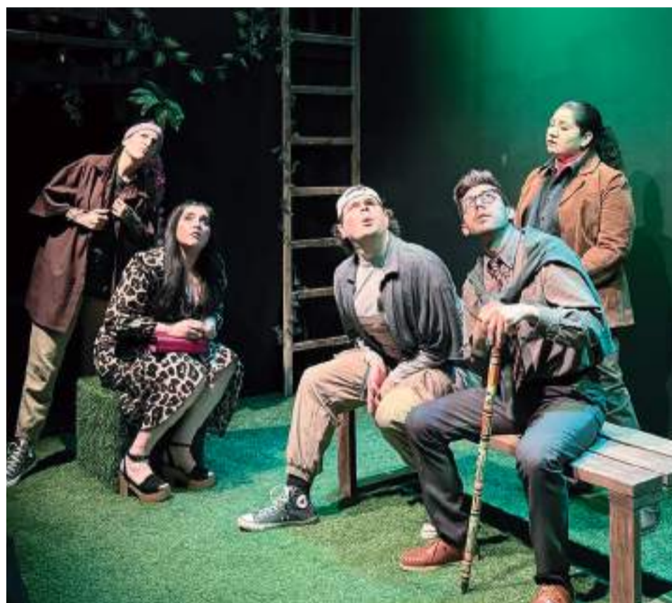
“Vote por el León” es un texto inteligente y divertido, que representa muy bien las dramaturgias contemporáneas para niñas, niños y jóvenes.