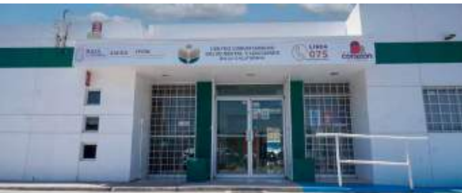
MEXICALI.- La Secretaría de Salud anunció la operación de 12 Centros Comunitarios de Salud Mental y Adicciones (CECOSAMA).

Esta situación de inseguridad, dicen, no sólo sigue poniendo en riesgo la vida de los ciudadanos sino también inhibe futuras inversiones.