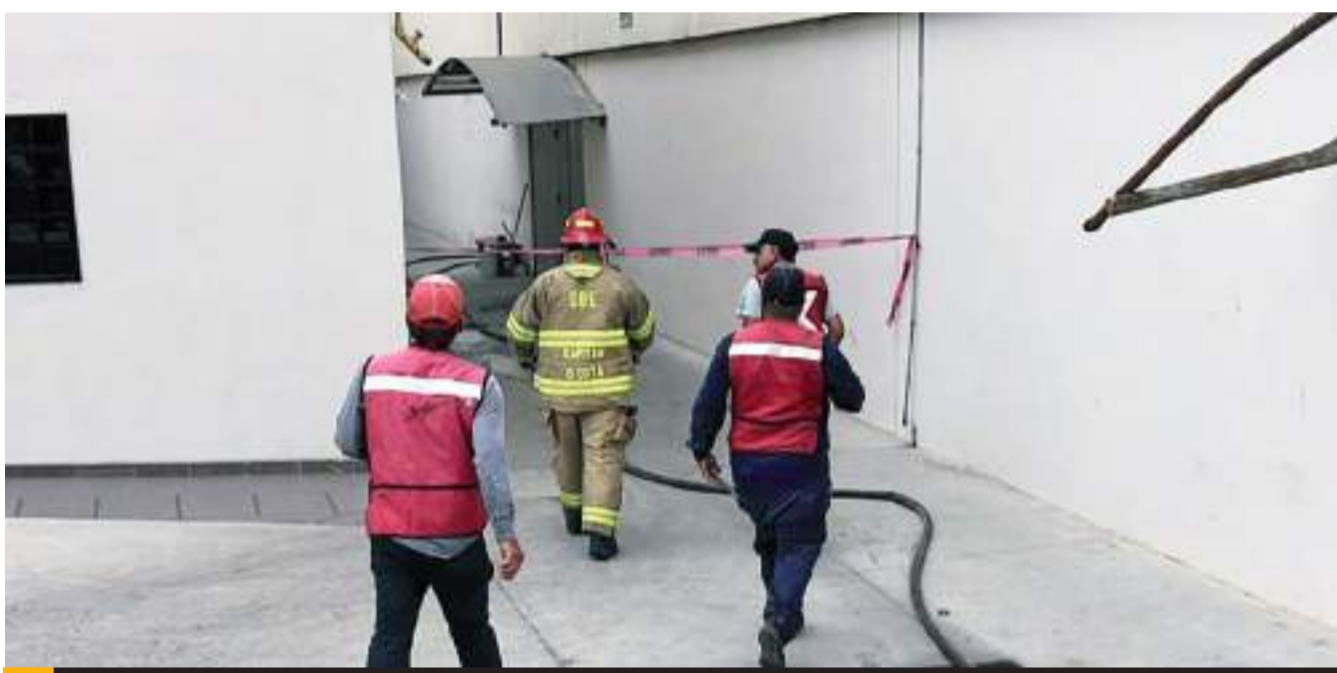
ENSENADA.- Debido a fugas de gas de dos tanques estacionarios, elementos de la Dirección de Bomberos y Coordinación de Protección Civil, procedieron al desalojo de 163 personas, entre clientes y trabajadores de esa plaza comercial.