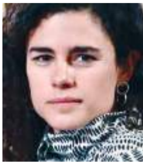
TIJUANA LUISA MARÍA ALCALDE...

Cuadros distinguidos del PARTIDO ACCIÓN NACIONAL