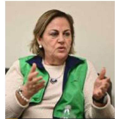
MEXICALI.- Guadalupe Fregoso, dirigente estatal del PRI, ofrece respaldo al trabajo de “Alito” Moreno, frente a la dirigencia nacional.

Finalmente, comentó que las grandes cadenas comerciales cuentan con plantas alternas de energía.