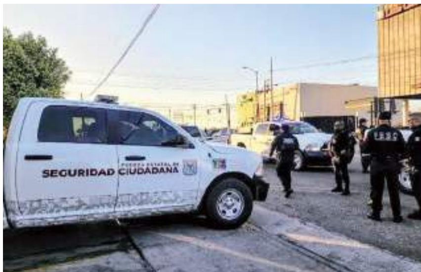
TIJUANA.- Los diversos niveles de seguridad formarán parte de la Mesa de Seguridad Turística.

"Esto para cuando el turista sea 'fraudado'