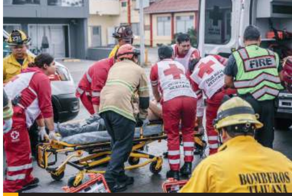
TIJUANA.- Tras sufrir un paro cardíaco conductor de una minipick up provocó una colisión múltiple sobre el bulevar Cuauhtémoc Sur.