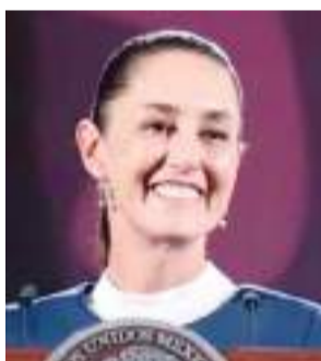
MEXICALI CLAUDIA SHEINBAUM PARDO...

En contraparte, el representante del panismo argumenta entre su círculo cercano que actualmente representan a la segunda fuerza política en la entidad, mientras que en los comicios electorales del 2021 se ubicaron en la tercera posición, situación que genera opiniones encontradas.