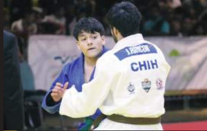
El mundial se llevará a cabo en Lima, Perú.

"Están ranqueados en la Federación por ello es que los están contemplando, tenemos siete semanas para que estén listos para la justa mundialista y muestren el potencial