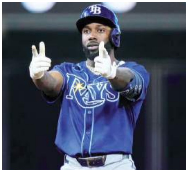
Tampa Bay podría convertirse en uno de los equipos vendedores este verano.