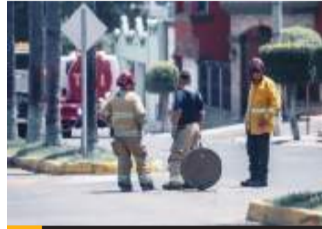
TIJUANA.- Una fuga de gas en líneas instaladas por la compañía Baja Gas and Oil provocó una enorme explosión en el Fraccionamiento Lomas de Agua Caliente.

"Desde antes, y después vinieron las fugas, y después hubo otra alcantarilla que botó y luego esta.