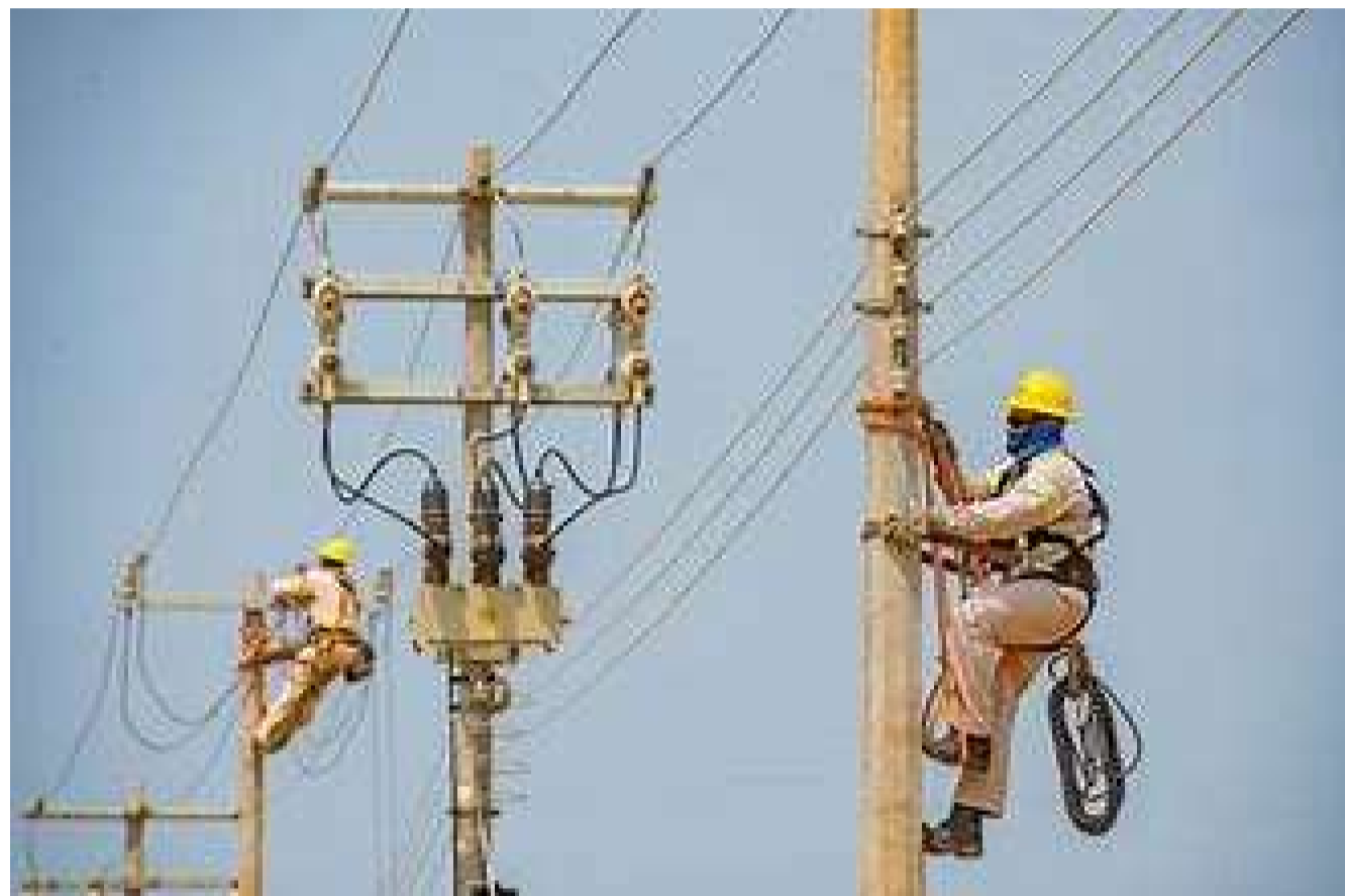
MEXICALI.- CANACO exige a la CFE solución a los apagones que afectan al comercio local.

“Los priistas de verdad seguiremos trabajando y defendiendo al partido, a pesar de los embates y las críticas mal intencionadas de apetitos personales, el PRI seguirá, no tenemos gobierno, la gente dice lo que quiere, la gente se expresa, dicen lo que quieren, que lo escriben y publican”, expresó la líder partidista.