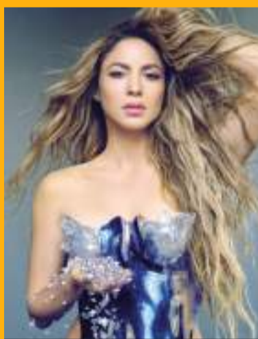
La Conmebol confirmó la presentación de la estrella colombiana en Miami.

Shakira también tuvo a su cargo el proporcionar la canción oficial del certamen, ya que su sencillo "Puntería" sonó a lo largo de las transmisiones televisivas del torneo. La cantante se encuentra en plena promoción de su nuevo álbum "Las mujeres ya no lloran".