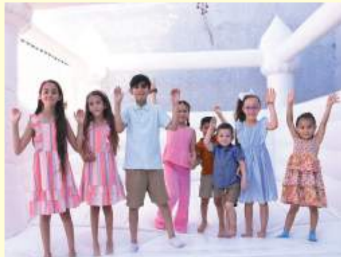
Una fiesta muy feliz gozaron los niños invitados.