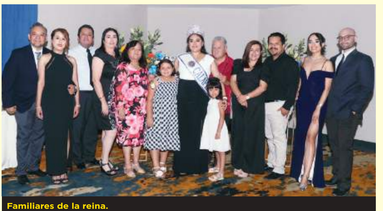
Familiares de la reina.