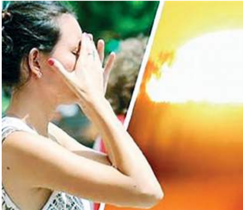
MEXICALI.- Continúa imparable el número de muertes por golpe de calor.

La dirección de protección civil local, comunicó que la capital del estado rompió nuevamente récord en cuanto a temperaturas en un 23 de julio, en 2006 y 2018 fue de 48 grados centí-