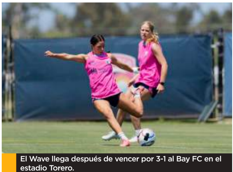
El Wave llega después de vencer por 3-1 al Bay FC en el estadio Torero.