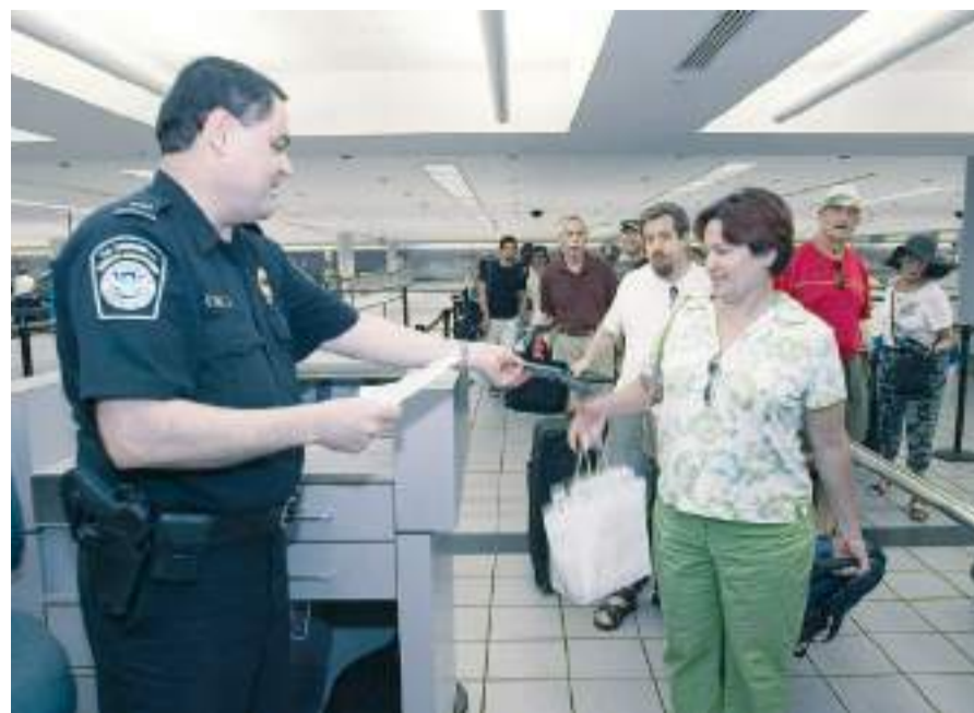
TIJUANA.- El 19 de agosto inicia la Orden Ejecutiva de Joe Biden, para la regularización de personas que residen de manera irregular y así solucionar su récord migratorio o criminal.

Detalló que, dentro de los requisitos para ser candidatos a este “Parol in Place”, destacan el haber ingresado desde hace diez años o más de forma irregular a Estados Unidos y estar casado con una persona ciudadana estadounidense, sin embargo, la lista completa