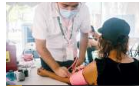
MEXICALI.- Los puntos de hidratación masiva tienen un horario extendido de lunes a domingo, las 24 horas del día.

Finalmente, la abogada Josefina Orozco, comentó que el que entre en vigor la Orden Ejecutiva de Joe Biden, permitirá que una gran cantidad de personas con un status migratorio irregular pueda arreglar su situación sin separarse de su familia, y además obtenga una autorización para laborar y posteriormente obtener la residencia en Estados Unidos.