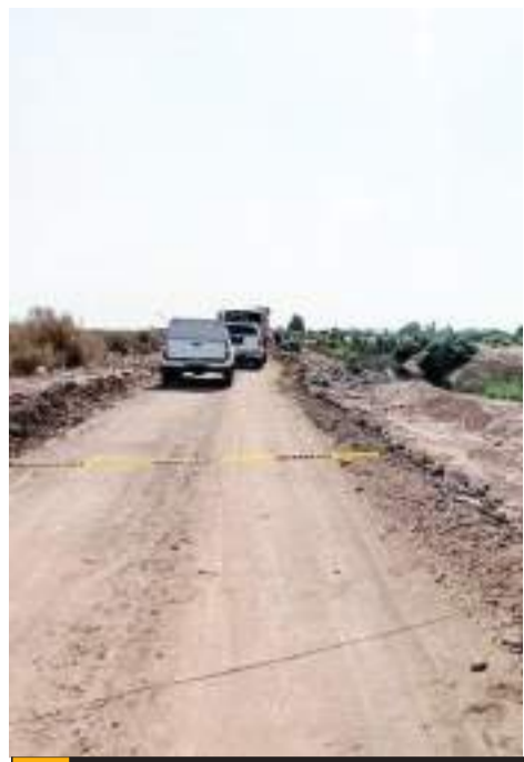
VALLE DE MEXICALI.- Muy cerca de un comercio, fue abandonado el cuerpo sin vida de una mujer, en el Valle de Mexicali.