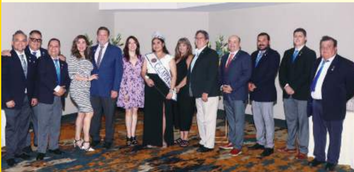
Club Rotario Calafia de Mexicali, con el Club Rotario de Yuma Arizona.