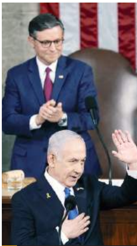
El primer ministro israelí, Benjamin Netanyahu, habla ante una reunión conjunta del Congreso en el Capitolio.