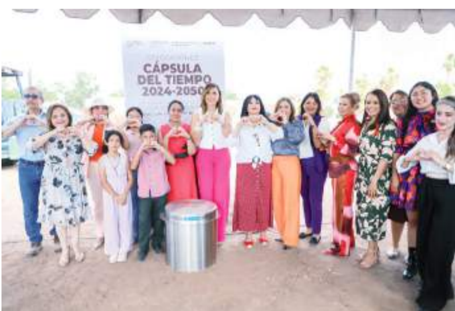
MEXICALI.- Puso en marcha Marina del Pilar, los trabajos de construcción del tercer Centro de Justicia para las Mujeres.

En ese mismo sentido, como parte de esta obra se colocó la capsula de tiempo la cual se abrirá en el año 2050, donde depositaron documentos del proyecto CEJUM, libros diversos, diarios impresos de la región, así como cartas de niños que fungieron como “Niños Funcionarios”.