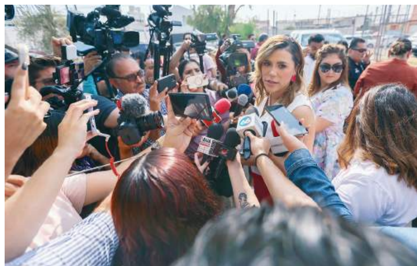
MEXICALI.- Baja California y Sonora tendrán mesa de seguridad para revisar estrategias contra los delincuentes.