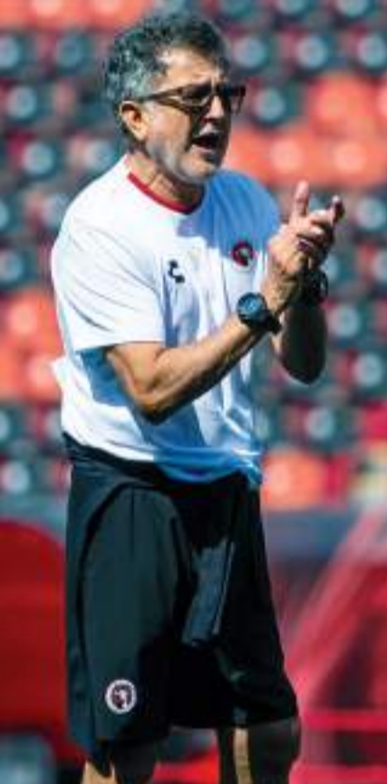
Juan Carlos Osorio dirigirá su primer partido internacional con Xolos.