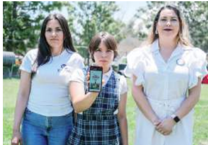
TIJUANA.- El tipo de violencia que predomina en los primeros lugares, es la psicológica, la emocional y la física, de acuerdo al “violentómetro”.

Si son declarados culpables, cada uno enfrenta una pena máxima de cinco años de prisión y una multa de hasta 250.000 dólares.