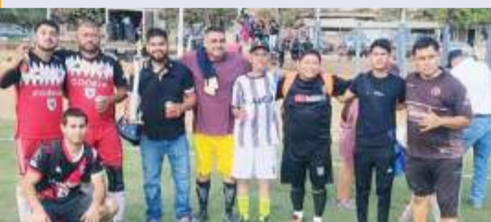
El Deportivo Sonido Matrix es bicampeón de la Primera Fuerza.