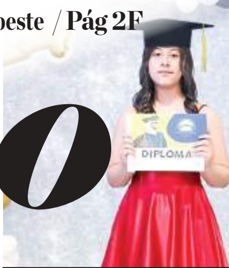
La orgullosa estudiante mostrando el diploma.

Directivos de la institución educativa, exhortaron a los egresados, a continuar con su preparación académica que les garantice un mejor futuro profesional y personal.