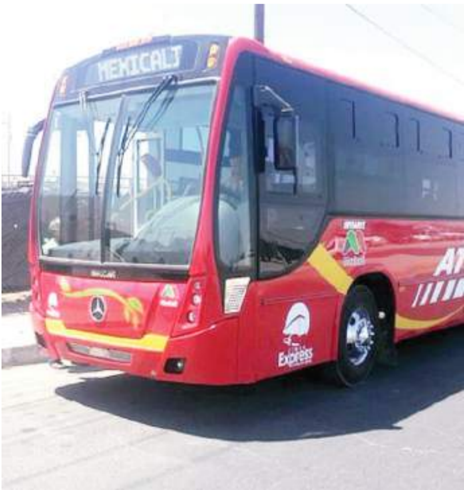
MEXICALI.- La mandataria estatal Marina del Pilar justificó que la actualización a la tarifa del transporte público es un ajuste, de acuerdo a la inflación.

Ciudadanos inconformes con esta decisión, realizarán una manifestación este viernes a partir de las 19:00 horas, en la explanada central de Centro Cívico, frente al edificio de Poder Ejecutivo y del Ayuntamiento de Mexicali.