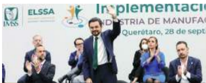
Zoé Robledo seguirá al frente del IMSS.