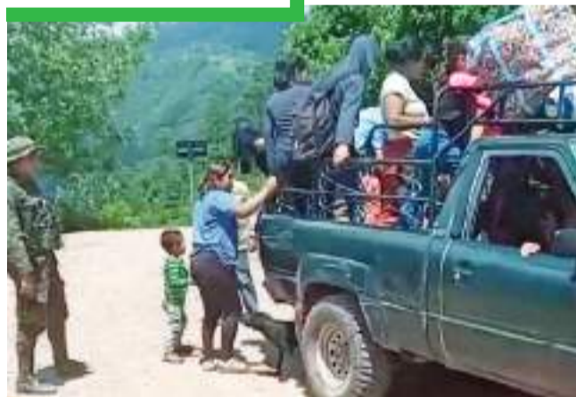
Decenas de familias cruzaron la frontera sur para escapar de los enfrentamientos y reclutamiento forzoso, de parte de grupos criminales