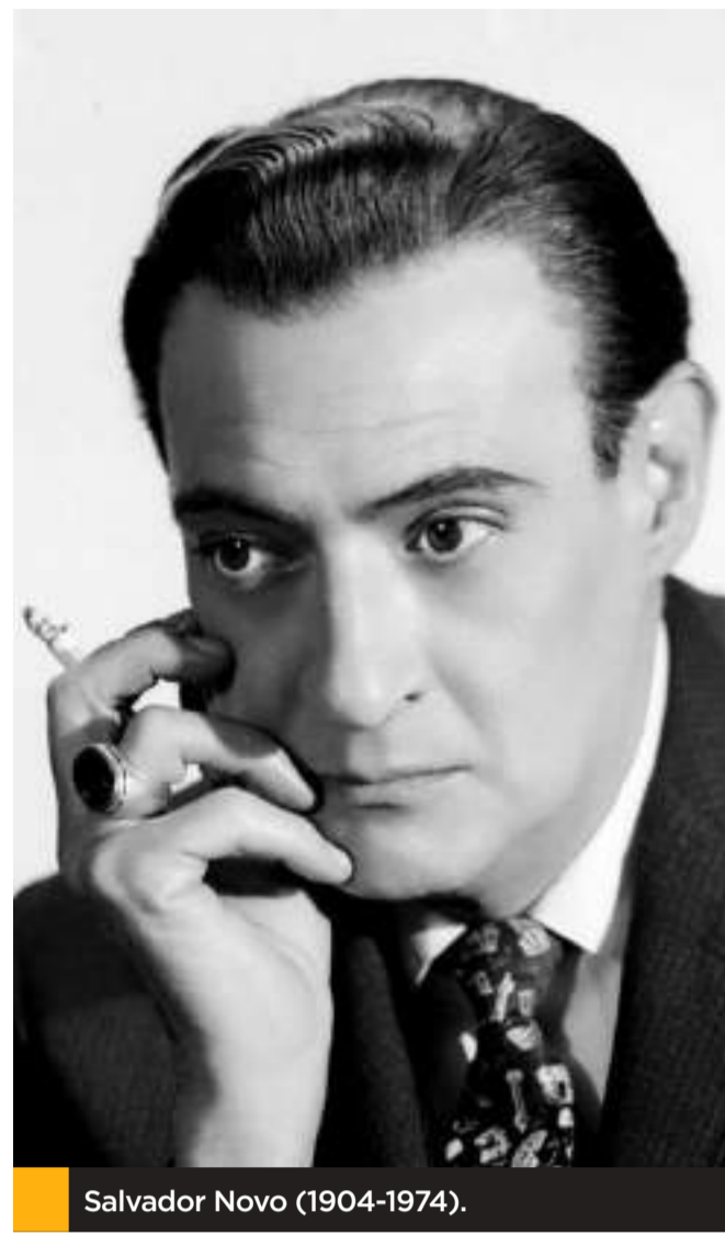
Salvador Novo (1904-1974).

EL ACERVO, DE MIL 130 DOCUMENTOS, DE UNO DE LOS GRANDES CLÁSICOS MEXICANOS, ESTÁ RESGUARDADO EN EL CENTRO DE ESTUDIOS CARSO. EL ARCHIVO, CON CARTAS PERSONALES Y DE TRABAJO, AGUARDA A LOS INVESTIGADORES