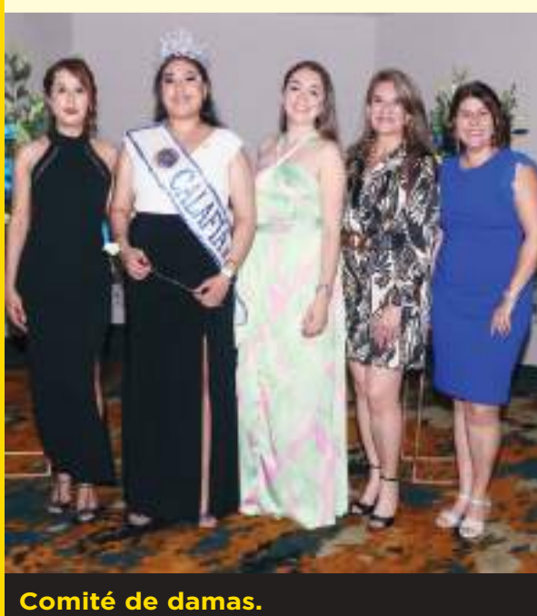
Comité de damas.