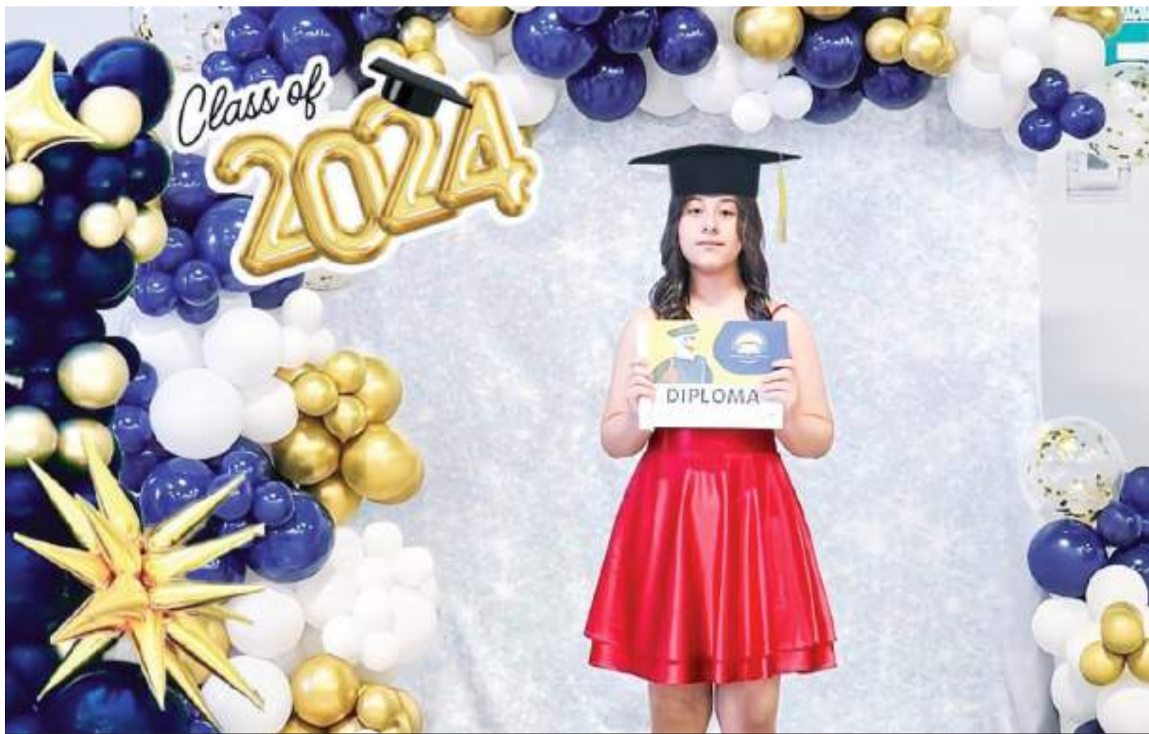
La orgullosa estudiante mostrando el diploma.

DIRECTIVOS DE LA INSTITUCIÓN EDUCATIVA, EXHORTARON A LOS EGRESADOS, A CONTINUAR CON SU PREPARACIÓN ACADÉMICA QUE LES GARANTICE UN MEJOR FUTURO PROFESIONAL Y PERSONAL