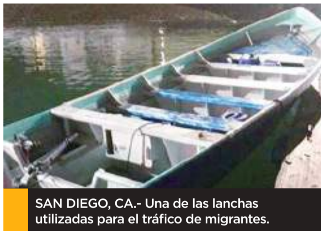
SAN DIEGO, CA.- Una de las lanchas utilizadas para el tráfico de migrantes.

Detalla que los nueve mexicanos fueron detenidos en la garita de San Ysidro y diferentes escondites donde se resguardaban en los condados de