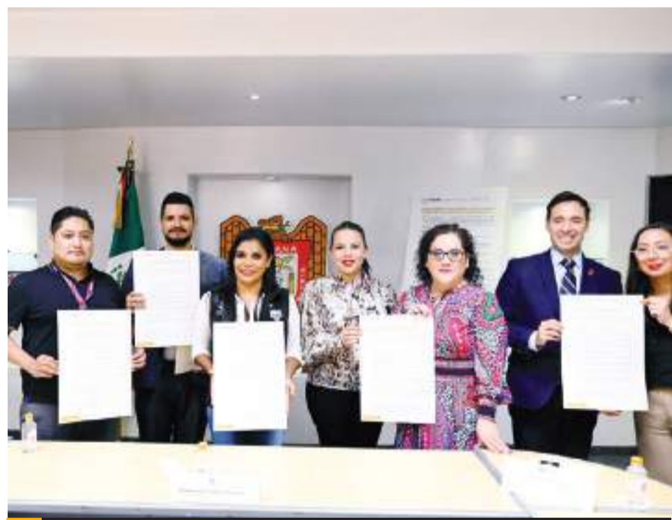
TIJUANA.- Ahora el Ayuntamiento de Tijuana, fue declarado como espacio libre de discriminación.