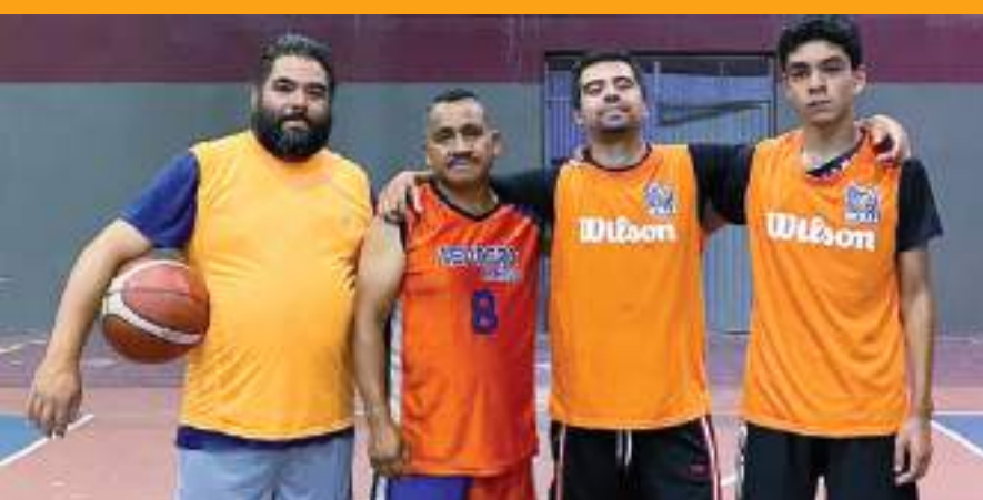
Con solo cuatro jugadores durante todo el partido, Skulls ganó en tiempo extra a los Unidos.

Esto es todo por hoy. Hasta la próxima semana, amigos y amigas.