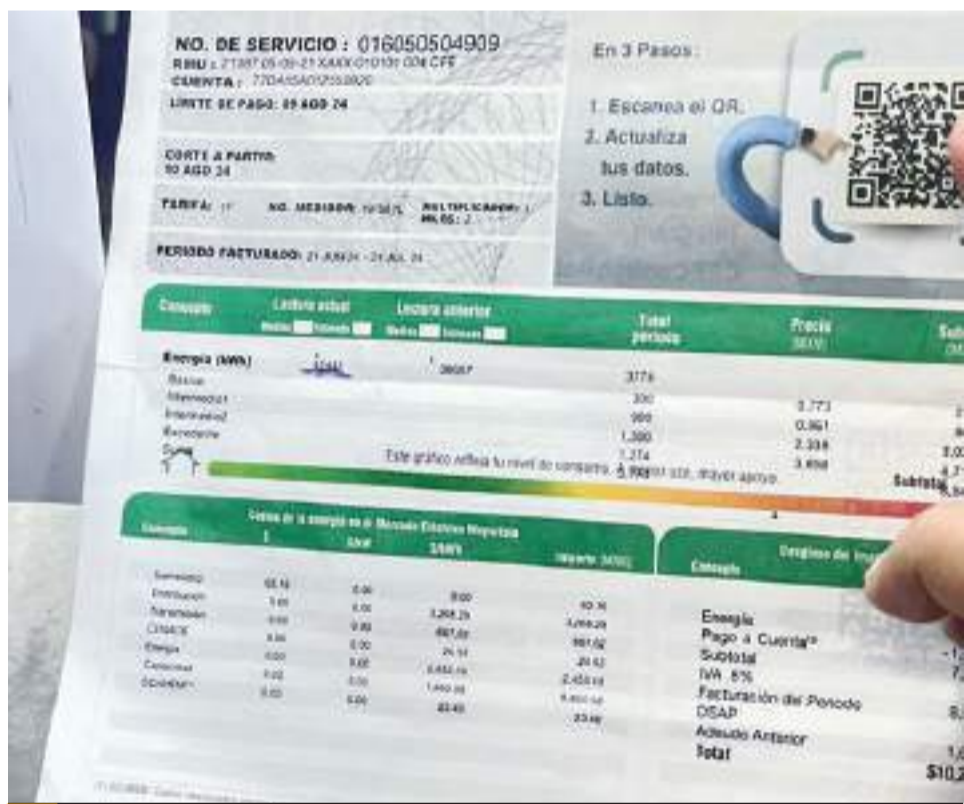
MEXICALI.- Sergio Tamaí Quintero pide a la CFE no cortar la luz en verano.