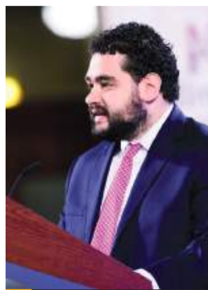
Juan Pablo de Botton es el subsecretario de la SHCP, en la conferencia en Palacio Nacional.