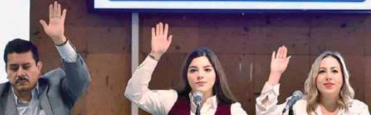
ENSENADA.- En la recta final de la LXV (65) Legislatura de la Cámara de Diputados, la Comisión de Justicia aprobó su informe final de actividades con el dictamen de 165 iniciativas, 13 minutas y 61 puntos de acuerdo.

PALACIO LEGISLATIVO DE SAN LÁZARO, JULIO 30 DE 2024.