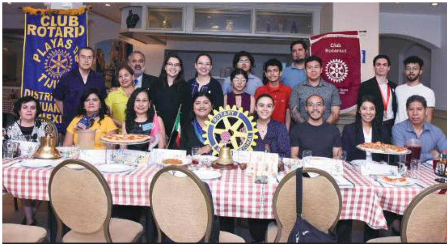
Renuevan su mesa directiva 2024-2025, Club Rotario y Rotaract de Playas de Tijuana.