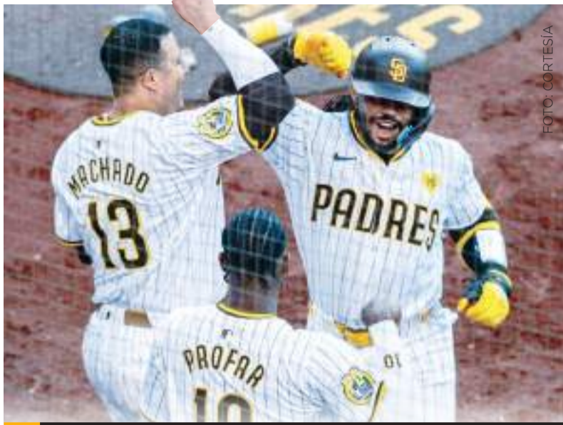
San Diego barrió la serie corta de dos juegos contra el equipo angelino.

Tras haber ganado por barrida dos series esta semana, San Diego redujo la diferencia en la carrera por la división a cuatro juegos y medio, el diferencial más pequeño desde el pasado 4 de mayo. Padres también aseguró la serie anual