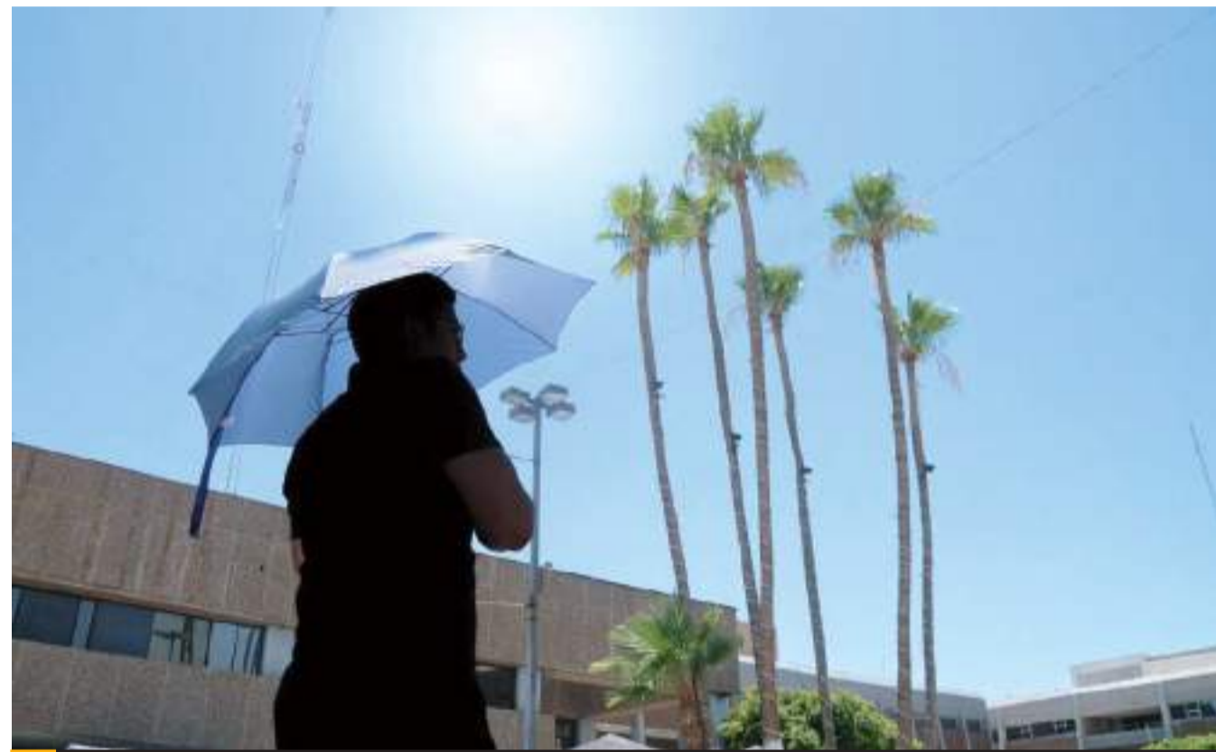
MEXICALI.- El sector salud pide a los mexicalenses extremar precauciones ante las altas temperaturas.

Inmediatamente se procedió a realizar la intervención que derivó en el decomiso ya mencionado, en ese sentido fue detenida y trasladada a la Comandancia de la Policía Municipal para ser puesta a disposición de la instancia legal competente, ya que se presume su aparente responsabilidad en los delitos de portación de arma prohibida y contra la salud, en la modalidad de posesión de enervantes.