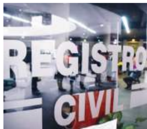
ENSENADA.- Con la aplicación del 50% de descuento para estudiantes con credencial o constancia vigente, en este mes regresa la Campaña de Actas Escolares en beneficio de la comunidad escolar, comentó el Alcalde Armando Ayala.

Para más información los interesados pueden comunicarse a los teléfonos (646) 172-3446 y (646) 172-3447, en los horarios ya descritos.