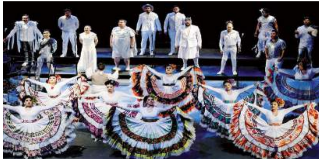
Demostaciones de danza contemporánea y folclórica serán elementos principales de este encuentro.

Los boletos pueden ser adquiridos en taquillas de Cecut, así como en línea en la página www.cecuto.gob.mx .