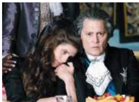
Los días 1, 2, 3, 4, 6, 7, 8 de agosto se proyectará a las 20:00 horas en Cecut.

Barry (1743-1793), se convirtió en la principal acompañante de El Bien Amado, sobrenombre con el que se conoció al soberano, ella no solo poseía una cultura digna de impresionar a la corte a la que escandalizó, sino que desarrolló un olfato político que la convirtió en una personalidad que dictaba tendencias en la conducta de sus cercanos, pero también en la moda por su forma de vestir y pei-