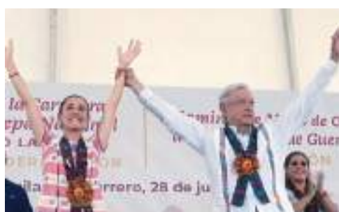
MEXICALI CLAUDIA SHEINBAUM PARDO...

Trabaja en favor de los más necesitados.