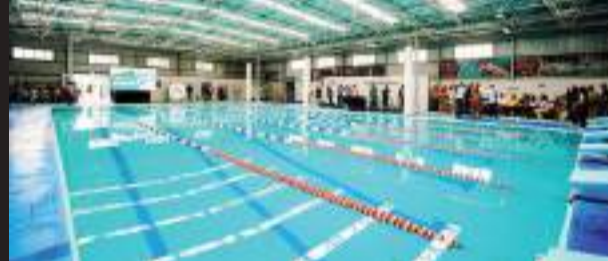
En la remodelación de la alberca se invirtieron 7 millones 108 mil pesos.

Jaime Figueroa Tentori, director de Infraestructura Municipal, informó que con este proyecto se intervinieron