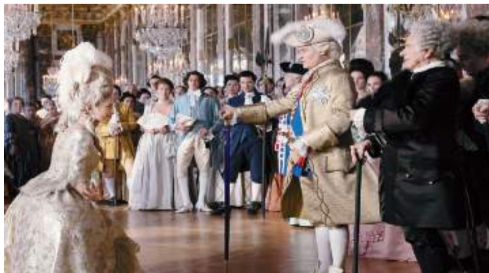
La cinta recrea la opulencia de la corte francesa con vestuarios fastuosos.