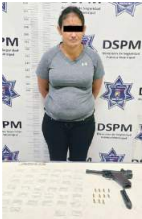
MEXICALI.- La DSPM logra la detención de una mujer con drogas y un arma.

Finalmente, también se resalta la importancia de mantenerse bien hidratado con agua natural, sin refrescos ni tampoco bebidas alcohólicas, además de identificar a tiempo síntomas como: dolor de cabeza intenso, mareo, sudoración excesiva, enrojecimiento y sequedad de la piel, fiebre con temperatura desde 38 grados, aceleración del ritmo cardíaco con latido débil, ya que pueden significar golpe de calor o deshidratación avanzada, por lo que será necesario solicitar ayuda de inmediato y recibir atención médica.