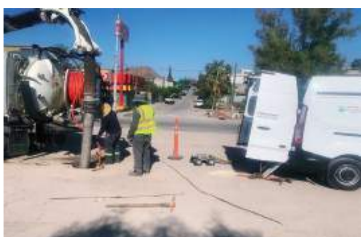
TIJUANA.- Utilizando tecnología de punta, la CESPT realiza labores correctivas en el colector Florida.

Fue a través de redes sociales que confirmaron el hecho, sin embargo, será la Fiscalía General de Baja California que determine y confirme el hallazgo, hasta la tarde de este 31 de julio no había sido confirmado.