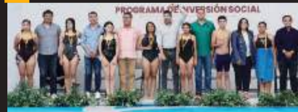
El Gobierno de Ensenada inauguró la rehabilitación de la alberca semiolímpica.