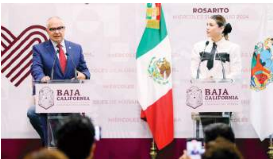
PLAYAS DE ROSARITO.- La nueva legislatura tiene contemplado una Reforma al Poder Judicial de Baja California que permita la votación de los magistrados.

Además, establece que todas las dependencias municipales están obligadas a colocar el tabloide de declaratoria y sus puntos, en un lugar visible y que sea conocido y aplicado el contenido del mismo, por el personal.