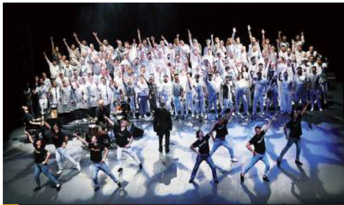
100 cantantes de Tijuana y San Diego participarán en la presentación Sigamos haciendo ruido.

El Coro Diversidad Tijuana cumple 1 año de haberse renovado luego de la creación del Coro LGBT hace más de 4 años, tiempo en el que han buscado ser representantes del arte de la comunidad LGBTQ+ y aliados de Tijuana, mientras que el San Diego Gay Men's Chorus lleva más de 41 años de trayectoria artística presentando