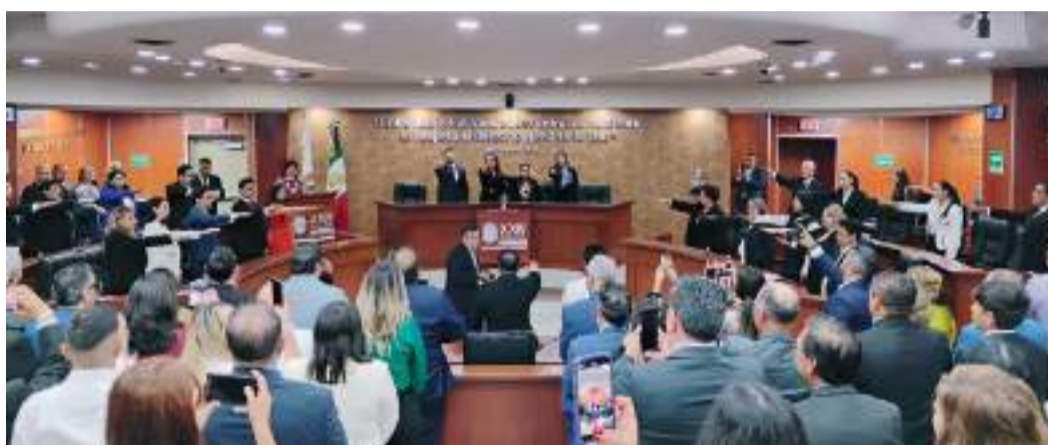
TIJUANA XXV LEGISLATURA DE BAJA CALIFORNIA...

Toman protesta las y los diputados que conforman la XXV Legislatura del Congreso del Estado, en donde MORENA y sus aliados cuentan con 18 votos.