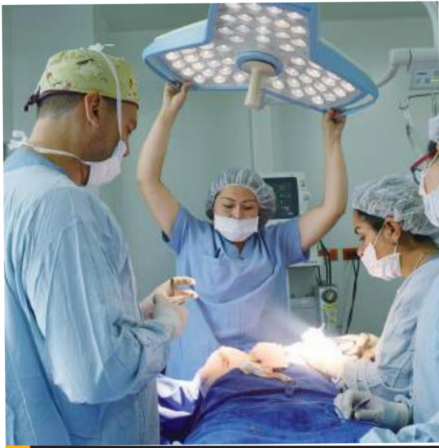
TIJUANA.- Entre mil y mil 300 cirugías plásticas se realizan en Tijuana cada mes.

“México es de los 3 países más importantes donde se realizan cirugías bariátricas, Tijuana es ícono internacional para cirugía oftalmológica, cáncer, medicina de reproducción, traumatología. Todas las áreas están cubiertas de una manera muy eficiente, tanto por la infraestructura de las clínicas y hospitales, como el expertise de los especialistas”, refirió.