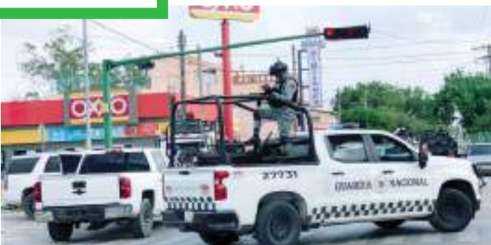
Guardia Nacional vigila un Oxxo en Tamaulipas.