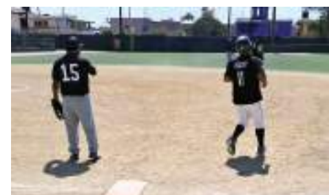
Lista, la etapa eliminatoria del torneo de softbol.