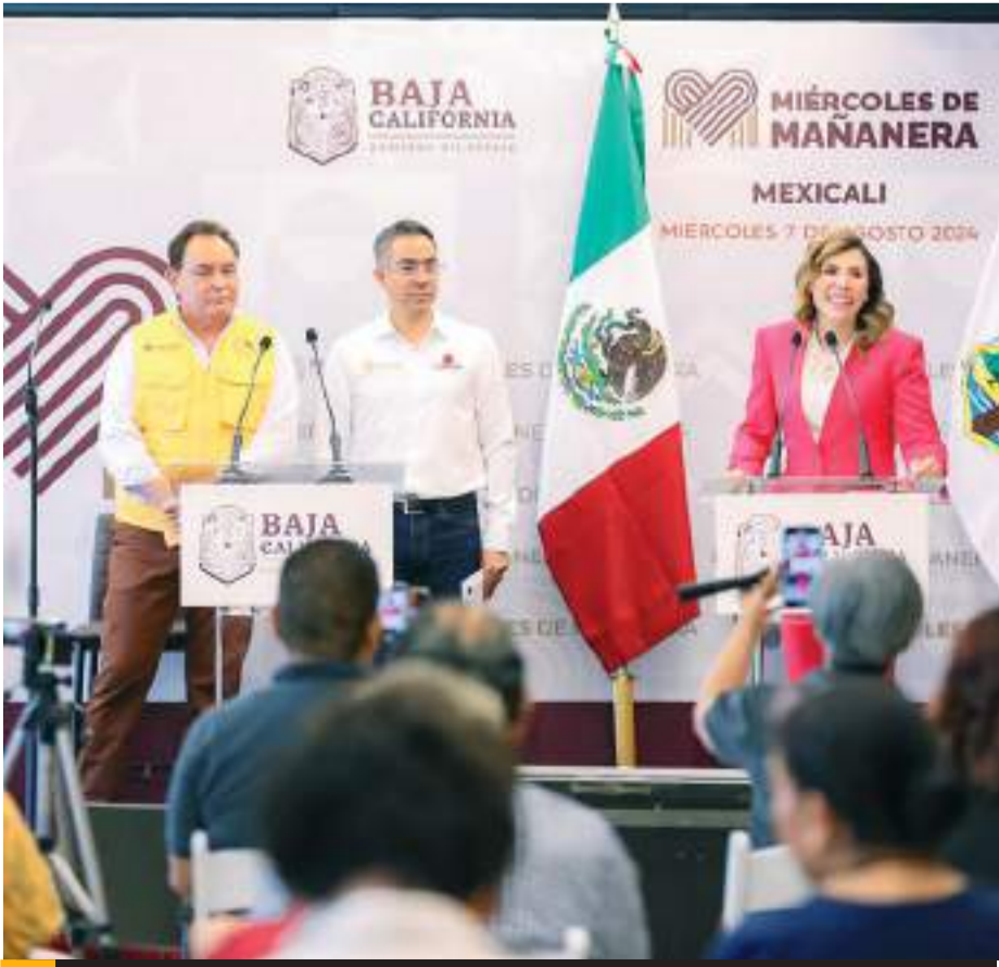
MEXICALI.- Confianza pide la gobernadora al magisterio para pagar el retroactivo de 2024.

Finalmente, Pedro Ariel Mendivil informó que presentará un plan municipal 2024-2027 con el objetivo de sacar del top ten, a las 10 colonias con más índices delictivos en la ciudad, con la aplicación de estrategias como cámaras instaladas en las calles por parte de la secretaría de seguridad ciudadana, lectores de rostro entre otros.