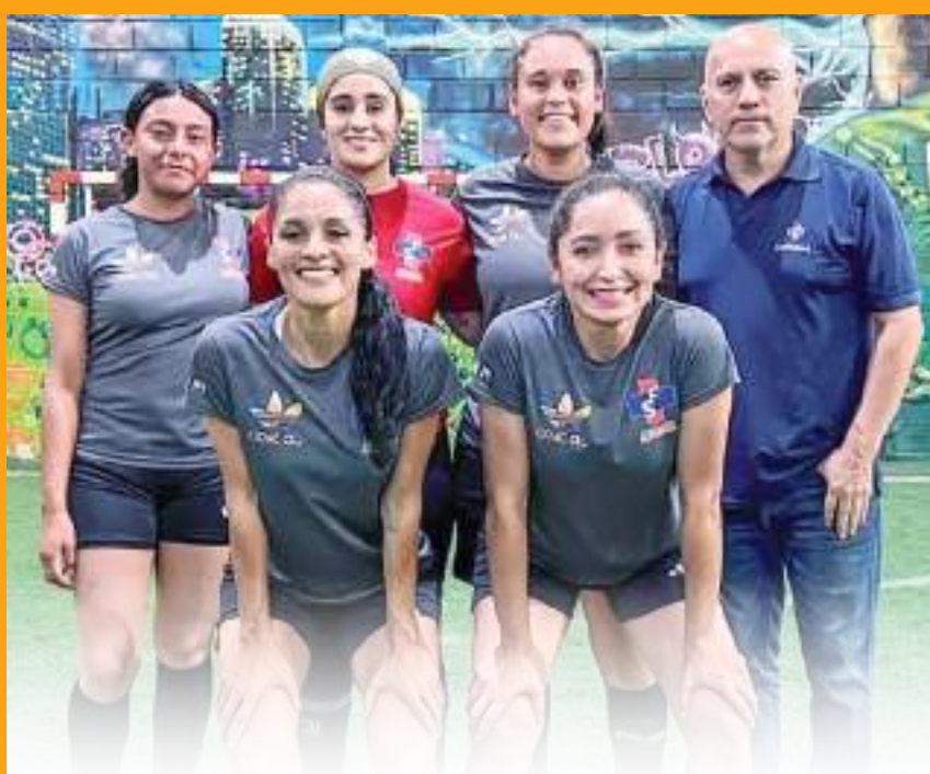
Farmacia Suprema va por su séptimo campeonato consecutivo de Primera Fuerza.

Esto es todo por hoy, amigos. Hasta la próxima semana.