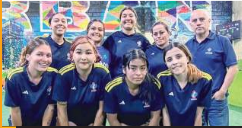
Farmacia Suprema B enfrentará en la final de Segunda Fuerza a Rosario Central.

En la otra semifinal, el conjunto del Rosario Central se impuso en la vuelta 8 anotaciones por 2 al Force FC, y terminó con global de 15-9 agarrando ticket a la final.