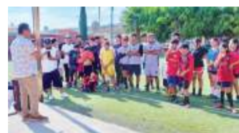
El director de Inmudere se reunió con vecinos, equipos y promotores deportivos del inmueble.

También se reunió con vecinos, equipos deportivos y promotores deportivos de la unidad Santo Tomás para informar sobre las rehabilitaciones, además, les entregó material deportivo y se notificó sobre la creación de un comité de vigilancia y un comité deportivo con el objetivo de resguardar la unidad de la mano del Inmudere.