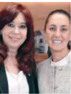
MEXICALI CLAUDIA SHEINBAUM PARDO...

Se reunió con la ex presidenta de Argentina, Cristina Fernández de Kirchner.