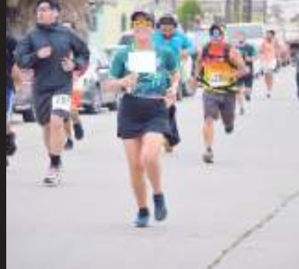
Se inscribieron mil 800 personas para la fiesta atlética en el puerto.

Agradeció a las y los corredores por su paciencia y entusiasmo, invitando a todos los ya inscritos a prepararse, descansar, alimentarse y dejar sus equipamiento listo para correr el siguiente domingo, en punto de las 7:00 horas en Playa Hermosa.