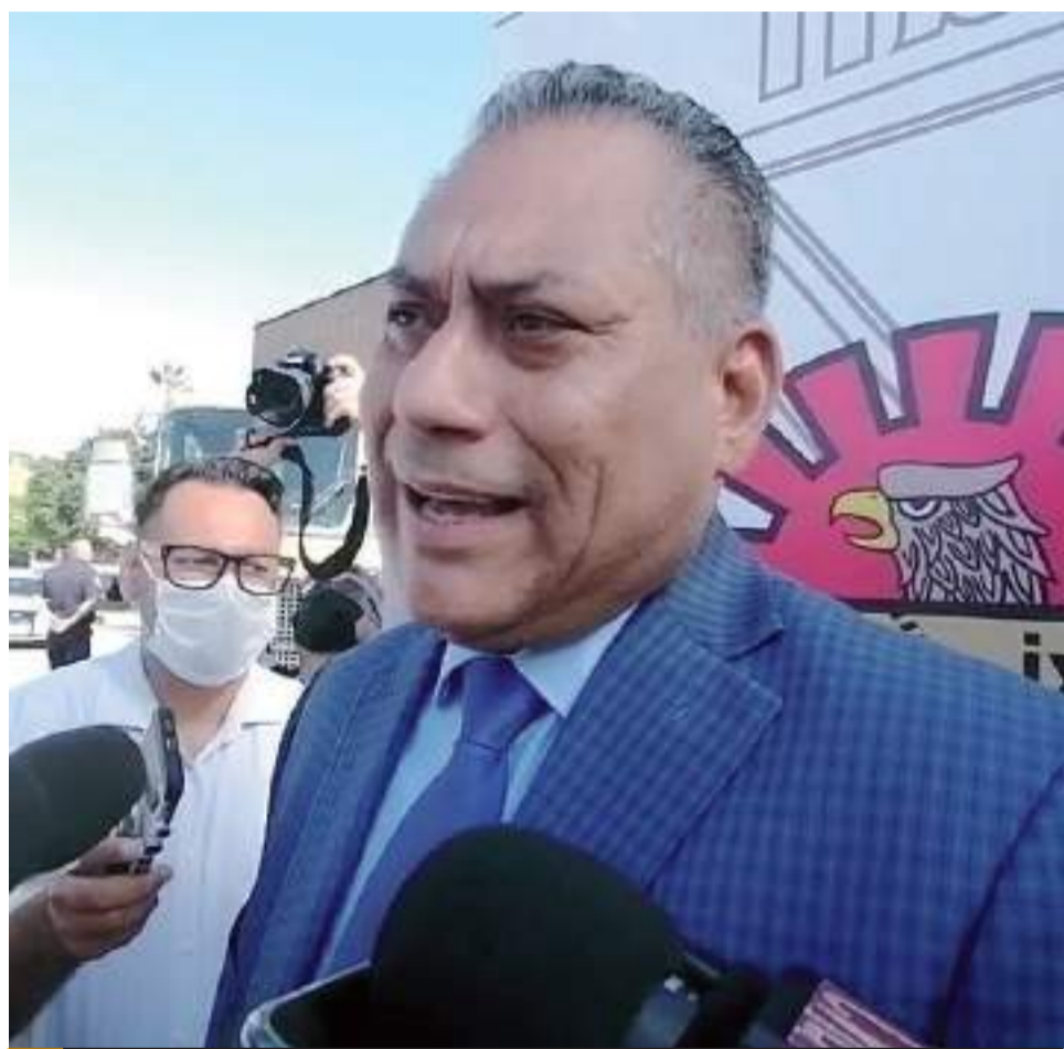
MEXICALI.- El director de la DSPM presume resultados en su último año de trabajo.

Por su parte, el secretario de educación Luis Gallegos Cortés, comentó que el gobierno estatal ha cubierto los pagos ordinarios a la nómina de 18680 docentes con un monto de 662 millones de pesos correspondientes a la segunda quincena de julio y primera de agosto, y para el 15 de agosto se prevé cubrir un total de 198 millones de pesos que incluye diversas prestaciones.