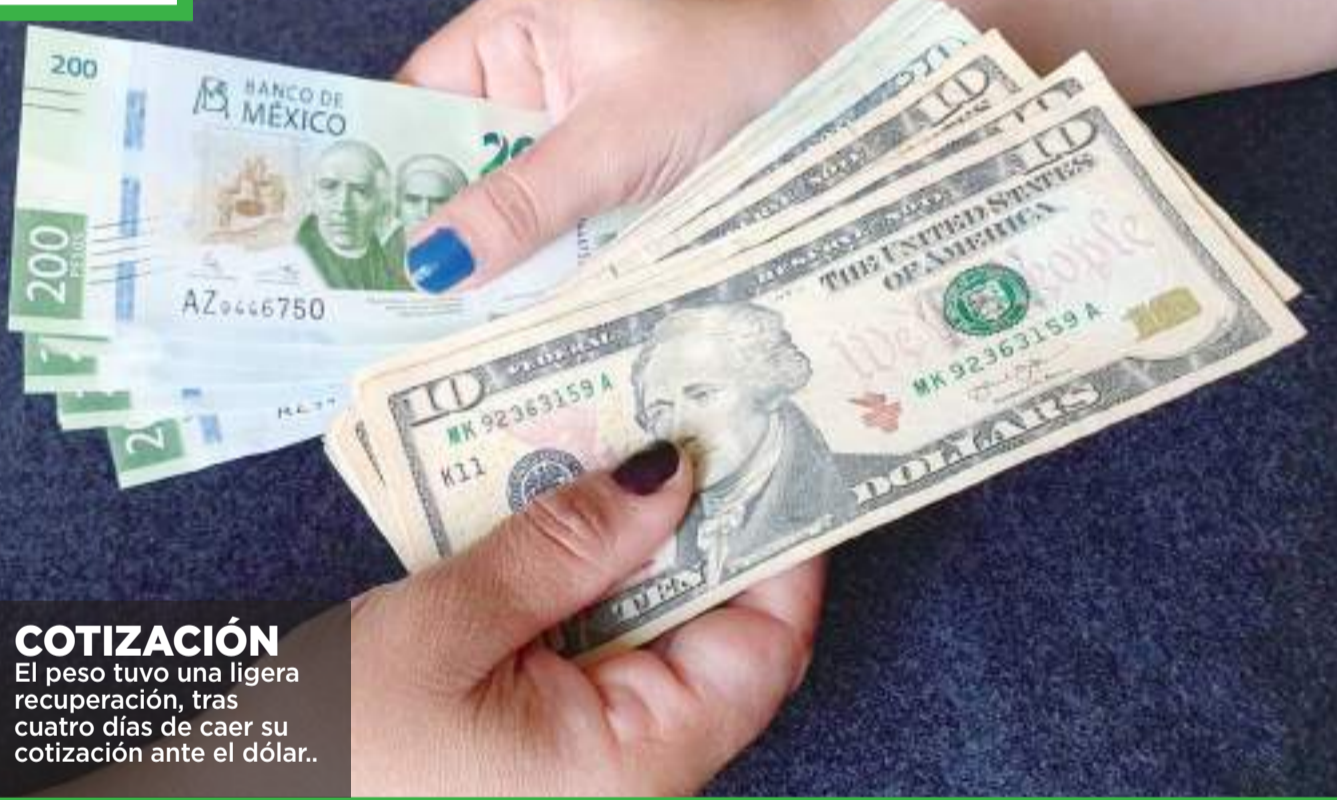
COTIZACIÓN El peso tuvo una ligera recuperación, tras cuatro días de caer su cotización ante el dólar.