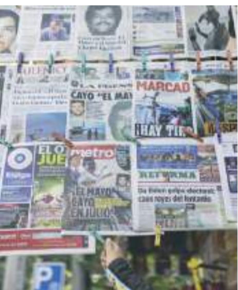
"El Mayo" se reunió con el hijo del "Chapo", porque pensaba que iba a mediar en una disputa entre políticos: NYT.