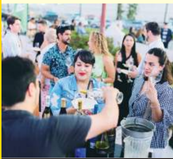
Más de 80 etiquetas de vinos locales y visitantes ofrecieron su degustación a los asistentes.