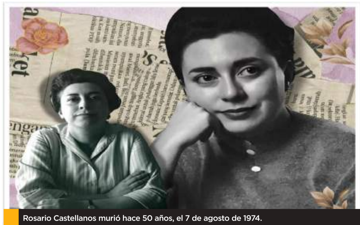
Rosario Castellanos murió hace 50 años, el 7 de agosto de 1974.

Es el lenguaje y hechos de Castellanos que esperan en su obra para cambiar el mundo que somos cada uno en este hoy que es siempre.