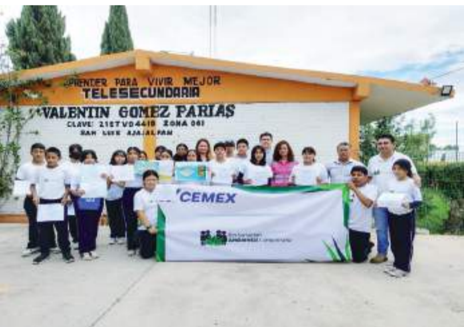
MONTERREY.- Desde 2013, CEMEX, a través de su Programa de Restauración Ambiental Comunitaria (PRAC), ha capacitado a casi 4,000 jóvenes promotores para la promoción de prácticas sostenibles en sus comunidades.