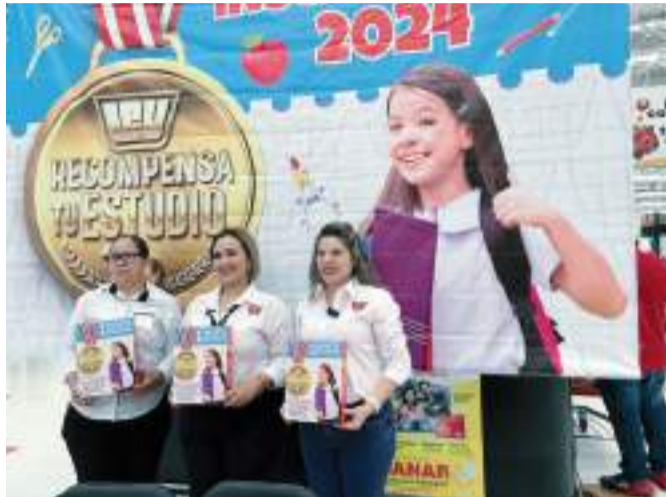
TIJUANA.- A partir del 13 de Agosto Casa Ley abrirá las inscripciones para el programa 2024 de entrega de Paquetes Escolares, en beneficio de los estudiantes de primaria.

Las inscripciones al programa de Paquetes Escolares inician el día 13 de Agosto para Sinaloa, el 14 para el estado de Sonora y a partir del