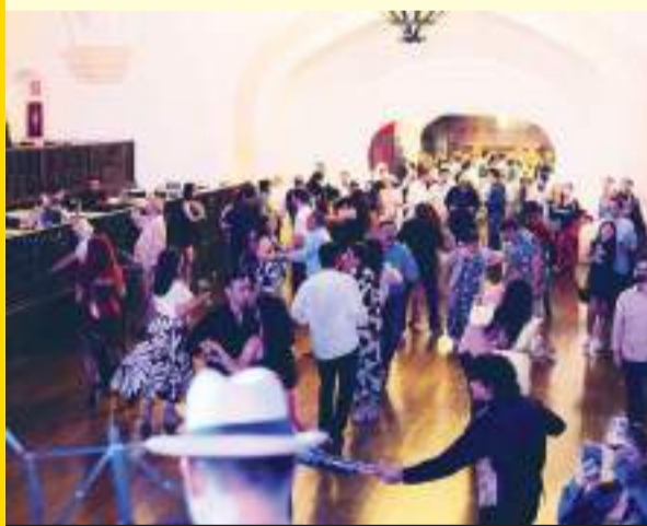
Música de todos los estilos, disfrutaron los visitantes en cada uno de los patios del Centro Cultural Riviera.