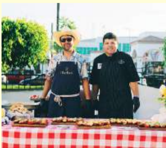
Los prestigiados chefs de la región ofrecieron sus creaciones culinarias para la ocasión a los visitantes.