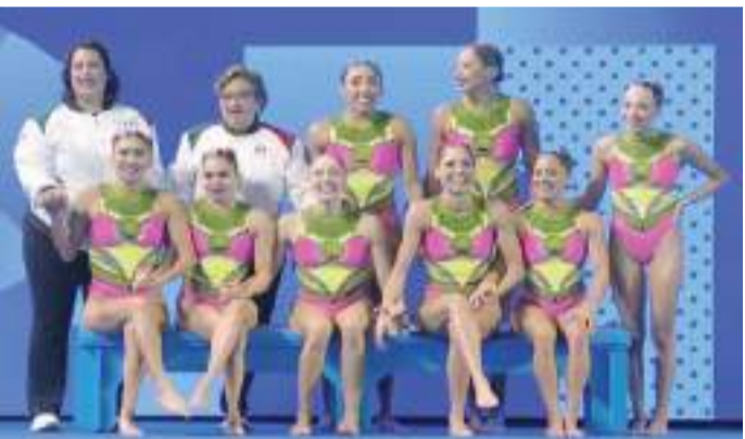
El selectivo mexicano presentó su rutina acrobática llamada "Matlalcueye".

El primer lugar fue para el equipo de China que obtuvo 996.1389 puntos totales, seguido de Estados Unidos con 914.3421 y España con 900.7319 unidades.