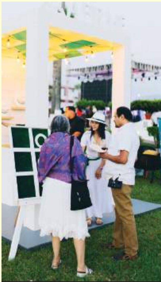
Actividades lúdicas también fueron parte del programa de las Fiestas de Vendimia.