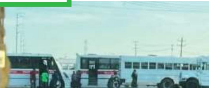
Sujetos armados atacan a elementos de la Guardia Estatal de Tamaulipas, provocando bloqueos carreteros.