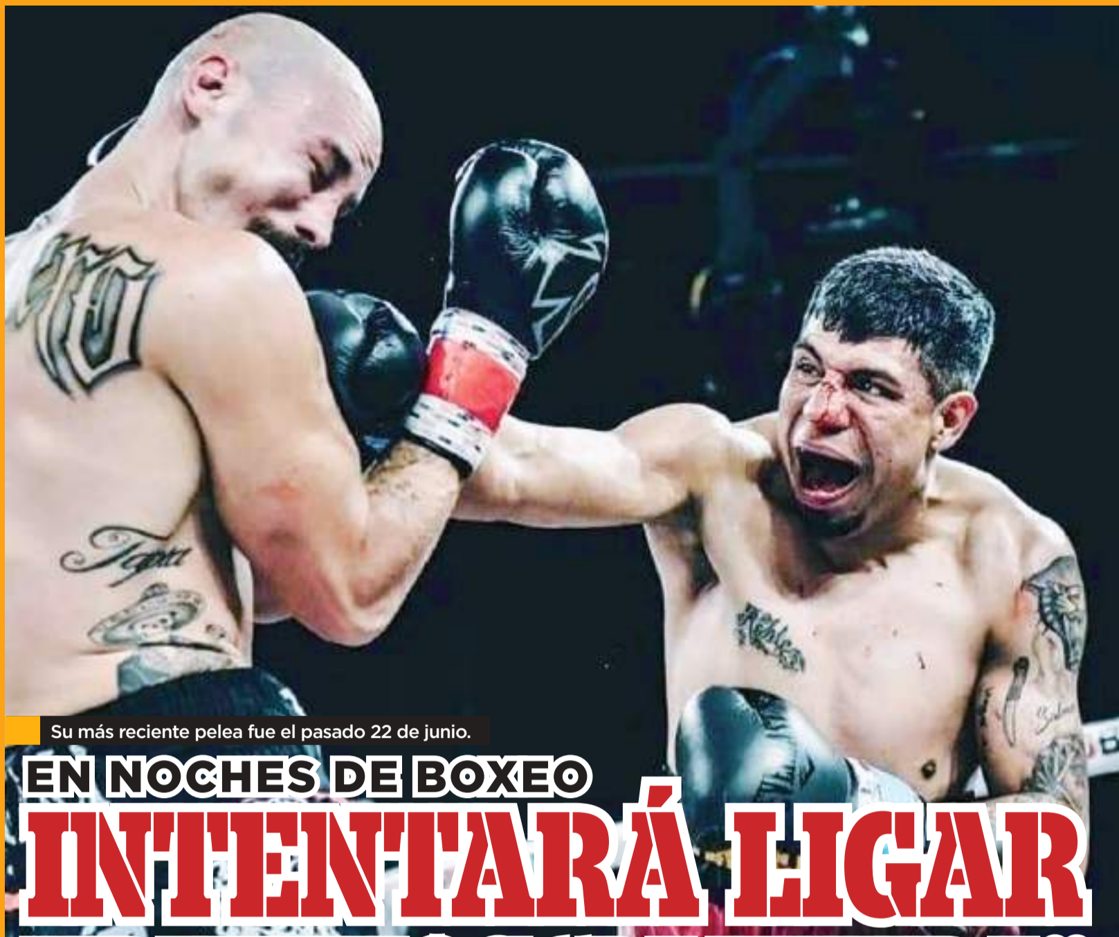
Su más reciente pelea fue el pasado 22 de junio.