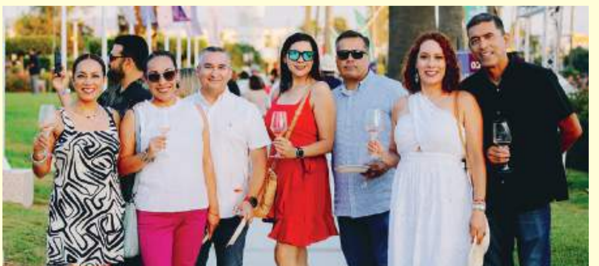
Cientos de visitantes locales y extranjeros estuvieron en la fiesta de inicio de las Fiestas de Vendimia 2024.