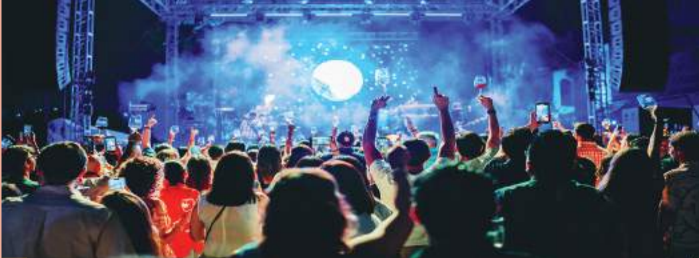
La banda regia de música electro pop, KINKY, fueron los estelares de la 34ª Muestra del Vino 2024.

Tras el gran éxito obtenido con su último álbum de estudio "Fierro" (2022), en dónde disfrutamos de una nueva faceta de la banda, un poderoso y adictivo material en dónde se recopilaron los diversos sencillos lanzados paulatinamente después de "Nada Vale Más Que Tú" (álbum de 2018), La Makina estrenó un espectacular EP que en tan sólo "5 Disparos" rinde tributo a emblemáticos hits que van desde canciones tradicionales del regional mexicano, hasta una icónica cumbia que vivirá por siempre en la mente de más de una generación, con lo que prendieron de inicio a fin a los asistentes a la primera gran fiesta de la Vendimia 2024.