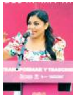
TIJUANA MONTSERRAT CABALLERO...

Presentó el Tercer Informe de Gobierno al Cabildo en pleno.