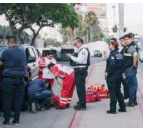
TIJUANA.- Una mujer fue arrollada por un automovilista que intentó ingresar a Palacio Municipal de reversa; por fortuna la mujer permanece en calidad de estable.