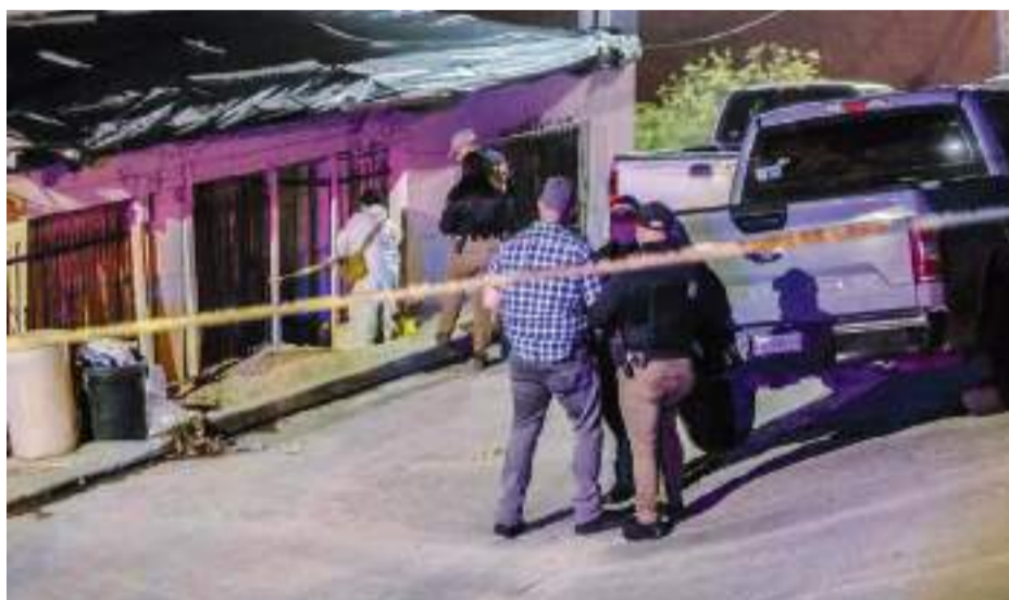
TIJUANA.- Un ciudadano de San Diego, hijo de padres mexicanos, atacó a los mismos en el hogar; lamentablemente la madre del agresor murió por lesiones de arma blanca.