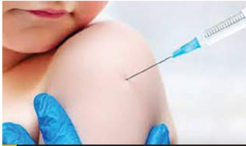
MEXICALI.- El Hospital materno invita a las mujeres a vacunarse para proteger la salud de los menores.

“La vacunación materna durante el embarazo transfiere anticuerpos al bebé, proporcionando una defensa crucial antes de que puedan recibir sus propias vacunas. Además, ayuda a crear un entorno más seguro al reducir la transmisión comunitaria. Proteger a los más pequeños contra la tosferina disminuye complicaciones graves, hos-