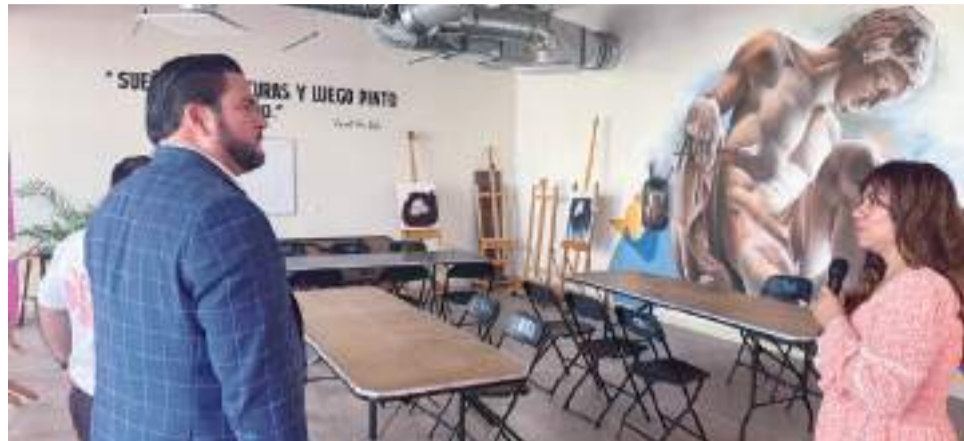
CIUDAD DE MÉXICO.- El Alcalde electo de Tijuana, Ismael Burgueño Ruiz, acompañado del Alcalde de Iztapalapa, Raúl Basulto Luviano, realizó un recorrido por las innovadoras Utopías de Iztapalapa.

"Es tiempo de invertir en el futuro de nuestros jóvenes y darles las herramientas necesarias para que florezcan en un entorno seguro y propicio", concluyó.