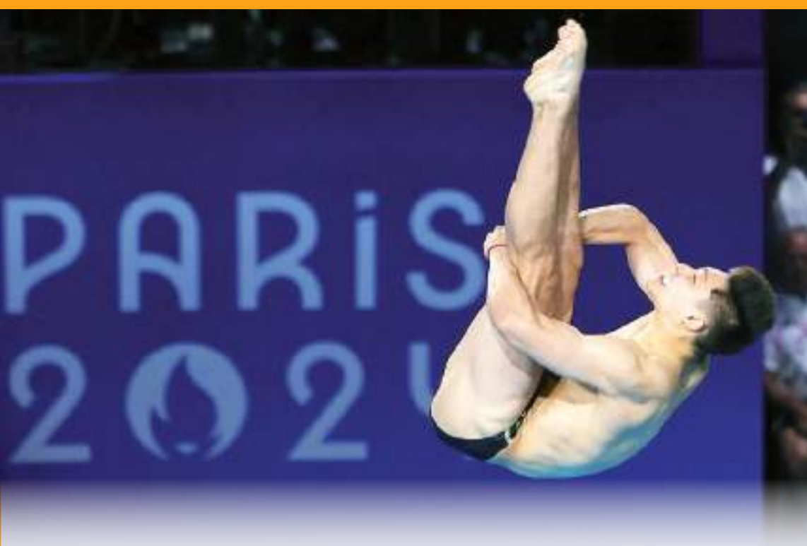
El capitalino disputará su segunda final olímpica en París 2024.