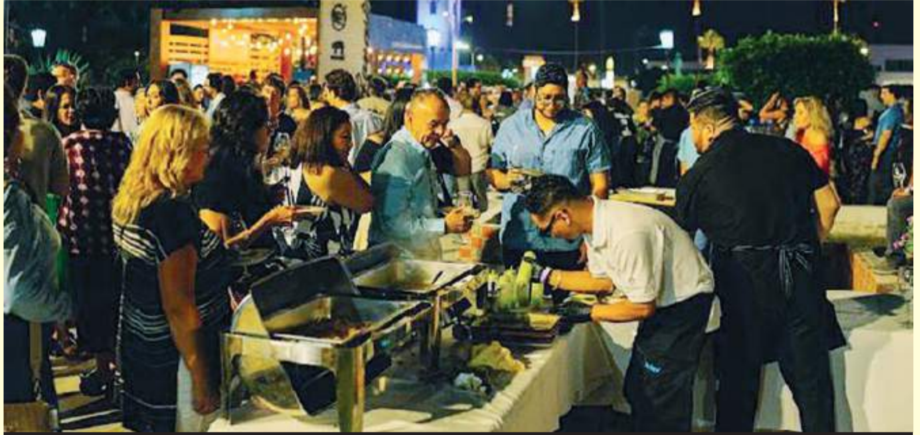
El histórico Centro Cultural Riviera, se vistió de gala para la 34ª Edición de la Muestra del Vino 2024.