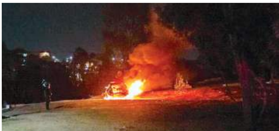
TIJUANA.- Un carro fue quemado en frente del panteón municipal número Tres, sin víctimas fatales.

Los daños fueron únicamente materiales, ya que al revisar el automóvil, los “Tragahumo” se percataron que no había víctima mortales en el interior.