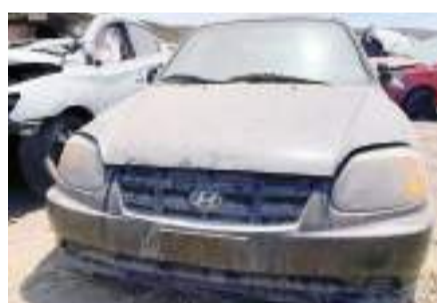
PLAYAS DE ROSARITO.- Elementos de la FGE localizaron vehículos con reporte de robo en las concesionarias Grúas Peña y Grúas Salceda; hay detenidos.