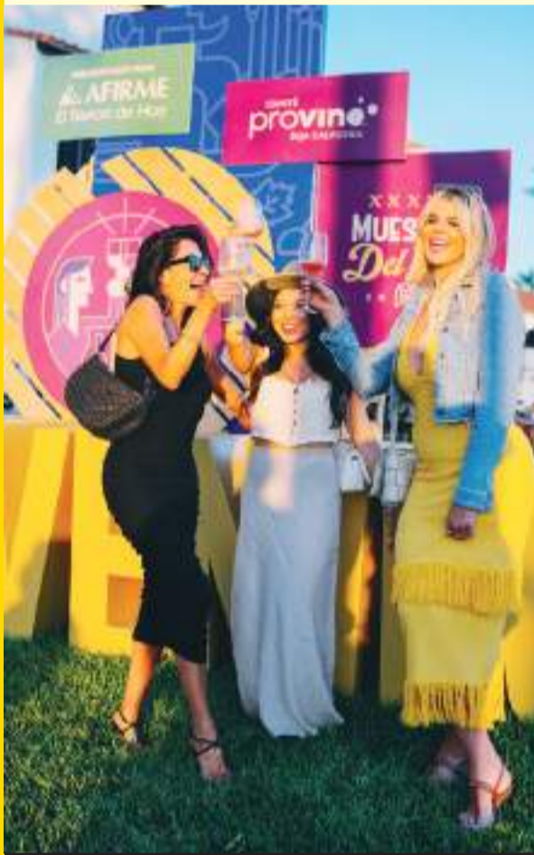
El Comité ProVino de Baja California, inició las Fiestas de Vendimia con un gran número de visitantes.