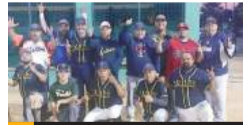
Gallos tiene su llamado este viernes para medirse a los Bulldogs.