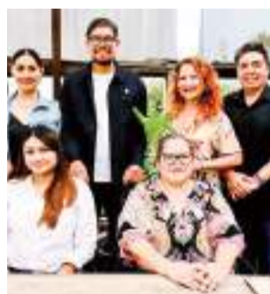
ENSENADA DIPUTADOS FEDERALES...

Acompañada de su esposo e hijo, así como hermanas y familiares, la alcaldesa expuso los resultados ob-