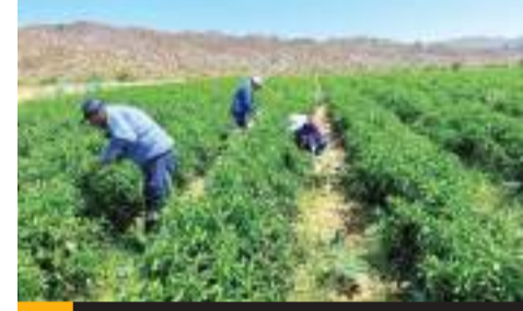
ENSENADA.- Autoridades implementan medidas en cultivos del Valle de la Trinidad.