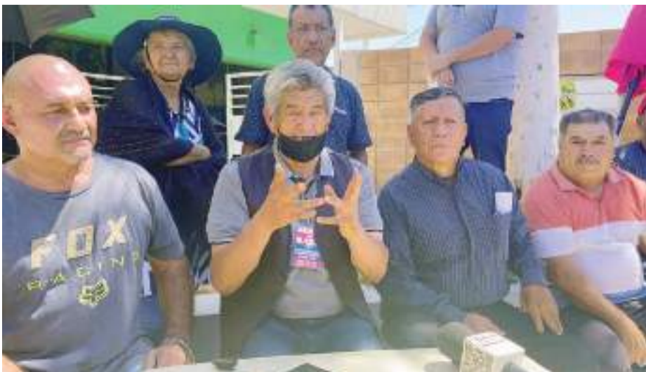
MEXICALI.- Nuevamente las oficinas de CFE son bloqueadas por el Frente Cívico Mexicalense ante los recibos locos y cortes de luz.