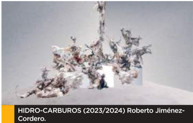
HIDRO-CARBUIROS (2023/2024) Roberto Jiménez-Cordero.

De la línea esencial se construyó este cosmos que no replica nada, únicamente el pretexto de su existencia, la justificación de concurrir desordenado que se apropia del espacio