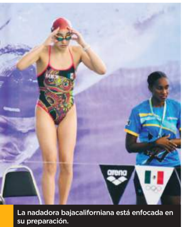
La nadadora bajacaliforniana está enfocada en su preparación.