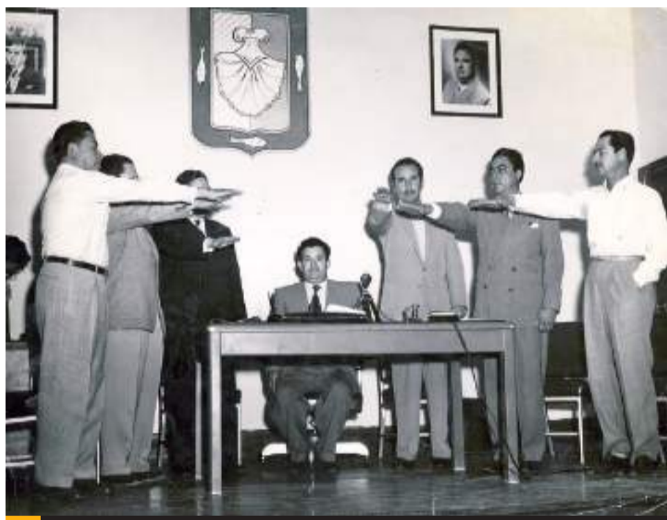
MEXICALI.- El próximo viernes 16 de agosto el Congreso del Estado realizará una Sesión Solemne en conmemoración del “Día del Constituyente”.

El funcionario, recordó que las tarifas se aplican de acuerdo con la temperatura promedio registrada en las ciudades, tomando en cuenta el estudio realizado en otros años por la Secretaría de Medio Ambiente y Recursos Naturales (Semarnat), por lo que confía en que Mexicali también puede adherirse al convenio.