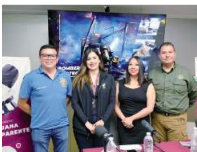
TIJUANA.- Tanto la Dirección de Bomberos como a la Dirección de Protección Civil se han fortalecido durante la presentes administración municipal encabezada por la Alcaldesa Montserrat Caballero Ramírez.

Sobre todo, porque debido a la temporada de verano, la atención de emergencias registra un repunte sobre todo en fin de semana, con la población que acude a playas, balnearios, presas o por accidentes vehiculares relacionados también por el