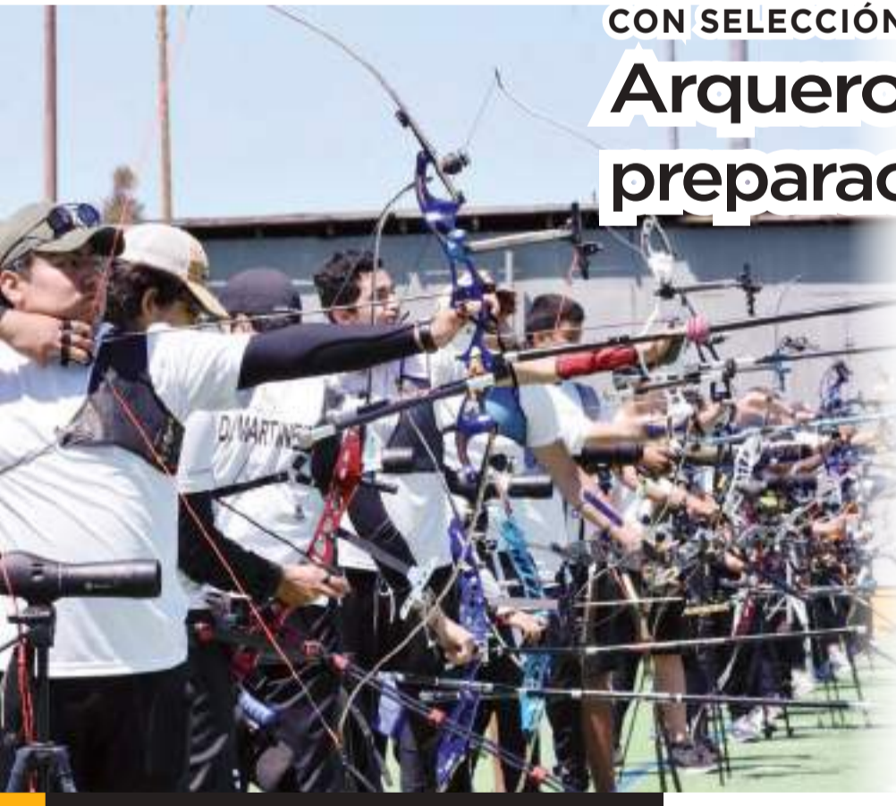
El campamento tendrá una semana de duración.