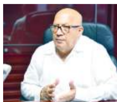
TIJUANA.- La Canaco Tijuana prevé un aumento del 45% en las ventas de estos negocios con el regreso a clases.

TIJUANA.- El regreso a clases es una de las temporadas de mayor derrama económica para ciertos giros comerciales, como lo son papelerías, zapaterías y tiendas departamentales. En ese sentido, la Cámara Nacional de Comercio (Canaco) de Tijuana prevé un aumento del 45% en las ventas de estos negocios.