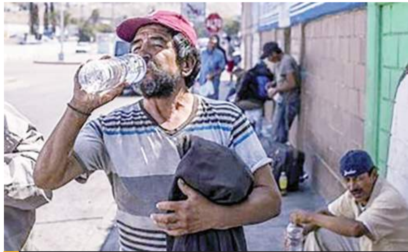
MEXICALI.- Aumentan a 42 los decesos por el golpe de calor en la capital del estado, informa el sector salud.

Esas situaciones de violencia que vivieron los alumnos en sus hogares, dijo la experta, las repitieron en las escuelas; hay alumnos violentados y alumnos que ejercen violencia, hay violencia entre ellos, con los maestros y violencia de género.