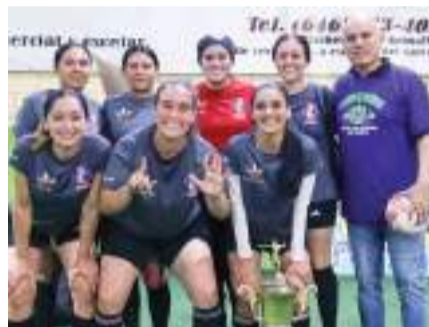
Farmacia Suprema deja en 6 títulos consecutivos su récord en Primera Fuerza.