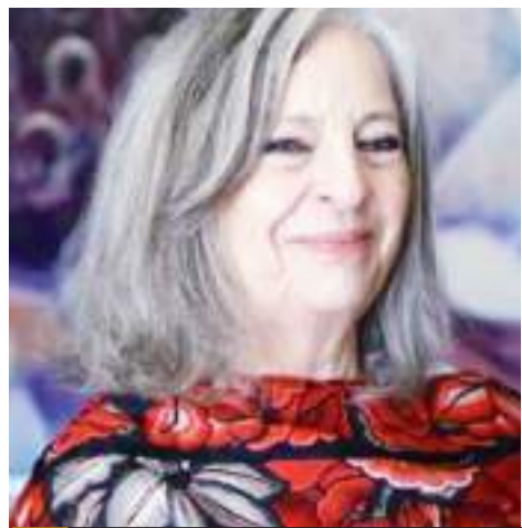
MEXICALI.- El COVID es un factor importante en el comportamiento de los estudiantes universitarios menciona la experta María Medina Mora.

Durante los recorridos que se realizan diariamente de 10:00 am a 4:00 pm, se entregaron 1 mil 500 botellas de agua con más de 900 sobres de Vida Suero Oral, 1 mil 200 botellas de agua en San Felipe, así como 7 mil litros de agua dispersada en pipas por parte de la SEDENA, en zonas vulnerables.