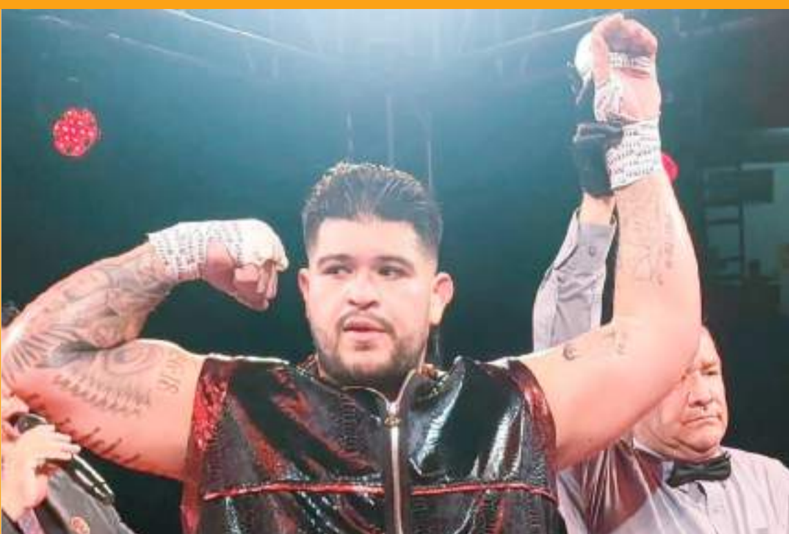
El boxeador se presentará con un palmarés de 2 victorias, ambas ganadas por la vía rápida.