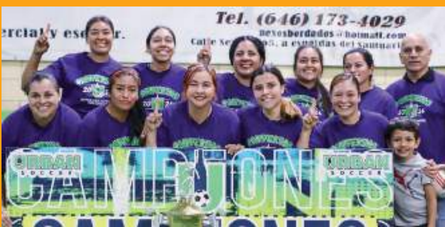
Farmacia Suprema B es el nuevo campeón de la Segunda Fuerza.

Hasta la semana que viene, mis fieles seis seguidores de esta columna de LOBOS.