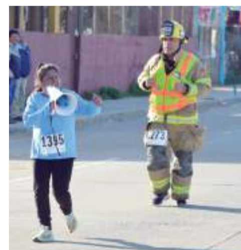
La primera carrera recreativa es a beneficio de la Asociación Pro Bomberos de Ensenada.