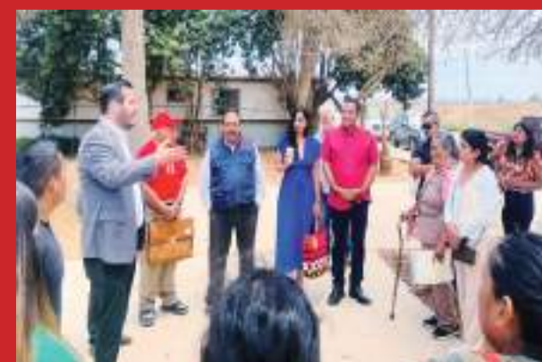
SAN QUINTÍN.- En la FGE ofrecen asesoría jurídica integral para fomentar la denuncia del delito y atender necesidades en relación a la procuración de justicia.

La Fiscalía General de Baja California sigue fortaleciendo lazos con todos los sectores de la comunidad, reafirmando su compromiso de brindar una atención especializada y oportuna que garantice la protección de los derechos de todos los ciudadanos. (bpa).