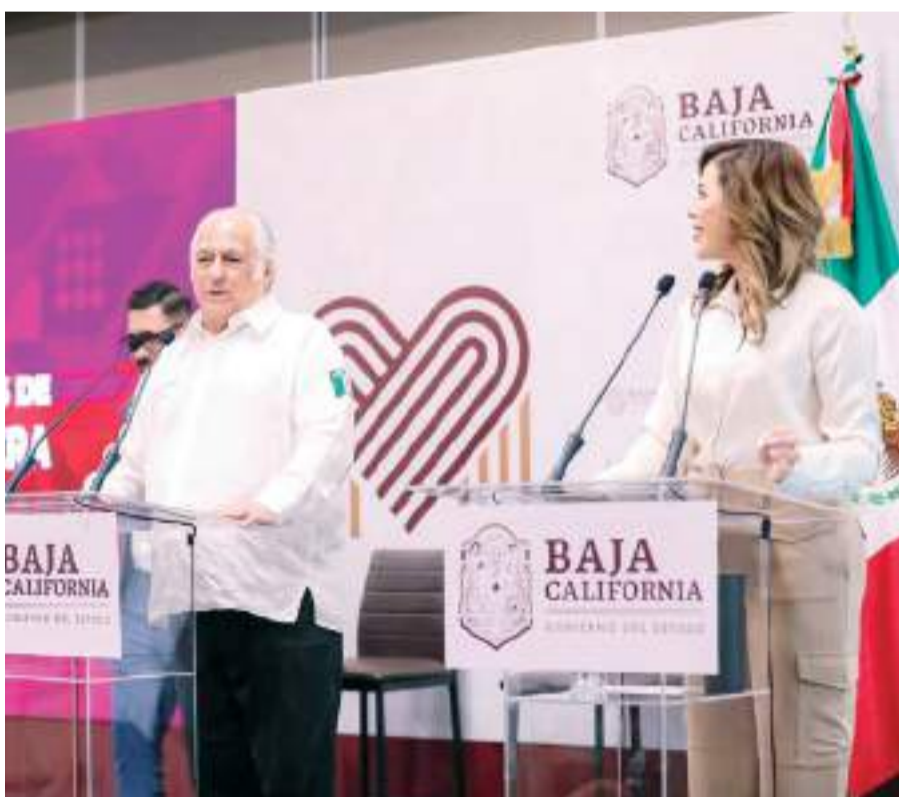
TIJUANA.- La Gobernadora, Marina del Pilar Ávila, acompañada por Secretario de Turismo de México, Miguel Torruco, informó que las obras de Respira terminarán a final del 2024, en beneficio de la movilidad.

“El tianguis turístico es en el mes de abril del próximo año y las obras van a estar terminadas este año, el Nodo Morelos se va a terminar en noviembre, que es la fecha que me dio SIDURT, y los constructores se comprometieron porque hasta me dieron la mano. El Nodo Morelos o Santa Fe estará terminado para moviente y este año nos dicen que estará terminando el viaducto elevado, pero no me quiero comprometer porque SEDENA está haciendo un trabajo extraordinario” dijo la mandataria estatal.