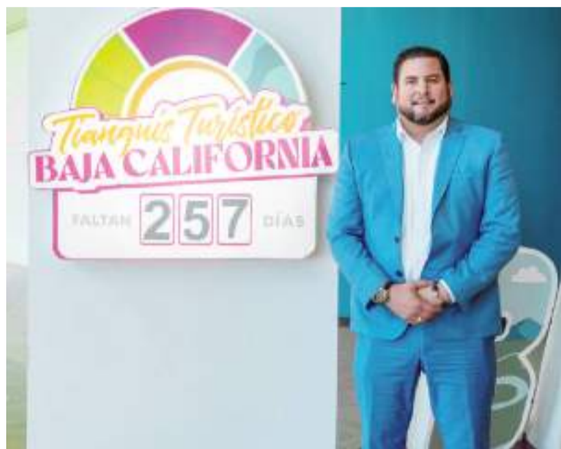
TIJUANA.- El Alcalde electo de Tijuana, Ismael Burgueño Ruiz, participó en la presentación del Tianguis Turístico 2025, con la presencia del secretario de Turismo Federal, Miguel Torruco Márquez.

El Tianguis Turístico 2025 promete ser un evento histórico