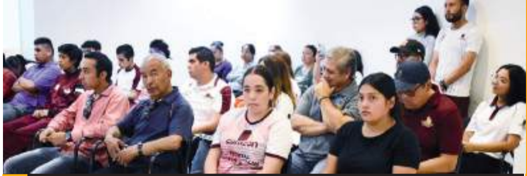
Las actividades se realizarán este fin de semana en el CAR de Tijuana.

El sábado 17 será la ceremonia de inauguración a partir de las 9:30 de la mañana en el Gimnasio de Usos Múltiples, luego de ahí se trasladarán los atletas a sus respectivos escenarios que en este caso serán la alberca olímpica, la pista de atletismo, además del mismo GUM, todos ubicados dentro del Centro de Alto Ren-