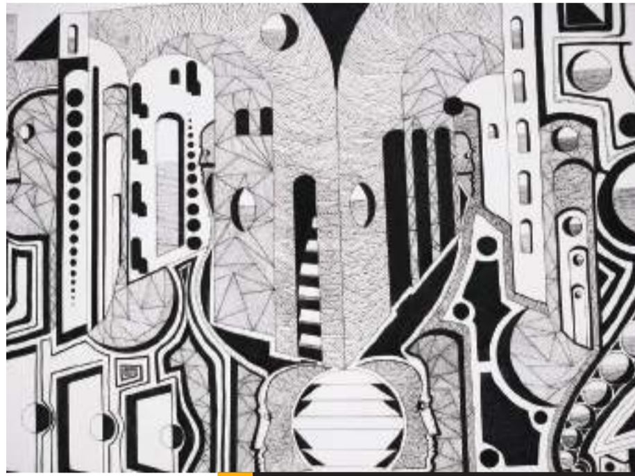
Fuera de la realidad, tinta china sobre papel / 22 x 30cm, de Manuel del Río Rosique.

El artista ensimismado en la búsqueda de respuestas a las interrogantes que lo rodea suele producir obras que concluyen en revelaciones o en la reafirmación de lo que otros niegan, en descubrir el velo que oculta intransigencias y a comprometernos a mirar la vida desde otros paradigmas jamás imaginados, y con ello a justificar otras posturas