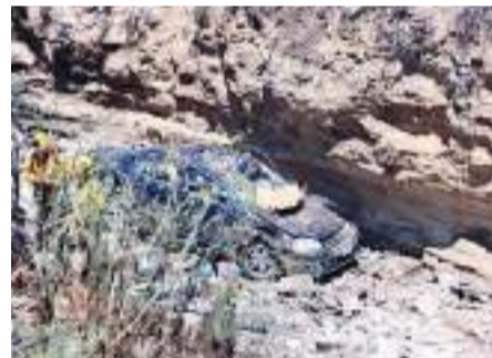
TIJUANA.- Los hombres volvieron a nacer luego de caer junto con el vehículo en el que viajaban sobre el Periférico Sur, ahora libramiento Rosas Magallón.

Afortunadamente ambos permanecen en condición estable; volvieron a nacer, luego de ver las condiciones en que quedó el carro al fondo del acantilado.