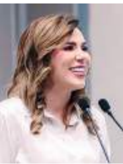
MEXICALI MARINA DEL PILAR AVILA OLMEDA...