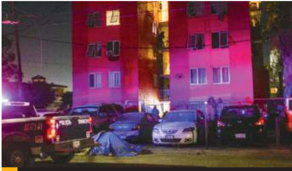
TIJUANA.- Dos hombres baleados, uno sin vida, otro ejecutado y abandonado envuelto en una cobija, lo ocurrido en 5 horas en distintos puntos de la ciudad.

sona con huellas de violencia envuelto en una cobija fue hallado la madrugada en la colonia El Pípila.