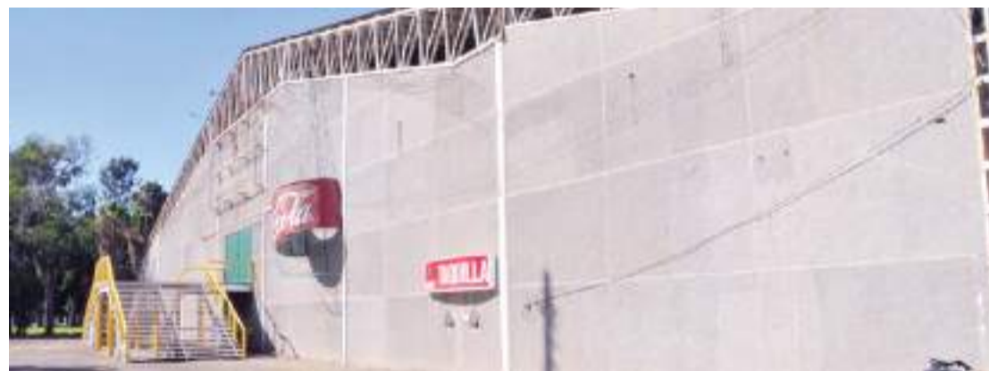
TIJUANA.- Ayer por la tarde cinco hombres intentaron quemar con bombas molotov las instalaciones del Palenque, ubicado a un costado del parque Morelos.