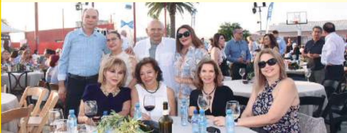
Un evento que congregó a entusiastas del vino y promovió la cultura vitivinícola de la región.