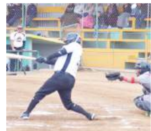
Veterinaria Bahía, Academia A1, Bravos de San Carlos y Nacionalistas, Panteras, Rockies, Titanes y Rancho Arroyo, confirmados para el torneo.

Sin duda que se espera un gran torneo en la Rural de Maneadero que la estará poniendo de nuevo en los primeros planos del beisbol en el estado.