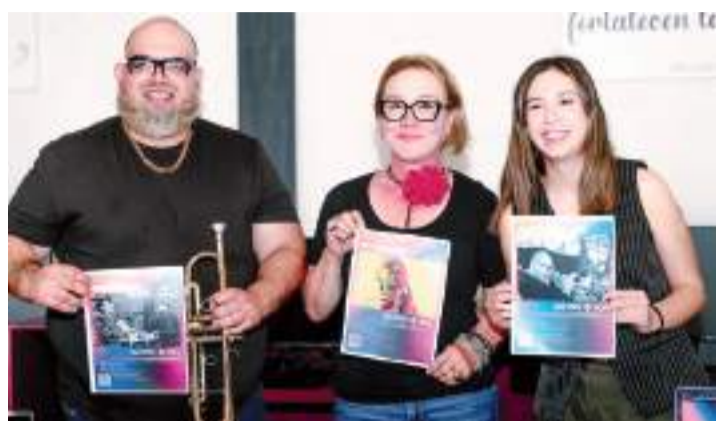
ENSENADA.- Como parte de los festejos por el 50 aniversario de reconocido club de golf, se llevará a cabo el Primer Festival de Baja Jazz de las 12 del día a las 12 de la noche.