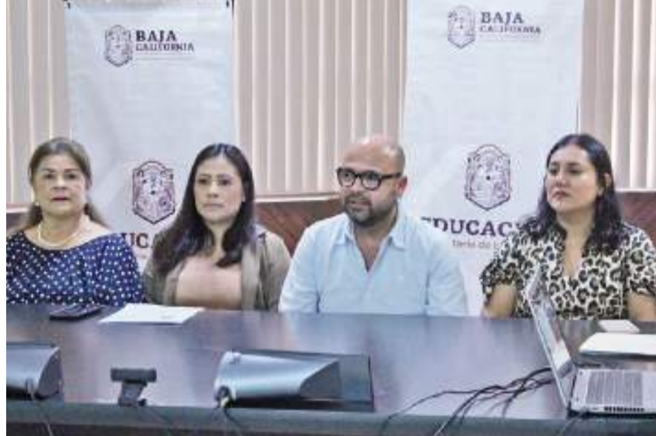
ENSENADA.- El ciclo de talleres “Educándonos en Comunidad” beneficiará a los colectivos docentes de Educación indígena y Educación Migrante.

Asimismo, “Procesos migratorios, educar desde la experiencia y la organización como espacio de aprendizaje”; “Metodologías prácticas para la interculturalidad en la Nueva Es-