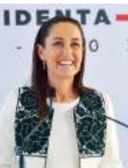
MEXICALI CLAUDIA SHEINBAUM PARDO...

Felicita a legisladores por la aprobación de la reforma judicial.