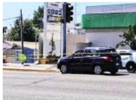
PLAYAS DE ROSARITO.- Sin vida terminó un ex oficial al ser víctima de una persecución y balacera sobre el bulevar Benito Juárez.

Al momento se realiza un intenso y amplio operativo para localizar a los presuntos responsables. (scg)