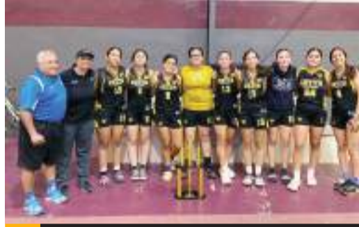
Las estudiantes del Cety's sucumbieron en la final y son dignas subcampeonas.