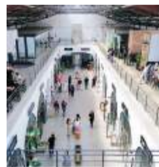
ENSENADA MERCADO MUNICIPAL...