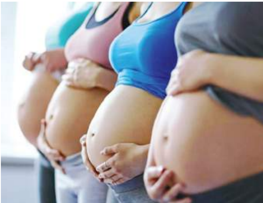
MEXICALI.- El Sector salud pide cuidado a las embarazadas ante rickettsia. Es importante minimizar el contacto con áreas infestadas de garrapatas.

Cuando existe la sospecha de que la mujer embarazada ha sido expuesta a mordeduras de garrapatas, es importante acudir a la unidad de salud más cercana para hacer el reporte al médico y así iniciar una vigilancia epidemiológica de 21 días, para estar al pendiente de la aparición de cualquier síntoma. De igual forma, si se ignora una posible exposición, pero se presentan signos de la enfermedad, es importante acudir al médico de inmediato.