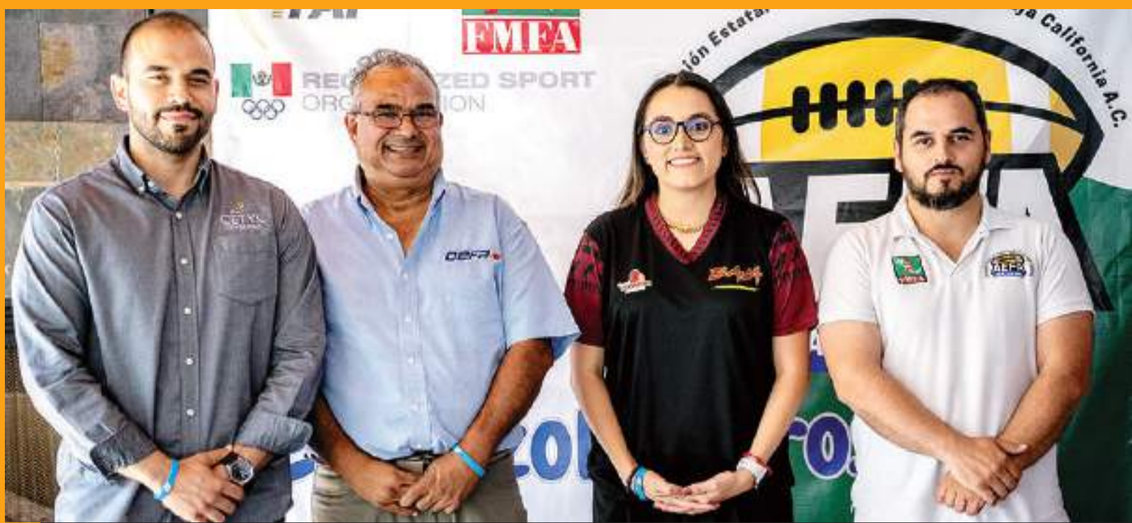
La integración permitirá a equipos y jugadores de la OEFA participar en los torneos avalados por la FMFA en México.