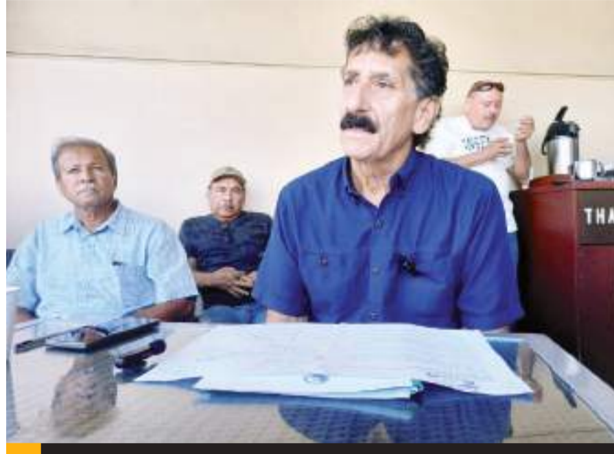
ENSENADA.- Tras no cumplirse las peticiones, pescadores y armadores amenazan con cerrar puertos El Sauzal y Ensenada.

los armadores también se ven afectados; sin embargo, deben seguir con el trabajo a pesar de que los costos de cada embarcación se han incrementado, afectando al menor de la cadena. En este caso, sostuvo, el pescador es el más afectado.