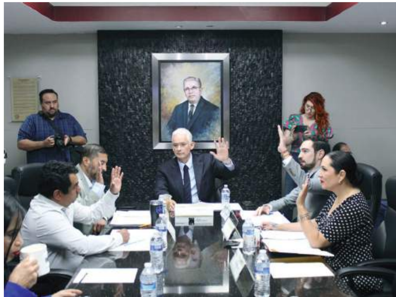
MEXICALI.- El legislador Jorge Ramos propone por la presencia de agentes mixtos de seguridad para enfrentar a la delincuencia.