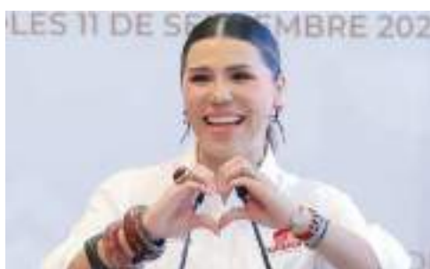
MEXICALI MARINA DEL PILAR ÁVILA OLMEDA...

Felicita a legisladores por la aprobación de la reforma judicial.