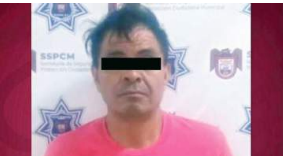
TIJUANA.- Octavio "N", de 50 años, tras lesionar con un cuchillo a su esposa en presencia de su hijo, este último lo reportó a la policía.

ra su situación jurídica en ese acto. Derivado de los antecedentes que obran en la carpeta de investigación, se dictó auto de vinculación a proceso, manteniéndose la medida cautelar de prisión preventiva justificada. Se fijó un plazo de investigación complementaria de seis meses, debido a la necesidad de cautela y la relevancia de la investigación, venciendo dicho plazo el 5 de marzo de 2025.