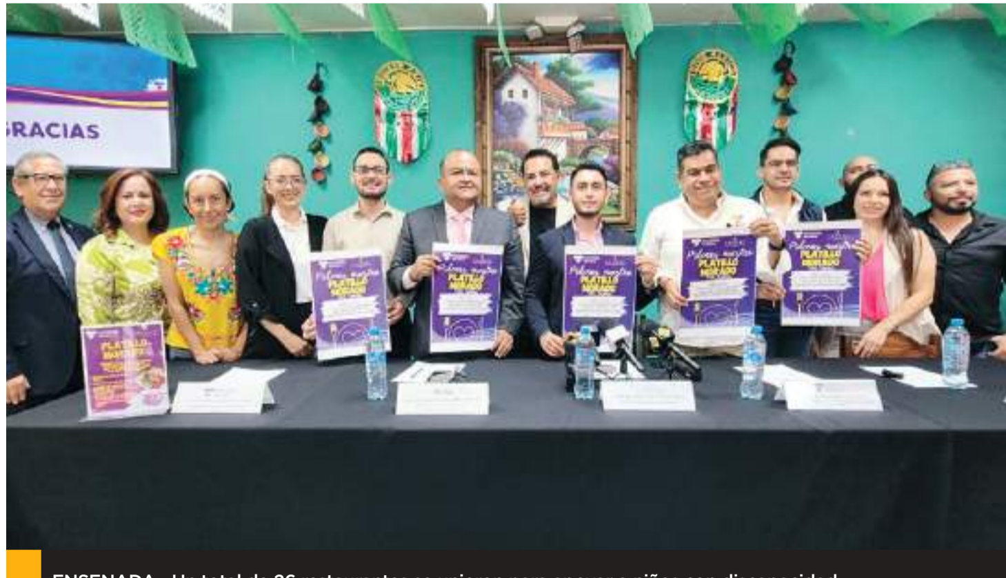
ENSENADA.- Un total de 26 restaurantes se unieron para apoyar a niños con discapacidad.