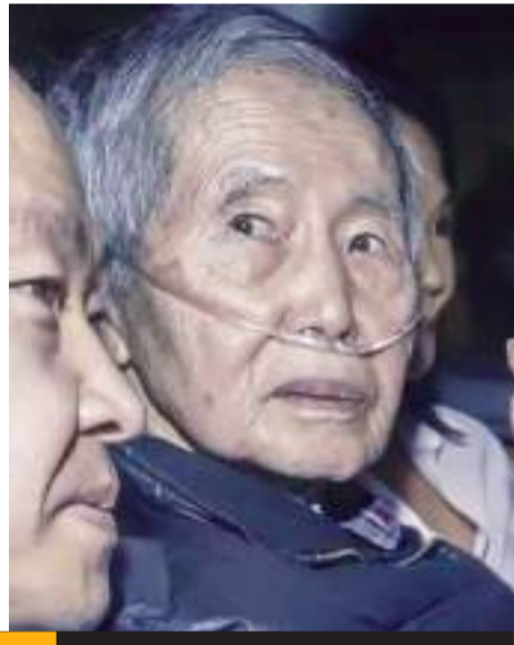
Alberto Fujimori, expresidente de Perú, falleció ayer miércoles, informó su hija Keiko.