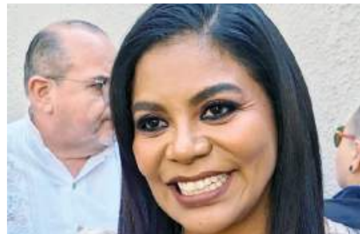
TIJUANA.- La Alcaldesa Montserrat Caballero afirmó que las mega obras que están en proceso, fueron totalmente cubiertas por su administración.

Caballero Ramírez subrayó a los beneficiados con los créditos, que se va con la satisfacción de demostrar que cuando existe la voluntad de apoyar, todo se puede.