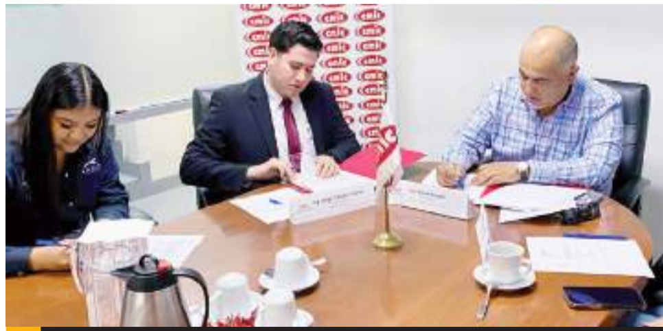
TIJUANA.- La CMIC delegación Tijuana, Tecate y Rosarito, firmó un convenio de colaboración con la Asociación Nacional de Estudiantes de Ingeniería Civil, a fin de formar futuros profesionistas para esta industria.

"Buscamos acceso a información, espacios, capacitaciones, y es una forma en que nosotros, como asociación, les podemos dar un respaldo a los alum-