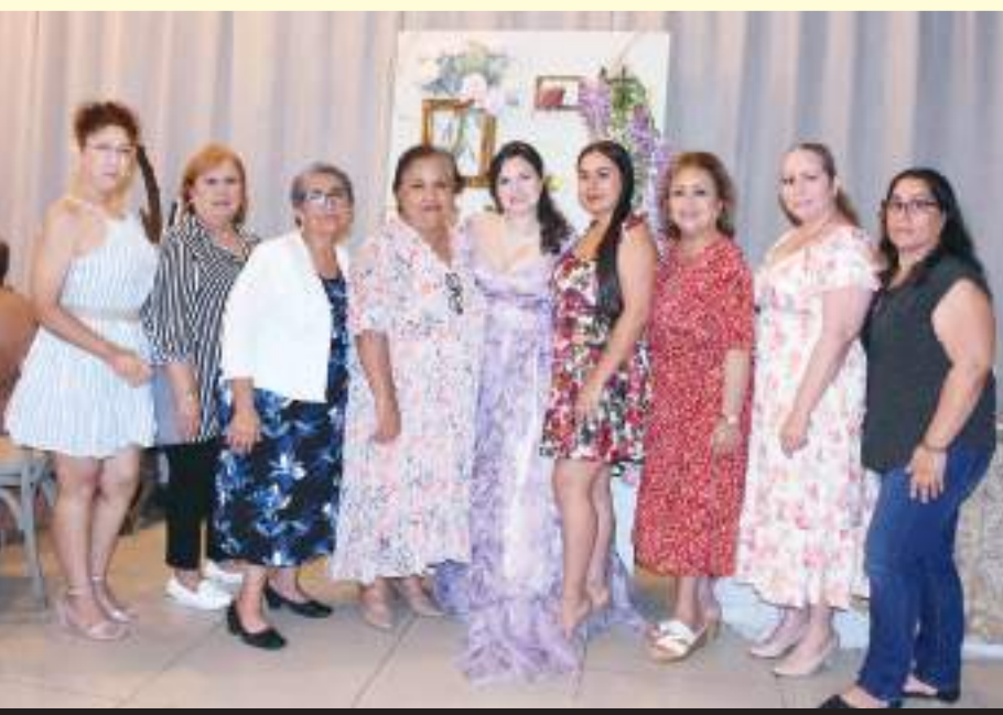
Familia Valdovinos durante el desayuno de despedida de soltera.