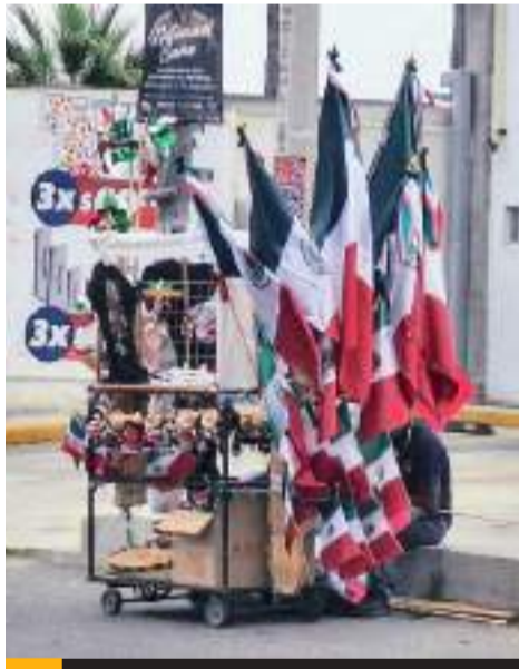
PLAYAS DE ROSARITO.- Se viste de tricolor Playas de Rosarito con la venta de banderas y artículos varios con motivo del mes patrio.

de acuerdo al tamaño y las camisetas tienen un valor de 270 pesos.