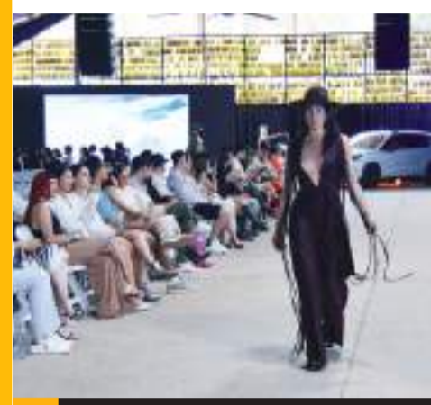
Tijuana Innovadora llevó a cabo InnoVaModa Fashion Experience.

El cantante gana entre 950,000 y 1 millón de dólares por concierto, atrayendo a más de 20,000 fanáticos por show. Ha logrado llenar recintos en Estados Unidos y México, alcanzando el sold-out en casi todas sus presentaciones. Además de su éxito en el escenario, su popular serie en Netflix y el crecimiento de seguidores en redes sociales han reforzado su influencia global.