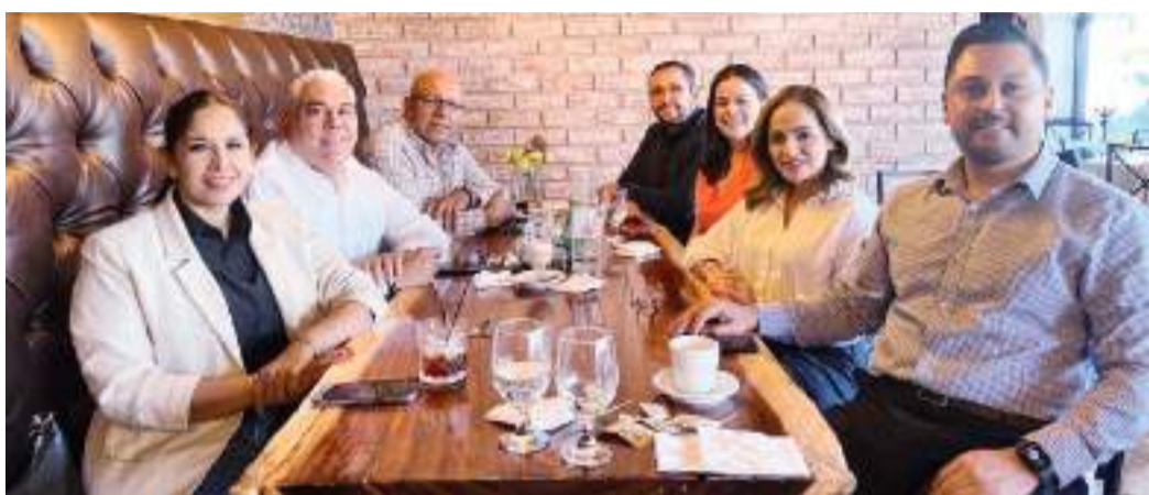
TIJUANA REGIDORES DE OPOSICIÓN...

"Participan desde la Secretaría de Hacienda, que en su momento generó el primer presupuesto el año pasado con perspectiva de género, se reflejó en incremento de los programas de prevención y atención de las mujeres en dependencias como la Secretaría de Economía, Secretaría de Educación, de Inclusión, y de Bienestar Social".