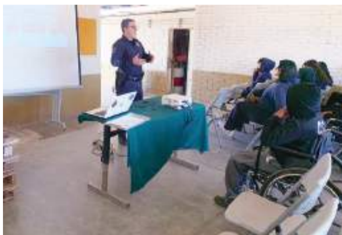
ENSENADA.- El bullying, en cualquiera de sus formas, es un fenómeno que afecta profundamente el desarrollo emocional y psicológico de los estudiantes.

Además, las charlas incluyeron un enfoque integral sobre equidad de género, explicando la importancia de reconocer y respetar los derechos de todas las personas, así como los desafíos que aún enfrentan las mujeres y otros grupos en su lucha por la igualdad, por lo que se enfatizó en que la promoción de la equidad es clave para construir una so-