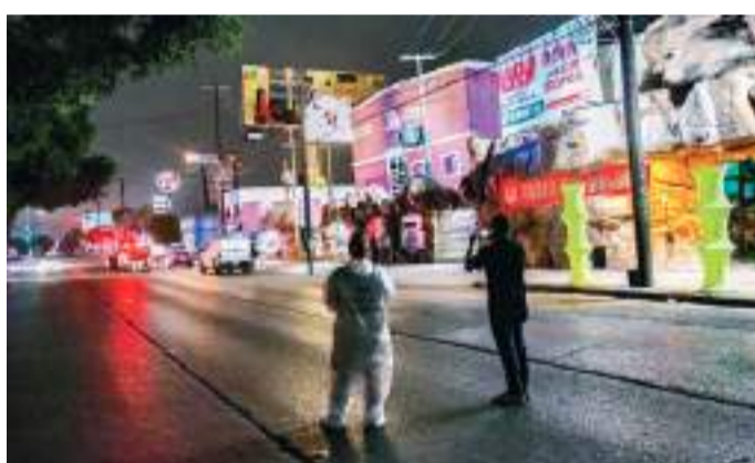
TIJUANA.- Una hielera con una cabeza humana y un "narcomensaje" escrito en una lona, fue localizada en el interior de un automóvil estacionado a un costado del bar La Cueva del Peludo.

la SSPCM, pero que el titular ha negado mandar a sus agentes; "aunque se pague