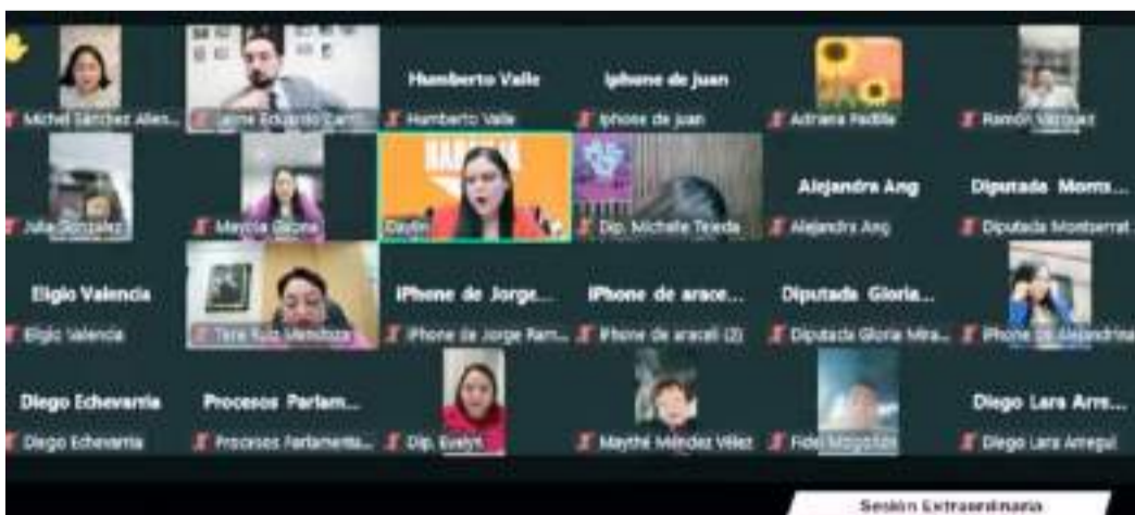
TIJUANA CONGRESO DE BC...

Va a haber un periodo, según la propuesta de la Secretaría de Gobernación, de