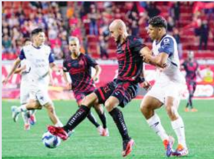
El delantero paraguayo dijo que como ex diablo, ante Toluca "mi partido es aparte".

Charly, como ex escarlata, mencionó que "mi partido es aparte, siempre me va bien contra mis ex equipos y esperamos que esta vez no sea la excepción".