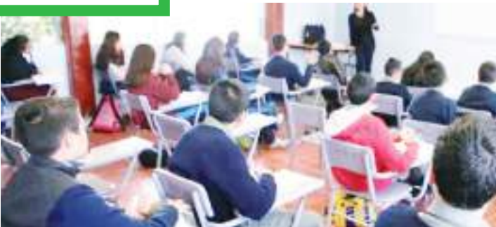
El presupuesto para educación, está debajo del nivel promedio de los países de la OCDE.