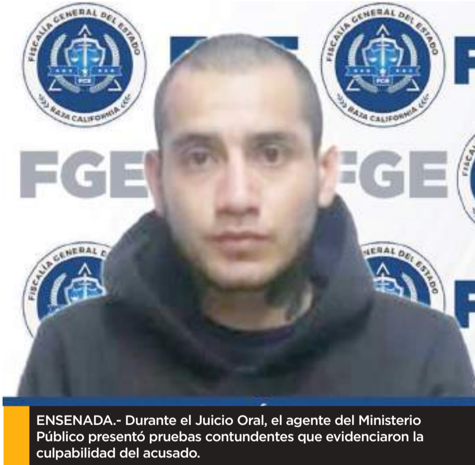
ENSENADA.- Durante el Juicio Oral, el agente del Ministerio Público presentó pruebas contundentes que evidenciaron la culpabilidad del acusado.