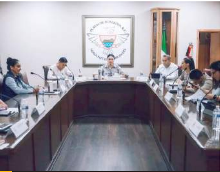
PLAYAS DE ROSARITO.- Aprueba el Cabildo paquete de obras así como reglamentos que permitirán lograr mayores beneficios a las y los rosaritenses.