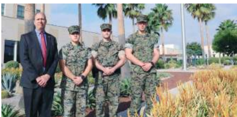
TIJUANA.- En el Consulado General de Estados Unidos en Tijuana, honraron con un minuto de silencio a las víctimas de los ataques del 11 de septiembre del 2001.

silencio está dedicado a recordar y honrar a aquellos que trágicamente perdieron la vida el 11 de septiembre de 2001.