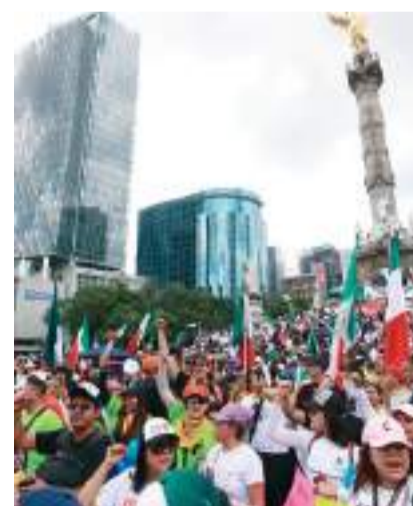
Jueces y magistrados mexicanos, buscarán detener la reforma judicial del Senado, mediante acciones nacionales e internacionales.