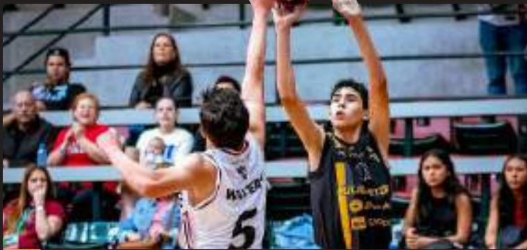
El torneo se jugará en la categoría 2010-2011.

Al igual que la edición pasada, el torneo se jugará con equipos de fuerzas básicas de la Liga Asociación de Clubes de Baloncesto (ACB) de España, el Circuito de Baloncesto de la Costa del Pacífico (Cibacopa) y la Liga Nacional de Baloncesto Profesional (LNBP).