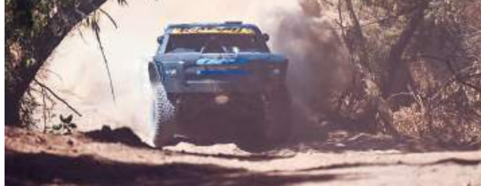
Se llevó a cabo la ronda de calificación de las categorías de Trophys.