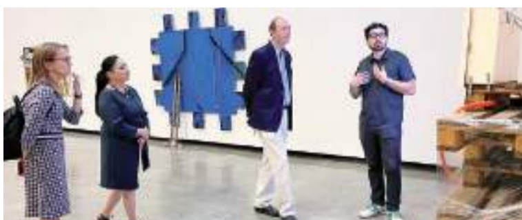
Entre los espacios visitados por el cónsul destacan las galerías que albergan la Trienal de Tijuana: 2. Internacional Pictórica.

El diplomático manifestó amplio interés en establecer vínculos de colaboración con Cecut que permitan la gestión cultural a ambos lados de la frontera y puso especial énfasis en la importancia de un diálogo cultural entre el consulado a su cargo y la dirección general de Cecut.