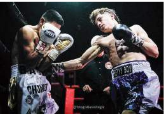
El boxeador peleará este 22 de septiembre en Tijuana.

Gracias a esto, se presenta con un palmarés de 13 victorias, de las cuales 7 han sido antes del límite sin derrotas y 1 empate. Suma un total de 57 rounds como boxeador profesional y un porcentaje de nocaut de 53.85.