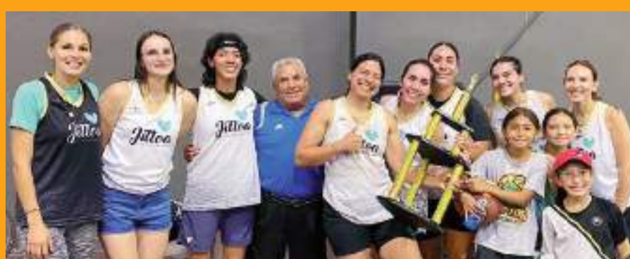
Jittoa se llevó los máximos honores de la rama femenil Abierta de la Liga Rural de baloncesto de El Sauzal de Rodríguez.

Esto fue todo por hoy. Hasta la próxima semana amigos y amigas.