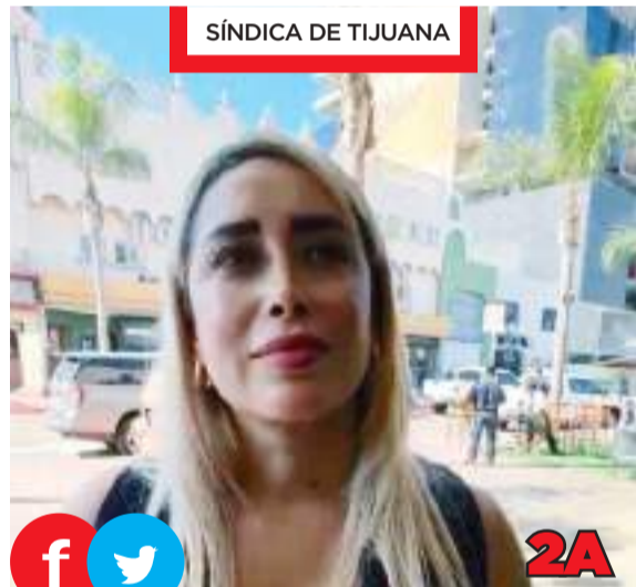
SÍNDICA DE TIJUANA