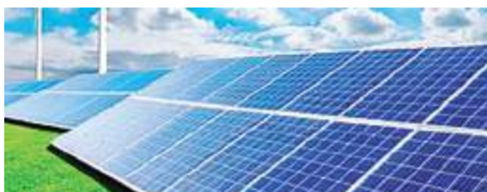
MEXICALI.- La CANACINTRA celebra un mayor uso de energías limpias.

Por último, dijo que aún está lejos el momento en que la CFE deje de ser un monopolio, ya que el gobierno federal pretende que sea una empresa eficiente y con menos deuda.