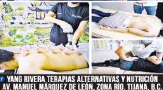
YANG RIVERA TERAPIAS ALTERNATIVAS Y NUTRICIÓN AV. MANUEL MÁRQUEZ DE LEÓN, ZONA RÍO, TIJUANA, B.C.