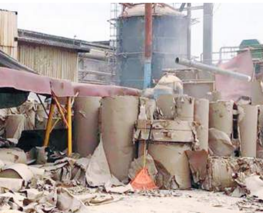
MEXICALI.- Con amparo, la empresa ZAHORI en Mexicali busca un descuento de la multa de un millón de pesos que recibió, derivado de un incendio en sus instalaciones.