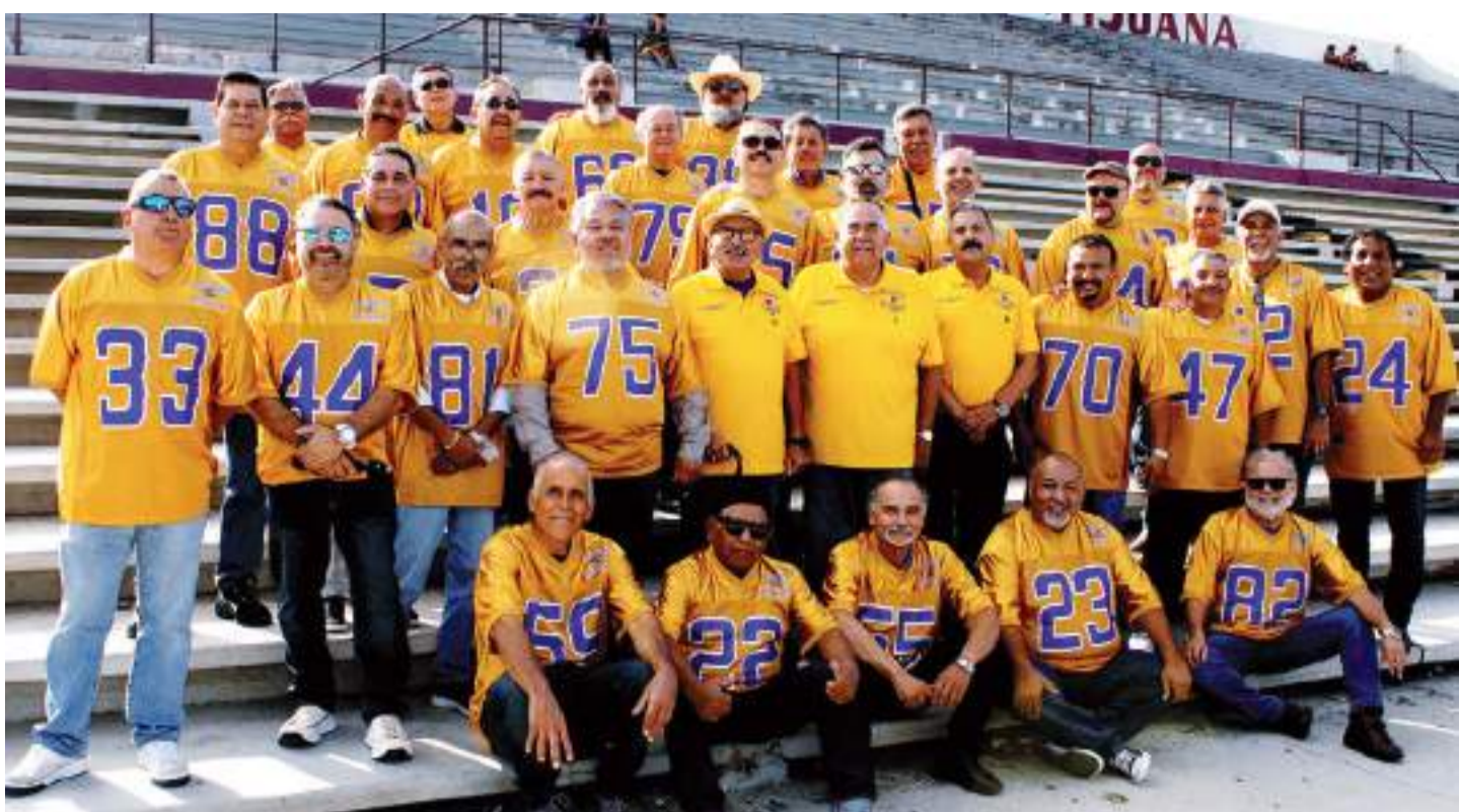
El Equipo de Futbol Americano Ostiones.