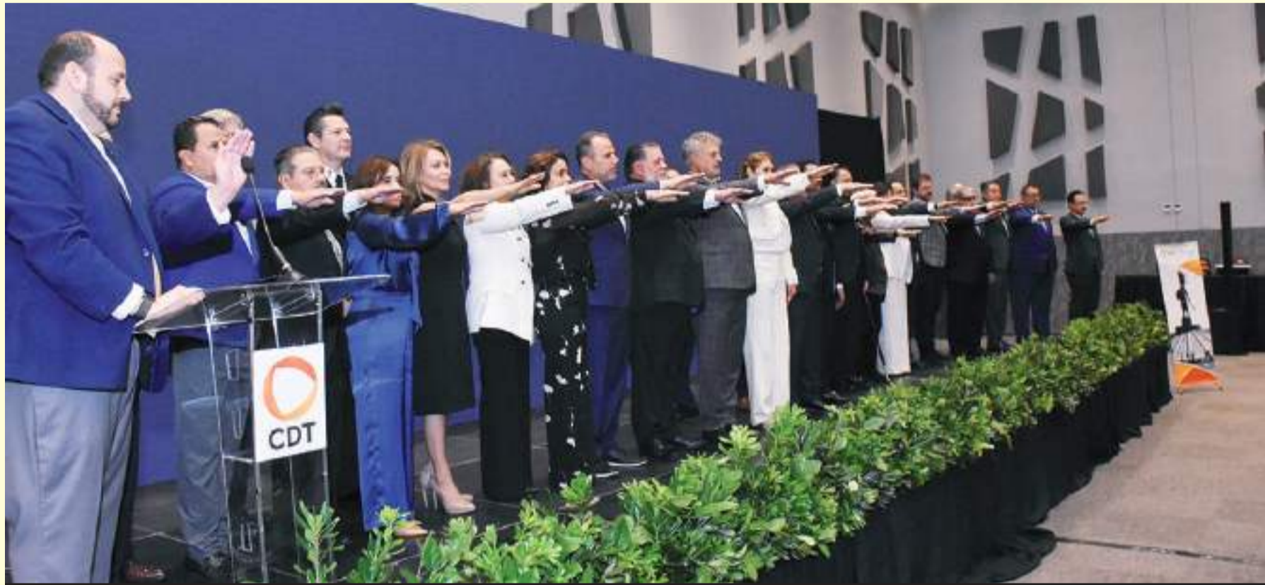
Durante un elegante desayuno quedó instalada, la nueva mesa directiva del Consejo de Desarrollo de Tijuana (CDT).