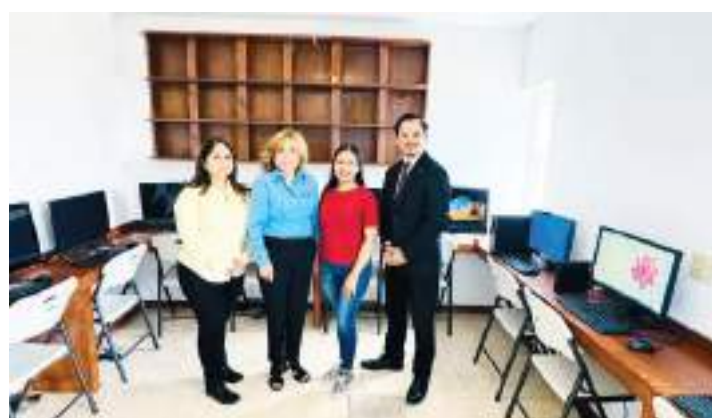
TIJUANA.- La Red Binacional de Corazones y Universidad Humanitas, remodelaron el centro de cómputo del refugio Casa del Jardín.