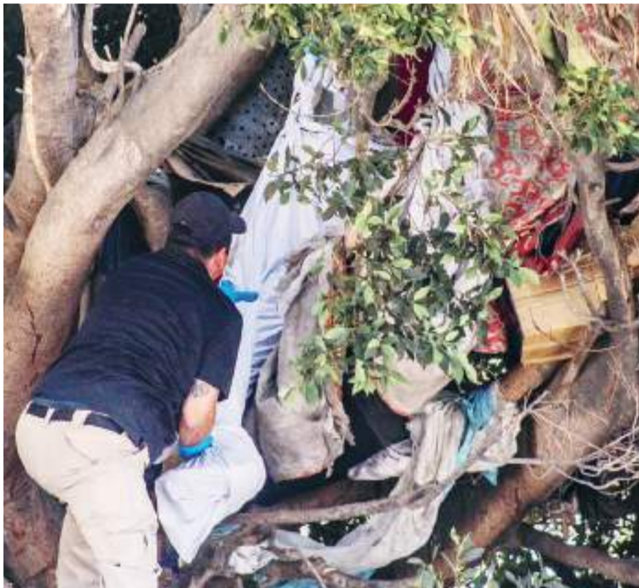
TIJUANA.- Un hombre en condición de calle fue localizado trepado en un árbol pero sin vida, el hallazgo fue reportado por empleados de limpia del Gobierno Municipal.

Agentes de la Fiscalía General del Estado llegaron al lugar para procesar la escena, quedando a cargo de ordenar el levantamiento del cadáver para trasladarlo a Semefo.