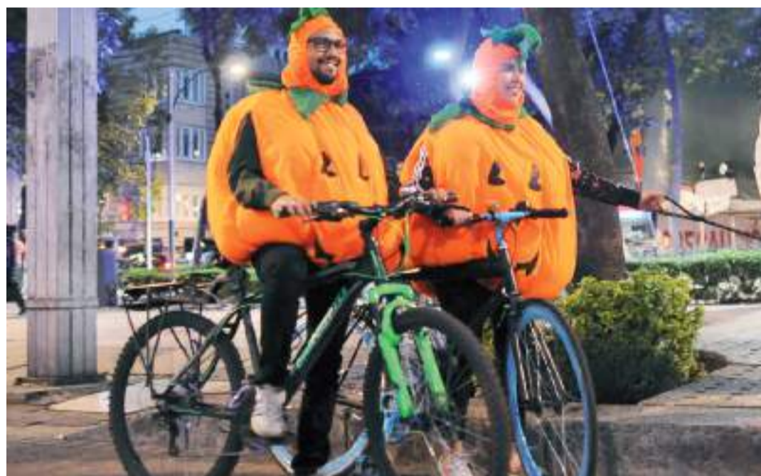
La Rodada de Halloween se estará llevando a cabo el 24 de octubre por las principales calles de la ciudad.