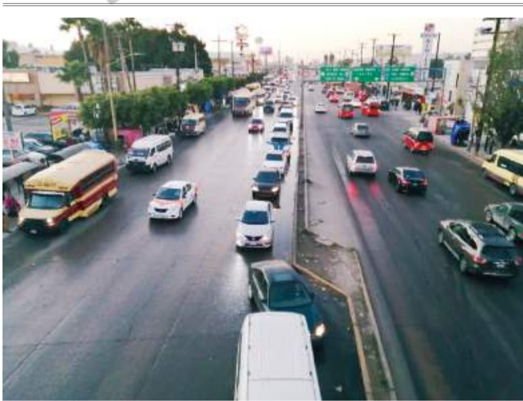
TIJUANA BULEVAR GUSTAVO DÍAZ ORDAZ...

También, con motivo del próximo 12 de octubre, Día de la Nación Pluricultural, expuso la importancia de las disculpas públicas entre países; el Gobierno de México refrenda su