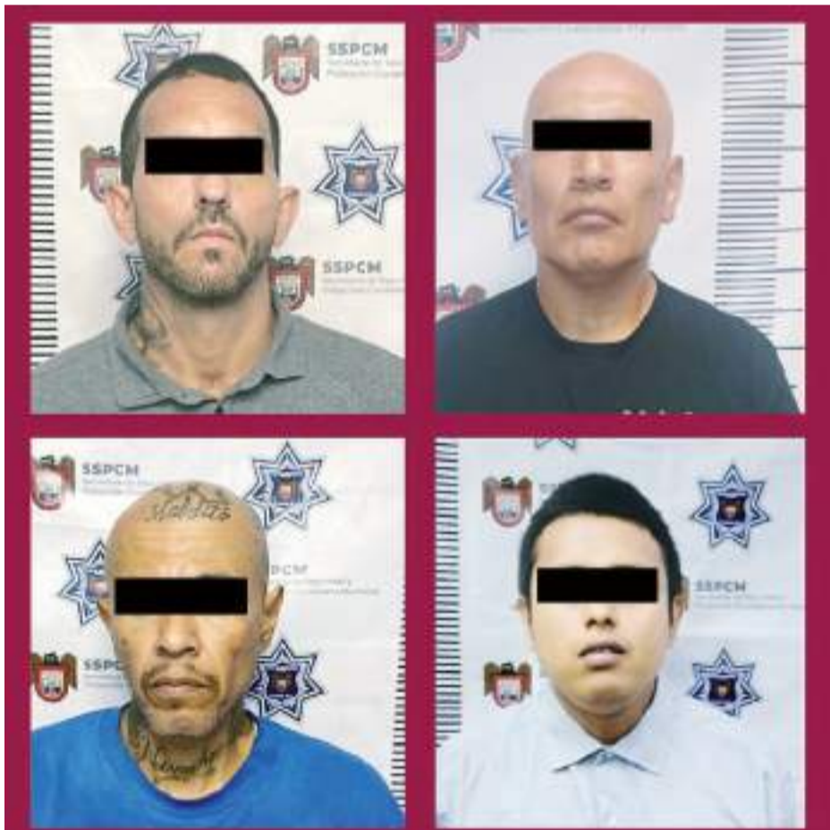
TIJUANA.- Los cuatro presuntos delincuentes quedaron a cargo de la FGE, autoridad investigadora encargada de presentarlos ante jueces de control.