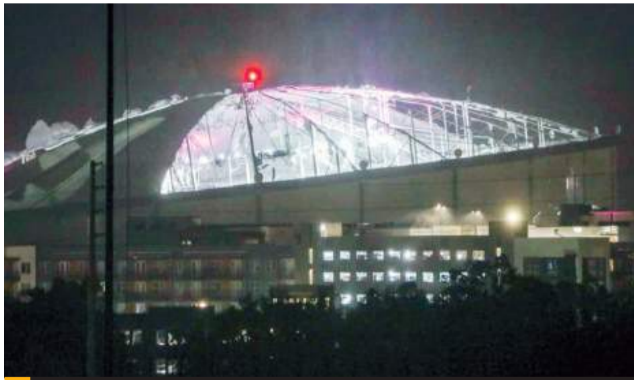
El estadio ha sido el hogar del club de Tampa Bay desde su temporada inaugural en 1998.

Las perrísimas sostendrán su próximo compromiso de la fecha 15 ante su similar de Atlético San Luis en el estadio Caliente, mismo que se llevará a cabo este domingo 13 de octubre.