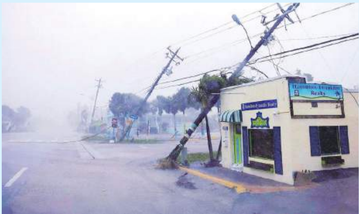
Tanto el gobierno federal como el estatal aseguran que se va a trabajar para restablecer el servicio eléctrico y las tareas de reconstrucción cuanto antes.

vier Charmant, otro residente de la zona que también sintió la fuerza de ‘Milton’ cuando el tornado arrasó con varias casas.