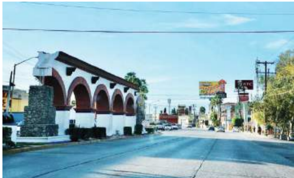
TIJUANA.- El bulevar Gustavo Díaz Ordaz cambiará de nombre

so del Estado emitió un exhorto para cambiar el nombre del Bulevar Gustavo Díaz Ordaz, argumentando que el expresidente está relacionado con la represión de estudiantes universitarios, conocida históricamente como "La matanza de Tlatelolco", ocurrida el 2 de octubre de 1968.