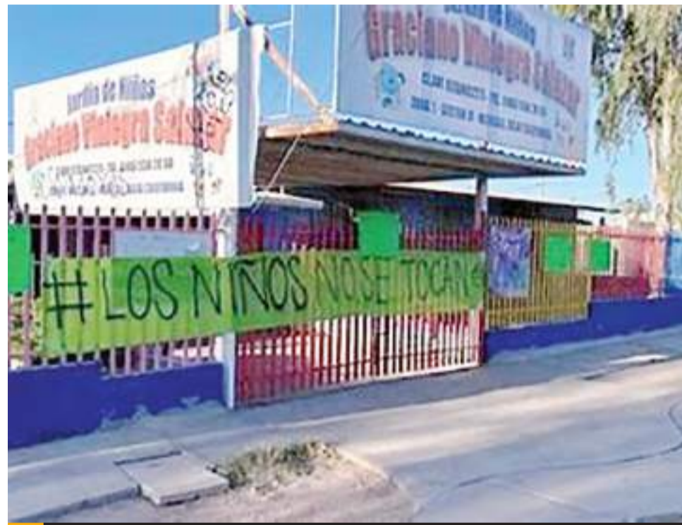
MEXICALI.- Se reiniciarán clases el próximo lunes en la escuela preescolar Graciano Viniegra en Mexicali, informó el secretario de Educación del Estado, Luis Gallegos Cortés.

Por último, la funcionaria resaltó que Baja California ya cuenta con un plan estatal de contingencia con el apoyo de los municipios para aplicar acciones respecto a la calidad del aire e informar a la ciudadanía para que tome precauciones.