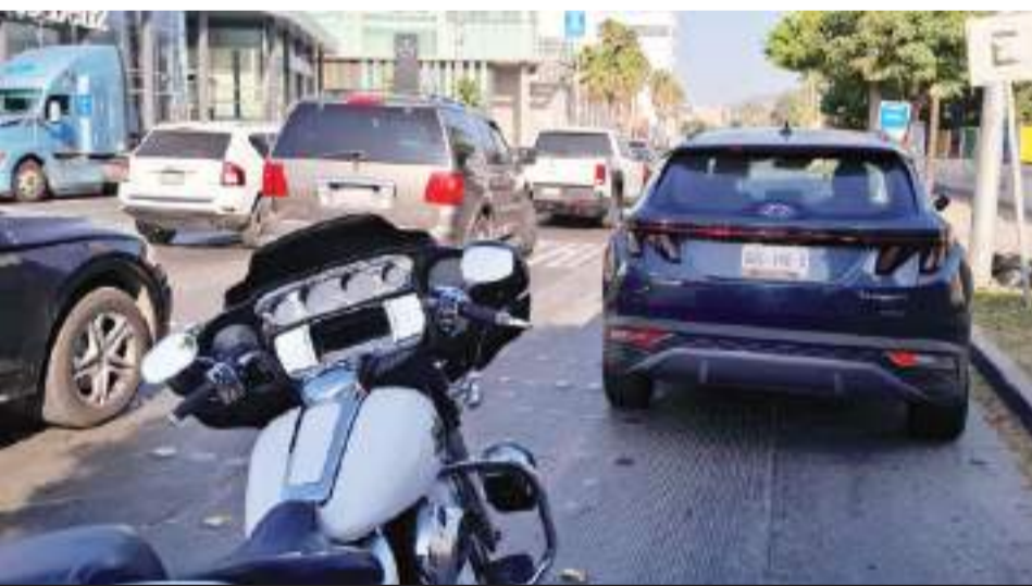
TIJUANA.- Se fortalecerá la vigilancia en la garita de San Ysidro, para evitar malas prácticas en los carriles que conducen a la garita internacional.

EN ATENCIÓN A LAS INQUIETUDES DE LA CIUDADANÍA