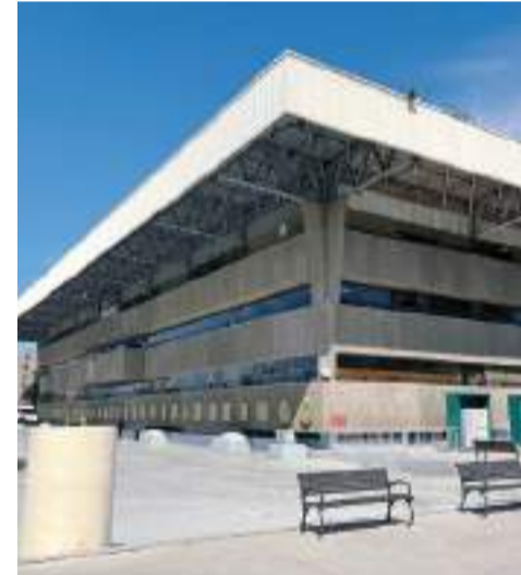
TIJUANA.- El próximo lunes 12 de octubre será día de descanso oficial para el personal que labora en el Ayuntamiento de Tijuana.

Las actividades se reanudarán de manera normal el martes 15 de octubre para la atención del público en general, en los diferentes trámites que requieran realizar en los horarios habituales.