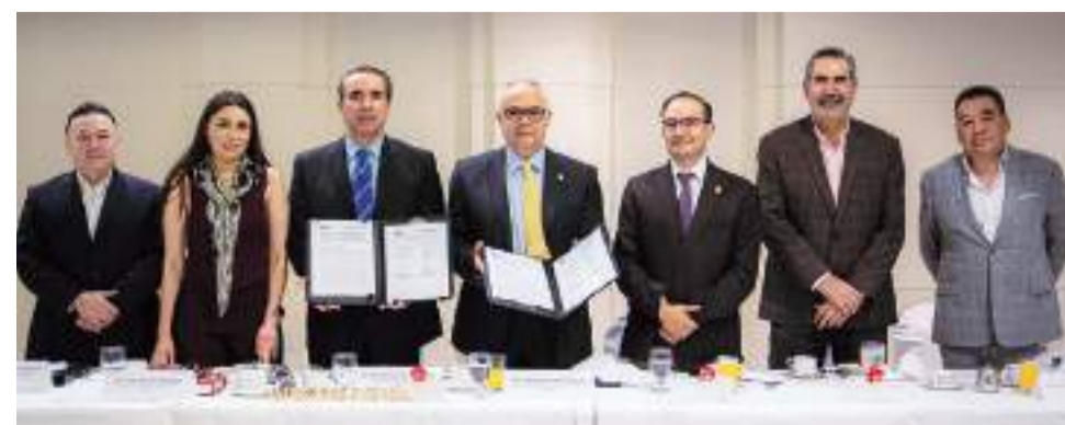
TIJUANA.- El Gobierno del Estado y el Grupo Unidos por Tijuana A. C., firmaron un acuerdo con el objetivo de sumar esfuerzos que fortalezcan el tejido social y brinden bienestar a la comunidad.

La firma de este convenio es un paso más en la consolidación del trabajo conjunto entre el Gobierno del Estado y la sociedad civil para construir un mejor futuro, no solo para Tijuana, sino para todo Baja California.