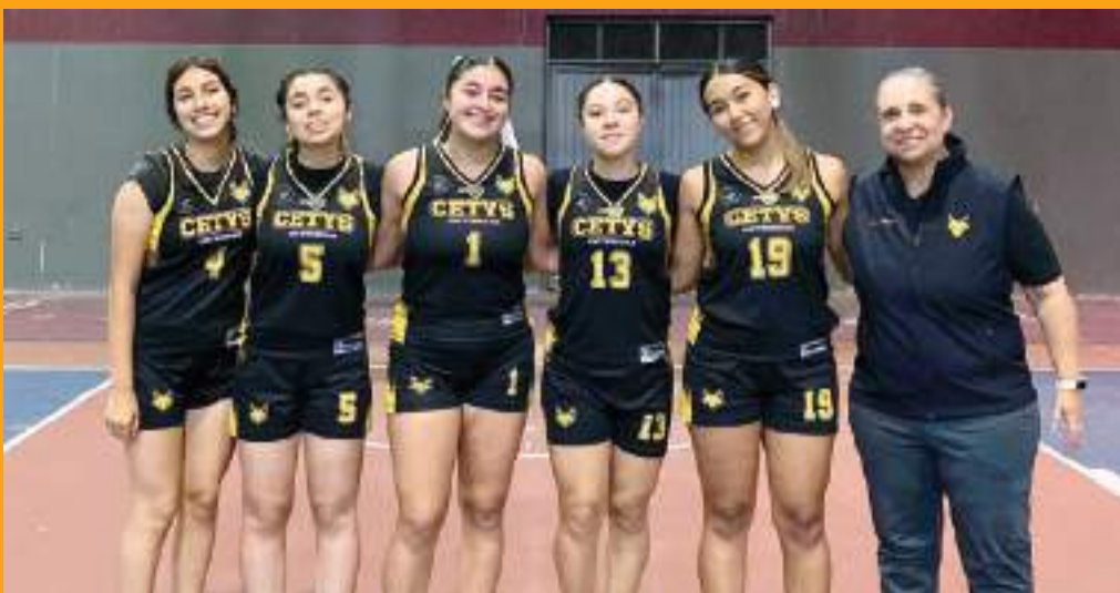
El representativo del Cety's se llevó el triunfo con marcador final de 59 puntos por 48 ante las Princess School.

golazoderampa@gmail.com facebook.com fufeac