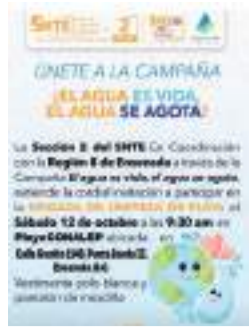
ENSENADA SECCIÓN 2 DEL SNTE...