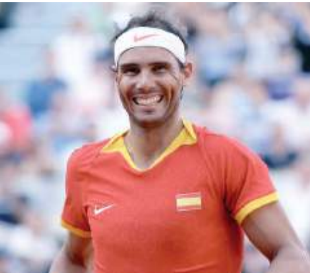
El español Rafael Nadal se despedirá del tenis en la Final de la Copa Davis 2024.

"Me hace muchísima ilusión que mi último torneo sea la final de la Copa Davis y representando a mi país. Creo que es cerrar el círculo, ya que una de mis primeras grandes alegrías fue la final de Sevilla en 2004".