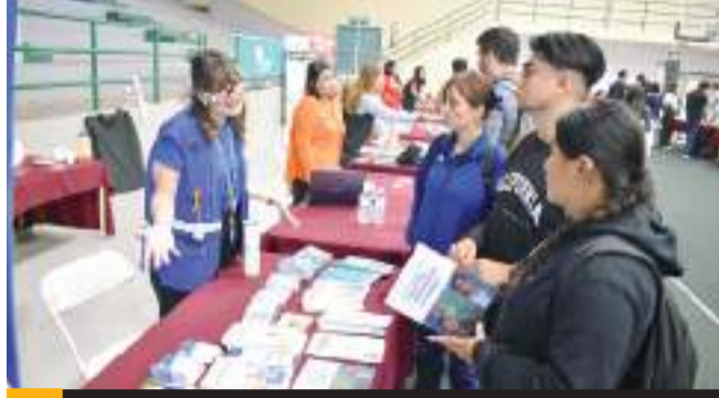
ENSENADA.- Se llevó a cabo la Feria del Empleo para la Inclusión Laboral de la Juventud, en la que participaron 25 empresas y se ofertaron aproximadamente 500 vacantes.

Enfatizó la importancia de que estos espacios permitan a los jóvenes encontrar empleadores dispues-