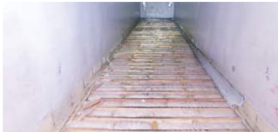
OTAY MESA, CA.- En una sola operación, agentes de CBP del puerto de carga comercial de Otay Mesa, detectaron la droga oculta en el piso de un tractocamión con un valor estimado en la calle de 3.2 mdd.

Una unidad canina K-9 del CBP respondió y alertó a los agentes de la presencia de narcóticos. Los agentes del CBP llevaron a cabo un examen físico del piso del tractor-remolque y descubrieron 265 paquetes ocultos en el entramado