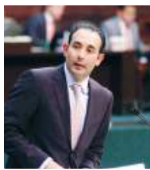
TIJUANA ROBERTO GIL ZUARTH...

Poder Judicial de la Federación es el panista ROBERTO GIL ZUARTH , ex secretario particular del entonces presidente FELIPE CALDERÓN HINOJOSA , del 8 de enero de 2011 al 30 de no-