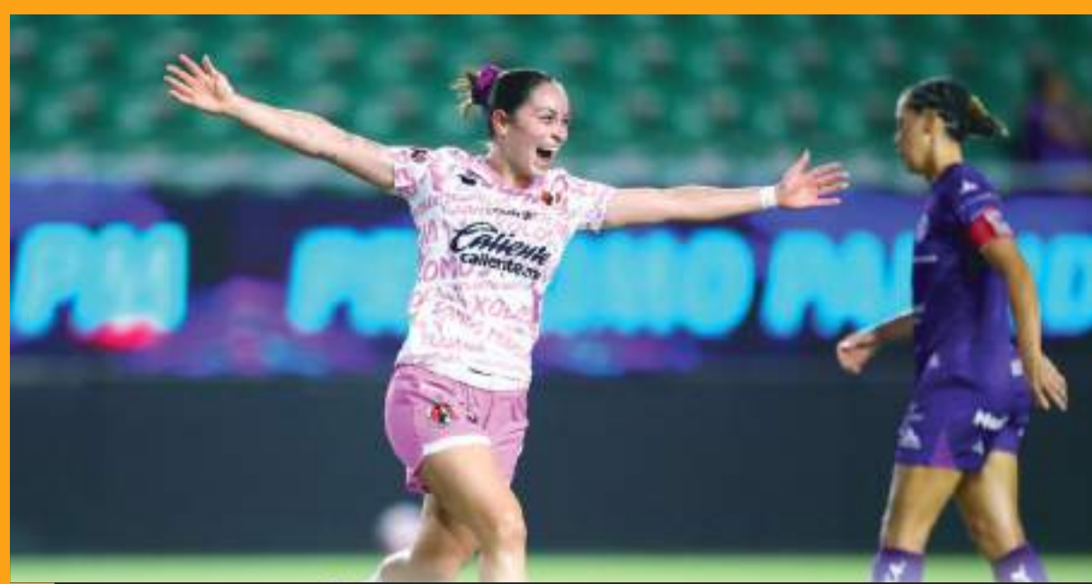
Xolos Femenil se reencontró con la victoria la noche del jueves al imponerse al Mazatlán.