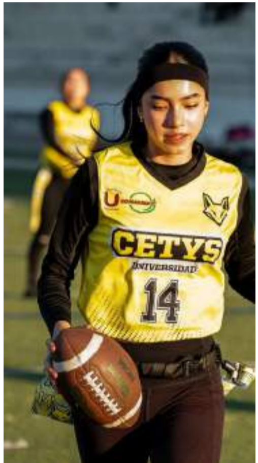
La temporada César Nafarrate Orozco 2024 mantuvo actividad en el emparrillado.

Finalmente, en la cancha 3, se vieron dos programas veteranos de fútbol americano bajacaliforniano ya que Cobach La Mesa superó 38-14 al Instituto México para agenciarse su primer triunfo de la campaña.