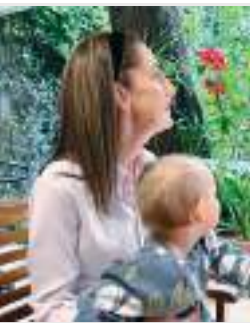
MEXICALI CLAUDIA SHEINBAUM PARDO...