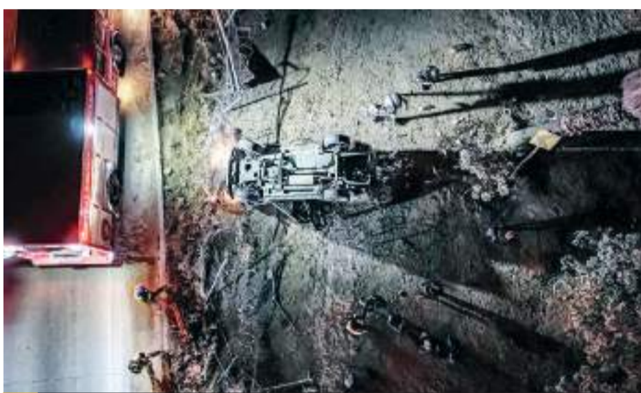
TIJUANA.- Los cuatro jóvenes que viajaban en la camioneta Grand Cherokee viven para contarlo, tras volcarse antes del barranco Cañón del Matadero, la madrugada del domingo.

ción de Policía y Tránsito Municipal, quienes determinarán responsabilida-