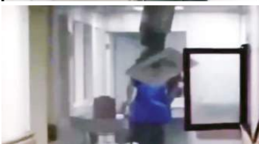
MEXICALI.- Una fuga de agua provocó el desplome de un pedazo de estructura del techo, al parecer del área de cirugía del Hospital General de Mexicali.