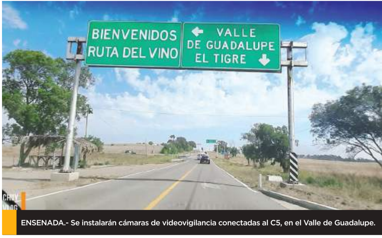
ENSENADA.- Se instalarán cámaras de videovigilancia conectadas al C5, en el Valle de Guadalupe.

Por otra parte, aseveró que se planteó la creación de consejos ciudadanos de seguridad pública en las delegaciones, y se acordó una próxima reunión en un plazo no mayor a 30 días para revisar avances en los acuerdos establecidos.