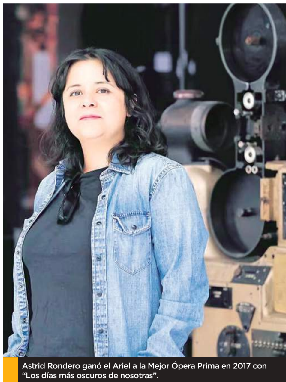
Astrid Rondero ganó el Ariel a la Mejor Ópera Prima en 2017 con “Los días más oscuros de nosotras”.

“Entre toda la violencia y las lamentables herencias que ha dejado el narcotráfico, ustedes de-