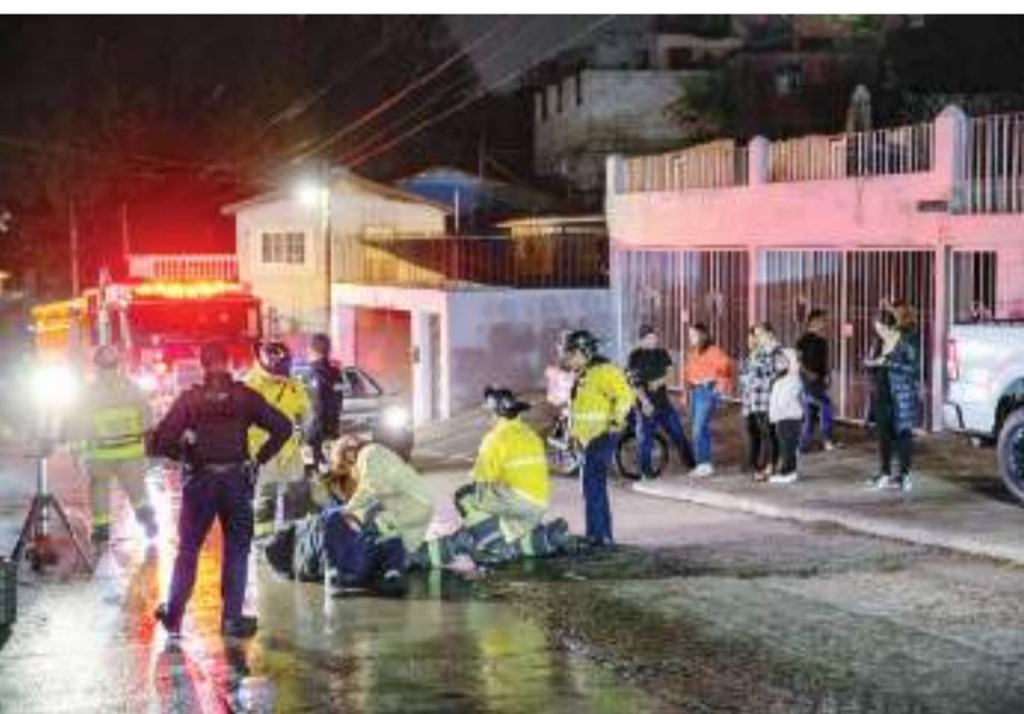
TIJUANA.- Paramédicos de Cruz Roja arribaron para brindarle los primeros auxilios al motociclista, quien resultó con fractura en uno de sus brazos.

TIJUANA.- Durante la poca lluvia registrada la noche del sábado en la región, un repartidor de pizza sufrió un accidente en su vehículo de trabajo sobre el Cañón K a la altura de la colonia Altamira, en donde finalizó con un brazo fracturado, según los primeros datos.