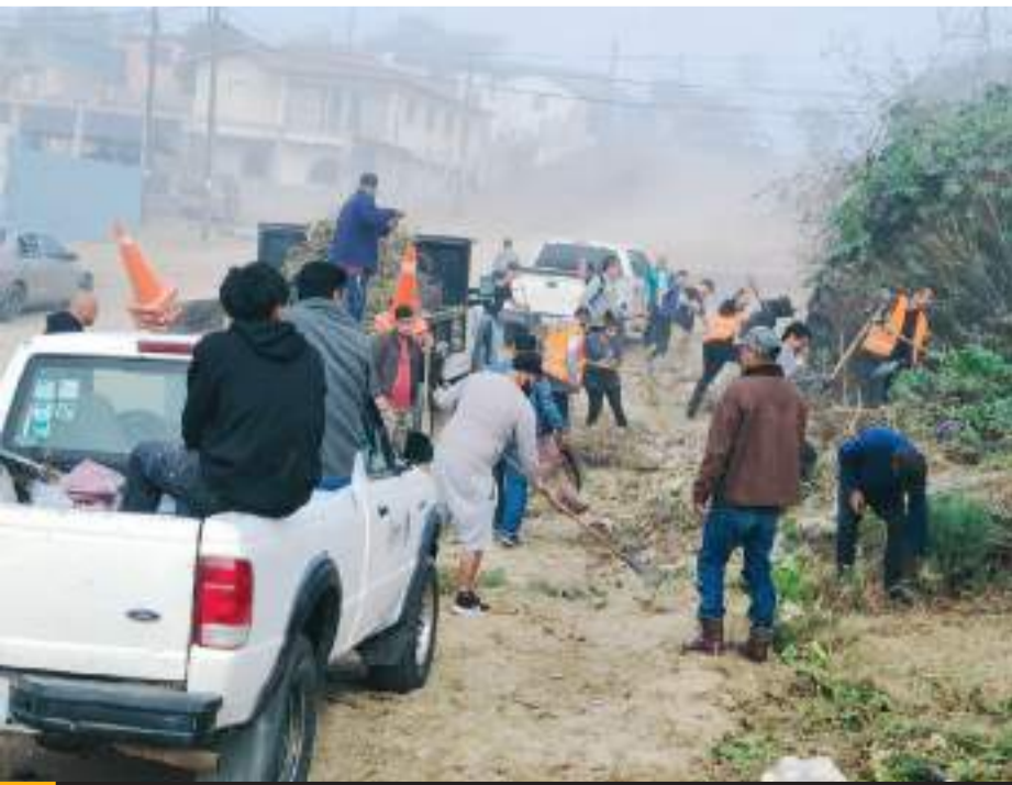
ENSENADA.- El Programa de Recuperación de Espacios Públicos, busca transformar espacios descuidados en áreas seguras y agradables.

Cabe mencionar que el pasado 6 de septiembre, miembros del colectivo Búsqueda de Ensenada, encontró cerca de la zona, tres osamentas.