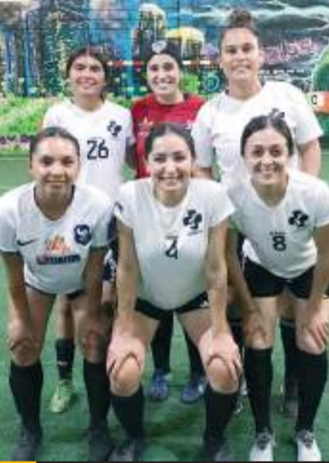
Farmacia Suprema/La Jugería saldrá este lunes a exponer su calidad de invicto ante el equipo de La Canasta.