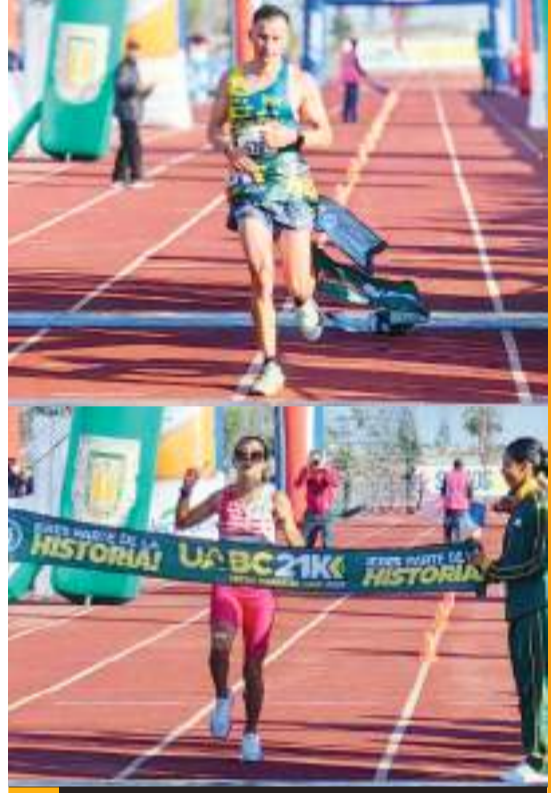
La Universidad Autónoma de Baja California celebró este domingo la primera edición de su Medio Maratón UABC 2024.