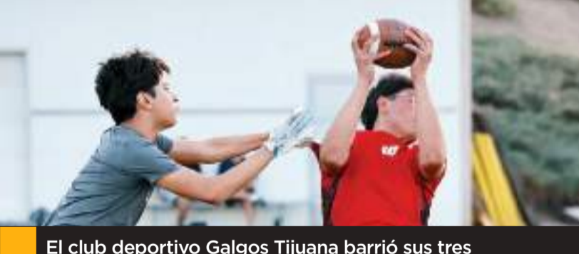
El club deportivo Galgos Tijuana barrió sus tres encuentros de la categoría Juvenil Varonil.

Montero, única head coach mujer en el torneo. Primero Coyotes chocaron con Lobos, de la UIA, y ganaron 44-6; acto seguido enfrentaron al conjunto de la Preparatoria Federal Lázaro Cárdenas (PFLC), y dieron cuenta del conjunto de César Nafarrate por marcador de 26-12. Las felinas tuvieron doble caída, ya que antes de enfrentar a Coyotes se vieron contra Tigres NT, de head coach Waldo García, y el equipo de casa ganó 60-33 para mantener paso con Xochicalco en la cima del grupo. Mientras tanto Panteras, de Cobach La Mesa, también tuvo dos partidos en Varsity Femenil, solamente que perdieron el primero 25-8 ante Tigres Negros, para después ganar 24-0, única blanqueada de la jornada, ante Lobos.