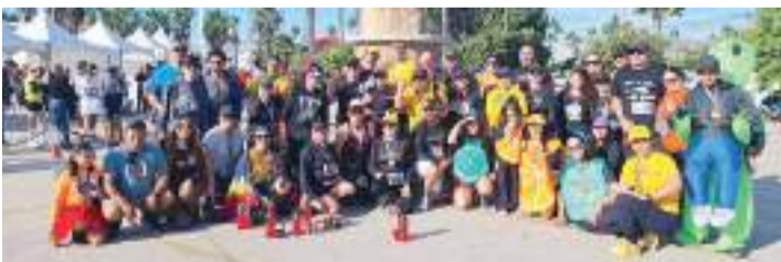
Los Saludables con puntaje de 3530 se mantienen de líder de las posiciones de Puntación de Clubes por Participación en el Serial Atlético Ensenada 2024.