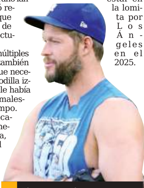
El veterano Clayton Kershaw se someterá a dos operaciones durante la temporada baja.

Tras 17 temporadas con los Dodgers, Kershaw por fin pudo celebrar un campeonato con un desfile. Pese a las operaciones de este invierno, el zurdo reiteró que espera estar en la lomita por Los Ángeles en el 2025.