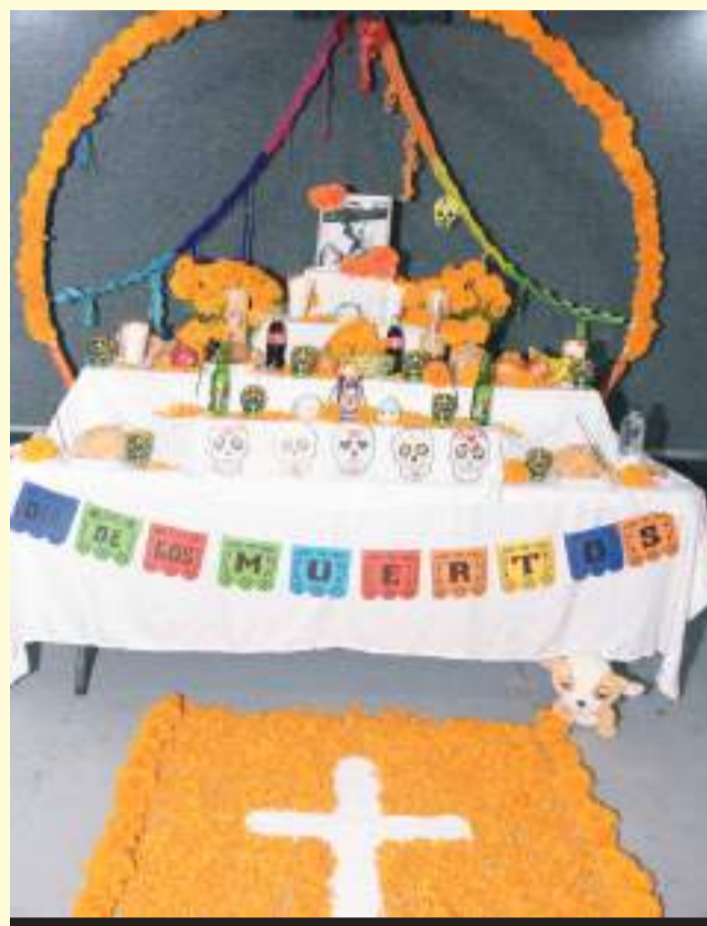
Pedro Infante no se olvida y es uno de los que tradicionalmente se recuerda.