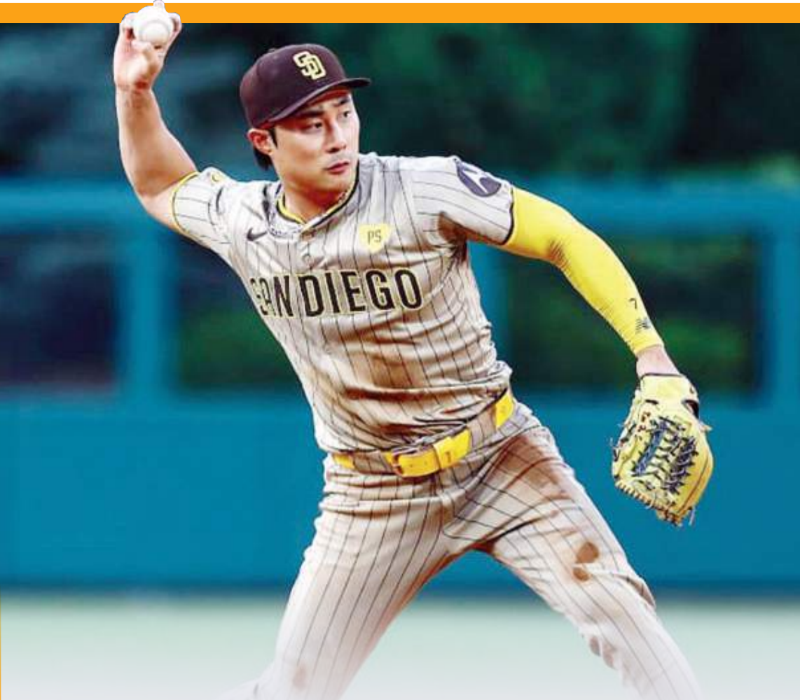
El torpedero surcoreano Ha-Seong Kim será agente libre tras declinar su opción con Padres de San Diego.