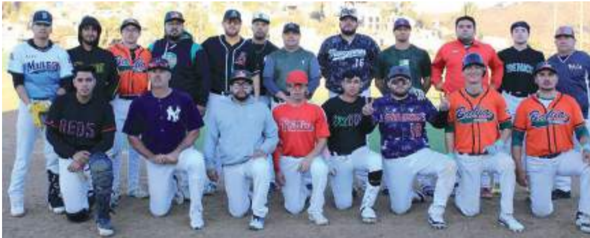
Veterinaria Bahía se apuntó ya su primera victoria en su debut dentro de la máxima categoría del campeonato oficial 2024-25 de la Liga Rural de beisbol de Maneadero.