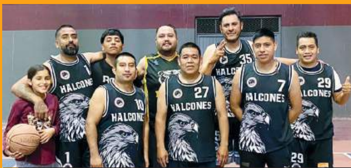
Halcones se llevaron el triunfo con pizarra final de 48 puntos por 34 sobre El Porvenir en duelo de la Segunda Fuerza de Libasa.