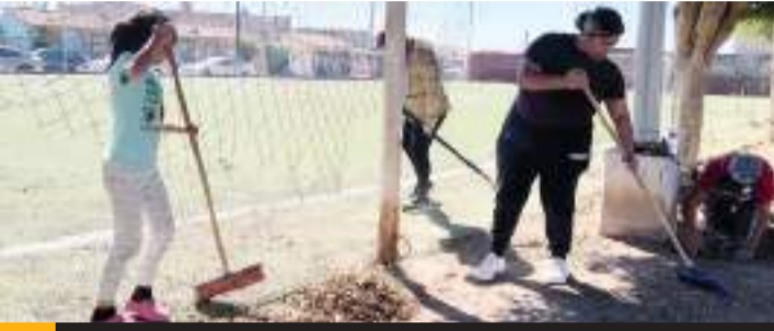
El programa "Tu Colonia, Nuestra Prioridad" se enfocan en la recuperación y rehabilitación de espacios deportivos para ofrecer a la comunidad instalaciones seguras y dignas.

Con el lema "Amor en Grande", el Gobierno de Ensenada y el INMUDERE reafirman su compromiso de seguir beneficiando a miles de familias que utilizan estos espacios para su bienestar físico y recreativo. Únete al programa Tu Colonia, Nuestra Prioridad.