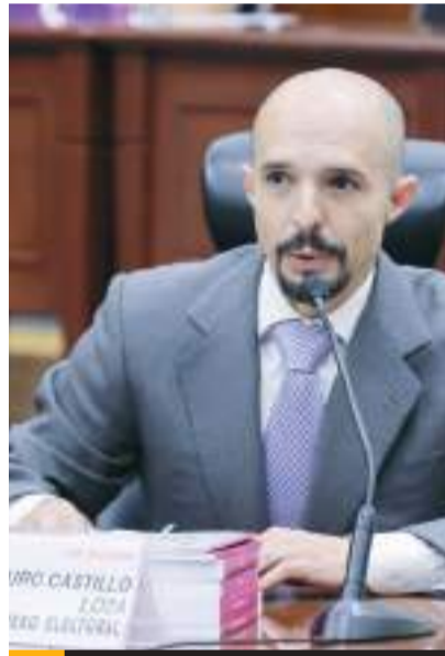
Arturo Castillo, Consejero del INE.