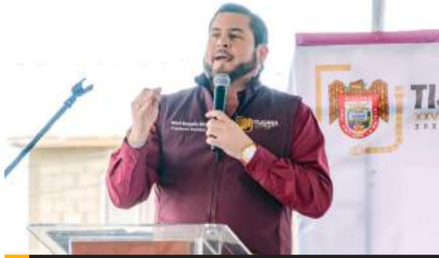
TIJUANA.- El miércoles de cada semana, el Alcalde Ismael Burgueño acudirá a las delegaciones municipales para dar atención de manera personal a las y los tijuanaenses.

“En la Jornada de Bienestar que llevamos a cabo en la comunidad de Salvatierra anunciamos este esquema de carácter social que emprendemos en marcha todos los miércoles, a las 8 de la mañana; estableceremos un calendario para estar en las delegaciones, será una jornada de atención directa con el Alcalde, tenemos que tener esa