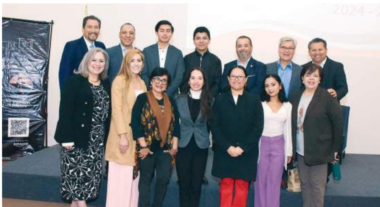
Grupo de alumnos de la carrera en Lic. en Contaduría de la UABC.