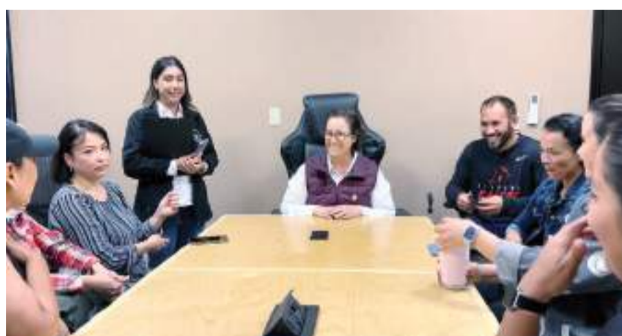
PLAYAS DE ROSARITO.- El Gobierno Municipal impulsa una cultura de bienestar fortaleciendo la seguridad de los espacios destinados para la comunidad.

En respuesta a las solicitudes de la comunidad deportiva, especialmente de la agrupación Nadadores Rosarito, el gobierno municipal ha mantenido un diálogo abierto y constructivo. Como resultado de estas conversaciones, se han implementado las medidas necesarias para garantizar la seguridad y la calidad de los servi-