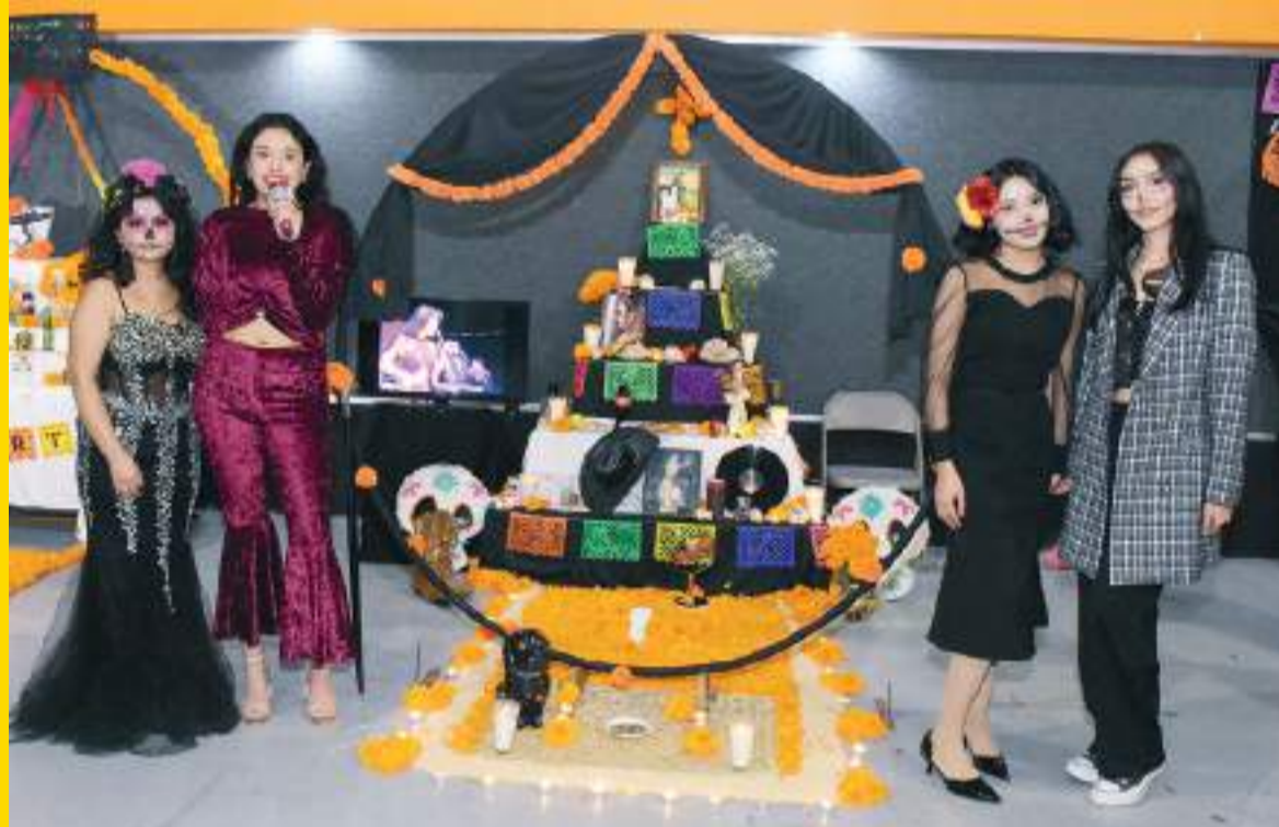
Hermosa propuesta dedicada a la cantante Selena Quintanilla, donde las universitarias usaron atuendos de la cantante.