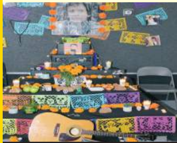
El Príncipe de la Canción, José José, fue otro de los que merecieron un altar de muertos en la UDCI.