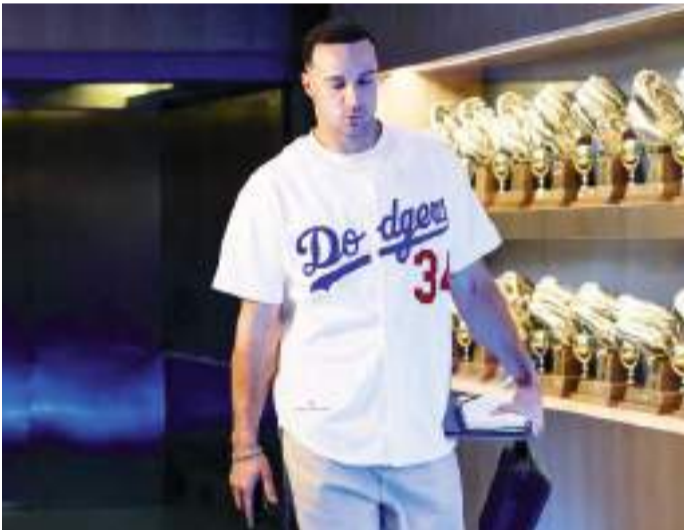
Tanto Teóscar Hernández como Jack Flaherty se convirtieron en agentes libres al término de la temporada.