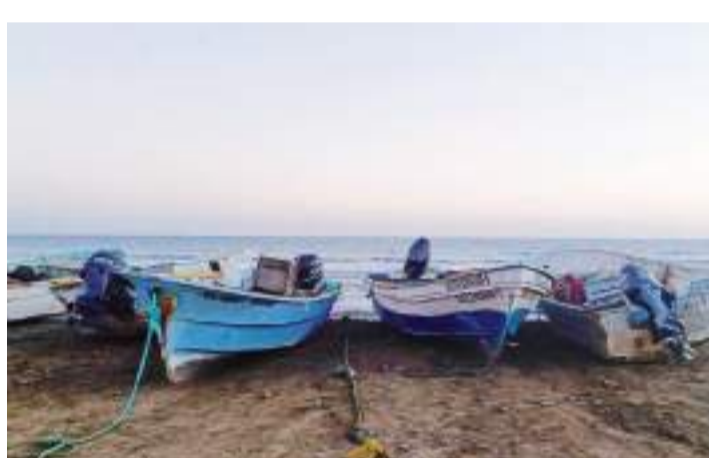
ENSENADA.- La vocación pesquera y acuícola del extremo sur de la entidad es un ejemplo de sustentabilidad productiva.

También, recorrió la región pesquera de Punta Canoas, donde se encuentra la sociedad cooperativa de igual nombre