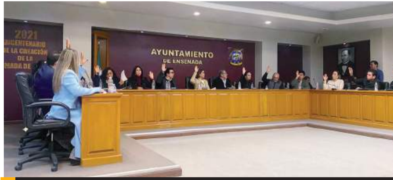
ENSENADA.- Fue aprobado en el Cabildo de Ensenada el proyecto de Presupuesto de Egresos 2025.