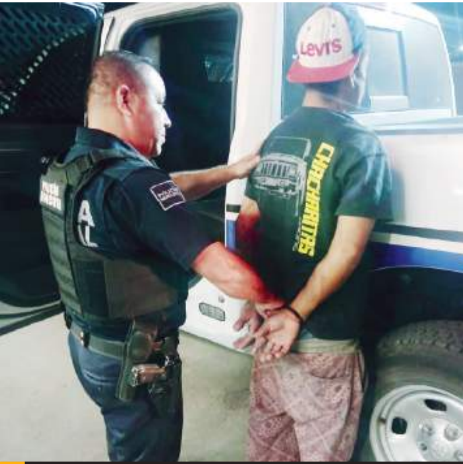
MEXICALI.- La DSPM en la aplicación de operativos para reducir la incidencia delictiva en la ciudad.