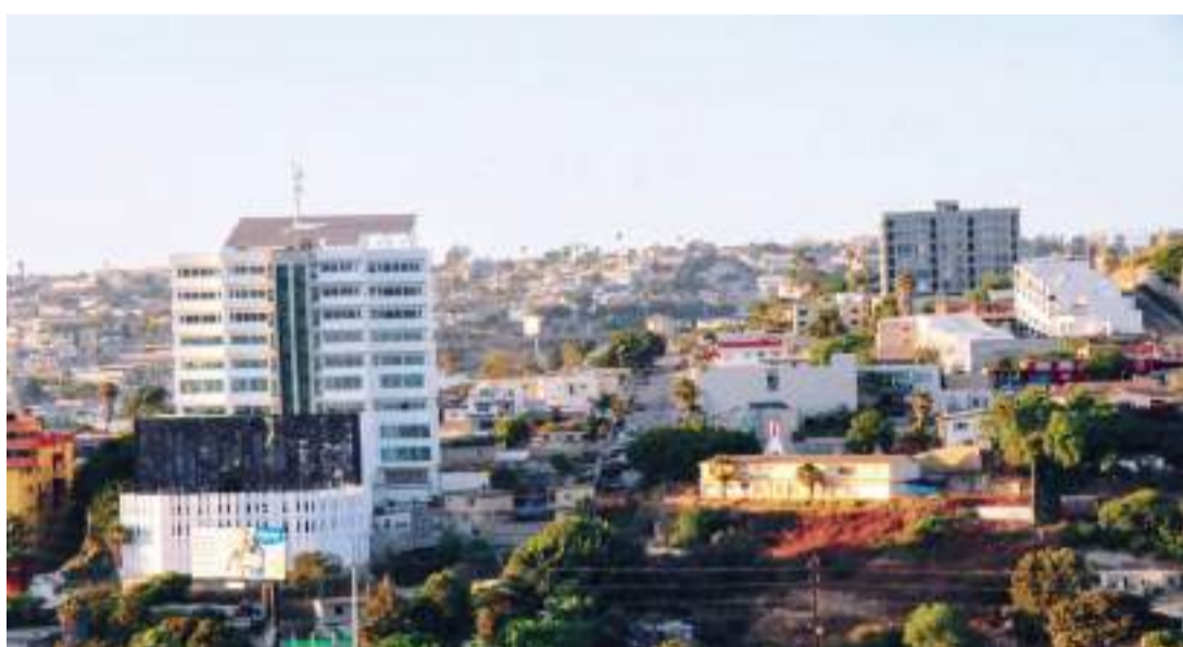
CIUDAD DE MÉXICO.- La actividad económica de Baja California creció 3.5% en el 2023, informó el INEGI.

El PIB es un cálculo anual y su propósito es contribuir al conocimiento del desempeño económico de las entidades federativas. Sus resultados permiten conocer la estructura económica de cada entidad y su contribución al producto nacional. Asimismo, posibilita la evaluación de la dinámica que presentan los 32 estados, así como la comparación entre los mismos.