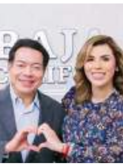
MEXICALI MARINA DEL PILAR ÁVILA OLMEDEA...

Recibió al secretario de Educación, MARIO DELGADO.