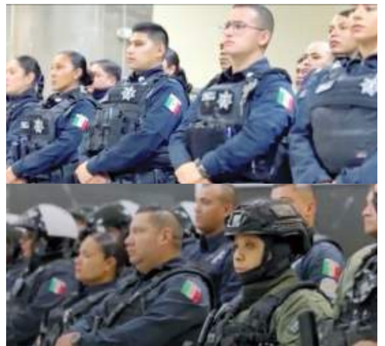
"LAS OPINIONES EXPRESADAS DE LOS COLUMNISTAS EN LOS ARTÍCULOS Y/O IMPRESOS SON DE EXCLUSIVA RESPONSABILIDAD DE SUS AUTORES Y NO NECESARIAMENTE DE #ELMEXICANODIARIO Y/O EDITORIAL KINO, S.A. DE C.V."

Que Trump vuelva al poder en la Casa Blanca amenazando con recrudecer y llevar casi al límite su guerra comercial, aduciendo que quiere proteger a la industria norteamericana, no es más que el anuncio de cuatro difíciles años para la producción y para las industrias más punteras. Nadie saldrá victorioso en una guerra comercial.