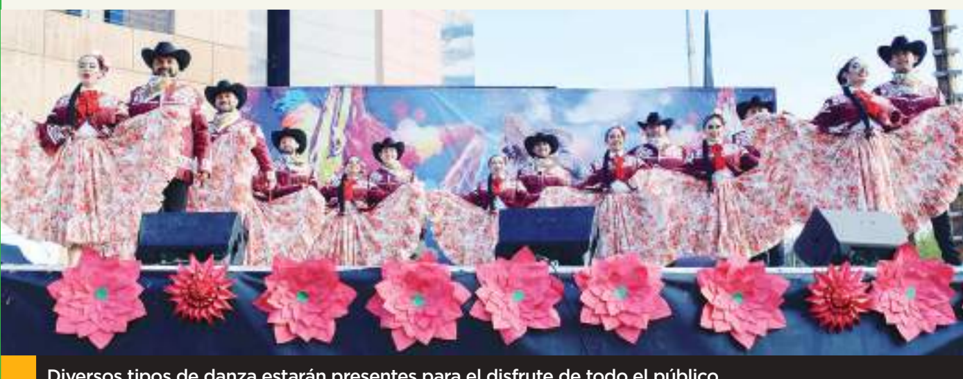
Diversos tipos de danza estarán presentes para el disfrute de todo el público.