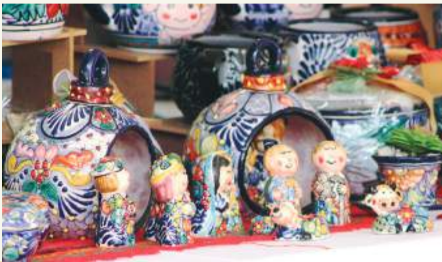
El Festival decembrino Hecho a mano y más contará con venta de artesanías tradicionales y muchos otros productos.

A las 14:00 horas el Coro Cenzontle presentará un repertorio navideño, para las 15:00 horas llega-