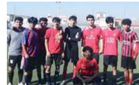
Este sábado se juegan los partidos de semifinales de vuelta.