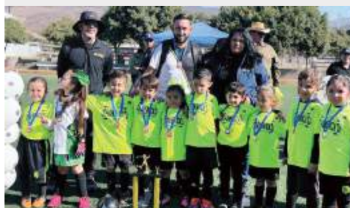
El Colegio St. Patricks ganó por 1 gol por 0 al Jardín de Niños Chapultepec.