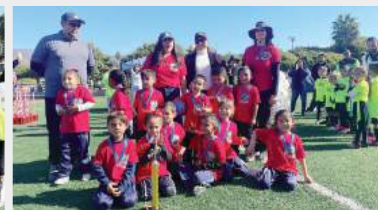
El Jardín de Niños Chapultepec tuvo una excelente participación.