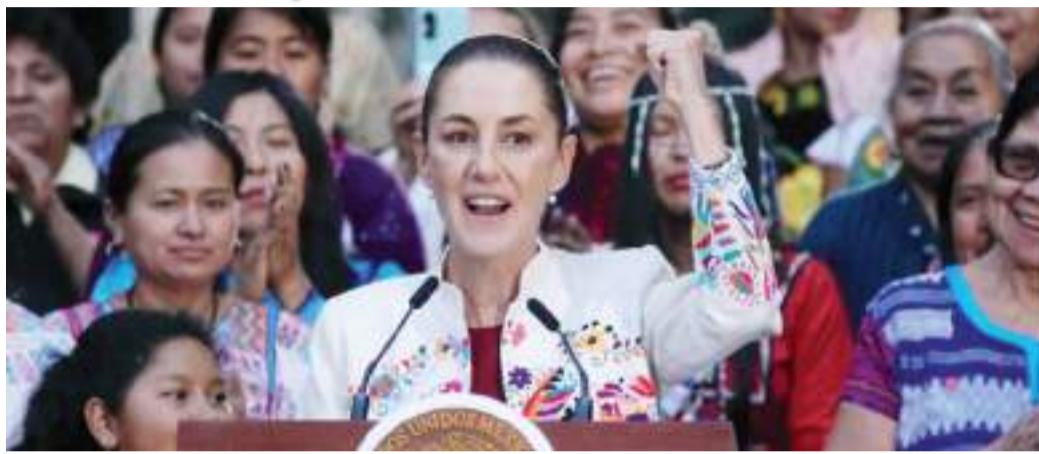
TIJUANA CLAUDIA SHEINBAUM PARDO...

Se trabaja de manera coordinada con los diferentes órdenes de gobierno para garantizar espacios de protección para quienes más lo necesitan. ¡Cuentan con todo el apoyo del CEJUM BC!