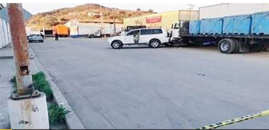
MEXICALI.- La COPARMEX en contra de la extinción de los organismos autónomos y lamentó la muerte del empresario de CANAINPESCA.

Los ciudadanos están perdiendo la capacidad de acceder a información sobre cómo se gastan sus impuestos, limitando su poder de exigir transparencia y rendición de cuentas, vemos con alarma como se ha desvanecido la división de poderes de la República, y lo mismo está sucediendo en nuestra entidad, donde la directriz del ejecutivo pesa lo suficiente para que un dictamen sea nuevamente votado en pleno del Congreso de Baja California, finalizó COPARMEX.