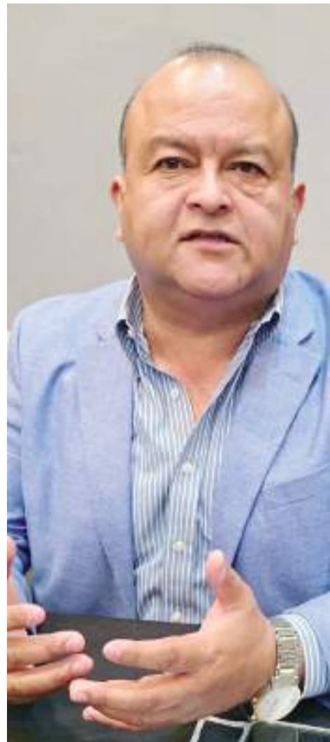
ENSENADA.- El sector empresarial propone que el cobro del impuesto a cruceristas sea aplicado en obras de infraestructura carretera, portuaria y turística, imagen urbana y promoción.

También hay incremento en otras dependencias como la Dirección de Infraestructura, para compra de pintura, arrendamiento de maquinaria y compra de concreto hidráulico, por mencionar algunas. De igual manera, se validó el punto de acuerdo relativo a solicitar la autorización y aprobación al Congreso del Estado de Baja California, la celebración y suscripción de un contrato plurianual de arrendamiento de 80 unidades equipadas como patrullas, por un periodo que rebase el ejercicio fiscal 2024 y subsecuentes, cuya vigencia sea hasta el 30 de septiembre de 2027.