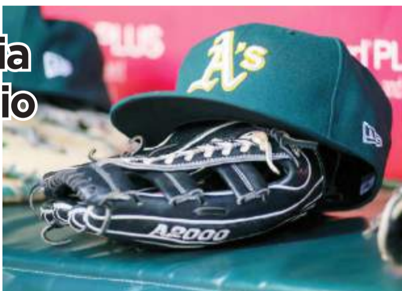
La Autoridad de Estadios de Las Vegas realizó una reunión especial.

El dueño de los Atlético John Fisher y su familia serán responsables por mil 400 millones de dólares de la cantidad. Los otros 350