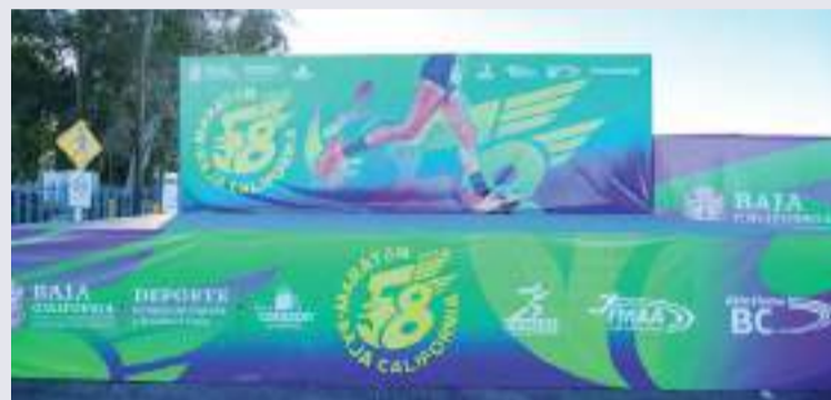
La ruta de 42,195 kilómetro arrancará en punto de las 07:00 horas.

La jornada de entrega de números y chips será de las 09:00 a las 18:00 horas.