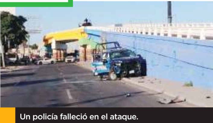
Un policía falleció en el ataque.