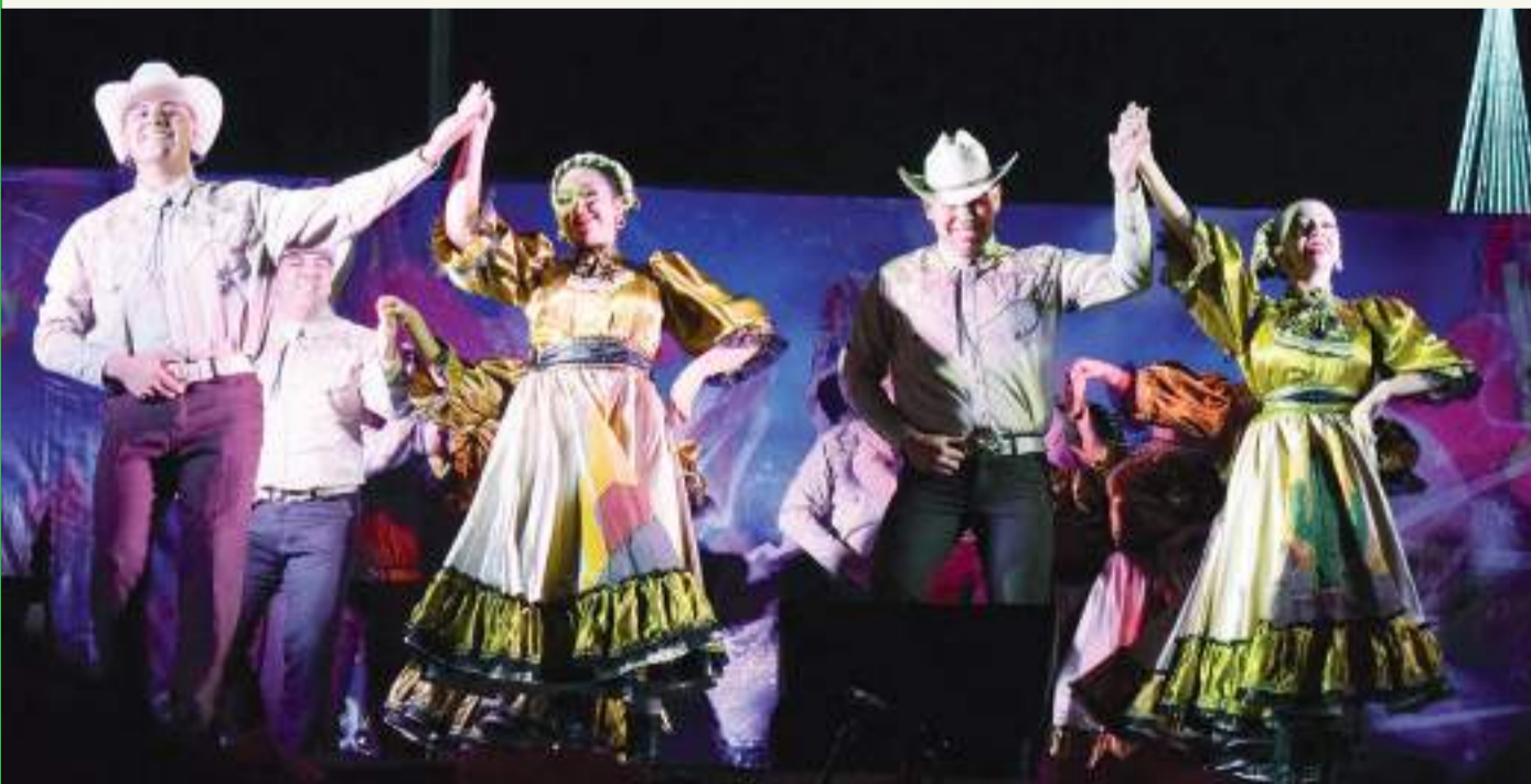
Un nutrido programa artístico gratuito será presentado en el escenario instalado en la Explanada de Cecut.

El programa completo de las actividades artísticas dentro del Festival decembrino Hecho a mano y más, puede ser consultado en: https://bit.ly/4eK2Lio