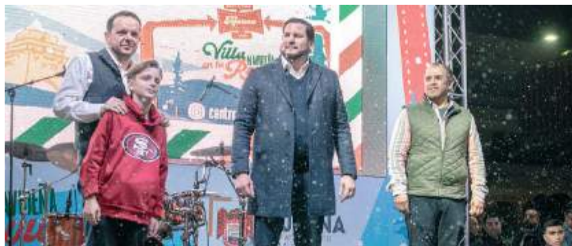
TIJUANA.- El Presidente Municipal, Ismael Burqueño Ruiz, inauguró la Villa Navideña en la Avenida Revolución, que estará del 6 de diciembre hasta el próximo 6 de enero.

Además de la pista de patinaje, que se abrirá mañana sábado 7 de diciembre, de 5 de la tarde a 10 de la noche con entradas gratuitas, a los atractivos se le suma el colorido árbol de navidad que colocó la empresa Coca Cola, en la Avenida Revolución, que luce en sintonía con la magia, el color y la luz que envuelve estas fechas, para que la ciudadanía acuda a compartir momentos felices con sus seres queridos en un espacio seguro, que además les brinda una amplia oferta gastronómica, cultural y artística.