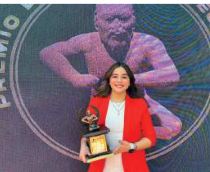
La esgrimista es multimedallista en Nacionales Conade y plata en el Panamericano Juvenil.

Luego de ser condecorado en la capital del país, el medallista mundial regresó a su campamento en las instalaciones de la Conade, debido a que realiza una concentración con miras al selectivo nacional en la próxima semana en la pista olímpica Virgilio Uribe en Cuernavaca.