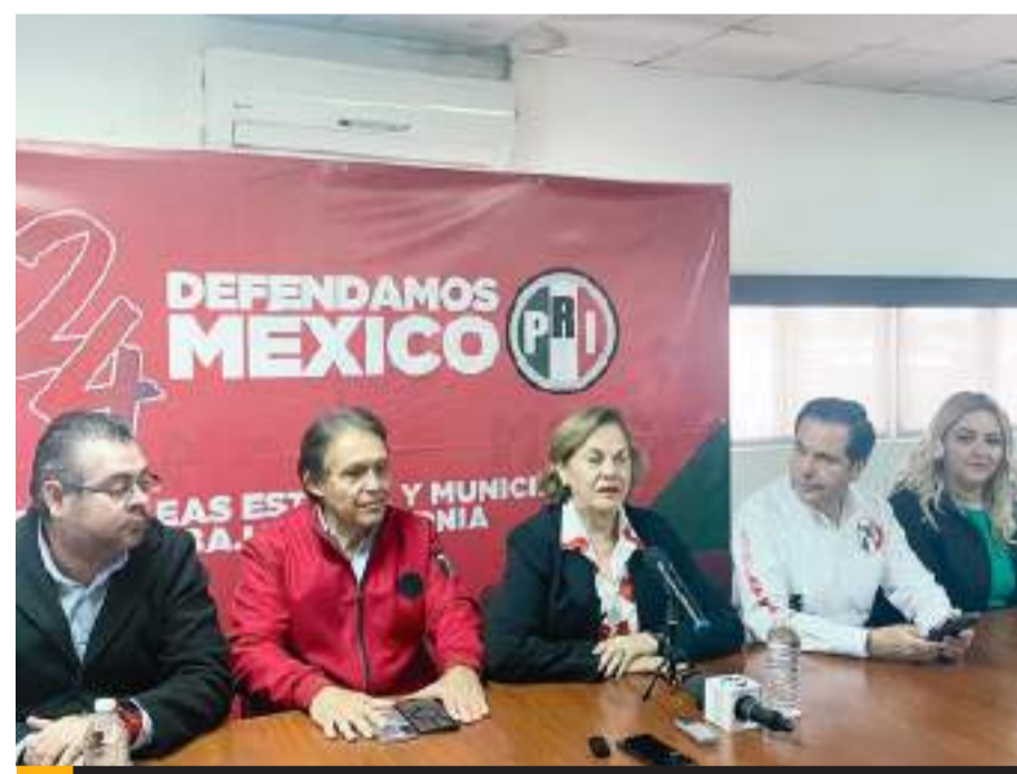
MEXICALI.- Guadalupe Fregoso anunció que no buscará la reelección como líder del PRI en BC.