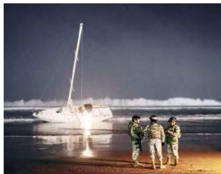
TIJUANA.- Ayer por la tarde reportaron un yate varado de color blanco, en la orilla del muro fronterizo que divide a México y Estados Unidos.