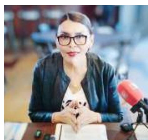
MEXICALI.- Legisladores del PAN informaron que presentarán un proyecto alternativo del Presupuesto de Egresos de la Federación.

En el tema de la seguridad, donde el paquete económico propone una reducción de 36 mil millones de pesos, la legisladora señaló establecer el plan Blindar México que conlleva una estrategia para tener carreteras seguras mediante una rehabilitación.