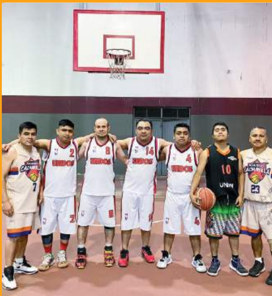
Los Unidos vencieron al son de 41 por 31 a los Guardianes.

golazoderampa@gmail.com www.facebook.com/fufec