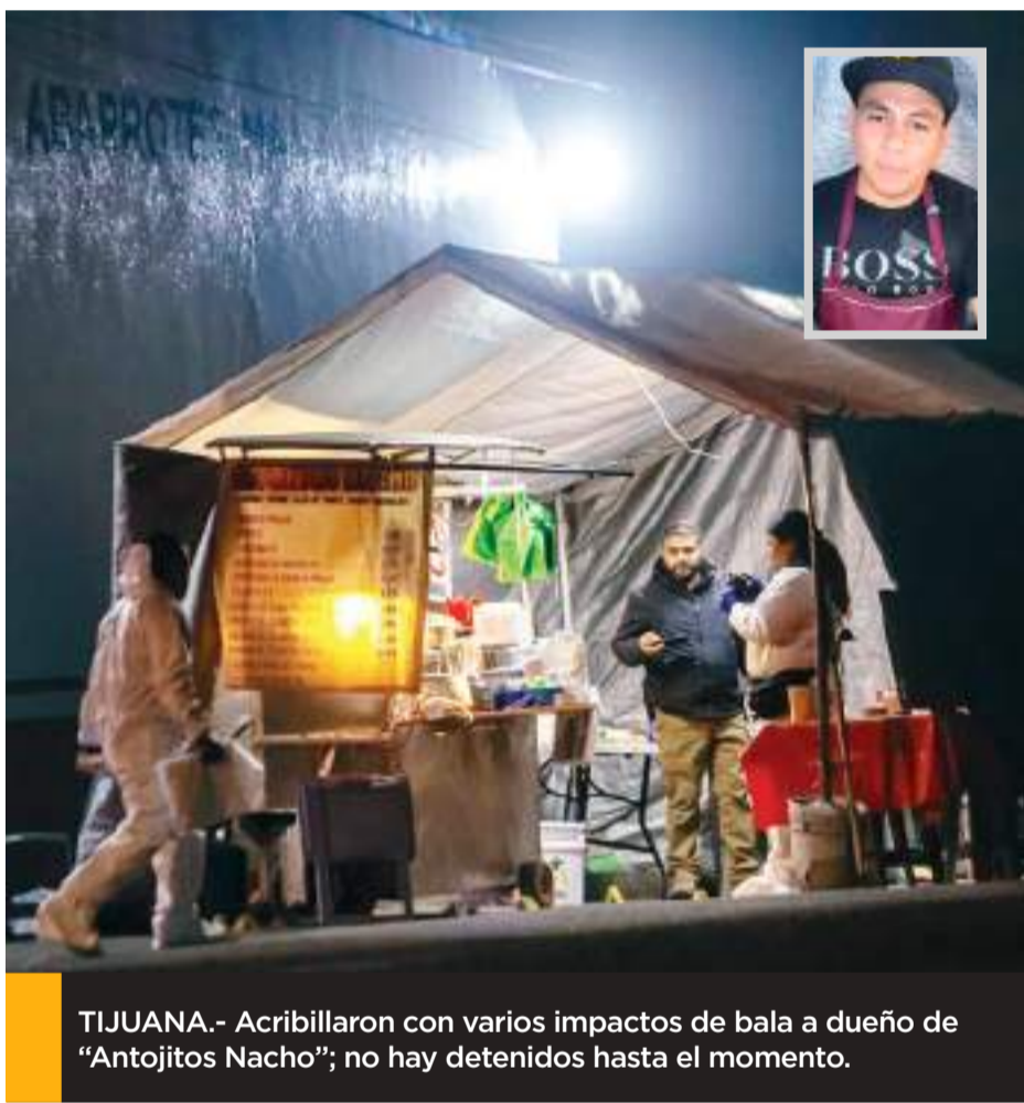
TIJUANA.- Acribillaron con varios impactos de bala a dueño de "Antojitos Nacho"; no hay detenidos hasta el momento.

De acuerdo a los primeros reportes, el ataque fue perpetrado por dos hombres que hasta el momento no han sido detenidos.