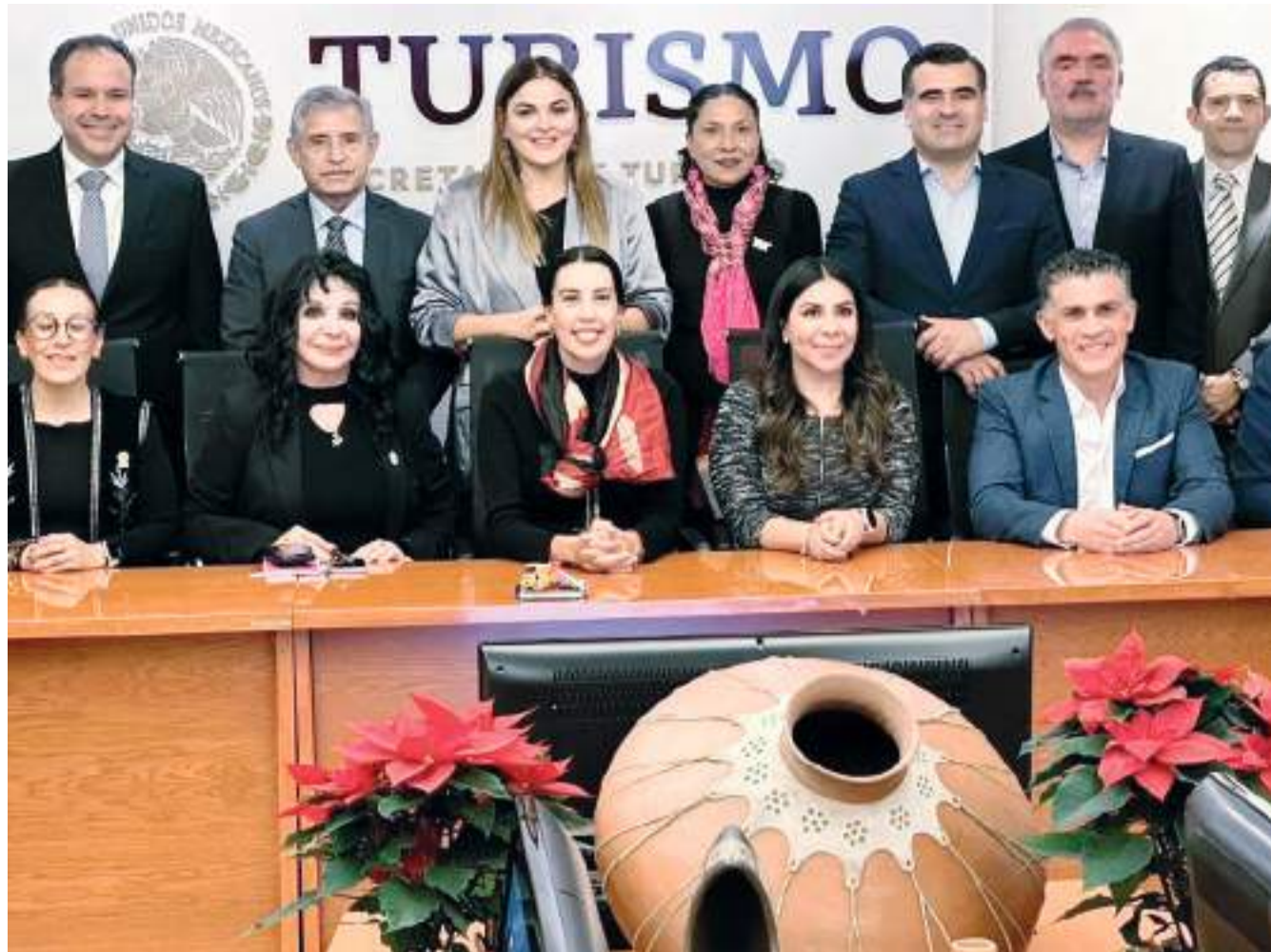
MEXICALI.- La Asociación de Ciudades Captales con la tarea en incrementar el potencial turístico de los Ayuntamientos del país.