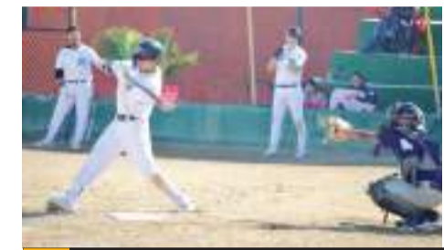
El líder invicto Bandits expone su calidad ante los aguerridos Yankees.