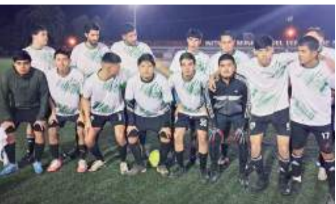
La jornada tendrá duelos de campeonato.