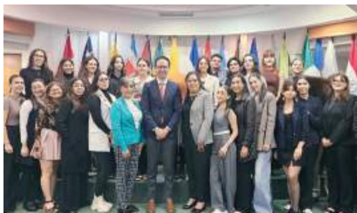
SAN JOSÉ, COSTA RICA.- Un convenio de colaboración y cooperación académica fue firmado entre la Corte Interamericana de Derechos Humanos (Corte IDH) y la Escuela de Derecho de CETYS Universidad.