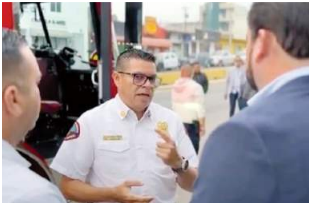
TIJUANA.- La Secretaría de Seguridad y Protección Ciudadana Municipal (SSPCM), invita a las y los tijuanaenses a seguir recomendaciones esenciales en esta temporada navideña.

La Policía Municipal exhorta a la ciudadanía a tomar en cuenta estas recomendaciones porque la #SeguridadTijuana es Responsabilidad de Todos.