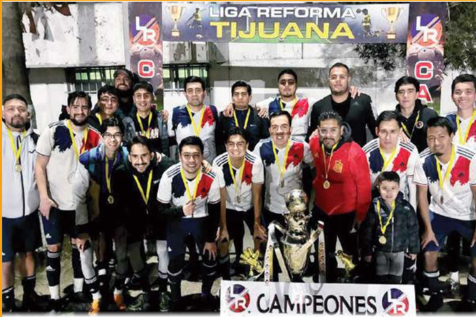
La Liga Reforma celebró sus partidos en la Unidad Deportiva Reforma.

Cabe señalar que en caso de que Guadalajara salga triunfante de su cruce, se encontraría al América en octavos de final. (Información de ESPN)