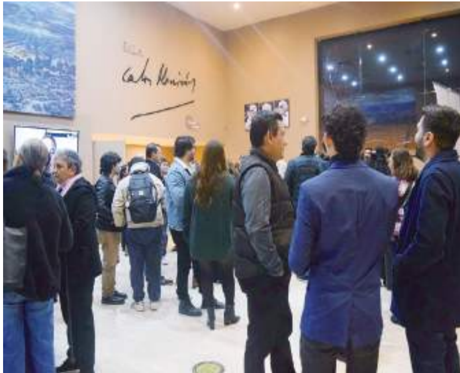
El festejo por el décimo tercer aniversario de la sala de cine Carlos Monsiváis concluyó con un brindis. (Imagen: Marisol Ramírez).