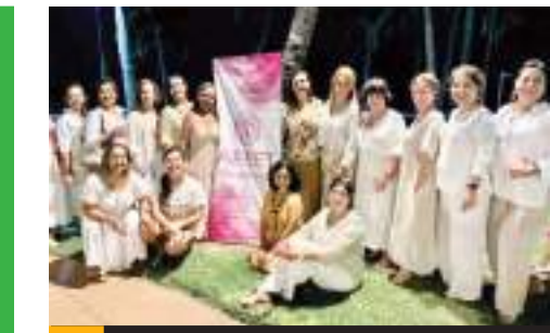
TIJUANA.- Ejecutivas de Empresas Turísticas desarrollarán alianzas estratégicas para generar negocios, promoviendo productos y experiencias turísticas tanto de Guerrero como de Baja California.