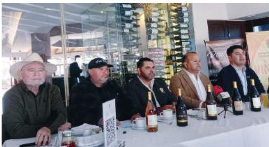
ENSENADA.- Se proyecta un buen año 2025, con un aumento en el consumo de vino y visitas en el Valle de Guadalupe.

Estudillo Bernal, agregó, que en el año 2023 se mantuvo un punto de equilibrio debido a los precios preferenciales que se manejan en la zona por el reto que representa que la actividad turística se concentre únicamente en seis meses.