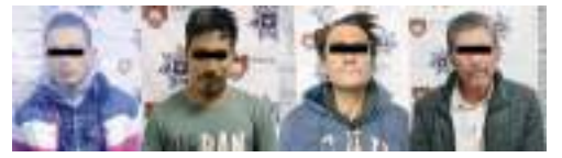
EN DIVERSOS OPERATIVOS

Capturaron a cuatro, por delitos contra la salud