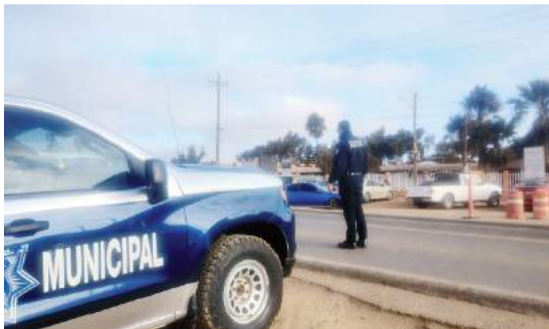
ENSENADA.- Personal de la Dirección de Seguridad Pública Municipal (DSPM), a través de la Base de Operaciones Mixtas (BOM), realizó operativo en el Parador de Punta Prieta.

Asimismo, en el Ejido Villa Jesús María, el acceso a la Secundaria Francisco Villa #41, se atendió el Ejido El Costeño (límite con Guerrero Negro), el Preescolar Gabilondo Soler, Telesecundaria #92, Gasolinera el Berrendo, y hotel Alfway Inn.