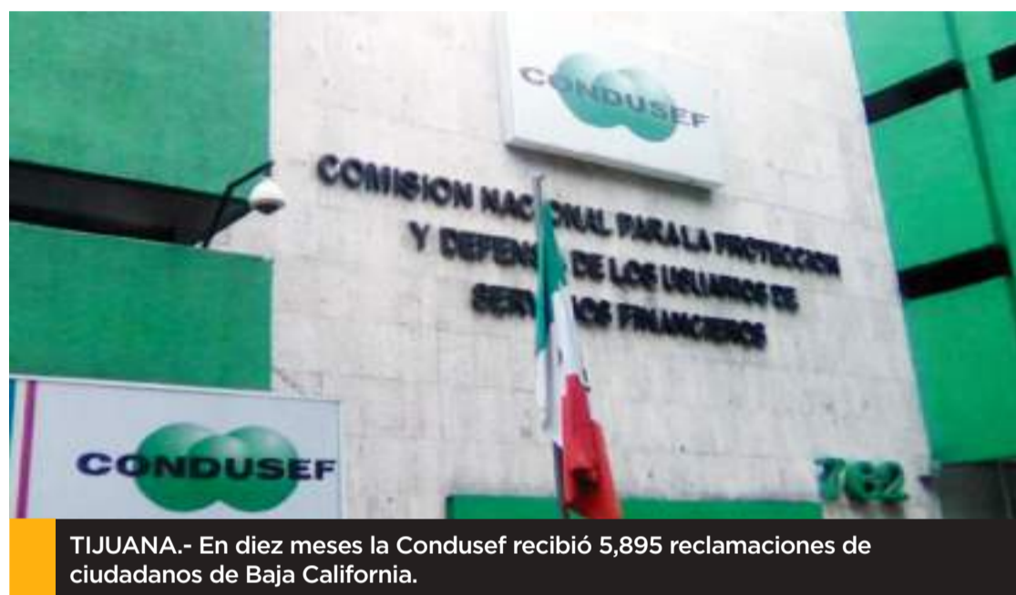
TIJUANA.- En diez meses la Condusef recibió 5,895 reclamaciones de ciudadanos de Baja California.

Las reclamaciones recibidas por Condusef en esta entidad se interpusieron por usuarios de 5 de 7 municipios que lo integran, siendo Tijuana el que concentró el 73.7% del total, seguido por Mexicali con el 13.6%.