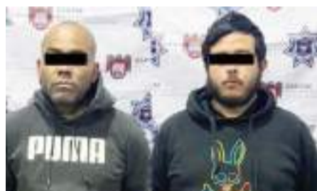
TIJUANA.- Los cuatro presuntos generadores de violencia fueron capturados en el momento que trasladaban a su víctima de "levantón", a quien le dieron un balazo.