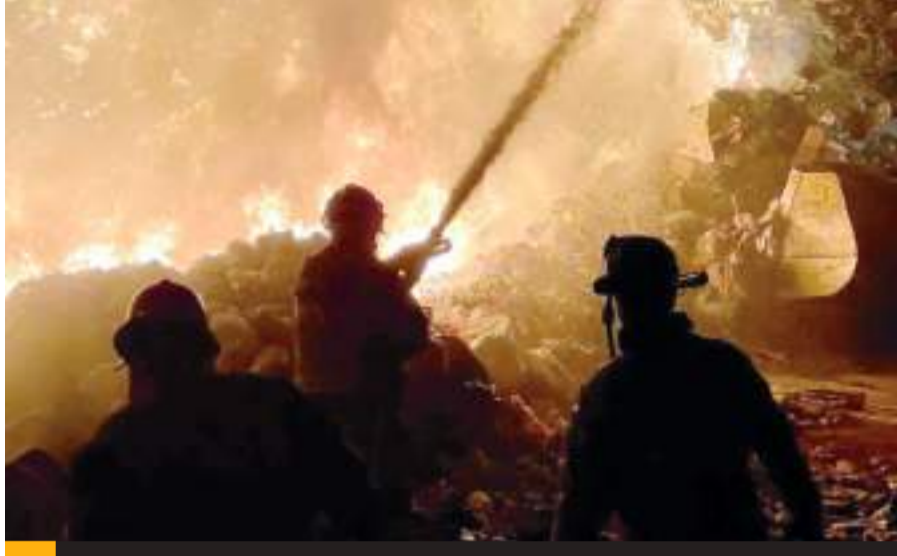
PLAYAS DE ROSARITO.- Varios incendios se registraron en diferentes puntos de Playas de Rosarito, a consecuencia de los fuertes vientos de Santa Ana.

Estos corresponden a 3 incendios forestales, 3 incendios de za-