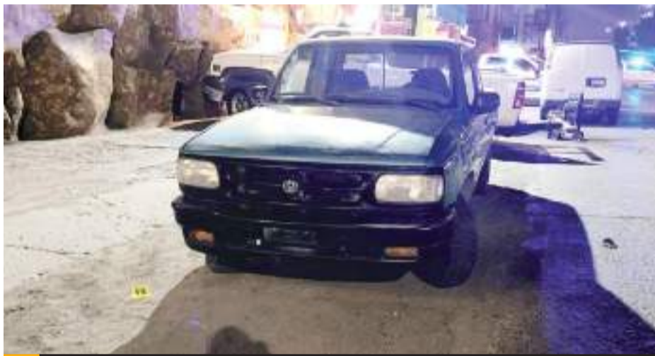
TIJUANA.- Este es el pick up con reporte de robo que utilizaron los agresores para arribar al bar La Cueva del Peludo, en donde mataron al guardia de seguridad.

Tras recabar información con los testigos, informaron que el lesionado laboraba en el lugar y contaba con permiso para portar arma de fuego, señalando que momentos antes llegó