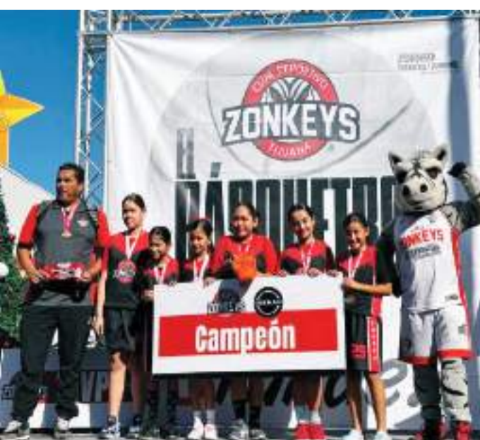
Zonkeys se impuso en la final a TJ Girls.

Para coronarse, en la final, Zonkeys le ganó la final a TJ Girls, mientras que el tercer peldaño fue para Club Pumas.