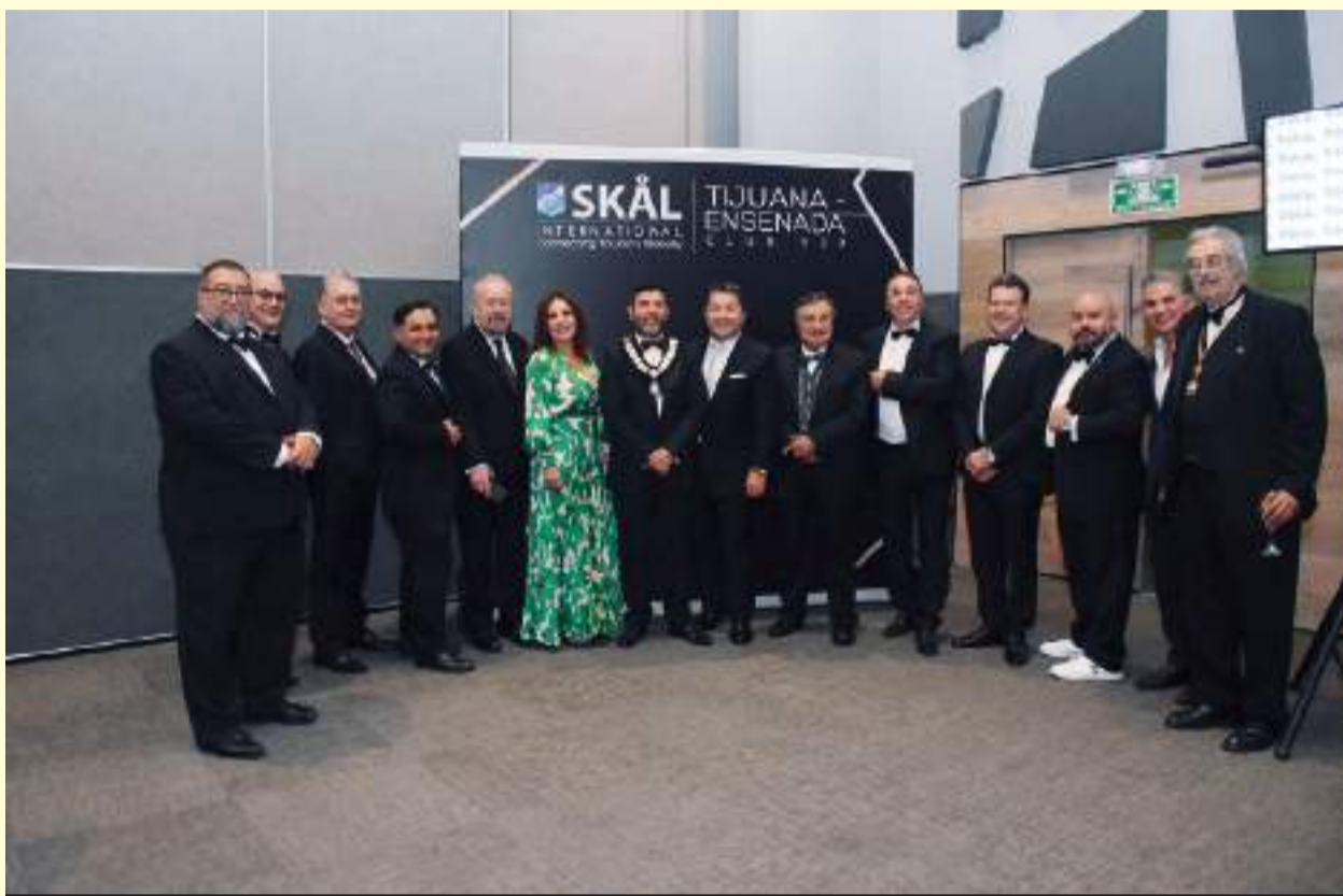
Tradicional foto del recuerdo de los empresarios y promotores turísticos de la región.