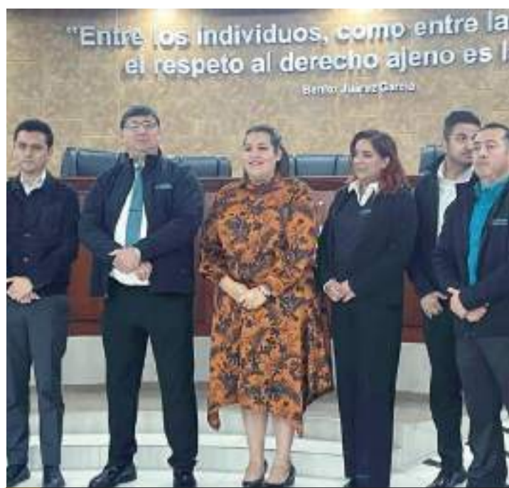
MEXICALI.- Un presupuesto de 16 millones de pesos es lo que solicitó el ITAIP al Poder Legislativo, para el proyecto de egresos 2025.