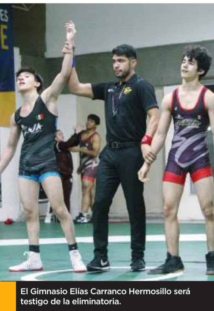
El Gimnasio Elías Carranco Hermosillo será testigo de la eliminatoria.