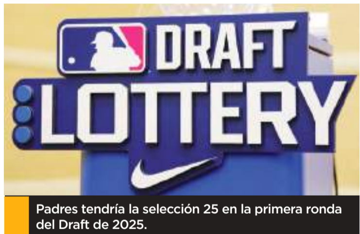
Padres tendría la selección 25 en la primera ronda del Draft de 2025.

A continuación, el orden del Draft para los 12 equipos de postemporada, con sus porcentajes de victorias en 2024 entre paréntesis: 19. Orioles (.562), 20. Cerveceros (.574), 21. Astros (.547), 22. Bravos (.549), 23. Reales (.531), 24. Tigres (.531), 25. Padres (.574), 26. Filis (.586), 27. Guardianes (.571), 28. Mets (.549), 29. Yankees (.580) y 30. Dodgers (.605).