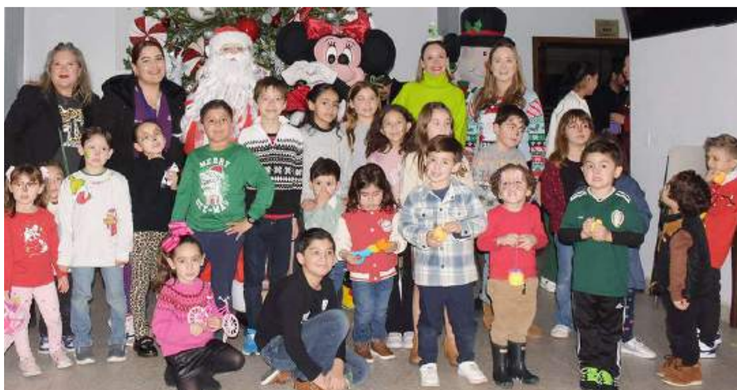
Niños y niñas disfrutaron de posada y encendido de árbol navideño con Santa Claus y Mickey Mouse.