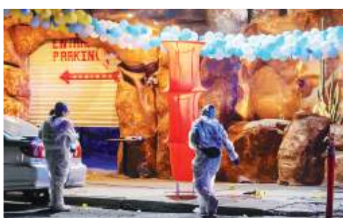
TIJUANA.- Dos hombres detenidos, uno herido de bala y un guardia sin vida, fue el saldo de un incidente armado en la entrada del bar La Cueva del Peludo.