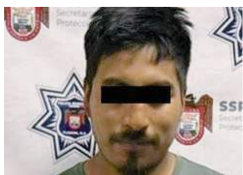
TIJUANA.- Tras diversos operativos preventivos, fueron aseguradas cuatro personas por delitos contra la salud.