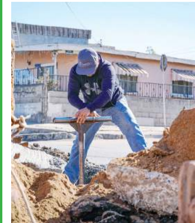
ENSENADA.- LA CESPE realizó trabajos de reparación en la red de agua potable ubicada en el cruce de la calle Vicente Guerrero y Calzada de las Águilas, de la colonia Aviación.