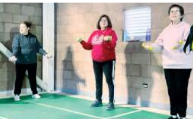
El entrenamiento funcional es para adultos y adultos mayores de 50 años.

“Nuestro objetivo es alentar a los adultos mayores a adoptar un estilo de vida activo para preservar su salud física, mental y emocional”, reiteró el entrenador.