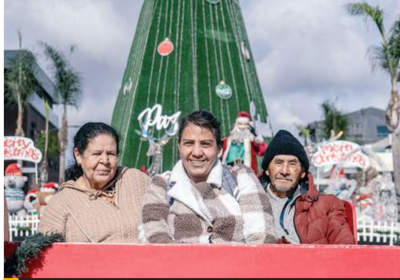
TIJUANA.- Las parejas y familias pueden disfrutar de un noble recorrido y grandes fotografías de forma gratuita.

"El cambio ocurre cuando logramos intervenir antes de que se produzca la violencia. Cada mujer que ayudamos representa una victoria, pero nuestro sueño es que ningún ser humano tenga que enfrentar estas situaciones", precisaron.