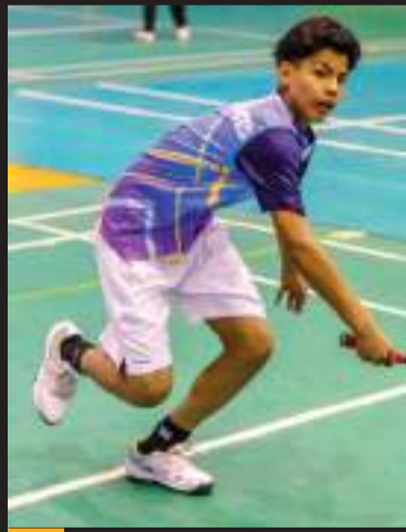
Los atletas coronaron semana y media de concentración.

"Los resultados de la Copa Baja reflejaron el trabajo realizado, los ganadores cuentan con experiencia,