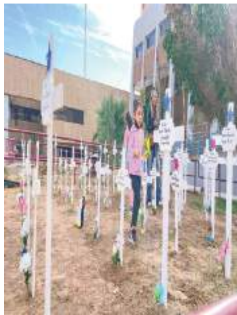
MEXICALI.- Ciudadanos exigen la aprobación de la Ley 5 de Junio en Baja California.