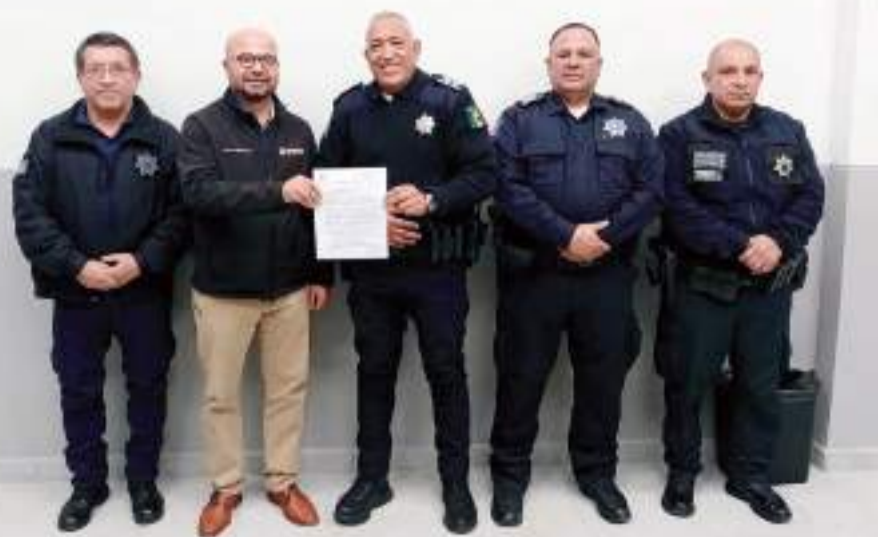
ENSENADA.- Para prevenir actos vandálicos y robos en escuelas durante el receso escolar de invierno, la Secretaría de Educación en coordinación con la Dirección de Seguridad Pública Municipal (DSPM), hicieron un llamado social a denunciar actividades sospechosas dentro y fuera de los planteles en los números telefónicos de emergencia 9-1-1 y 089.

Cabe señalar que el receso escolar de invierno es para 79 mil 470 alumnos de Educación Básica, así como 4 mil 122 docentes de 569 planteles educativos, siendo 103 de secundaria; 240 de primaria; 212 de preescolar; y 14 de inicial.