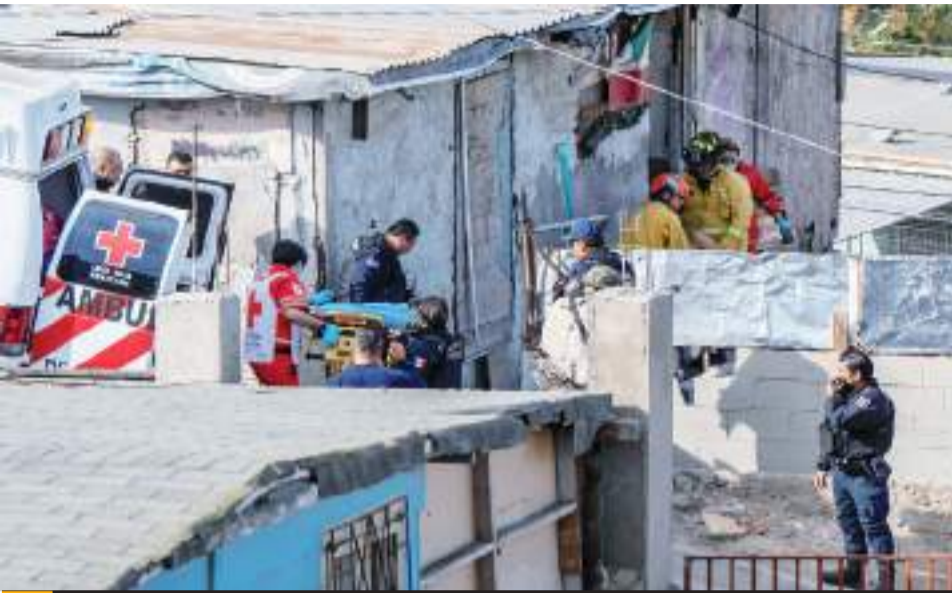
TIJUANA.- Dos hombres sufrieron una agresión armada en la colonia Las Cruces.