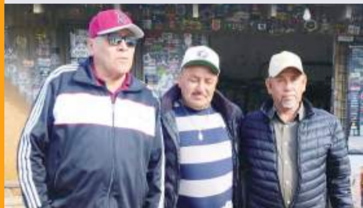
Están por formar la Asociación Estatal del Futbol Indígena.