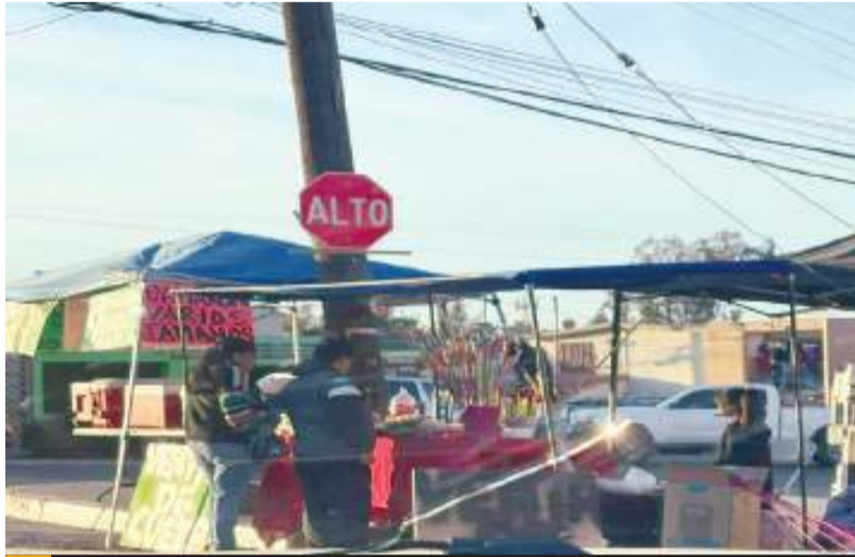
TIJUANA.- Durante los festejos de Nochebuena y Navidad en Tijuana se hicieron presentes las detonaciones de cohetes y de armas de fuego en esta ciudad.

Por su parte, el XXV Ayuntamiento de Tijuana aseguró que la Dirección de Inspección y Verificación Municipal mantenía operativos de supervisión y control contra la venta de pirotecnia, en los cuales participaban 37 inspectores. Sin