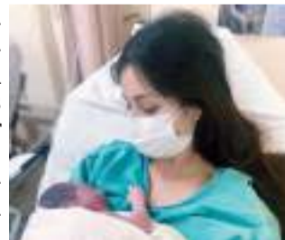
BC.- Estos son los primeros bebés nacidos en los diferentes hospitales del Estado.