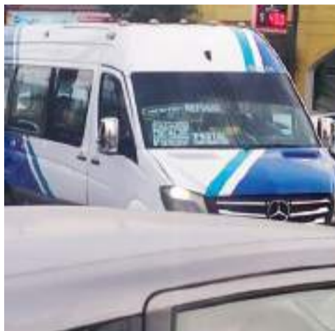
TIJUANA.- Los afectados no fueron notificados de ningún aumento en el cobro, y las unidades no tienen escritos sus costos.

Hasta la tarde del 25 de diciembre, las autoridades de seguridad, bomberos y la Secretaría de Seguridad y Protección Ciudadana Municipal de Tijuana (SSPCMT), así como la Fiscalía General del Estado (FGE), no reportaron incidentes de heridos por balas perdidas ni por detonación de pirotecnia durante los festejos navideños en la ciudad.