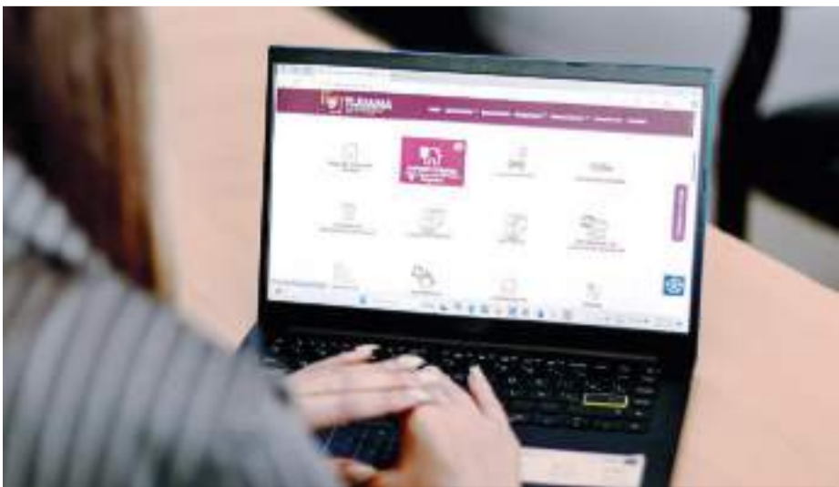
TIJUANA.- Se exhorta a las y los ciudadanos a aprovechar los diversos trámites y servicios que el Gobierno Municipal pone a disposición a través del portal del XXV Ayuntamiento www.tijuana.gob.mx .

Una de las prioridades del Gobierno que preside el Alcalde Ismael Burgueño Ruiz, es el bienestar económico de las familias tijuanaenses, por ello, fue emitido el decreto que establece que durante su vigencia a las y los tijuanaenses que realicen el pago del Impuesto Predial y del Impuesto Sobre Adquisición de Inmuebles, se les condonará el 100% de las multas y recargos generados por incumplimiento en su pago, respecto al ejercicio fiscal 2024 y años anteriores.