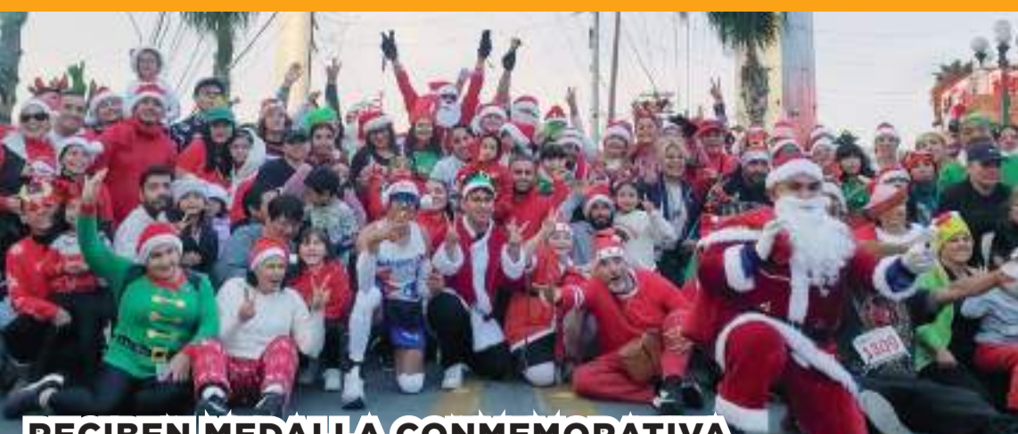
RECIBEN MEDALLA CONMEMORATIVA

"Tavo" logró 3 podios en 4 fechas durante este 2024, quedándose muy cerca de ganar la Baja 1000 y la Baja 500, en ambas carreras finalizó segundo, además de un tercer sitio en la San Felipe 250, y un quinto lugar en la Baja 400, resultados que son parte de los éxitos conseguidos por "La Armada Mexicana" en la organización más prestigiosa del off road dentro de la actualidad.