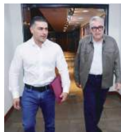
García Harfuch lleva una semana operando desde Sinaloa, estado que vive una ola de más de 100 días de violencia ininterrumpida desde la detención, en Estados Unidos, de Ismael "El Mayo" Zambada.