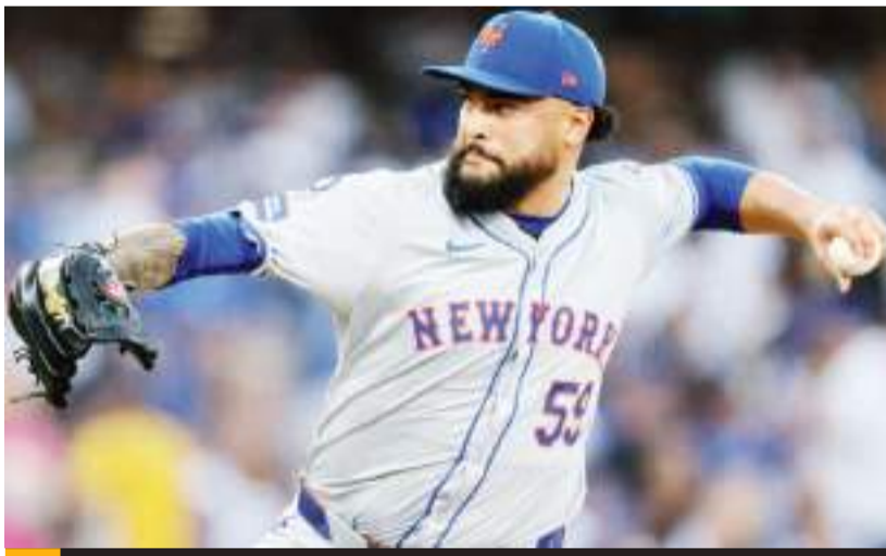
Manaea mejoró en grande durante la temporada del 2024.

ese proceso se darían en enero. "Es un contrato justo y la OTC (Oficina del Comisionado de MLB) nos trató con respeto durante todas las negociaciones", dijo la Asociación de Árbitros de MLB en un comunicado. "Entendemos el papel que tenemos en nuestro juego y hemos jugado duro para construir nuestra relación para que sea de una sociedad y de buena comunicación. Anticipamos con gusto el crecimiento continuo y positivo del juego en los próximos años". De ser ratificado el acuerdo