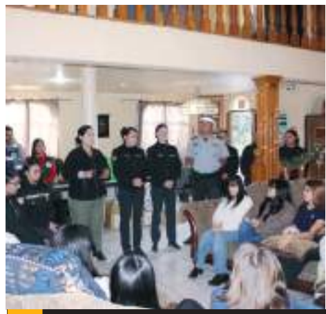
PLAYAS DE ROSARITO.- Personal de la Guardia Nacional compartió estrategias de prevención con las integrantes de la Casa Hogar "Estrella de la Mañana".

La Villa Navideña se encuentra entre calles Cuarta y Quinta y aprovecha el gran árbol navideño que la compañía Coca-Cola brindó a la comunidad. La Villa Navideña estará disponible con acceso libre hasta el 6 de enero.