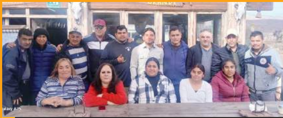
La Liga Rural de Maneadero celebró las fiestas decembrinas con sus agremiados.