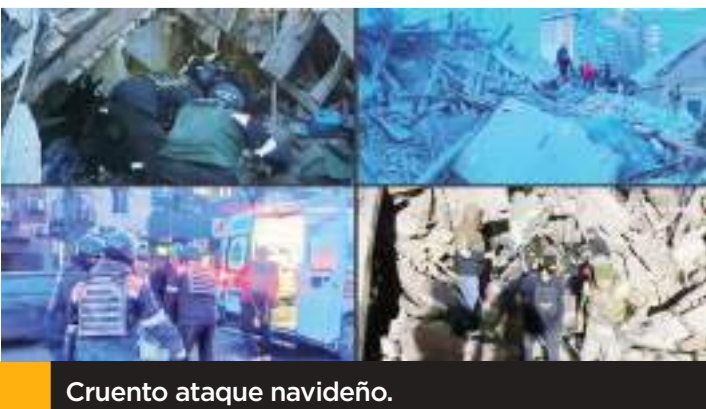
Cruento ataque navideño.