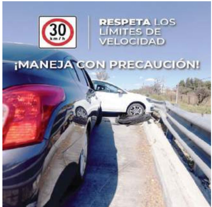
MEXICALI.- La Secretaría de Infraestructura, Comunicaciones y Transportes (SICT) hace algunas recomendaciones al transitar por la Red Carretera Federal durante estas vacaciones de fin de año.

Recuerde: "Las carreteras son más seguras si manejas con precaución", "Los mensajes que debes leer cuando manejas, no se encuentran en tu celular".