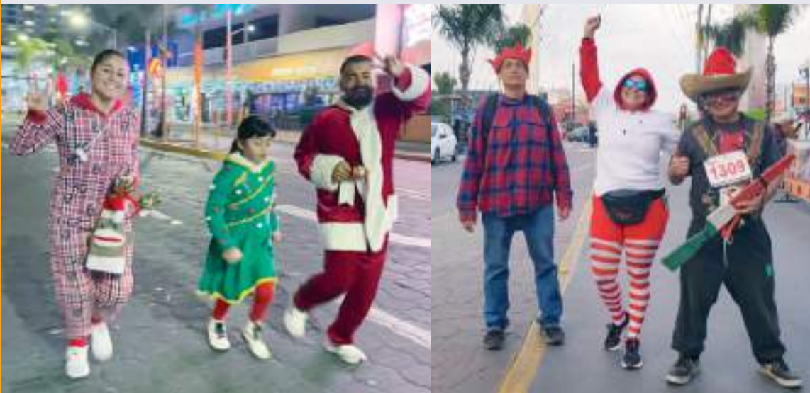
Vestidos como Santa Claus, duendes, o con adornos y luces, los participantes completaron el recorrido.

Además, los participantes que portaron los disfraces navideños más creativos fueron premiados con pavos, cerrando con alegría y entusiasmo esta gran celebración deportiva y solidaria.