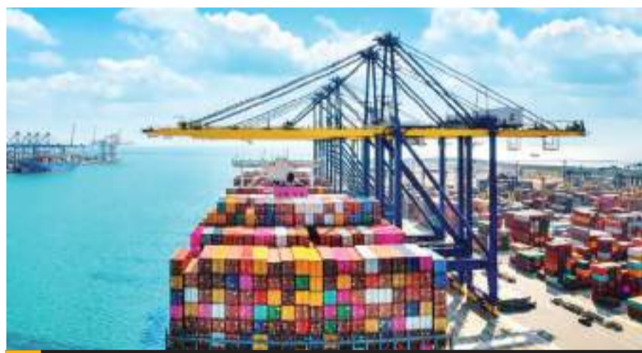
MEXICALI.- Baja California con importante actividad en el ramo de exportación.