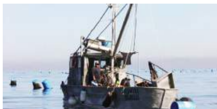
ENSENADA.- Se trabaja en una estrategia federal, para responder a los intereses de este sector.