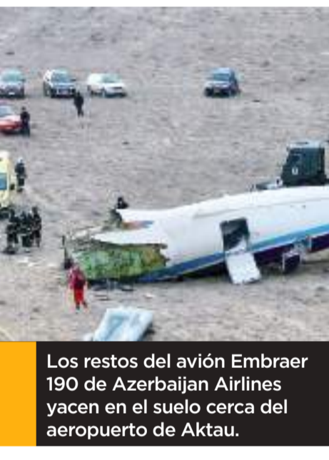
Los restos del avión Embraer 190 de Azerbaijan Airlines yacen en el suelo cerca del aeropuerto de Aktau.