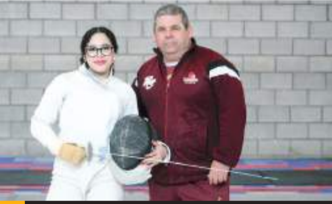
Logró en el presente año representar a México en el Campeonato Panamericano Cadete Juvenil de Florete.