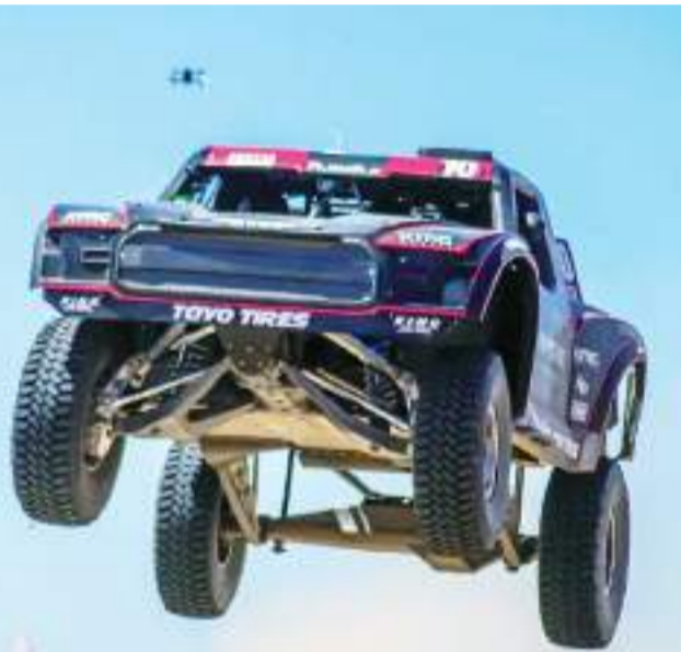
Ampudia finalizó todas las millas de este 2024.