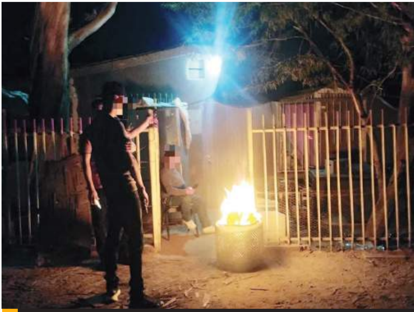
MEXICALI.- La DSPM aplicando sanciones por violaciones al reglamento de medio ambiente.

MEXICALI.- Un total de 101 boletas de infracción fueron emitidas por la Policía Ecológica de la Dirección de Seguridad Pública Municipal (DSPM) durante los festejos navi-