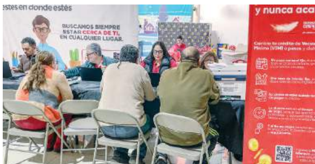
CIUDAD DE MÉXICO.- La Concanaco reconoce la decisión de la Presidenta de México, Doctora Claudia Sheinbaum Pardo, de aplazar la discusión de la reforma a la Ley del INFONAVIT hasta febrero de 2025.