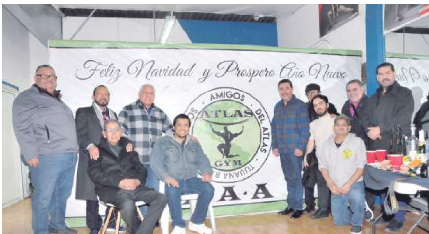
Amena reunión navideña tuvieron los Amigos Auténticos del Atlas.

LOS DEPORTISTAS DEJARON POR UNAS HORAS LOS APARATOS Y LAS PESAS PARA PONERSE DE MANTELES LARGOS Y CONVIVIR EN UNA MEMORABLE REUNIÓN DECEMBRINA