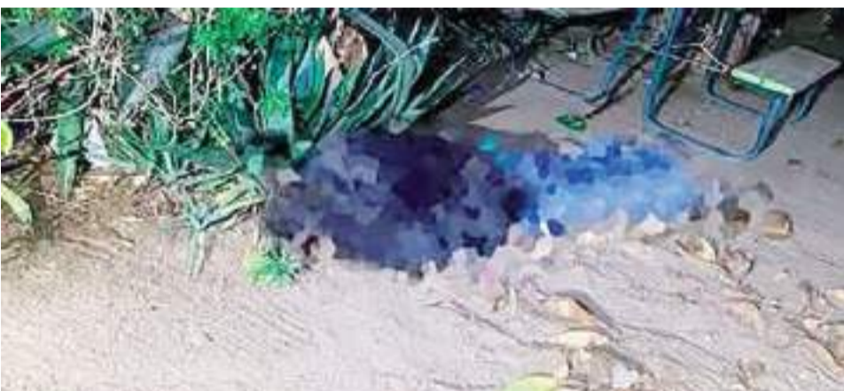
SAN FELIPE.- Dos hombres fueron asesinados en el kilómetro 181 de la carretera federal de San Felipe.

Paramédicos de la Cruz Roja y elementos del Cuerpo de Bomberos llegaron al lugar para brindar los primeros auxilios a los lesionados