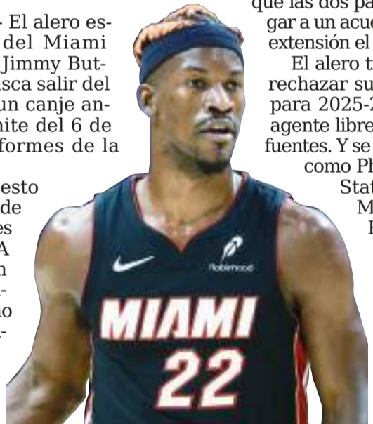
El seis veces All-Star de la NBA se ha abierto a equipos como los Suns, Warriors, Mavericks y Rockets.

Varios equipos han llamado al Heat para expresar interés en Butler en las últimas dos semanas, pero Miami no ha mostrado urgencia en las conversaciones mientras la franquicia monitorea la primera mitad de la temporada, dijeron esas