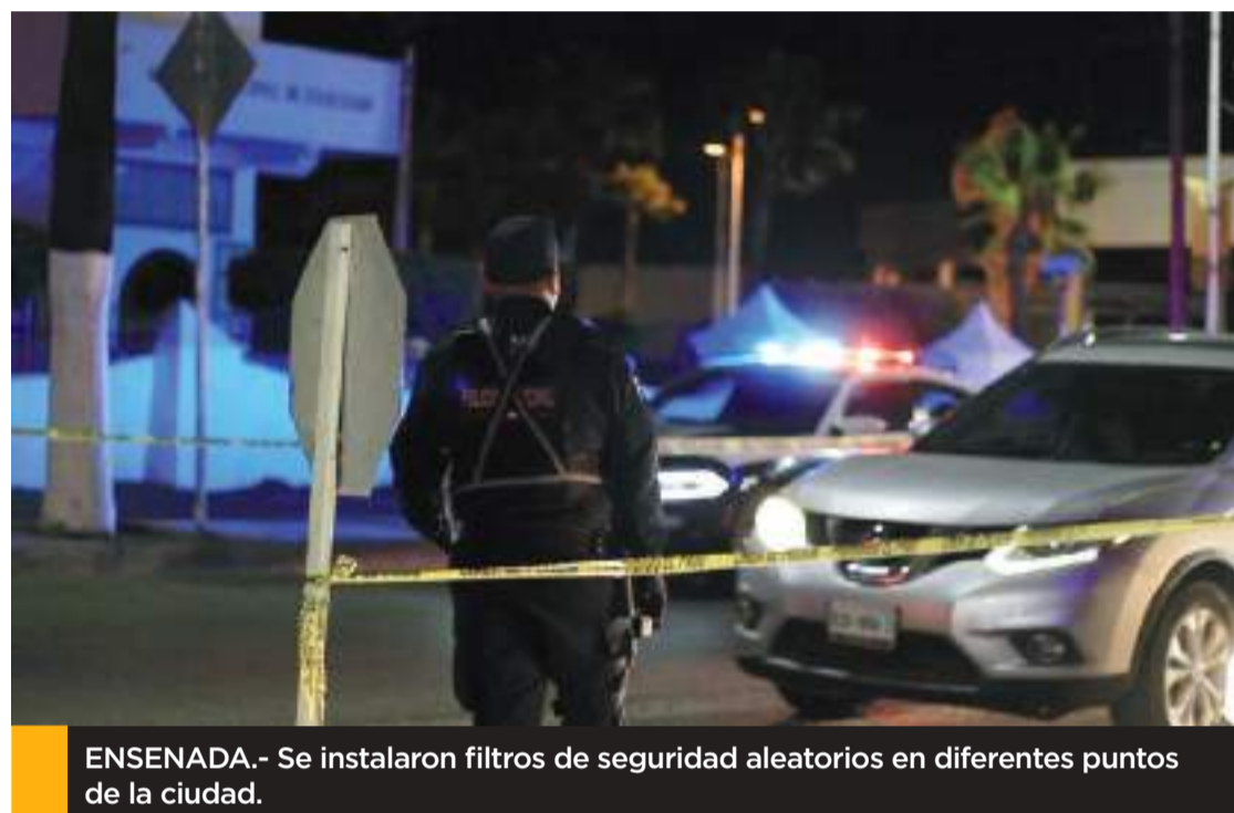
ENSENADA.- Se instalaron filtros de seguridad aleatorios en diferentes puntos de la ciudad.

El titular de la DSPM subrayó que los operativos continuarán durante los festejos de fin de año, a fin de garantizar que las celebraciones transcurran en orden y sin contratiempos. Hizo un llamado a la ciudadanía a mantener conductas responsables y a reportar cualquier situación sospechosa al número de emergencias 911.