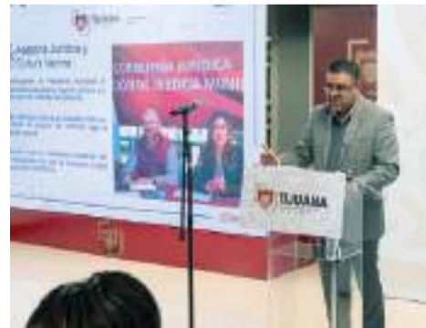
TIJUANA.- A fin de privilegiar la justicia social, se capacita a los elementos policíacos en la protección de los derechos humanos.

Dentro de las acciones realizadas en los primeros meses de la administración, destaca la firma de un Convenio de Colaboración con el Poder Judicial, con el objetivo de capacitar a los elementos policíacos en la protección de los derechos humanos y la elaboración