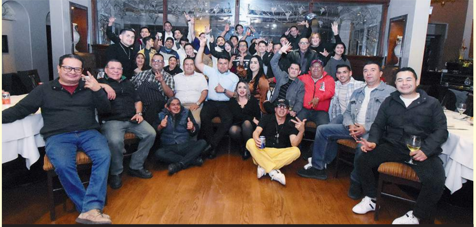
Ameno y divertido brindis decembrino, gozaron trabajadores restauranteros.

DISFRUTARON VELADA EN LA PRIMERA Aprovechando las vacaciones decembrinas se realizó la primera edición del evento destinado al público adulto para que disfrute y aprenda en las salas del Museo Interactivo.