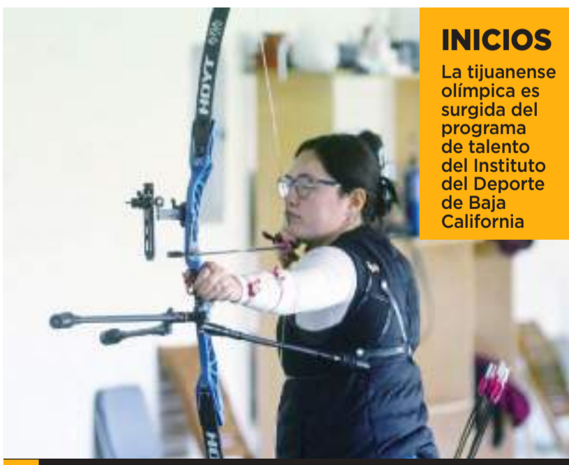
Bayardo lleva a cabo jornadas de 120 minutos en las instalaciones.

Bayardo contabiliza tres participaciones en Juegos Olímpicos en su carrera, la primera en Río 2016 con el equipo mexicano y posterior a su