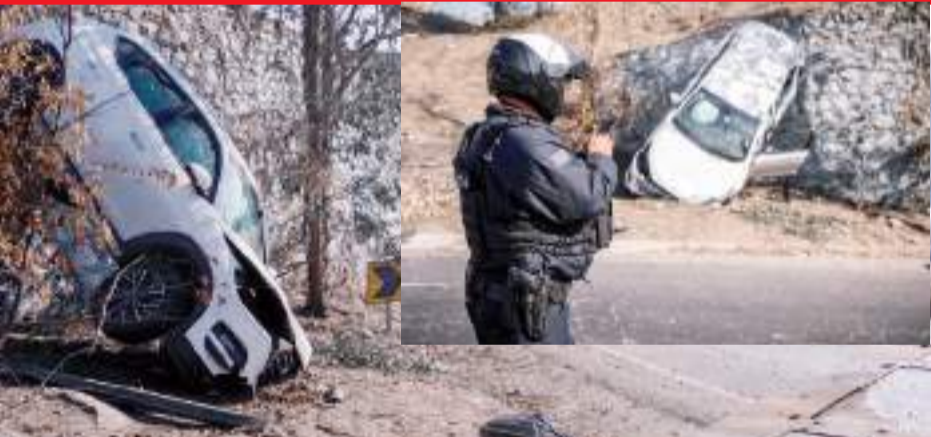
TIJUANA.- Así quedó el vehículo conducido por una joven en el bulevar Cuauhtémoc Sur; ella resultó ilesa.