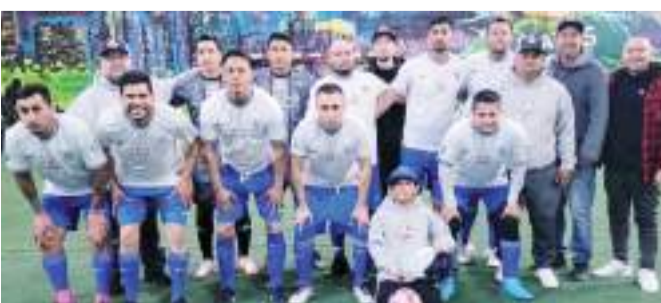
En partido que se espera reñido, Farmacia Suprema enfrentará a Pozos y Bombas.