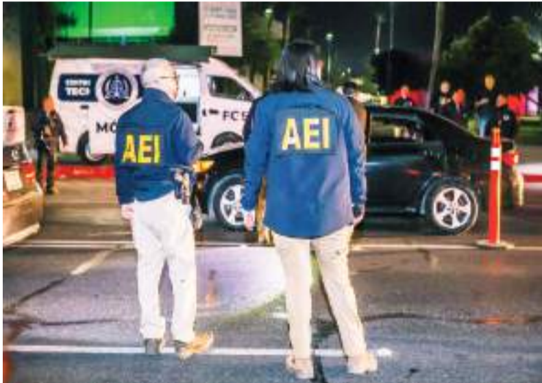
TIJUANA.- Saldo blanco tras operativos realizados por la FGEBC durante las festividades de Año Nuevo en la región.

medidas de seguridad en lugares vulnerables. Se ha dispuesto un equipo de trabajo especializado en delitos de alto impacto, como