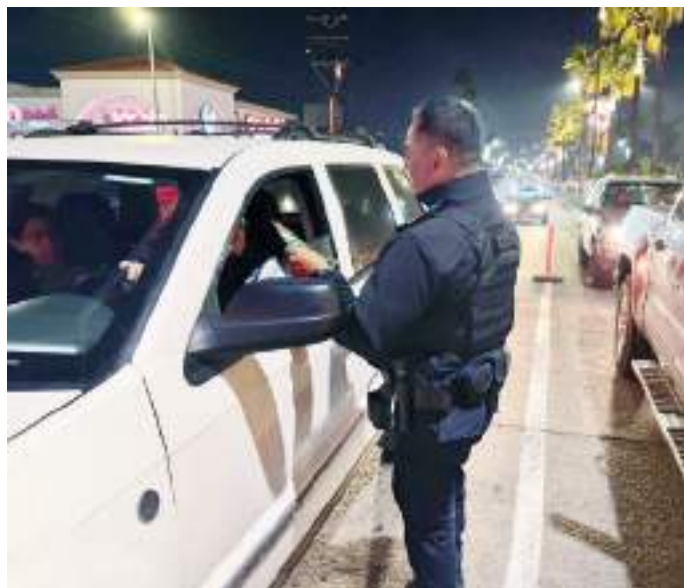
ENSENADA.- Como parte del operativo, se implementaron filtros con alcoholímetro en diversos puntos de la ciudad.