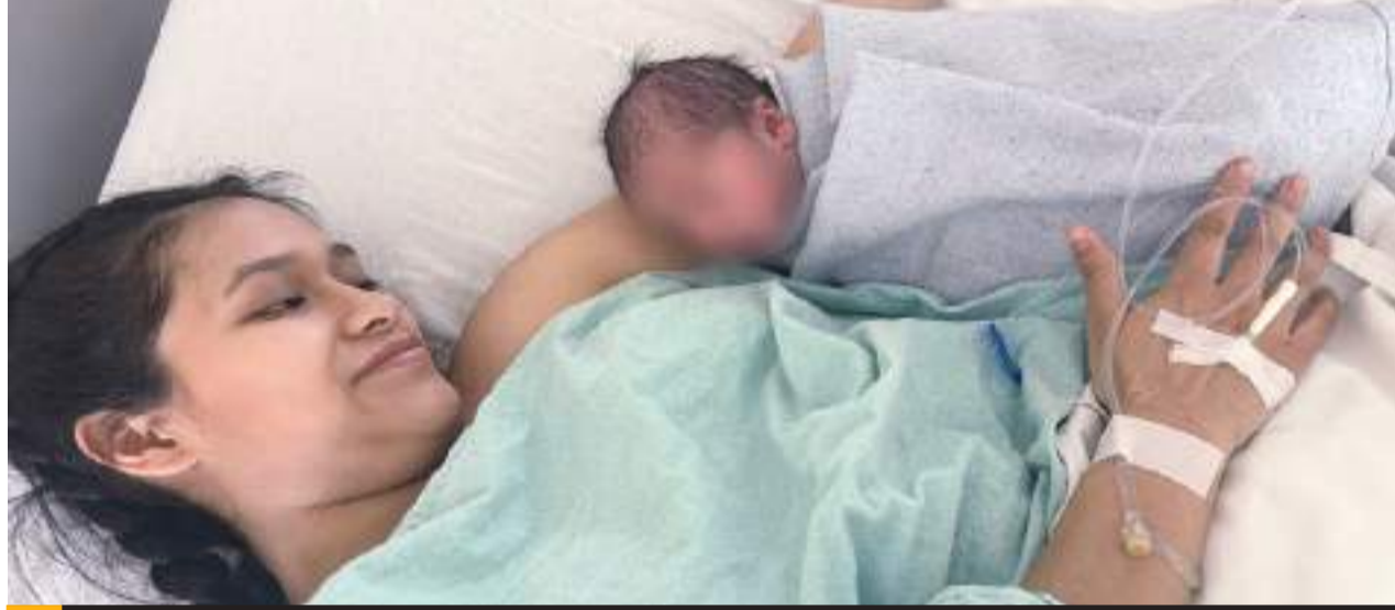
MEXICALI.- Nació a las 04:18 horas, de este miércoles 1 de enero, el primer bebé de 2025 en la entidad.

Se reitera que el IMSS en el HGPMF No.31 cuenta con áreas de Urgencias, Atención Médica Continua y hospitalización las 24 horas del día, los 365 días del año, con la finalidad de salvaguardar el bienestar materno-infantil.