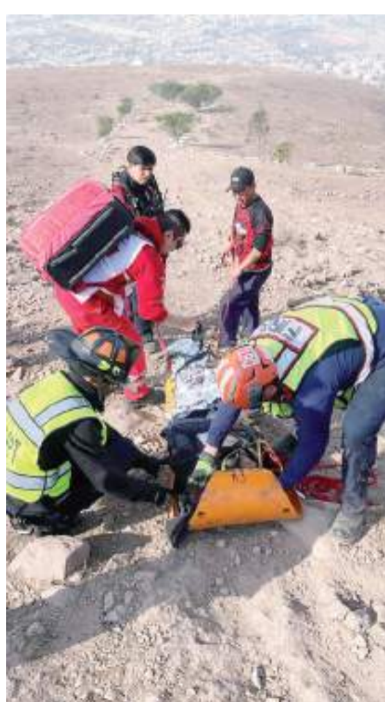
TIJUANA.- Saldo blanco dejó jornada de 66 incidentes en la ciudad, sólo una persona fue reportada sin vida, pero por fallecimiento natural (enferma), informó la dirección de Bomberos.

Por último, se atendió un incendio en un restaurante de comida japonesa ubicado en la zona de los módulos de Otay Centenario, ahí los traga humo lograron sofocar las llamas en el área de la cocina; sin personas lesionadas.