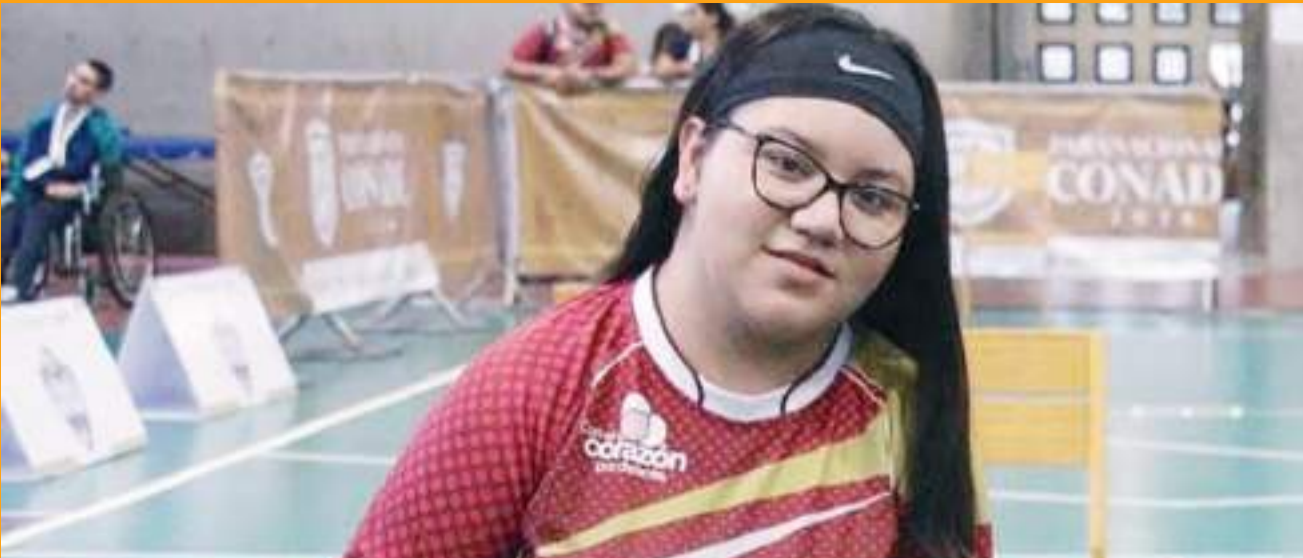
En el 2024, la ensenadense ganó la medalla de plata individual, de la clase BC2, en la "New Taipei City 2024 World Boccia Cup".