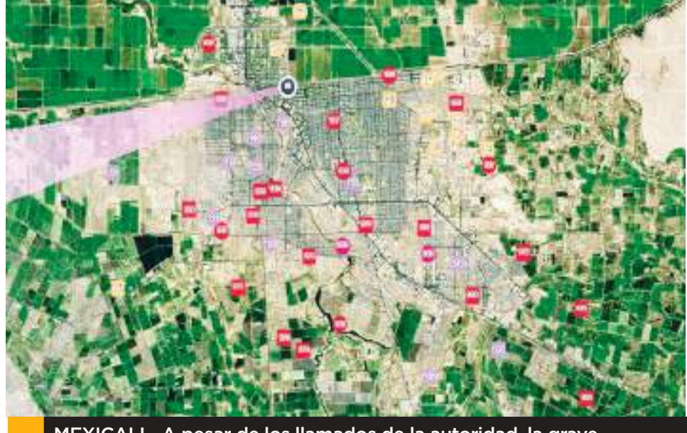
MEXICALI.- A pesar de los llamados de la autoridad, la grave contaminación continúa en la ciudad.

Por su parte, el gobierno de Mexicali, alertó sobre las condiciones ambientales, representando un riesgo para los menores de edad, adultos mayores, personas con afecciones cardíacas y respiratorias, además de evitar actividades en el exterior, el uso de mascarilla, cerrar puertas y ventanas.