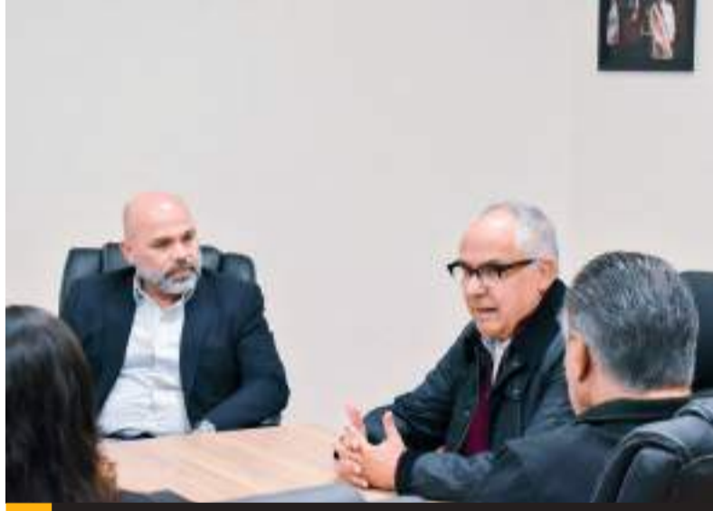
MEXICALI.- Para el gobierno de BC es muy importante la estrecha comunicación de la CLB con las familias de personas desaparecidas, como parte de su política de gobierno.