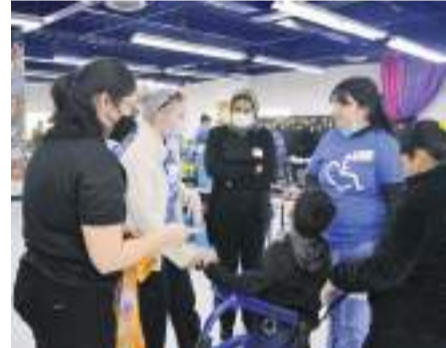
TIJUANA.- Lanza la Fundación para los Niños de las Californias, del Hospital Infantil de las Californias (HIC), la campaña "Donar para Soñar" para apoyar a pacientes infantiles.

El Hospital Infantil de las Californias, recordó, inaugurado en 1994 en la ciudad de Tijuana, es una institución pionera en la región dedicada a brindar servicios médicos espe-