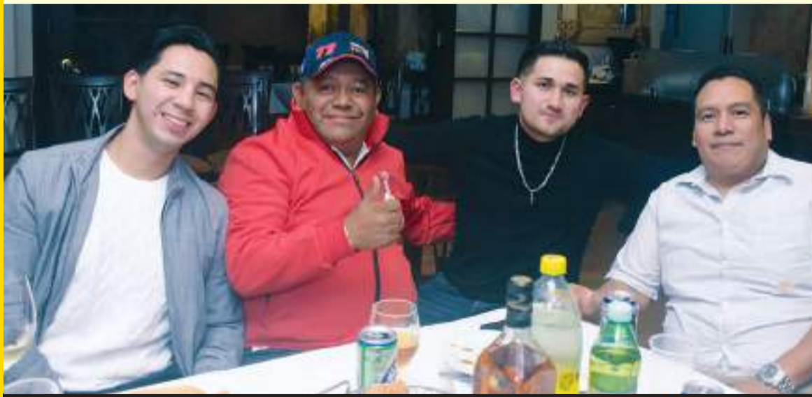
Al final del elegante brindis, los abrazos y los buenos deseos fueron muy expresivos entre las asistentes.