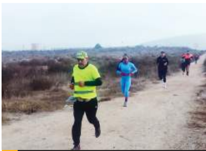
Los participantes se reunieron en Playa Conalep.