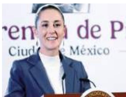
MEXICALI CLAUDIA SHEINBAUM PARDO

Entrega vivienda a damnificados por deslizamientos.