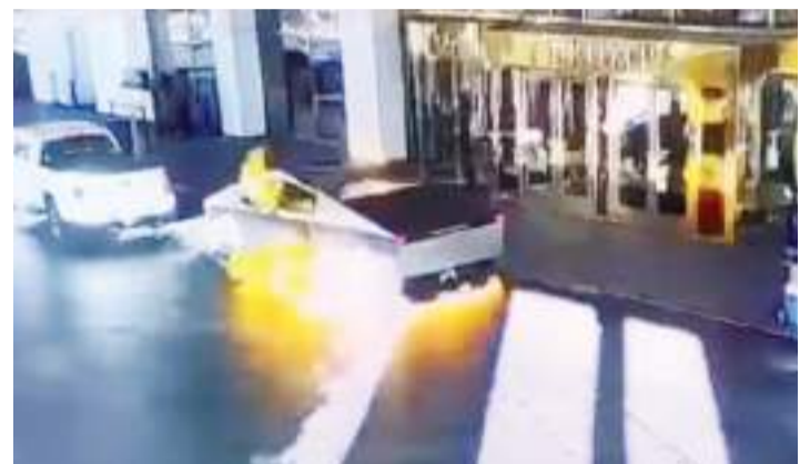
LAS VEGAS, NEVADA.- Cámaras de vigilancia del hotel capturaron el momento del estallido que terminó con la vida de una persona que se encontraba al interior del vehículo.

El dueño de Tesla, Elon Musk, expuso en su cuenta de X que al momento del incidente el Cybertruck se encontraba en buen estado, por lo que confirmó la presencia de algún explosivo al interior.