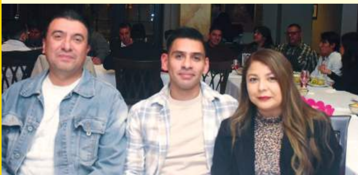
Otro de los detalles de la ocasión fue el mensaje de buenos deseos y afecto al grupo de trabajadores.