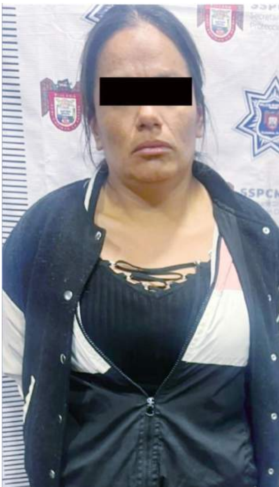
TIJUANA.- Claudia "N" y dos cómplices intentaron privar la libertad de dos personas; ella cayó pero dos sujetos lograron huir. Las víctimas fueron liberadas por oficiales municipales.

Asimismo, al verificar el automóvil, arrojó contar con reporte de robo, mientras que la mujer detenida fue turnada ante la autoridad competente para dar inicio a la carpeta de investigación correspondiente.