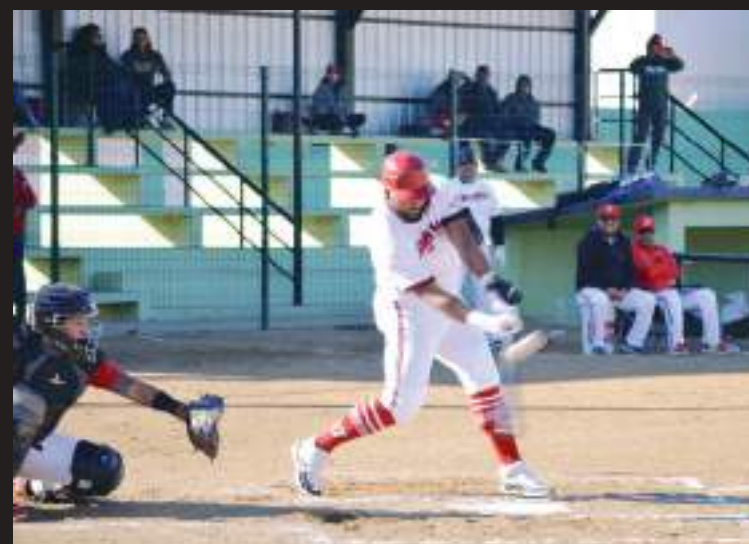
Nacionalistas expondrán su invicto ante los aguerridos Titanes del Valle de la Trinidad.