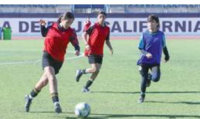
La Asociación Estatal de Fútbol y el INDE BC trabajan en equipo.