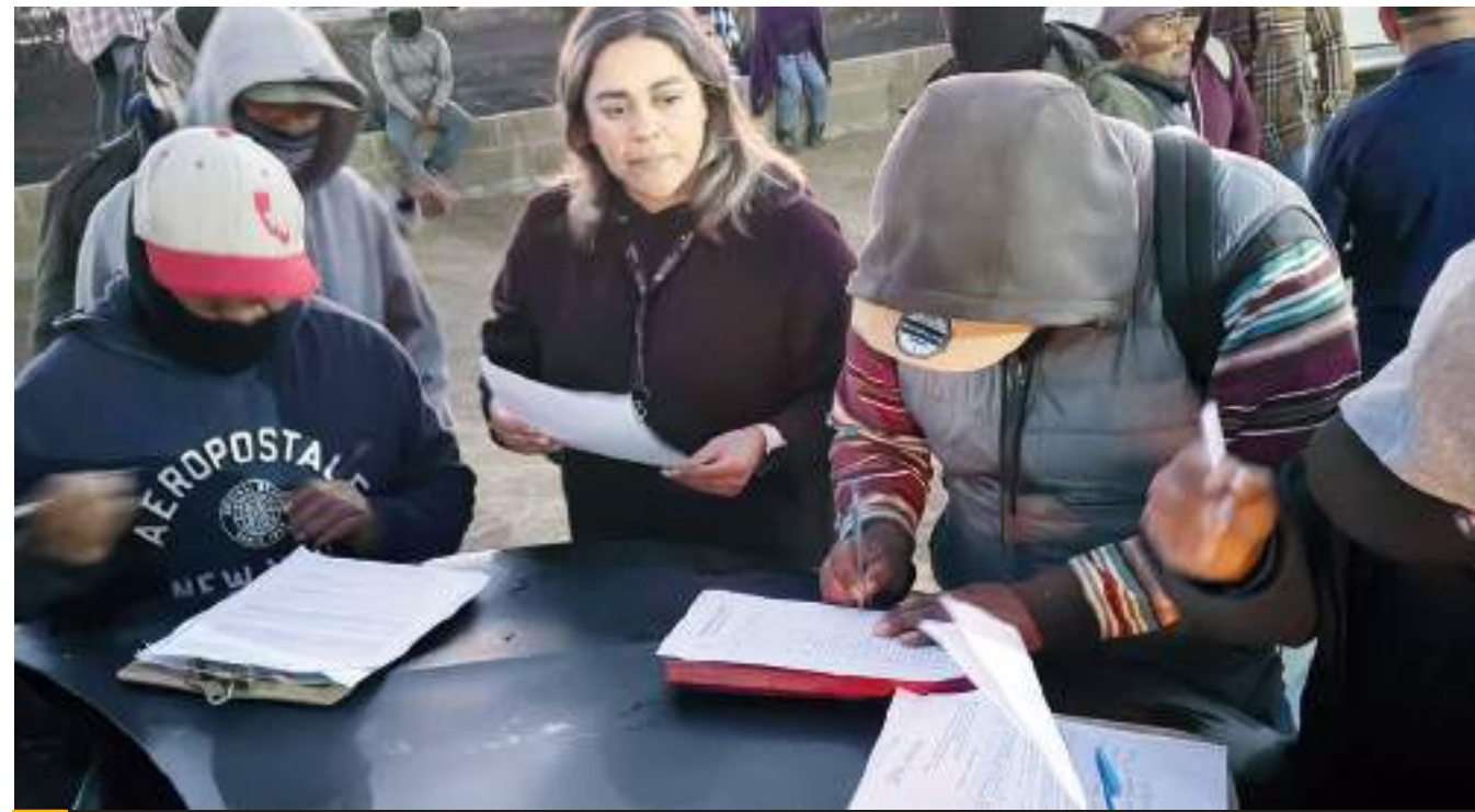
SAN QUINTÍN.- Tras acuerdo entre el gobierno del Estado y las y los trabajadores agrícolas, se logró la liberación de la carretera Transpeninsular.

Resaltó la importancia de la educación como herramienta de transformación social y reiteró que está convencida de que la educación es el camino para construir un futuro mejor. Por eso, seguirá trabajando para ampliar las oportunidades de aprendizaje para todos los rosaritenses.