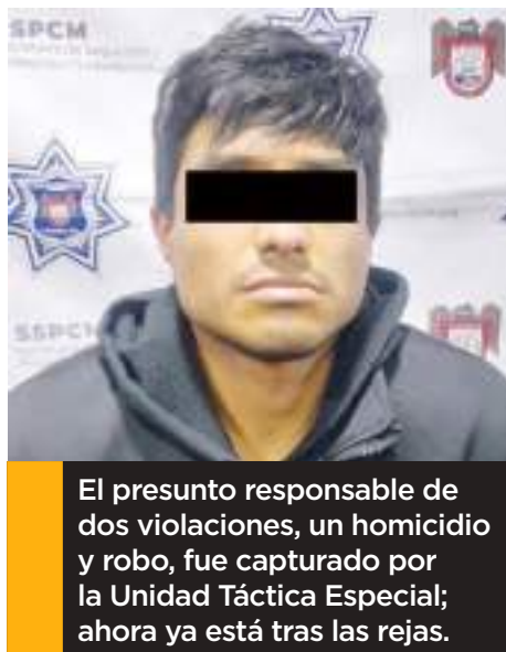
El presunto responsable de dos violaciones, un homicidio y robo, fue capturado por la Unidad Táctica Especial; ahora ya está tras las rejas.

Finalmente, durante la tarde del pasado viernes en la colonia Obrera 3era Sec-