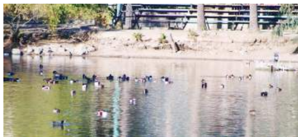
TIJUANA.- Levantan cuarentena en el Parque de La Amistad de Tijuana.