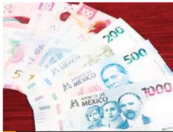
MEXICALI.- El gobierno de México debe estar atento a las acciones que realice Donald Trump en el ámbito económico dice el IMCP.