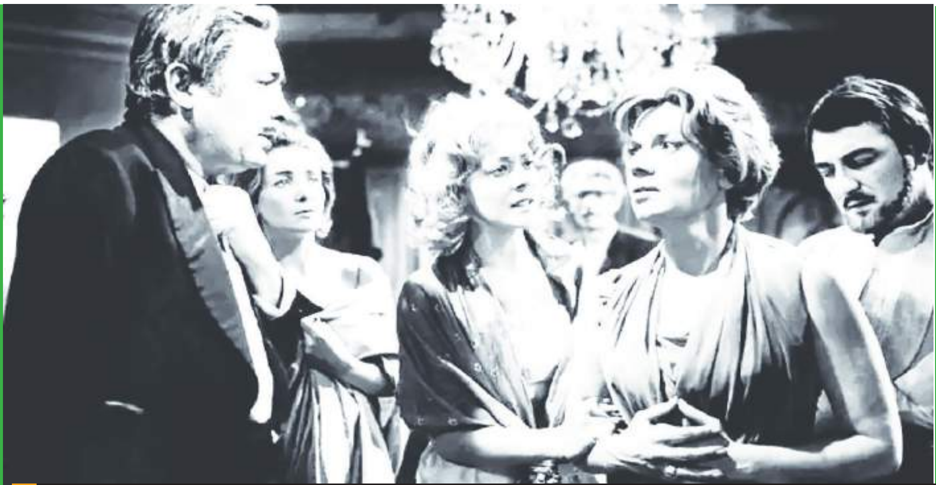
El ángel exterminador.