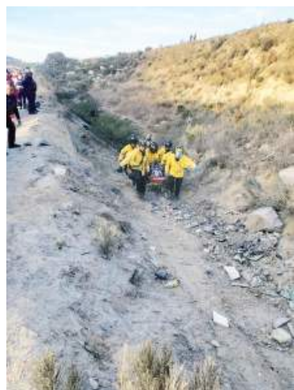
TIJUANA.- El rescate de las personas fue complejo debido al difícil acceso en la zona.

Bomberos informaron que el estado de salud de los lesionados es estable y que la causa del accidente aún está siendo investigada.