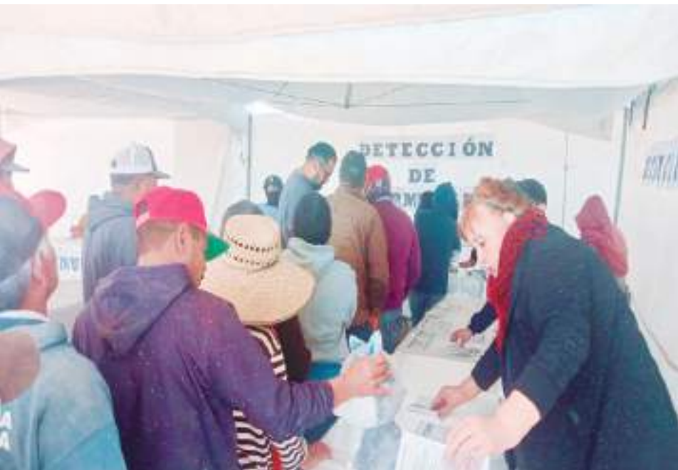
MEXICALI.- La secretaria de Salud ejerciendo acciones para cuidar la salud de los trabajadores agrícolas en el Estado.

El propósito de divulgar estos criterios es instruir a los jornaleros agrícolas para prevenir accidentes tanto en el trabajo como en sus hogares, incluso saber actuar de manera responsable en caso de presentarse una emergencia.