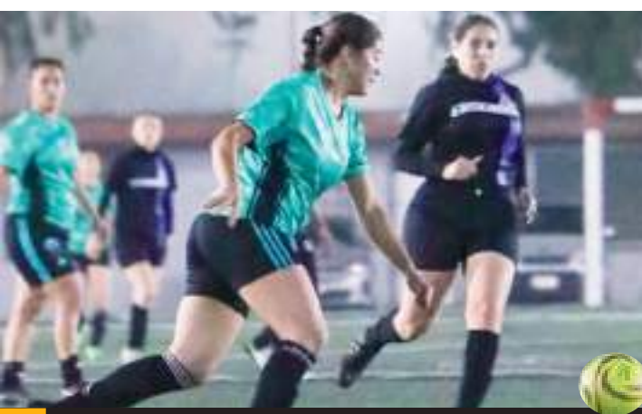
Fueron 20 jugadoras las convocadas.