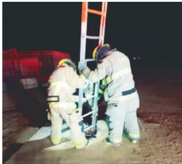
RESCATAN A PERRITO DE ALCANTARILLA

"Nuestra organización no realiza llamadas telefónicas, ni solicita autorizaciones de descuentos mediante ningún medio electrónico", concluyó.