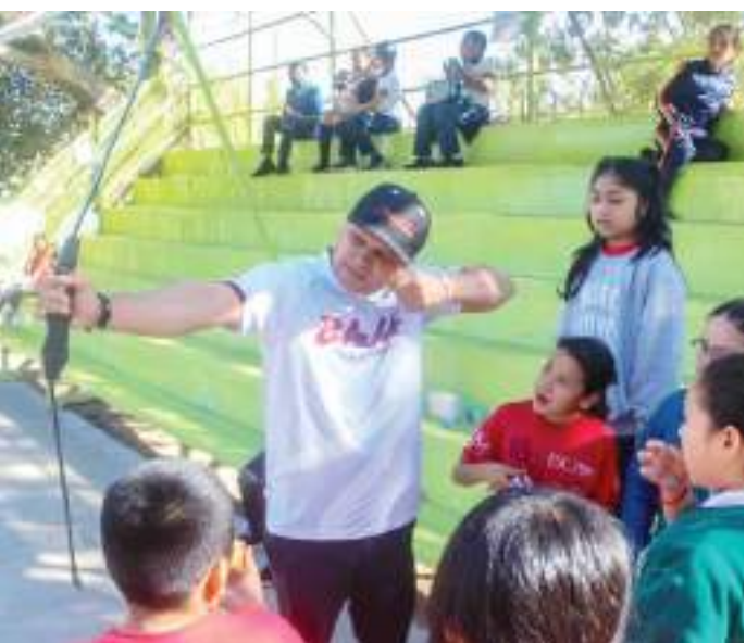
Los prospectos continuarán sus estudios en la Telesecundaria del CAR.

La primera jornada de detección se llevará a cabo el 15 de enero en la Secundaria Estatal #214, turno matutino, ubicada en el municipio de Tijuana, en la zona de Planicie Altiplano. Las jornadas concluirán el 13 de febrero en la escuela primaria "Miguel Alemán Valdez" de la Nueva Colonia Hindú, en el municipio de Tecate. En ambos casos, las actividades comenzarán a las 8:30 horas.