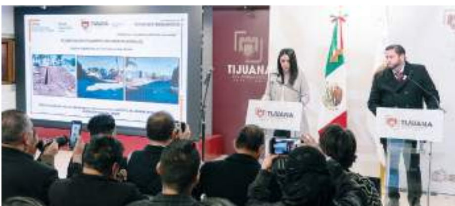
TIJUANA.- Durante este 2025, el Gobierno Municipal continuará trabajando en el impulso de obras que abonen a la transformación de la ciudad y el bienestar de la ciudadanía.

En total, han sido sacrificadas 4 aves para controlar la propagación de la enfermedad, y hasta el momento no se han registrado más casos positivos entre las aves del parque.