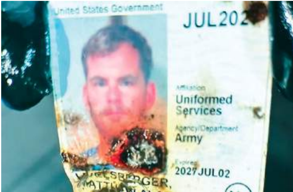
LAS VEGAS.- Esta fue una de las credenciales y tarjetas que las autoridades encontraron en el radio de la explosión.

Por último, aunque el Cybertruck en este caso, y el camión usado en el ataque de Nueva Orleans en el que murieron 14 personas se alquilaron en la misma aplicación digital, no consideran que ambos atentados guarden relación.