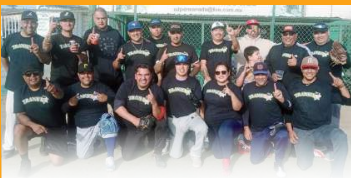
El equipo de Tránsito se coronó campeón de la bola bofa.