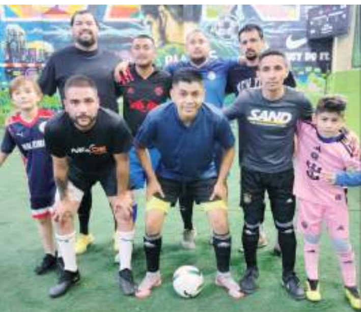
Pozos y Bombas ganó por la mínima de 8-7.