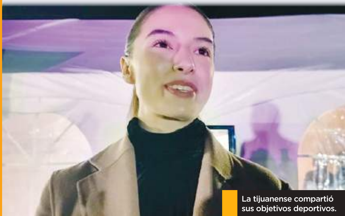
La tijuanaense compartió sus objetivos deportivos.

dad de realizar su preparación en Tijuana previo a los próximos Juegos Olímpicos, Souza declaró, "a mí me encantaría porque como mencionas la región es prácticamente igual, las condiciones se asemejan mucho a Los Ángeles. Yo creo que es una estrategia muy clave en nuestra preparación. La verdad sí es una energía muy padre el estar aquí en casa".