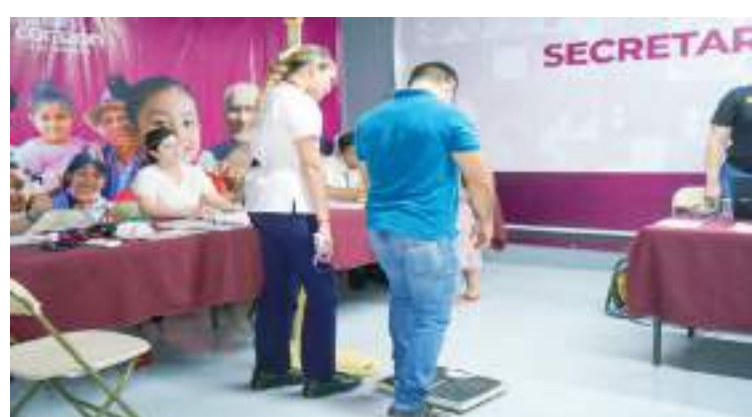
MEXICALI.- Con estas recomendaciones, la Secretaría de Salud en el Estado reitera su compromiso por promover la prevención y tratamiento oportuno de padecimientos, por el bienestar de las familias bajacalifornianas.

12.- Acudir a una consulta médica en los Centros de Salud Móviles en la comunidad: las llamadas "Caravanas de la Salud" ofrecen servicios gratuitos con tecnología de rayos X, laboratorio, electrocardiograma, farmacia, y seguimiento oportuno. Consulta sus ubicaciones en https://www.facebook.com/BC.SecretariaSalud .