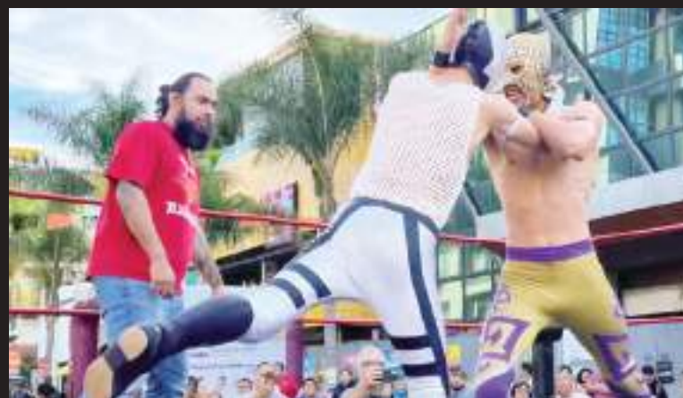
La actividad forma parte de los atractivos de la Villa Navideña del gobierno municipal.

Esta actividad es parte de los atractivos que le han dado vida a la Villa Navideña, que el pasado diciembre inauguró el Alcalde Ismael Burgueño con el propósito