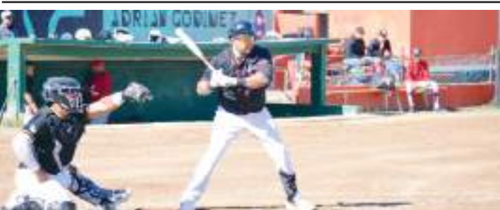
Este domingo se reanudan las actividades de la categoría de Primera Fuerza.