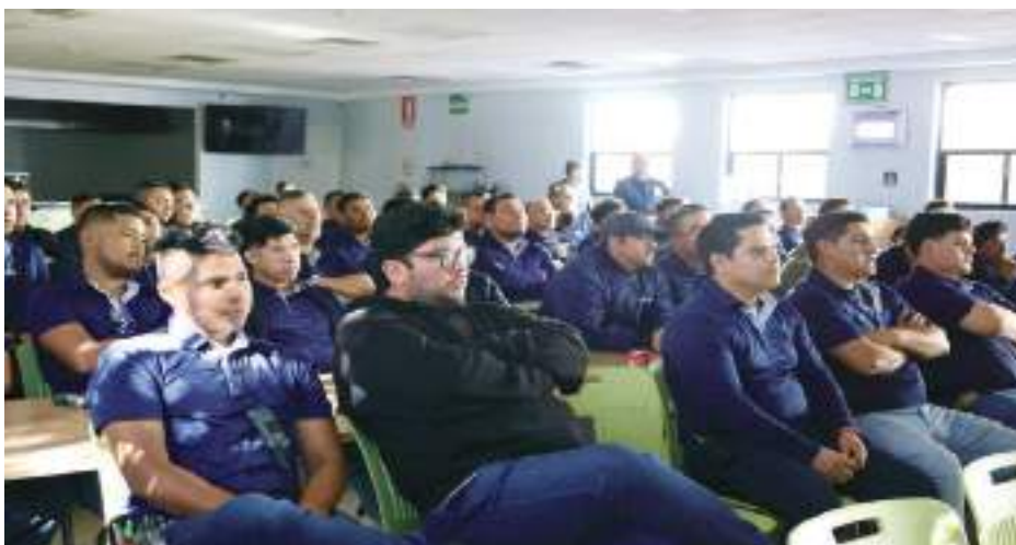
TIJUANA.- La Fiscalía General del Estado se acerca a la ciudadanía para informar sobre los diversos programas disponibles tanto en oficinas como en línea.

En el evento, los representantes de la FGE reafirmaron su compromiso de colaborar la institución en acciones que beneficien a la población y a todos los bajacalifornianos.