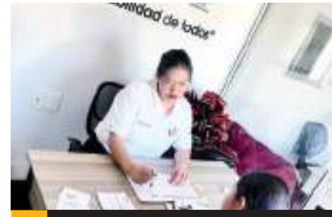
TIJUANA.- DIF Tijuana acercará los servicios de asesoría psicológica, jurídica y trabajo social con la unidad "DIF en Movimiento".

trabajo altruista de personas que contribuyen al desarrollo de Tijuana. "DIF en Movimiento", cuenta con tres cubículos completamente equipados para que los especialistas ofrezcan atención personalizada a quienes requieran del servicio, en especial los adultos mayores y las personas con capacidades diferentes.