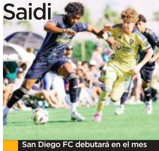
San Diego FC debutará en el mes de febrero en la MLS.