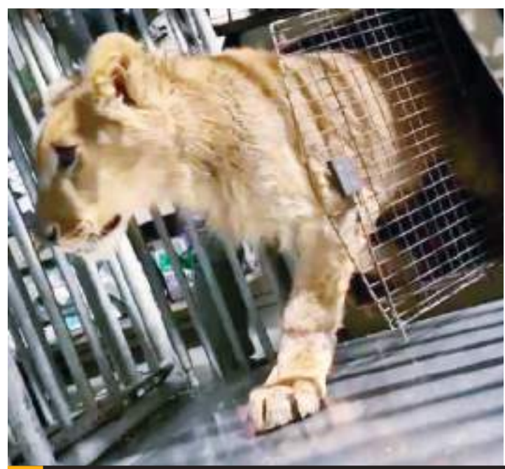
MEXICALI.- El pequeño león rescatado en Tijuana ya se encuentra en cuarentena en el Bosque y Zoológico de la ciudad.