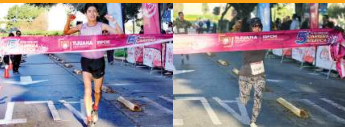
Rolando Real se llevó la rama varonil con un tiempo de 16 minutos y 17 segundos.