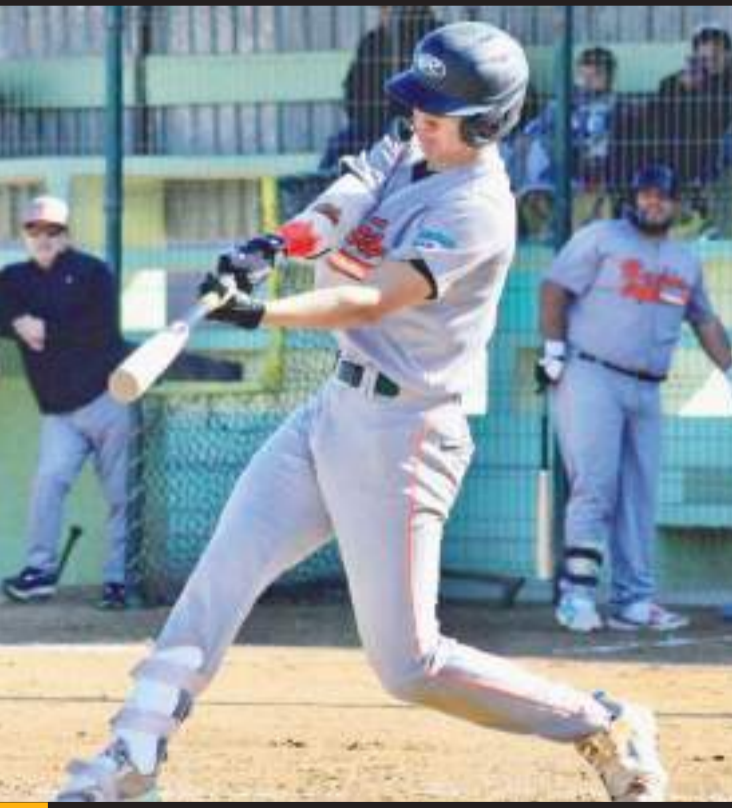
Veterinaria Bahía tuvo que remar contra la corriente para vencer a Rancho Arroyo.

MANEADERO.- La novena de Veterinaria Bahía tuvo que remar contra la corriente para poder vencer ocho carreras por cuatro a Rancho Arroyo, al reanudarse las actividades del campeonato oficial selectivo 2024-25 denominado “Ramiro Gutiérrez Silva” de la liga Rural de beisbol de Maneadero.