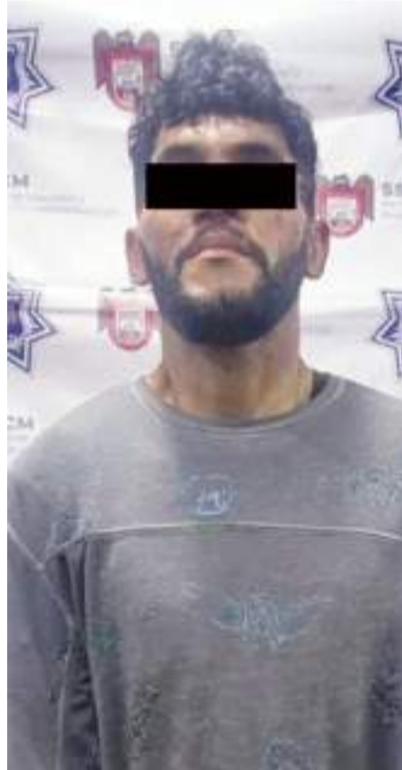
TIJUANA.- La Secretaría de Seguridad exhorta a denunciar de manera inmediata cualquier situación de riesgo, a través del número 911.

En seguimiento, el hoy detenido fue turnado ante la autoridad competente para dar inicio a la carpeta de investigación correspondiente.