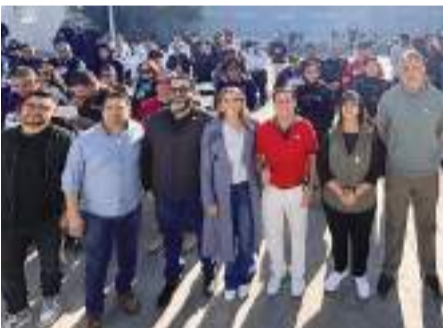
PLAYAS DE ROSARITO.- La Alcaldesa Rocío Adame Muñoz reconoció y agradeció a los oficiales, su entrega y sacrificio diario.

PLAYAS DE ROSARITO.- En el marco del Día Internacional del Policía, el 10mo. Ayuntamiento de Playas de Rosarito, encabezado por la presidenta municipal, Mtra. Rocío Adame Muñoz, rindió un emotivo homenaje a los valientes elementos de la Secretaría de Seguridad Ciudadana. "Nuestros policías son los verdaderos héroes de nuestra ciudad. Día a día ponen en riesgo sus vidas para garantizar nuestra seguridad. Este gobierno municipal está comprometido a brindarles todo el apoyo y los recursos necesarios para que puedan desempeñar su labor de manera eficiente", afirmó Adame Muñoz. La alcaldesa reafirmó el compromiso de la administración municipal de brindar a los agentes las herramientas y el apoyo necesarios para