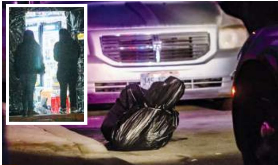
TIJUANA.- Los cuerpos sin vida de dos personas fueron abandonados en la vía pública, y otro hombre fue localizado muerto por disparos de arma de fuego en un comercio; en lugares y tiempos distintos.

Por otro lado, el cuerpo de otra persona fue abandonado en zona residen-