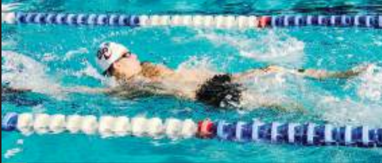
Durante la semana quedarán abiertos registros y reinscripciones.

Los requisitos para inscribirse son presentar un certificado