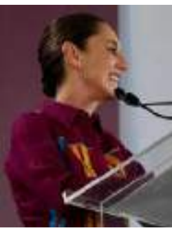
MEXICALI CLAUDIA SHEINBAUM PARDO...

Honestidad y justicia, no mano dura en seguridad.