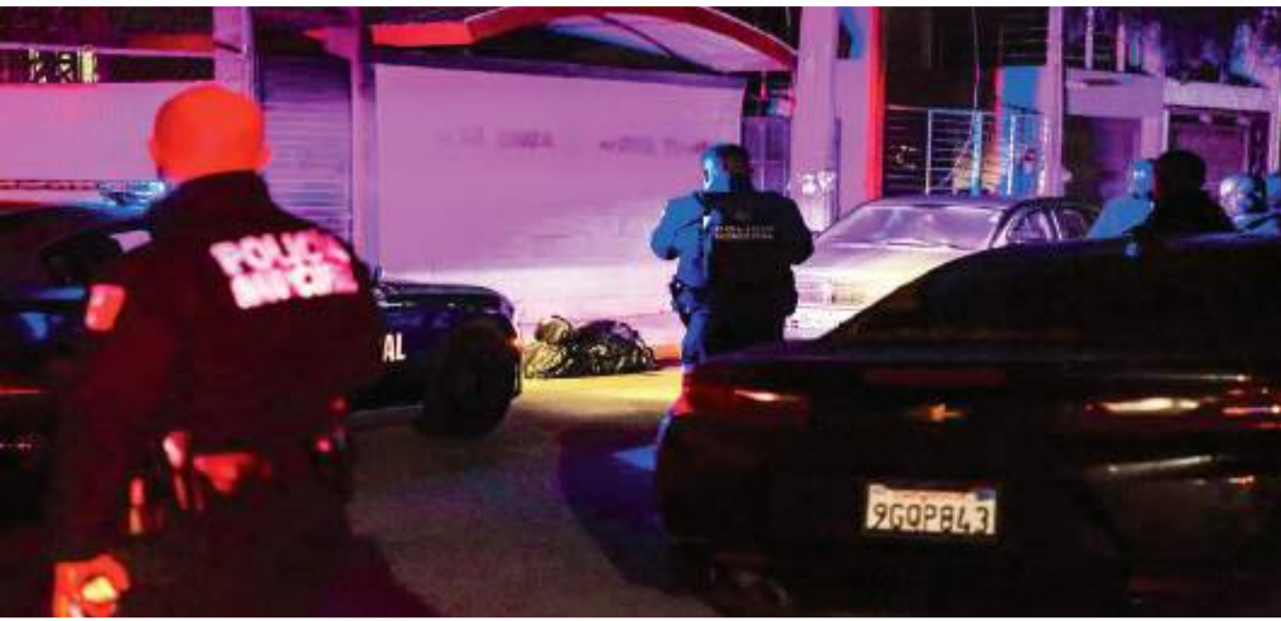
KAREN CASTAÑEDA/BORDER ZOOM