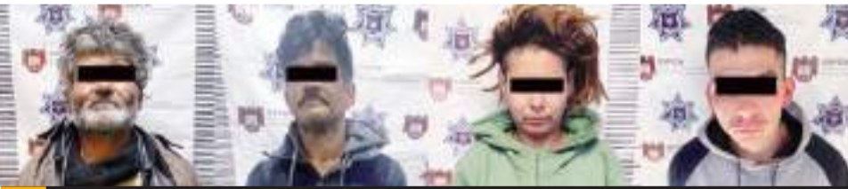
TIJUANA.- En todos los casos, los hoy detenidos fueron turnados ante la autoridad competente para dar inicio a las respectivas carpetas de investigación.

El último crimen del sábado quedó registrado en la segunda sección de la colonia Laurel, cuando un masculino fue ejecutado a balazos en el momento que se encontraba adentro de una tienda Six, de acuerdo a la tarjeta informativa de la AEI. Los restos del sujeto, de 40 años de edad, permanecen en el Semefo en calidad de desconocido.