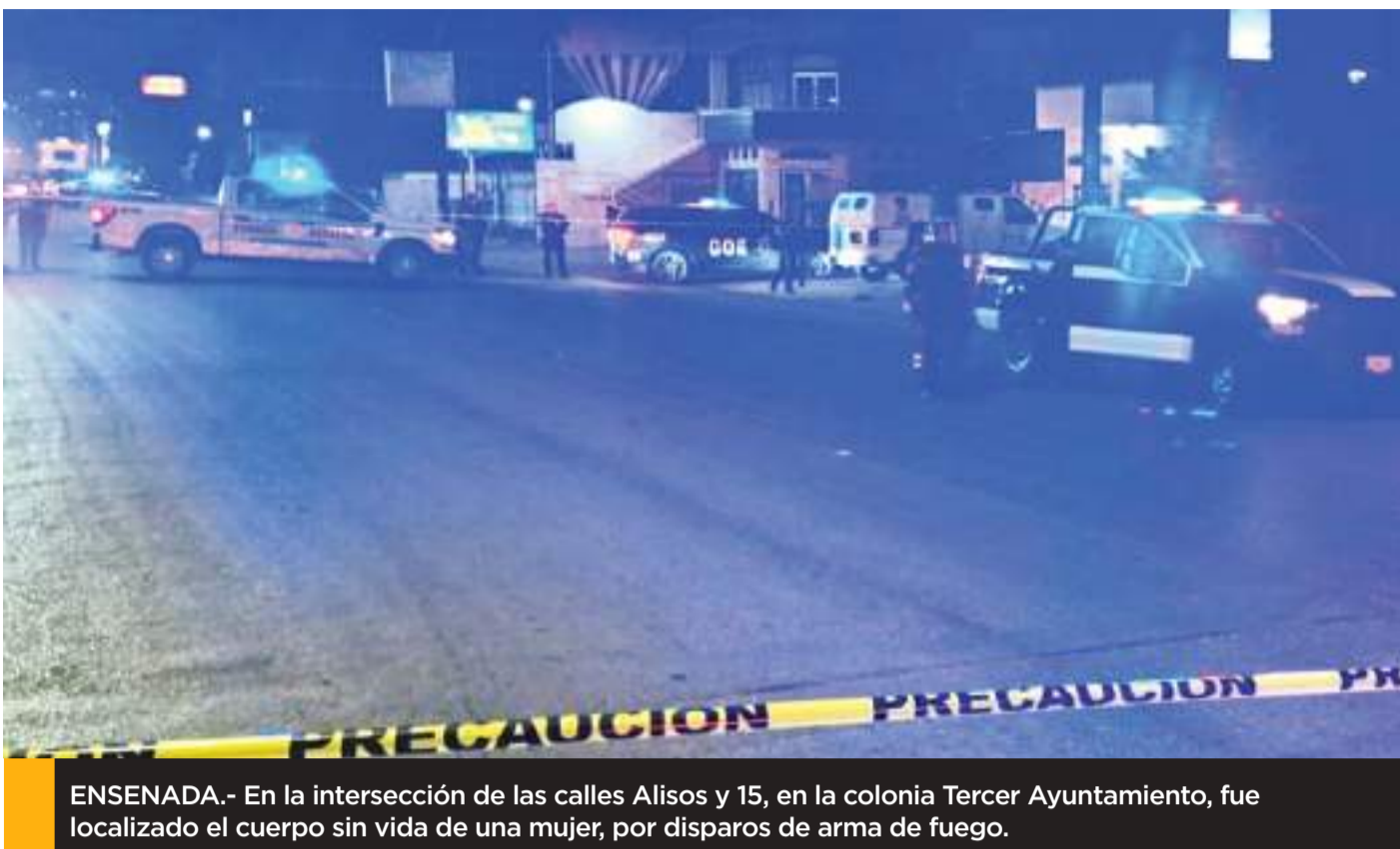
ENSENADA.- En la intersección de las calles Alisos y 15, en la colonia Tercer Ayuntamiento, fue localizado el cuerpo sin vida de una mujer, por disparos de arma de fuego.

Con esto, la DSPM refuerza el compromiso con la construcción de una comunidad más segura y participativa. Además, se busca fomentar un entorno en el que la denuncia sea vista como una herramienta esencial para garantizar la paz social y el orden público en Ensenada.