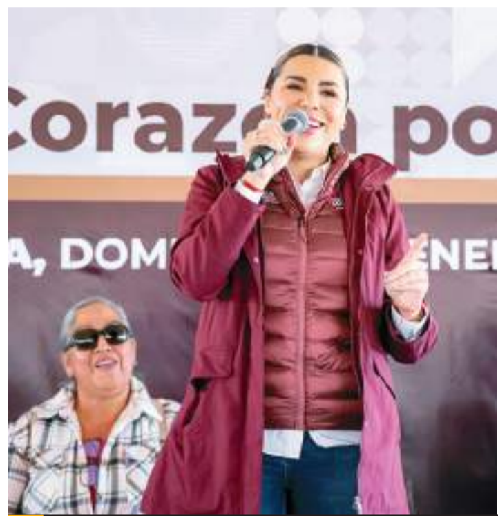
TECATE.- La gobernadora de Baja California, Marina del Pilar Ávila Olmeda encabezó la primera jornada "Con el Corazón por Delante" del año en curso.

nó una serie de obras que están siendo impulsadas en puntos como la Nueva Colonia Hindú, el Estadio Manuel Ceseña, así como la