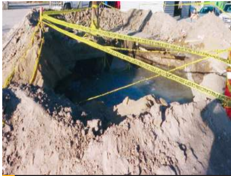
TIJUANA.- El socavón se ve a simple vista y ya se encuentra acordonado por la CESPT.

"Sólo pido más congruencia, cordura y empatía hacia la ciudadanía de