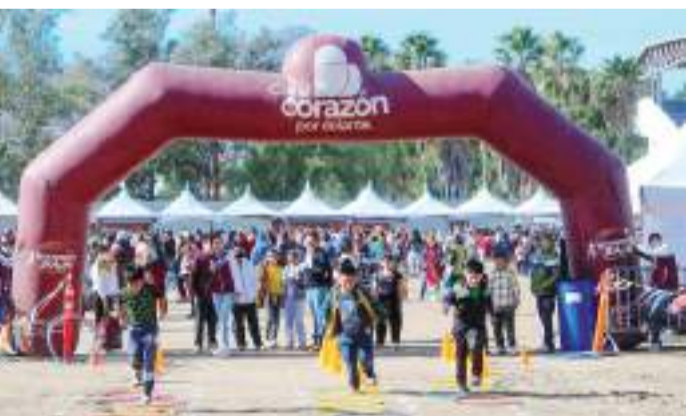
En Tecate se llevó a cabo el magno evento en el que la paraestatal se sumó.

El evento también fue la ocasión ideal para compartir la tradicional rosca de reyes y rifar regalos entre los asistentes.