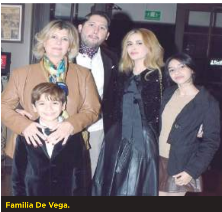
Familia De Vega.