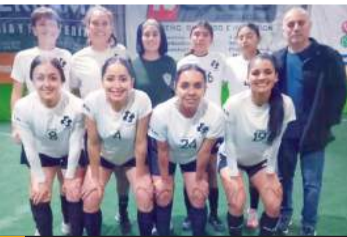
El líder invicto de la Primera Fuerza, Farmacia Suprema/La Juguería buscará pegar primero en semifinales.