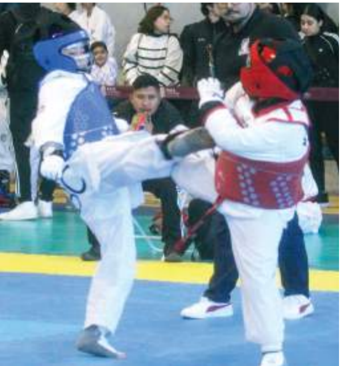
El campeonato estatal se llevará a cabo en el CAR Tijuana el 8 de febrero.

La selección de taekwondo del año pasado en los Nacionales Conade obtuvo 4 medallas de oro, 3 de plata y 6 de bronce.