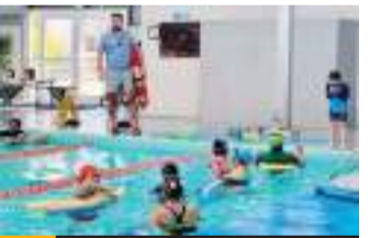
Invitan a la comunidad para inscribirse en los programas de actividades acuáticas.

Indicó que mensualmente participan entre 400 y 500 personas en todos los programas que se ofrecen, lo que refleja la gran aceptación de estas actividades por parte de la comunidad.