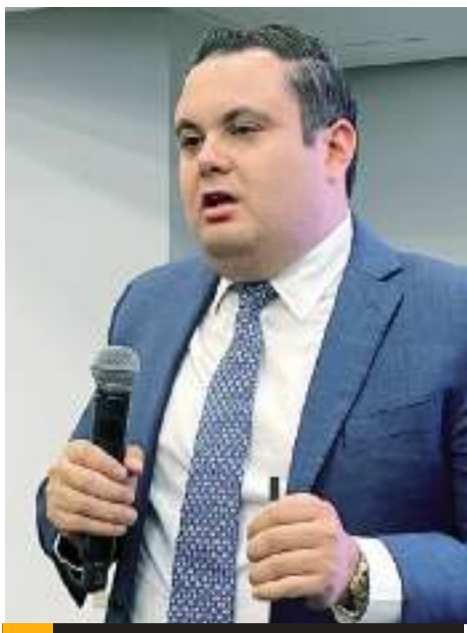
TIJUANA.- Se publicó en el Diario Oficial de la Federación (DOF) Resolución Miscelánea Fiscal Para 2025, y sus Anexos.