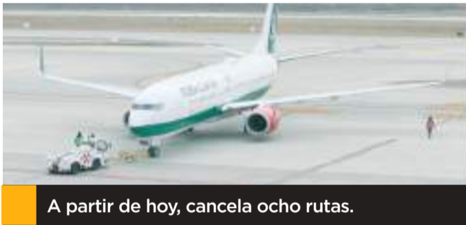
A partir de hoy, cancela ocho rutas.