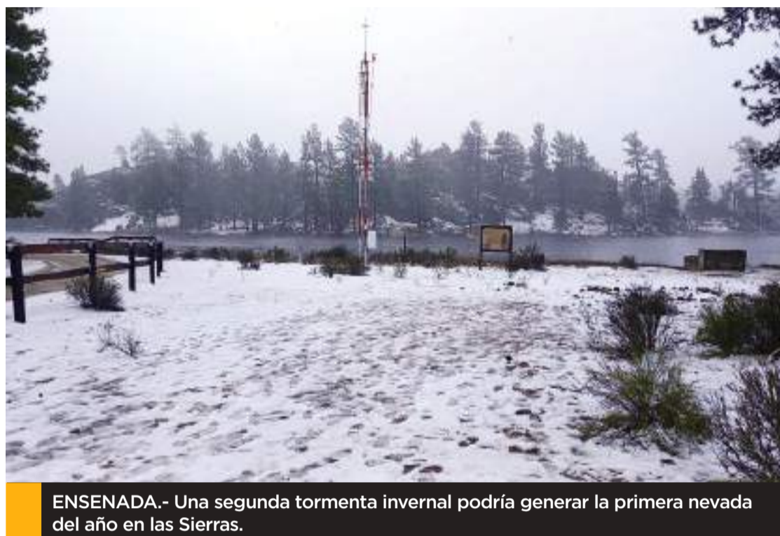
ENSENADA.- Una segunda tormenta invernal podría generar la primera nevada del año en las Sierras.

Por último, el director de la Coordinación Municipal de Protección Civil, también exhortó a la población a permanecer al pendiente de la actualizaciones climatológicas que emitan las autoridades en los próximos días.