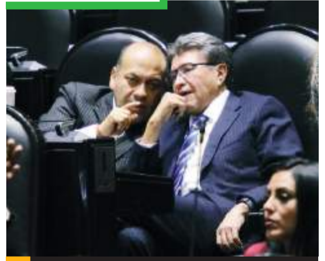
Apunta 4T a INE e Infonavit.