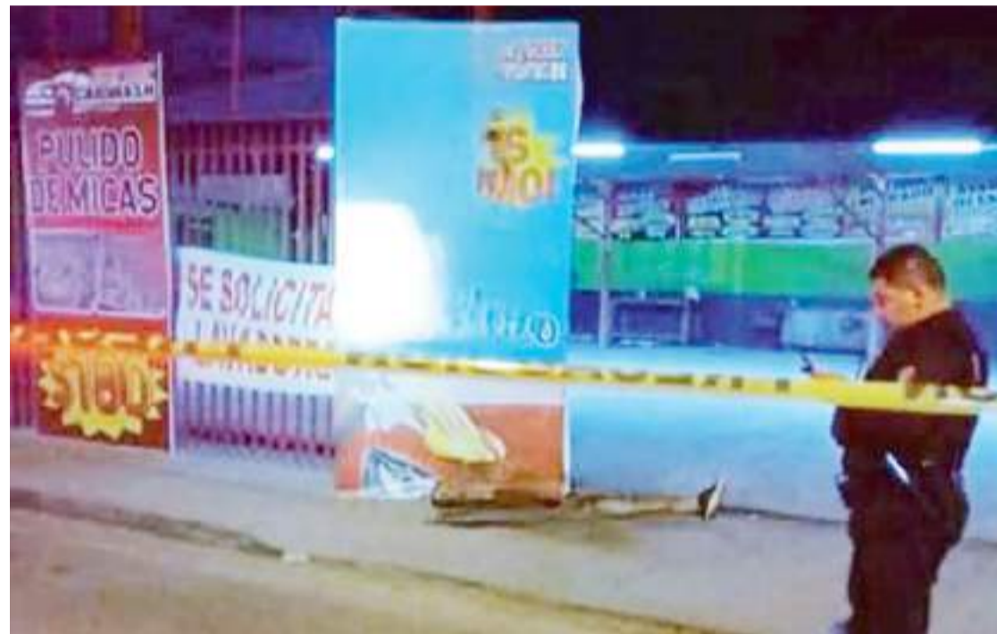
MEXICALI.- En el 2024 se registraron 227 asesinatos en esta Ciudad, de los cuales 20 fueron mujeres, siendo el mes de octubre el de mayor incidencia de homicidios.

Agregó que han reforzado con el apoyo de autoridades estatales y federales la seguridad en el Valle de Mexicali, tanto la zona Sur como la parte Norte.