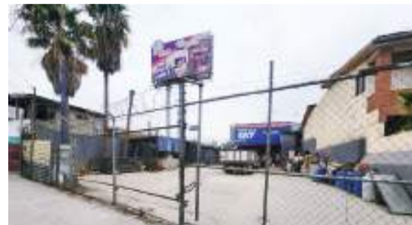
TIJUANA.- El operativo de cateo se ejecutó para intervenir un predio abandonado ubicado en el bulevar Simón Bolívar.

Durante esta operación, las autoridades inspeccionaron el lugar en busca de indicios relacionados con delitos de maltrato y crueldad animal,