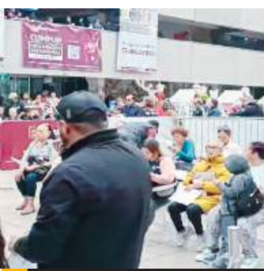
TIJUANA.- Desde los primeros días se ha observado una copiosa participación de los ciudadanos en el pago del impuesto predial en Palacio Municipal.