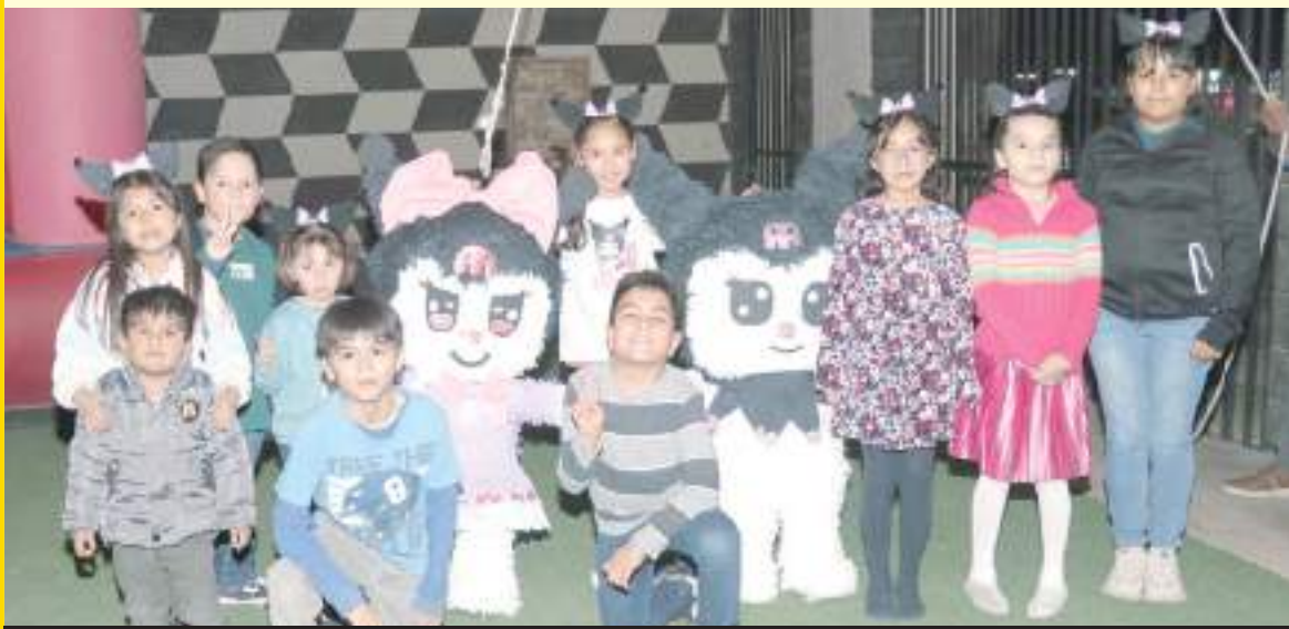
Niños, presentes en el festejo.