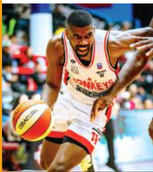
La serie inaugural en casa está programada para el 14 de marzo.