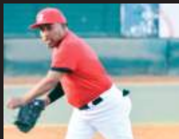
Diablos y Motel América es uno de los duelos de la última fecha del rol regular.

Uno de los duelos más atractivos de la jornada tendrá lugar en el campo Alberto Mancilla, donde se enfrentarán las novenas de Motel América y Diablos.