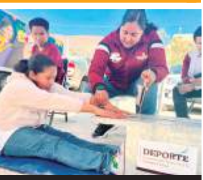
El equipo de metodólogos y entrenadores aplicará pruebas básicas.