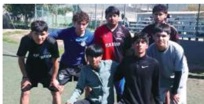
Este sábado se pondrá en marcha el torneo Juvenil 2025.