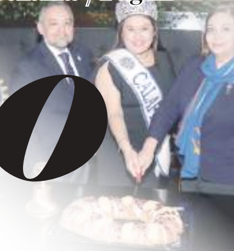
Cortando la tradicional rosca.

El evento se celebró con la presencia de la mesa directiva.