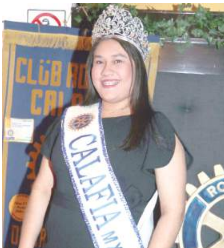
Reina del club.