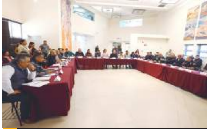
La reunión se realizó este jueves.

Así como el H. Cuerpo de Bomberos, la Dirección de Seguridad Pública Municipal, la Unidad Municipal de Protección Civil, el Patronato de las Fiestas del Sol, la Coordinación de Gabinete del XXV Ayuntamiento de Mexicali, CFE, el Hospital Almater, Cruz Roja Mexicana, Servicios de Médicos Municipales, las Águilas de Mexicali e INDE BC.