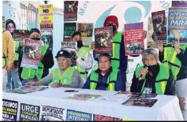
TIJUANA.- Albergues de migrantes se preparan para recibir a los mexicanos que sean deportados en el próximo gobierno de Donald Trump.