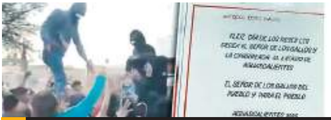
Reparten juguetes en nombre del 'Mencho', en Aguascalientes.