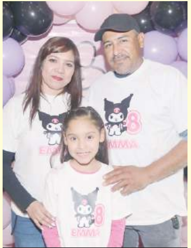
Los papás de la cumpleañera.