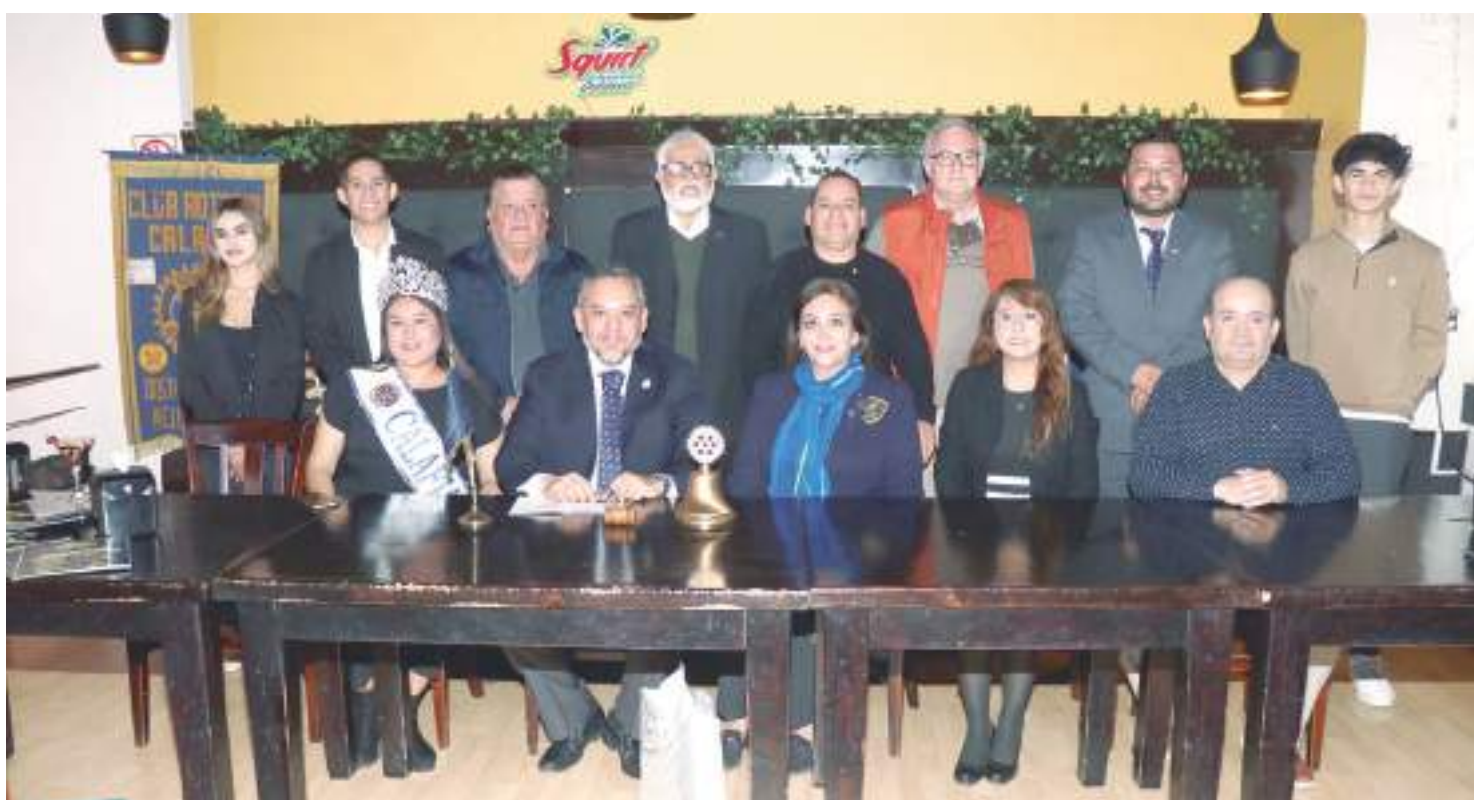
El Club Rotario, con la gobernadora de distrito 4100 y jóvenes de Rotarac.

EL EVENTO SE CELEBRÓ CON LA PRESENCIA DE LA MESA DIRECTIVA