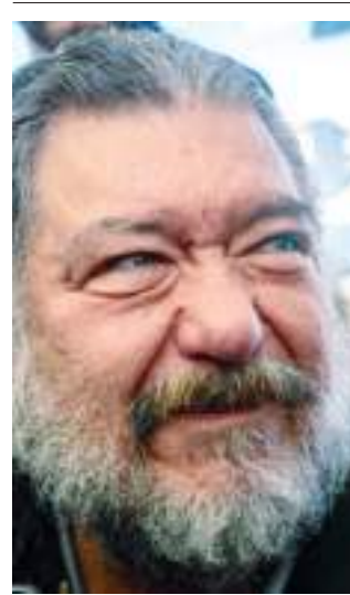
TIJUANA JORGE HANK RHON...