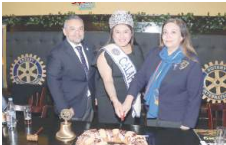
Cortando la tradicional rosca.