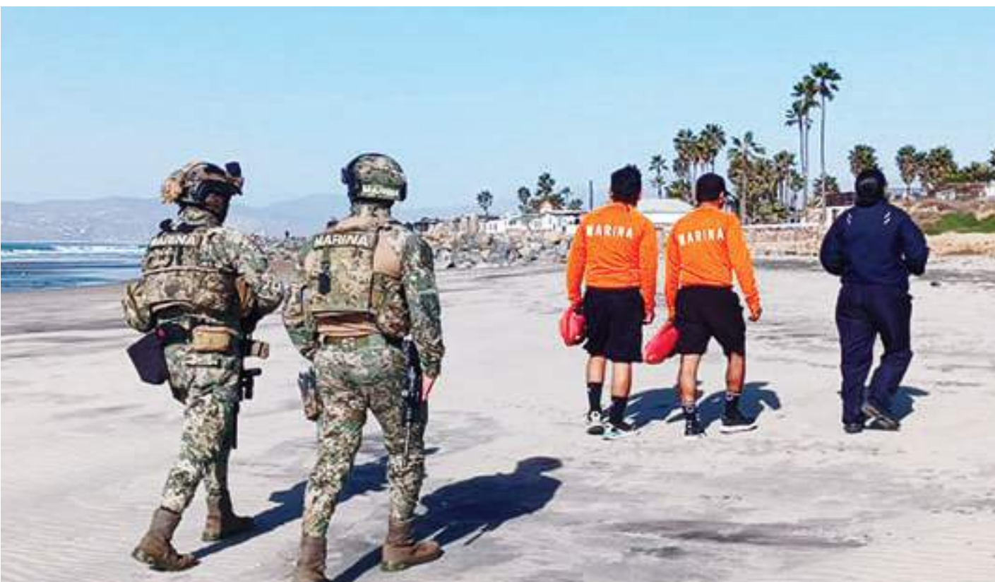
ENSENADA.- Durante la "Operación Salvavidas Invierno 2024", participó la Estación Naval de Búsqueda, Rescate y Vigilancia Marítima (ENSAR ENSENADA).

Tras el hallazgo, el hombre de 39 años de edad, fue trasladado a la Estación Central, para más tarde, junto con la navaja ser puesto a disposición de la Fiscalía General del Estado, para la investigación correspondiente por el probable delito de portación de arma prohibida.