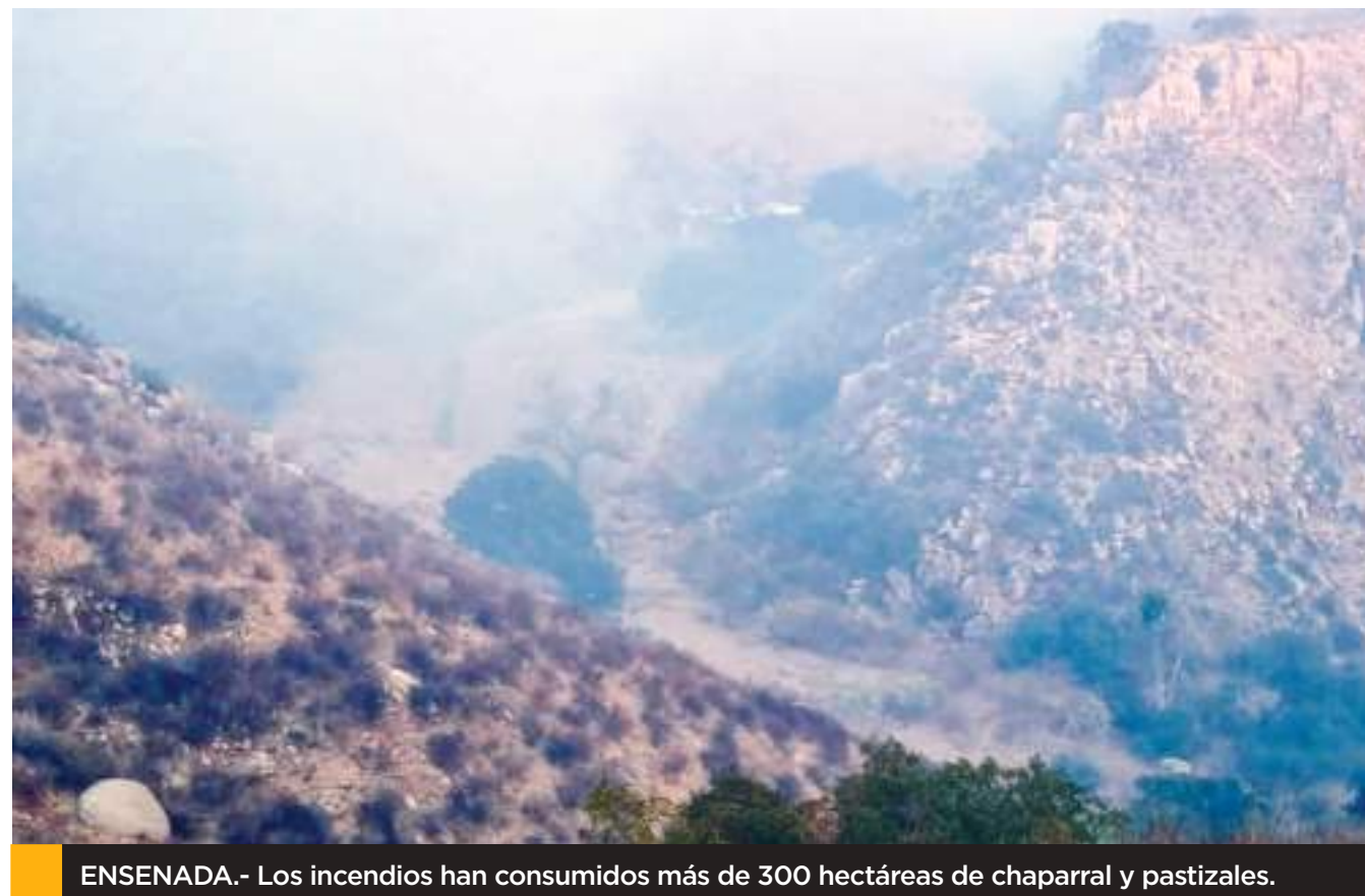
ENSENADA.- Los incendios han consumidos más de 300 hectáreas de chaparral y pastizales.

Se prevé que la iniciativa de reforma Constitucional en materia electoral sea aprobada en el próximo período ordinario de sesiones en la Cámara de Diputados, que inicia el 1 de febrero de 2025.