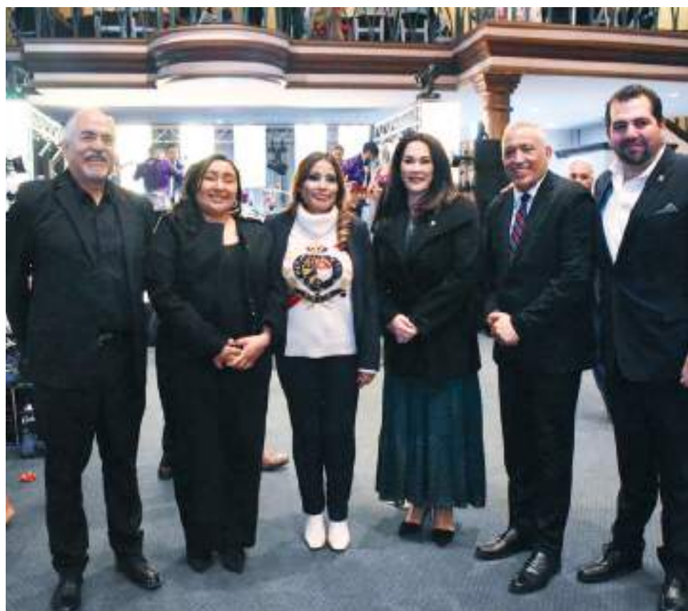
ENSENADA.- La Dirección de Seguridad Pública Municipal (DSPM) llevó a cabo un evento para reconocer y celebrar la labor de los oficiales.

Hizo un llamado a las autoridades y a la sociedad para abordar de manera conjunta los desafíos del sector y evitar la politización del tema, enfocándose en soluciones que mejoren la calidad del transporte público en beneficio de la comunidad.