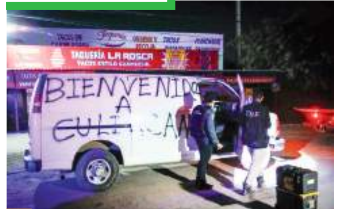
Con Culiacán como el epicentro de la batalla intestina del cartel de Sinaloa, los homicidios y levantones siguen incrementando sus cifras, en contraste con los datos de la SSPC.