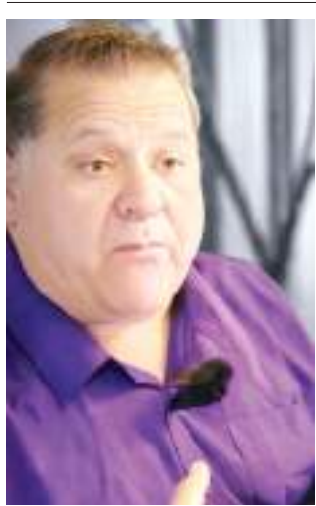
ENSENADA HUMBERTO VALDÉS ROMERO...

Por cierto, que la gobernadora MARINA DEL PILAR anunció que, en Tecate, la avenida México llevaba 12 años inconclusa desde el 2013, hasta ahora, que el Gobierno del Estado se está encargando de hacer esta pavimenta-