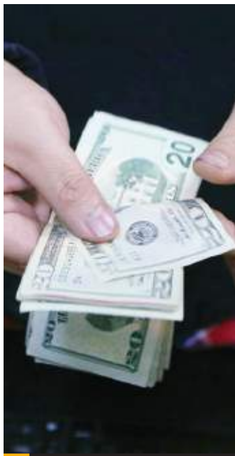
Mantiene la divisa americana, su paso ascendente.

Este panorama brindaría al banco central mayor confianza para continuar con su ciclo de recortes, evento que acortaría la brecha con la tasa de interés estadounidense.