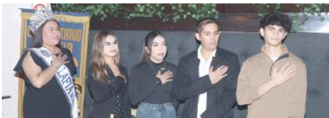
Jóvenes de Rotarac tomando protesta.