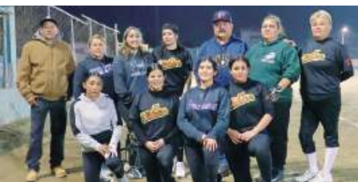
El evento contará con la participación de Ensenada y Rosarito.

El certamen se llevará a cabo este domingo a partir de las 8:00 a.m. en el campo Manuel Mercado y se jugará bajo el formato de eliminación directa.