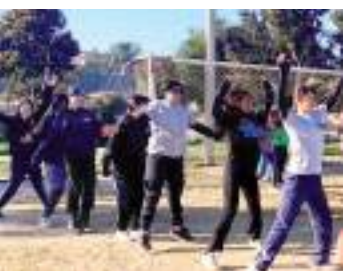
El programa se organiza en colaboración con diversas dependencias municipales.

Finalmente, González Velázquez hizo un llamado a la ciudadanía para participar en estas jornadas, convencido de que el deporte, la motivación y una vida saludable son esenciales para la prevención y el fortalecimiento del tejido social en Ensenada.