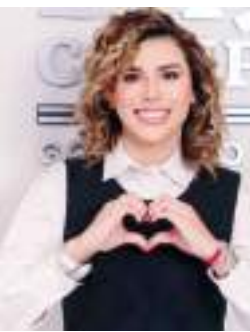
MEXICALI MARINA DEL PILAR ÁVILA OLMEDA...

Anuncia pavimentación de la avenida México en Tecate.