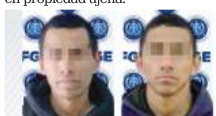
PLAYAS DE ROSARITO.- Sacan de las calles a presuntos delincuentes, algunos ya hasta se les determinó sentencia.