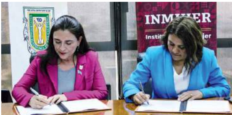
ENSENADA.- INMUJER y la UABC buscan fomentar capacitaciones entre estudiantes y docentes, además de establecer dos Puntos Naranja en la Universidad.

dad Autónoma de Baja California (UABC) firmaron un convenio de colaboración para establecer dos Puntos Naranja en la Vicerrecto-