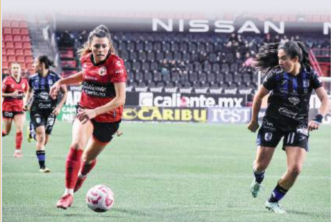
El resultado deja a Tijuana estancado con siete unidades.

Xolas intentará sumar puntos de nueva cuenta en su próximo compromiso, en el que volverá a salir a una gira como visitante en la que enfrentará a las bicampeonas Rayadas el próximo 2 de febrero y a Santos el jueves 6 del próximo mes. Tijuana regresará a casa para enfrentar a Chivas el 10 de febrero.