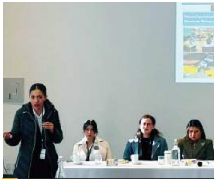
TECATE.- La Fiscalía General del Estado continúa fortaleciendo el acercamiento con la comunidad, promoviendo los servicios y procesos de las Unidades Modelo de Atención Ciudadana.

Es por ello que desde Coparmex Tijuana se trabajará para garantizar que las MiPyme tengan acceso a recursos que les permitan innovar y crecer. Se impulsarán programas de capacitación en tecnologías digitales y educación financiera, además de promover esquemas de crédito con tasas competitivas y menos trámites burocráticos. El presidente de la Confederación en Tijuana reconoce que el desarrollo de las MiPyme es clave para reducir las brechas de desigualdad en México, y es fundamental que lo hagan desde la formalidad; para lo que se requiere crear incentivos fiscales que les garanticen ventajas claras.