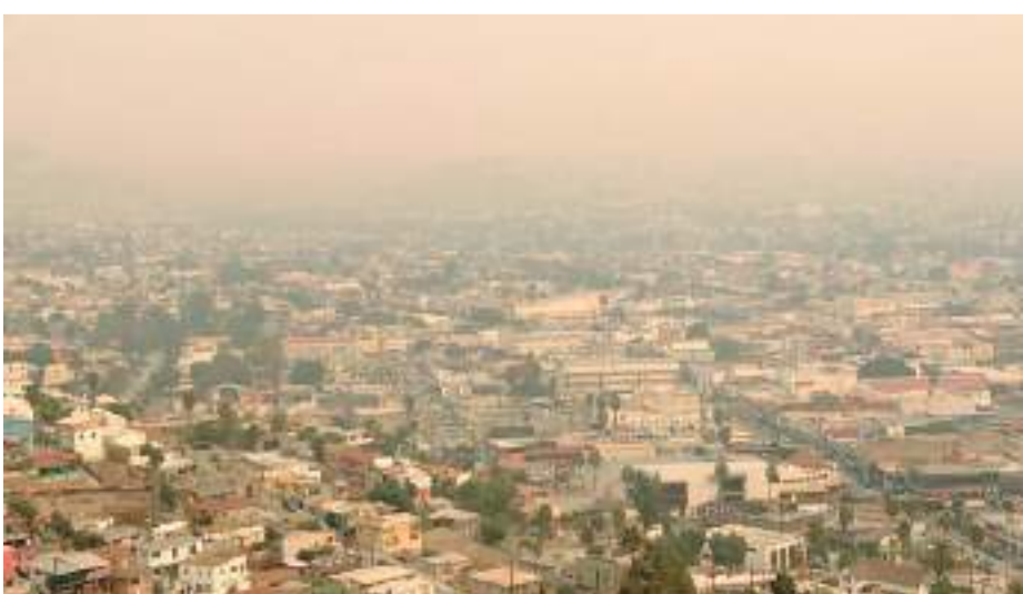
ENSENADA.- Se suspendieron actividades escolares en planteles educativos cercanos a incendios.

En caso de inasistencia no se contará como falta, además que las autoridades de los planteles escolares implementarán su estrategia, junto con familiares de estudiantes para cubrir el plan de estudios.