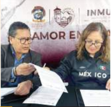
Con la firma del convenio buscan establecer acuerdos para promover la inclusión deportiva.