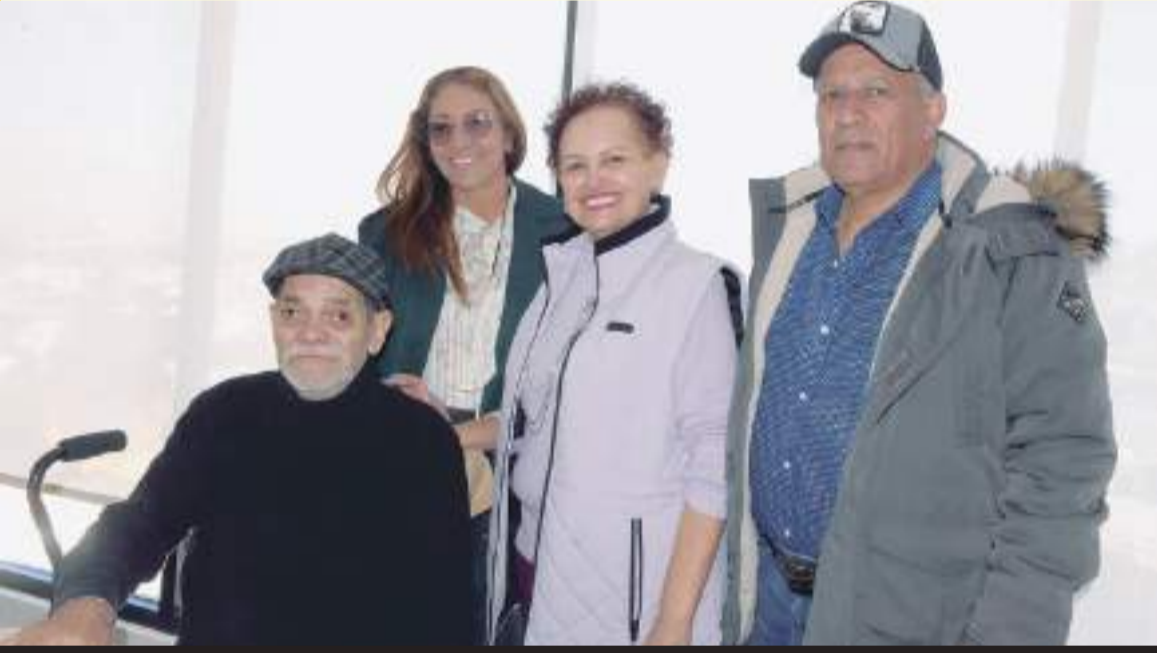
Entre sus anécdotas a los invitados, expuso su paso por el Instituto Mexicano del Seguro Social, Cetys Universidad, Hipódromo de Agua Caliente.

Concluyó que en una época en que se prohibía la formación de sindicatos el "mutualismo" permitió la asociación con la finalidad de luchar por los derechos civiles en la región.