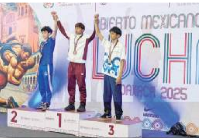
Se puso en marcha el evento de Femela en Oaxaca 2025.