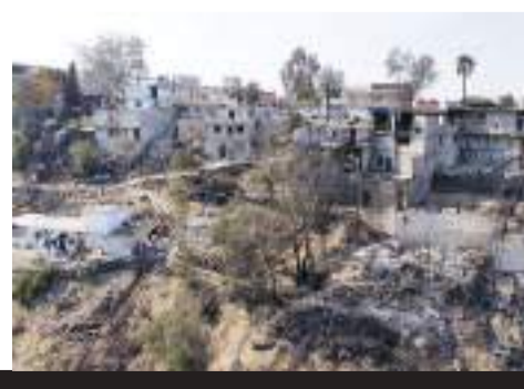
TIJUANA.- Más de 70 familias se quedaron sin hogar en la colonia Leandro Valle, luego de que un voraz incendio destruyó sus viviendas.

enfrentar la magnitud de esta tragedia. Las donaciones en especie se reciben en los puntos establecidos, en las calles Texcoco y Solidaridad Xochimilco, donde los vecinos afectados esperan reconstruir lo que el fuego les arrebató.