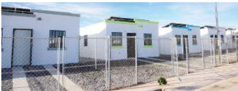
MEXICALI.- La gobernadora Marina del Pilar Ávila Olmeda, encabezó la entrega de las primeras siete de 90 casas con las que el Proyecto Vivienda Violeta da inicio en el fraccionamiento Valle del Progreso.

Precisó que 35 de esas viviendas se ubicarán en el fraccionamiento Valle del Progreso, 17 en Valle de las Misiones, 10 en colonia La Calma, 10 en desarrollo Casa Digna, tres en colonia Anáhuac, cinco en Villa del Prado y cinco en Lomas Altas, todo esto en Mexicali, además de cinco en el fraccionamiento Santa Fe, en Tijuana.