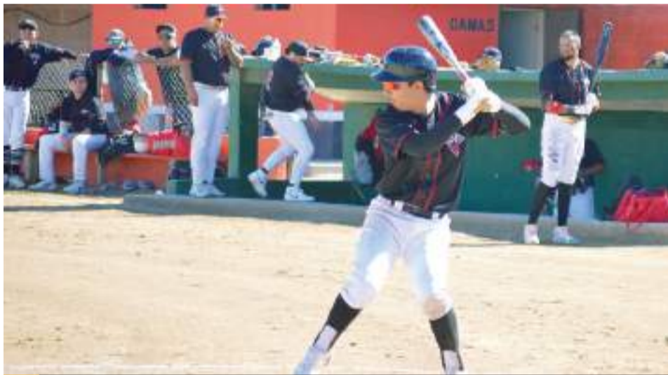
Los Bandits expondrán su invicto ante los Yankees, en ronda de la Primera Fuerza del campeonato oficial selectivo 2024-25 de la Liga de beisbol Urbana de Chapultepec.