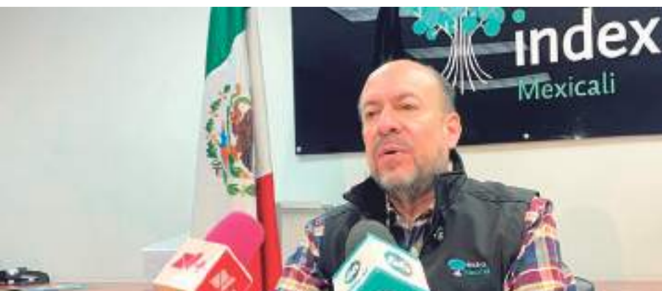
MEXICALI.- El titular de INDEX dice que la aplicación de aranceles por parte del gobierno de los Estados Unidos, pegará a los consumidores estadounidenses.