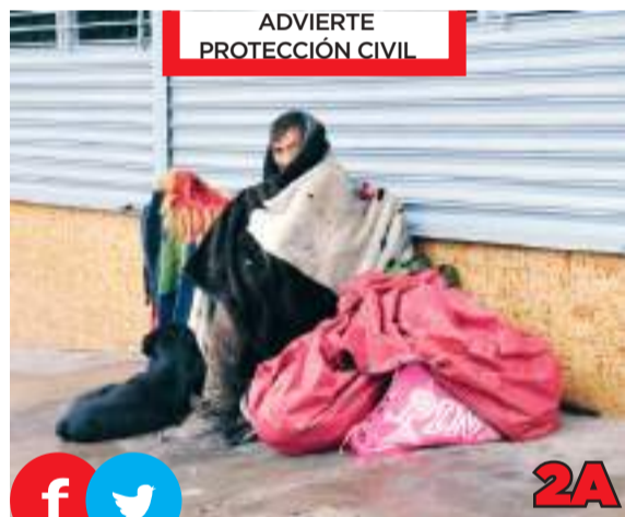
ADVIERTE PROTECCIÓN CIVIL

Durante este viernes, también se llevaron a cabo ejercicios conjuntos entre los Marines de EE.UU. y agentes del CBP en la zona de Otay, cerca del muro fronterizo.