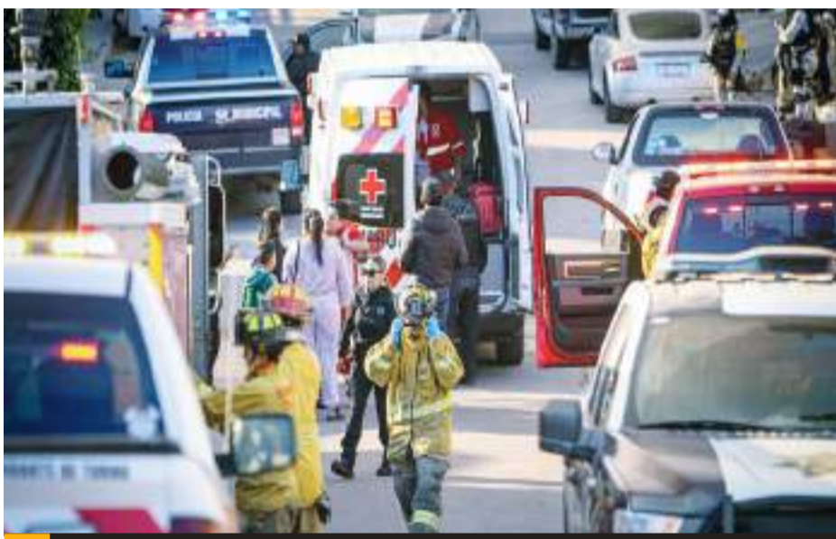
TIJUANA.- "El Brayan", ahora interfecto, detonó en contra de los policías en la colonia El Pípila.

de una ambulancia, donde momentos más tarde los paramédicos lo declararon sin signos vitales, mientras que del enfrentamiento, resultó lesionado un transeúnte, quien de inmediato fue trasladado al hospital más cercano para que recibiera la atención médica correspondiente.