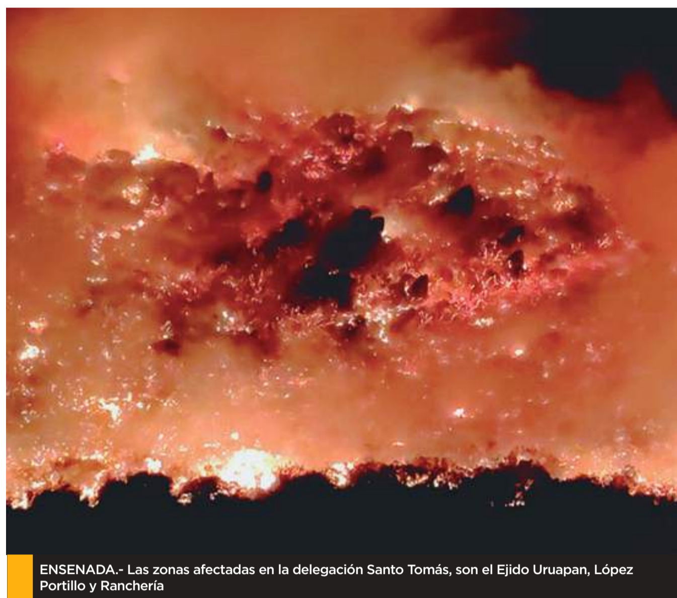
ENSENADA.- Las zonas afectadas en la delegación Santo Tomás, son el Ejido Uruapan, López Portillo y Ranchería

Con base en los monitoreos que se realizan en la estación ICAARO del Instituto de Investigaciones Oceanológicas de la UABC, en el que indican que en la ciudad de Ensenada la calidad del aire es "peligrosa", se instó a la comunidad a evitar salir en lo posible de los hogares u oficinas; mantener cerradas ventanas y puertas; evitar el uso de lentes de contacto; no fumar y usar lo menos posible el auto.