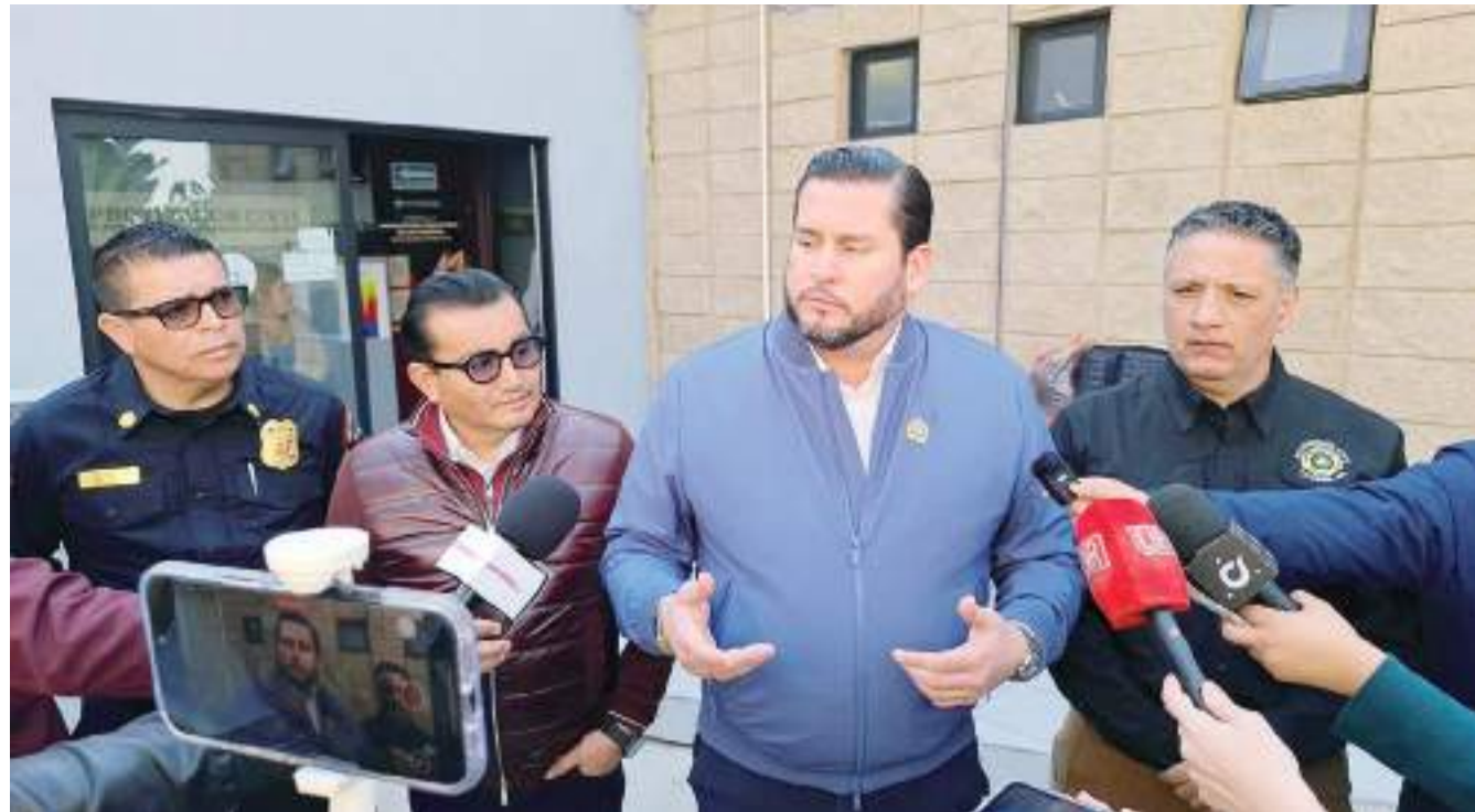
TIJUANA.- El Alcalde Ismael Burgueño Ruiz dio a conocer resumen de las acciones implementadas para combatir incendios y atender a personas afectadas por los mismos.