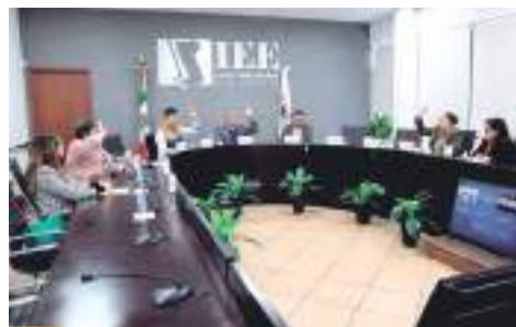
MEXICALI.- El IEEBC anuncia la creación del sistema CONOCELES para el proceso de selección de jueces y magistrados.