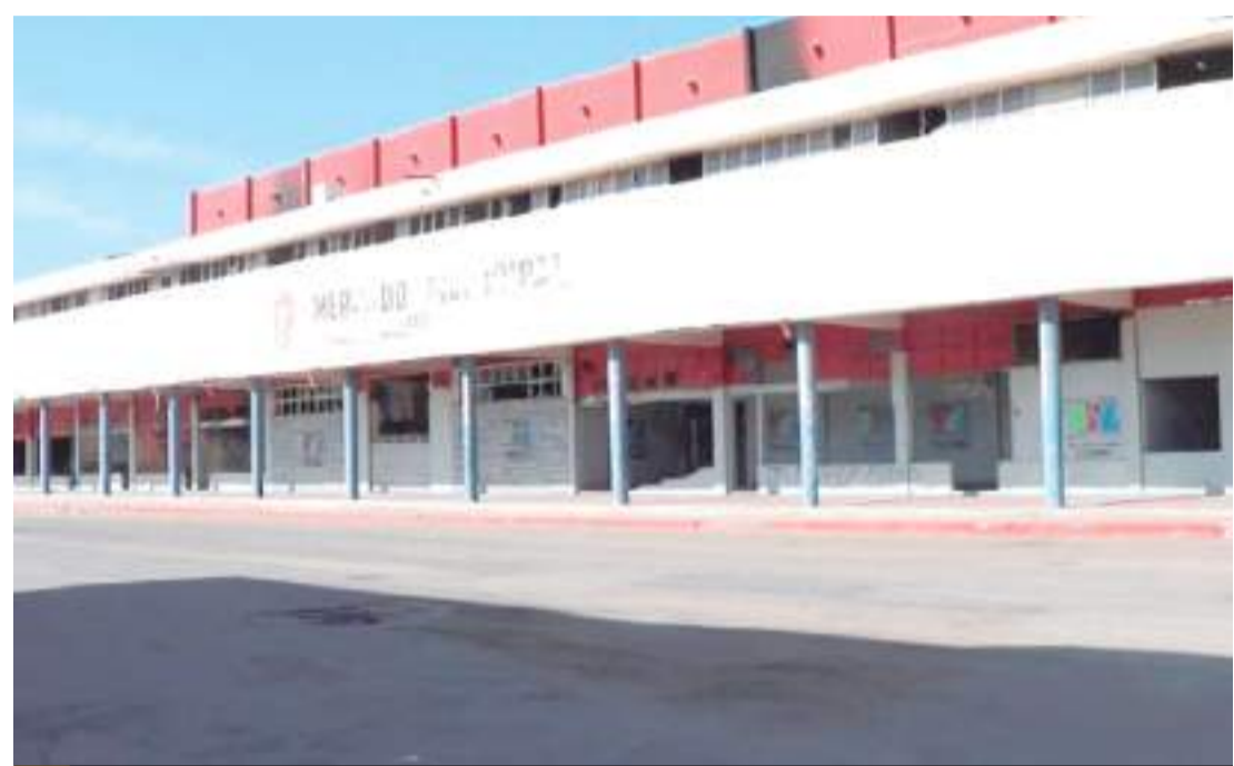
MEXICALI.- La alcaldesa de Mexicali dijo que la demolición del mercado municipal se ha retrasado por falta de recurso.

El edificio de dicho mercado quedó dañado a raíz del sismo de 7.2 grados que sacudió a la capital del Estado en 2010.