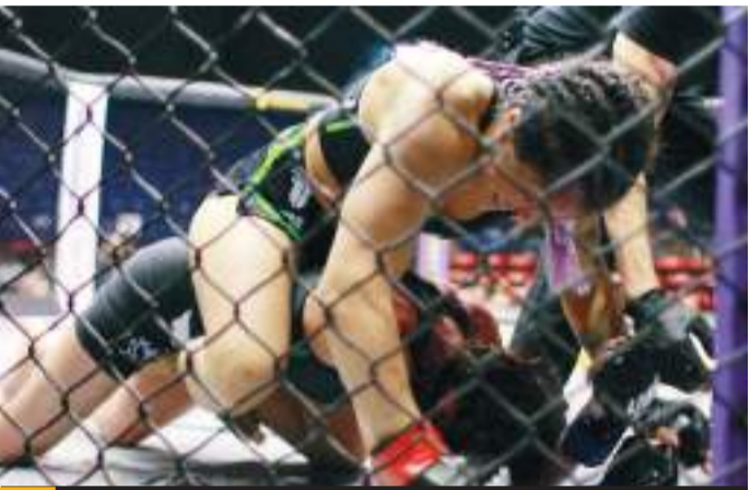
La función tendrá lugar en el auditorio municipal.

“Ahora vamos de regreso con cuatro eventos en esta primera parte de nuestra temporada, pusimos costos accesibles para que nos acompañe la afición que sabe que siempre presentamos eventos de la mayor calidad”, apuntó.