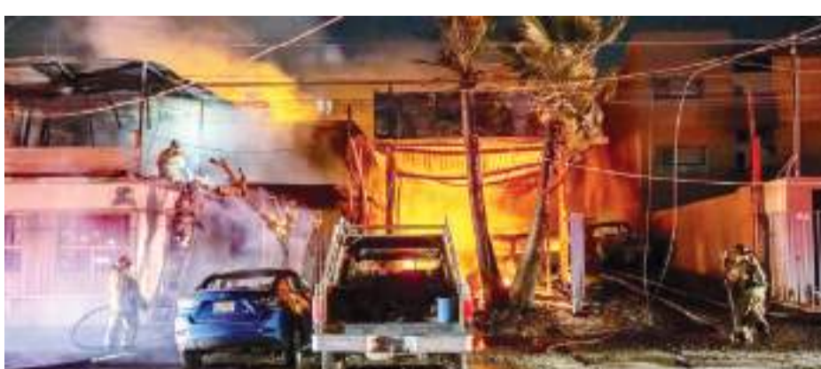
TIJUANA.- Ocho incendios se registraron durante las últimas 24 horas en la ciudad, donde desafortunadamente una persona fue localizada en estado de carbonización.

zó a 6 casas de madera, en terreno de asentamiento irregular, con afectaciones totales pero sin víctimas, por fortuna.