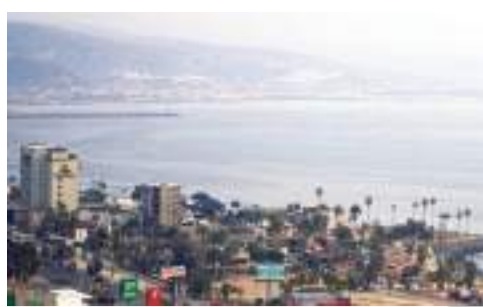
ENSENADA CIELO GRISÁCEO...

Reportan desde el CICESE altos índices contaminantes.