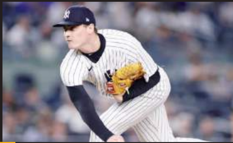
Primer refuerzo de San Diego en la actual temporada baja.