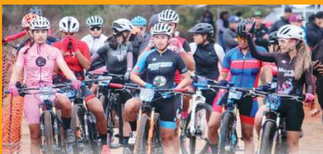
Celebraron en Ensenada el selectivo estatal de ciclismo de montaña, evento que tuvo lugar en el Rancho Santa Cruz.