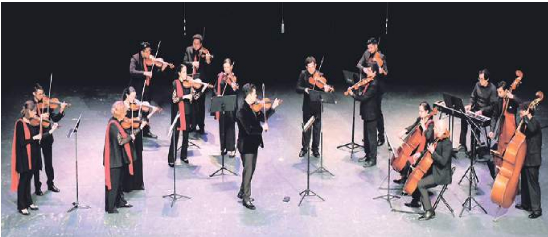
Ghukasyan String Orchestra hizo gala de su talento en la Sala de Espectáculos de Ccut en 2023.