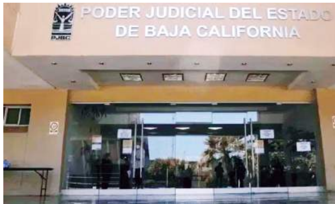
MEXICALI.-Habrá un mes de campaña para quienes participen en la elección de magistrados y jueces en el Poder Judicial estatal.

Por último, el magistrado presidente comentó que participará en el proceso de selección.