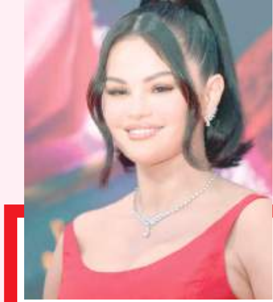
IMPACTADA POR LA AGRESIÓN A MEXICANOS

“Están atacando a toda mi gente, a los niños. No lo entiendo. Lo siento mucho, me gustaría poder hacer algo, pero no puedo. No sé qué hacer: Lo intentaré todo, lo prometo”, expresó, visiblemente afectada.