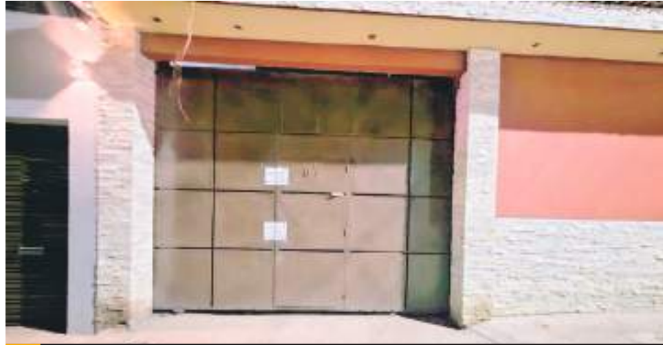
TIJUANA.- Los vehículos quedaron a cargo del ministerio público y el domicilio asegurado por la FGE.

A su vez, el domicilio donde fueron localizados los vehículos, también resultó asegurado para su investigación. Estas acciones se llevaron a cabo con la participación de un Fiscal, un auxiliar, 13 elementos de la Agencia Estatal de Investigación y dos oficiales de la Policía Municipal.