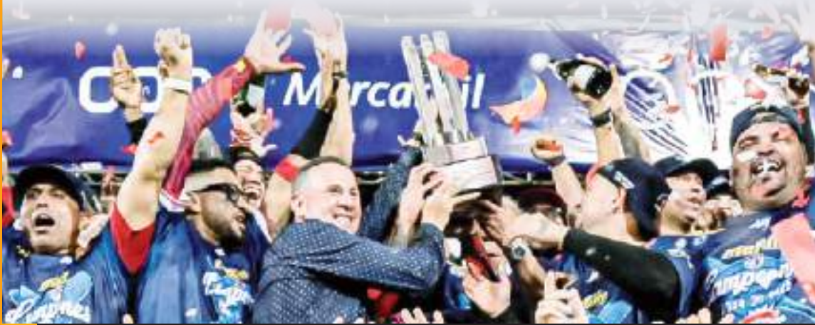
Cardenales de Lara es el tercer invitado a la Serie del Caribe Mexicali 2025.

El equipo venezolano se une a Indios de Mayagüez de Puerto Rico y a Japan Breeze de Japón como los primeros clasificados a certamen que tendrá lugar en la capital de Baja California a partir del próximo viernes.