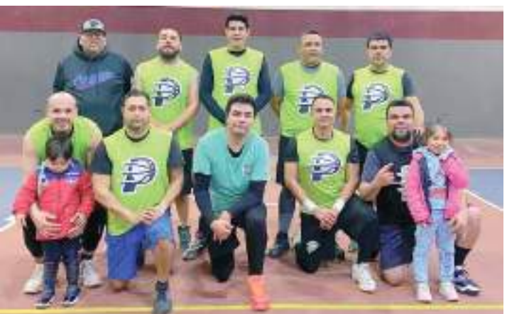
El Pirul buscará un boleto a la final de Segunda Fuerza de Libasa, enfrentando este martes en semifinales a los Raptors.