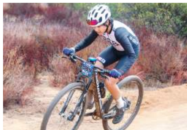
El selectivo fue con el objetivo de integrar a la preselección que representará al estado en el proceso clasificatorio para los Nacionales CONADE 2025.

"Sin duda, nuestro objetivo es seguir mejorando el nivel de nuestros ciclistas para alcanzar un nivel competitivo más alto y así poder luchar por las medallas en los eventos nacionales", expresó