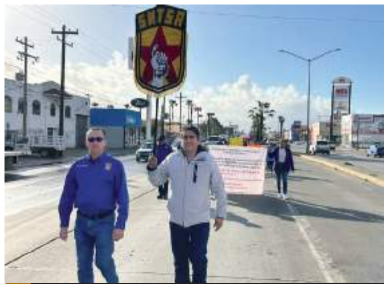
ENSENADA.-Salieron este lunes a manifestarse decenas de trabajadores del sector salud.

Asimismo, mencionó que, como parte de las carencias de insumos, las unidades no cuentan con lo básico para atención médica, obligando a los pacientes o parientes a