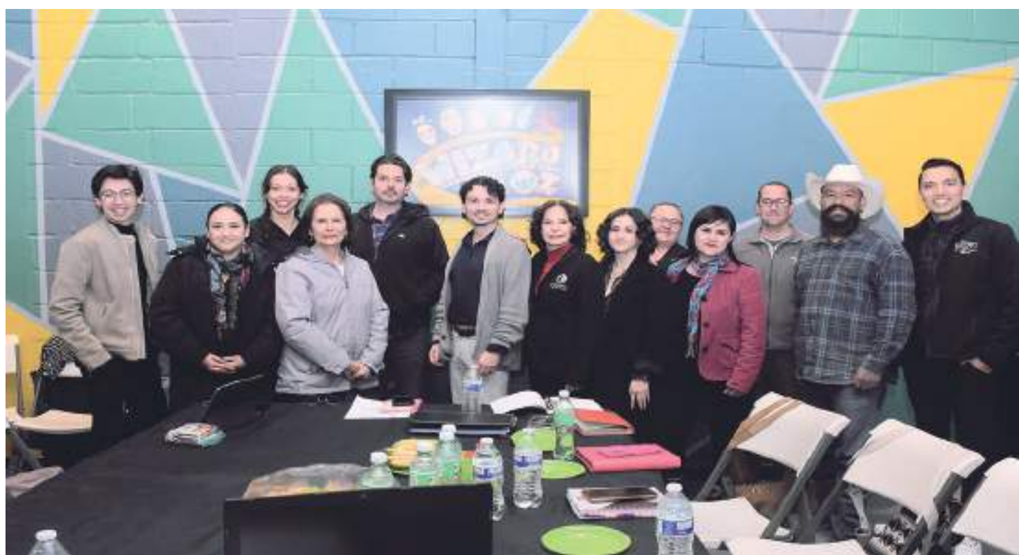
Colectivo multidisciplinario del Centro Teatral Camafeo.

LAS REDES SOCIALES DEL CENTRO TEATRAL CAMAFO SERÁN EL MEDIO PRINCIPAL PARA DAR A CONOCER DETALLES SOBRE LA CONVOCATORIA, TALLERES Y EL TÍTULO DE LA NUEVA OBRA QUE MONTARÁN