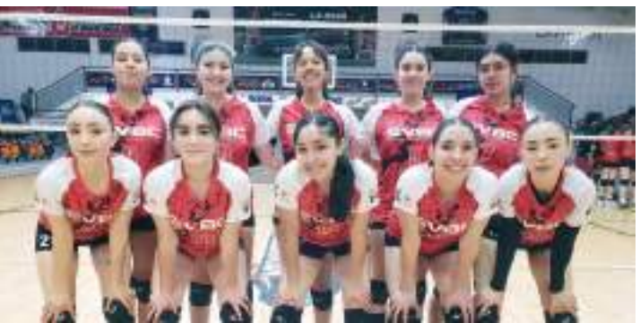
Con ocho encuentros se estará jugando la primera jornada, el torneo oficial 2025 del Comité Municipal de Voleibol de Ensenada.