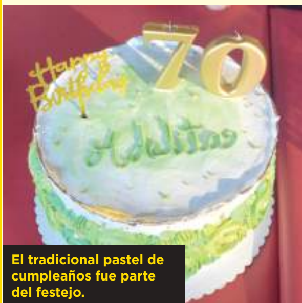
El tradicional pastel de cumpleaños fue parte del festejo.