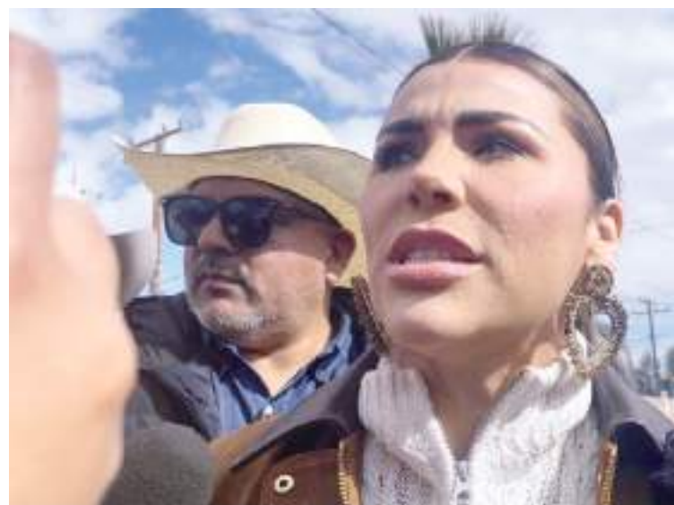
MEXICALI.- Paciencia pidió la gobernadora del Estado para resolver las necesidades de los trabajadores del sector salud.

El secretario, insistió que en que está en riesgo la salud de los bajacalifornianos, sin embargo, a pesar de que no cuentan con las herramientas para atención al derechohabiente, se sigue atendiendo y dando consulta.