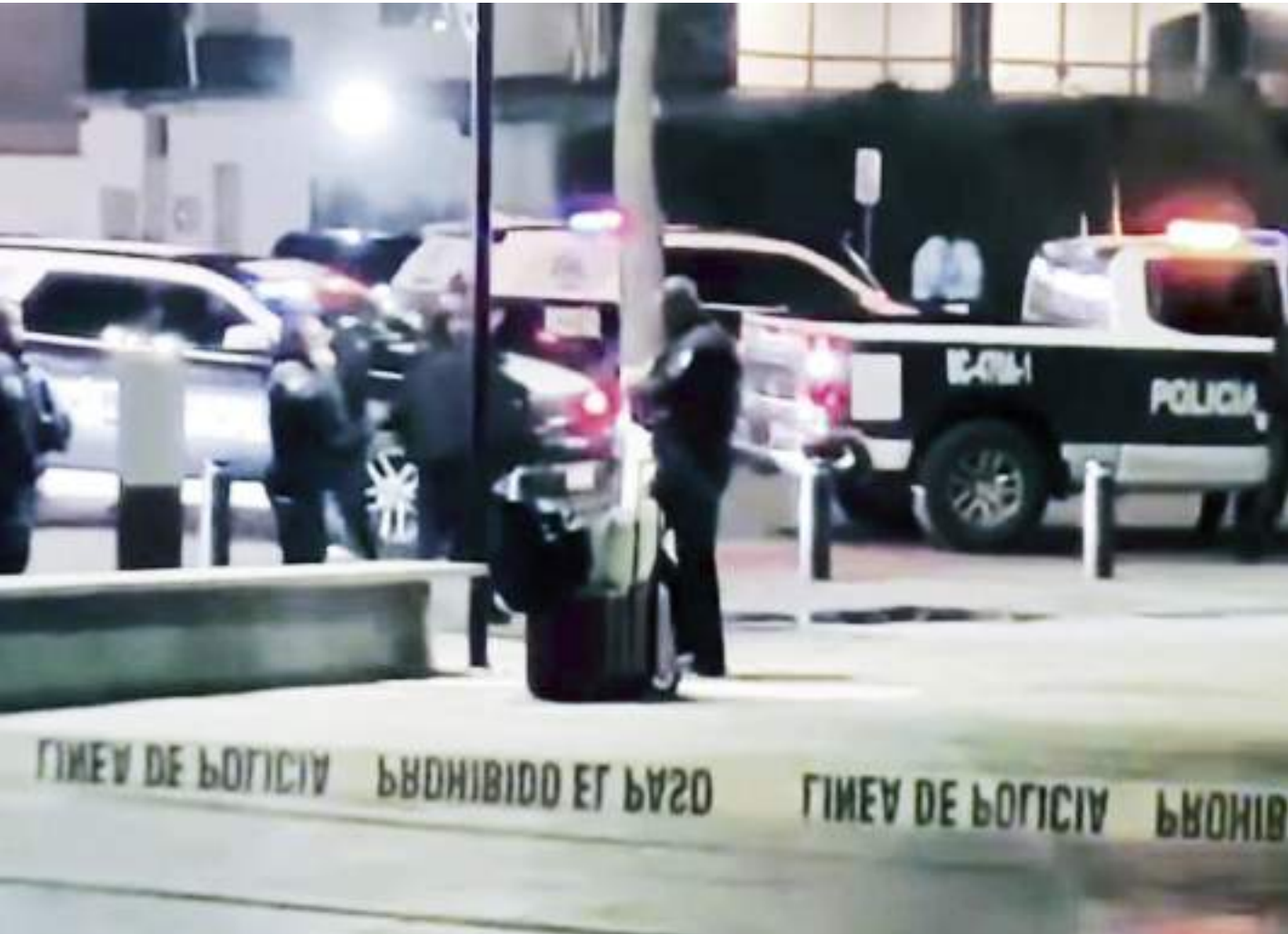
ENSENADA.- En la Plaza Cívica de la Patria, dejaron una narcomanta con amenazas, y una hielera (la cual despedía olores fétidos), y en su interior dos cabezas humanas.

Derivado de ello un fuerte operativo pudo ver en el lugar por varias horas, por lo que se acordó el área y se dio aviso a la Fiscalía General del Estado a quienes les corresponde el levantamiento de indicios y la investigación correspondiente.