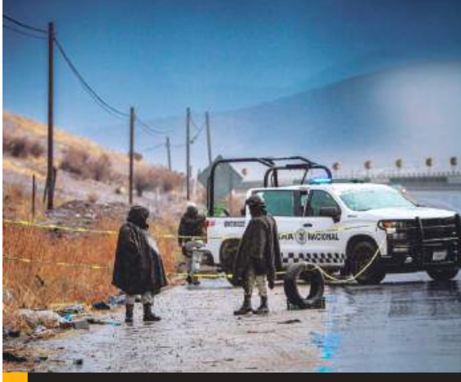
TIJUANA.- El cadáver de un hombre fue abandonado envuelto en bolsa y cobija de color negro en la carretera Tijuana-Tecate, a la altura de la colonia Valle San Pedro.

Ante el hallazgo, la zona quedó resguardada por los mismos elementos de la Guardia Nacional, mientras que agentes de la Fiscalía y servicios periciales realizaban las investigaciones correspondientes.