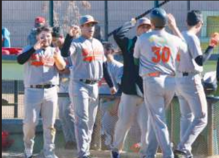
Veterinaria Bahía descargó una ofensiva de 16 imparables para acreditarse gran triunfo en siete entradas al son de 12 carreras por dos sobre los juveniles Astros.