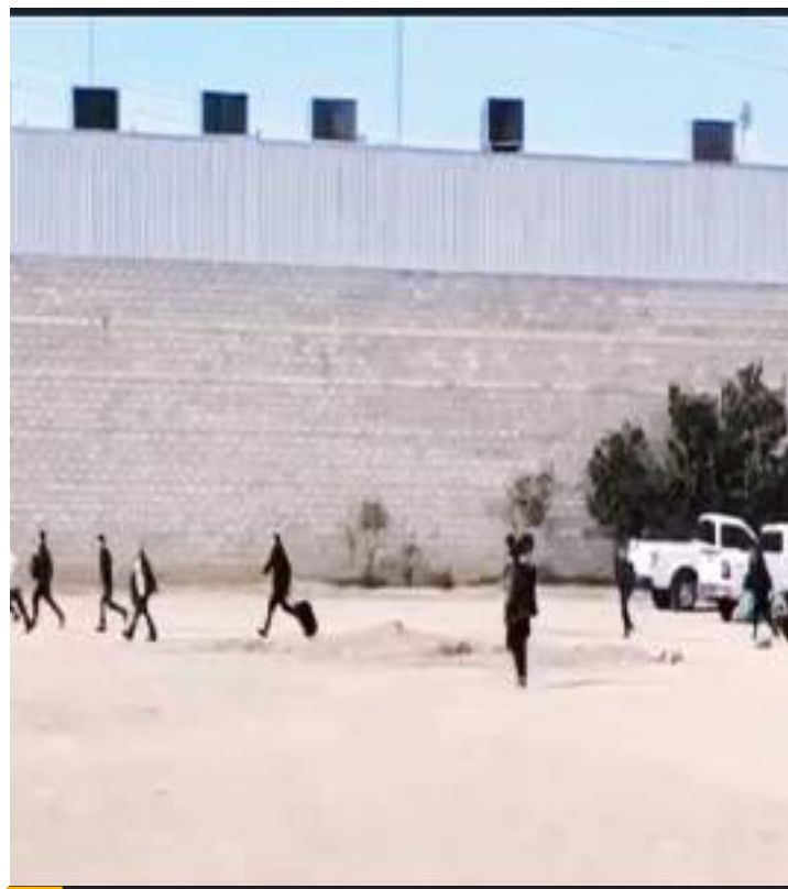
MEXICALI.-Descartan fuga de paciente en Centro de Rehabilitación en el Valle, dijo la FGE.