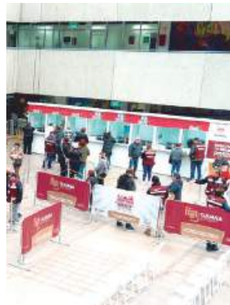
TIJUANA.- Ayuntamiento hace un llamado a la población a aprovechar los últimos días del 12% de descuento en el pago del impuesto predial.