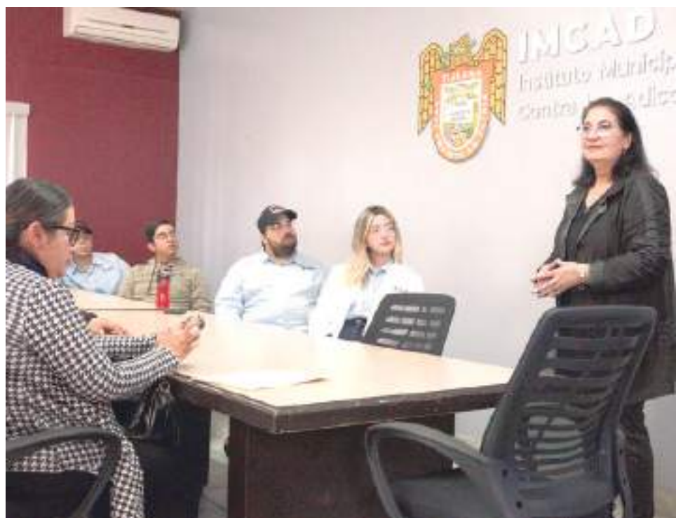
TIJUANA.- El Instituto Municipal Contra las Adicciones fortalece sus programas específicos para atender a la población de todas las edades, como parte de las acciones en materia de salud.

Con estas acciones, el Gobierno Municipal a través de IMCAD ha beneficiado a la Policía Juvenil, estudiantes de la escuela primaria Gabriel Ramos Millán, Vicente Suárez, Alba Roja; Cetis 158, Conalep I, Cobach BC Extensión La Presa, Preparatoria Lázaro Cárdenas, Preparatoria Cut, Centro de Atención Integral en Salud (CAIS) de la Universidad Autónoma de Baja California (UABC), entre otras instituciones educativas, cabe destacar que, además, ha atendido a centros de rehabilitación.