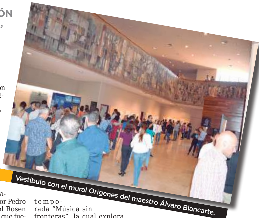
Vestíbulo con el mural Orígenes del maestro Álvaro Blancarte.

En la Sala de Espectáculos del CECUT hizo gala de su talento en 2023 y ahora vuelve para celebrar cuatro décadas de la Sala de Espectáculos.