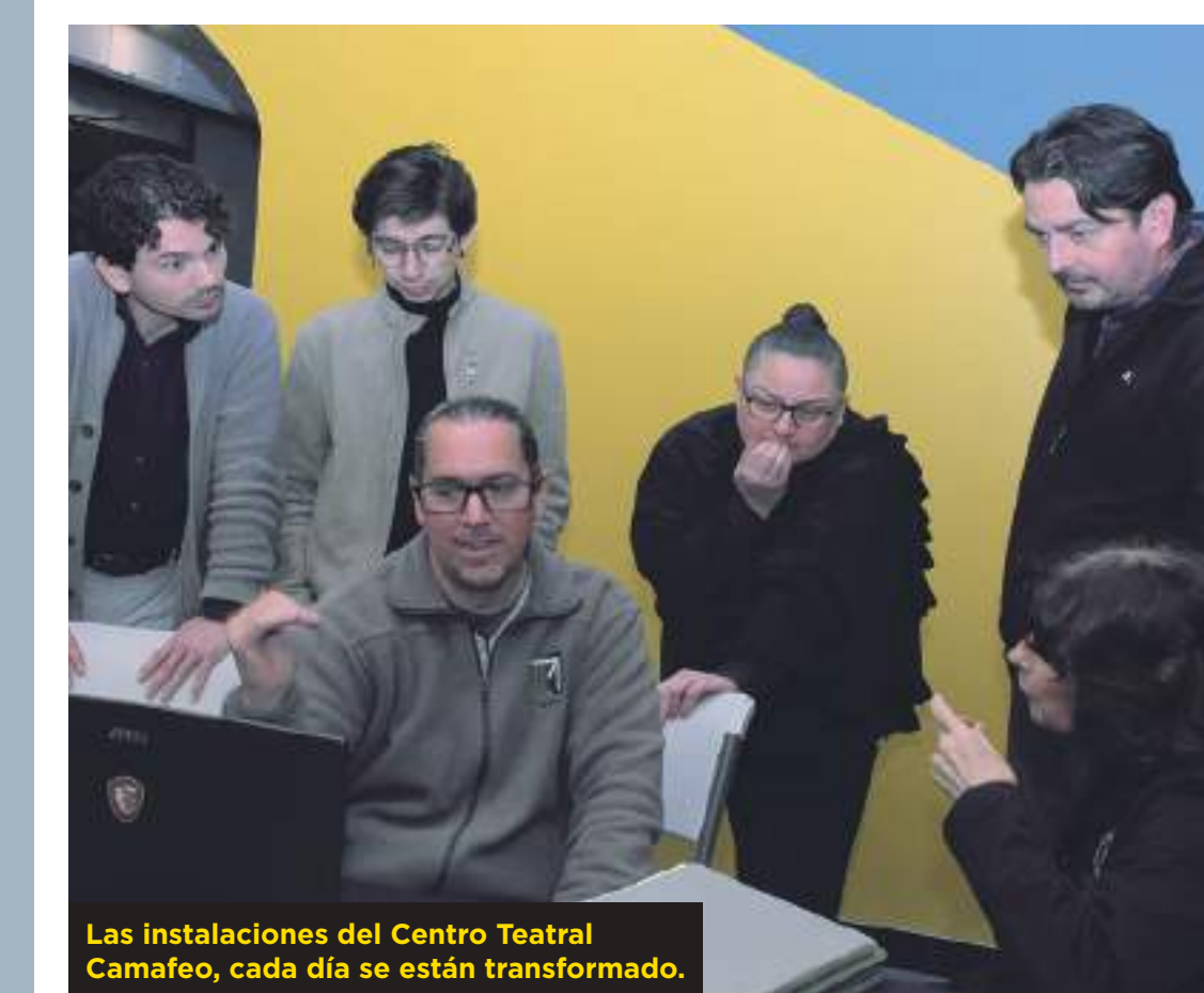
Las instalaciones del Centro Teatral Camafeo, cada día se están transformado.