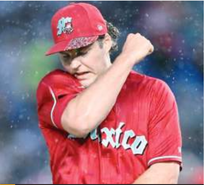
Trevor Bauer no jugará la temporada 2025 de la LMB con Diablos Rojos del México.

Bauer fue uno de los elementos destacados de Diablos Rojos, equipo con el que logró romper varios récords. En su paso por la LMB, el diestro consiguió 10 victorias en 14 juegos y acumuló 120 ponches. Además estableció una nueva marca de ponches en un juego a nueve entradas de la Liga Mexicana de Beisbol con 19.