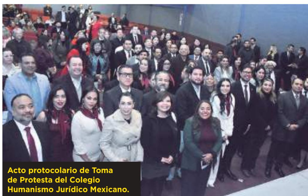
Acto protocolario de Toma de Protesta del Colegio Humanismo Jurídico Mexicano.