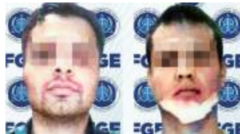
UNO DE ELLOS 'CAZABA' A LA VÍCTIMA Cayeron "ratas" por robo