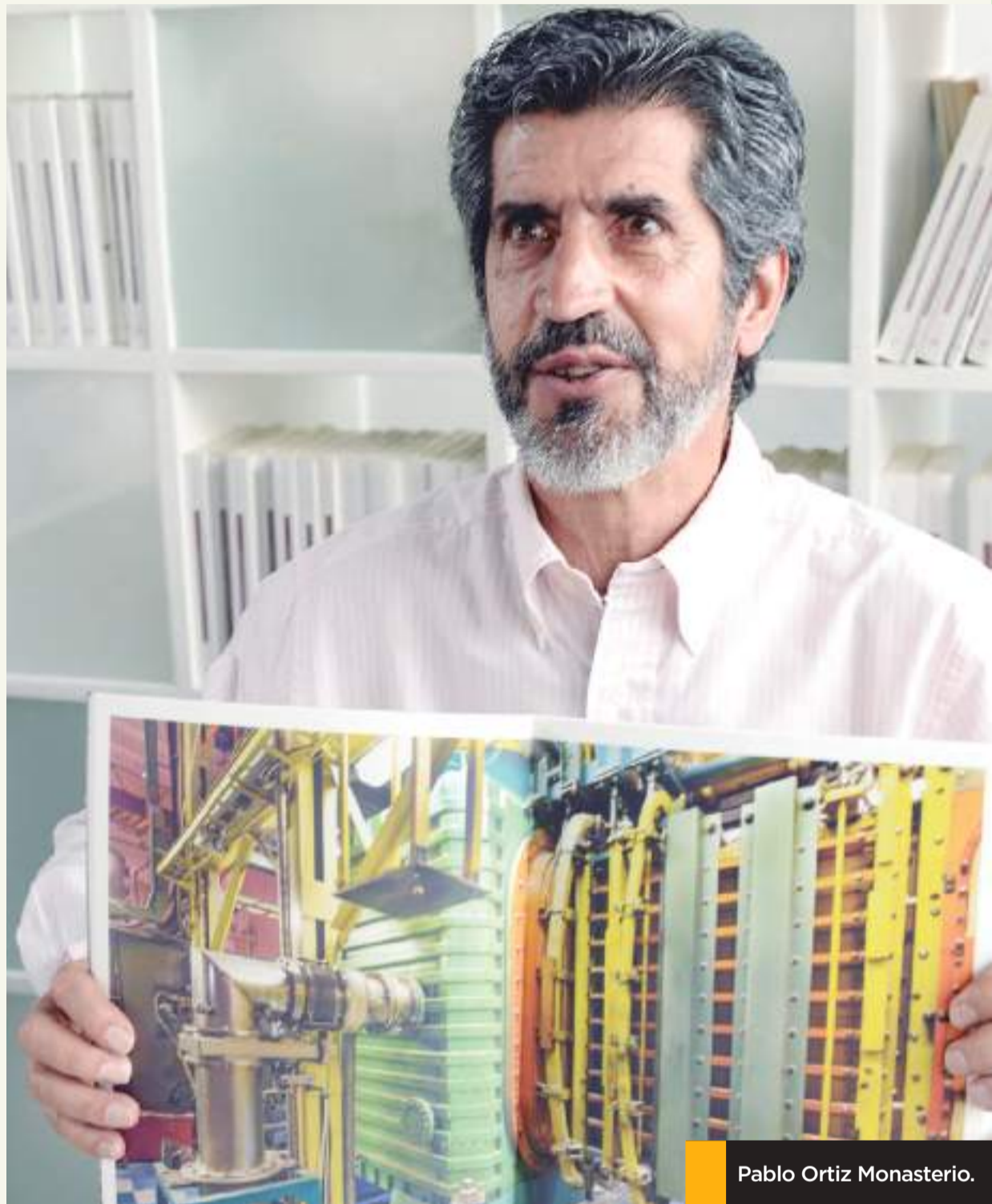
Pablo Ortiz Monasterio.

El fotógrafo siempre está de un proyecto a otro, “soy así por temperamento -dice-, he trata-