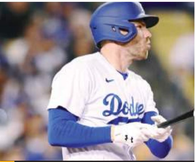
El primera base Freddie Freeman señaló que estará limitado durante los entrenamientos primaverales.

Por segundo año consecutivo, los Dodgers tendrán unos Entrenamientos de Primavera abreviados debido a que jugarán fuera de los Estados Unidos para iniciar la temporada. Este año jugarán dos compromisos contra los Cachorros en Tokio, Japón del 18 al 19 de marzo.