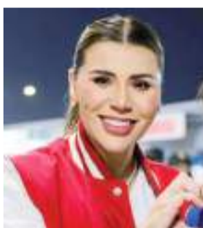
MEXICALI MARINA DEL PILAR ÁVILA OLMEDA...

Recorrer los siete municipios de la entidad y tocar puertas casa por casa será parte de la estrategia que implementarán con el propósito de refrendar su triunfo en las urnas a nivel local y federal en 2027 cuando se renueve la gubernatura, alcaldías, con-