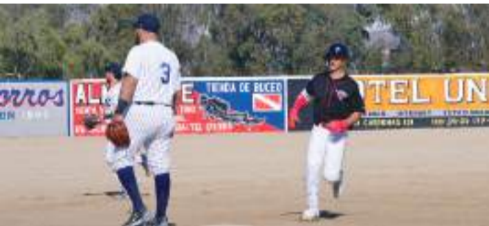
Bandits mantienen su calidad de invicto dentro de la Primera Fuerza del campeonato oficial 2024-25 de la Liga de beisbol Urbana de Chapultepec.