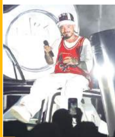
Antes de ser famoso, J Balvin vivió una experiencia traumática: fue secuestrado cuando estuvo en Oklahoma.

"Fue la ciudad que me hizo un momento muy difícil y me hizo soñar", aseguró el reguetonero sobre la ciudad que lo motivó a ser artista.