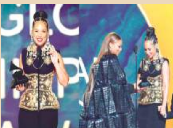
Alicia Keys recibe el premio Dr. Dre Global.

timón' con 'Las mujeres ya no lloran', su más reciente trabajo y cuyo título también es el protagonista de su próxima gira mundial.