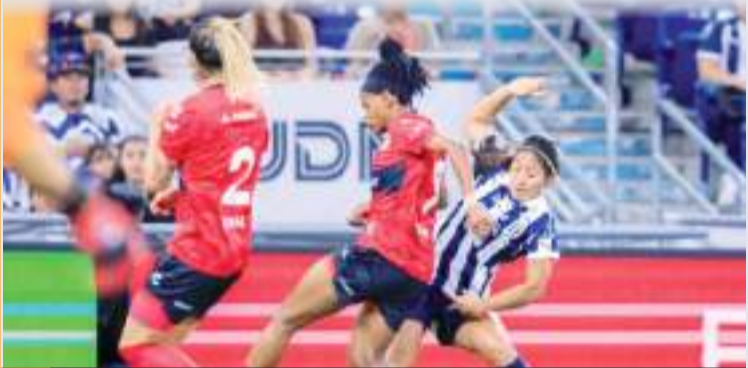
Xolos Femenil firmó un empate contra las bicampeonas Rayadas de Monterrey.

El próximo duelo para las reinas del Mictlán será ante las guerreras de Santos el próximo jueves 6 de febrero en la comarca lagunera. Tijuana regresará a casa para un compromiso contra Chivas el próximo lunes 10 de febrero.