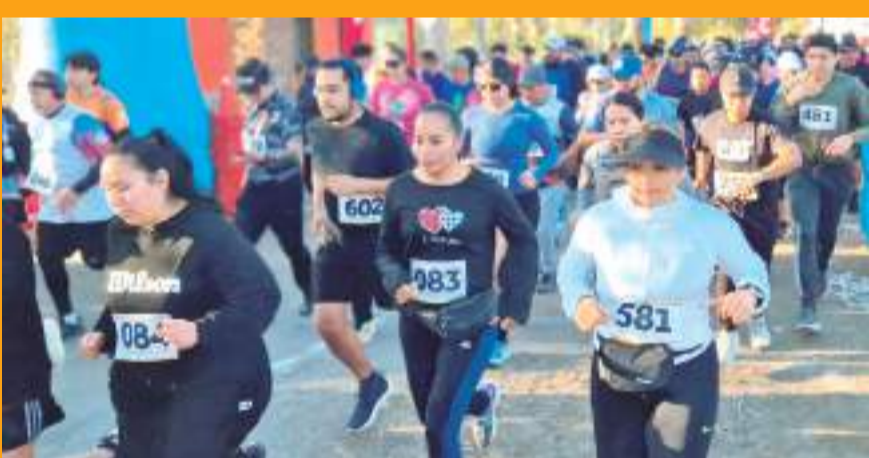
Un total de 700 participantes se dieron cita a la carrera por el 38 aniversario del Parque Morelos.

La versatilidad es la mejor arma defensiva del veloz pelotero dominicano. Puede desempeñarse en cualquier jardín y también en la tercera base, paradas cortas o la intermedia.