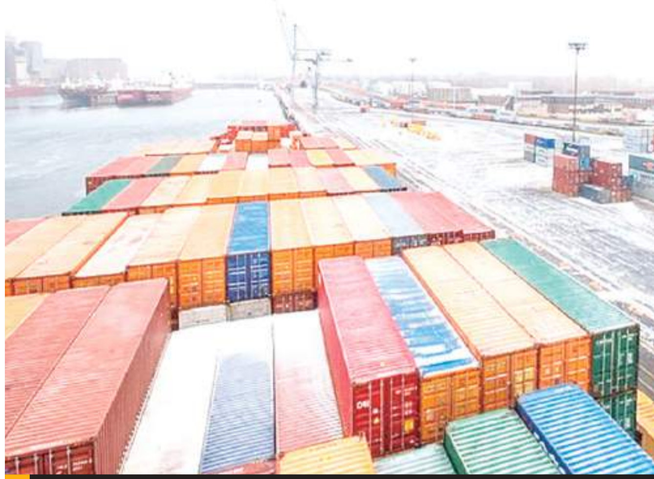
MEXICALI.- INDEX ve positivo la suspensión momentánea de la aplicación de aranceles de Estados Unidos hacia México.

Por último, apuntó que los aranceles afectan la economía de ambos países, México con una disminución de exportaciones y Estados Unidos donde los ciudadanos pagarán más por los bienes que consuman.