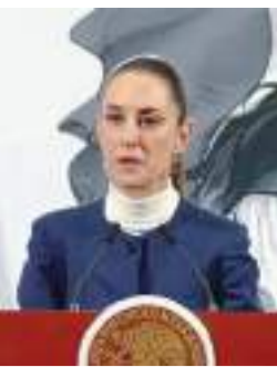
MEXICALI CLAUDIA SHEINBAUM PARDO...

Defiende los intereses de MÉXICO ante ESTADOS UNIDOS.