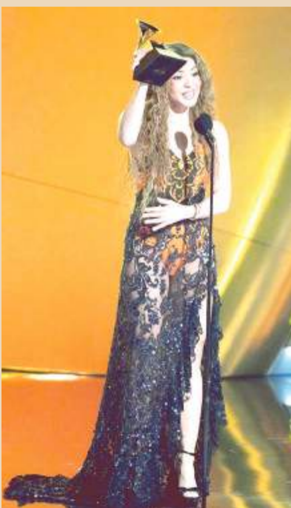
Shakira regresa al escenario de los Grammy y gana premio.

En esta edición, se llevó el galardón en la categoría 'Mejor álbum pop la-