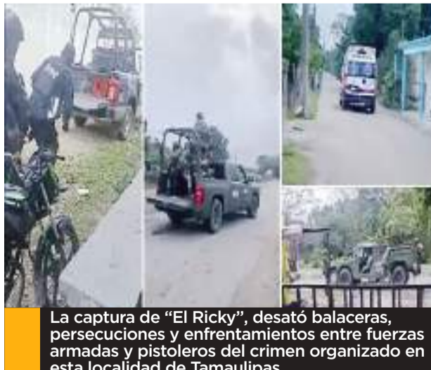
La captura de "El Ricky", desató balaceras, persecuciones y enfrentamientos entre fuerzas armadas y pistoleros del crimen organizado en esta localidad de Tamaulipas.

En conferencia de prensa, Víctor Hugo Chávez, titular de las SSPC de Tabasco, explicó que los 13 policías, los dos funcionarios y el otro hombre detenido, que se identificó a sí mismo como dueño del rancho, fueron puestos a disposi-