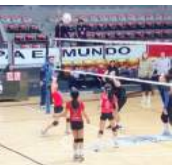
Reñidos duelos se dieron en la primera jornada del torneo oficial 2025, del Comité Municipal de Voleibol de Ensenada.