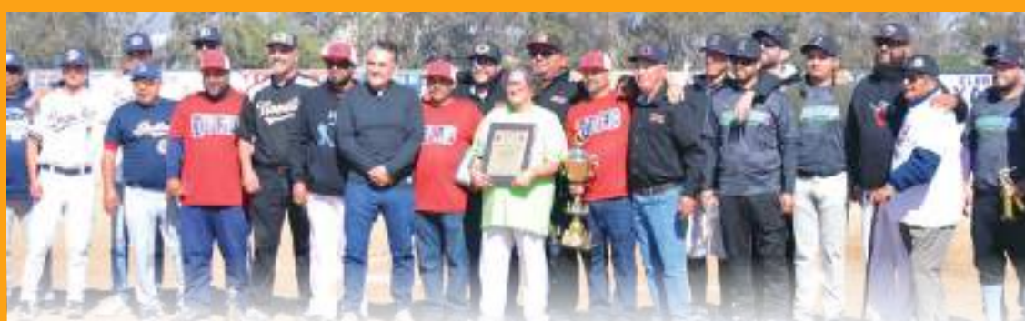
La Liga Urbana de beisbol de Chapultepec tuvo la ceremonia inaugural de su torneo oficial selectivo 2024-25.