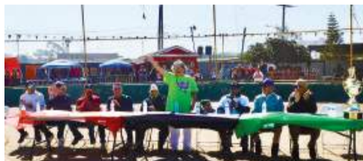
Así lucio la mesa de invitados de honor en el acto inaugural del torneo oficial selectivo 2024-25, denominado Lulu Reyes.