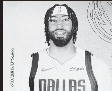
Lakers y Mavericks hicieron oficial el traspaso que involucra a Luka Dončić y a Anthony Davis.