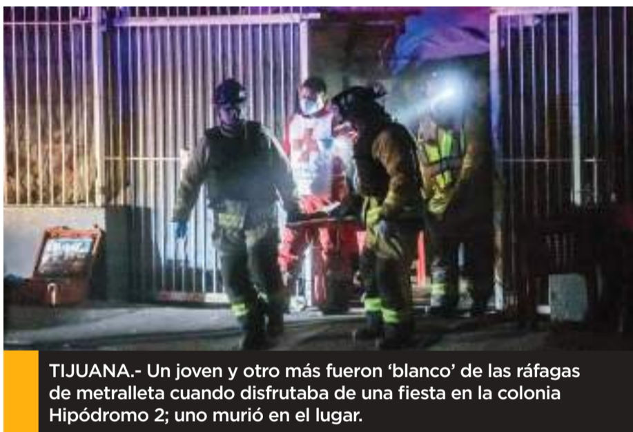
TIJUANA.- Un joven y otro más fueron 'blanco' de las ráfagas de metrallera cuando disfrutaba de una fiesta en la colonia Hipódromo 2; uno murió en el lugar.

calizados alrededor de 30 cartuchos percutidos de arma larga, los cuales fueron detonados por varios sujetos que hasta el momento lograron huir;