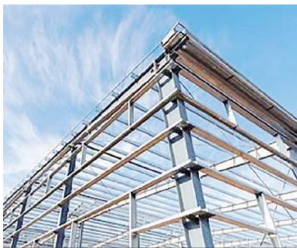
MEXICALI.- La CMIC estima mayor costo en las obras que utilizan acero y aluminio, ante el anuncio de aranceles por parte de Estados Unidos.

La colaboración de la comunidad es clave para garantizar la seguridad hídrica de Mexicali y prevenir problemas derivados de las lluvias.