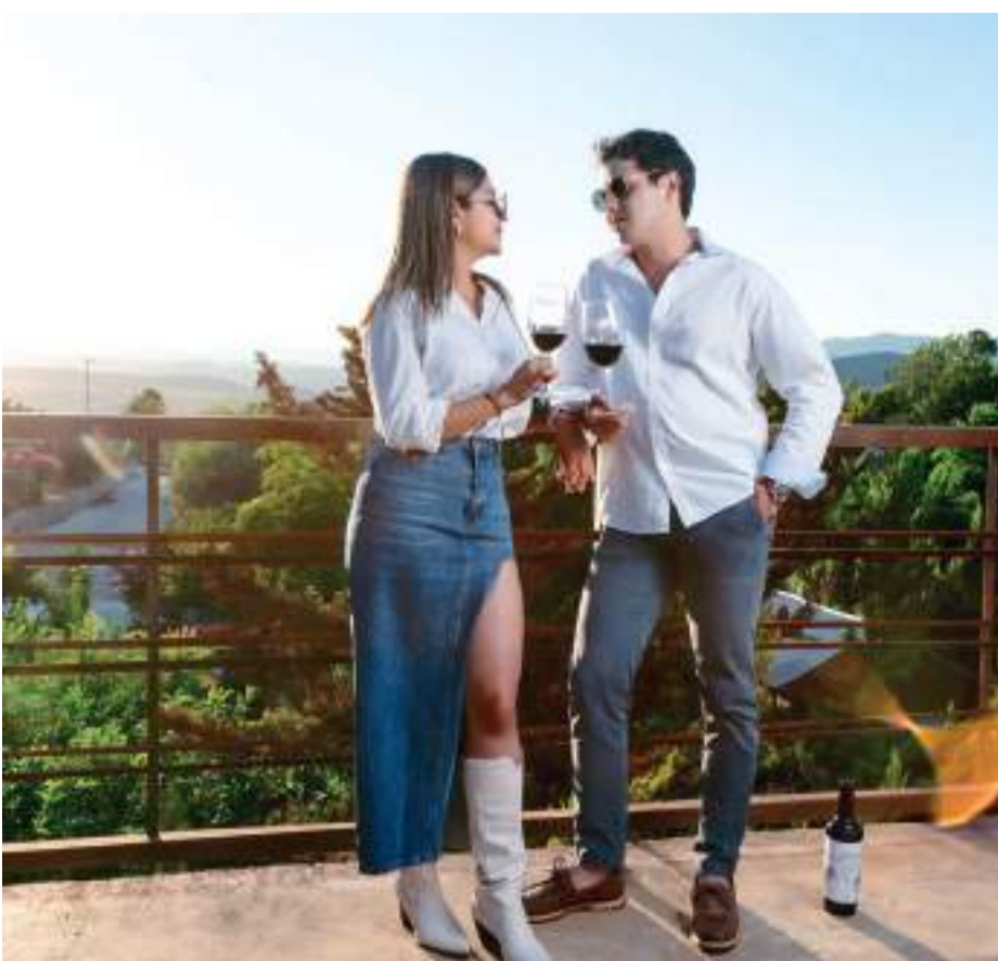
ENSENADA.-Promueven el Valle de Guadalupe para celebrar en el marco del “Día de los Enamorados”.

La asociación civil Emprendedores del Valle de Guadalupe agrupa actualmente a más de 200 empresas en sectores como el agrícola de vid y olivo, vinícola, gastronómico, hospedaje, transportista, romance, entre otros.