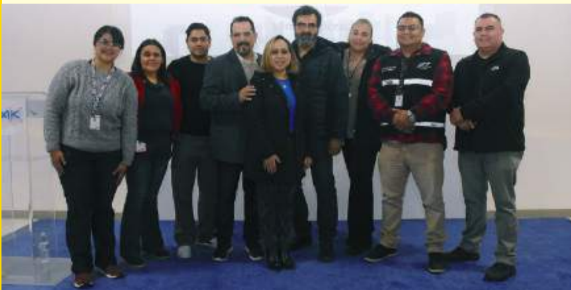
Estudiantes de la Universidad Tecnológica de Tijuana.

Para terminar, el presidente de SMK Electrónica destacó que cada año se imparte el Diplomado en Manufactura Esbelta, de febrero a noviembre, por lo que invitó a las empresas e instituciones educativas a ponerse en contacto con la compañía.