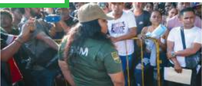
El dictamen insta al INM a trabajar con los gobiernos del sur de México, para implementar medidas más eficaces en pro de los migrantes.