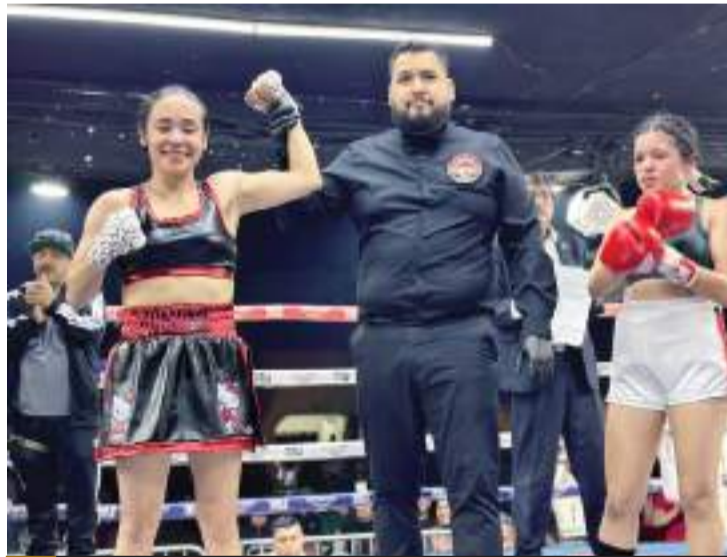
El choque será parte de una velada con un total de 10 combates.