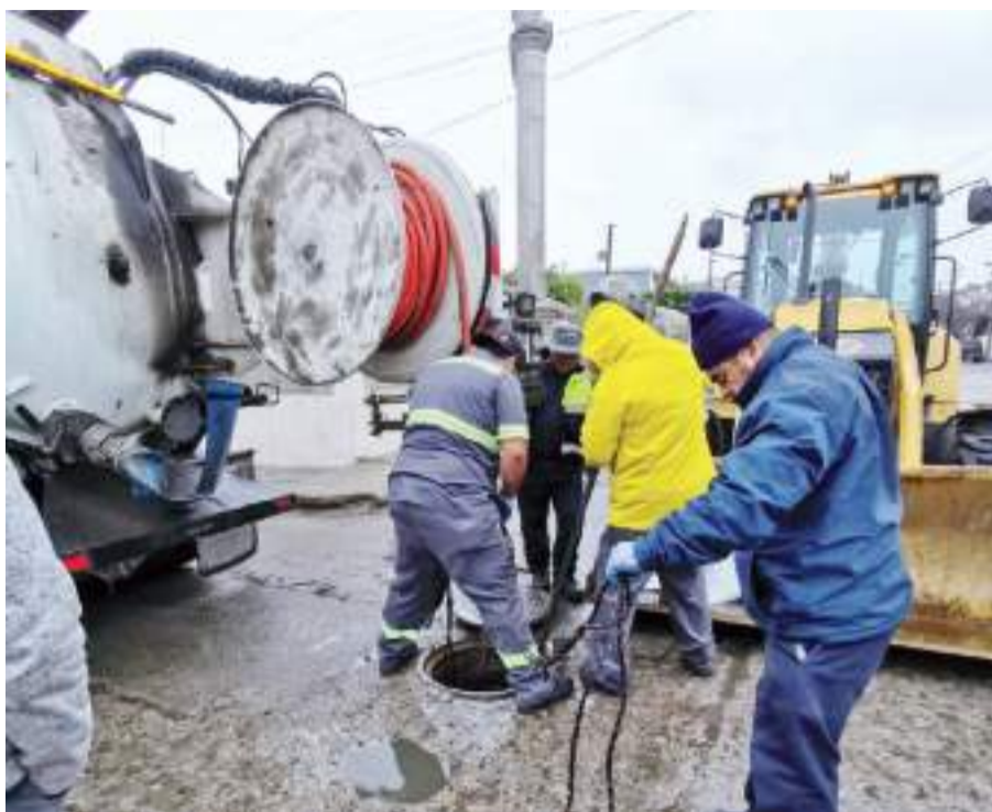
TIJUANA.- La CESPT activó su protocolo de mantenimiento de la infraestructura ante la llegada de las lluvias.

Mencionó que el equipo especializado de la red matriz de agua potable y saneamiento, implementó monitoreos permanentes en las ubicaciones críticas en distintos puntos de la ciudad, como