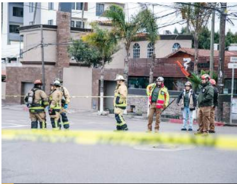
TIJUANA. Otra fuga de gas se registró en la colonia Cacho, donde fue necesario evacuar 15 locales.

En la zona fueron acordonadas 2 cuadras por las autoridades hasta la Avenida colima.