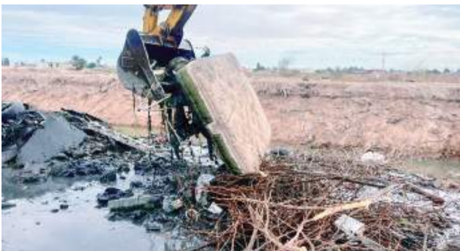
MEXICALI.- La CESPM hace un llamado a la ciudadanía para mantener los drenes libres de basura y escombros.

"Al final de cuentas el perjudicado con todo esto, es el consumidor de Estados Unidos, ellos pagarán más los productos", finalizó.