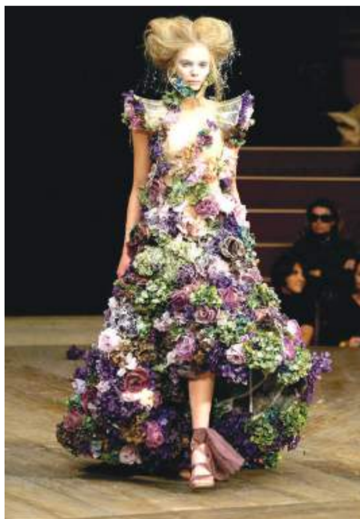
2007: una oda a la elegancia

Alexander McQueen sorprendió con una colección donde la elegancia actual se fusionaba con propuestas más propias del siglo pasado inspiradas en Goya, Barry Lyndon o Marchesa Casat.