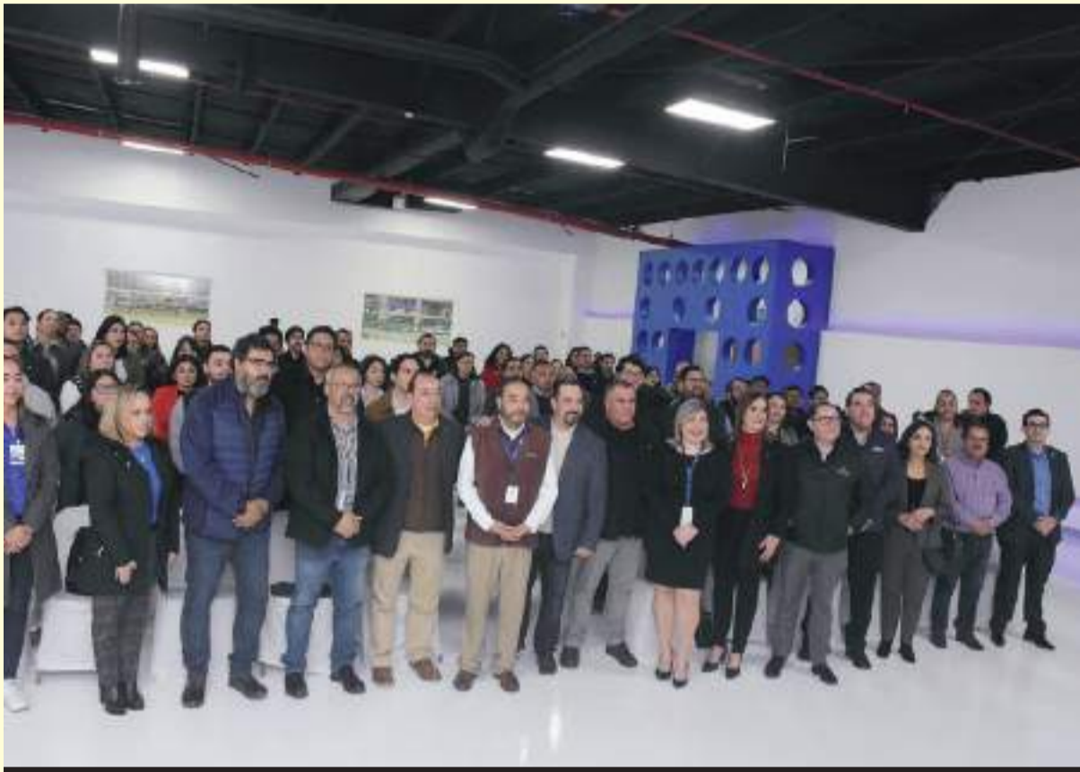
El diplomado se creó hace 10 años, de manera interna en SMK Electrónica.