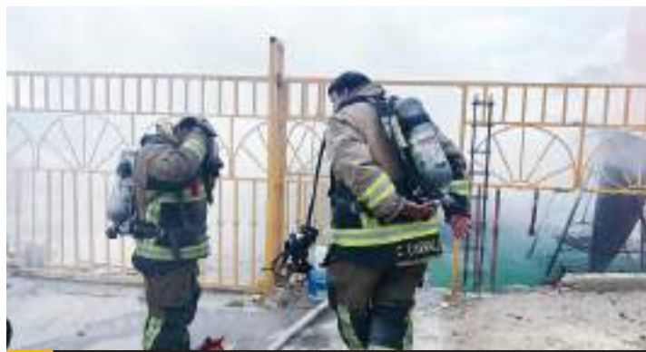
TIJUANA.- Tres adultos mayores fueron localizados sin vida y un sujeto más herido, en distintos incidentes registrados durante 24 horas en la ciudad.

Por último, se atendió lesionado por caída en la colonia Las Torres, en donde un masculino, sufrió caída del techo de una bodega en construcción, fue trasladado a un hospital donde fue reportado como grave.