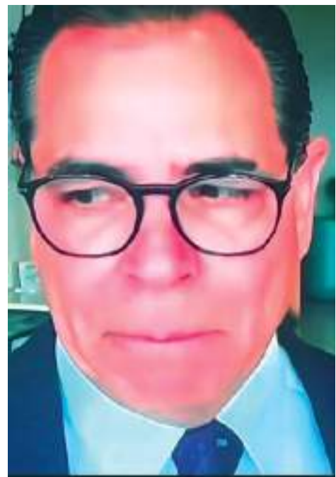
MEXICALI.- El secretario del Ayuntamiento dijo que pidió permiso para asistir al super tazón.

El dictamen será remitido al Consejo General para que, en sesión plenaria, éste sea analizado, discutido y, en su caso, aprobado.