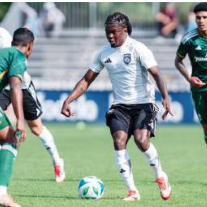
El equipo sandieguino disputará un último duelo de preparación este sábado.

El San Diego FC debutará en la MLS el domingo 23 de febrero enfrentando al LA Galaxy en calidad de visitante, en tanto que su presentación como local en el estadio Snapdragon tendrá lugar el domingo 1 de marzo ante el St. Louis City SC.