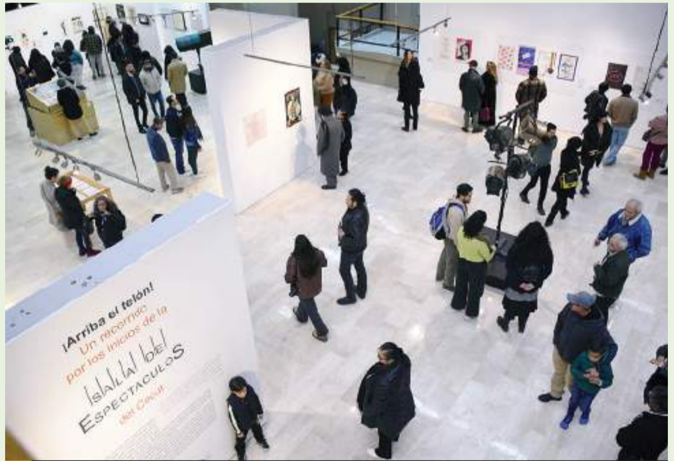
La celebración culminó con el Concierto de gala Ghukasyan String Orchestra en la Sala de Espectáculos.

40 años, en un trabajo retrospectivo, es a lo que nos invita esta exposición, con el trabajo acucioso de todo el equipo de exposiciones, de los museógrafos, del equipo del Cendoart, que es donde se guarda la memoria de CECUT, y que es un espacio abierto a todos y todas,