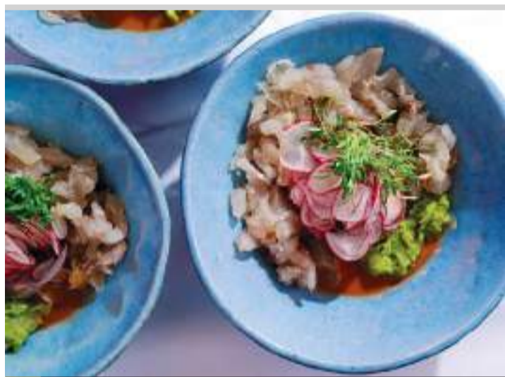
ENSENADA.- La SEPESCA realizará la edición 2025 de “Cocina la Baja”, el festival gastronómico de pescados y mariscos más importante del país.

Las mejores recetas serán calificadas en dos categorías, una como la más popular entre los asistentes (people choice) y otra calificada por especialistas de la gastronomía regional y/o nacio-