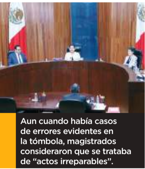
Aun cuando había casos de errores evidentes en la tómbola, magistrados consideraron que se trataba de "actos irreparables".

Durante la sesión de hoy, los integrantes de la Sala Superior revisaron decenas de impugnaciones de aspirantes que cuestionaron su ausencia en las listas de candidatos, por diversas razones;.