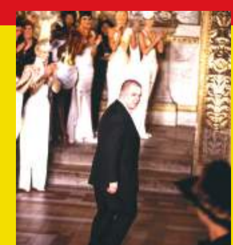
2009: un ícono de McQueen

Estos espectaculares zapatos de plataforma y pedrería son una de las últimas creaciones del diseñador y a fecha de hoy son uno de sus grandes emblemas.