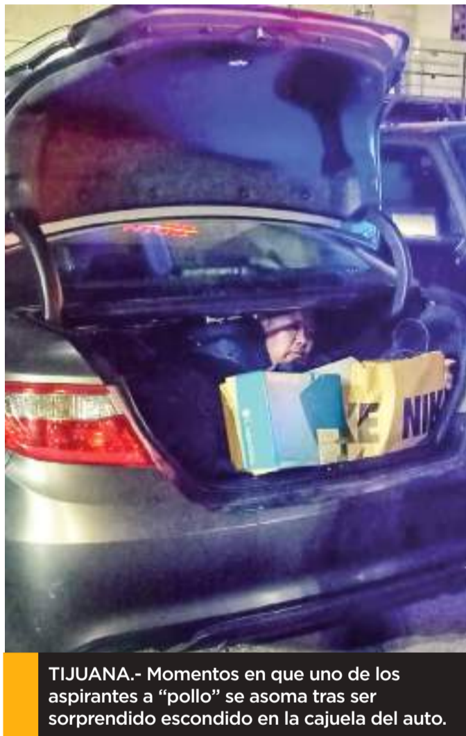
TIJUANA.- Momentos en que uno de los aspirantes a "pollo" se asoma tras ser sorprendido escondido en la cajuela del auto.

Ambos fueron presentados ante el Juez Municipal, quien habrá de determinar la situación jurídica del par de masculinos.