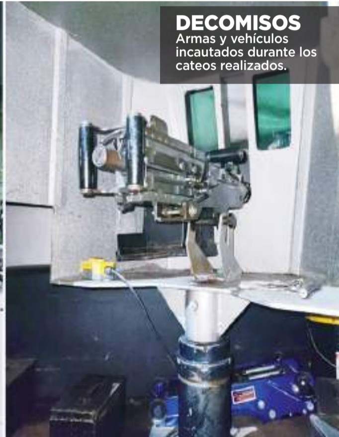
DECOMISOS Armas y vehículos incautados durante los cateos realizados.