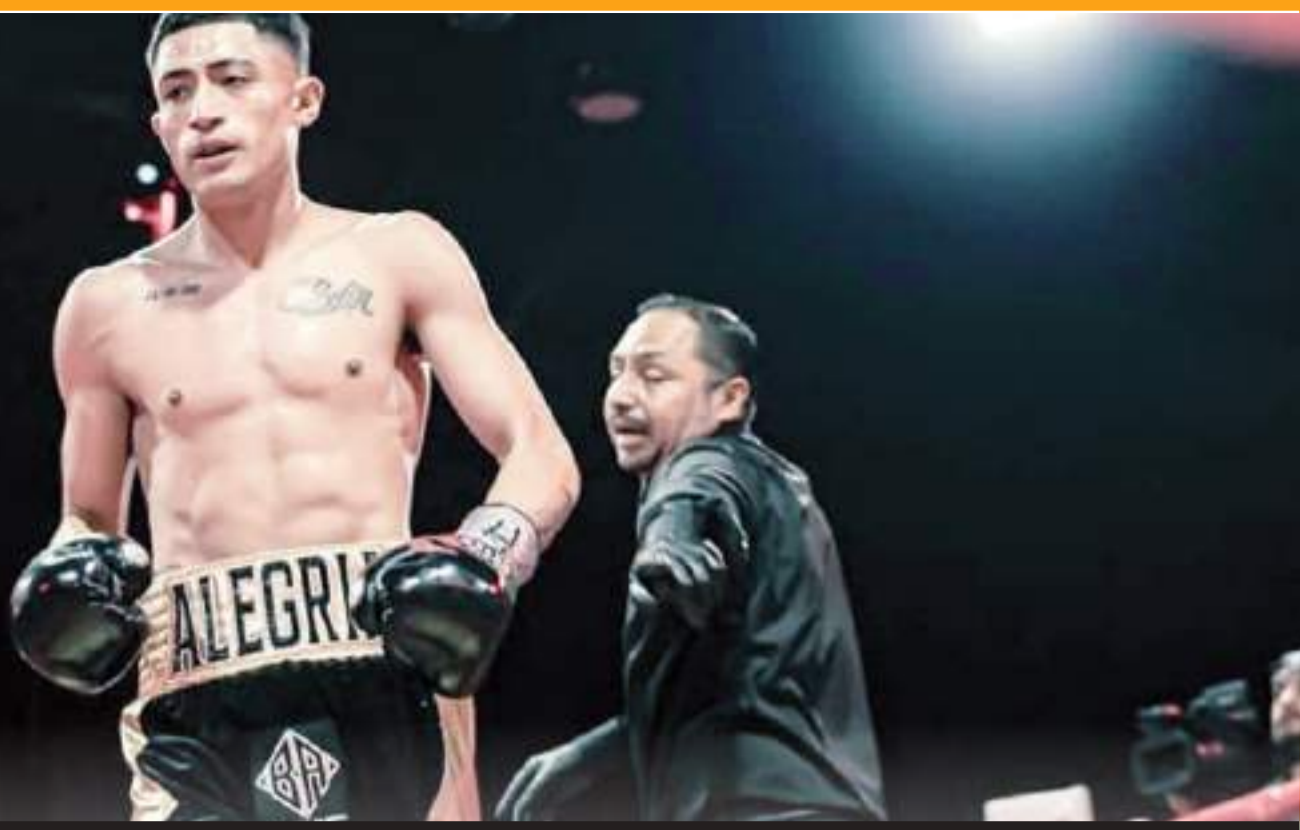
Alegría cuenta con un récord impecable de cuatro victorias, todas por nocaut.

Además del triunfo de 1-0 del Feyenoord sobre el AC Milan, también sumaron triunfos este miércoles el Benfica, 1-0 sobre el Mónaco, el Bayern, 2-1 sobre el Celtic, y el Club Brujas, 2-1 sobre el Atalanta.