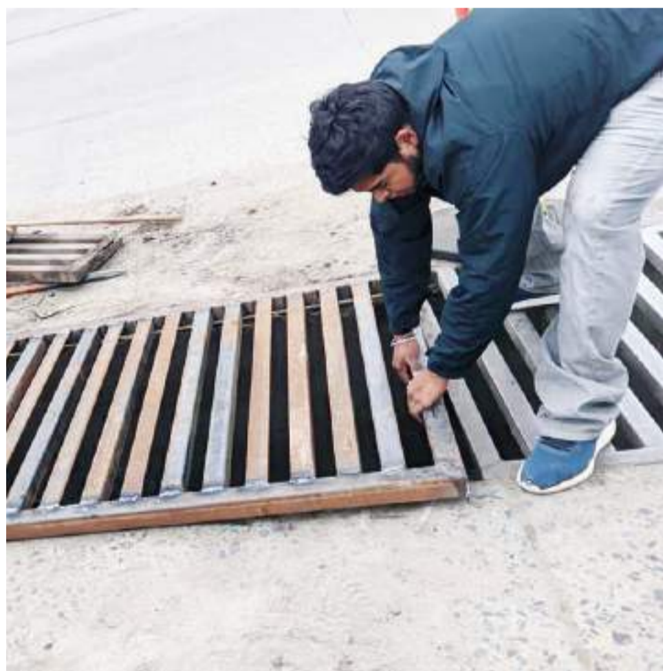
ENSENADA.-Se han limpiado alcantarillas en diversos puntos de la ciudad.