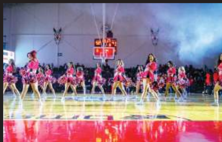
Tijuana enfrentará a Mazatlán en su primer partido como local.

Esto sumado a que el Grupo de Animación del equipo, conformado por El Zonkey, Alery, Zombras y, por su