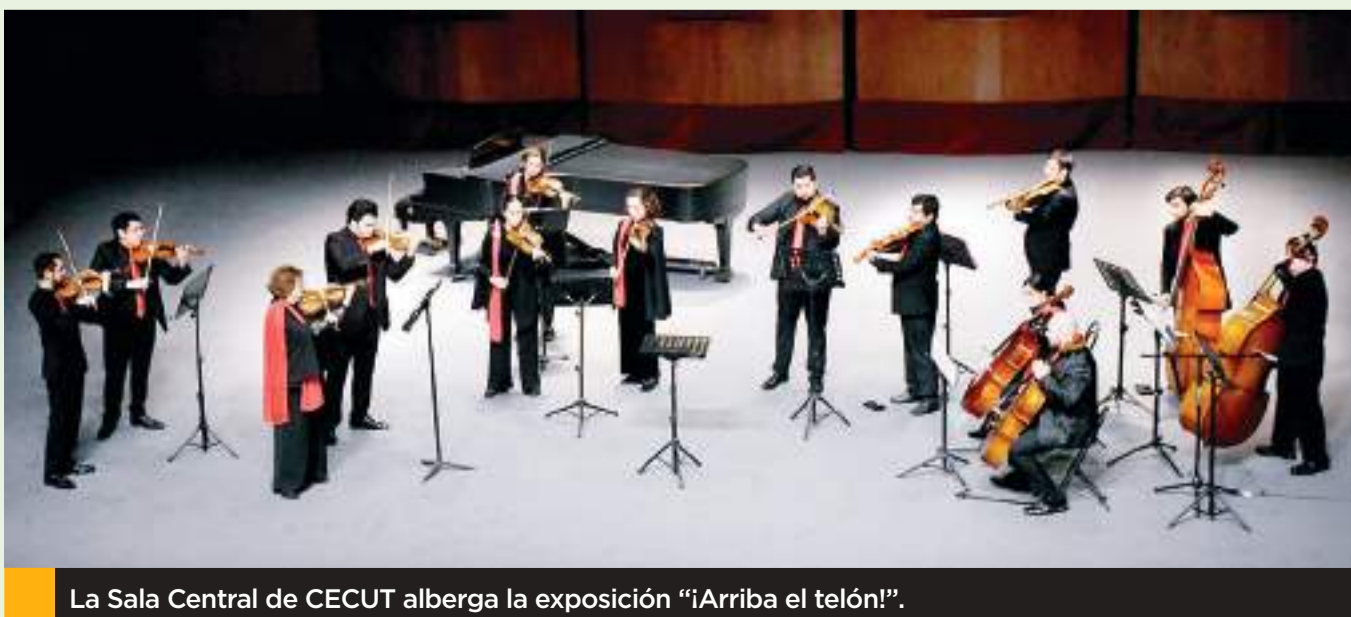
La Sala Central de CECUT alberga la exposición “¡Arriba el telón!”.

Para mayor información, visita las redes sociales del CECUT en X, Facebook, YouTube e Instagram. Sigue las redes sociales de la Secretaría de Cultura en X, Facebook e Instagram.