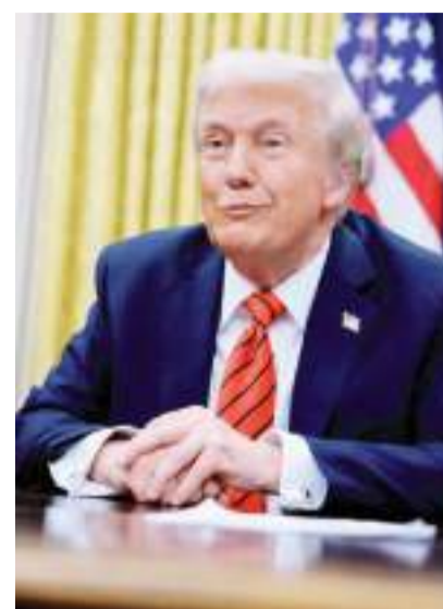
Donald Trump anuncia acuerdo con Putin, para negociar el fin de la guerra en Ucrania.

Esta es la primera vez que el mandatario estadounidense anuncia de manera oficial que conversó con Putin, aunque se había filtrado a medios de comunicación que como presidente electo también había hablado con su contraparte ruso.