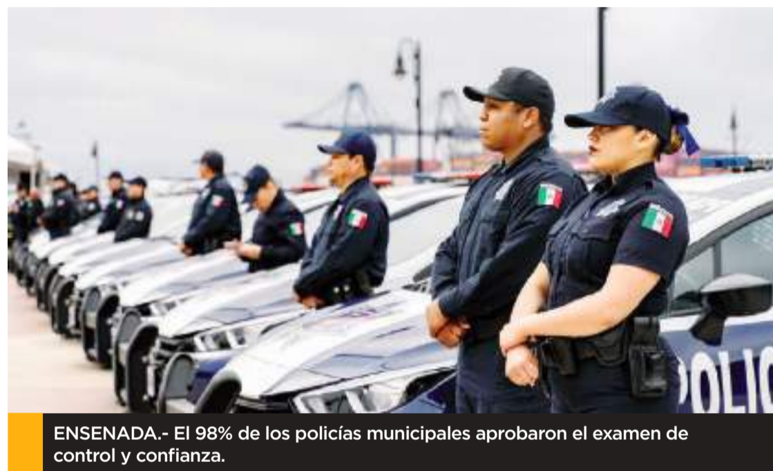
ENSENADA.- El 98% de los policías municipales aprobaron el examen de control y confianza.

“El tener un examen de control y confianza es importante, pero, necesitamos ver un todo para analizar el perfil de los elementos. Tiene que actualizarse si hay denuncias vigentes”, enfatizó.