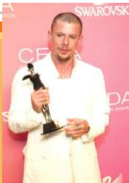
1997: Primera colección junto a Givenchy

Presentada en enero de 1997 en París, se trataba de la colección primavera/verano de la casa.