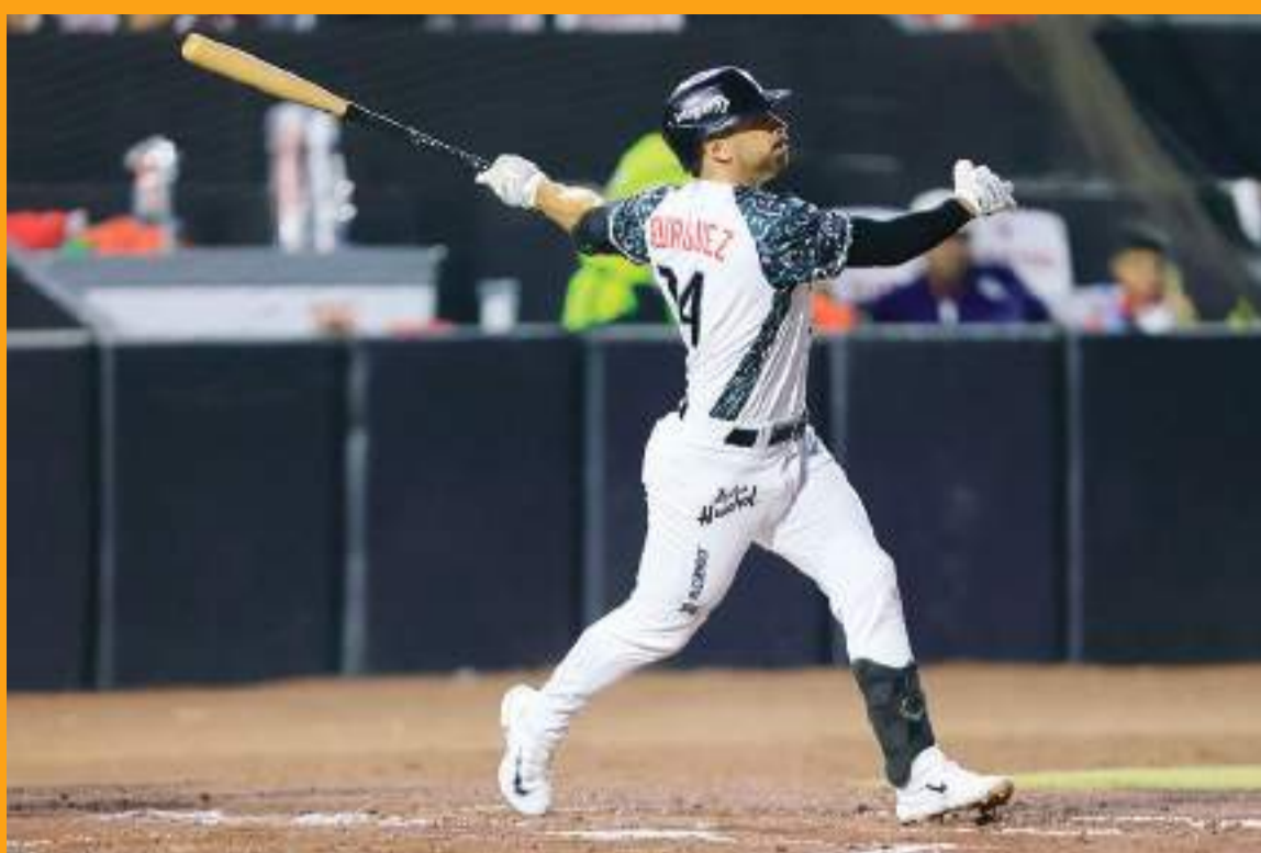
En 2025, el diestro será el primer "toro" con 700 juegos en temporada regular.