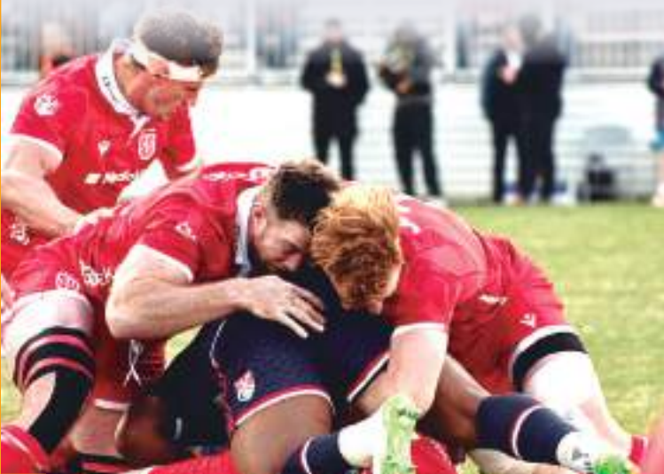
De nuevo el trabajo grupal sacó el resultado a favor de SD Legion.

Houston Sabercats vs Seattle Seawolves Chicago Hounds vs Free Jacks