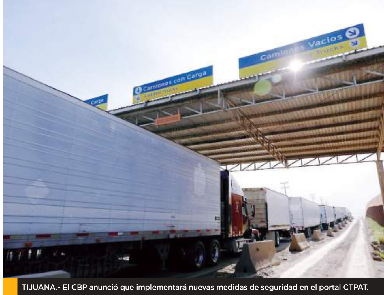
TIJUANA.- El CBP anunció que implementará nuevas medidas de seguridad en el portal CTPAT.

“Vamos paso a paso, emocionados de empezar a construir, a reconciliarnos como partido y buscar perfiles para hacer comunidad. Esa es la base de lo que hace MC”, dijo.