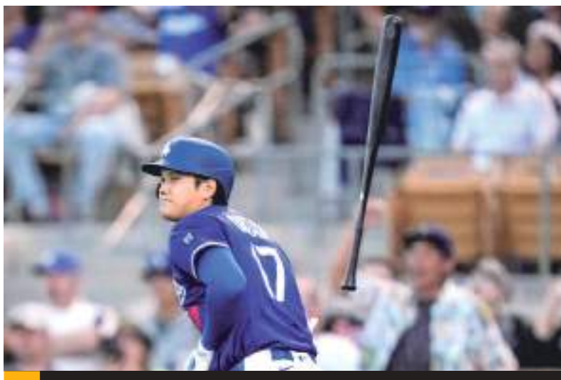
No se espera que Ohtani lance en los juegos de la Liga Cactus.

El as japonés no ha subido a la lomita de Grandes Ligas desde que se sometió a una cirugía en el codo derecho en septiembre de 2023 y a otra intervención en el hombro izquierdo en noviembre pasado, lo que retrasó su programa de temporada baja.