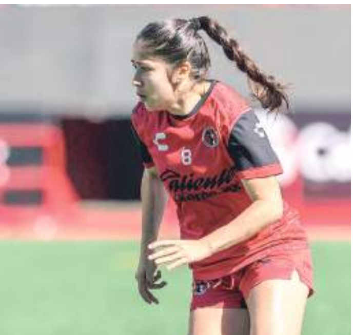
Xolos Femenil buscará mantenerse dentro de los mejores equipos.

Por su parte "La Fiera" ganó sus dos últimos partidos antes de la pausa en el torneo, lo que le permitió llegar al puesto 12 de la clasificación general, con un registro de tres triunfos, dos empates y cuatro descalabros que les han permitido sumar 11 puntos.