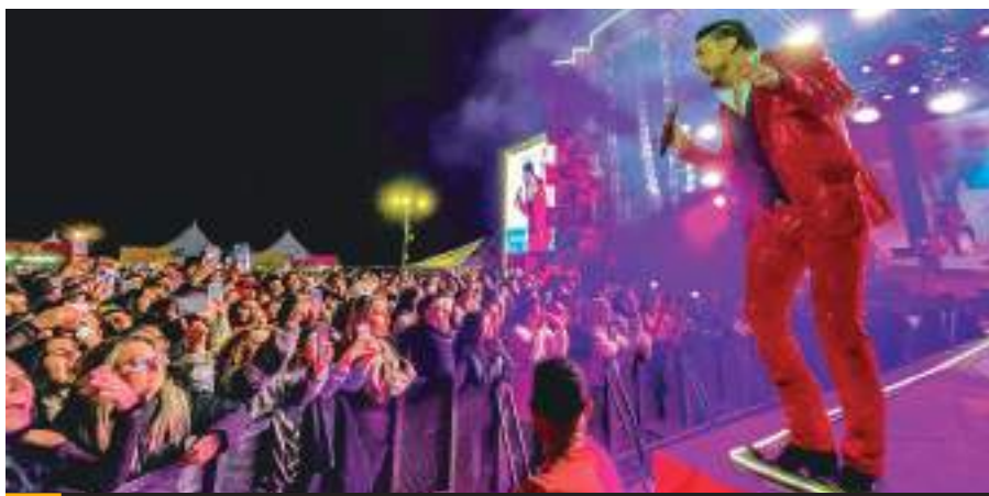
ENSENADA.- Este nuevo récord en la presentación de la Banda El Recodo, supera ampliamente las marcas previas de conciertos masivos en Ensenada.