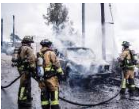
TIJUANA.- Una casa que funcionaba como iglesia, así como un auto, fueron consumidos por el fuego, resultando daños totales, pero sin víctimas que lamentar.