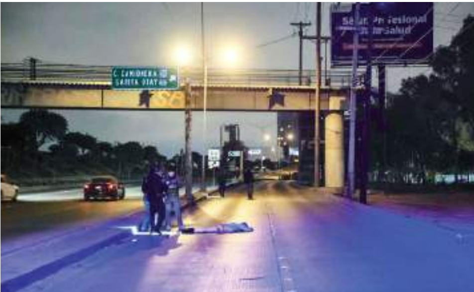
TIJUANA.- Un hombre murió al ser atropellado en la Vía Rápida Poniente, zona no apta para cruce peatonal.