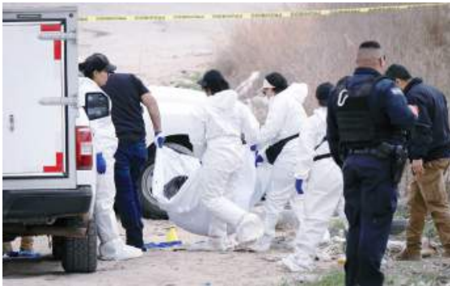
TIJUANA.- Inició el mes de marzo con personas privadas de la vida de manera violenta.