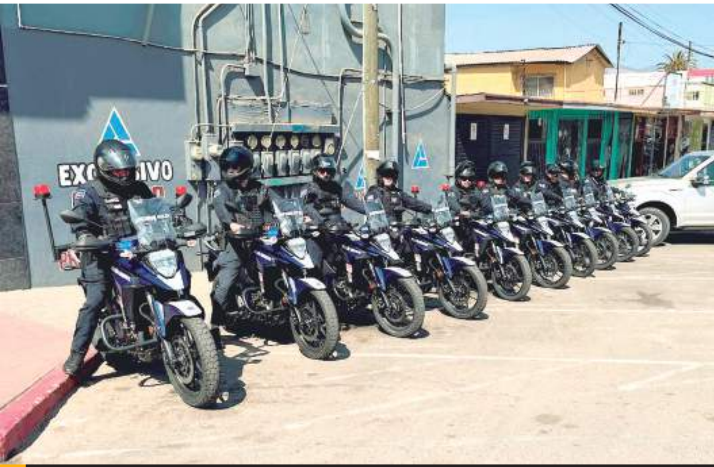
ENSENADA.- El Grupo Escudo está conformado por 10 elementos que operan a bordo de motocicletas en la zona turística y comercial.

En ambos casos, el juez de control dictó medidas cautelares para los imputados, asegurando el adecuado desarrollo de los procesos judiciales.