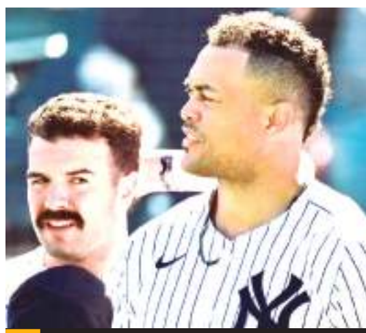
La lesión deja abierto el rol de bateador designado en Yankees.

Stanton fue una fuerza en la posttemporada por los Bombarderos el pasado octubre, que incluyó el ser nombrado Jugador Más Valioso de la Serie de Campeonato de la Liga Americana contra los Guardianes de Cleveland.