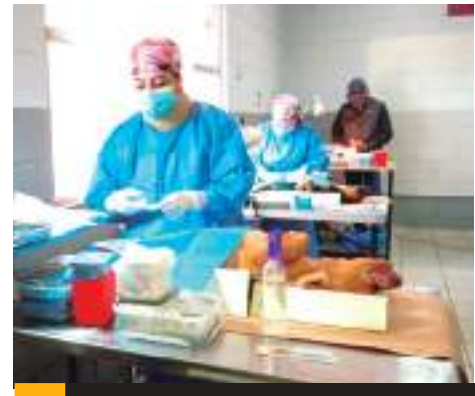
MEXICALI.- La Secretaría de Salud invita a la población a esterilizar a sus mascotas.

Entre los requisitos con que debe contar la mascota para dicho procedimiento, están, la edad mínima de 4 meses o máxima de 7 años, no se esterilizan hembras gestantes, lactantes o en celo. Los perros deben tener un peso máximo de 15 kg. No tener garrapatas, presentarse con ayuno mínimo de 8 horas, con collar o correa en el caso de perros y en caja transportadora en el caso de gatos; y llevar una cobija para el área de recuperación.