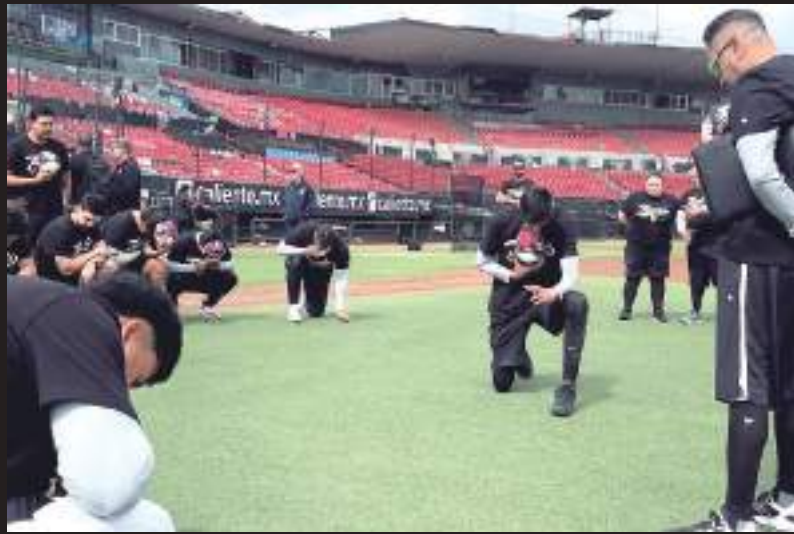
La novena tijuanaense inaugurará la temporada el 18 de marzo.