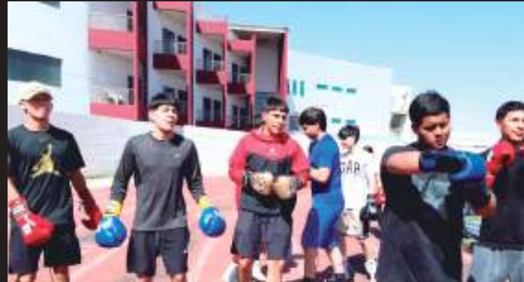
La preselección de Baja California fue exigida en la Ciudad Deportiva.