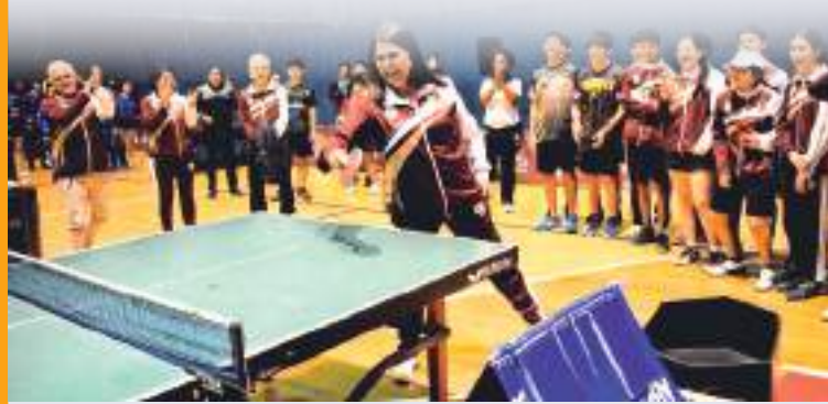
Inicia una nueva generación de atletas, el proceso olímpico.

Con un alto nivel y un gran respaldo organizativo, Baja California se consolida como un referente en el desarrollo del tenis de mesa en México.