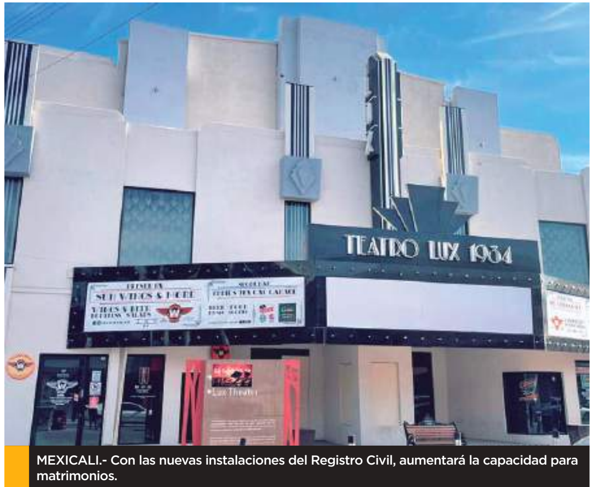
MEXICALI.- Con las nuevas instalaciones del Registro Civil, aumentará la capacidad para matrimonios.

En ese sentido, el director expresó que no hay costo para registrarse, señaló que los requisitos son acta de nacimiento, CURP e identificación de los contrayentes, certificado médico y dos testigos de cada uno de la pareja, en ese sentido, los formatos de certificados médicos son expedidos en el Ayuntamiento los cuales son gratuitos.