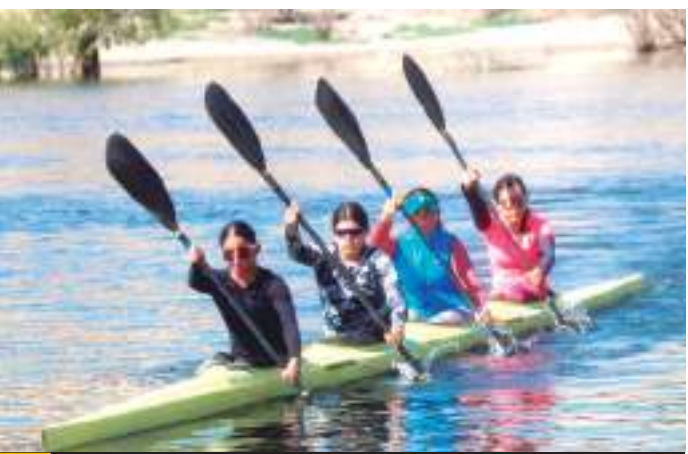
Un total de 45 canoístas bajacalifornianos.

Los deportistas fueron evaluados en distancias de competencia