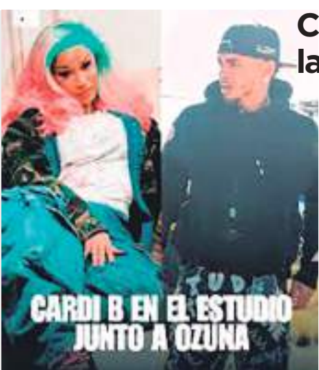
CARDI B EN EL ESTUDIO JUNTO A OZUNA

Esta semana, Cardi B compartió en sus historias de Instagram un video junto al reguetonero puertorriqueño en un estudio de grabación. "Siempre una película", escribió la rapera junto al video, que luego publicó una cuenta de fans de la rapera en X. De inmediato, el video en el que se ve a ambos artistas cantando se llenó de comentarios de sus fans expresándoles su emoción por la supuesta colaboración.