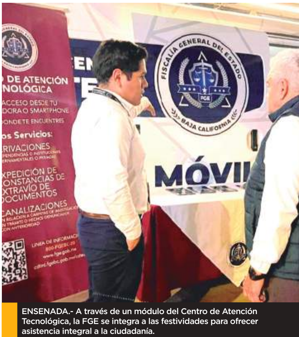
ENSENADA.- A través de un módulo del Centro de Atención Tecnológica, la FGE se integra a las festividades para ofrecer asistencia integral a la ciudadanía.

El jefe policiaco exhortó a la comunidad a atender las indicaciones del personal de policía y tránsito tanto en la zona de festejos como en la ruta del desfile, y recordó que el tramo del Bulevar Costero, entre Esmeralda y Floresta permanecerá cerrado hasta el 7 de marzo.