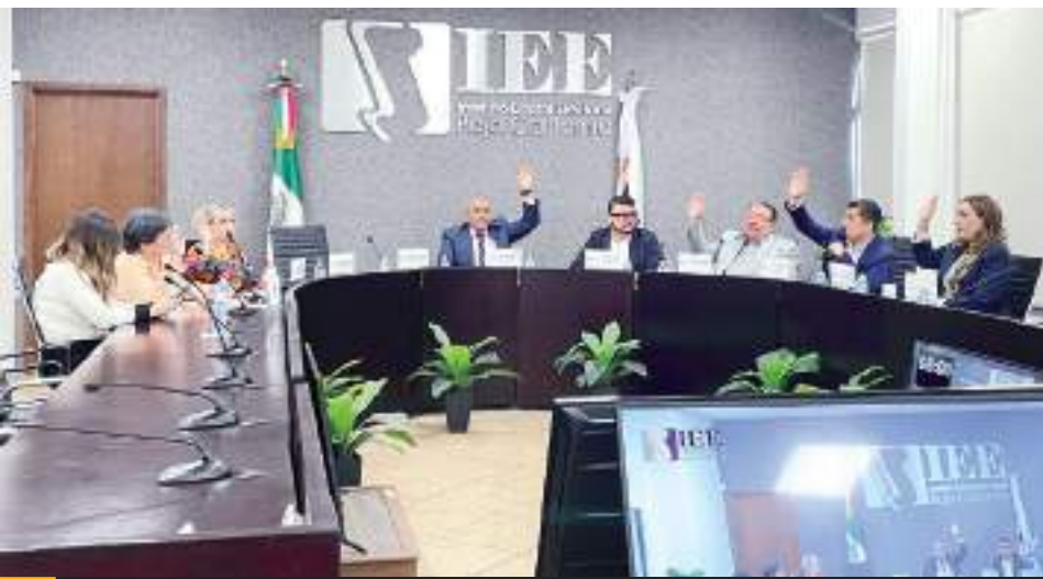
MEXICALI.- El IEEBC espera que con el plazo para ser consejeros distritales, cumplir con oportunidad el proceso para elección de personas juzgadoras este 1 de junio.