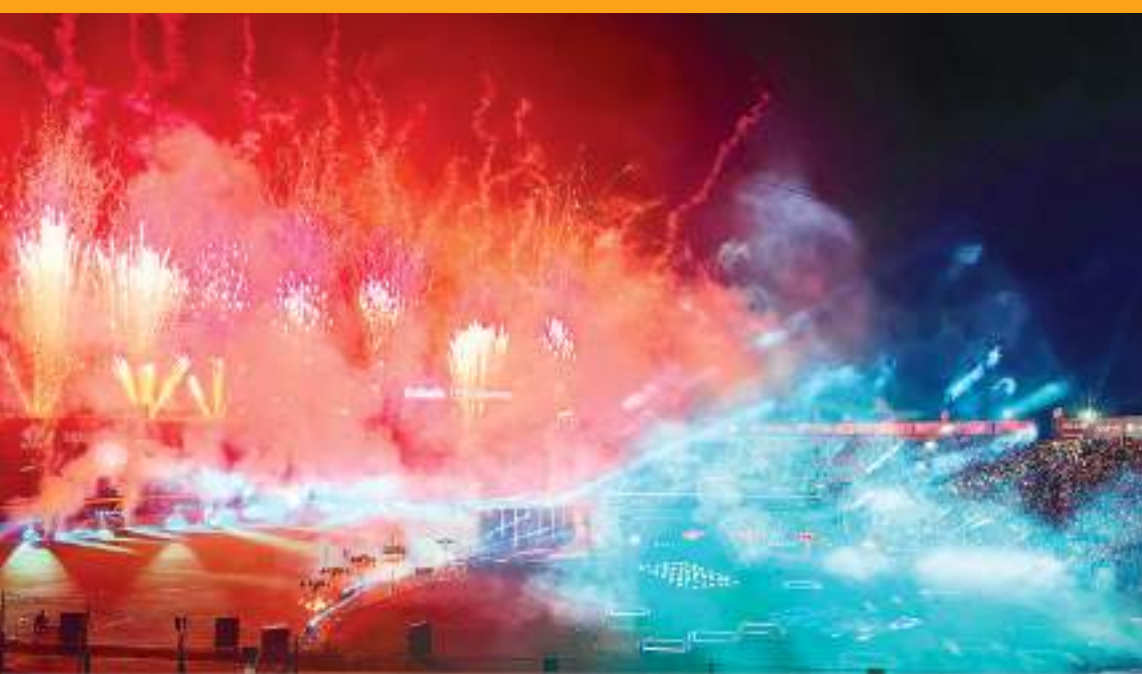
Toros de Tijuana confirmó que Elefante encabezará la ceremonia inaugural del equipo en casa.