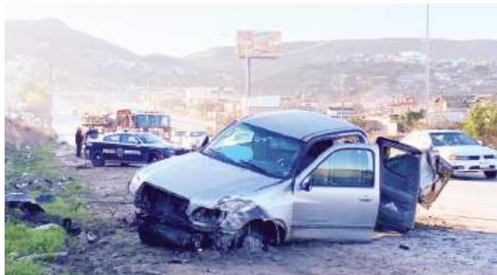
TIJUANA.- Otro accidente vehicular que terminó en volcadura y un conductor lesionado, se registró en el bulevar 2000.

Cabe señalar que en el transcurso de la mañana de este sábado 8 de marzo, se registraron al menos 3 accidentes vehiculares sobre el bulevar 2000.