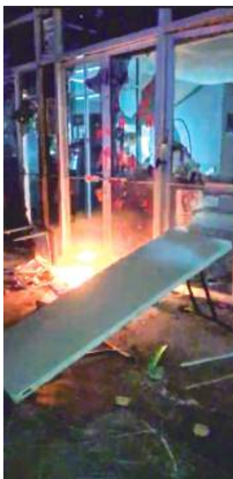
MEXICALI.- La marcha por el Día Internacional de la Mujer, terminó con daños a edificios de gobierno del Centro Cívico, y un siniestro en el inmueble del poder ejecutivo; intervinieron bomberos, policía municipal y de la fuerza estatal.

Pero fue hasta llegar al edificio del poder ejecutivo, donde con piedras, palos, y hasta con extinguidores, rompieron las