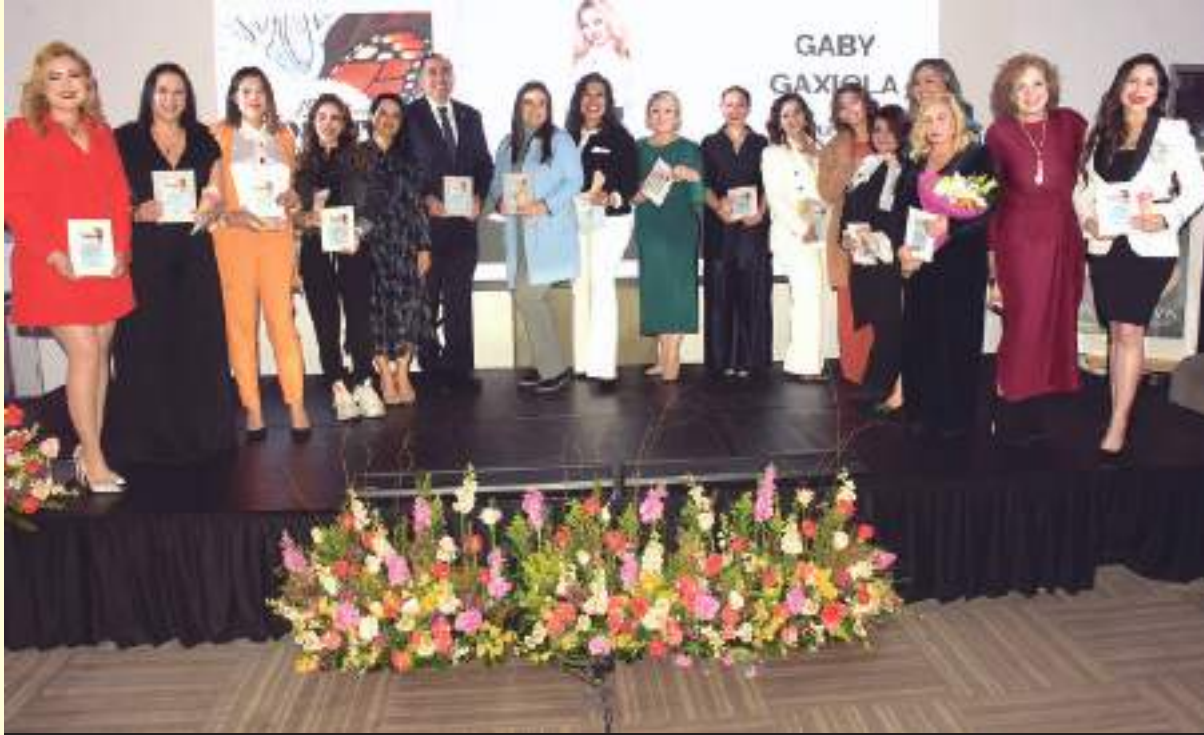
Teniendo como marco un espacio moderno y en medio de una atmosfera de reconocimiento se realizó su tradicional foro con el lema "Nosotras Impulsando el Cambio".

MUJERES EGRESADAS UNIVERSITARIAS Con temas de actualidad para la mujer se realizó el Foro de Egresadas: Mujeres en los Negocios, donde abordaron temas de desigualdades en el ámbito laboral, la importancia de no autolimitarse y de seguir formándose en diversas áreas