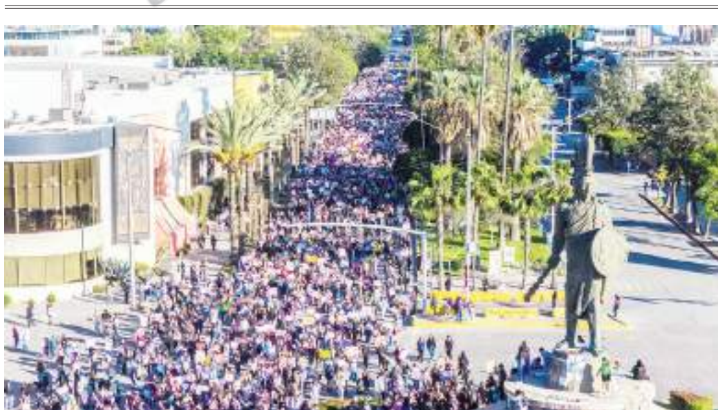
TIJUANA DÍA INTERNACIONAL DE LA MUJER...

Congrega a miles de mujeres en una marcha para levantar la voz por las víctimas de inseguridad.