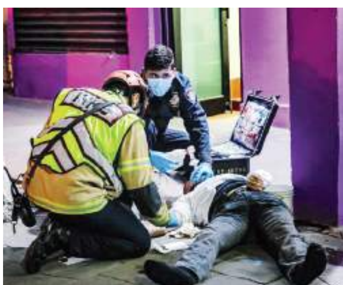
TIJUANA.- Por sobredosis, un hombre de alrededor de 40 años de edad, fue atendido por paramédicos de Cruz Roja.

Después de casi media hora, paramédicos lograron estabilizarlo. Sin embargo, el hombre no fue trasladado a un hospital y fue dejado en el lugar. Hasta el momento, se desconoce qué tipo de sustancia consumió.