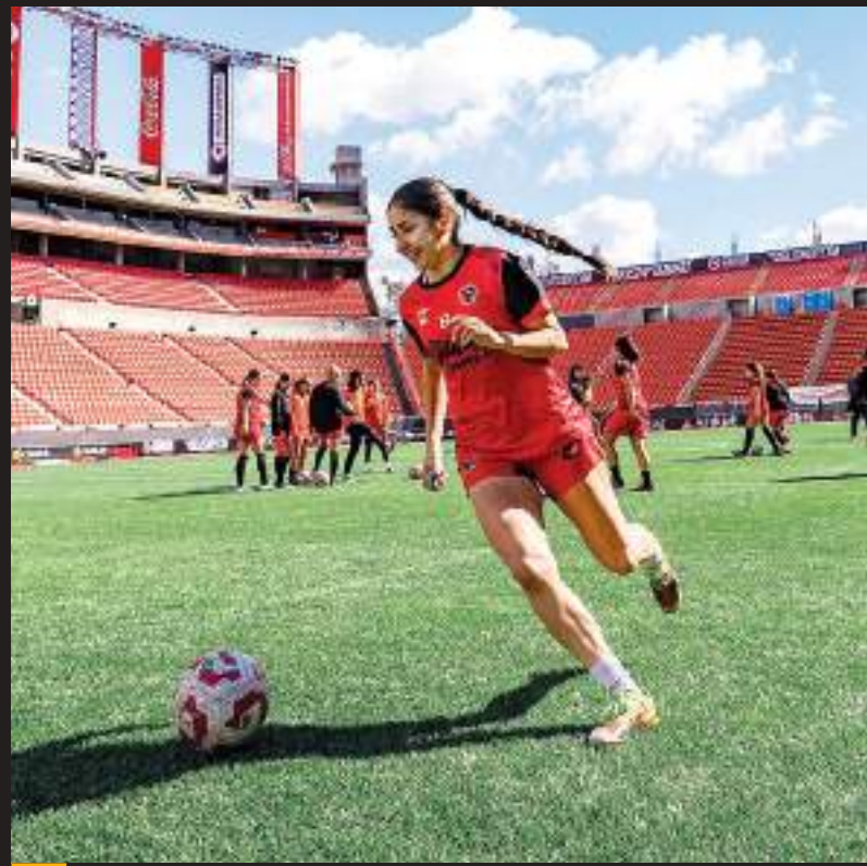
Xolos Femenil visitará a Puebla como parte de la jornada 11 del torneo Clausura 2025 de la Liga MX Femenil.

Xolos Femenil intentará sumar de a tres este domingo en el estadio Cuauhtémoc