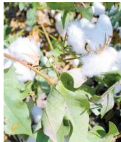
MEXICALI.- Buen inicio del ciclo primavera-verano en la expedición de hectáreas.

Así mismo, el funcionario señaló que la próxima semana se reunirá con los alcaldes y tesoreros para del esquema de colaboración para que mejoren las finanzas de cada municipio.