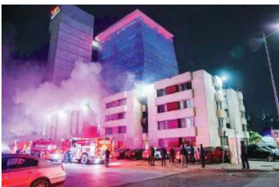
TIJUANA.- Un incendio registrado en un departamento de Zona Río, movilizó a bomberos de cinco estaciones diferentes, a fin de evitar su propagación y daños mayores.

Pese a no haber afectaciones físicas, algunos de los habitantes del departamento fueron atendidos por sufrir crisis nerviosa.