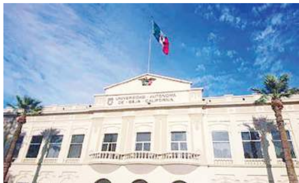
MEXICALI.- La UABC cumplió totalmente con la transparencia y rendición de cuentas, expresó el ITAIPBC.