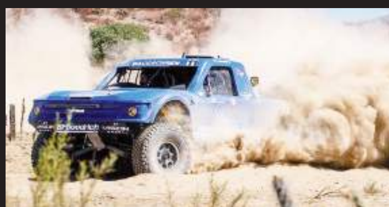
La primera carrera del “Campeonato Mundial del Desierto Score 2025”, iniciará los recorridos de reconocimiento de la ruta a partir del sábado 22 de marzo.

ENSENADA.- Lo que será la edición número 38 de la exitosa carrera fuera de caminos Score San Felipe 250 registra ya a más de 110 equipos inscritos procedentes de diversos países del mundo incluyendo Canadá, Australia, Estados Unidos., Nueva Zelanda, Japón y México entre otros.