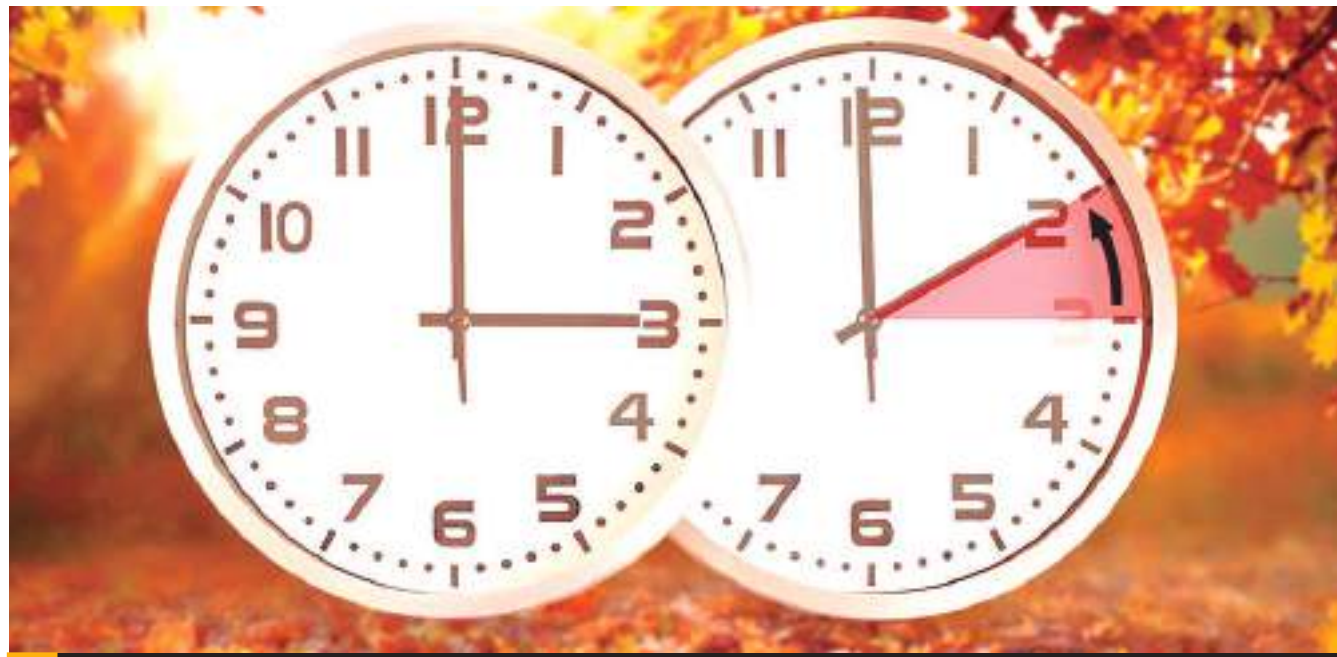
TIJUANA.- El cambio de horario en México 2025 se llevará a cabo en la madrugada del 9 de marzo, en Baja California, Chihuahua, Coahuila, Nuevo León y Tamaulipas, donde se debe adelantar el reloj una hora.

QUE NO SE LE HAGA TARDE, Y AJUSTE SUS RELOJES