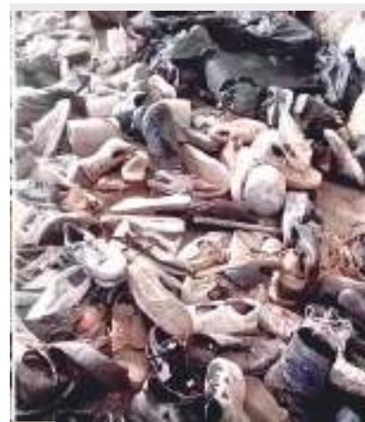
Hallan hornos clandestinos en un rancho que se encontraba asegurado por las autoridades en Jalisco; aproximadamente 200 personas fueron incineradas.