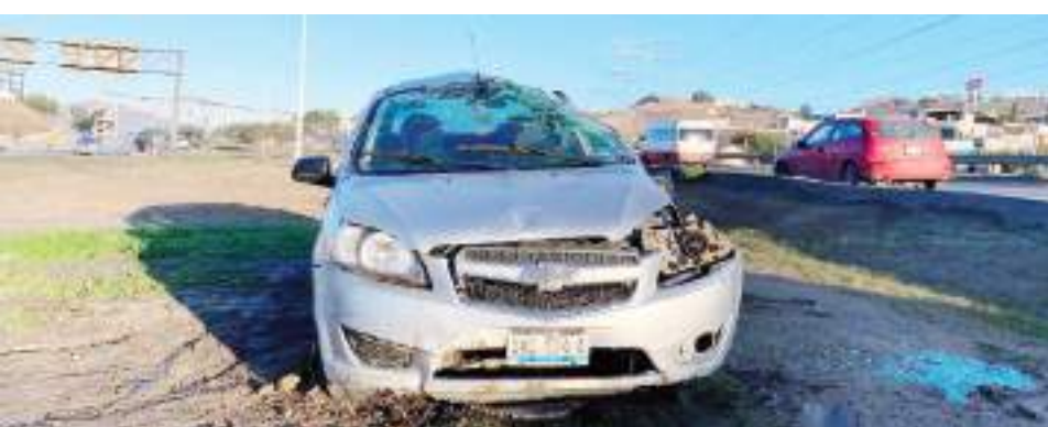
TIJUANA.- A diferente hora pero en el mismo lugar, sobre el bulevar 2000, se registraron dos accidentes vehiculares.