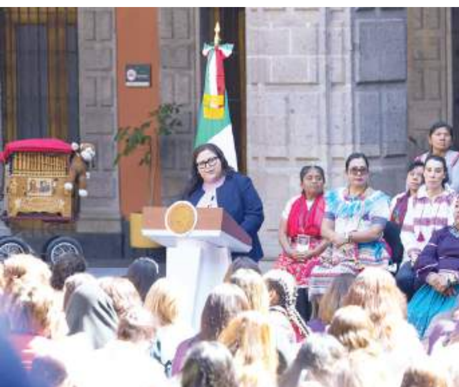
CIUDAD DE MÉXICO.- Durante la presentación de la Cartilla de Derechos de las Mujeres que hizo la Presidenta Claudia Sheinbaum, participó una comitiva de Baja California.

Así mismo durante el evento la presidenta del Consejo Nacional para Prevenir la Discriminación, Claudia Olivia Morales Reza, celebró las diversas acciones impulsadas por la Presidenta como la elaboración de la Cartilla de Derechos de las Mujeres, la defensa del maíz y las reformas constitucionales que reconocen los derechos de mujeres indígenas y afroamericanas.