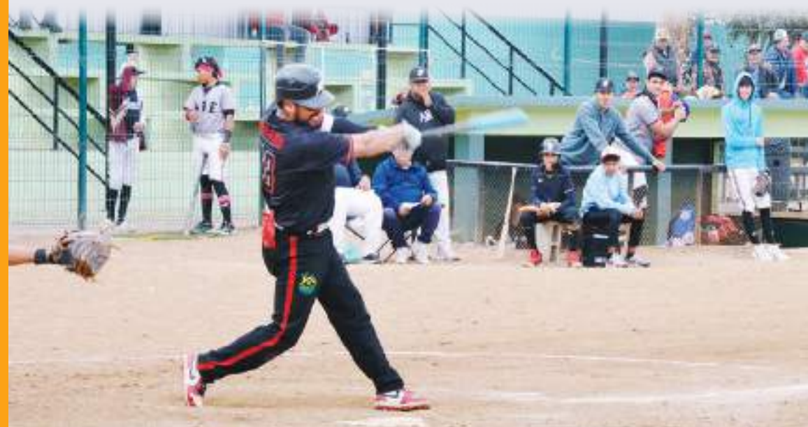
Langosteros buscará liquidar su serie ante Veterinaria Bahía, al jugarse este domingo el tercero de la serie.

El los 2 primeros de la semifinal las huestes del Pita Silva y Juan M. López se llevaron cerrados triunfos de 6-5 en el primero y 2 por 1 en el segundo, así que se espera un tercer encuentro igual de cerrado donde los veterinarios buscaran a como de lugar la victoria para alargar la serie y continuar con vida.