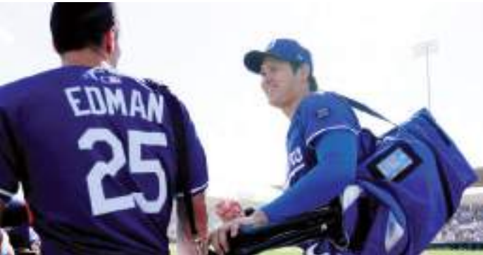
Shohei Ohtani disminuyó el ritmo en su rehabilitación como lanzador rumbo al debut de temporada de Dodgers.

A principios de la primavera, Roberts y los Dodgers habían dicho que un regreso al pitcheo en algún momento de mayo sería factible para Ohtani. Ese podría seguir siendo el caso, aunque Ohtani tendrá que volver a acelerar su carga como lanzador después de regresar de Japón. Actualmente no hay un plan para que Ohtani vaya a una asignación de rehabilitación, lo que significa que la mayor parte de su preparación como lanzador se llevaría a cabo en juegos simulados.