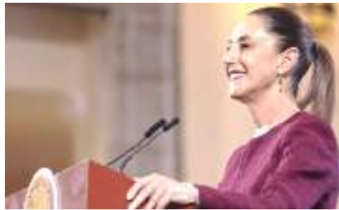
MEXICALI CLAUDIA SHEINBAUM PARDO...

Eleva a rango constitucional la Tarjeta Violeta.