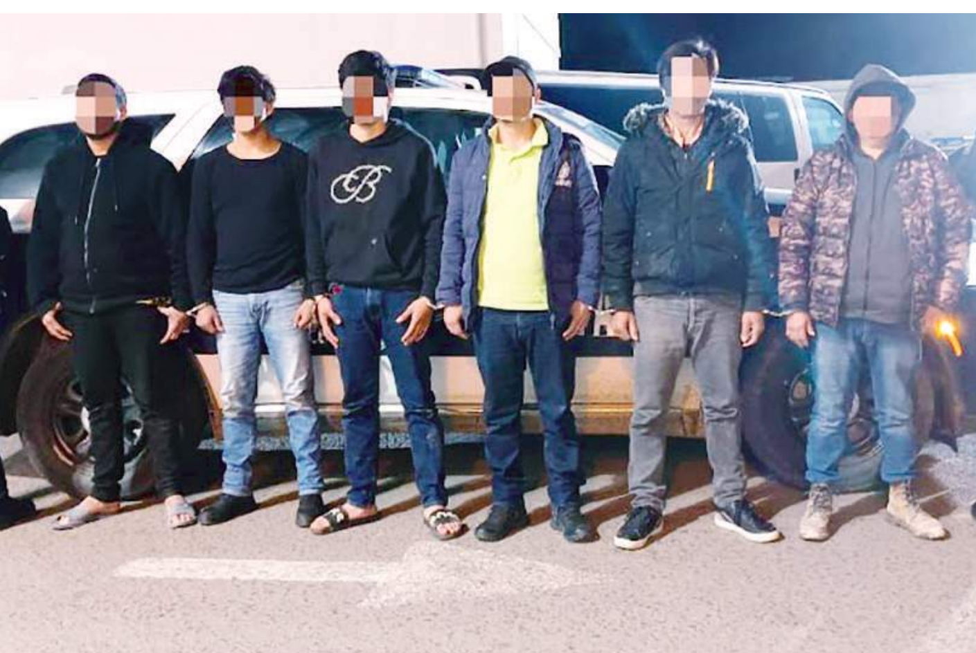
ENSENADA.- Los detenidos fueron encontrados en poder de "cristal", armas de fuego y cartuchos útiles.

Este aseguramiento es un claro reflejo de los esfuerzos interinstitucionales para garantizar la seguridad de la comunidad, y la DSPM continúa trabajando en coordinación con las autoridades de los tres órdenes de gobierno, para asegurar objetivos prioritarios, como parte del compromiso de mantener la paz y el orden en el municipio.