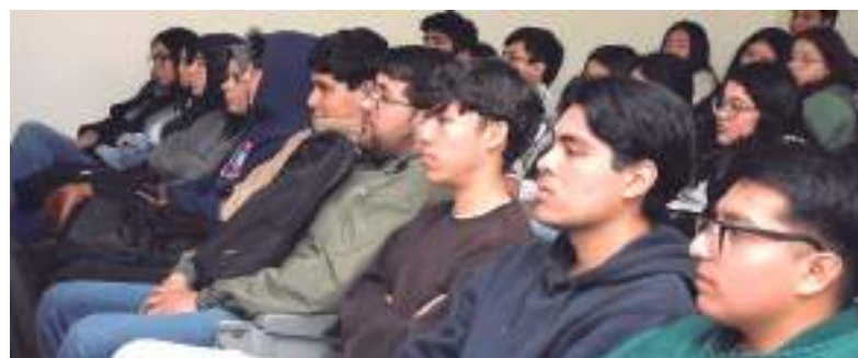
Alumnos de la facultad de contaduría y administración.