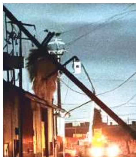
TIJUANA.- La CFE logró restablecer el 100% de la energía en la entidad, tras las afectaciones por lluvias y vientos que dejaron a su paso el frente frío no. 32.

La Comisión Federal de Electricidad hace de conocimiento de los ciudadanos que pueden comunicarse para cualquier reporte, duda o aclaración respecto al suministro eléctrico al teléfono 071, al sitio "Mi Espacio" en cfe.mx, o descargar la aplicación CFEContigo. (scg)