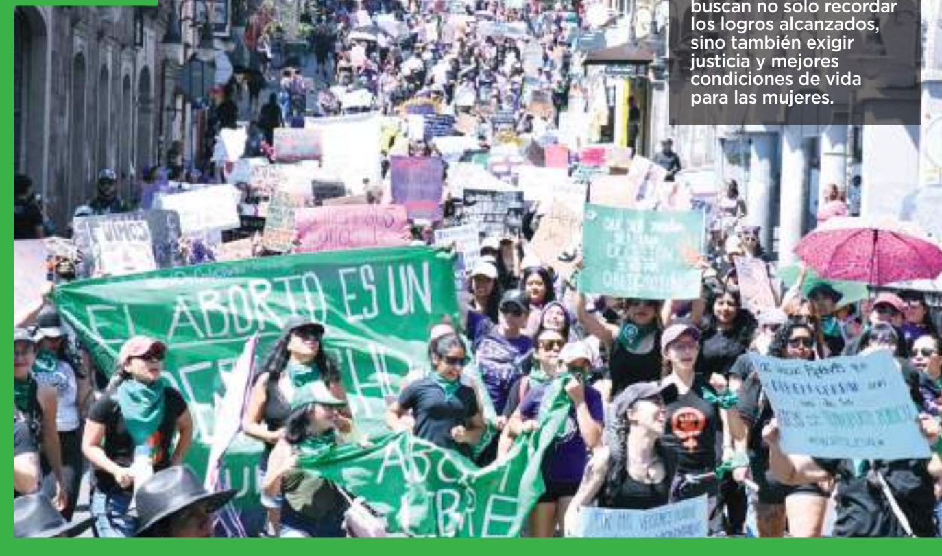
JUSTICIA Las movilizaciones buscan no solo recordar los logros alcanzados, sino también exigir justicia y mejores condiciones de vida para las mujeres.