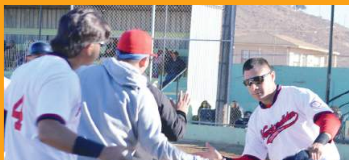
Nacionalistas de Colonet Fresh y Academia A1E, listos para iniciar la serie semifinal pactada a ganar 3 de 5 partidos por un boleto a la final del torneo 2024-25.