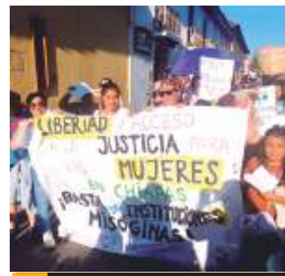
Activistas acusan que no hay testigos directos ni peritajes que prueben las acusaciones.