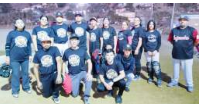
Los Chikeens Mix se enfrentarán en la segunda etapa del Grupo Mixto del softbol de Los Barrios a los aguerridos de Eventos Vale Vale.