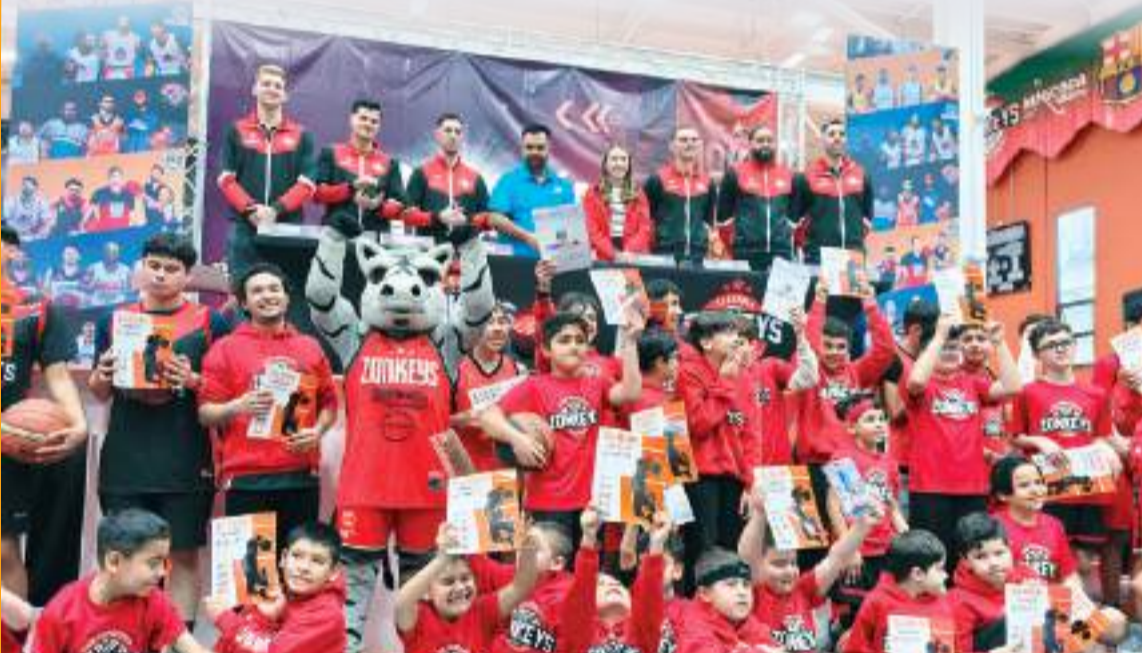
En cada partido será posible obtener un sobrecito con 10 estampas.