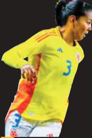
La ganadora del Defensora del Año del Brasileirão se une con un contrato de dos años.