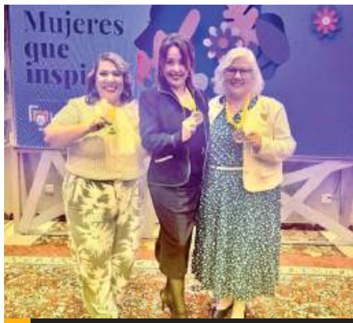
TIJUANA.- Mujeres empresarias en el ramo turístico, fueron reconocidas por autoridades municipales de Tijuana.

Por su parte, los integrantes del ramo constructor reconocieron el trabajo que CESPE ha venido realizando; al mismo tiempo que mostraron su apoyo para atender los proyectos que aporten y beneficien a Ensenada tanto en la parte del abastecimiento de agua, como en el saneamiento y reúso de la misma.