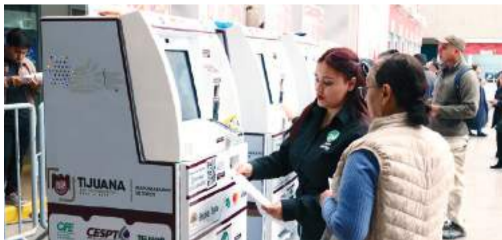
TIJUANA.- El día último de marzo concluyó el programa de estímulos fiscales para el pago del predial. Invitan a los contribuyentes para aprovechar descuentos.

Cabe señalar que, el pasado 11 de marzo el Cabildo de Tijuana aprobó el acuerdo relativo a la condonación de multas y recargos municipales del Ejercicio Fiscal 2025 y años anteriores, mediante el cual se otorga a los contribuyentes un 100 por ciento de descuento en multas y recargos en el pago del impuesto predial, así como del Impuesto Sobre la Adquisición de Inmuebles; beneficios que actualmente están vigentes y puede aprovechar el ciudadano.