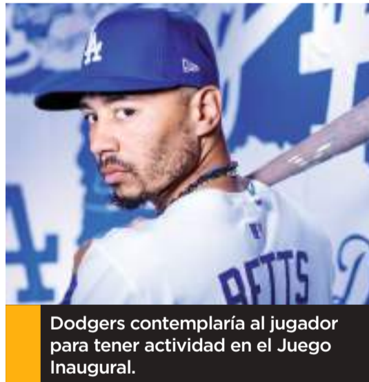
Dodgers contemplaría al jugador para tener actividad en el Juego Inaugural.

"Las pruebas de fuerza que le hicieron reflejar que su fuerza está donde debe estar, lo cual es positivo", explicó Roberts. "Ya controlamos la deshidratación. Ha podido digerir la comida los últimos días. Todas las señales in-