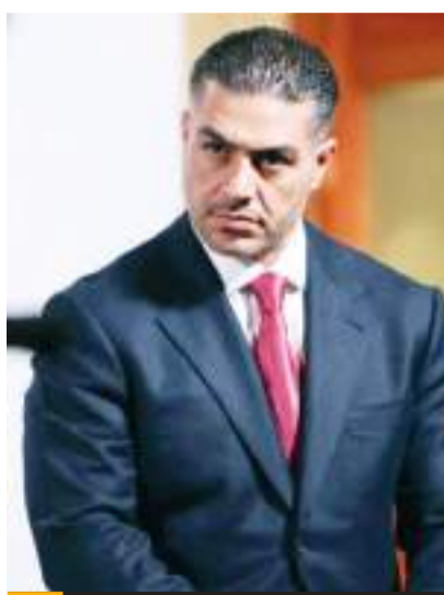
Omar García Harfuch, busca profundizar la colaboración contra los cárteles del narcotráfico mexicano.