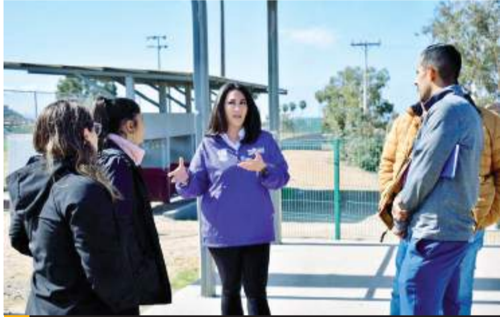
ENSENADA.- Se han implementado rondines de vigilancia en unidades deportivas para inhibir el vandalismo.

Cabe destacar, que los vecinos y promotores deportivos han expresado la presencia de los elementos de seguridad en varias ocasiones realizando los recorridos preventivos, principalmente en la Unidad Deportiva Raúl Ramírez, Unidad Sporti-