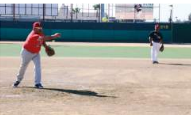
El evento deportivo se verificará en los deportes de bola bofa y balompié.

Los equipos que participarán son: Seguridad Pública Municipal de Ensenada, Mexicali, Tecate, San Quintín, Fiscalía General del Estado, FESC, Socios AASPM, Border Patrol y Bomberos de Ensenada, distribuidos en los distintos campos de juego.