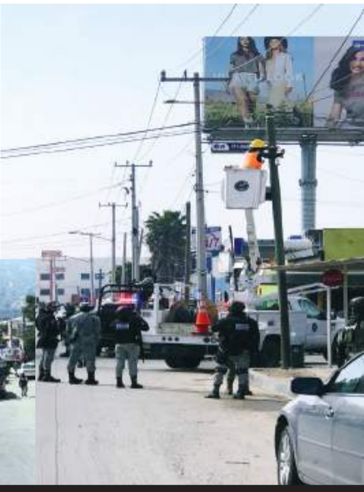
TIJUANA.- En coordinación con otras corporaciones de seguridad pública, la policía municipal logró retirar 57 cámaras de vigilancia colocadas de manera ilegal en la "Liber".

la colonia Libertad, con el objetivo de localizar, desinstalar y resguardar los aparatos de videovigilancia que se encontraban colocados ilegalmente. Las más de 50 cámaras decomisadas fueron puestas a disposición de la Fiscalía General del Estado.