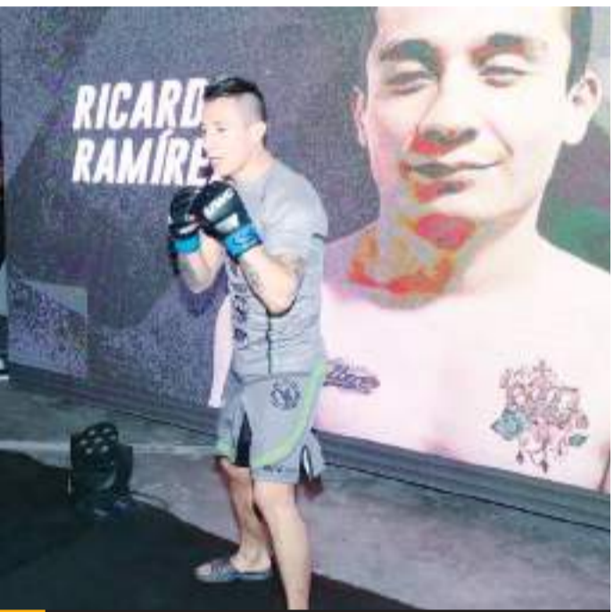
El combate se realizará en Peso Gallo.

Ahora en su camino está González (12-5-2), de Buenos Aires, Argentina, quien en el 2023 contendió por el fajín de las 135 libras y este duelo bien puede verse como un clasificatorio rumbo al cetro.