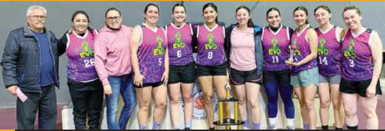
Evo Team se proclamó campeón de la rama femenil Abierta del Torneo 2024-25 de la Liga Rural de baloncesto de El Sauzal.