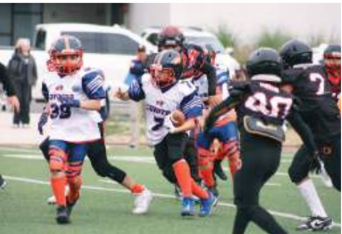
Las acciones comienzan este sábado 29 de marzo.