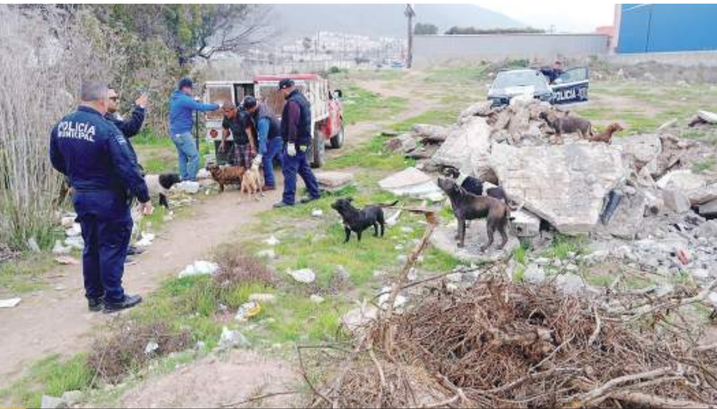
ENSENADA.- Policía Ecológica y CACyFE implementaron protocolos especializados para la captura segura de los animales.