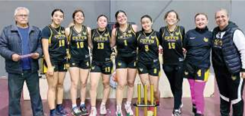
El Cetys se quedó con el trofeo de subcampeón.