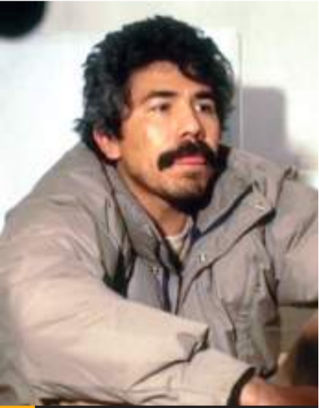
Juez da plazo de 90 días a los fiscales para que definan si buscarán la pena de muerte para el narcotraficante Rafael Caro Quintero.

Caro Quintero enfrenta varios cargos, PASA A LA PÁGINA 2-C