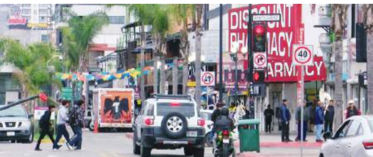
TIJUANA.- Los comerciantes turísticos esperan la visita de más ciudadanos estadounidenses durante mediados de abril.

Cabe recordar que los días clasificados por el calendario oficial, indican que la Semana Santa se llevará a cabo del domingo 13 de abril al domingo 20 del mismo mes.