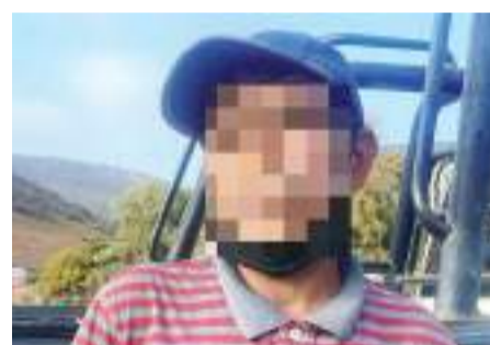
ENSENADA.- Elementos del Grupo Contra el Narcomenudeo realizaron la detención de un individuo por portación de sustancia prohibida.

En las instalaciones de la corporación local al individuo le realizaron la respectiva certificación médica para posteriormente ser puesto a disposición de la Fiscalía General del Estado (FGE) para las diligencias correspondientes por el probable delito de posesión de drogas.