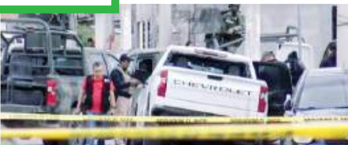
La ejecución extrajudicial de cinco jóvenes se registró en febrero de 2023, en Nuevo Laredo, Tamaulipas.