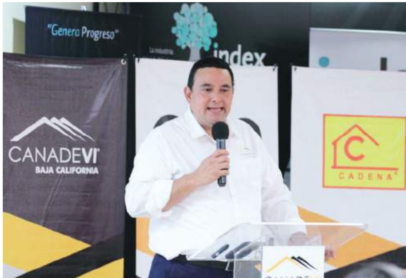
MEXICALI.- La CANADEVI proyecta construir más casas de interés social en la capital del Estado.