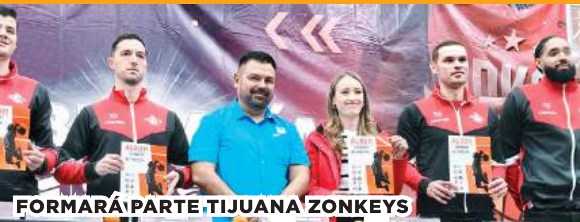
FORMARÁ PARTE TIJUANA ZONKEYS