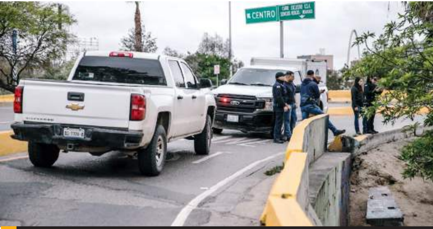
TIJUANA.- Sobre el carril médico en la Garita de San Ysidro, elementos de emergencia atendieron a un hombre lesionado por impactos de arma de fuego, el cual fue declarado sin vida en el lugar.