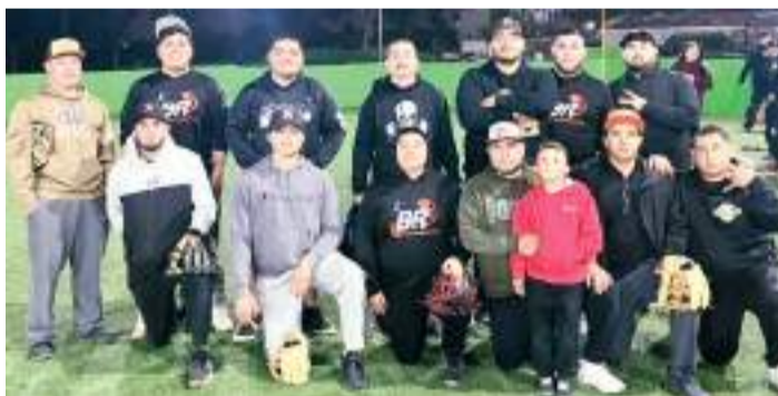
Baleros y Ruedas pone su marca en siete juegos ganados y cuatro descalabros.