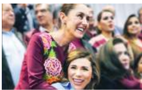
TIJUANA CLAUDIA SHEINBAUM— MARINA DEL PILAR...

Empeñaron su palabra de cambiar la imagen del primer cuadro.