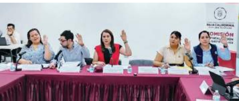
MEXICALI.- En su tercera sesión, la Comisión de Fiscalización del Congreso local dictaminó cuentas públicas de diversos entes fiscalizados.

"Se han hecho todos los mantenimientos y reparaciones a los acueductos para hacer frente al abasto de agua en el Estado", indicó el titular de la SEPROA.