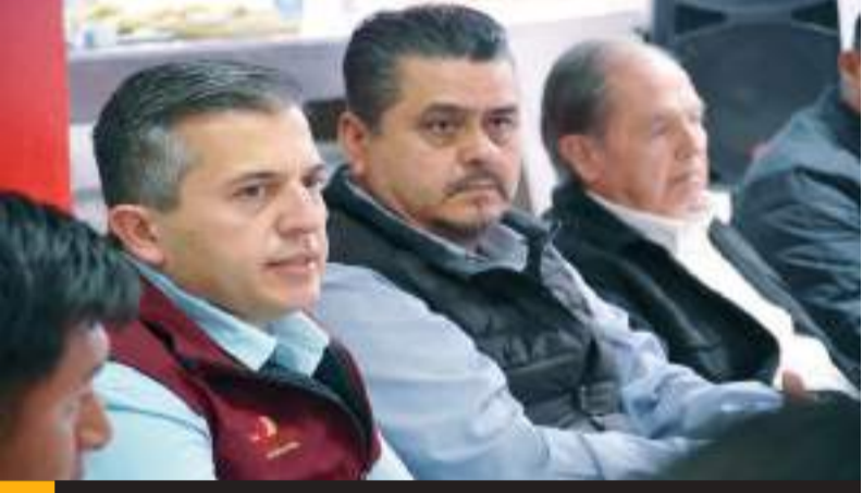
ENSENADA.- La CESPE tiene contemplada la rehabilitación de la Planta de Bombeo La Misión (PB87).