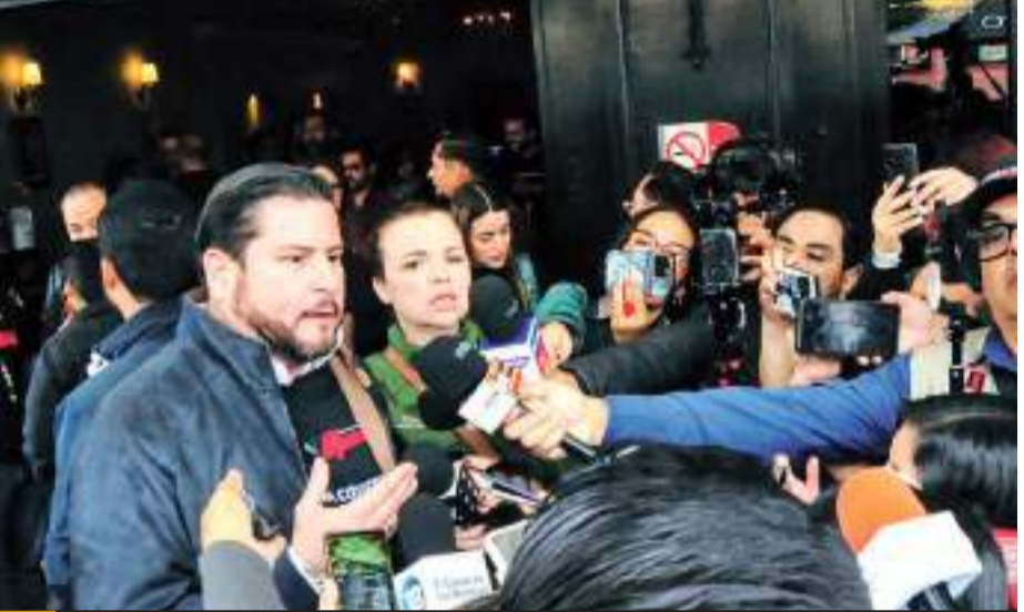
TIJUANA.- El Alcalde Ismael Burgueño Ruiz sostuvo que el retiro de cámaras es una estrategia de la Guardia Nacional, que busca garantizar seguridad a las y los ciudadanos.